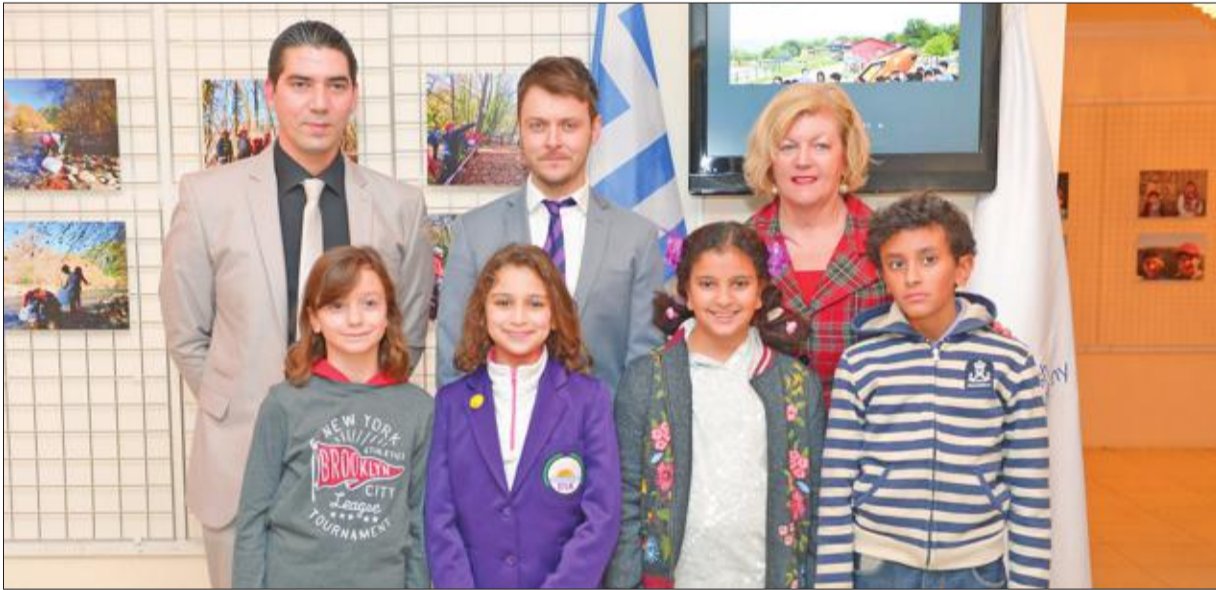
عدد من المشاركين في الرحلة