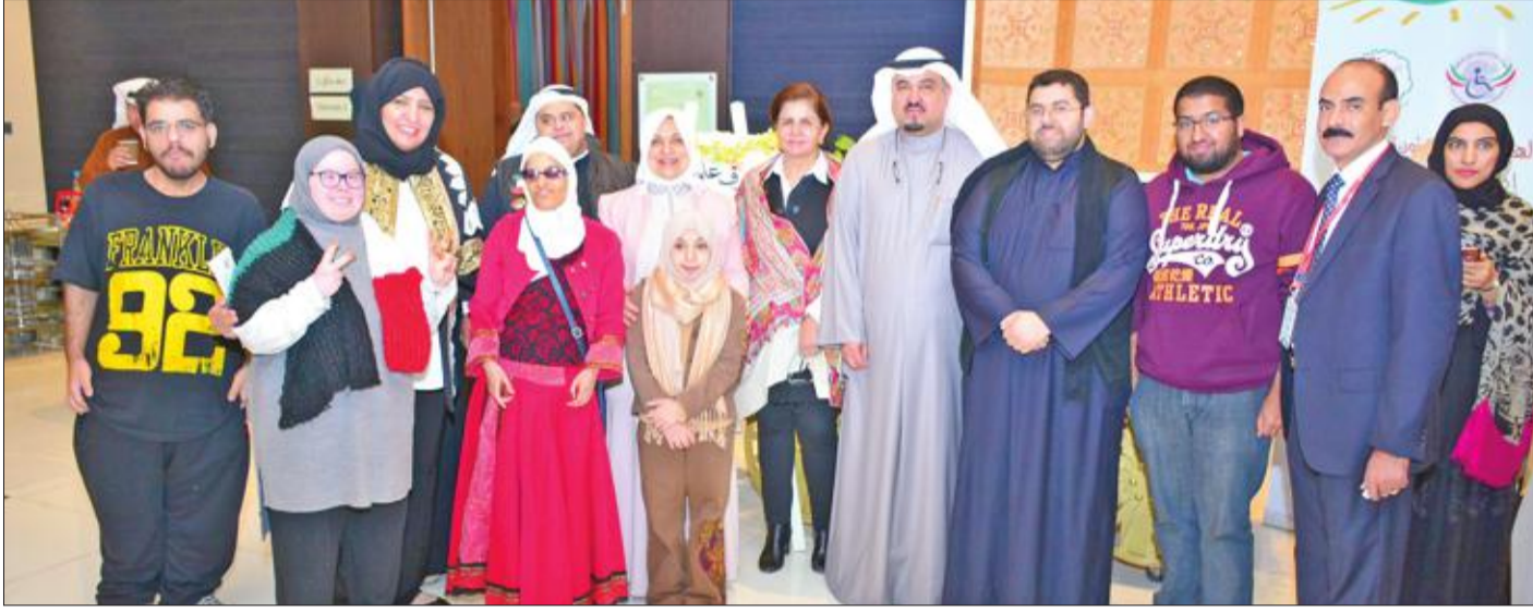
صورة تذكارية مع الصبيح