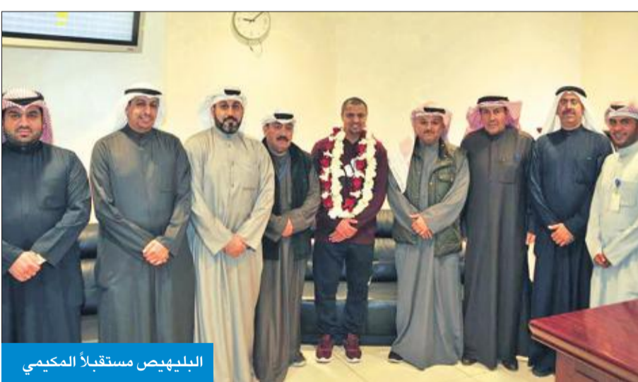
البليهيص مستقبلاً المكيمي

وجوده خارج البلاد للعلاج، داعياً المولى عز وجل أن يحفظ الجميع من كل مكروه.