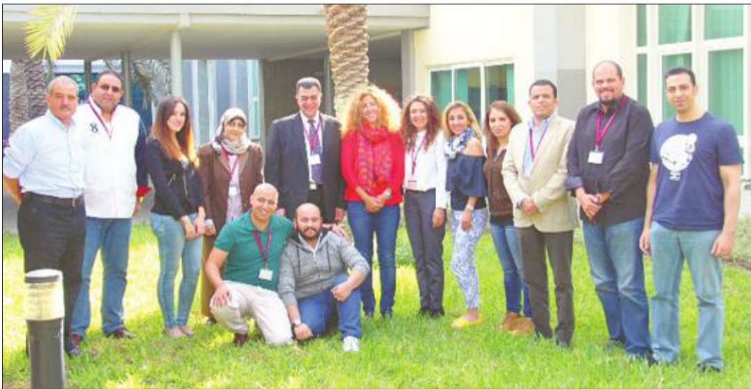
صورة تجمع الطلبة المتدربين والمعلمين