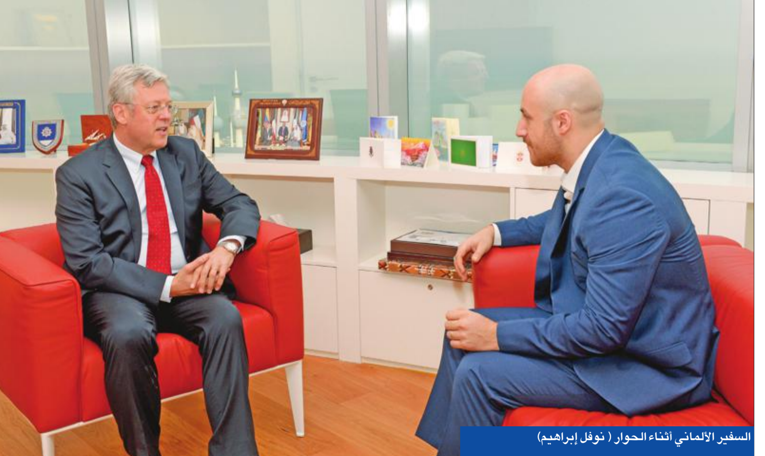
السفير الألماني أثناء الحوار (نوفل إبراهيم)

حول المجالات التي تحتاج إلى تطوير، ضمن إطار العلاقات الألمانية-الكويتية، وصف السفير الألماني، العلاقة بين الطرفين بالحميمة والمختفة، الأمر الذي يمكن معاينته من خلال مجموعة اللقاءات، وعلى مستوى عالٍ جمعت بين الطرفين، لاسيما التعاون القوي على المستوى السياسي في سبيل التوصل إلى حلول للمخاطر التي تعصف بالمنطقة كالتالي في اليمن، والتغلب على أزمة اللاجئين في سورية. كما أشار إلى العلاقات الممتازة بين البلدين على الصعيد الاقتصادي، وقال «بري المرء الكثير من السيارات الألمانية الصنع في الشوارع الكويتية، غير أن ألمانيا لديها الكثير من المنتجات التي تقدمها إلى السوق الكويتي إلى جانب