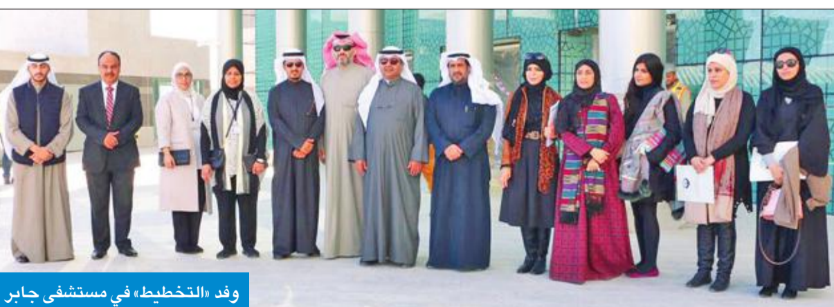
وفد «التخطيط» في مستشفى جابر

له، مؤكداً أن كل الجهات تقوم بإدخال بيانات مشاريعها التخمومية أولاً بأول من خلال النظام الآلي للمتابعة في الأمانة.