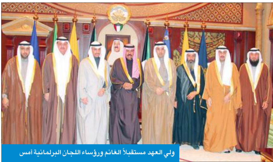
ولي العهد مستقبلاً الغانم ورؤساء اللجان البرلمانية أمس

كما استقبل سموه، أعضاء مكتب المجلس لدور الانعقاد العادي الأول للفصل التشريعي الخامس عشر كلا من نائب رئيس المجلس عيسى الكندري وأمين سر المجلس د. عودة الرويعي ومراقب المجلس نايف العجمي ورئيس لجنة الشؤون التشريعية والقانونية محمد الدلال ورئيس لجنة الأولويات ثامر الظفيري وذلك بمناسبة تشكيل هيئة المكتب.