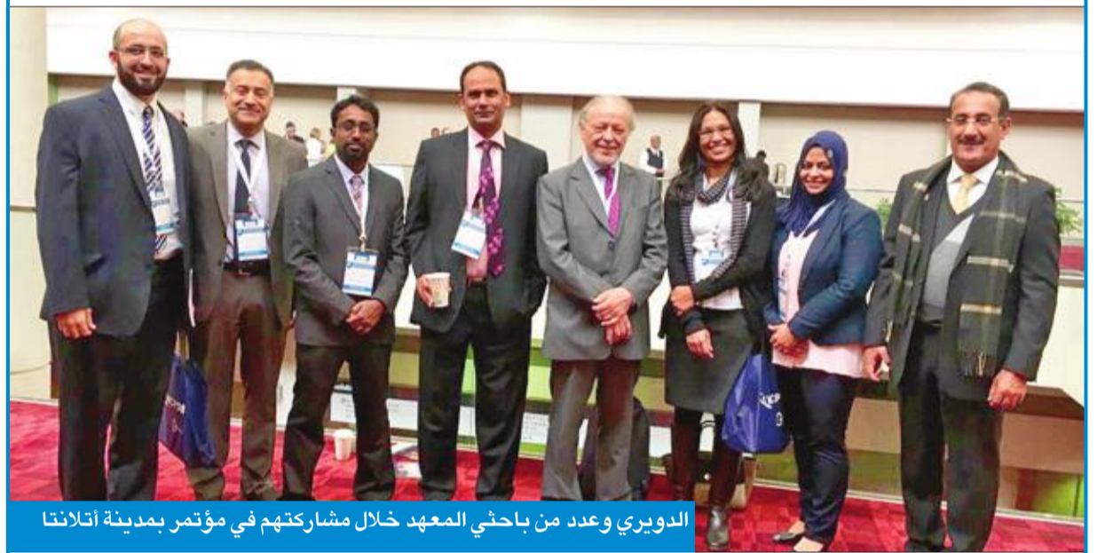
الدويري وعدد من باحثي المعهد خلال مشاركتهم في مؤتمر بمدينة أتلانتا

الدويري: حضور المعهد كان لافتاً في المؤتمرين