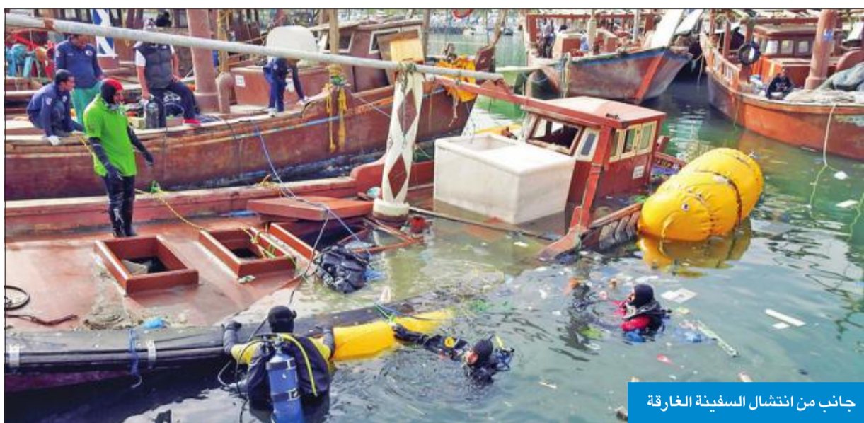
جانب من انتشل السفينة الغارقة

قانون الوحدة الوطنية لإساءته إلى المذهب الشيعي في البلاد، وذلك بعد نشره في حسابه على شبكة التواصل الاجتماعي "تويتر" منشوراً يتضمن الإساءة إلى المذهب الشيعي بالبلاد وتحقيراً وردت بحسابه، والتي تؤثر على العلاقات بين الكويت والسعودية. يذكر أن هناك أحكاماً غيابية بحق دشتي تزيد على 32 عاماً، بعد إدانته بالإساءة إلى السعودية والبحرين، بعد نشره تغريدات عدة بحسابه على "تويتر"، وكذلك بلقاءات بعدة فضائيات مختلفة مسيئة للأنظمة في البحرين والسعودية، وهي ما اعتبرتها الكويت تؤثر في علاقاتها مع البلدين.