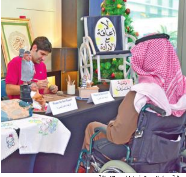
ورشات عمل المحترفين لذوي الإعاقة