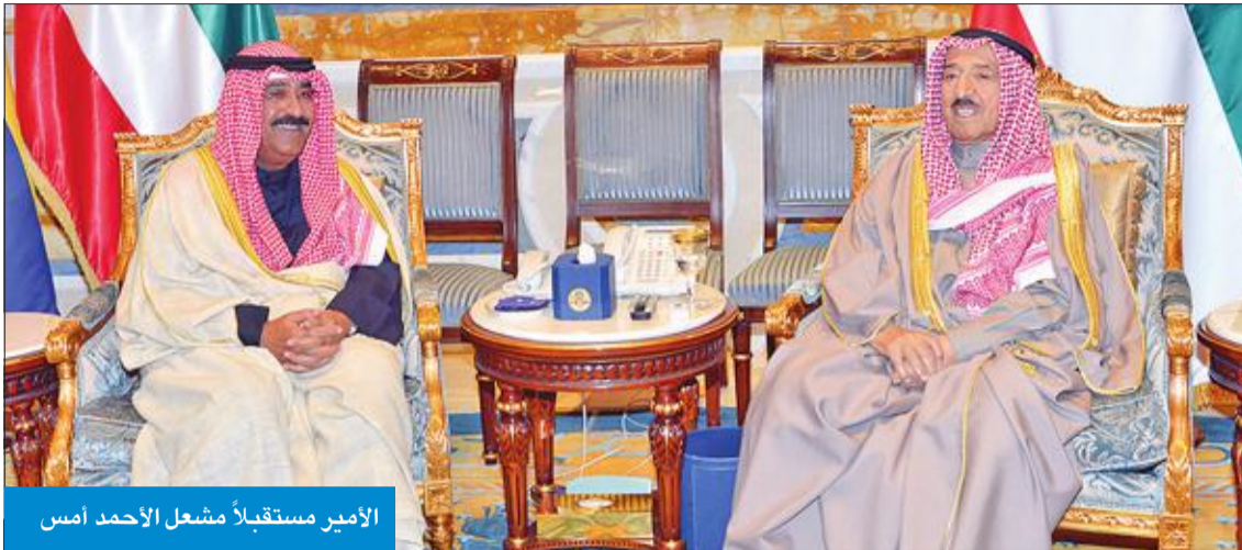
الأمير مستقبلاً مشعل الأحمد أمس

الهاشمية الشقيقة، أعرب فيها سموه عن خالص تعازيه وصادق مواساته بضحايا الهجوم الذي نفذته مسلحون على دوريات للشرطة في مدينة الكرك جنوب الأردن، والذي أسفر عن استشهاد عدد من أفراد قوات الأمن الأردنية وإصابة آخرين، مشيراً سموه الى استنكار الكويت وإدانتها الشديدة لهذا العمل الإرهابي الذي استهدف أرواح الأبرياء الأمنيين.