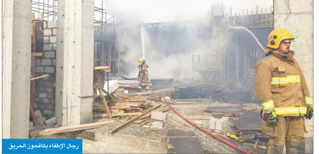
رجال الإطفاء يكافحون الحريق