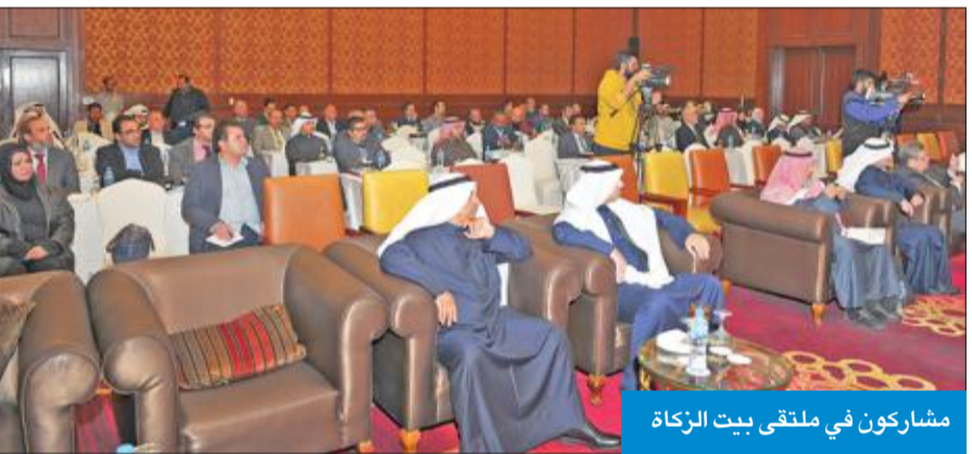
مشاركون في ملتقى بيت الزكاة

مثل تحقيق التكافل الاجتماعي، وتربية النفس على العطاء والتواضع بين أبناء المجتمع، وتدفع بعجلة الاقتصاد في البلاد. وأضاف العجران أن احتساب العروض التجارية يكون بنسبة ربع العشر، أي (2.5 في المئة) إذا كان الحول بالنسبة القمرية أو نسبة (2.577 في المئة) إذا كان الحول بالنسبة الشمسية، وهذا في حال العجز عن الاحتساب بحول السنة القمرية الهجرية. من جانبه، تناول د. محمد