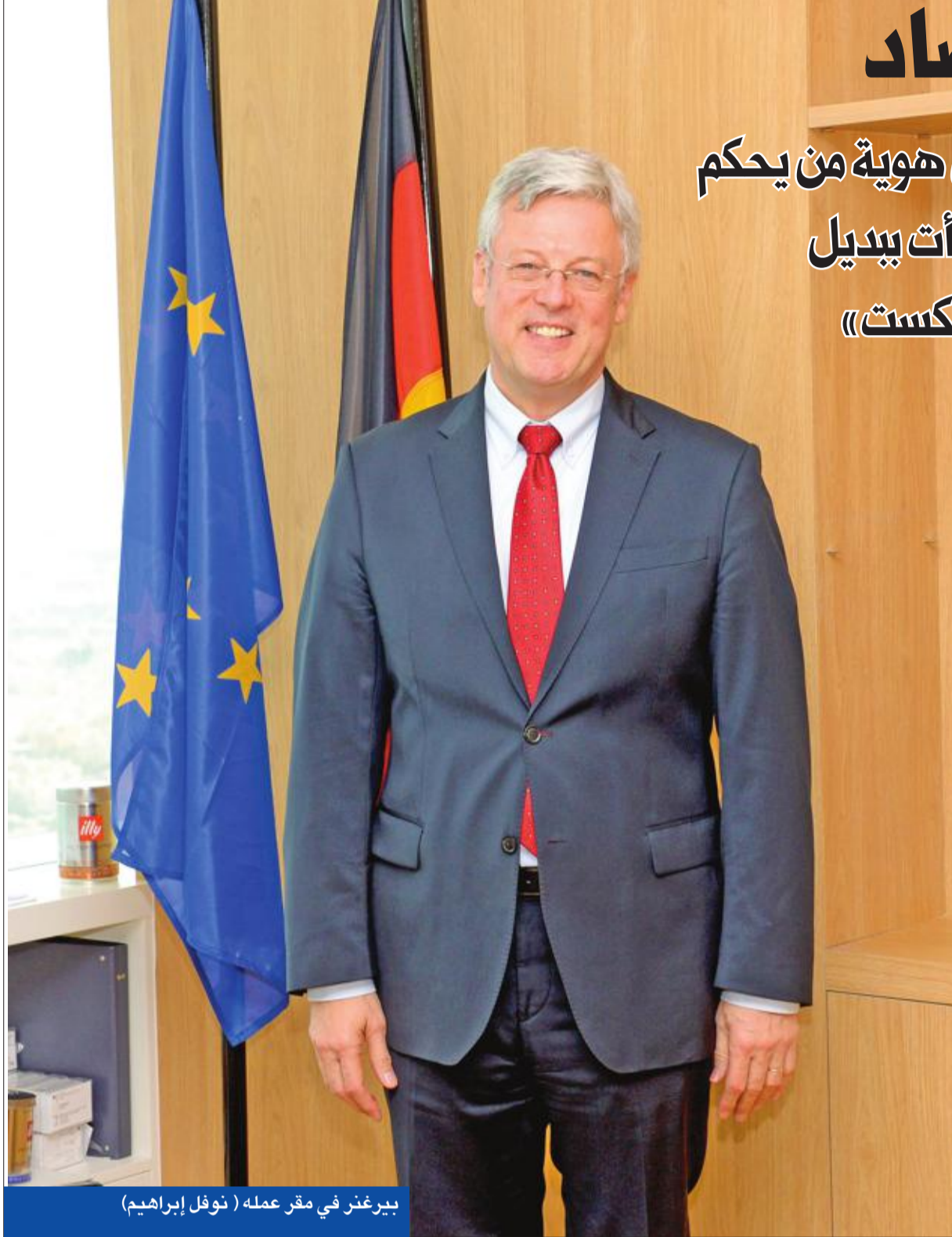
بيرغر في مقر عمله (نوفل إبراهيم)

أكد سفير ألمانيا في الكويت، كارل فريد بيرغر، أن تصاعد الحالة الشعبوية يعود إلى اعتقاد الشعبويين الخاطئ بأن وضع حاجز أمام كل غريب يعد حلاً للمشكلات الاقتصادية والسياسية، مشيراً إلى أن هذا التوجه مضر بالاقتصاد. وحول الهجرة لألمانيا، أكد بيرغر أن من لا يحقق شروط الحصول على حق اللجوء، أو يسيء استخدام كرم الضيافة الألماني من خلال الأعمال الإجرامية، يجب إبعاده، أما بخصوص