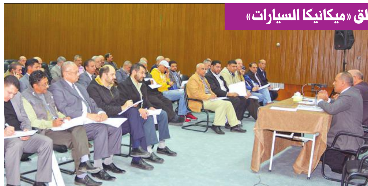
المعلمون خلال اللقاء التثقيفي