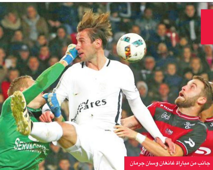
جانب من مباراة غانغان وسان جرمان

أعلن غابرييل ميليتو، استقالته من تدريب فريق إندبدينتي أمس، في مؤتمر صحفي مقتضب امتد لدقيقة و39 ثانية. وقال ميليتو عقب هزيمة فريقه في أرضه على يد بانفيلد بهدف نظيف الليلة الماضية في الجولة الـ14 من الدوري الأرجنتيني لكرة القدم: "أريد الإعلان أنه منذ هذه اللحظة أترك عملي كمدير فني لإندبدينتي". وخلال قيادته لإندبدينتي، خاض معه 19 مباراة، فاز منها الفريق بثمانية لقاءات وخسر ست وتعادل خمس مرات. ويضع ميليتو، لاعب برشلونة وساراجوسا السابق، نهاية لتجربته الثانية في التدريب، عقب قيادته العام الماضي لإستوديانتس دي لا بلاتا. وأكد "حان وقت التنحي، لم أعد قادراً على مواصلة ما أديعه، وأريد شكر الفرصة التي منحتموها لي، واعتذر لجميع من تحمس وتامل بشأن قيادتي للنادي". وبذلك يتبرك ميليتو إندبدينتي في المركز الثامن بترتيب الدوري برصيد 22 نقطة.