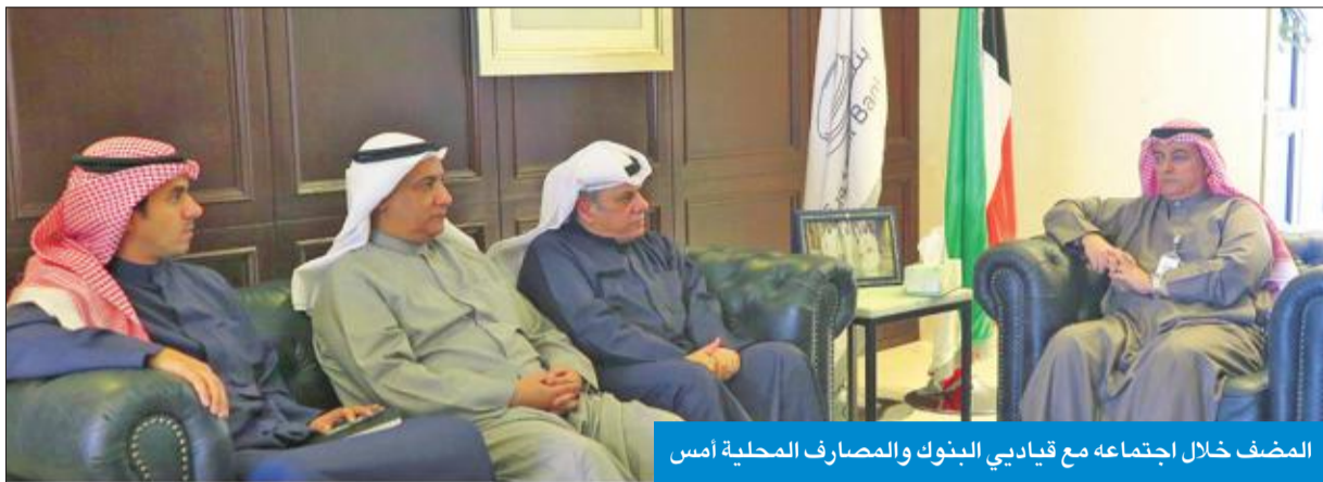
المضف خلال اجتماعه مع قيادي البنوك والمصارف المحلية أمس

أكد إسهامات «الأئتمان» في حل القضية الإسكانية بالبلاد