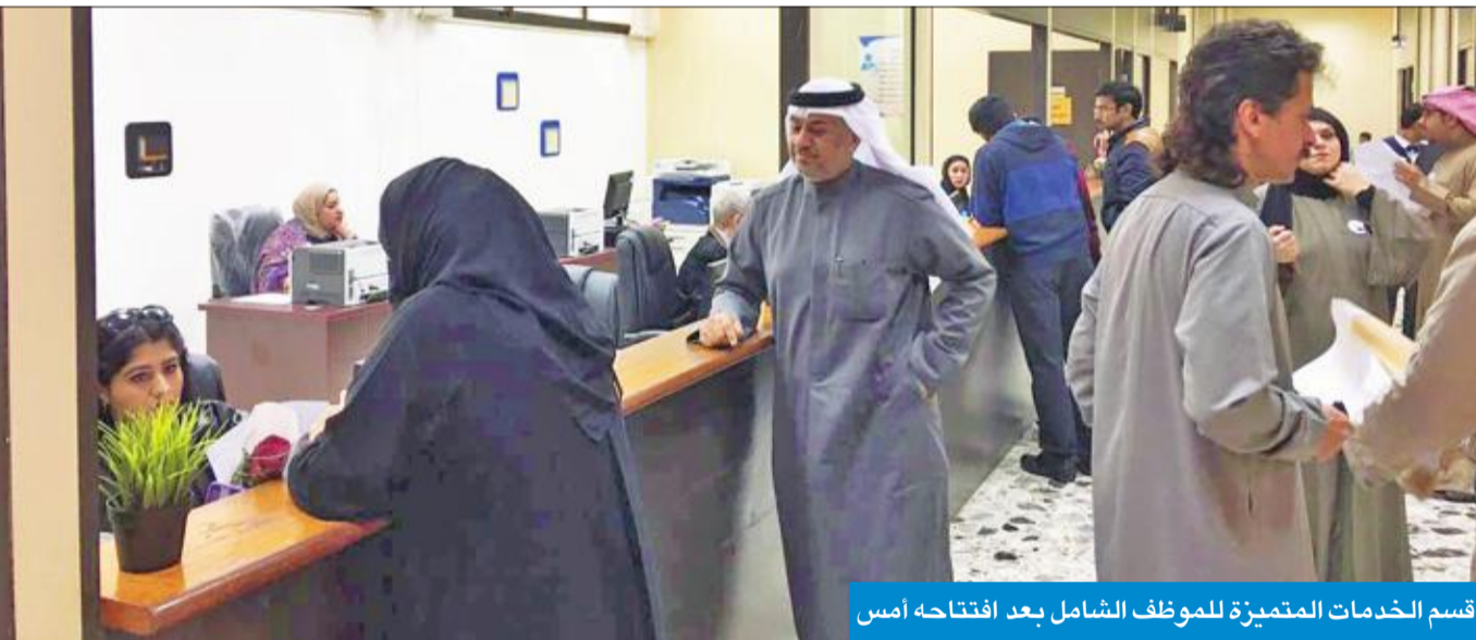
قسم الخدمات المتميزة للموظف الشامل بعد افتتاحه أمس

المطيري: تقليص الدورة المستندية وتسهيل أمور الموظفين الحاليين والمتقاعدين