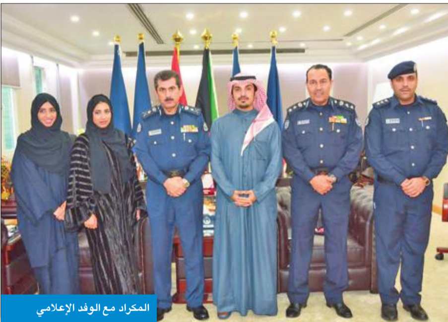
المكرد مع الوفد الإعلامي

استقبل المدير العام للإدارة العامة للإطفاء الفريق خالد المكرد، صباح أمس، وفداً من مركز الشارقة الإعلامي لحكومة إمارة الشارقة من دولة الإمارات العربية الشقيقة، تمثلها مديرة المنفذ الدولي للاتصال الحكومي جواهر النقبى، ووفد مرافق من وزارة الإعلام برئاسة سلطان بن حثلين، لدعوة الإدارة العامة للإطفاء للمشاركة في جائزة الشارقة للاتصال الحكومي الرابع، نظراً لما تتميز به الإدارة العامة للإطفاء في دولة الكويت من مستوى إعلامي عال محلياً وخليجياً. وأكد المكرد نجاح الاستراتيجية الإعلامية للإدارة التي أثمرت نتائجها عن انخفاض نسبة الحرائق والحوادث من خلال الدور التوعوي والوقائي، مبيناً أهمية الإعلام ووسائل التواصل الاجتماعي الحديثة في المجتمع.