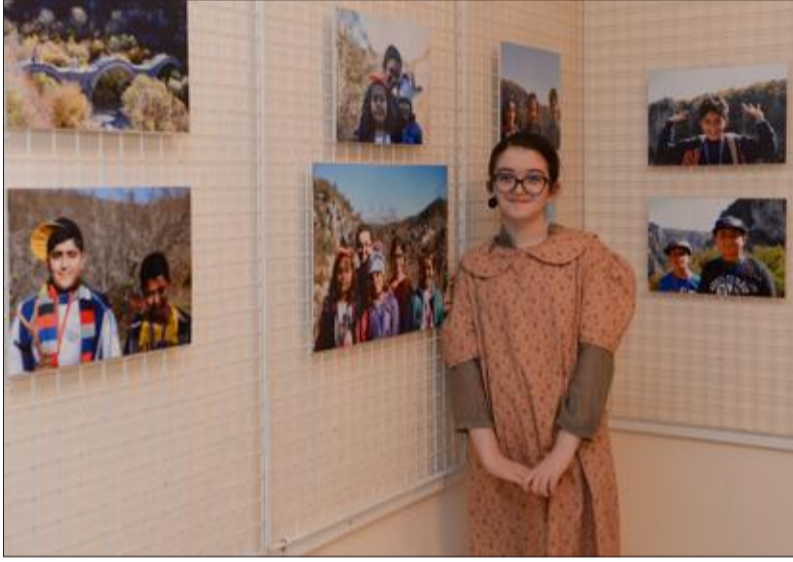
طالبة مشاركة في المعرض