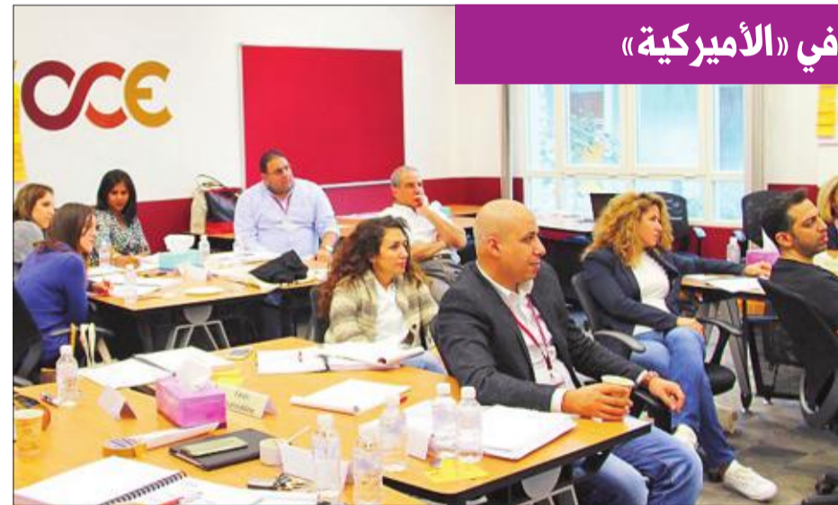
جانب من المشاركين في البرنامج