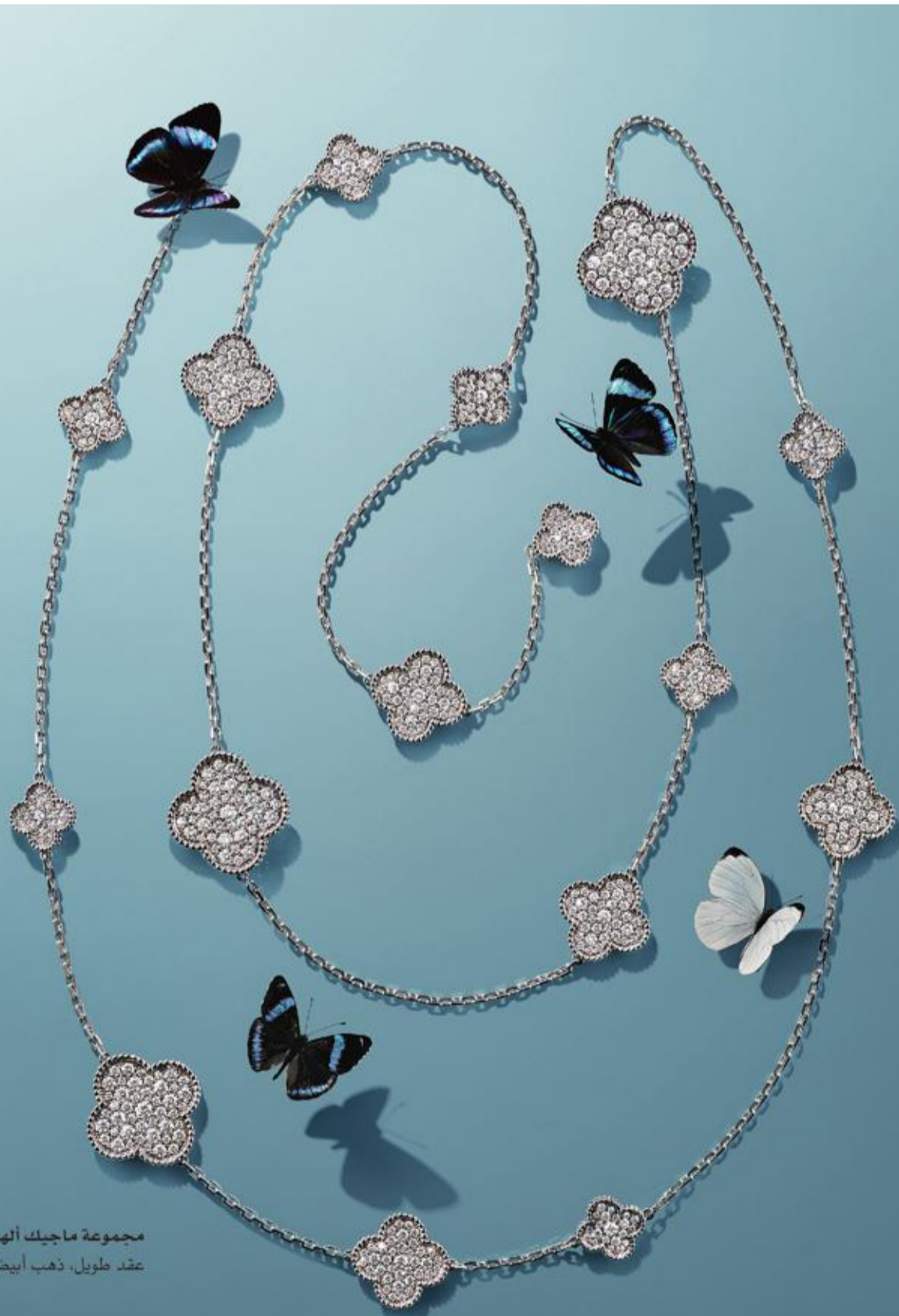
مجموعة ماجيك ألياميرا عقد طويل، ذهب أبيض و ألماس

تتعلق القضية الثانية بمصير وانغ تشي شان، رئيس لجنة الانضباط في الحزب الشيوعي الصيني وقائد حملة شي لمكافحة الفساد، فإذا تقاعد وانغ العام المقبل، كما تقضي قواعد الحزب، فسيخسر شي حليفه الأكثر جدارة بالثقة، ولكن إذا ظل وانغ في منصبه، فربما يرفض أعضاء اللجنة الآخرون الذين بلغوا سن التقاعد الامتناع لهذه القاعدة، وهو ما يعني فعلياً إنهاء حدود سن التقاعد لمسؤولي الحزب الشيوعي الصيني.