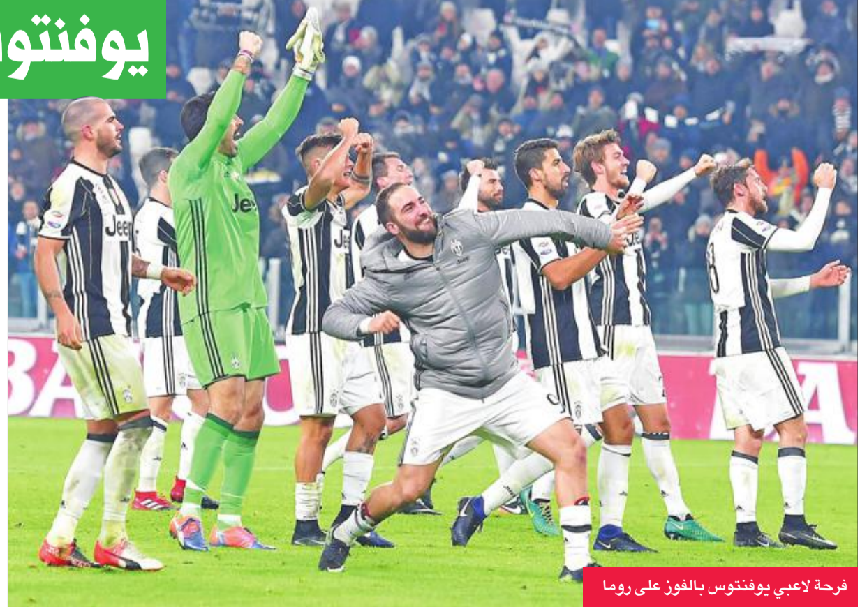
فرحة لاعبي يوفنتوس بالفوز على روما