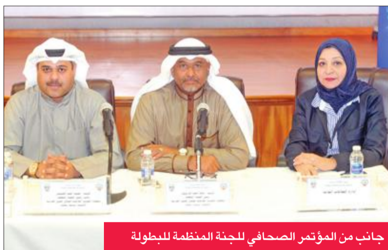
جانب من المؤتمر الصحافي للجنة المنظمة للبطولة

215 رأساً من 97 مربيماً كويتيياً من الإنتاج المحلي، وستشهد فعاليات البطولة في اليوم الأول منافسة المهرات من عمر سنة إلى ثلاث سنوات بمشاركة 86 رأساً في حين تشهد فعاليات اليوم الثاني منافسات المهور بعمر سنة إلى ثلاث سنوات بمشاركة 80 رأساً.