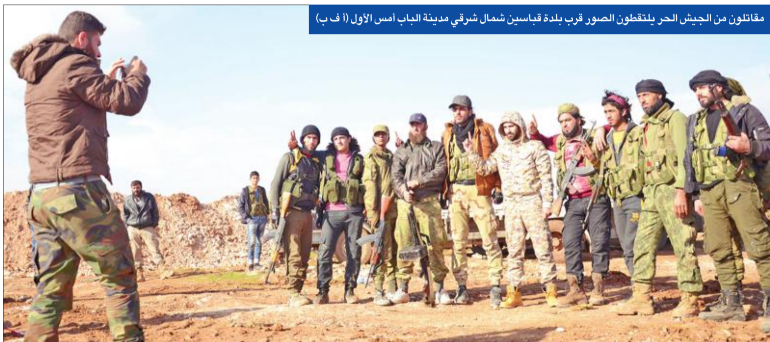
مقاتلون من الجيش الحر يلتقطون الصور قرب بلدة قباسين شمال شرقي مدينة الباب أمس الأول

في عام 2017، دعا أمين المجلس الأعلى للامن القومي الإيراني علي شمخاني لإجراء المحادثات في دمشق وبإشراف السوريين أنفسهم. وقال شمخاني بعد لقائه الأسد، أمس الأول، «على الجميع أن يدرك أن المفاوضات السياسية يجب أن تنقل إلى دمشق باعتبارها عاصمة سورية الموحدة، مشيراً إلى أن بعض اللابعين الرئيسيين في الأزمنة السورية استطاع معالجة أخطائه، وادرك ضرورة تغيير سياسته».