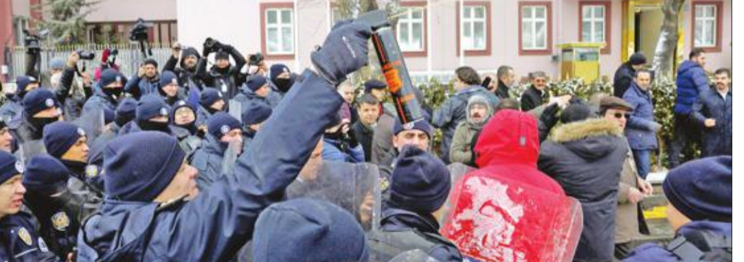
احتكاك بين قوى الأمن ومظاهرين ضد إقرار التعديلات الدستورية قرب مقر البرلمان في أنقرة أمس (رويترز)

البرلمان يبدأ مناقشة تعديل الدستور و«العدالة والتنمية» واثق من الفوز بالاستفتاء