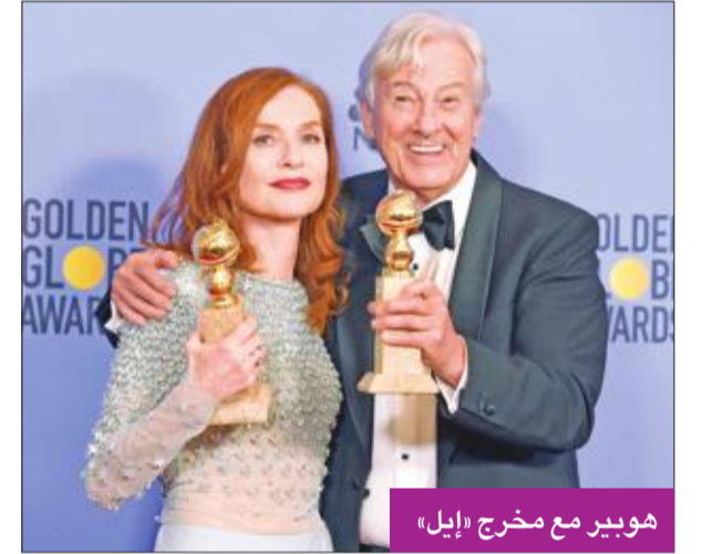
هوبير مع مخرج «إيل»

ودعت مجتمع هوليوود للاحتفال والدفاع عن التعدد، مشيرة إلى أن "هوليوود مليئة بالأجانب، وإذا قدمت بطردهم، فلن يكون أماننا إلا مشاهدة مباريات كرة القدم والفنون القتالية".