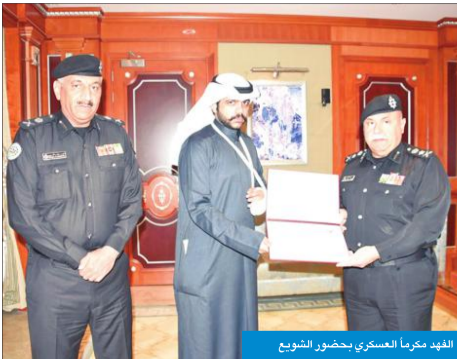
الفهد مكرماً العسكري بحضور الشيوخ

وأشار إلى أنه فور وصول الدوريات للتعامل مع الحادث أخذ قائد إحدى مركبات الدفع الرباعي بالاستعراض أمام الدوريات وكانت مركبته تصدر أصواتاً مزعجة وظلم منه رجال المرور التوقف ولم يستجب، مما دفع بعسكري المرور إلى اعتراض خط سيره وإجباره على التوقف بقوة، فما كان من المستهتر إلا أن حاول دهس عسكري المرور بشكل متعمد وتسبب في إصابته بيده قبل أن يتمكن زملاؤه من استيقافه.