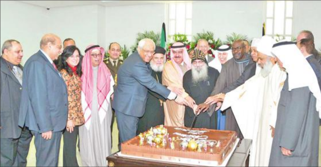
قطع كعكة الحفل