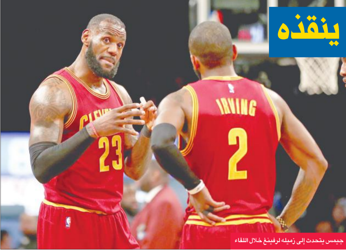
جيمس يتحدث إلى زميله ليرفينغ خلال اللقاء

وعلى ملعب "ستابيلس سنتر"، حقق لوس أنجلوس كليبرز فوزه الرابع تواليًا منذ بداية 2017 (انتهى 2016 بست هزائم متتالية)، والسادس والعشرين هذا الموسم، على حساب ضيفه ميامي هيت 98-86.