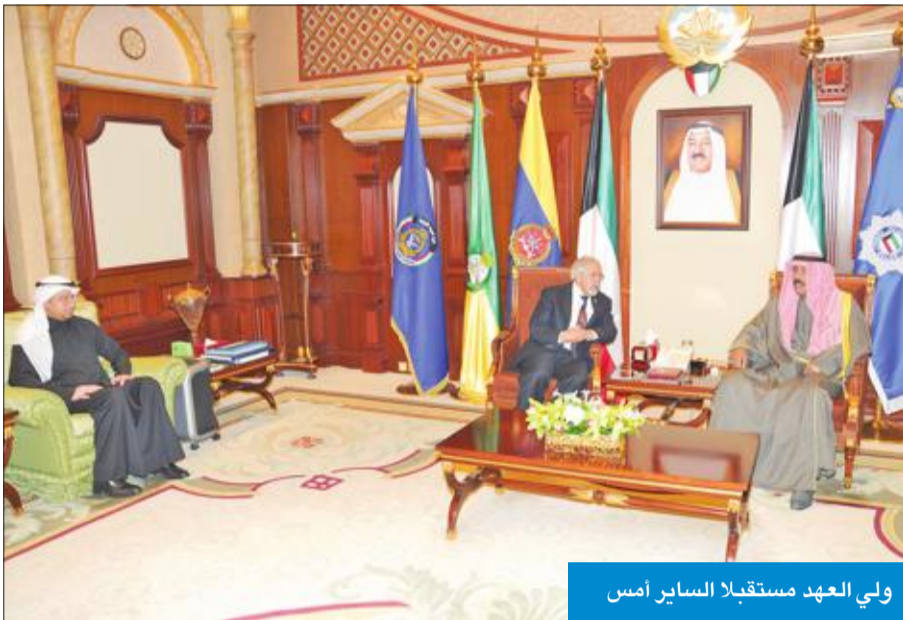
ولي العهد مستقبلي السائر امس

استقبل سمو ولي العهد الشيخ نواف الأحمد، بقصر بيان، صباح أمس، وزير الصحة د. جمال الحربي، ود. مثنى السرتاوي، حيث قدما لسموه شرحاً حول الإنجاز الطبي الذي ابتكره السرتاوي في تركيب الركببة والمفصل الصناعي من خلال إجراء عملية جراحية دون قطع الأربطة والعضلات. وهناك سموه بهذا الإنجاز الطبي، الذي يعتبر إنجازاً جديداً يضاف إلى إنجازات الكويت، ونموذجاً كويتياً مشرفاً يدعونا للفخر به، وبمن يسعون إلى ازدهار بلادهم، متمنياً سموه له التوفيق والنجاح، كما حثه على المزيد من الإنجازات في البحث العلمي والطبي. كما استقبل سموه، ورئيس جهاز الأمن الوطني الشيخ ثامر الطلي، والمساهمين بتأسيس شركة مصادر المياه الدولية المساهمة، حيث قدما لسموه شرحاً حول الشركة وخططها وتطورات مشاريعها، الخاصة بتوفير مصادر المياه والمتنوعة دولياً، وصولاً إلى تحقيق الأمن المائي والغذائي. وأشاد سموه بجهود القائمين على الشركة واستراتيجياتها في إيجاد مصادر وحلول مبتكرة