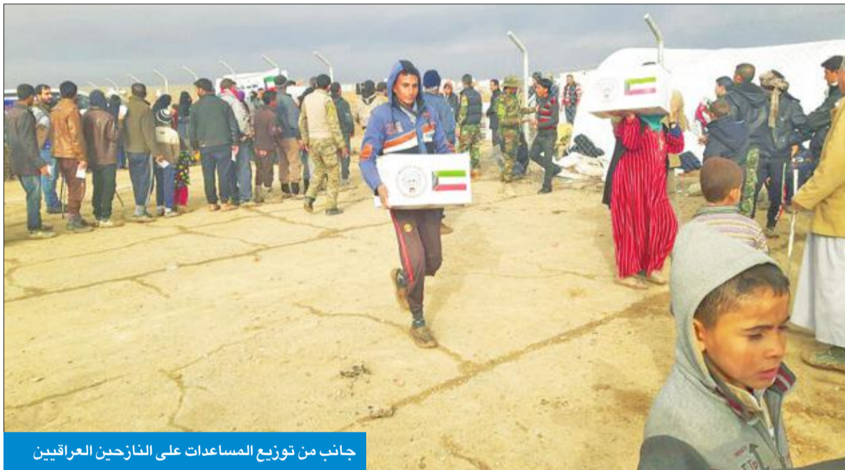
جانب من توزيع المساعدات على النازحين العراقيين

وأوضح أن الوضع الإنساني الصعب في مناطق النزاع بالعراق تسبب في نزوح الآلاف عن ديارهم، ما حتم على «الهلال الأحمر» القيام بواجبها الأخوي والإنساني، تخفيفاً لمعاناتهم، وإسهاماً في تلبية احتياجاتهم الأساسية.