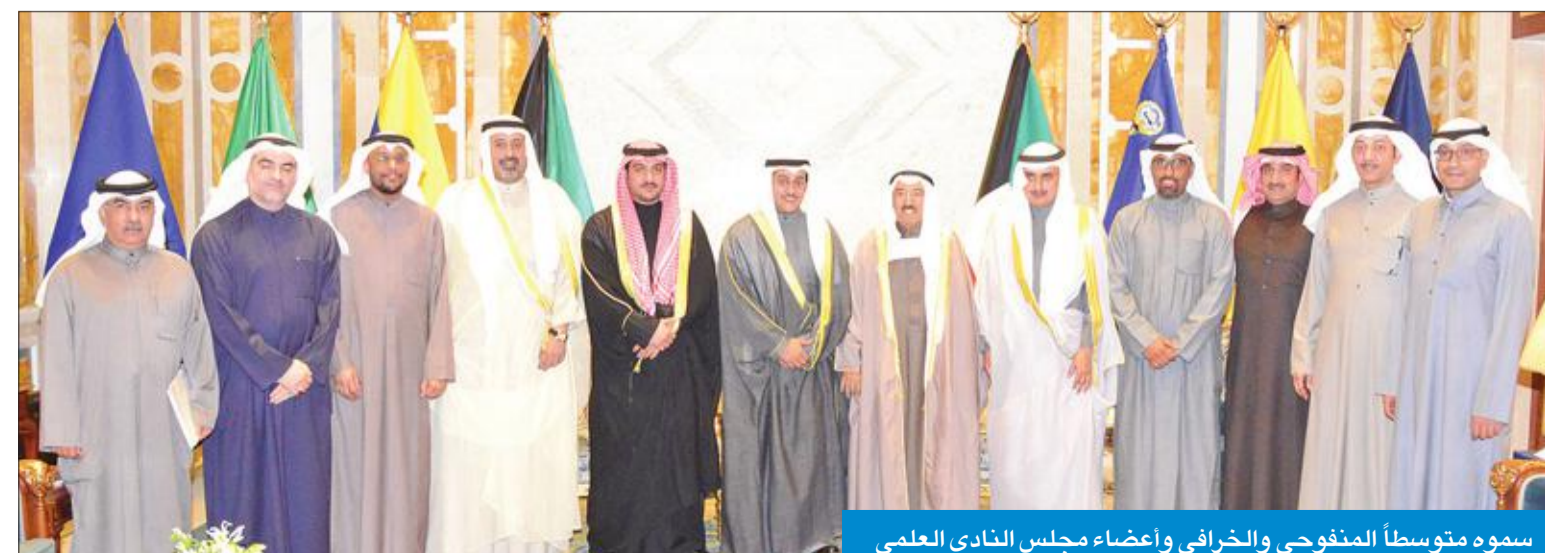
سموه متوسلاً المنفوحى والخرافي وأعضاء مجلس النادي العلمي