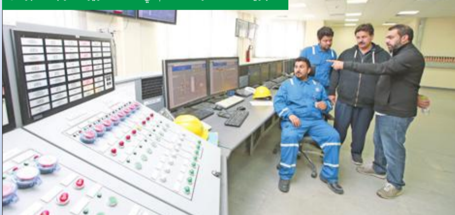
«الجريدة» داخل غرفة التحكم في محطة تعزيز الغاز بحقل برقان