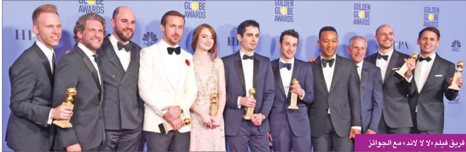
فريق فيلم «لا لا لاند» مع الجوائز