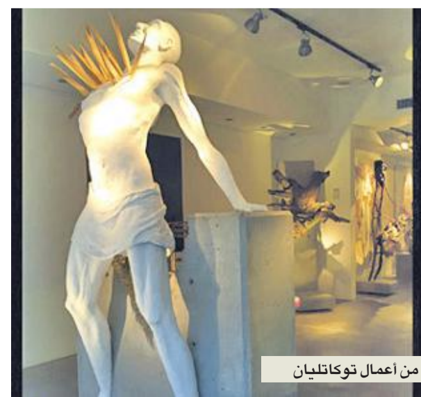
من أعمال توكاتليان

ولد الفنان الأرمني عام 1957، وترعرع وسط عائلة أفرادها من الفنانين. جده هو الوحيد من العائلة الذي نجح من المجازر الأرمنية 1915، ولجا إلى لبنان، ففكر حفيده على هدي الروايات التي كان يرويها له حول هذه المجازر وهو من أرمينيا، فاضى بذلك طابعاً خصوصياً في فنه. استقى توكاتليان ثقافته الفنية من خلال التعقّد في الميثولوجيات التي قادته نحو الفن التقليدي الكلاسيكي اليوناني والروماني، ثم أهتم بمصدر النهضة لا سيما أعمال دوناتيلو. وشكل جيروم بوش مصدر إلهام كبير له، من تلك التي تحدد نفسه بأنه فنّان سوربالي ميثولوجي كلاسيكي.