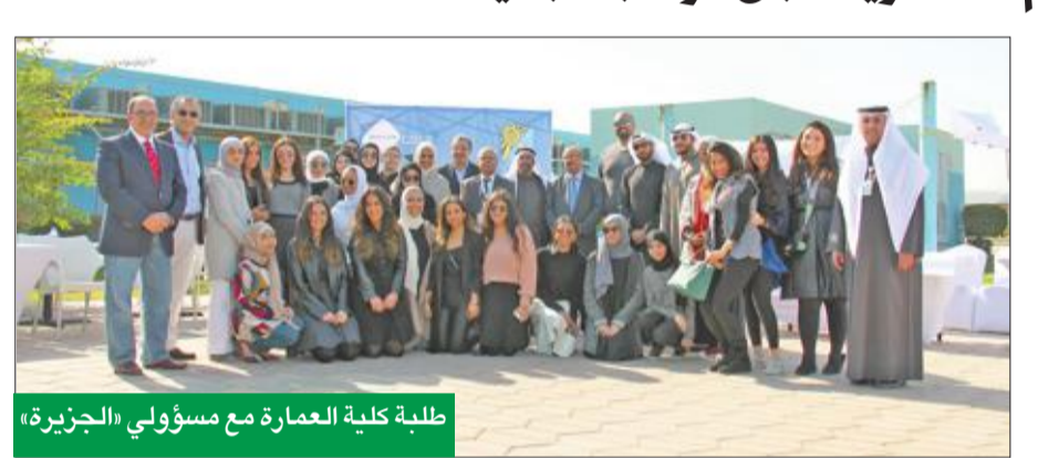
طلبة كلية العمارة مع مسؤولي «الجزيرة»

قلوبنا بتصورات ونماذج معمارية فاقت التوقعات، وأظهرت قدرات تصميمية واعدة في تطوير البنية التحتية لقطاع الطيران الذي يشهد تحديات متغيرة وتطوراً مستمراً.