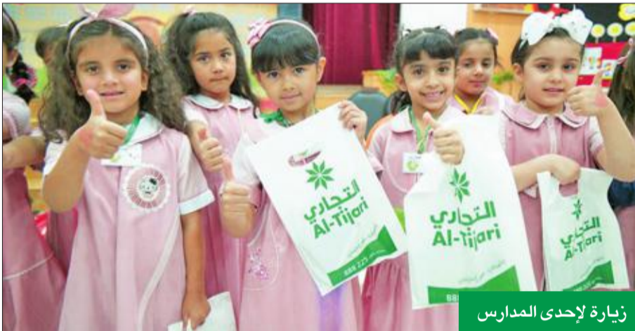
زيارة لإحدى المدارس

توجت جهود «التجاري» في مجال المسؤولية الاجتماعية بحصوله على جائزة الريادة لعام 2016 على مستوى دول مجلس التعاون، وتكريم البنك بهذه المناسبة، وجاء هذا التكريم على هامش الدورة الـ 33 لمجلس وزراء العمل والشؤون الاجتماعية بدول «التعاون» الذي أقيم في الرياض.