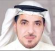
لا تسرق أولويات المجلس!