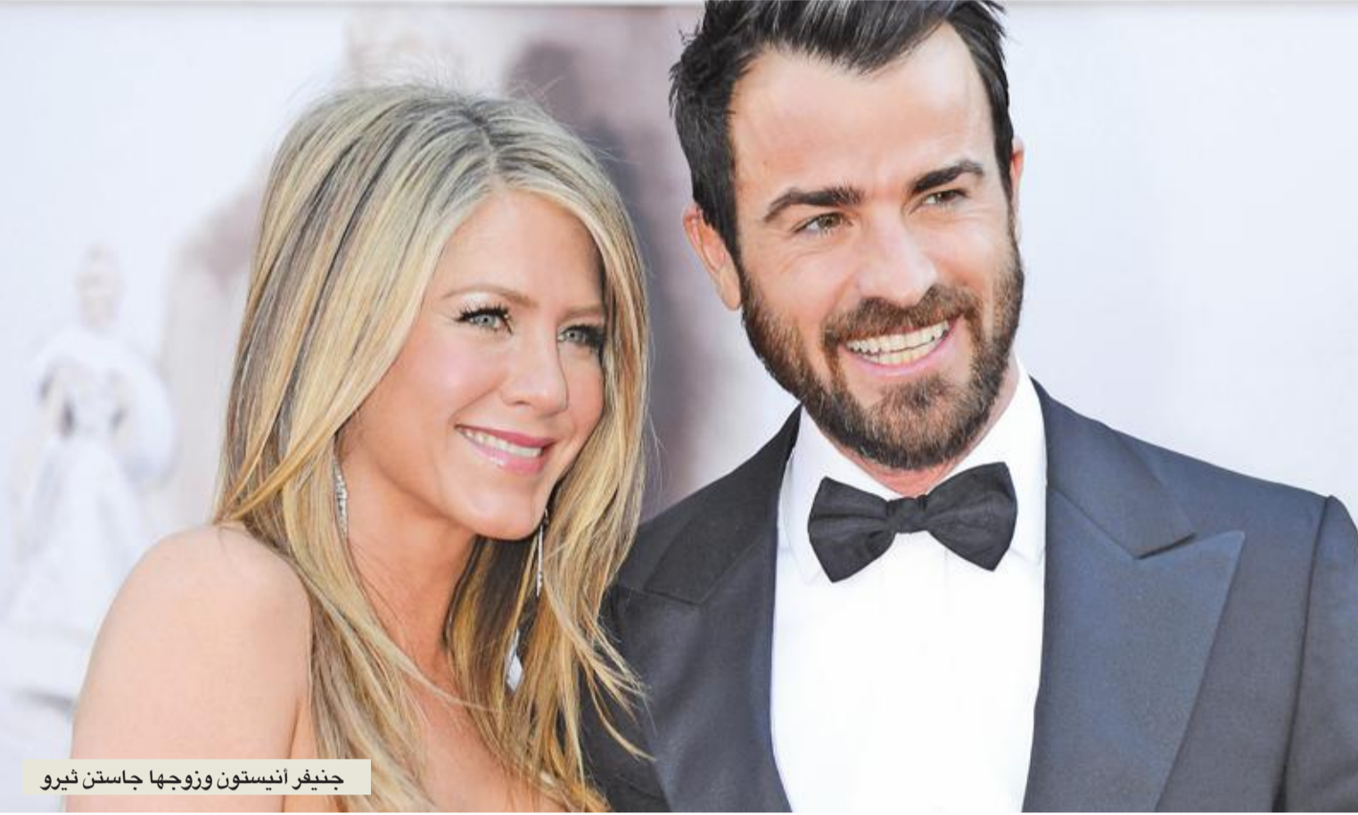
جينيفر أنيستون وزوجها جاستن ثيرو

لها، أو فيلم The Gore Girls (فتيات غوري) الذي يتمحور حول إحدى أوائل الفرق النسائية المؤلفة من ثماني سجينات في سجن تكساس خلال الأربعينات.