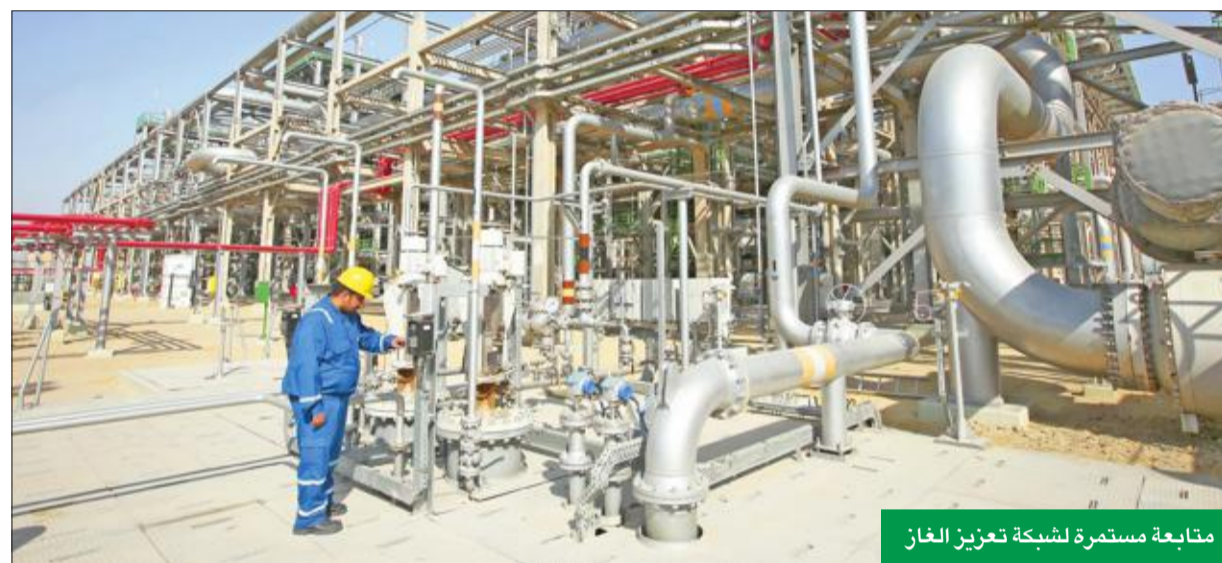
متابعة مستمرة لشبكة تعزيز الغاز

ما آخر استكشافات الغاز؟ - في الأعوام الثلاثة الماضية كان هناك عدد من المشاريع الاستكشافية المهمة، حيث تم الانتهاء من المسح الزلزالي ثلاثي الأبعاد لمناطق المطرية وكراع المر، والانتها من المسح الزلزالي ثلاثي الأبعاد عالي الدقة لمناطق شمال الكويت، و جار الآن المسح الزلزالي ثلاثي الأبعاد عالي الدقة لحقول برقان الكبير. وصاحبت تلك المشاريع نجاحات على صعيد الاستكشاف، حيث كان هناك أكثر من اكتشاف في السنوات الثلاث الأخيرة، وأود الإشارة إلى بعضها، مثل اكتشاف "حقل" في شمال الكويت، واكتشاف النفط الثقيل في حقل "أم نقا" واكتشاف حقلي كبد وأم الروس والركسه. ولله الحمد نتج عن هذه الاكتشافات والمشاريع زيادة في الاحتياطيات المحتملة إضافة أيضاً إلى زيادة في الاحتياطيات المؤكدة من خلال عمليات الاستكشاف والتطوير، وتأتي أهمية هذه الإنجازات من خلال تدعيمها لاستراتيجية الشركة والمؤسسة