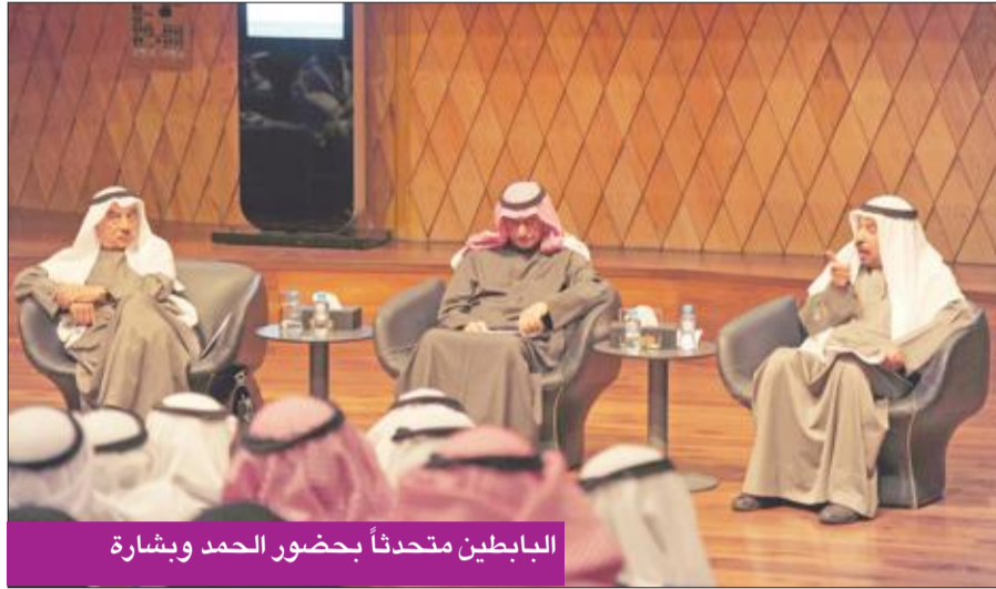
الباطنين متحدثاً بحضور الحمد وبشارة

وأشار إلى مدى اهتمامه وحبّه للغة العربية خاصة