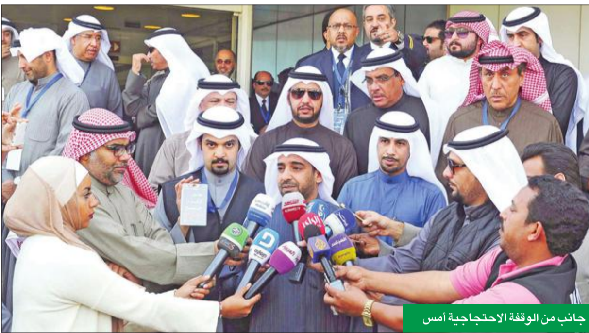
جانب من الوقفة الاحتجاجية أمس

«الكويتية» الذين تزيد أعمارهم على 24 عاماً، علماً بأنه لا توجد أي شركة طيران تقدم هذه الخدمة. وأضادت بأنها نفذت دراسة شاملة لبرنامج تذاكر السفر أظهرت أن هناك تكلفة واضحة من خلال إشغال مقاعد الدرجة السياحية ومقاعد درجتي رجال الأعمال والأولي، تقدر بحوالي 8 ملايين دينار سنوياً من الفرص ضائعة، مضيفة أنها مع تنفيذ الآلية الجديدة ستعمل على ترشيد النفقات المالية بنسبة 50 في المئة من إجمالي تذاكر السفر المجانية التي تصرف سنوياً.