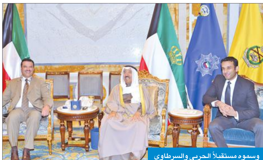
وسموه مستقبلاً الحربي والسرتاوي