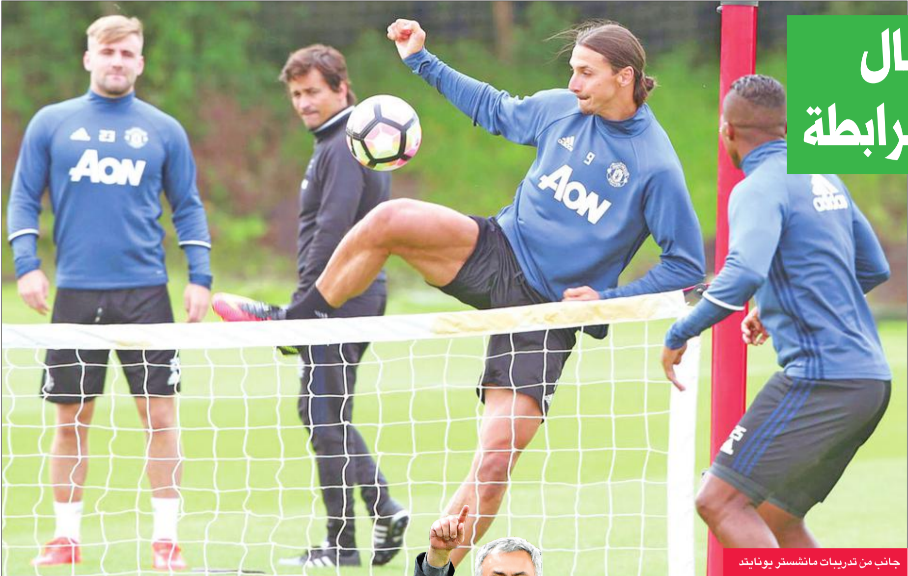
جانب من تدريبات مانشستر يونايتد

ضمن الدور نصف النهائي لبطولة كأس رابطة الأندية الإنكليزية يخوض مانشستر يونايتد مواجهة أمام هال سيتي، وهو مدرك أنها قد تكون فرصته الوحيدة للقب