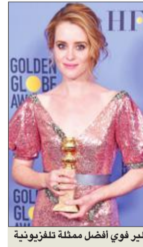
كلير فوي أفضل ممثلة تلفزيونية