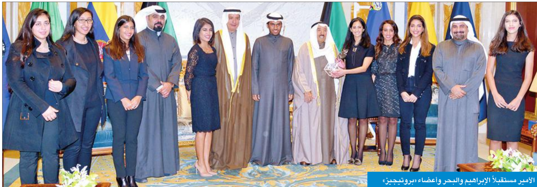
الأمير مستقبلاً الإبراهيم والبحر وأعضاء «بروتيجين»

«لا خير فينا إن ما ساعدناكم ويدي بيدكم حتى تصلون إلى المرحلة التي تتمنوها»