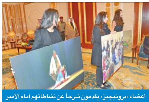
أعضاء «بروتيجين» يقدمون شرحاً عن نشاطاتهم أمام الأمير

شباب الكويت ثروة الوطن الحقيقية وقادة المجتمع نحو النماء والتطور