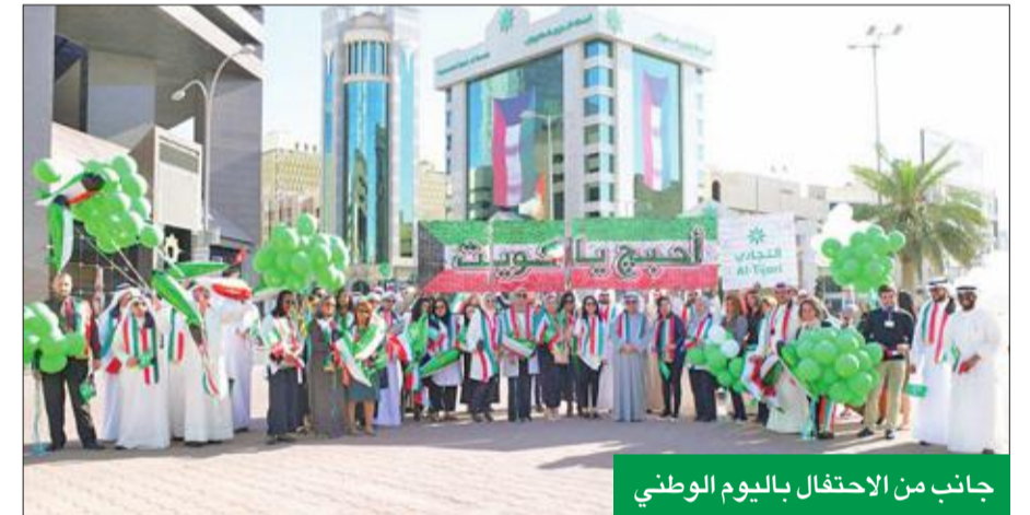
جانب من الاحتفال باليوم الوطني