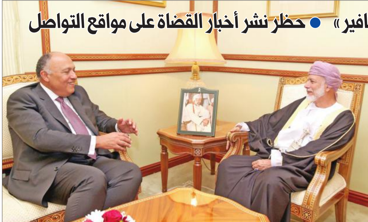
وزير الخارجية العماني يوسف بن علوي مستقبلاً نظيره المصري سامح شكري في مسقط أمس

وزير الخارجية العماني يوسف بن علوي مستقبلاً نظيره المصري سامح شكري في مسقط أمس