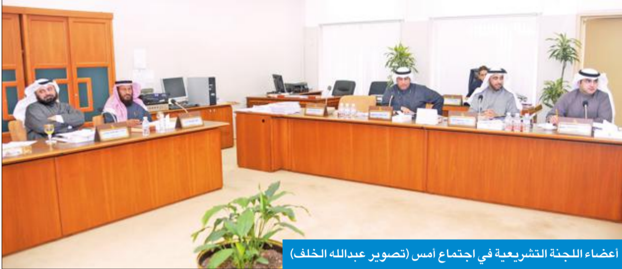
أعضاء اللجنة التشريعية في اجتماع أمس