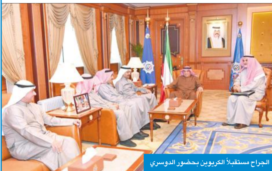
الجراح مستقبلاً الكريون بحضور الدوسري

مجلس الوزراء وزير الداخلية، معرباً عن شكره له لدعم المؤسسة الأمنية اللاحق للجمعية، من أجل أداء دورها المجتمعي والقانوني، متمنياً له تشكيل لجنة مشتركة بين وزارة الداخلية والجمعية، لبحث بعض المعوقات التي تواجه عمل «المحامين»، ووعد الوزير بالعمل على حلها وتذليل كل العقبات.