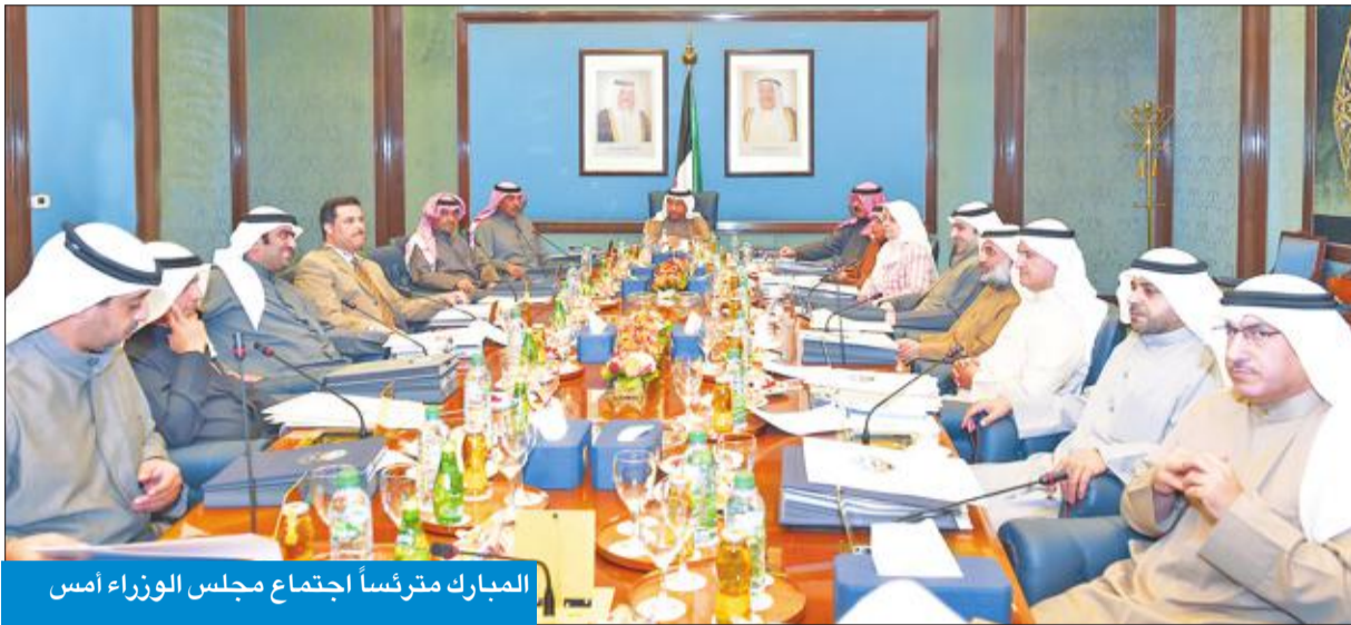
المبارك مترئسا اجتماع مجلس الوزراء أمس

الكويتية، الإدارة العامة للجمارك" ولها أن تتولى التنسيق بين كل الجهات المختصة لرفع كفاءة العمل في المنافذ البحرية، ورفع قدرتها التنافسية في مجال التيسير التجاري، وتطبيق الآليات الحديثة في مفهوم إدارة الموانئ، ونفاذي تشايبك الاختصاصات والصلاحيات في مجال عمل الموانئ وإجراءات استيراد وتصدير السلع والمنتجات، كما تختص بمناخبة إنجاز رفع كفاءة العمل في المنافذ البحرية وتطوير التجهيزات والعمليات المتصلة بالمناولة والرافعات واستخدمات الأرصعة ومناطق التخزين وحركة نقل الضائع، وتطوير الإجراءات القانونية والإدارية والفنية المرتبطة بذلك، وتعزيز الكفاءة الأمنية للوصول إلى نظام مراقبة وتفتيش فعال للطرود والبضائع والشاحنات، وتقليص الدورة المستندية المرتبطة بالتخليص والمستندية الجمركيين، مع تحقيق الربط الإلكتروني بين الجهات المختصة وزيادة فاعلية طاقم الموظفين وتأهيلهم بشكل مستمر، وأيضاً تنسيق وتوحيد سلطة القرار في المنافذ البحرية على كافة الأجهزة، ووضع الخرتجات العملية وتهيئة البيئة التنظيمية والقانونية اللازمة لتحقيق أفضل البات العمل في المنافذ البحرية الدولية لشؤون الإسكان ووزير الدولة لشؤون الخدمات تضم في عضويتها ممثلين عن كل من وزير الداخلية، مؤسسة الموانئ