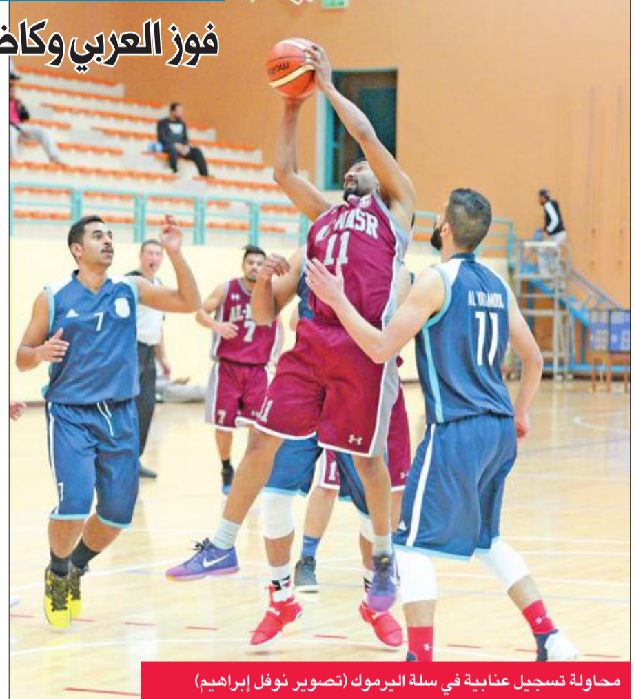
محاولة تسجيل عنابية في سلة اليرموك

فاز النصر على اليرموك والعربي على التضامن وكاظمة على الصليبيخات والجھراء على الشباب ضمن منافسات المرحلة السادسة من الدوري العام لكرة السلة.