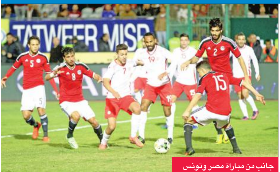
جانب من مباراة مصر وتونس