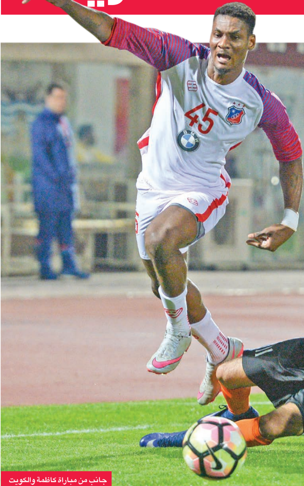
جانب من مباراة كاظمة والكويت

وبفوزه على النصر، بات السالمية حسابيا الأقرب للظفر بالبطاقة الثانية، فالسماوي يكفيه التعادل أمام الكويت للتأهل، وهو أمر لا يبدو صعبا، واللافت أن احتساب الحكم علي طلب