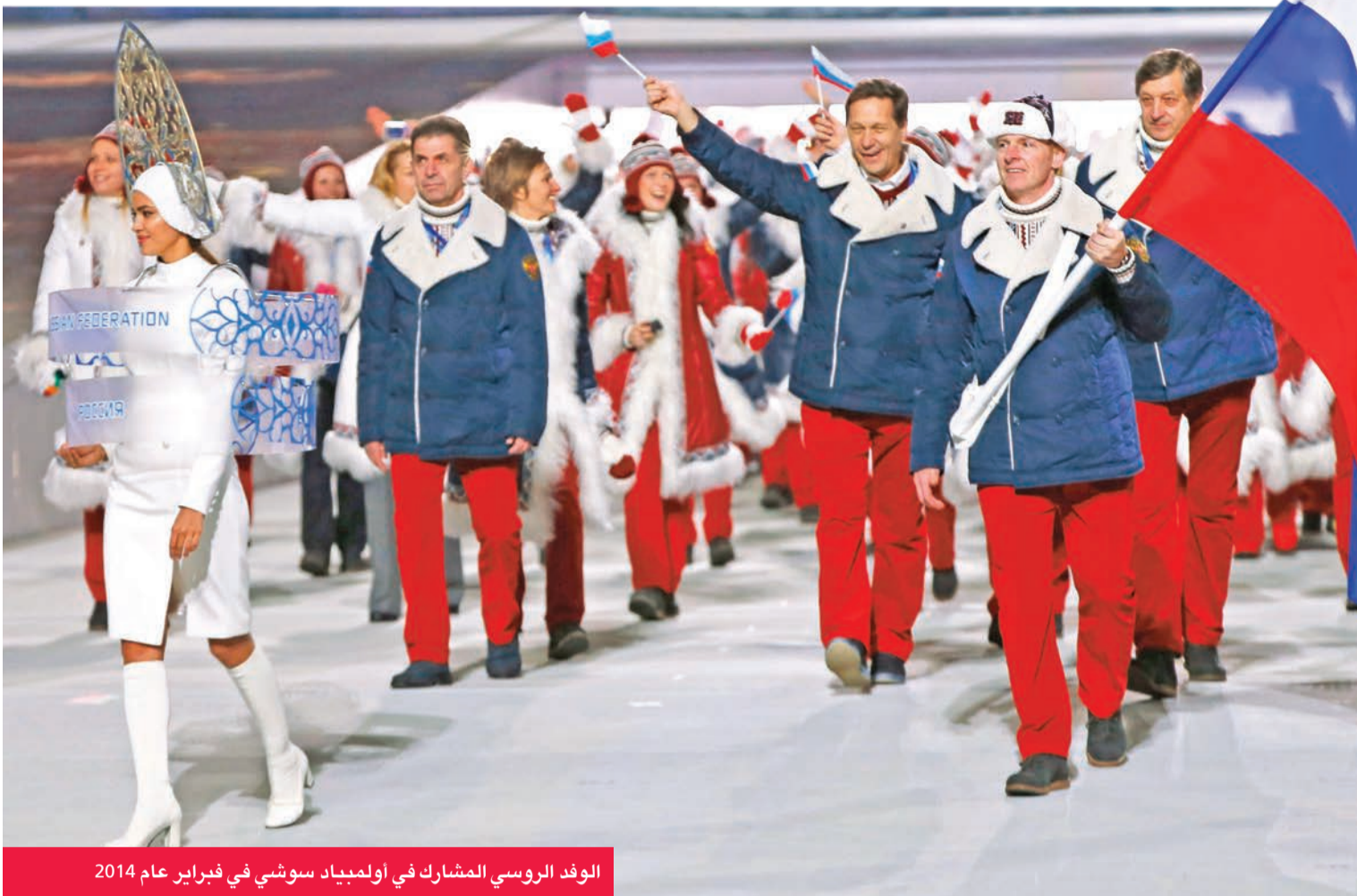
الوفد الروسي المشارك في أولمبياد سوشي في فبراير عام 2014

العديد من المديرين لا يفهمون كيف يمكن العمل دون اللجوء إلى المنشطات موتكو