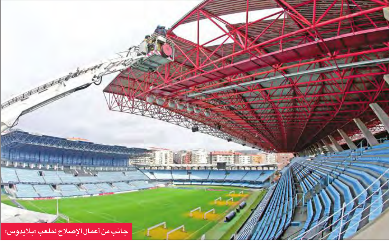
جانب من أعمال الإصلاح لملاعب «بلايدوس»

الإسباني 3 خيارات: الأول هو دراسة إمكانات تصليح السقف المتضرر، الثاني يكمن في بحث إمكان غلق المدرج، الذي يغطيه هذا السقف، الثالث هو إيجاد ملعب قريب لإقامة المباراة في حال لم يكن ممكناً تبني أي من الحلين السابقين.