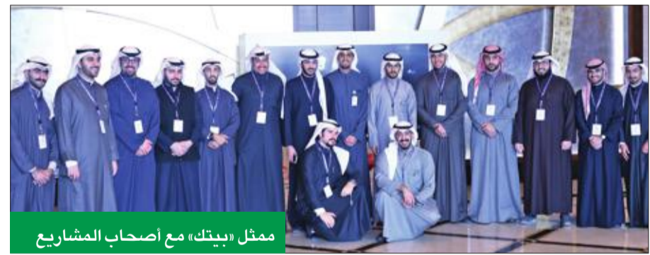
ممثل «بيتك» مع أصحاب المشاريع