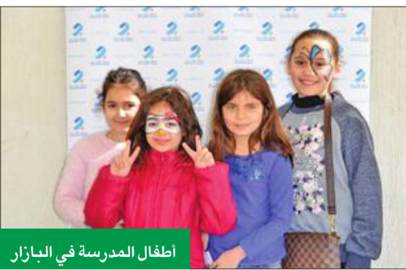
أطفال المدرسة في البازار

أعلن بنك برقان رعايته لبازار Green Unit، الفعالية السنوية غير الربحية التي ستقام خلال الشهر الجاري بمدرسة الكويت الإنكليزية، حيث سيتخلل هذه الفعالية العديد من الأنشطة الترفيهية للأطفال، والتي تشمل على مباريات كرة القدم والرسم على الوجوه وكشك ممتع للتصوير ورسم الحنة والرماية، وقراءة القصص وسحب على جوائز عديدة وغيرها. وأشار إلى أنه ستتاح الفرصة للأطفال لشراء الألعاب التربوية والكتب وأدوات الرسم، على أن يتم تخصيص ريع الفعالية لتوفير بيئة تعليمية فعالة للطلبة ذوي الاحتياجات التعليمية الخاصة. يذكر أن قسم Green Unit السنوية الكويت الإنكليزية يهدف إلى تطوير قدرات ومهارات الطلبة من ذوي الاحتياجات الخاصة، ويضم القسم نحو 125 طالباً من عمر 6 إلى 21 عاماً، ويوفر أساليب تعليمية خاصة ومميزة، ويركز