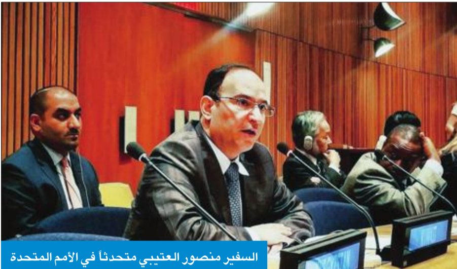
السفير منصور العتيبي متحدثاً في الأمم المتحدة

العتيبي: التعسف في استخدام «الفيثو» نال من مصداقية اتخاذ القرار