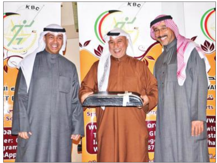
تكريم اللاعب الدولي حمد بوحمند