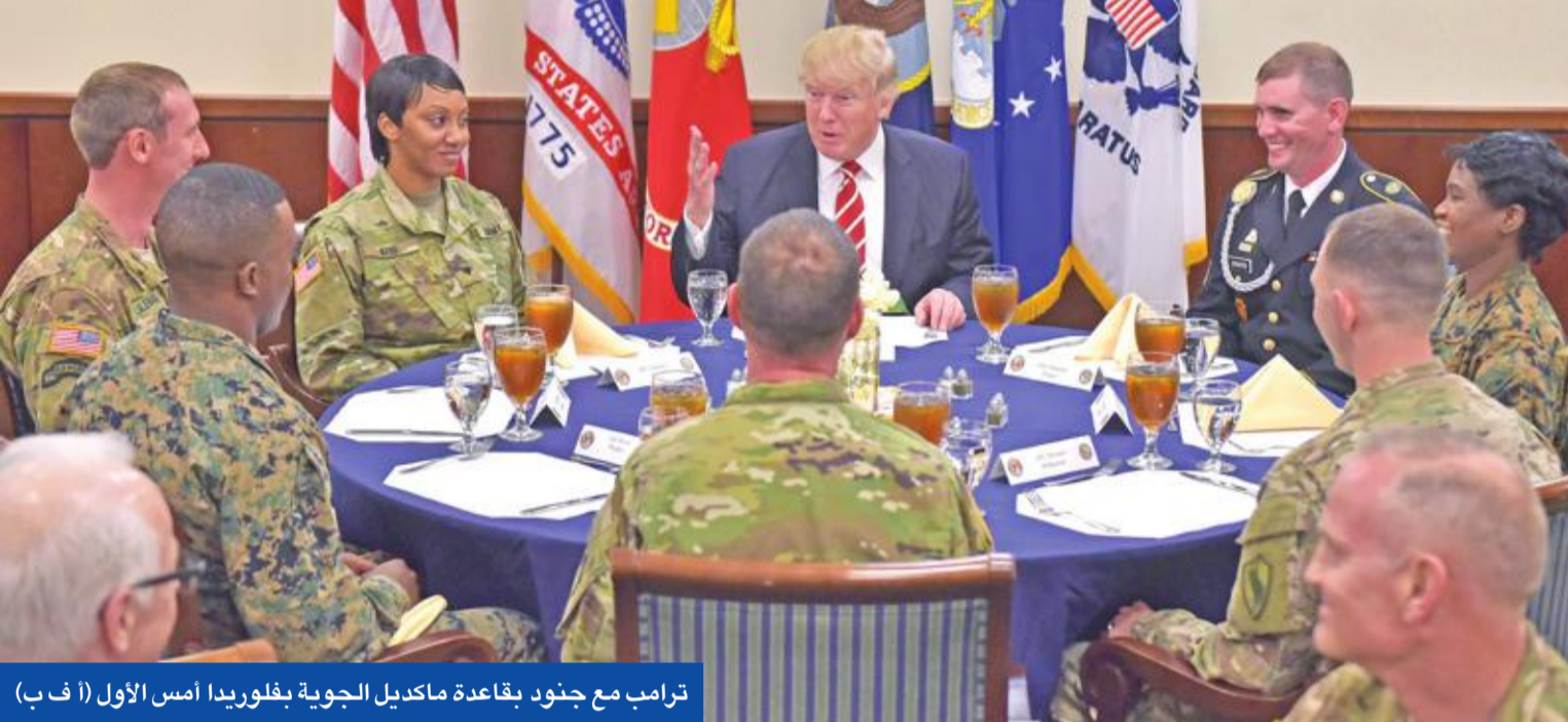
ترامب مع جنود بقاعدة ماكيل الجوية بفلوريدا أمس الأول

وأوضح تحقيق ذلك "نحن بحاجة لإبراج قوية للناس الذين يحجون بلادنا القوم لا الأشخاص الذين يريدون تدميرنا".