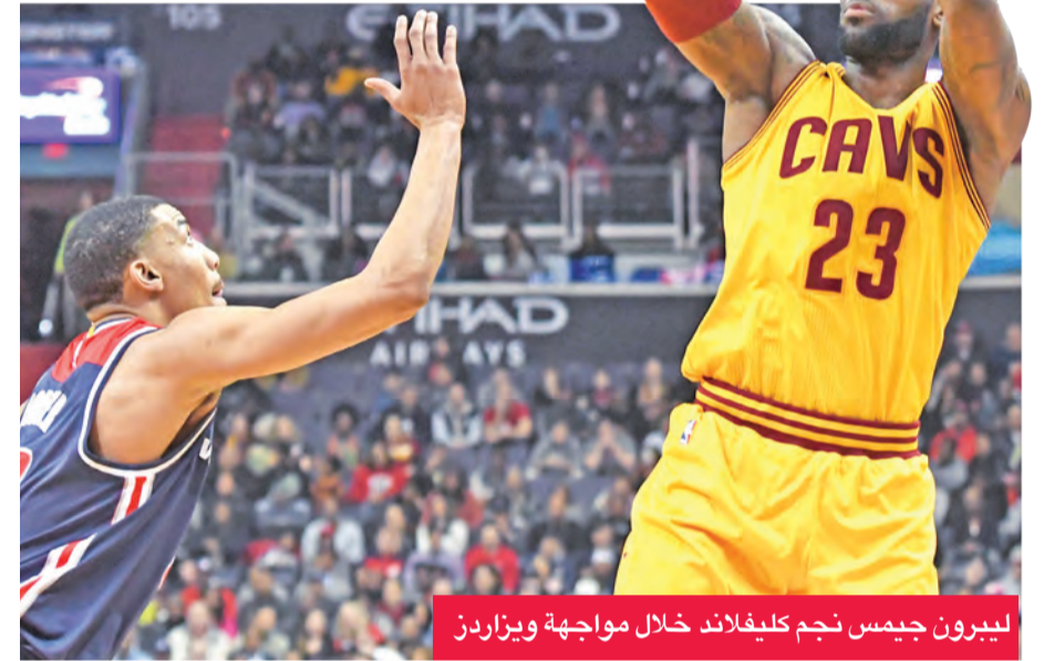
ليبرون جيمس نجم كليفلاند خلال مواجهة ويزاردز

من جانب آخر، لم تكن رحلة سان انطونيو سبيرز الى ممفيس موفقة وخسر امام غريزلز 74-89 على ملعب «فيديكس فوروم» وامام 16708 متفرجين.