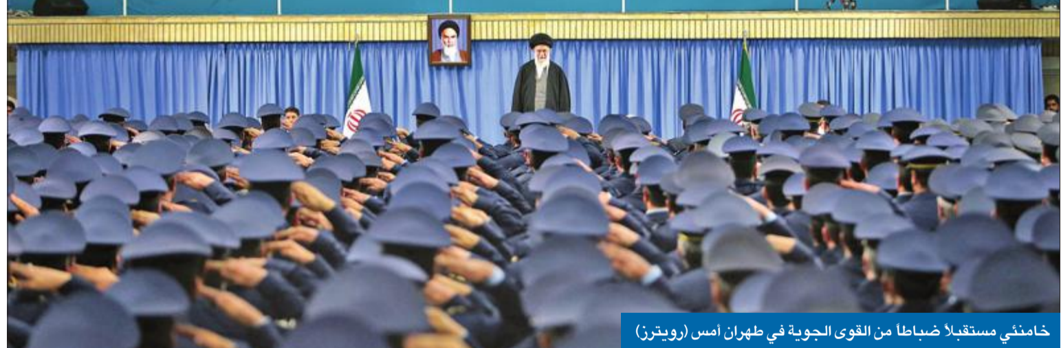
خامنئي مستقبلاً ضباطاً من القوى الجوية في طهران أمس

مع رسالة الأمير، قال ظريف في مقابلة مع صحيفة «إطلاعات» الإيرانية الرسمية نشرت أمس، إن بلاده مستعدة لـ «تفاعل حقيقي» مع ما ورد في الرسالة، التي أعرب عن أمه أن تعكس إرادة حقيقية من الطرف الخليجي.