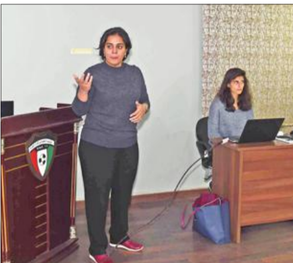
حيات خلال تقديمها لتاريخ اللعبة وتبدو المدربة الألمانية

والمحركات الوطنية من خلال سقل خبراتهن بالدورات بشكل مستمر سواء تلك التي تقام في الكويت أو خارجها.