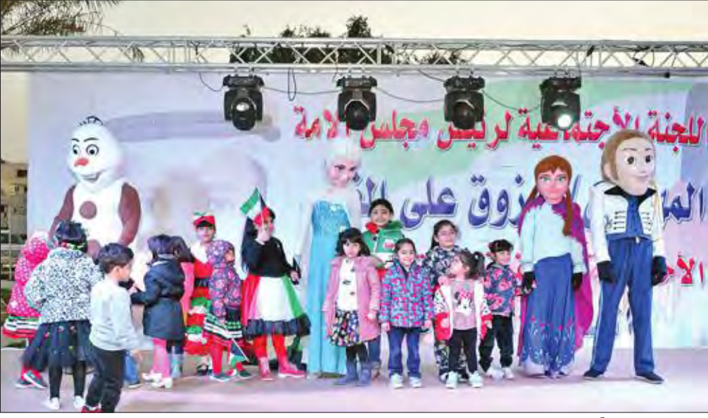
شخصيات كرتونية تشارك الأطفال فرحتهم بالعيد

أقامت اللجنة الاجتماعية لرئيس مجلس الأمة مرزوق الغانم يوماً مفتوحاً احتفالاً بالأعياد الوطنية للبلاد في حديقة ضاحية عبدالله السالم، بحضور رئيسة اللجنة دلال العازمي، وعضوات اللجنة وإبناء الكويت. وتخللت اليوم فعاليات عديدة تراوحت بين مسابقات للكتاب والصغار وتوزيع جوائز على الفائزين، وفقرات ترفيهية وغنائية، مع مشاركة من الشخصيات الكرتونية والبهلولان.