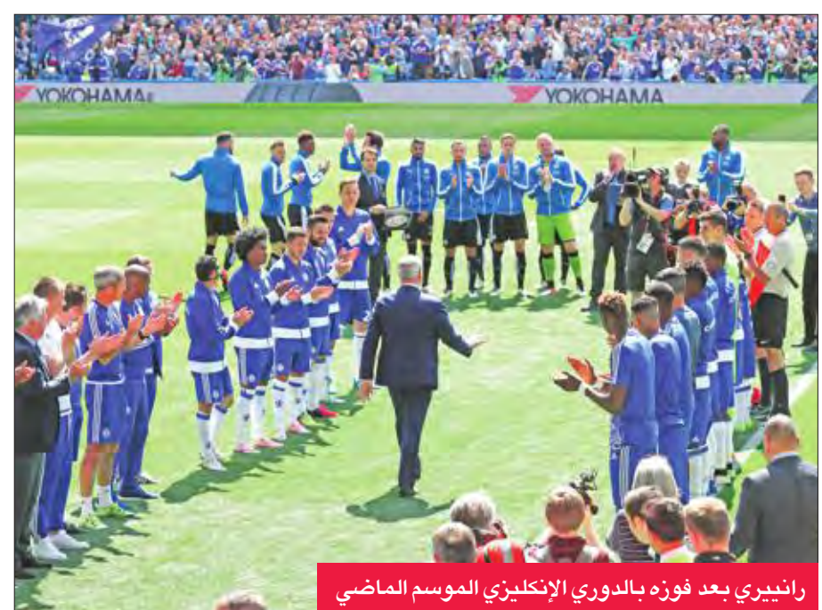
رانييري بعد فوزه بالدوري الإنكليزي الموسم الماضي

بعد الإيطالي روبرتو مانشيني الأقرب، بحسب دور المراهقات البريطانية، لخلافه مواطنه كلاوديو رانييري، في قيادة ليستر سيتي، حامل لقب البريمير ليغ، بعد إقالة الأخير أمس الأول بشكل مفاجئ لسوء النتائج. وذكرت دور مراهقات (سكاى بت) أن مانشيني هو المدرب الذي يشهد أكبر عدد من الإقبال لخلافة رانييري على دكة بلاك بول ستاديو. وسبق أن لعب المدرب البالغ من العمر 52 عاماً في صفوف ليستر (خاض خمس مباريات معه في يناير 2001) وكان عمره وقتها 36 عاماً، كما أنه لديه خبرة في العمل بالبريمير ليغ عندما قاد مانشستر سيتي للقب الدوري في موسم 2011-2012 وكأس الاتحاد في 2010-2011. ويأتي الإنكليزي نايفل بيرسون، مدرب ليستر سيتي السابق، في الترتيب الثاني خلف مانشيني، حيث كان قد أقبل من تدريب «العالم قبل تولي رانييري المسؤولية. ويعدّه باتي الهولنديان فرانك دي بوير وجوس هيدينك في الترتيب الثالث. وكان ليستر سيتي قد أعلن في الساعات الأخيرة من الخميس إقالة رانييري بعد 9 أشهر فقط من تنويعه التاريخي بلقب البريمير ليغ على حساب باقي أندية الدوري العريقة، وذلك للمرة الأولى في تاريخ النادي الذي يمتد لـ 133 عاماً. ورغم التألق في دوري الأبطال، والتأهل لثمن النهائي، حيث خسر ليستر ذهاباً على ملعب إشبيلية الإسباني بهدفين لواحد، فإن الفريق يحتل مركزاً متأخراً في الدوري المحلي، الترتيب السابع عشر، ويتبعد بنقطة عن منطقة الهبوط.