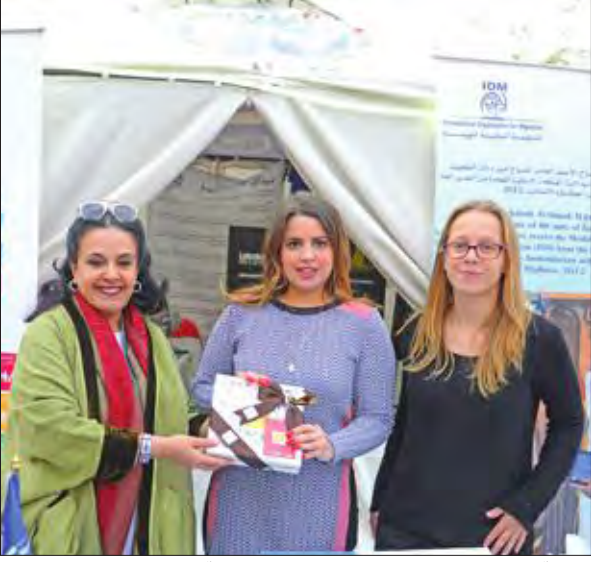
فاطمة الأمير تكرم إحدى المشاركات في الفعالية

اختتم مهرجان «شكراً لدول التحالف» فعاليات الاسبوع الاول للمهرجان، الذي نظمه مكتب الشهيد برعاية سمو أمير البلاد الشيخ صباح الأحمد، ومشاركة عدد من سفارات الدول، التي ساهمت في حرب التحرير، وتضمن عروضاً مسرحية ووصلات موسيقية وأغاني وطنية. وقالت الوكيل المساعد في الديوان الأميري والمديرة العامة لمكتب الشهيد فاطمة الأمير: «واصلنا فعاليات احتفالينا بمهرجان شكراً، وحقاً شكراً لكل الدول التحالف، التي ساهمت معنا في تحرير بلدنا الغالي، وطبعاً اليوم شكراً احنا نقولها لهم ومشاركتهم لنا حتى في الاحتفاليات الوطنية السنوية».