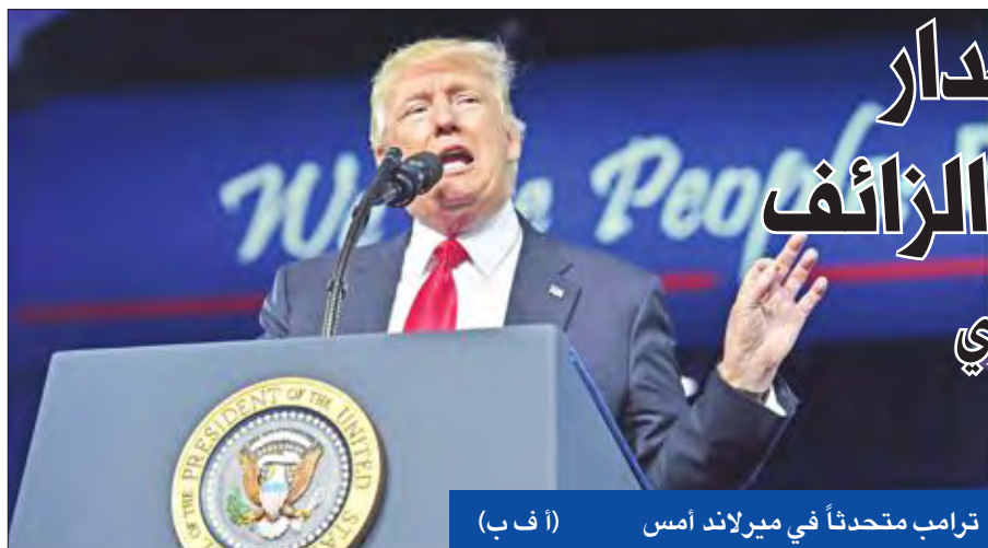
ترامب متحدّثاً في ميرلاند أمس (أ ب)

وكانت زعيمة الجبهة الوطنية تتحدث في باريس أمام العديد من الصحفيين وممثلي 42 دولة أجنبية، ضمنهم سقراء تايوان وكامبوديا وكوبا والصين وأميركيون، وفقاً للجهة. وتابعت لوبن التي تهاجم الاتحاد الأوروبي منذ زمن «علينا وضع حد لهذا الوحش البيروقراطي». وأكدت أن الاتحاد الأوروبي «يقزّم فرنسا، ويفصلها عن العالم، أرحب بولادة الشعوب الأوروبية ضد الاتحاد، من أجل أوروبا كقارة»، في إشارة إلى بريكس في يونيو 2016. وقالت لوبن: «سنبني أوروبا أخرى»، وتعددت في حال انتخابها بإصلاح المعاهدات الأوروبية، وأشراك فرنسا بقوة في بناء أوروبا الأمم الحرة.