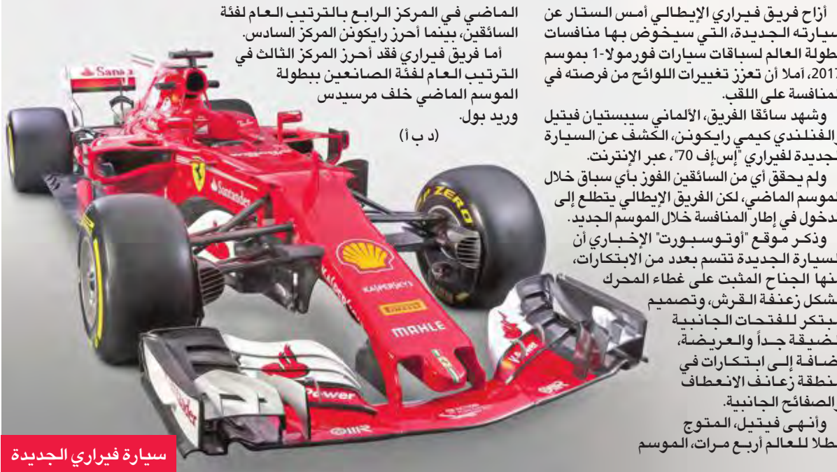
سيارة فيراري الجديدة

الماضي في المركز الرابع بالترتيب العام لفئة السائقين، بينما أحرز راكوتن المركز السادس. اما فريق فيراري فقد أحرز المركز الثالث في الترتيب العام لفئة الصانعين بطولة الموسم الماضي خلف مرسيدس وريد بول.