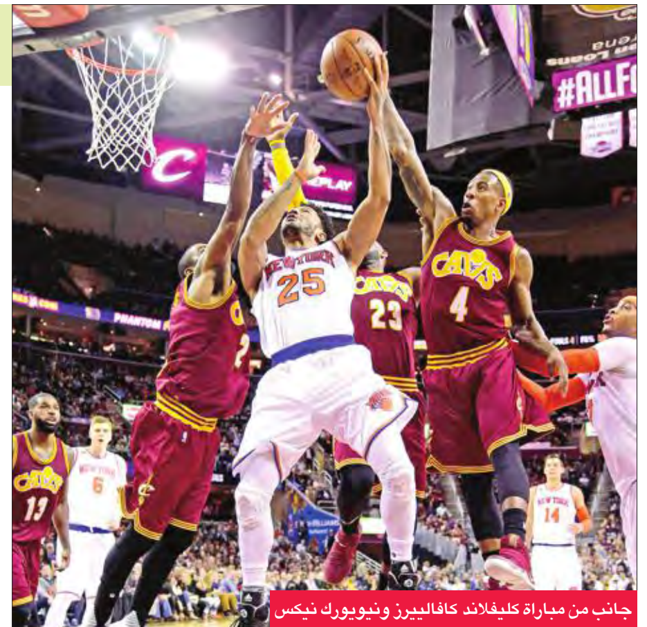
جانب من مباراة كليفلاند كافاليريز ونيويورك نيكس

وعلى ملعب «كويك لاونز أرينا»، عزز كليفلاند