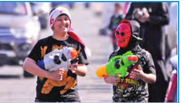
جانب من مشاعر الفرحة والسرور ابتهاجاً بالأعياد