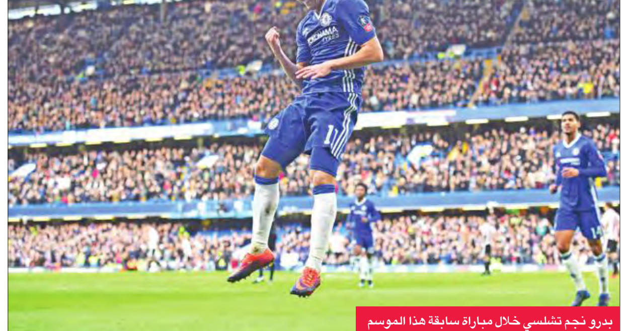
يدرو نجم تشلسي خلال مباراة سابقة هذا الموسم

يسعى تشلسي إلى العودة لسكة الانتصارات، وذلك عندما يستضيف سوانسي سيتي اليوم في المرحلة السادسة والعشرين من الدوري الإنكليزي لكرة القدم.