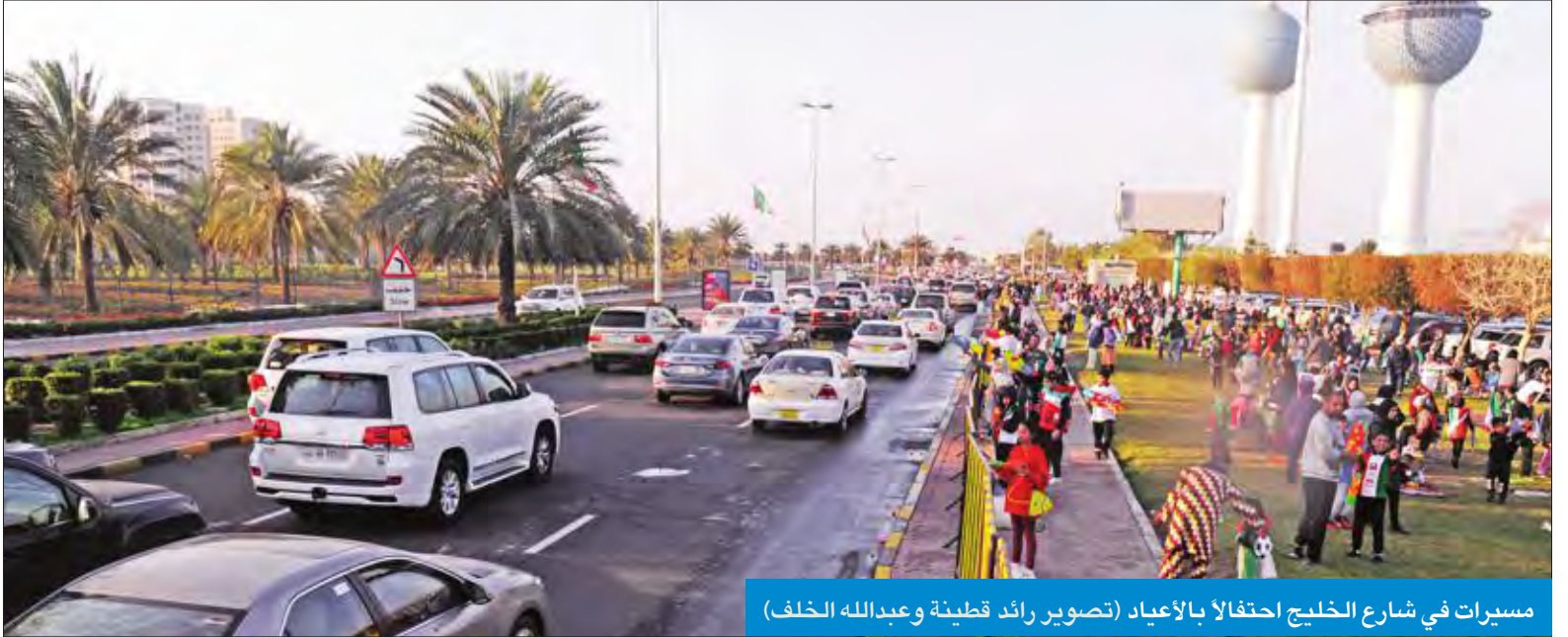
مسيرات في شارع الخليج احتفالاً بالأعياد