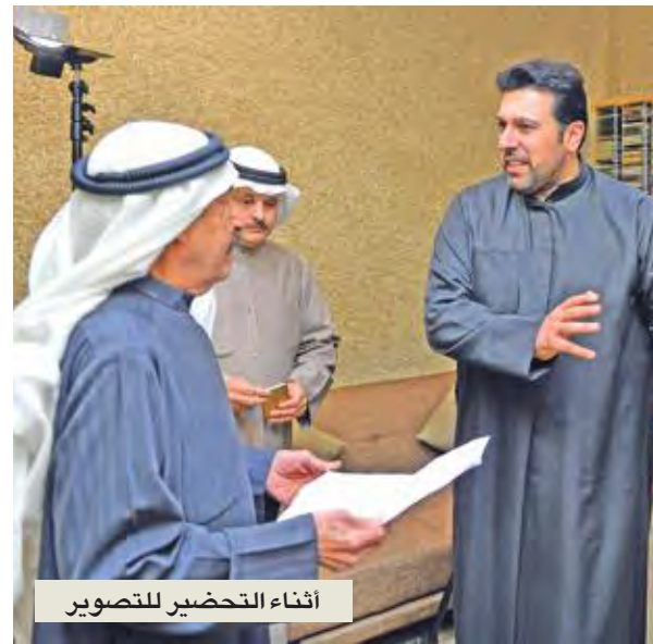
إثناء التحضير للتصوير

أشار المخرج علي حسن من جهته إلى سعادته بهذا التعامل مع المطرب الكبير عبدالكريم عبدالقادر، الذي يُعد أحد أبرز المطربين في منطقة الخليج العربي، وتشكل أغنيته جزءاً كبيراً من تراثنا الغنائي. وتابع: «أب المستمع الخليجي على الاستماع إلى عبدالقادر منذ أكثر من خمسة عقود، وراحت الحناجر تلهج باغانبه، فيما الخيال يستعيد ذكريات أعماله الجميلة بين فترة وأخرى. لذلك اعتبر هذا التعاون معه خطوة مهمة في مسوارتي الفني، وأمل تقديم أغنية مصورة