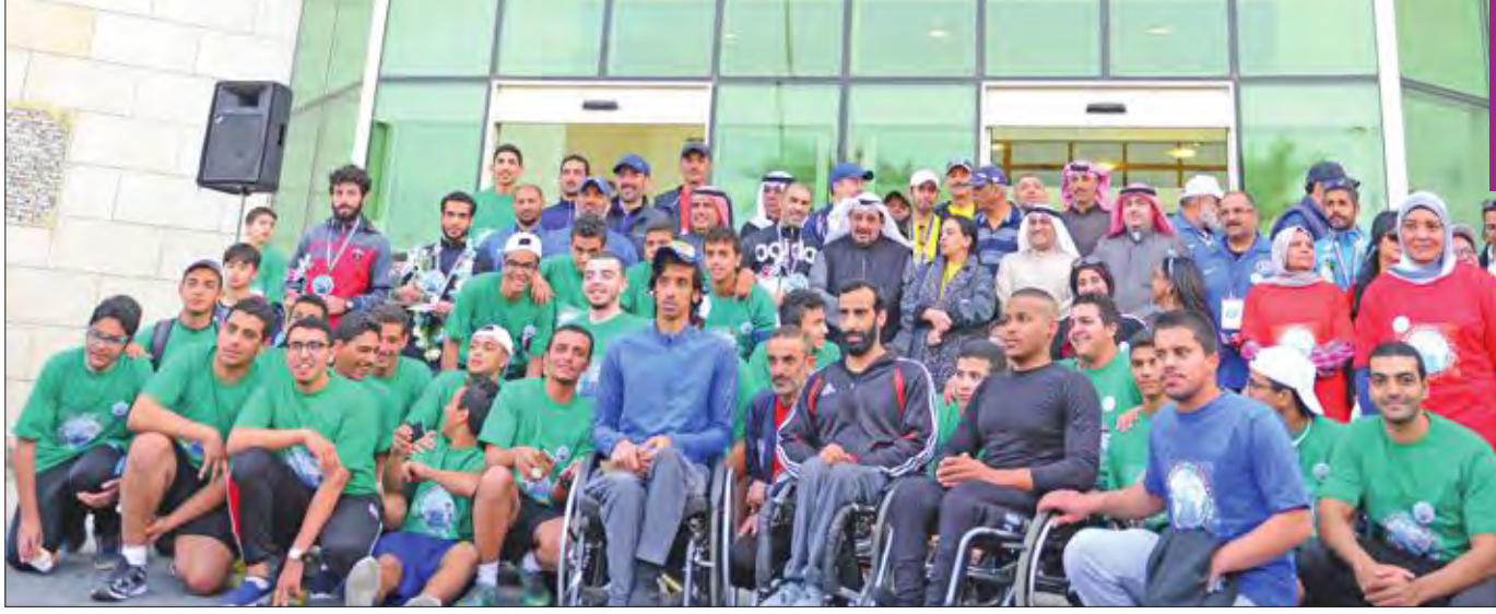
المشاركون في فعاليات الاسبوع الاول للمهرجان

اختتم مهرجان «شكراً لدول التحالف» فعاليات الاسبوع الاول للمهرجان، الذي نظمه مكتب الشهيد برعاية سمو أمير البلاد الشيخ صباح الأحمد، ومشاركة عدد من سفارات الدول، التي ساهمت في حرب التحرير، وتضمن عروضاً مسرحية ووصلات موسيقية وأغاني وطنية. وقالت الوكيل المساعد في الديوان الأميري والمديرة العامة لمكتب الشهيد فاطمة الأمير: «واصلنا فعاليات احتفالينا بمهرجان شكراً، وحقاً شكراً لكل الدول التحالف، التي ساهمت معنا في تحرير بلدنا الغالي، وطبعاً اليوم شكراً احنا نقولها لهم ومشاركتهم لنا حتى في الاحتفاليات الوطنية السنوية».