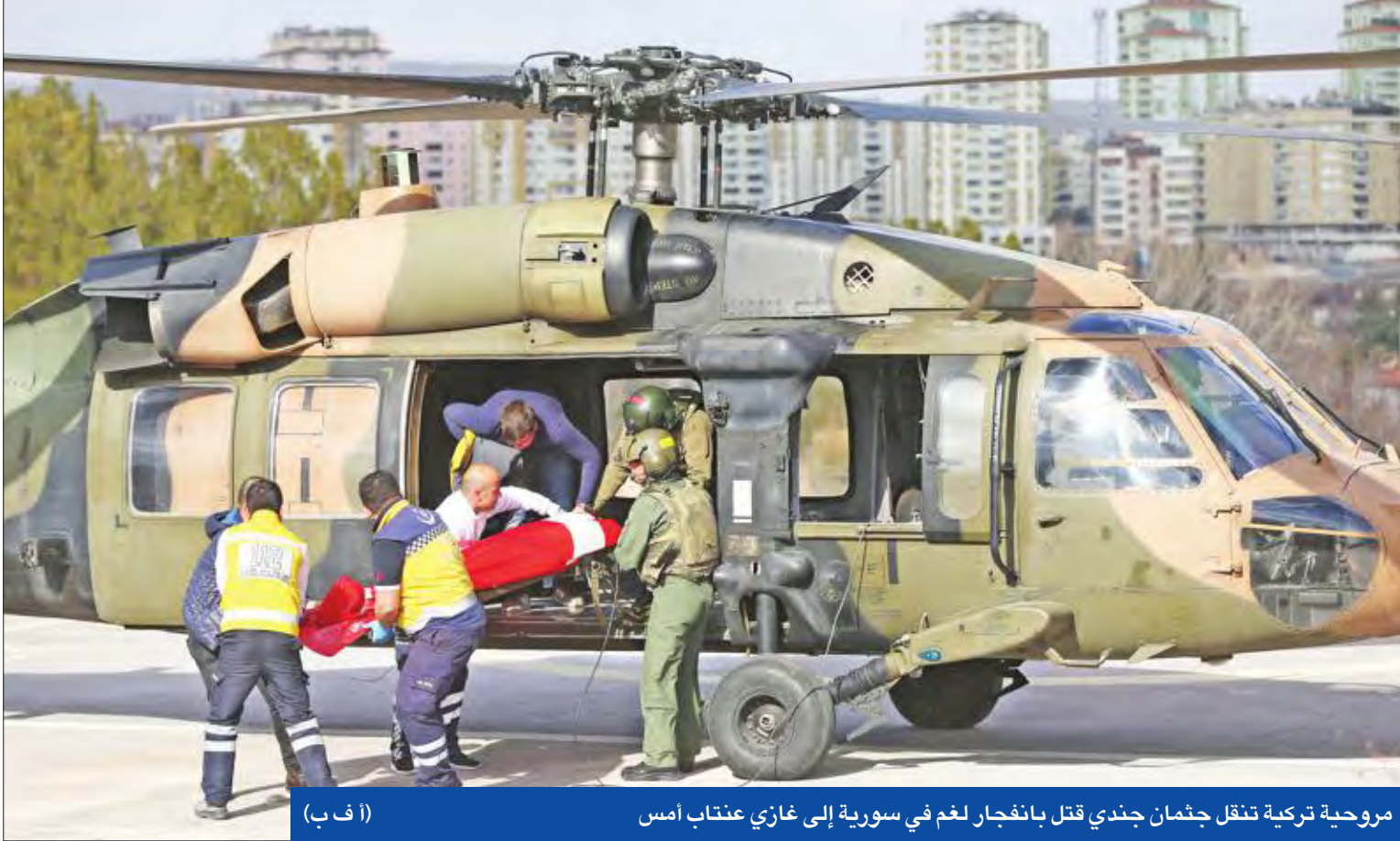
مروحية تركية تنقل جثمان جندي قتل بانفجار لغم في سورية إلى غازي عنتاب أمس

«جنيف 4» لتفاوض مباشر والنظام السوري يتسلم ورقة • عقوبات أميركية تستهدف «النصرة»