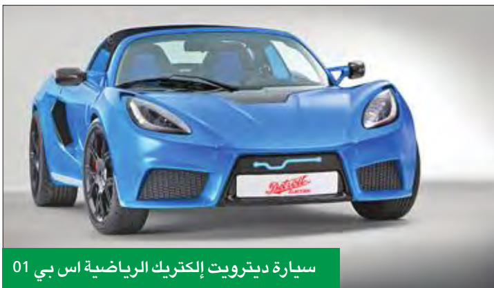
سيارة ديترويت الكريك الرياضية اس بي 01

ومجموعة تشاينا سمارتر انرجي هي شركة تتخذ من هونغ كونغ مقراً لها وتتمحور أنشطتها الرئيسية حول «أعمال الطاقة الشمسية والاستثمار والفراء»، وكانت حتى سنة 2015 تعمل أيضاً في تعدين الفاناديوم، وفي عام 2016 حققت عوائد بلغت 32600 مليون دولار أعلى بنحو 25 في المئة مقارنة مع 2015.