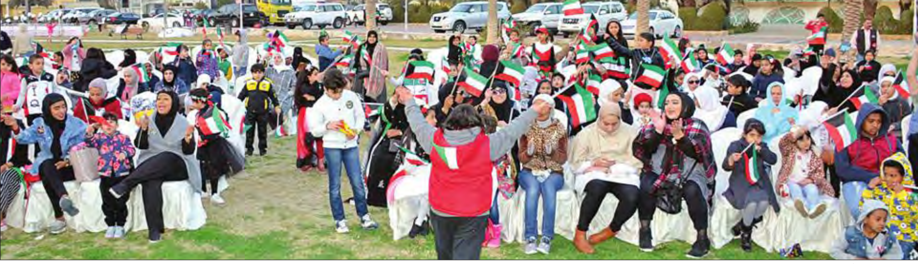
الحضور خلال مشاركتهم