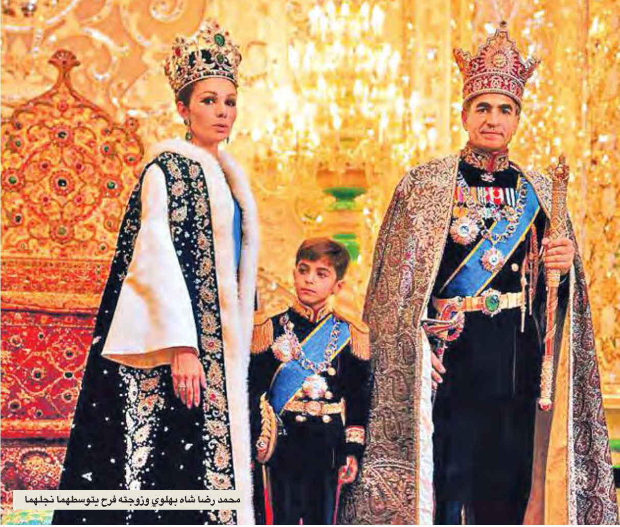
محمد رضا شاه بهلوي وزوجته فرح بنو سلطهما بنجلهما

كان يفترض أن تعرّض مجموعة فنية من متحف طهران للفنون المعاصرة في برلين خلال شهر ديسمبر، لكن رفض المسؤولين الإيرانيين إعطاء الإذن بخروج الأعمال الفنية من إيران. حاورت صحيفة «شبيغل» الإمبراطورة السابقة فرح بهلوي التي تولّت تجميع تلك الأعمال الفنية خلال السبعينيات. تعيش بهلوي في المنفى منذ 38 سنة.