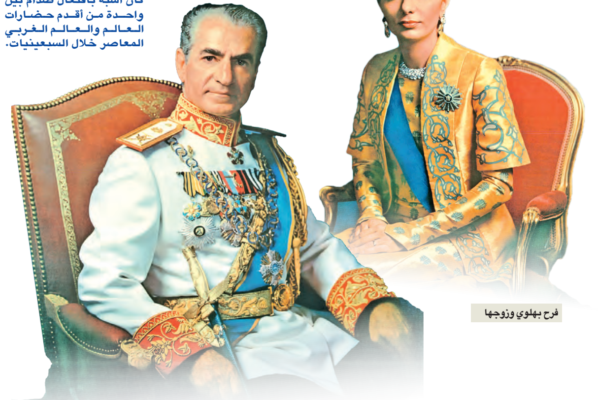
فرح بهلوي وزوجها

في بداية الستينيات، قصّدت معارض فنية كثيرة وقابلت فنانيين واشترت أعمالهم. كان أشراف إيران يبتاعون الفنون الإيرانية القديمة بدل أعمال الفنانين المعاصرين. قالت لي رشا: «حيناً لو نملك مكاناً دائماً لحفظ أعمالنا الفنية». هكذا خُطرت على بالي فكرة بناء