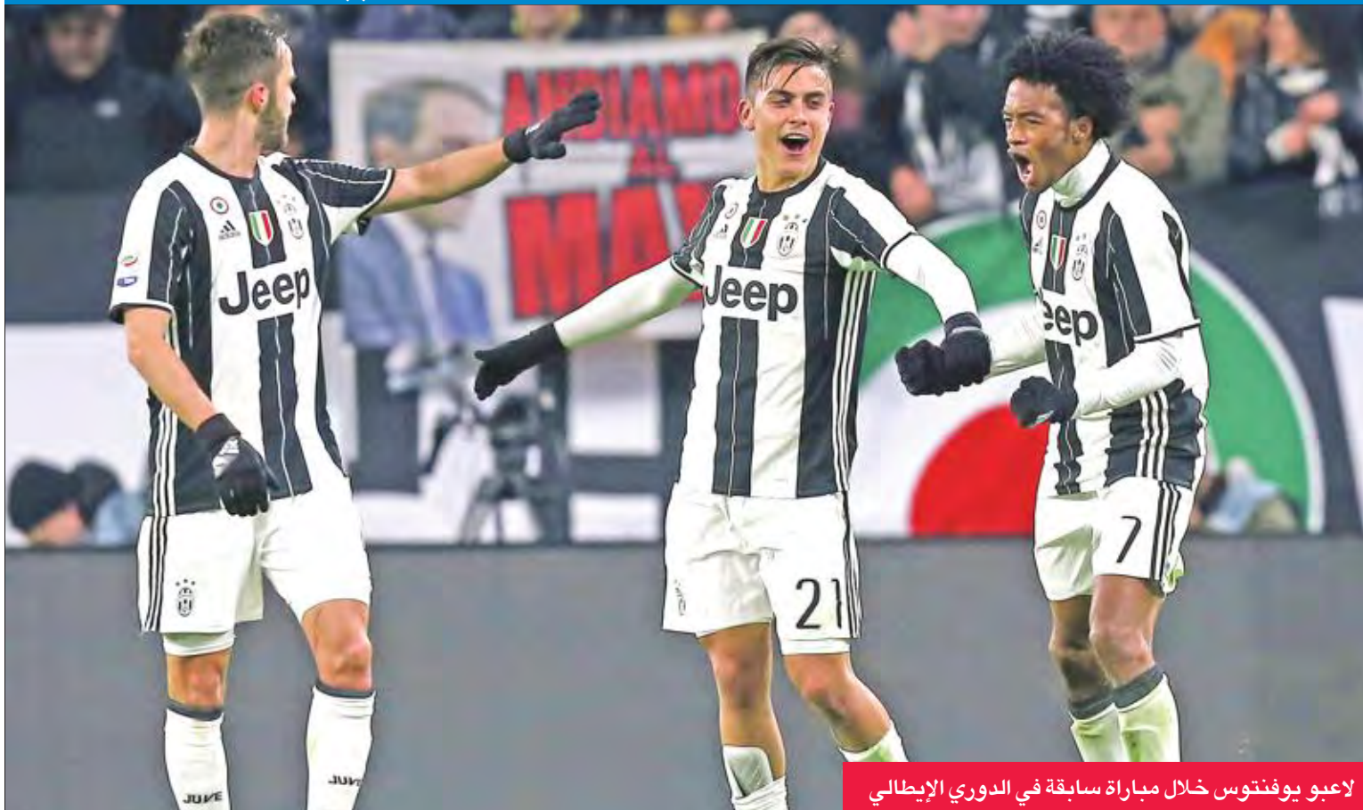
لاعبو يوفنتوس خلال مباراة سابقة في الدوري الإيطالي

تبدو الفرصة سانحة أمام يوفنتوس للاقترب من لقبه السادس على التوالي عندما يواجه ضيفه المتواضع إيمبولي اليوم، في المرحلة السادسة والعشرين من الدوري الإيطالي. ويدخل يوفنتوس مباراته مع إيمبولي القابع في المركز السابع عشر لكن بفارق 8 نقاط عن منطقة الخطر، بمعنويات مرتفعة بعد الفوز الثمين الذي حققه الأربعاء في معقل يورنو البرتغالي في ذهاب الدور ثمن النهائي من مسابقة دوري أبطال أوروبا. وقطع فريق المدرب ماسيميليانو اليغري أكثر من نصف الطريق نحو الدور ربع النهائي بعد فوزه خارج قواعد أفضل البدلين الكرواتي ماركو بياتسا والبرازيلي داني الفيش اللذين سجلا الهدفين في الدقيقة 72 و 74 بعد ثوان معدودة من مشاركتهما في المباراة. واستحق يوفنتوس الفوز خارج قواعد، لأنه كان الطرف الأفضل حتى قبل تفوقه العددي وحصل على العديد من الفرص دون أن ينجح في ترجمتها، قبل أن يلعب بياتسا والفيش دور المظليين بحسمهما اللقاء في غضون دقيقة.