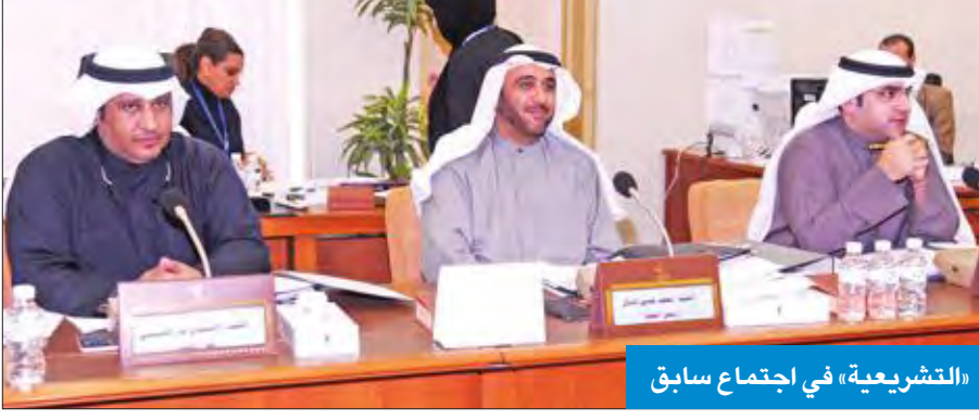
«التشريعية» في اجتماع سابق

تصادر بقوة القانون في إحدى الحالات: الأولى- متى صدر قرار بحفظ الشكوى من النيابة العامة المختصة بالتحقيق والتصرف والإدعاء في جميع الجرائم المنصوص عليها في قانون المطبوعات والنشر، والثانية- متى صدر في الشكوى حكم من المحكمة المختصة -إدارة الجنايات في المحكمة الكلية- لصالح المشكو في حقه، سواء برفض التظلم من قرار حفظ النيابة العامة أو حكم ببراءته مما هو منسوب إليه في الشكوى. أما في حالة إدانة المشكو في حقه فإن المحكمة تقضي بإلزام المشكو في حقه بأن يؤدي للشاكي مبلغ الكفالة المذكورة بحسبانها كلا أو جزءاً من التعويض الجابر للضرر، في دعوى الشاكي المدنية المترتبة على الشكوى. وتنفيذاً لهذا القانون فقد نصت المادة الثانية على أنه على رئيس مجلس الوزراء والوزراء -كل فيما يخصه- تنفيذ هذا القانون، ويعمل به من تاريخ نشره في الجريدة الرسمية.