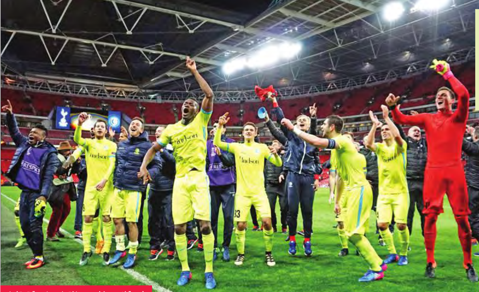
فرحة لاعبي غنت بعد انتهاء مواجهة توتنهام