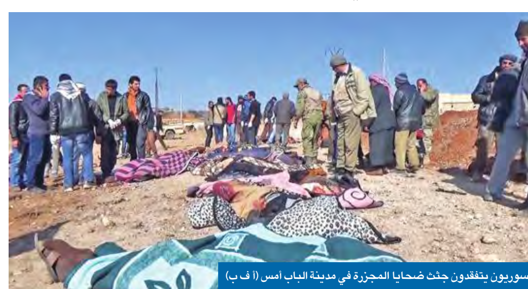
سوريون يتفقدون جثث ضحايا المجزرة في مدينة الباب أمس

عادة إعلان الجيش التركي وفصائل المعارضة السيطرة على آخر معاقله في محافظة حلب، نفذ تنظيم «داعش» هجوماً انتقامياً بمدينة الباب تسبب في وقوع مجزرة سقط فيها أكثر من 80 قتيلاً، بينهم جنديان تركيان.