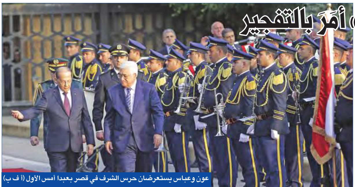
عون وعباس يستعرضان حرس الشرف في قصر يعقبا أمس الأول

شارك الزعيم الجديد لحركة «حماس» في قطاع غزة، يحيى السنوار، أمس، في افتتاح مسجد في جنوب القطاع، في أول ظهور علني له بعد أن تم انتخابه رئيساً للمكتب السياسي للحركة خلفاً لإسماعيل هنية. وأشارت دعوة وزعتها «حماس» لتغطية افتتاح المسجد إلى أن نائب رئيس الحركة خليل الحية سيلقي خطبة الجمعة خلال الافتتاح، وأن هنية سيلقي كلمة، من دون أن تشير إلى حضور السنوار.