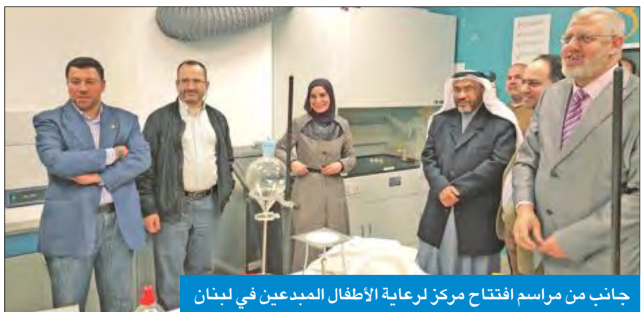
جانب من مراسم افتتاح مركز لرعاية الأطفال المبدعين في لبنان

افتتح مركز تخصص في بناء قدرات الاطفال وتنمية مهاراتهم وإبداعاتهم في بلدة جندرا ب قضاء الشوف جنوب لبنان مساء أمس الأول بتمويل من بيت الزكاة الكويتي.