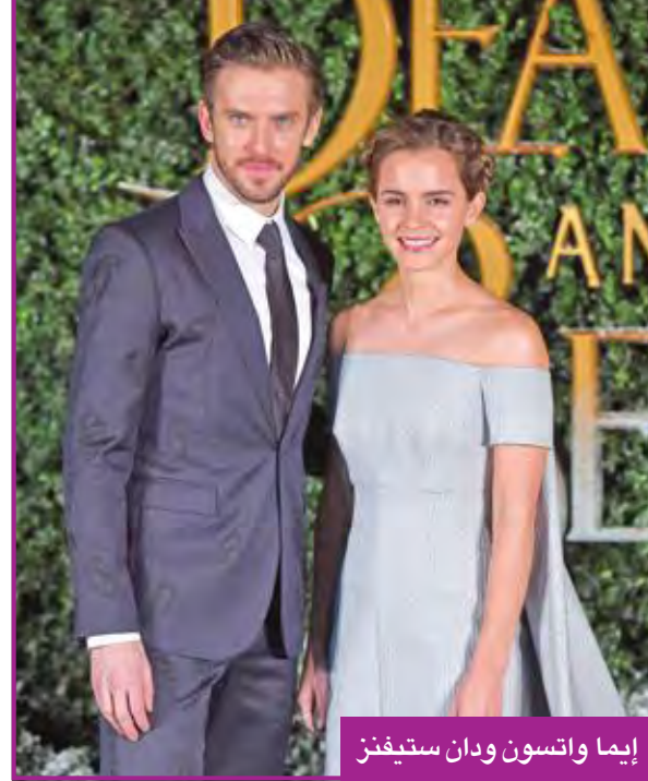
إيما واتسون ودان ستيفنز

حضرت النجمة السينمائية الإنكليزية إيما واتسون افتتاح العرض الأول لفيلمها الجديد «الجميلة والوحش» في لندن، وهو من إنتاج شركة ديزني، وكان معها نجوم العمل دان ستيفنز، ولوك إيفانز، وجوش غاد، وإيما تومسون، وإيوان ماكغريغور، وإيان ماكلين، والمخرج الأمريكي بيل كوندون. ويعد الفيلم هو الثاني المقتبس عن رواية «الجميلة والوحش» بعد فيلم الرسوم المتحركة الذي أنتجته «والت ديزني» عام 1991، وتجسد واتسون في هذا العمل شخصية «الحسنة»، ويؤدي ستيفنز دور «الوحش». أما موعد طرح الفيلم رسمياً بدور العرض السينمائية فس يكون في 17 مارس المقبل. يذكر أن هذا الفيلم يعتبر تكملة لسلسلة الأفلام التي حولتها من أفلام كرتونية شركة ديزني، وذلك بعد أفلام مثل «سندريلا» و«ماليغينست» و«كتاب الغابة» و«دومبو».