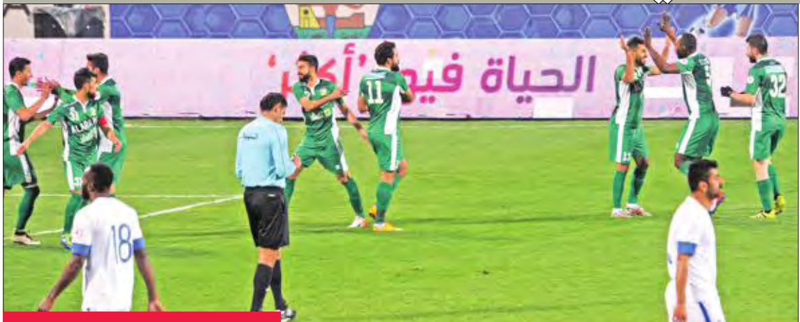
فرحة لاعبي العربي بعد تسجيل هدف

وأكد مصادر عربية مطلعة داخل النادي العربي أن هناك تراجعاً أو تردداً لدى عدد كبير من أعضاء مجلس إدارة الأخضر في تنفيذ قرار الانسحاب، الذي تمت الموافقة عليه في اجتماع مجلس الإدارة قبل عدة أشهر. من جانب آخر، قال المنسق الإعلامي