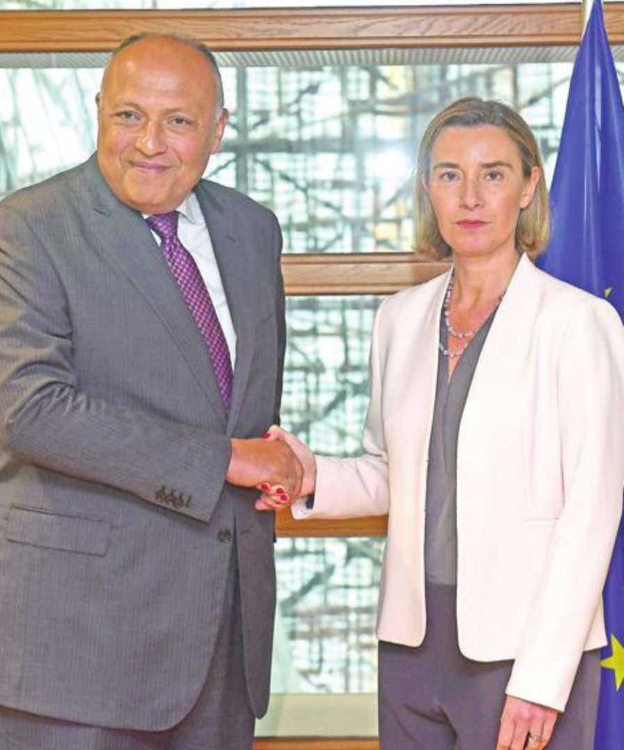
وزير الخارجية المصري سامح شكري مصافحاً مسؤولة السياسة الخارجية بالاتحاد الأوروبي فيدريكا موبيرغي في بروكسل أمس (أ ف ب)

قالت وزارة التموين المصرية، أمس، إن حصة الفرد كما هي دون تغيير 150 رغيفاً شهرياً، وأنه لا توجد خطة لدى الوزارة للاقتراب من حقوق المستفيدين من الدعم، كما يدعي البعض، نافية صحة الأخبار بشأن خفض حصة الخبز المدعم للفرد من 5 إلى 3 أرغفة يومياً. وصرح وزير التموين على المصيلحي، بأنه يعمل على استمرار العمل في منظومة الخبز الجديدة، وعدم حدوث أي خلل بها مع استمرار حصول المواطنين على الأرغفة بشكل طبيعي بسهولة ويسر، وفي أي وقت طوال اليوم.