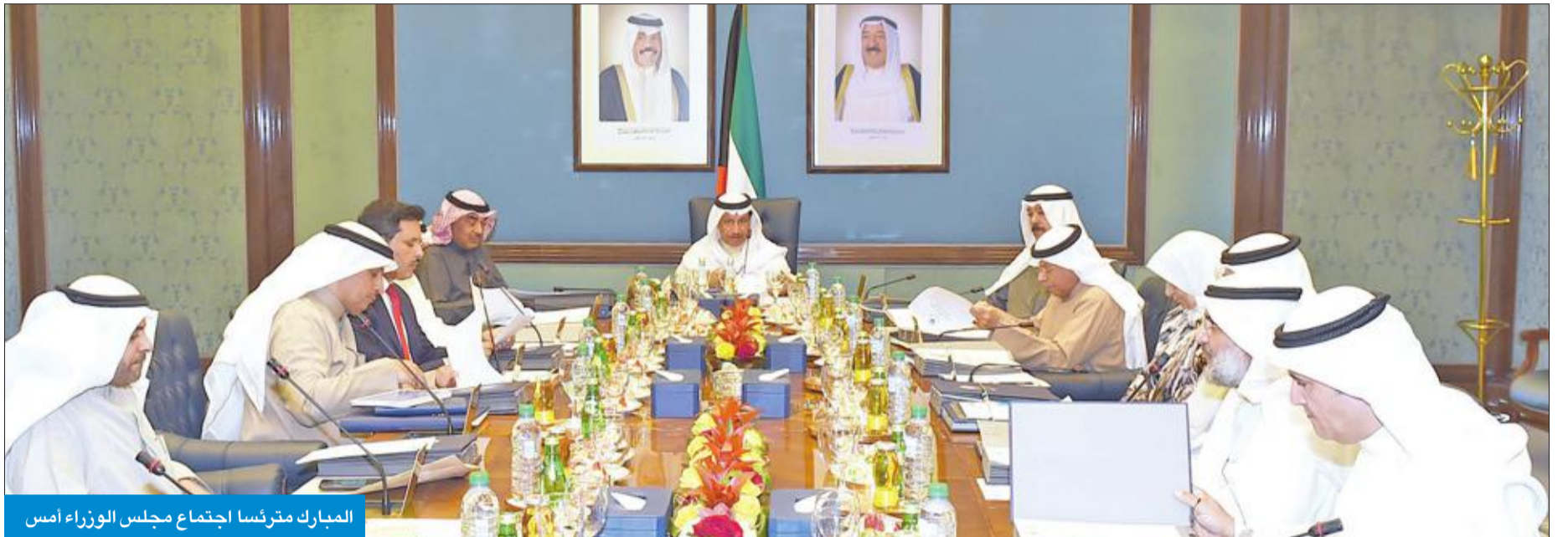
المبارك مترنسا اجتماع مجلس الوزراء أمس

في ضوء التقارير المتعلقة بمجمل التطورات الراهنة في الساحة السياسية على الصعيدين العربي والدولي.