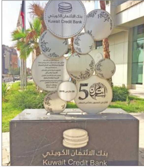
مقر بنحو 20 الف دينار (ما يعادل 65 الف دولار) وثلاثة قرص للترميم بمبلغ قدره 28 الفاً (ما يعادل 91 ألف دولار) ومصرف بـ 57 الفاً (ما يعادل 186 ألف دولار).

كشفت بنك الائتمان، في إحصائية متخصصة صدرت عنه أمس، أن قروض فبراير الماضي تضمنت 22 قرصاً لبناء قسائم خاصة بمبلغ قدره 1.4 مليون دينار (ما يعادل 4.5 ملايين دولار)، ومنصرف بـ 1.7 مليون دينار (ما يعادل 5.5 ملايين دولار)، و270 قرصاً لبناء قسائم حكومية بمبلغ قدره 18.6 مليون دينار (ما يعادل 60.9 مليون دولار) ومنصرف بـ 15.2 مليون دينار (ما يعادل 49 مليون دولار).