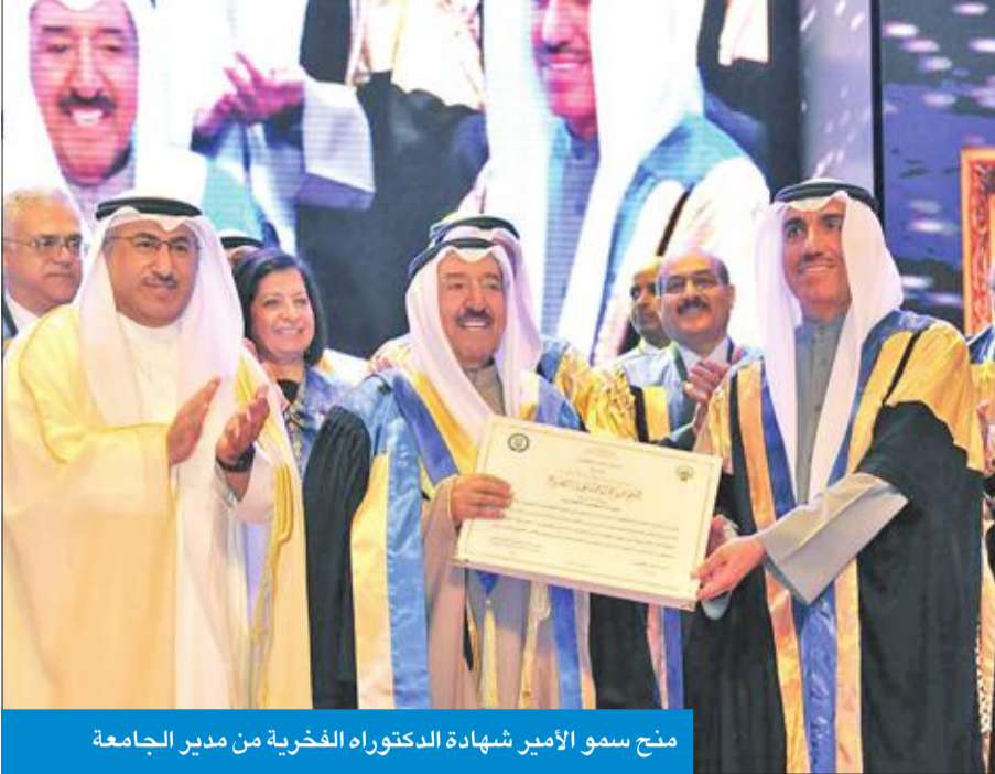
منح سمو الأمير شهادة الدكتوراه الفخرية من مدير الجامعة