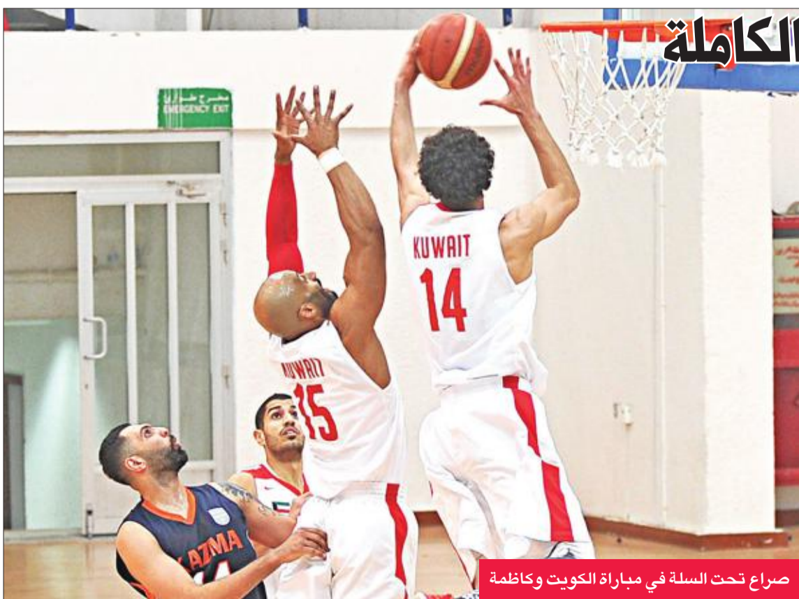
صراع تحت السلة في مباراة الكويت وكاظمة