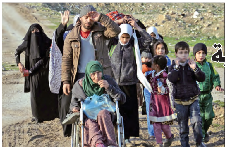
نازحون من الموصل يصلون إلى منطقة حمام العليل أمس

إيران تجبر سفينة أميركية على تغيير مسارها في هرمز