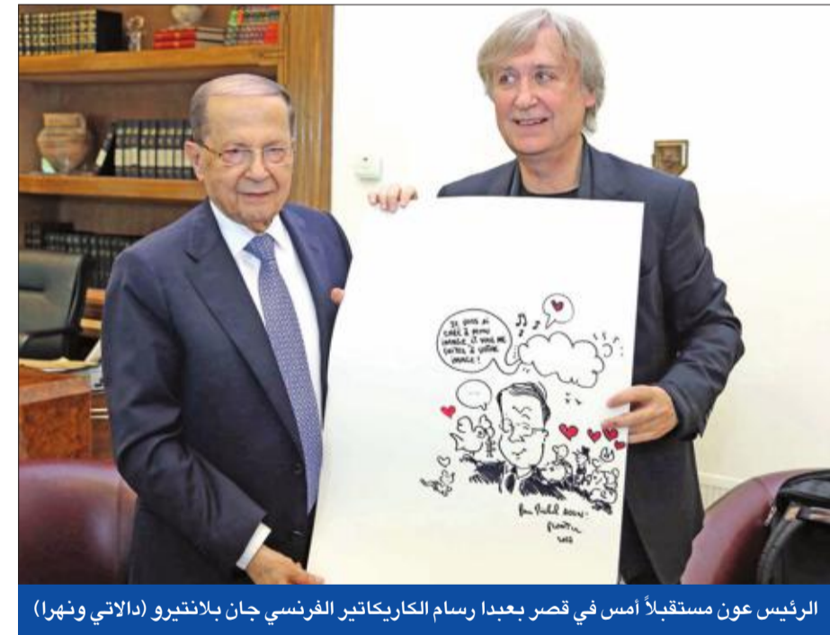
الرئيس عون مستقبلاً أمس في قصر بعبدا رسام الكاريكاتير الفرنسي جان بلانتيرو

وقال: «الإيجابية التي حصلت أننا لم نعد إلى الصفر، بالتالي المواد المتعلقة أساسية لكنها قليلة». وأضاف: «إذا توفرت الإرادة والمعليات المادية فلا عوائق أمام إقرار السلسلة».