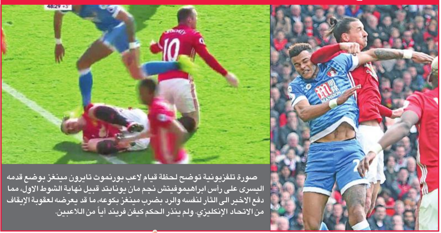
صورة تلفزيونية توضح لحظة قيام لاعب بورنموث تايرون مينغز بوضع قدمه اليسرى على رأس ابراهيموفيتش نجم مان يونايتد قبيل نهاية الشوط الاول، مما دفع الإخبر إلى التآثر بنفسه والرذ بضرب مينغز بكوعه، ما قد يعرضه لعقوبة الإيقاف من الاتحاد الإنكليزي، ولم ينذر الحكم كيفين فريند أياً من اللاعبين.