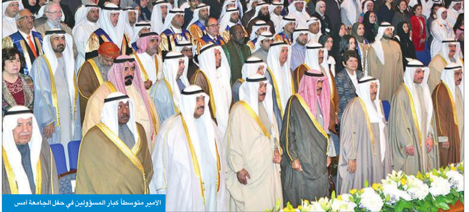
الأمير متوسماً كبار المسؤولين في حفل الجامعة أمس

تفاهم على المادة 44 من قانون الجامعات الحكومية أكد وزير التربية وزير التعليم العالي د محمد الفارس أن هناك تفاهماً مبدئياً بين الحكومة واللجنة التعليمية بمجلس الأمة فيما يتعلق بالمادة 44 من قانون الجامعات الحكومية الخاص بمدينة صباح السالم الجامعية، وما زالت المشاورات تدور حول مصير جامعة الشدادية، هل تصبح لجامعة الكويت أم تكون جامعة منفصلة؟ وأوضح أن هناك أكثر من توجه في هذا الجانب، فمن رأي اللجنة التعليمية بمجلس الأمة أن تصبح مدينة صباح السالم الجامعية مكملة ومنتمية لجامعة الكويت، ويتم انتقال جامعة الكويت لها مستقبلاً، ويتم إعادة استغلال المواقع الحالية لجامعة أخرى، لافتاً إلى وجود سيناريو آخر، وهو أن تكون مدينة صباح السالم الجامعية وبعض مواقع الجامعة الحالية مكملة لجامعة الكويت، موضحاً أن جميع تلك السيناريوهات قيد الدراسة من جميع النواحي المالية والعملية والإدارية. وحول تعيين نواب المدير العام للهيئة العامة للتعليم التطبيقي والتدريب قال الفارس: بدأت بجمع البيانات فيما يتعلق بالسيرة الذاتية للمرشحين لتلك المناصب، وسوف يتم فيها خلال الفترة القادمة، وسيتم اختيار 3 أسماء لكل منصب ويتم رفعها إلى القيادة السياسية.