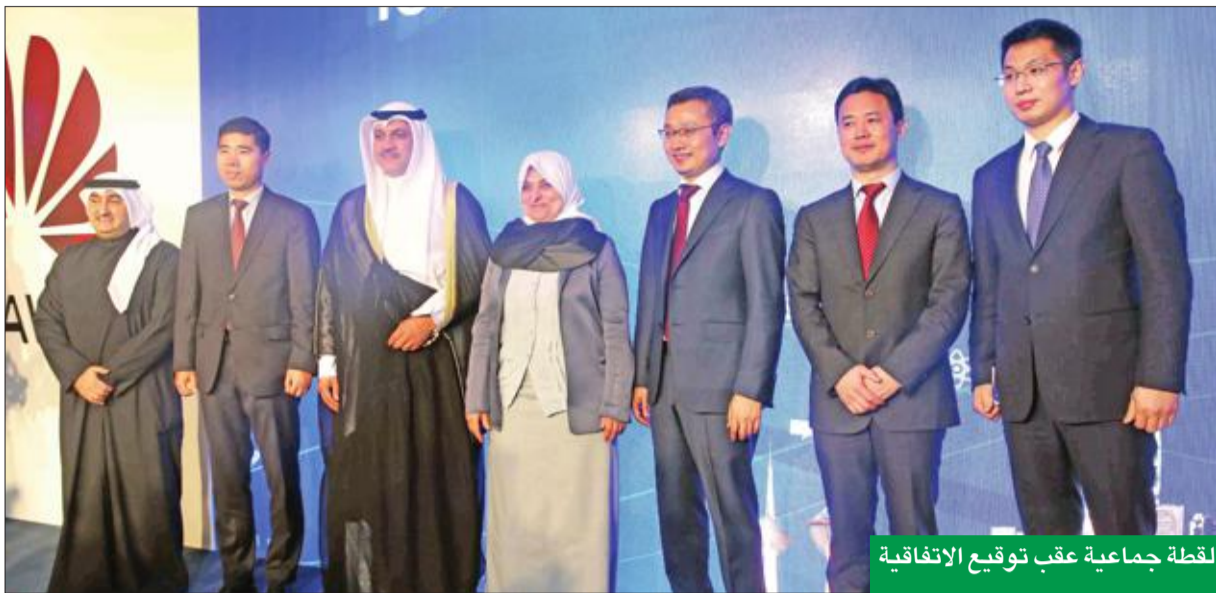
لقطة جماعية عقب توقيع الاتفاقية

وأشار إلى أن الهيئة وضعت الخطة الرئيسية في مجال الاتصالات ونظم المعلومات للدولة، التي تهدف إلى تحويل الكويت إلى «كويت ذكية»، من خلال الاعتماد على عدة ركائز أساسية أهمها تطوير البنية التحتية للاتصالات، وتعزيز دور الاتصالات ونظم المعلومات في الاقتصاد الوطني من خلال رفع نسبة مساهمتها في الناتج المحلي. ولفت إلى تطوير وتأهيل العمالة الوطنية في مجال الاتصالات ونظم المعلومات عبر توقيع مجموعة من الاتفاقيات مع شركات معلومة عالمية لتأهيل الشباب للعمل في قطاعي الاتصالات وتكنولوجيا المعلومات وصولاً إلى تحقيق هدفنا في توفير وظائف تخدم هذه القطاعات. وأشار بإطلاق شركة «هواوي» لتكنولوجيا كويت» مركز الكويت