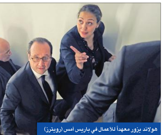
هولاند يزور معهداً للأعمال في باريس أمس

بموقفه إثر الحشود التي عبرت عن دعمه له، قائل إن عددهم 200 ألف، في حين قدرت الشرطة عددهم بـ40 ألفاً. ومع إقراره «بجانب من المسؤولية» في «المعانة» التي يمر بها، فإن فيون (63 عاماً) لا يزال مقتنعاً بأن مشروعه «هو الوحيد الذي يمكن أن ينجح نهوضاً وطنياً».