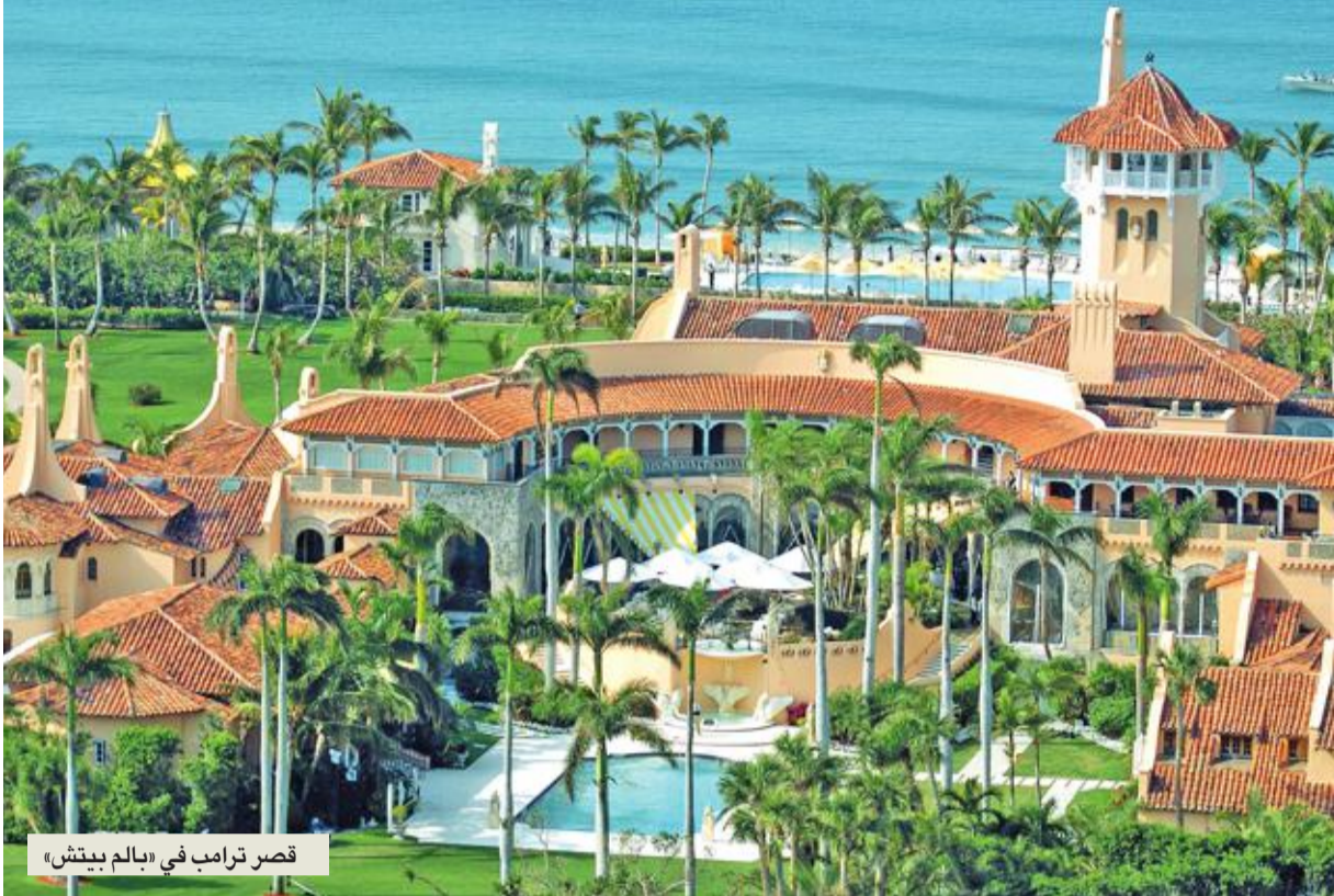
قصر ترامب في «بالم بيتش»

مقدمة ومنجحة سابقة في كاليفورنيا وأنشأت حركة داعمة لترامب وتظن أن فرص مارين لوبان في فرنسا جيدة.