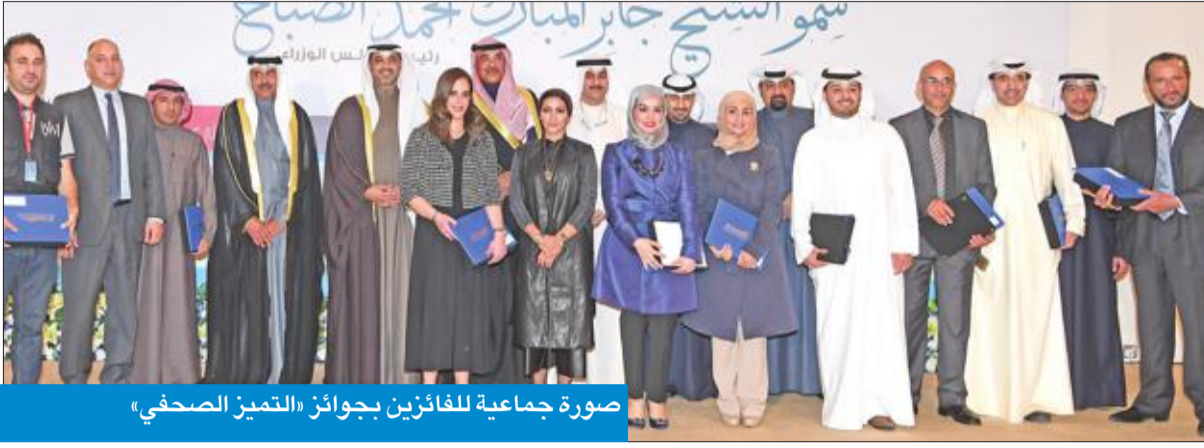
صورة جماعية للفائزين بجوائز «التميز الصحفي»

المركز الأول في تحقيق «الشباب» والثاني في «الصورة» والثالث في «تقرير» فئة العموم