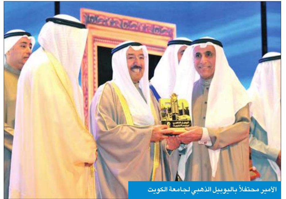
الأمير محتفلاً باليوبيل الذهبي لجامعة الكويت