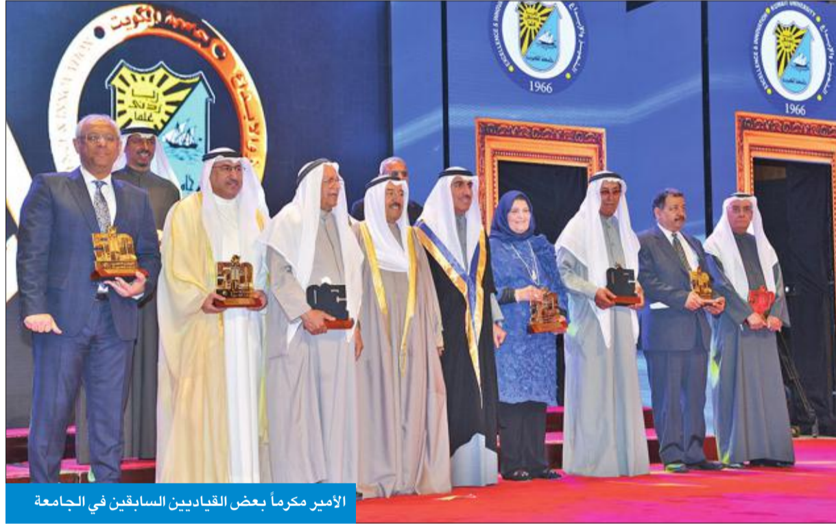
الأمير مكرماً بعض القديين السابقين في الجامعة

تفاهم على المادة 44 من قانون الجامعات الحكومية أكد وزير التربية وزير التعليم العالي د محمد الفارس أن هناك تفاهماً مبدئياً بين الحكومة واللجنة التعليمية بمجلس الأمة فيما يتعلق بالمادة 44 من قانون الجامعات الحكومية الخاص بمدينة صباح السالم الجامعية، وما زالت المشاورات تدور حول مصير جامعة الشدادية، هل تصبح لجامعة الكويت أم تكون جامعة منفصلة؟ وأوضح أن هناك أكثر من توجه في هذا الجانب، فمن رأي اللجنة التعليمية بمجلس الأمة أن تصبح مدينة صباح السالم الجامعية مكملة ومنتمية لجامعة الكويت، ويتم انتقال جامعة الكويت لها مستقبلاً، ويتم إعادة استغلال المواقع الحالية لجامعة أخرى، لافتاً إلى وجود سيناريو آخر، وهو أن تكون مدينة صباح السالم الجامعية وبعض مواقع الجامعة الحالية مكملة لجامعة الكويت، موضحاً أن جميع تلك السيناريوهات قيد الدراسة من جميع النواحي المالية والعملية والإدارية. وحول تعيين نواب المدير العام للهيئة العامة للتعليم التطبيقي والتدريب قال الفارس: بدأت بجمع البيانات فيما يتعلق بالسيرة الذاتية للمرشحين لتلك المناصب، وسوف يتم فيها خلال الفترة القادمة، وسيتم اختيار 3 أسماء لكل منصب ويتم رفعها إلى القيادة السياسية.