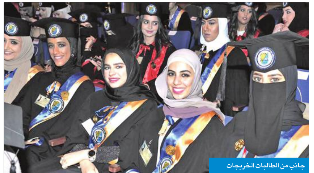
جانب من الطالبات الخريجات

لقطات من الحفل • تشرفت جامعة الكويت بمنح سموه شهادة الدكتوراه الفخرية، تقديراً لدوره البارز عبر مسيرته على مستوى دولة الكويت وعلى المستوى الإقليمي والإسلامي والعالمية. • لفقة أبوية من سمو الأمير حرصه على تهنئة جميع الطلبة بمناسبة تفوقهم. • عرض فيلم بعنوان «مسيرة جامعة الكويت» • تكريم جيل الرواد الأوائل في جامعة الكويت.