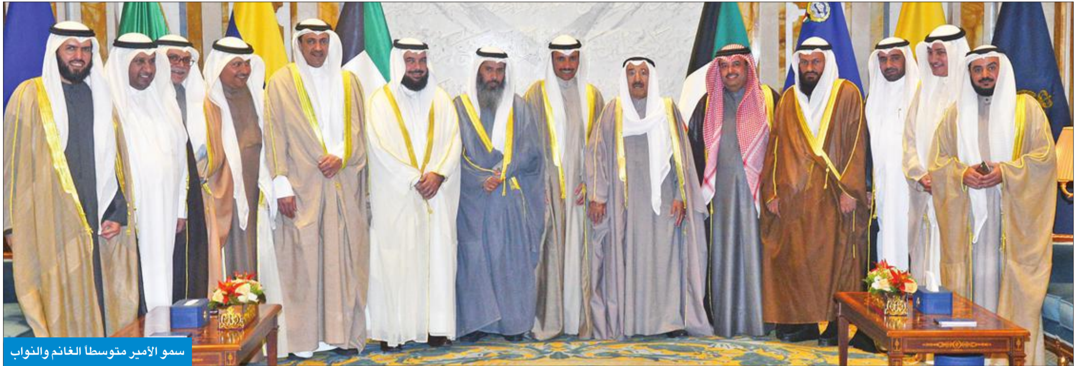
سمو الأمير متوسلا الغانم والنواب

الأمير يفوض إلى الغانم والمبارك متابعة الملف وتقديم تصور كامل عنه