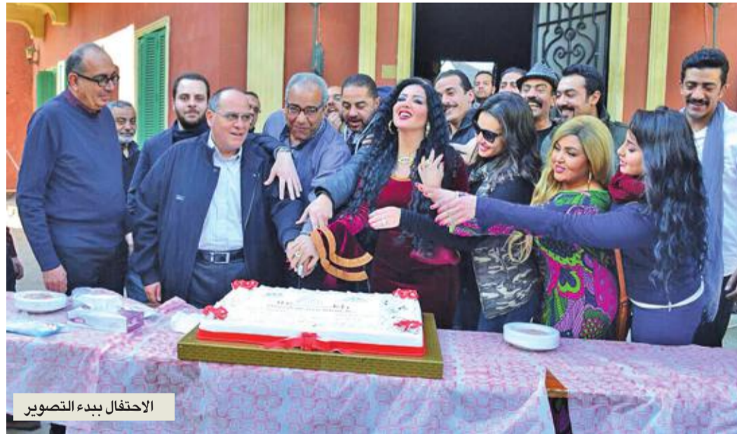
الاحتفال ببدء التصوير