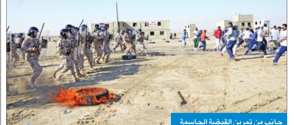
جانب من تمرين القبضة الحاسمة