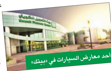
أحد معارض السيارات في «بيتك»

و«السندس» وهي مجموعة الخدمات الحصرية الخاصة بالعملاء، ويمكن للعملاء من الشريحتين الاستفادة من العرض عبر زيارة معارض «بيتك» في الري والشويخ والضجيج والأحمدي، وسيتمتع العملاء، إضافة إلى مزايا العرض الخاص على برنامج التاجر، بخدمات الصيانة المجانية وتأمين ذهبي شامل وخدمة الطرق 24/7 وسيارة بدلة ويحرص «بيتك» على الاستمرار في مكافأة عملائه، وتلبية متطلباتهم نحو حياة أفضل، وفي الوقت ذاته تعزيز أهداف «بيتك» الرامية إلى تنشيط حركة الاقتصاد المحلي، من خلال زيادة مبيعات الوكلاء والتجار.