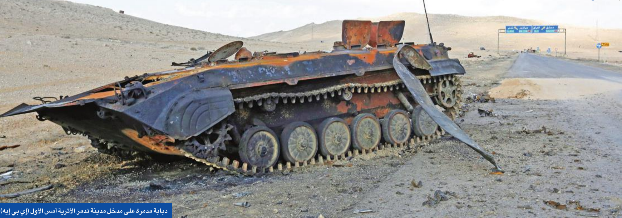
دبابة مدمرة على مدخل مدينة تدمر الأثرية أمس الأول