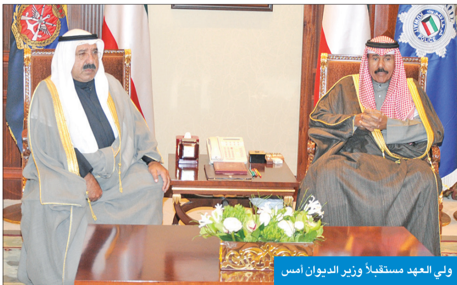
ولي العهد مستقبلاً وزير الديوان أمس

استقبل سمو ولي العهد الشيخ نواف الأحمد بقصر بيان، صباح أمس، وزير شؤون الديوان الأميري الشيخ ناصر صباح الأحمد.