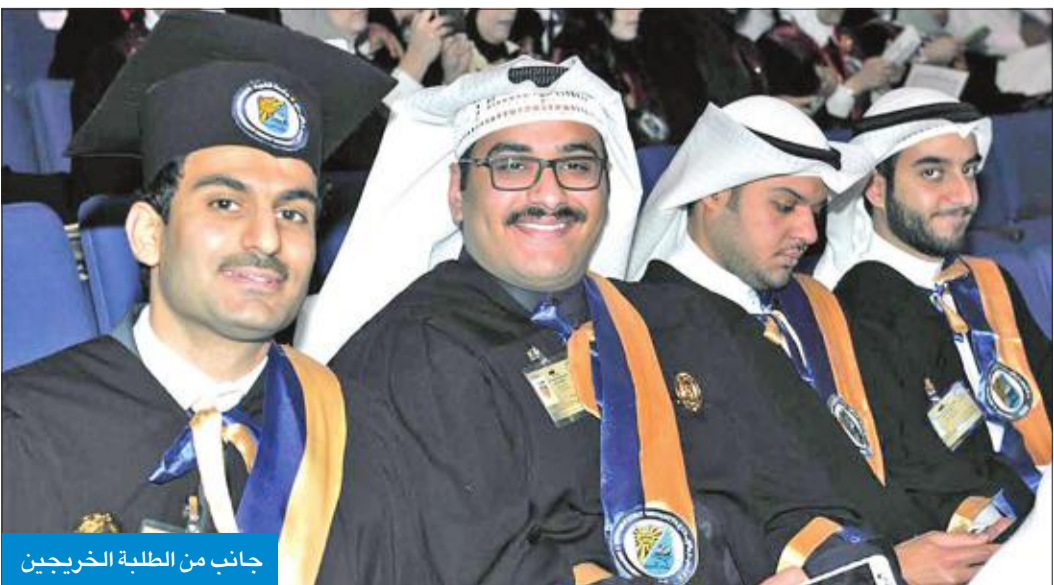
جانب من الطلبة الخريجين

لقطات من الحفل • تشرفت جامعة الكويت بمنح سموه شهادة الدكتوراه الفخرية، تقديراً لدوره البارز عبر مسيرته على مستوى دولة الكويت وعلى المستوى الإقليمي والإسلامي والعالمية. • لفقة أبوية من سمو الأمير حرصه على تهنئة جميع الطلبة بمناسبة تفوقهم. • عرض فيلم بعنوان «مسيرة جامعة الكويت» • تكريم جيل الرواد الأوائل في جامعة الكويت.