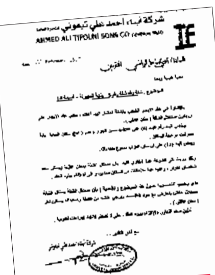
صورة من كتاب المؤجر يطلب الإخلاء