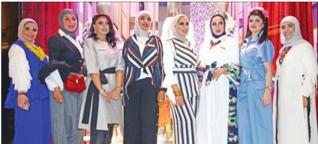
متخصصات استايست مونتانيا، يعرضن أزياء التشكيلة الجديدة