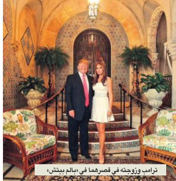
ترامب وزوجته في قصرهما في «بالم بيتش»

بسهل الوصول إلى دونالد ترامب؛ يكفي أن تملك 200 ألف دولار لتصبح جزءاً من ناديي الحصري «مارالاغو»؛ منذ انتخابه، زاد طلب الانتساب إلى الأخير بنسبة قياسية وارتفعت الأسعار. يستفيد كريستوفر رودي، مالك