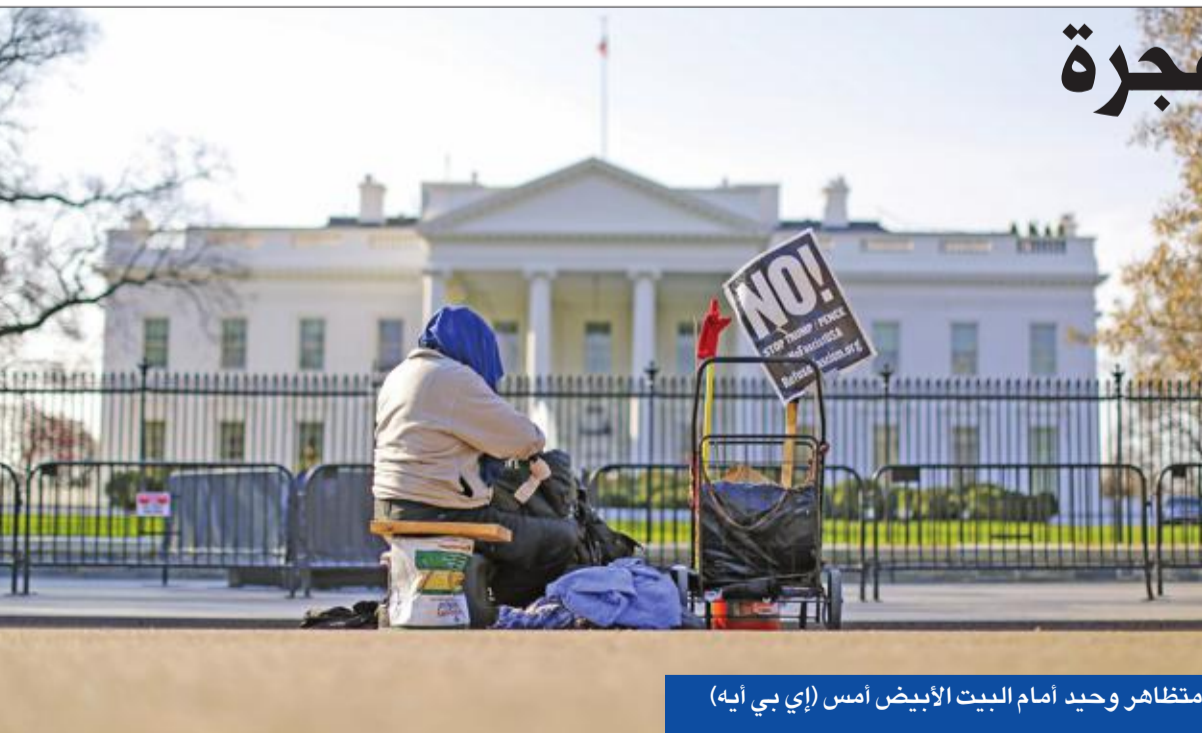
متظاهرو وحيد أمام البيت الأبيض أمس

إن كومي أرسل إلى الوزارة طلبه هذا السبت، لأن ليس هناك أي دليل يدع هذا الاتهام، ولأنه يلزم إلى أن الإف بي آي انتهكت القانون». وتشكيك كومي بصديق الرئيس عبر هذا الإجراء غير المعهود، هو مؤشر على خطورة ما أقدم عليه ترامب بنوجبه