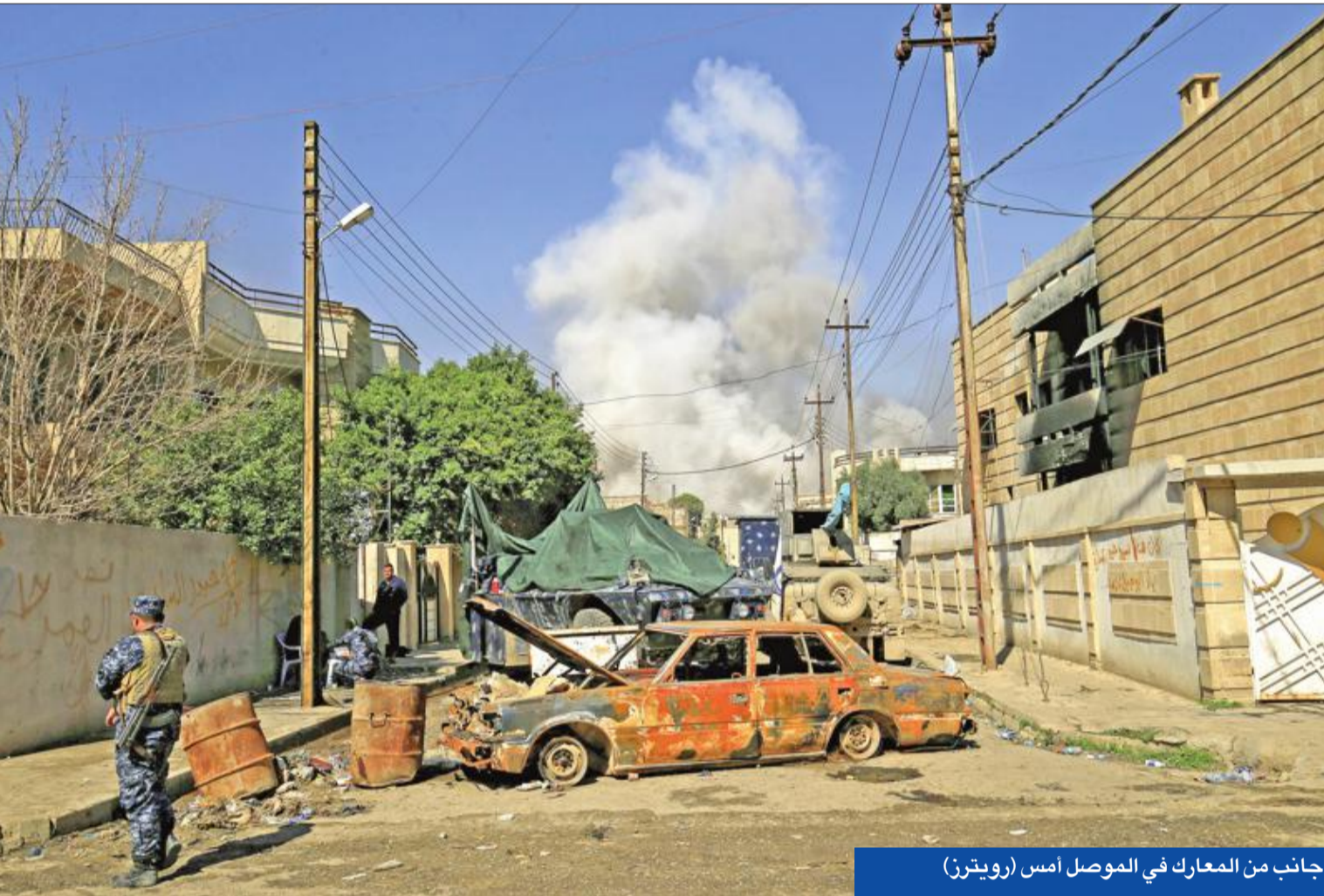
جانب من المعارك في الموصل أمس

سيطرته القوات العراقية المدعومة من الولايات المتحدة أمس على الجسر الثاني من جسور الموصل الخمسة أمس، مما أعطى دفعة لهجومها على ما تبقى من معقل تنظيم «داعش» في الجزء الغربي من المدينة.