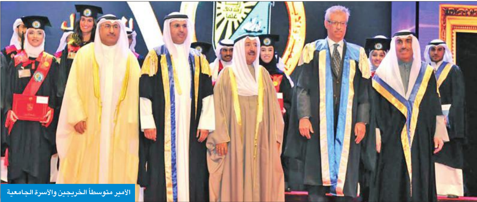
الأمير متوسماً الطلاب الخريجين والأسرة الجامعية

الجامعة قدمت خلال نصف قرن أعمالاً متميزة وإنجازات مهمة في جميع المجالات الأنصاري وقال الفارس: إن هذه المناسبة عزيزة، نستذكر فيها المراحل التي مرت على الجامعة، وما قام به الإخوة الأفاضل السابقون من عمل جبار لإنشائها بحدوهم في ذلك النية الصالحة والعمل الوطني الخالص، وقد تخرجت من مجال عمله أن يبذل الجهد للتغيير أبناء وطننا العزيز، تبوا بعضهم