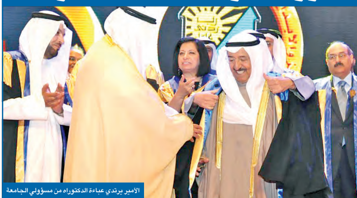
الأمير يرتدي عباءة الدكتوراه من مسؤولي الجامعة