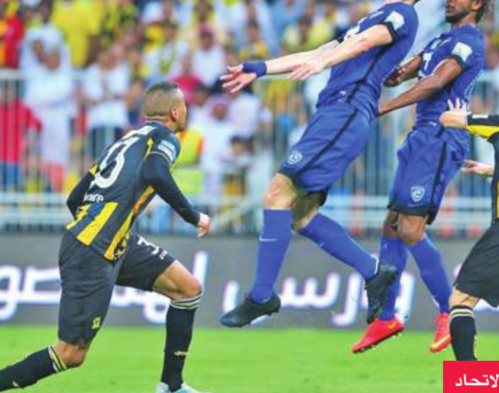
من لقاء الهلال والاتحاد