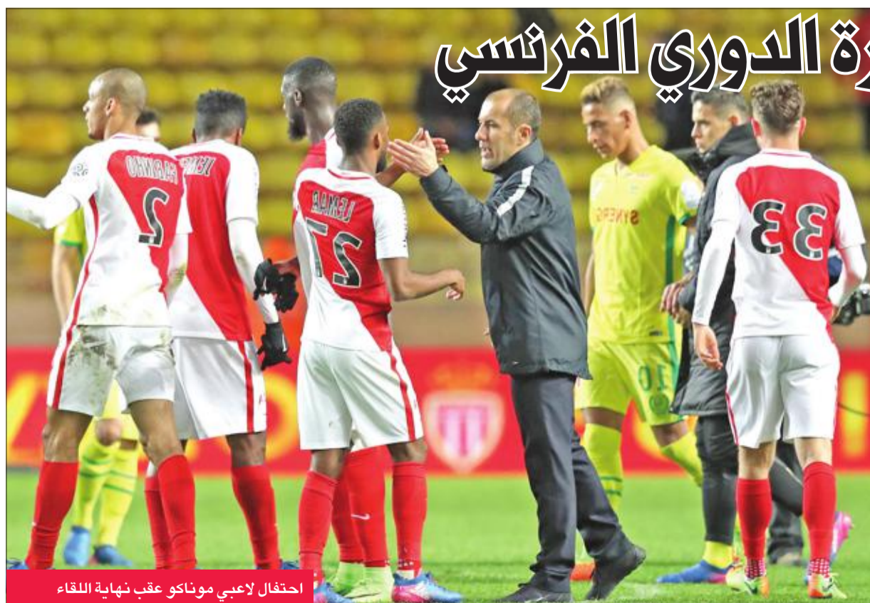
احتفال لاعبي موناكو عقب نهاية اللقاء

انفرد موناكو بالصدارة بعيداً عن مطارديه باريس سان جيرمان حامل اللقب ونيس، بسحبه ضيفه نانت 4-صفر، أمس الأول، في ختام المرحلة الثامنة والعشرين من الدوري الفرنسي لكرة القدم. وهدف فريق الإمارة رسيدته إلى 65 نقطة، بفارق 3 نقاط عن سان جيرمان ونيس اللذين فازا على نانسى وديغون على التوالي 1-صفر السبت.