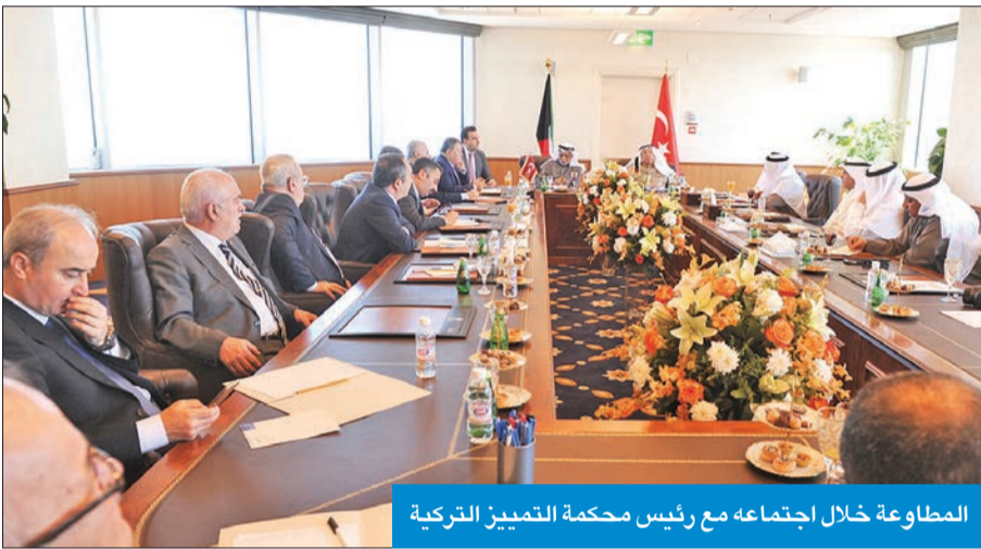
المطالعة خلال اجتماعه مع رئيس محكمة التمييز التركية

لها، مستذكراً الأيادي البيضاء لسموه في هذا الصدد. ورحب المطالعة بالدعوة، التي تلقاها زيارة تركيا بهدف تعزيز ما تم بحثه خلالها، مبيناً أنه تم الاتفاق أيضاً على تشكيل لجنة قضائية ما بين تركيا والكويت لبحث أوجه التعاون المشترك.