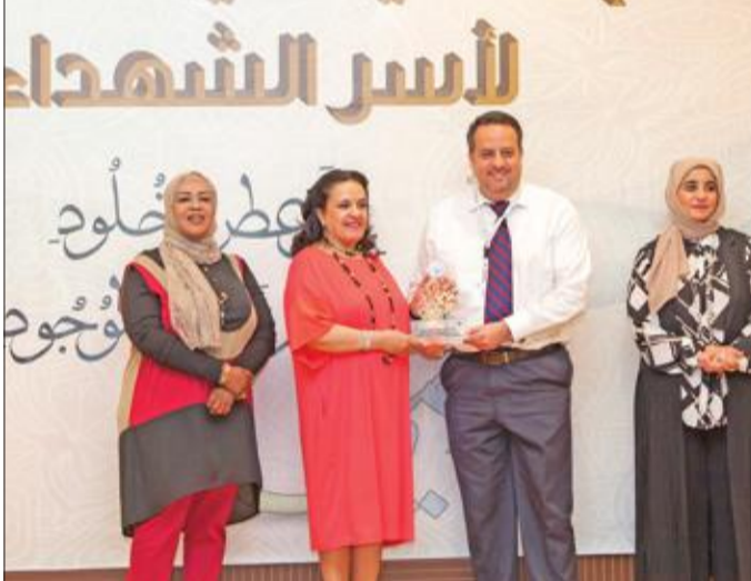
تكريم إحدى المشاركات

الشيء الكثير والكثير جداً، وعلينا أن نرد الجميل لهم في كل مجالات الحياة، مؤكدة أن مكتب الشهيد إنما هو كيان أسر الشهداء وصرحهم القائم واستمرارية المكتب، إنما تكون بأهله ومشاركته في جميع فعالياته، وأعربت عن سعادتها بوجود عدد كبير من أسر الشهداء وذويهم للمشاركة في فعاليات، التي سبقت في فبراير الماضي، والتي ستكون في قادم الأيام في كل المناسبات الدينية والوطنية. وتخلل الحفل عدد من الفقرات الترويحية والترفيهية منها استعراض موسيقي لمجموعة من الأطفال وقصيدة شعرية عن الإيم والوطنية. وتكريم المشاركين في الفعالية.