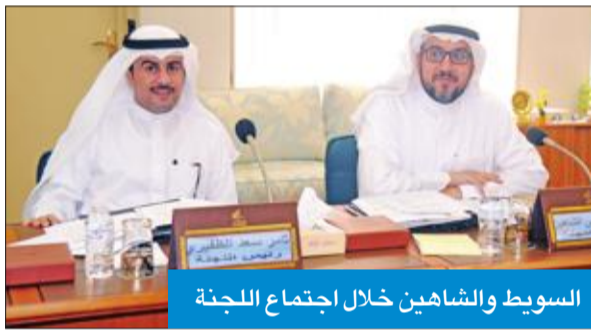
السويط والشاهمين خلال اجتماع اللجنة

الداخلية والدفاع والذي حدد حدا أدنى للمجسنيين خلال عام 2017. وذكر أن اللجنة ناقشت وزارة الصحة في القانون رقم 30 لسنة 2016 بتعديل بعض أحكام القانون رقم 28 لسنة 1996 في شأن تنظيم مهنة الصيدلة وتداول الأدوية، حيث تعهدت الوزارة بالانتهاء من اللائحة التنفيذية للقانون خلال المدة المقررة والتي تبقى عليها ثلاثة أشهر.