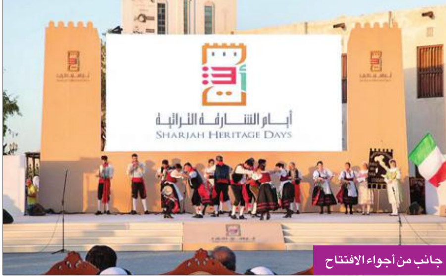
جانب من أجواء الافتتاح