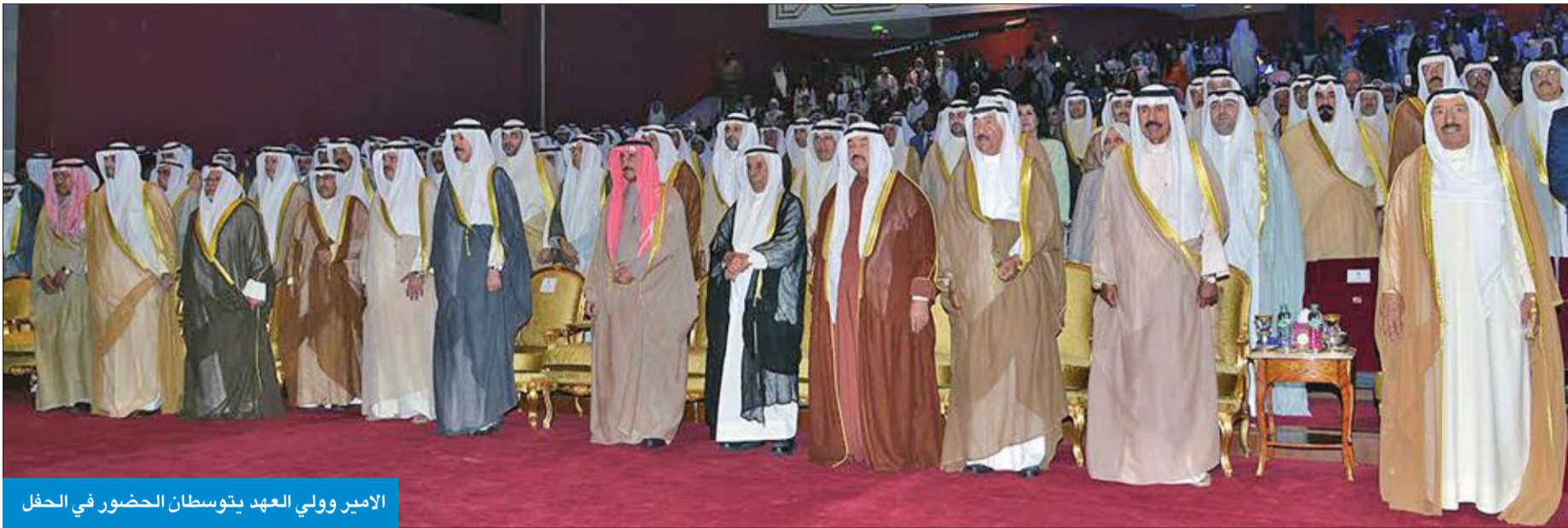
الامير وولي العهد يتوسطان الحضور في الحفل

سموه رعى أوبريت «الكويت ثم الكويت» بحضور ولي العهد والغانم وكبار المسؤولين بالدولة