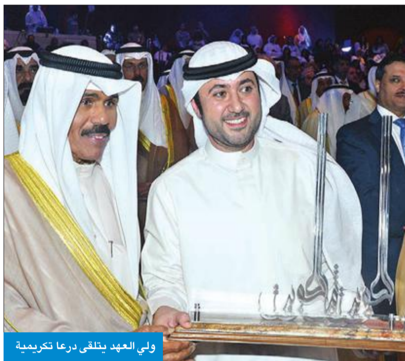
ولي العهد يتلقى درعا تكريمية