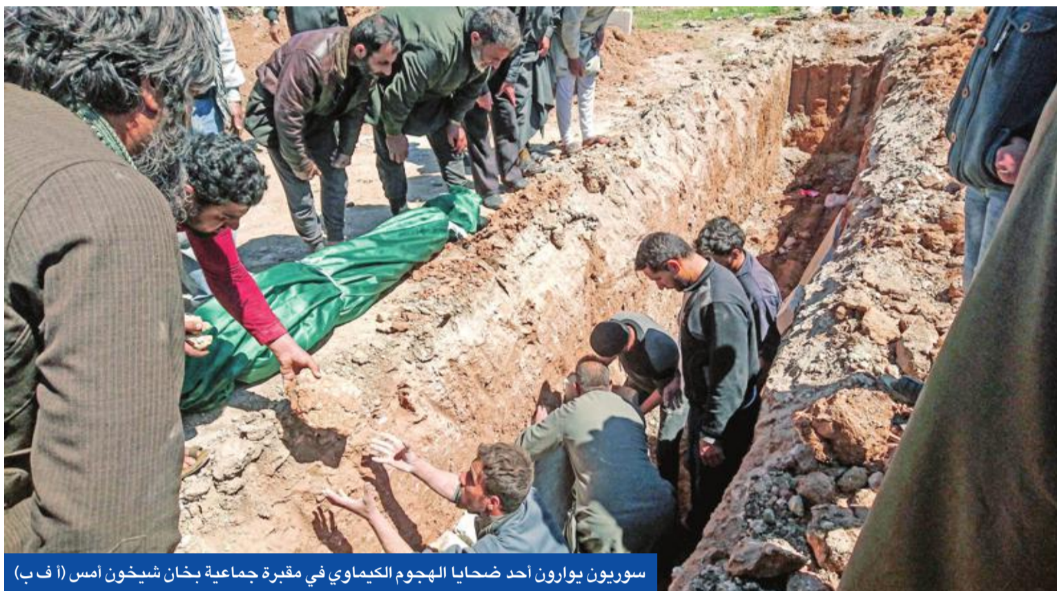
سوريون يوارون أحد ضحايا الهجوم الكيماوي في مقبرة جماعية بخان شيخون أمس

رغم تنامي موجة الغضب الدولية جراء مجزرة «الثلاثاء الأسود» الكيماوية في إدلب، ساندت موسكو الرئيس السوري بشار الأسد واتهمت خصومه بتخزين الأسلحة الكيماوية في المحافظة الخارجة على سيطرته كاملة، وتعهدت بمواصلة عملياتها الداعمة له، في حين نددت شريكها إيران باستخدام هذه الأسلحة وعرضت المساعدة.