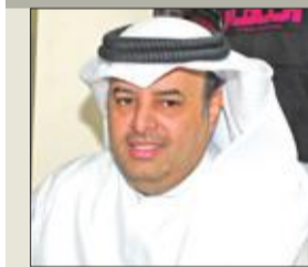
تقدم النائب مبارك الحجرف باقتراح برغبة بتحديد يوم العشرين من كل شهر ميلادي موعداً ثابتاً لصف مكافأة الاجتماعات لجميع الطلبة الدارسين في الخارج.

وأوضح الحجرف في اقتراحه انه «لأنك أن طلبتنا الدارسين والمبتعنين في الخارج تقع عليهم مسؤوليات مالية تتطلب منهم أداءها في أوقاتها بدون أي تأخير أو مماطلة وحرصاً منا كمشرعين على استقارهم النفسي والذهني». كما تقدم باقتراح آخر خصص على «إعادة اجازة تادية الاختبارات المنوحة لموظفي الدولة الدارسين على حسابهم في الخارج ومدتها 45 يوماً في السنة».