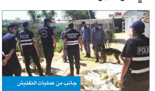
جانب من عمليات التفتيش

نفذت الإدارة العامة لمباحث السلاح، صباح أمس، حملة تفتيش شملت منطقة جواخير كبد، للتأكد من خلوها من الأسلحة والذخائر والمفرقات غير المرخصة، وتطبيق القانون على الجميع، حيث يعد الاحتفاظ بالأسلحة مخالفة يعاقب عليها القانون، وسبباً رئيسياً في