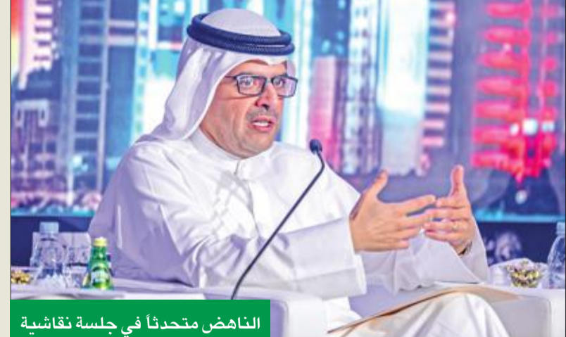
الناهض متحدثاً في جلسة نقاشية

1. التباطؤ في نمو الأصول والفرص التمويلية، إذ إنه مع تراجع الإيرادات النفطية وانخفاض الإنفاق الراسمالي، رابنا بعض التباطؤ في نمو أصول القطاع المصرفي في معظم دول مجلس التعاون، ومع غياب النمو الاقتصادي وقلة الفرص لدى القطاع الخاص تراجع الطلب على التمويل نتج عنه نسب نمو أقل للقروض لدى القطاع المصرفي، ويبقى وضع الكويت مختلفاً نسبياً، حيث مازالت فرص النمو متوافرة نتيجة لتسارع