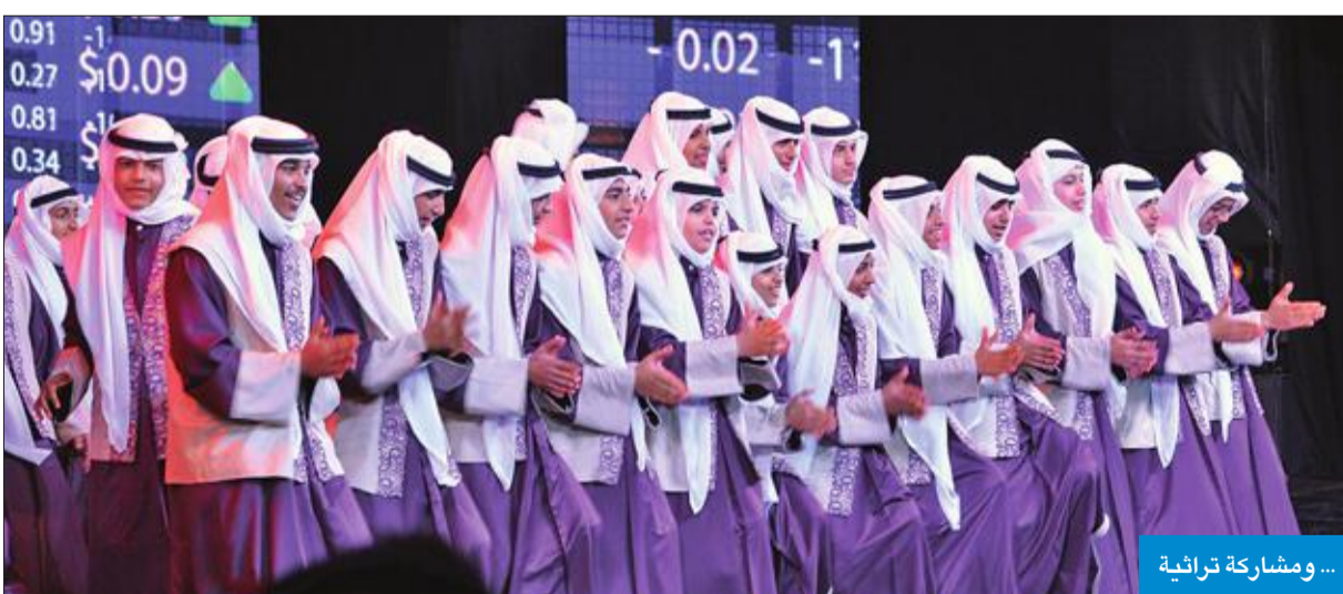
... ومشاركة تراثية