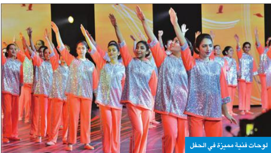
لوحات فنية مميزة في الحفل