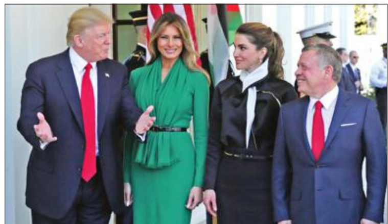
ترامب والعاهل الأردني والملكة رانيا وميلانيا ترامب في البيت الأبيض أمس

أبدى الرئيس الأميركي دونالد ترامب أمس تشدداً غير مسبوق تجاه نظام الرئيس السوري بشار الأسد وذلك غداة الهجوم الكيماوي على بلدة خان شيخون في ريف إدلب شمال سورية، والذي أسفر عن مقتل 100 شخص. وقال ترامب، في مؤتمر صحفي عقده مع العاهل الأردني الملك عبدالله بن الحسين، إن موقفه تجاه الأسد تغير بعد المجزرة التي وصفها بالعمل الفظيع والإهانة الرهيبة للإنسانية، مضيفاً أن دمشق تخطت الكثير من الخطوط الحمراء، بشأنها هذا الهجوم، وأنه لا يمكن الصمت حيال ما جرى. وجاء موقف ترامب هذا بعد أن رُصدت لهجة أميركية قاسية ضد الأسد، إذ حذرت