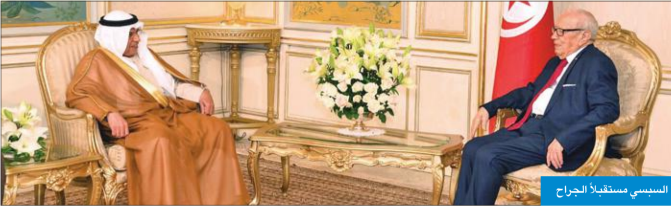
السبسي مستقبلاً الجراح

وزير الداخلية بحث مع عدد من نظرائه قضايا مشتركة