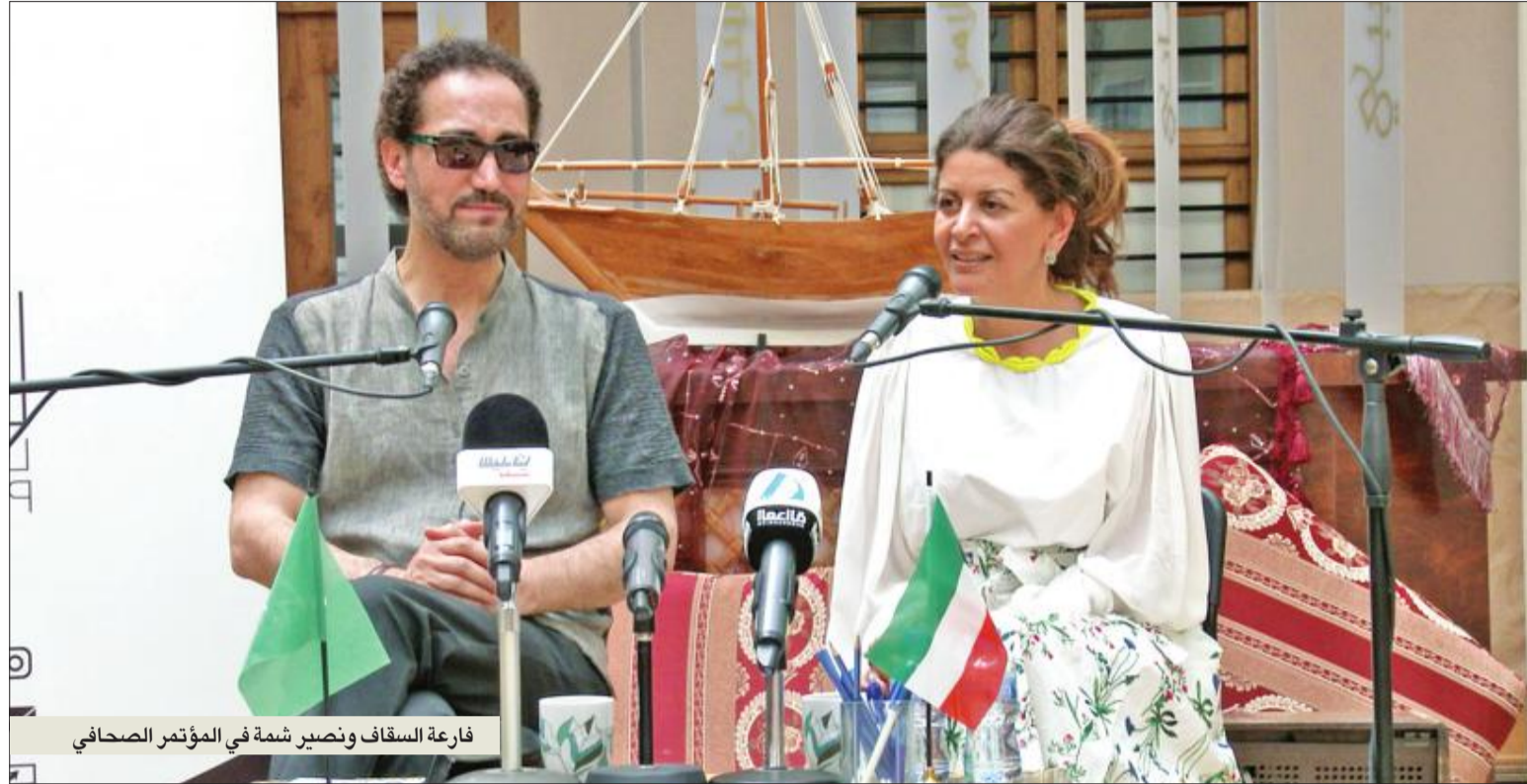
فارة السقايف ونصير شمة في المؤتمر الصحفي

كشف عازف العود العالمي العراقي نصير شمة عن تجهيزه حالياً لعمل موسيقي كبير، مستلهم من رواية كويتية قرأها منذ فترة وأعجب بها.