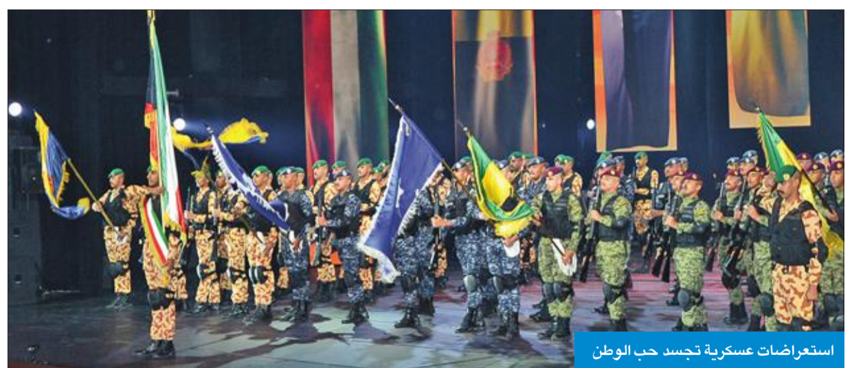
استعراضات عسكرية تجسد حب الوطن