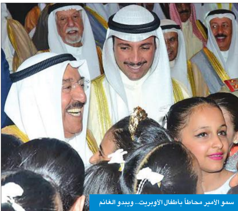
سمو الأمير محاطاً بأطفال الأوبريت... ويبدو الغانم

من جهة أخرى، استقبل صاحب السمو بقصر بيان صباح أمس سمو ولي العهد الشيخ نواف الأحمد. كما استقبل سموه رئيس مجلس الأمة مرزوق الغانم ثم رئيس مجلس الوزراء سمو الشيخ جابر المبارك.