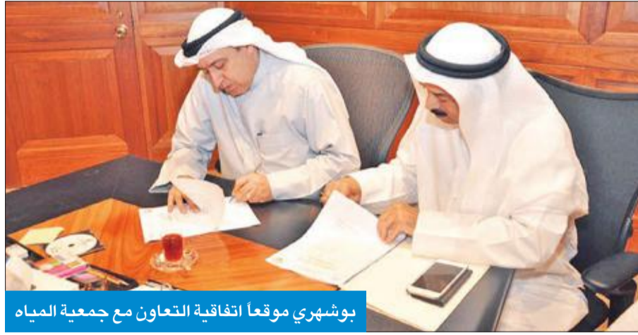
بوشهري موقعا اتفاقية التعاون مع جمعية المياه

تتضمن عمل برنامج مشترك بين الطرفين بحمل الصفة التنفيذية بهدف المحافظة على المياه والطاقة، وتحقيق خفض الفعلي لتكاليف فاتورة الميزانية السنوية المستخدمة في إنتاجها، والتي لو تكاثفت