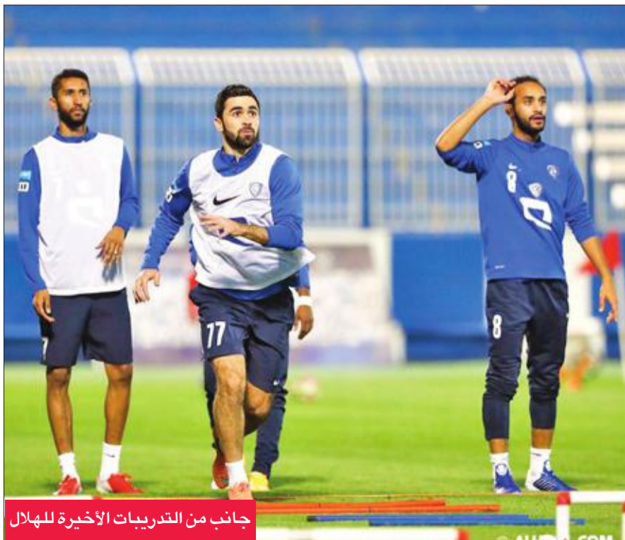
جانب من التدريبات الأخيرة للهلال

الدوري حتى الآن منحه الأفضلية؛ فهو أكثر الفرق فوزاً بواقع 17 انتصاراً وأقلها خسارة إذ لم يسقط سوى في مباراتين أمام الاتفاق والاتحاد، كما يعتبر الأقوى هجوماً بعدما سجل 50 هدفاً، والأقوى دفاعياً إذ دخل مرماه 13 هدفاً فقط.