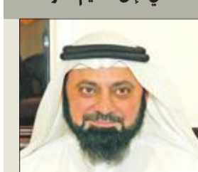
قال النائب د. وليد الطبطبائي إنه «في إطار تعزيز التعاون بين مؤسسات المجتمع المدني وجمعيات النفع العام والبرلمان الكويتي، ومن أجل تحقيق الشراكة الاجتماعية الفعالية؛ فقد تقدمت بمراسلة مؤسسات المجتمع المدني وجمعيات النفع العام والاتحادات، رغبة مني في مساهماتهم والقيام بمسؤولياتهم وحتم على تقديم اقتراحات أو مشروعات بقوانين، وللقيام بدور فعال يساعد في حل المشكلات ونهضة المجتمع الكويتي وازدهار الدولة،

قال النائب د. وليد الطبطبائي إنه «في إطار تعزيز التعاون بين مؤسسات المجتمع المدني وجمعيات النفع العام والاتحادات، رغبة مني في مساهماتهم والقيام بمسؤولياتهم وحتم على تقديم اقتراحات أو مشروعات بقوانين، وللقيام بدور فعال يساعد في حل المشكلات ونهضة المجتمع الكويتي وازدهار الدولة،