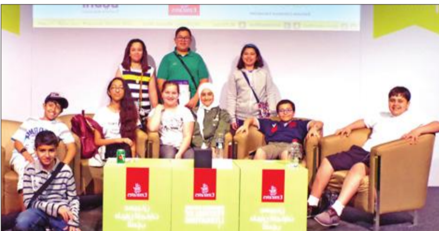
الطلاب الزائرون في مهرجان الأدب بدبي