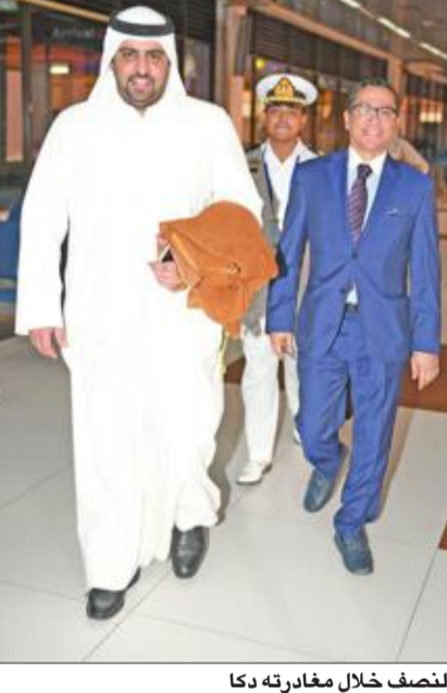
النصف خلال مغادرته دكا