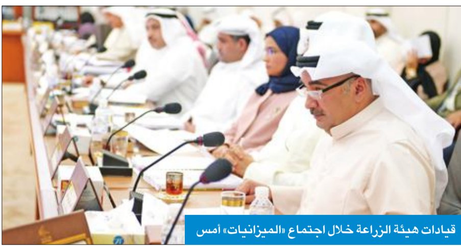
قيادات هيئة الزراعة خلال اجتماع «الميزانيات» أمس

وقال: «تبنه اللجنة إلى أن رفض ميزانية السنة المالية الحالية لن يؤثر على صرف الأمور الحتمية لها، وخاصة في مجال الأعلاف المدعومة، لأنه وفق الدستور، تسري الميزانية السادة إلى حين إقرار الميزانية الجديدة، وبالتالي فلا داعي للخوف من توقف صرف على الدعم، وللجنة بصدد رفع تقرير متكامل للمجلس بأسباب الرفض». وتبين أن تلك الدراسة قدمتها شركة أخرى للهيئة في سنة 2008 وتم نقلها حرفياً من الشركة، لدرجة أنها وردت بنفس الأخطاء الإملائية، وهناك خلل في المراسلات والكتب المتبادلة بين البلدية والهيئة، لدرجة وجود حيازة زراعية مسجلة في الهيئة على أنها موزعة في منطقة الوفرة، وفي مراسلة أخرى على أنها موزعة في العبدلي. وأوضح أنه تبين للجنة أن عدد الحيازات التي وزعت خلال الفترة