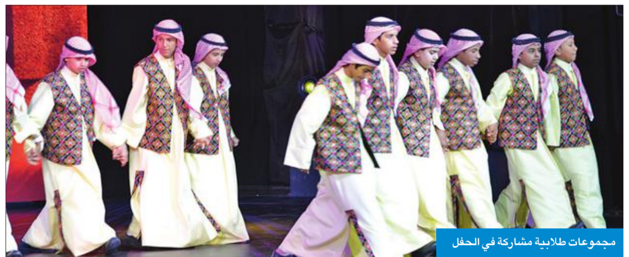
مجموعات طلابية مشاركة في الحفل

وتأتي الجائزة نظير رعاية الملك سلمان بخدمة الحرمين الشريفين وقاصديهما واهتمامه بالسيرة النبوية ودعمه لمشروع