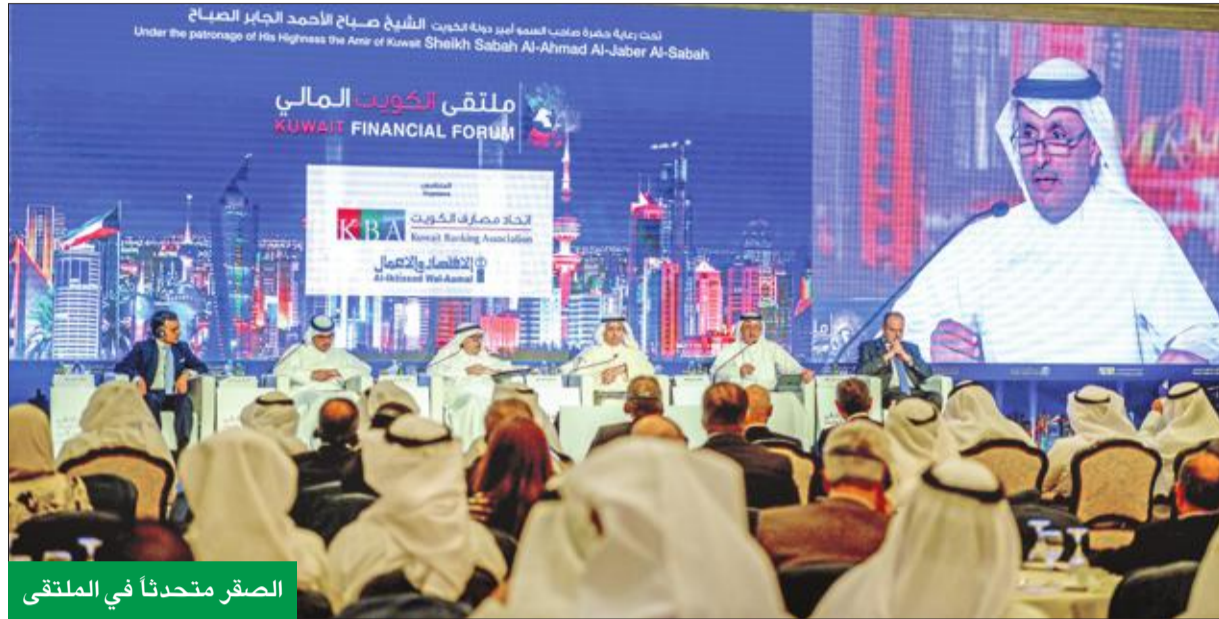
الصقر متحدثاً في الملتقى

وناقشت الجلسة الثانية التي كانت بعنوان «واقع ومستقبل المصرفية الإسلامية»، التي