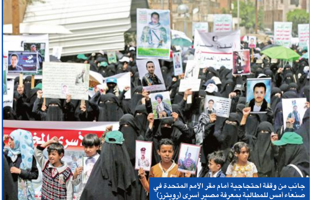
جانب من وقفة احتجاجية أمام مقر الأمم المتحدة في صنعاء أمس للمطالبة بمعرفة مصير أسرى

تتصاعد المؤشرات على اقتراب موعد انطلاق معركة تحرير ميناء الحديدة اليمني على الساحل الغربي لليمن على البحر الأحمر، مع دفع الحكومة الشرعية بلواءين إلى المنطقة، في حين أعلن ما يسمى بالمجلس السياسي الأعلى "التتابع للمتمردين، تشكيل مجلس دفاع وطني، تمهيداً لإعلان حالة الطوارئ في صنعاء". وأفادت تقارير لوكالة "رويترز" عن نشر قوات حكومة الرئيس اليمني عبدربه منصور هادي لسواءين عسكريين مجهزين ومدربين لاستعادة ميناء الحديدة الاستراتيجي الذي تدخل منه 80 في المئة من واردات اليمن من الغذاء والوقود تحت قبضة المتمردين الحوثيين. وأوضح التقرير نقلاً عن مسؤولين يمينيين أن اللواء الأول يتمركز في منطقة ميدي (230 كلم) شمال مدينة الحديدة، أما اللواء الثاني فيتحصن خارج منطقة الخوخة (130 كلم) جنوب المدينة، وذلك بهدف وضع حد لعمليات تهريب السلاح واختكار شحنات الإغاثة. ورأى مدير التوجيه المعنوي في وزارة الدفاع اليمنية، محسن خضروف، أن تجاهل الأمم المتحدة لطلب الإشراف على ميناء الحديدة