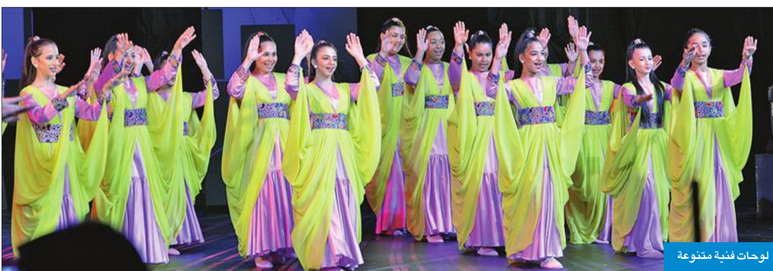
لوحات فنية متنوعة