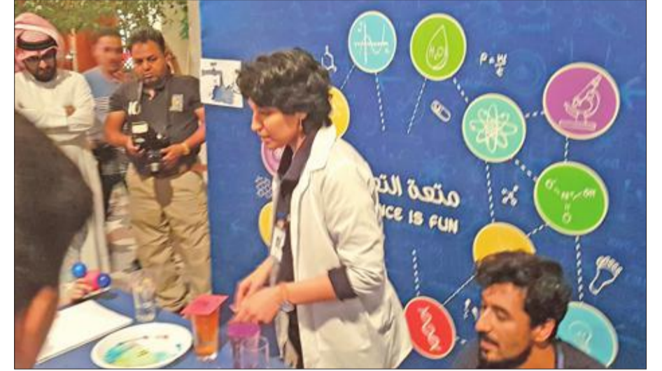
جانب من الفعاليات