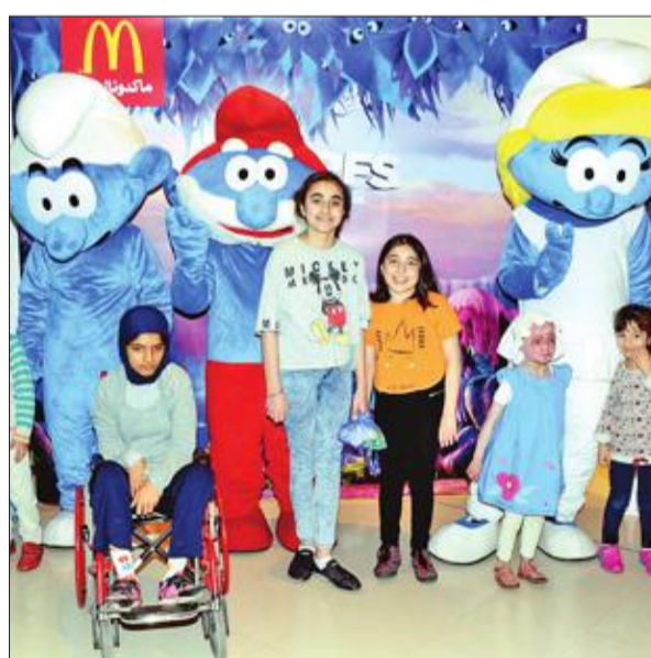
عدد من الأطفال المدعوين لمشاهدة فيلم «السنافر»

قضت مجموعة من الأطفال ليلة مميزة مع سحر الأفلام برفقة «ماكدونالدز الكويت»، التي نظمت عرضاً سينمائياً خاصاً للفيلم الكرتوني الجديد «السنافر» القرية الضائعة». ودعت مجموعة من الأطفال من الجمعية الكويتية لرعاية الأطفال في المستشفى، ودار الأيتام، ومدرسة دسمان ثنائية اللغة للذهاب في رحلة شاققة إلى عالم الخيال مع «السنافر»، وذلك في عرض حصري أقيم في سينيسكايب مارينا مول.