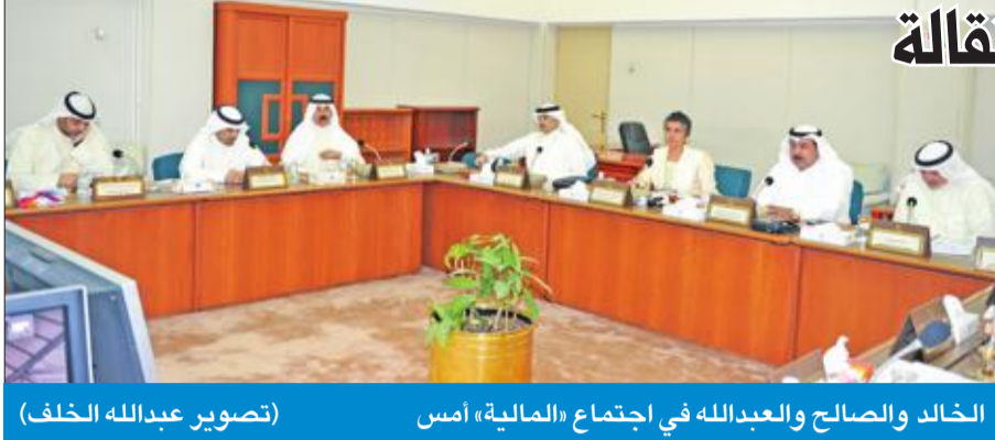
الخالد والصالح والعبده في اجتماع «المالية» أمس

في اجتماع شهد توليغ أحد أعضائها باستقالته؛ إثر ما اعتبره «مماطلة»، أرجأت اللجنة المالية البرلمانية التصويت على مكافآت العسكريين المتقاعدين إلى يوم الاثنين المقبل بطلب من الحكومة، بعد أن اجتمعت بحضور نائب رئيس الوزراء وزير الدفاع الشيخ محمد الخالد، ونائب رئيس الوزراء وزير المالية أنس الصالح ووزير الدولة لشؤون مجلس الوزراء ووزير الإعلام بالوكالة الشيخ محمد العبدالله.