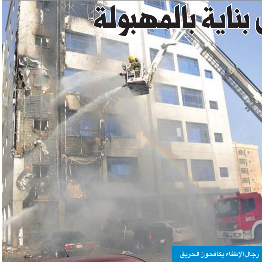
رجال الإطفاء يكافحون الحريق

أكدت رئاسة الأركان العامة للجيش، أمس، عدم صحة ما يتم تداوله بشأن اختراق إحدى الطائرات التابعة للقوات الجوية الكويتية للمجال الجوي العراقي. وقالت رئاسة الأركان، في بيان صحافي، إنه «بعد مراجعاتنا للتوثيق والصور الرادارية ورمز التعارف لطائراتنا تبين عدم وجود اي اختراقات للمجال الجوي في اي وقت من طائرة تابعة للقوة الجوية الكويتية». وأكدت رئاسة الأركان التزامها التام بالقوانين والاتفاقيات والمواثيق الدولية في شأن احترام سيادة الدول وتقديرها بمبادئ حسن الجوار.