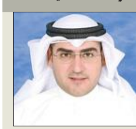
وجه النائب د. عبدالكريم الكندري سؤالاً إلى وزير الدولة لشؤون الإسكان وزير الدولة لشؤون الخدمات،

باسم أهل، جاء فيه: لماذا لم يصدر حتى الآن بيان جدول توزيعات الوحدات السكنية للسنة المالية 2017/2018، حيث إنه المفترض نزوله والإعلان عنه في أول أبريل من كل عام، فما أسباب التأخير؟ وهل سيتم فعلاً تقليص عدد التوزيعات للوحدات لهذه السنة من 12000 إلى 4470 وحدة سكنية؟ وإذا كانت الإجابة بنعم، فما أسباب هذا التقليص؟