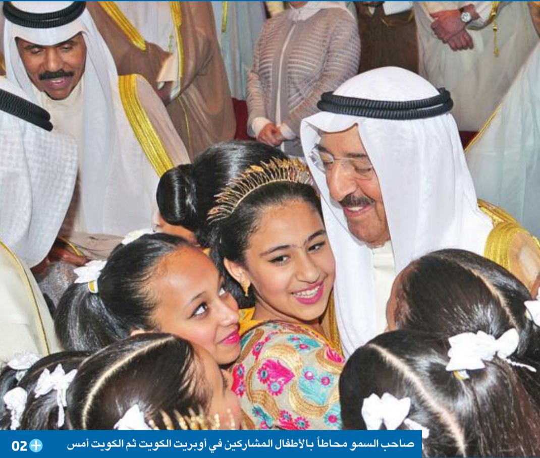
صاحب السمو محاطاً بالأطفال المشاركين في أوبريت الكويت ثم الكويت أمس