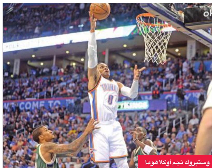
وستبروك نجم أوكلاهوما

ورقق وستبروك رصيده من الثلاثيات المزدوجة إلى 78 منذ بداية مسيرته في صفوف سوبر سونيكس سياتل عام 2008. وحقق أوكلاهوما فوزه الرابع والاربعين هذا الموسم مقابل 33 خسارة، وهو يحتل المركز السادس في ترتيب المنطقة الغربية وضمن التأهل للدور النهائي في المقابل مُني ميلووكي خامس المنطقة الشرقية بخسارته الـ 38 مقابل 40 فوزا.