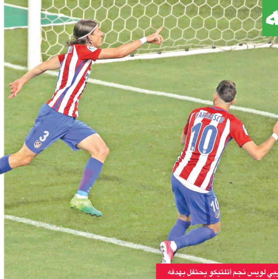
فيليبو لويس نجم آتلتيكو يحتفل بهدفه

وعن مباراة ريال سوسيداد، أمس الأول، أوضح أنه "بالأساس دقيقة الأولى من اللقاء، هم بدأوا بشكل جيد مع الكرة لكن لاحقاً تسببت لنا فرصة تسجيل هدف والسيطرة على مجريات المباراة".