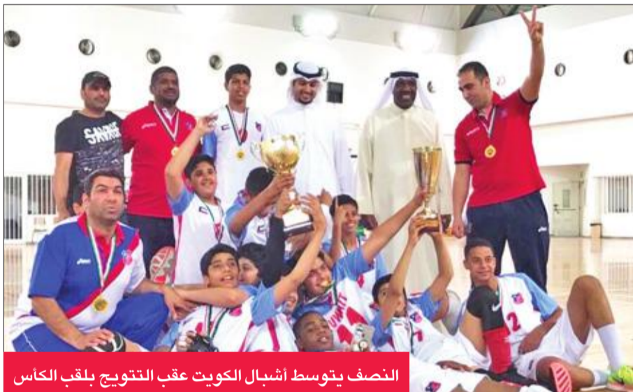
الصف يتوسط أشبال الكويت عقب التتويج بلقب الكاس

فريق الكويت وتوزيع الميداليات التذكارية على لاعبي الفرق الثلاثة الأوائل.