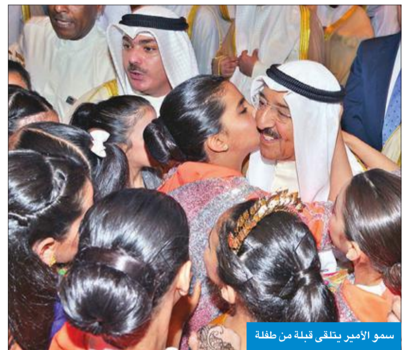
سمو الأمير يتلقى قبلة من طفلة