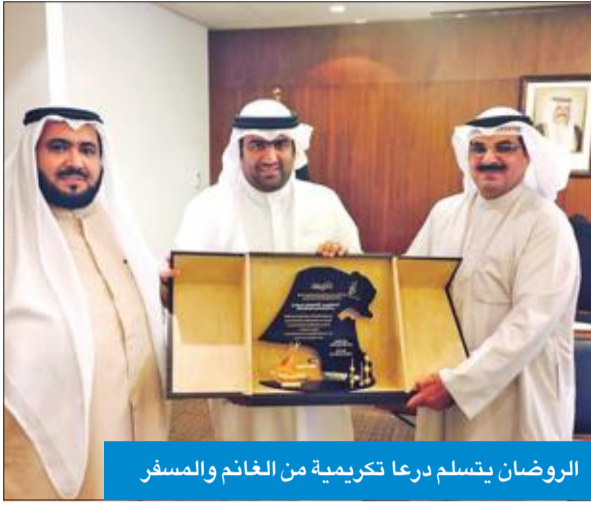
الروضان يتسلم درعا تكريمية من الغانم والمسفر

ثمن وزير التجارة والصناعة، ووزير الدولة لشؤون الشباب بالوكالة خالد الروضان، الأهداف والمعاني التي انطلقت لأجلها «مبادرة تكريم» الوطنية، مبدياً دمه لمثل هذه المبادرات التي تجسد الشراكة بين مؤسسات المجتمع المدني والأجهزة الحكومية.