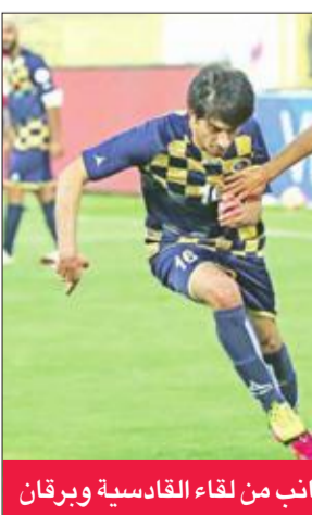
جانب من لقاء القادسية وبرقان