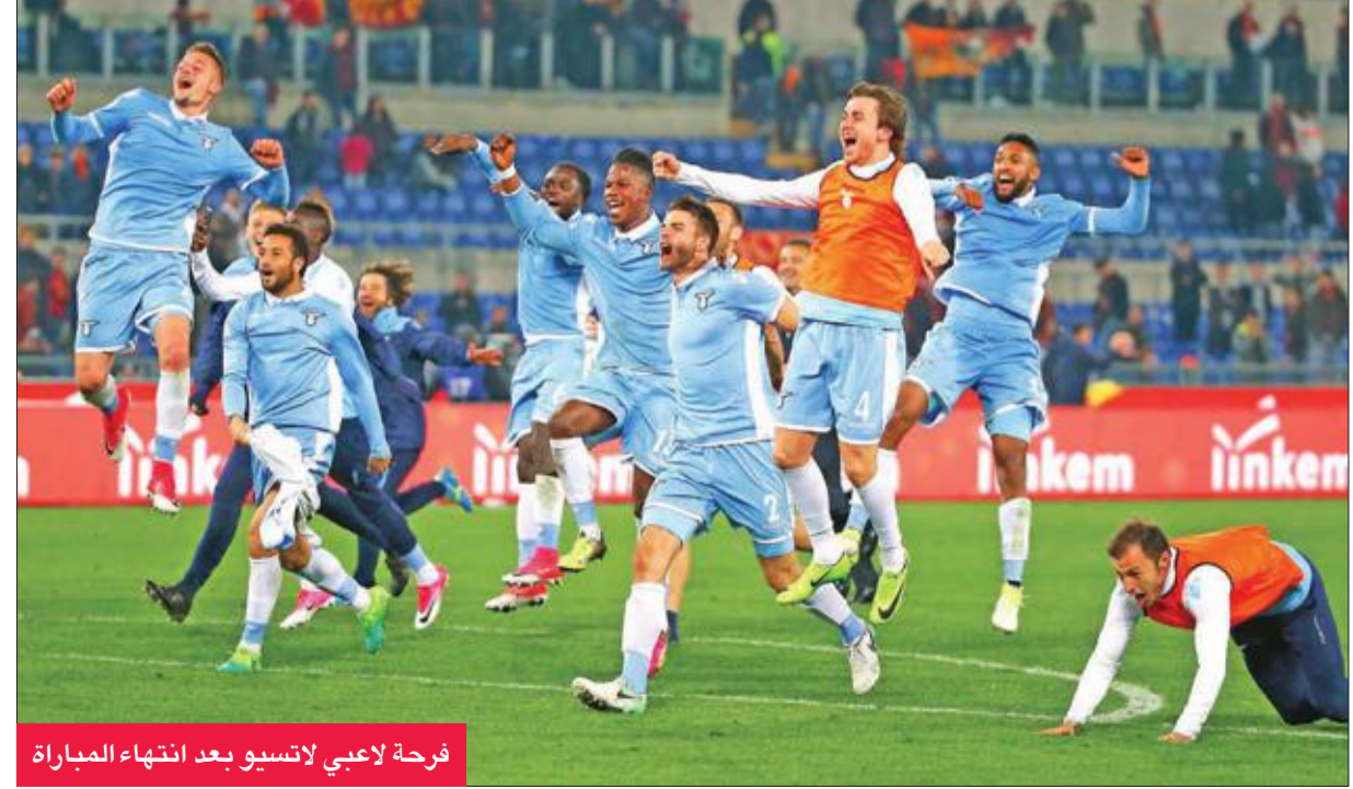
فرحة لاعبي لاتسيو بعد انتهاء المباراة

وبعد مرور عشر دقائق من بداية الشوط الثاني أهدر إيموبيلي هدفا لا يضيع لفريق لاتسيو وهو على بعد ست ياردات من المرمى.