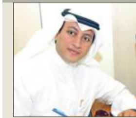
قال رئيس لجنة الداخلية والدفاع البرلمانية النائب عسكر العنزي «تتمنى من نائب رئيس الوزراء وزير الدفاع الشيخ محمد الخالد السماح لأبناء البدون العسكريين الذين انتهت بطاقاتهم الأمنية بالتسجيل للاتحاق بالبحر الكويتي، وذلك تسهيلاً لهم وتسهيلاً عملية تسجيلهم لحين صدور بطاقاتهم الأمنية الجديدة».

عسكر لتسجيل «البدون» المنتهية بطاقاتهم الأمنية