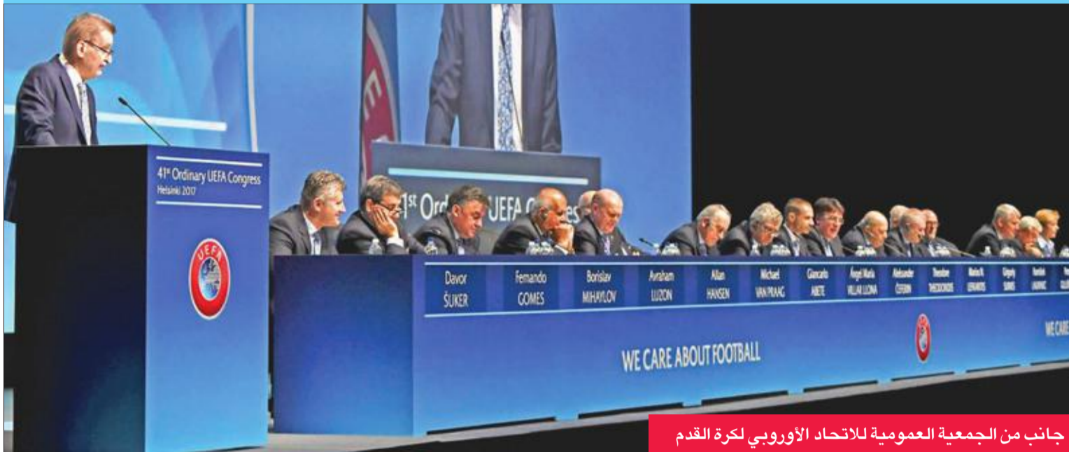
جانب من الجمعية العمومية للاتحاد الأوروبي لكرة القدم

وأعلن الاتحاد الأوروبي لكرة القدم "يويفا" أمس التصديق على حزمة الإصلاحات الخاصة به، ليتماشى نظامه الأساسي بذلك مع الاتحاد الدولي للعبة "فيفا"، كما أعلن منح كل من الاتحادات الوطنية الـ 55 الأعضاء به، مبلغ مليون يورو "1.07 مليون دولار" إضافية، على سبيل التضامن. ومن ناحية أخرى، قال السلوفيني الكسندر سيفرين رئيس اليويفا إن الاتحاد لن يرضخ "للابتزاز" من جانب روابط مسابقات دوري في أوروبا، بدأت السماح لأندية بطولة مبارات تتضارب مواعيدها مع مواعيد مباريات دوري أبطال أوروبا والدوري الأوروبي.