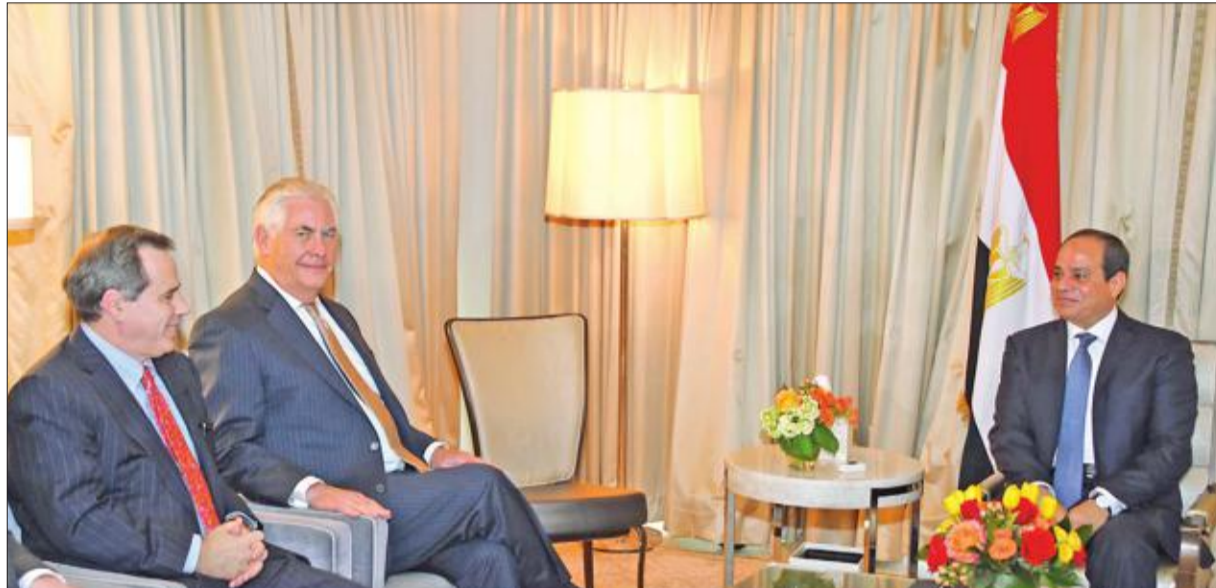
السيسي مستقبلاً تيلرسون في واشنطن أمس الأول

القاهرة - أيمن عيسى وخالد عبده ونسمة نزار وكاملة خطاب