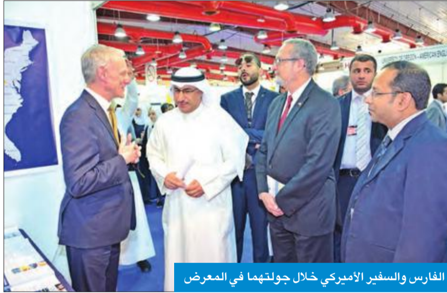
الفارس والسفير الأميركي خلال جولتهما في المعرض

وحول الإيقاف المؤقت لاعتماد جامعات شرق آسيا