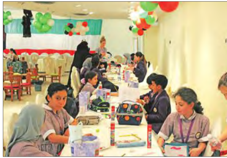
طلبة المدرسة البريطانية في مسابقة للمرحوم خليفة القطان