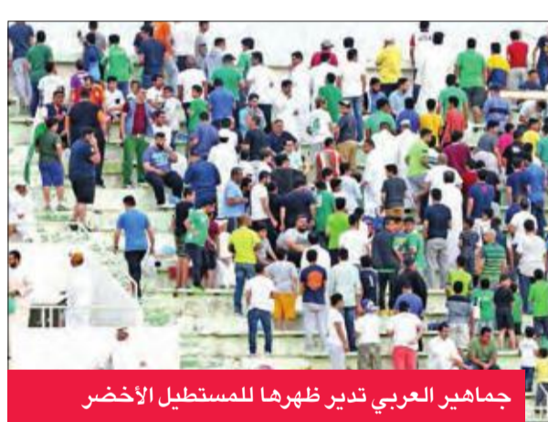
جماهير العربي تدير ظهرها للمستطيل الأخضر