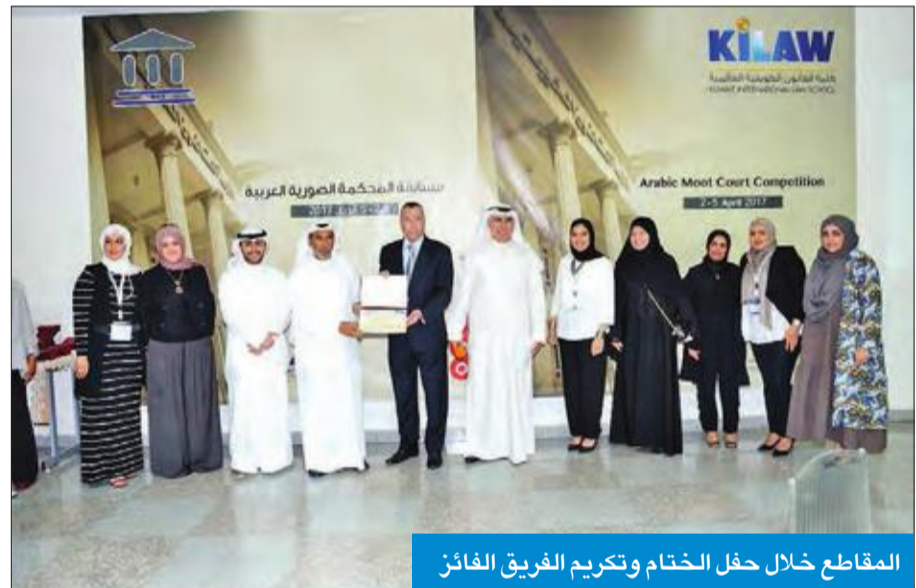
المقاطع خلال حفل الختام وتكريم الفريق الفائز

المقاطع: المشاركة الدولية والإقليمية خيار استراتيجي لإدارة الكلية