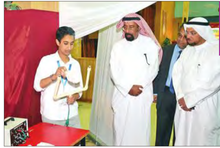
الزايد خلال جولته في المعرض المصاحب لورشة العمل