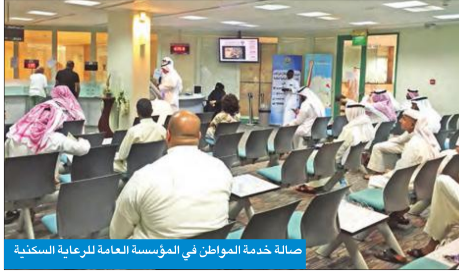
صالة خدمة المواطن في المؤسسة العامة للرعاية السكنية

وشهدت إدارة بدل الإيجار نقلة في عدد المعاملات مقارنة بالأشهر الماضية، بعد بلوغها 1568 معاملة خلال مارس الماضي،