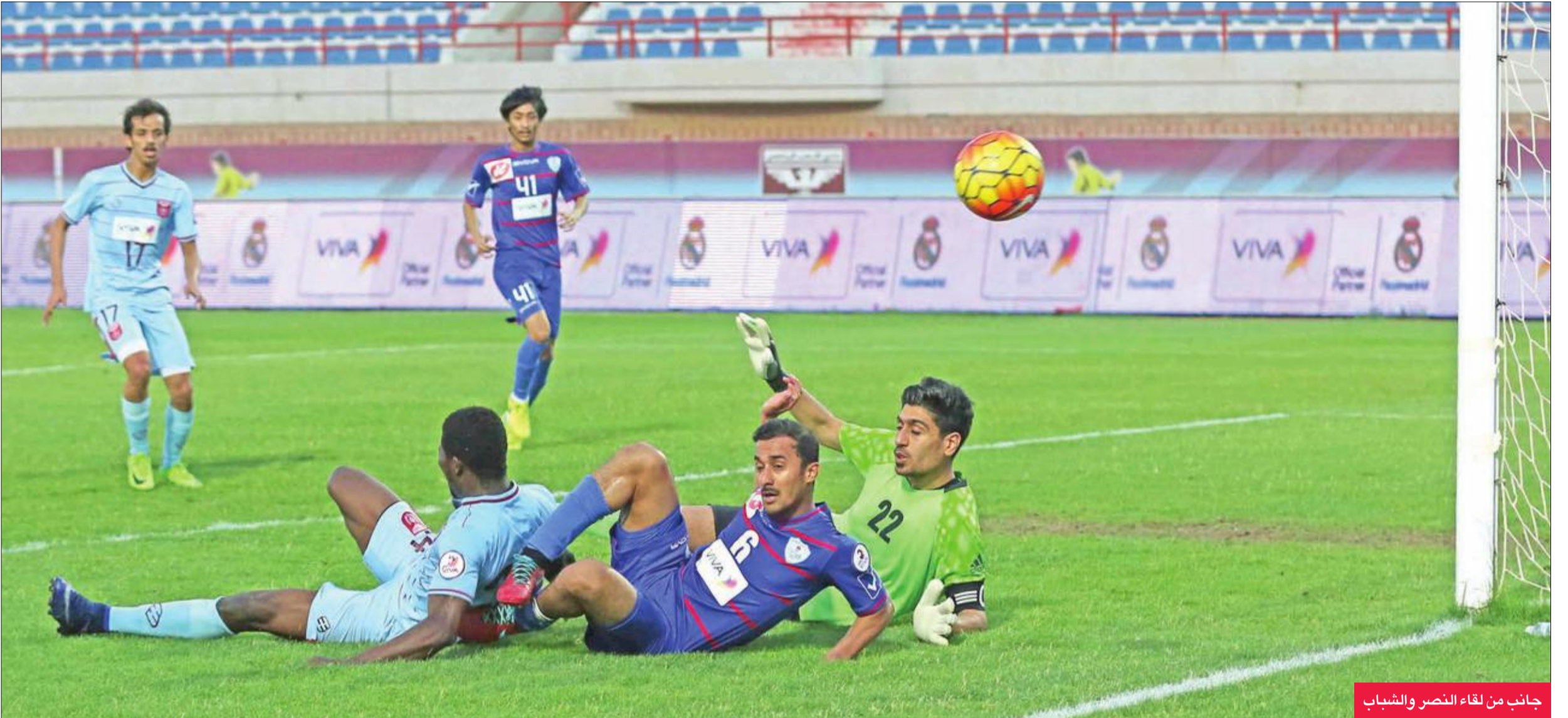
جانب من لقاء النصر والشباب