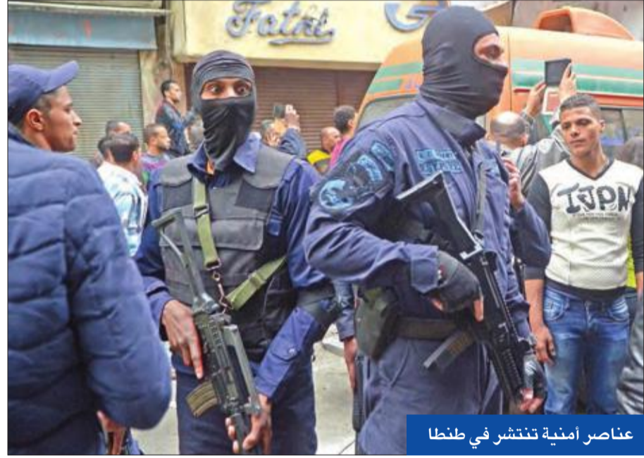
عناصر أمنية تنتشر في طنطا