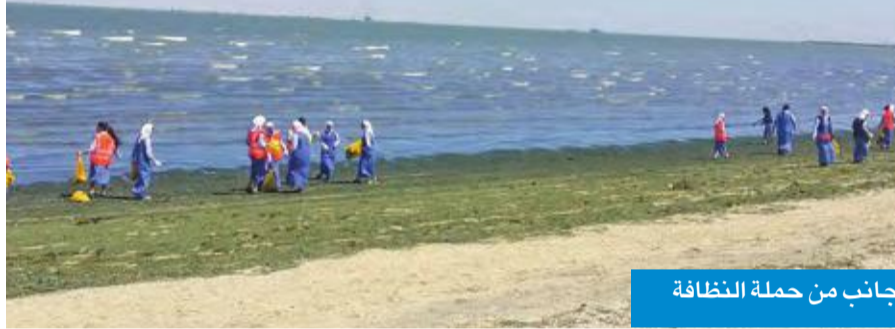
جانب من حملة النظافة

العلاقات العامة ببلدية الكويت بدء انطلاق الحملات التفتيشية، بالتعاون مع إدارات النظافة العامة وإشغالات الطرق بجميع المحافظات، على مكاتب بيع وشراء وتاجير السيارات، للتأكد من مدى التزام المكاتب باستغلال المساحات المسموح بها.