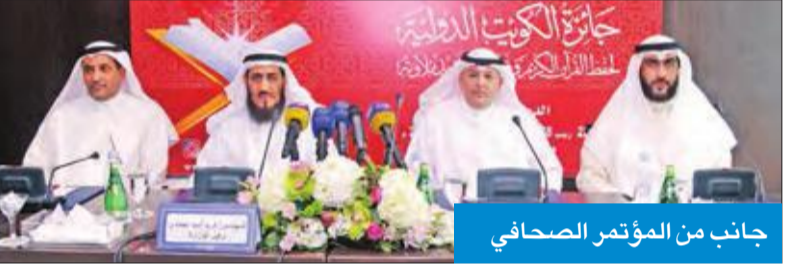
جانب من المؤتمر الصحافي

عمادي: نسعى إلى الترويج في حفظ كتاب الله