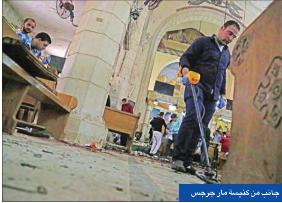
جانب من كنيسة مار جرجس

إرهابي ثان يفجر نفسه أمام الكاتدرائية المرقسية بالإسكندرية بعد فشله في تجاوز بوابة استشعار المعادن ونجاة البابا تواضروس • إقالة مدير أمن الغربية وإعلان الحداد 3 أيام