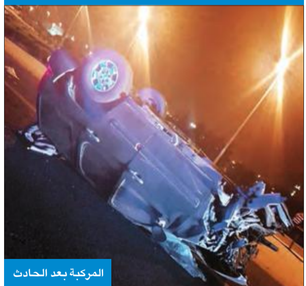
المركبة بعد الحادث