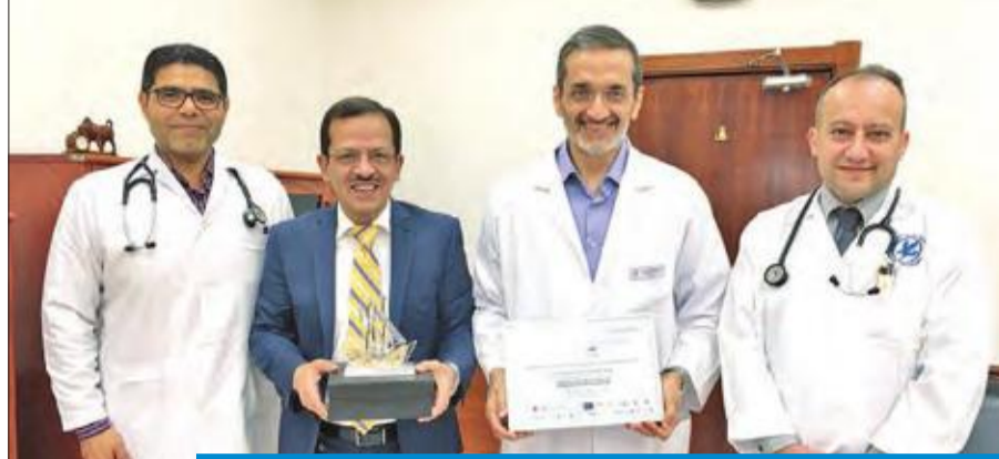
استشاريو العناية المركزة بالأحمدي يتسلمون الشهادة والدرع التكريمية

وفي اليوم الختامي تم توزيع الشهادات وتقديم الدرع إلى الفريق الفائز. وسيحظى البحث الطبي لشركة نفط الكويت- مستشفى الأحمدى بفرصة النشر في المجلة الأوروبية الرائدة في مجال الحالات الحرجة The Journal of Critical Care Medicine.