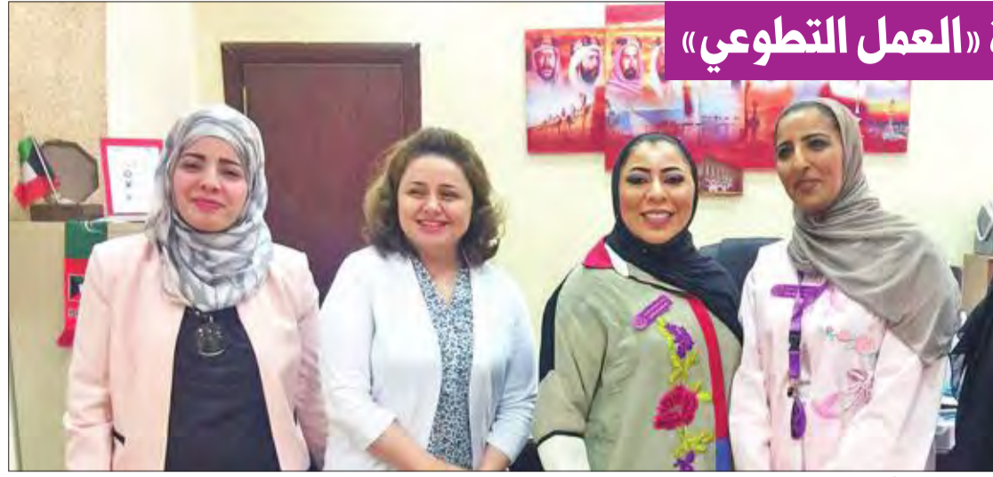
صورة جماعية للمعلمات