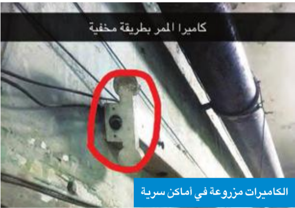
الكاميرات مزروعة في أماكن سرية

لحماية أوكار الرذيلة التي يديرها أفرادها في العاصمة • معدات حديثة نصبت باحترافية أنهلت رجال المباحث