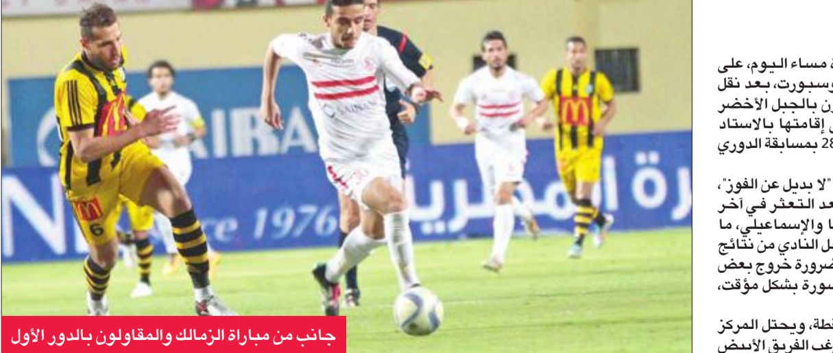
جانب من مباراة الزمالك والمقاولون بالدور الأول

ظنيره الإسماعيلي في مواجهة قوية، إذ يسعى أبناء الغربية إلى حصد النقاط الثلاث، لتلاعبة عن منطقة الخطورة، فيما يرغب «الراويش» في استعادة الانتصارات والاقتراب من المربع الذهبي. إلى ذلك، يحل سموحة ضيفاً على أسوان، في مباراة يأمل خلالها «أبناء الصعيد» الفوز بها للهروب من دوامة الهبوط، فيما يسعى الفريق السكندري لخطف المركز الثالث من الزمالك.