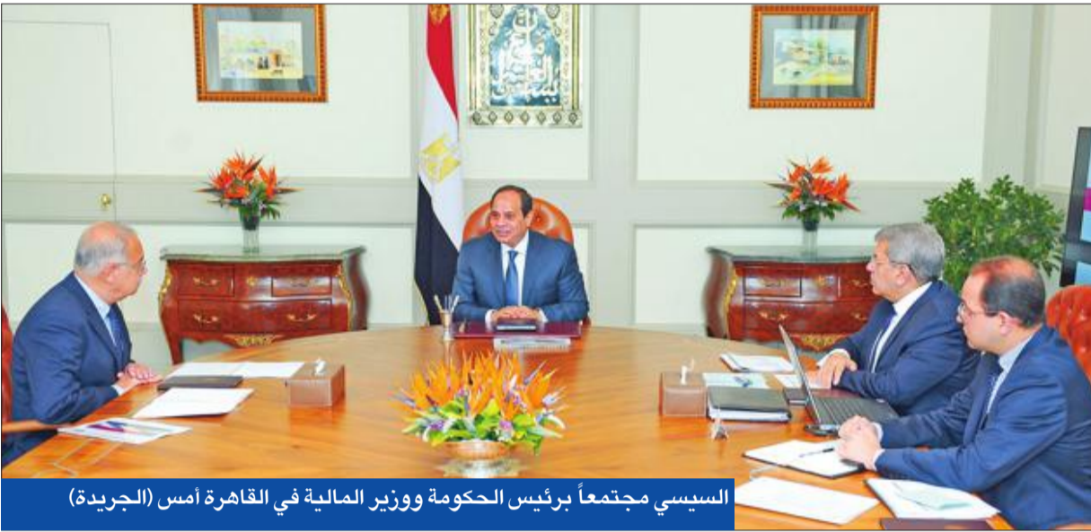
السيسي مجتمعاً برئيس الحكومة ووزير المالية في القاهرة أمس

«الداخلية» تقتل إرهابيين وتنفي خطف شرطيين • العثور على أشلاء 4 جثث في رفح اختطفهم «داعش سيناء»