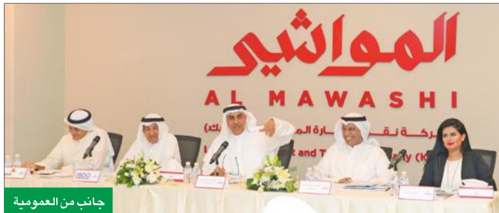
جانب من العمومية

عموميتها أقرت توزيع 5% نقداً وإطفاء خسائر بقيمة 5.5 ملايين