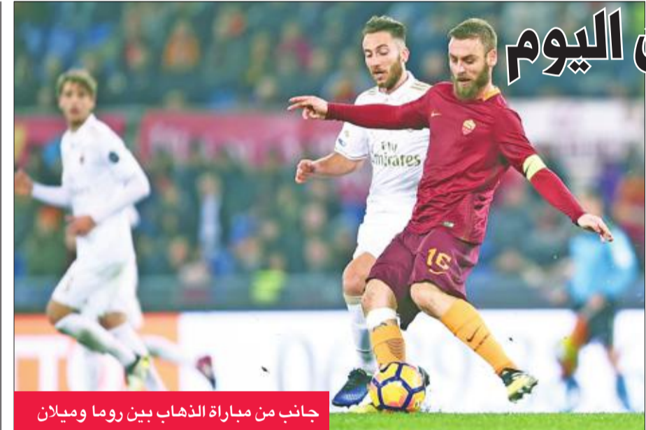
جانب من مباراة الذهاب بين روما وميلان

أكد لاعب كرة القدم الويلزي المعتزل ريان غيغز، أسطورة مانشستر يونايتد، أنه ذهب لطبيب نفسي لمساعدته في مواجهة حياته الجديدة عقب رحيله عن أولد ترافورد، الذي ظل بيته نحو 27 عاماً. وفي مقال كتبه لصحيفة «تيلغراف» عقب أشهر من رحيله عن مانشستر يونايتد، الذي عمل فيه عقب اعتزاله للعب مدرباً مساعداً للهولندي فان غال قبل تولي البرتغالي جوزيه مورينيو الإدارة الفنية للنادي الإنجليزي، أوضح غيغز «43 عاماً» «قررت الذهاب لطبيب نفسي لمواجهة حياتي الجديدة. نصحني بأن