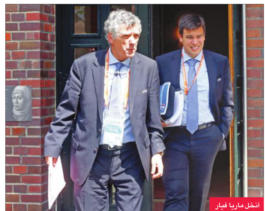
أنخل ماريا فيار

المشابه لما حدث في مناسبات سابقة، يبقى فيار المرشح الأوفر حظاً للفوز. وقبل أن يعلن ترشحه رسمياً لخوض الانتخابات، لم تكن الفترة الأخيرة لفيار سهلة على الإطلاق، بعدما تعرض لأكثر من اختبار صعب كان أبرزها الفترة الصعبة التي ضربت الاتحاد الدولي للعبة «فيفا»، بسبب اتهامات الفساد في عام 2015، فضلاً عن خلافاته الدائمة مع المجلس الأعلى للرياضة في إسبانيا. وازداد المشهد صعوبة بعد الرفض المتتالي للمجلس للتعديلات التي أجراها الاتحاد على اللوائح المنظمة للانتخابات التي أرسلها للاتحاد طوال العام الماضي، لعدم استيفائها النظام الوزاري الذي يحكم انتخابات الاتحادات، قبل أن تتم الموافقة بشكل نهائي عليها في 30 يناير الماضي.