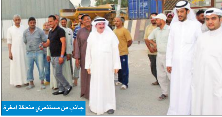
جانب من مستثمري منطقة أمغرة

وأضاف أن المنطقة لا يوجد بها خدمات إنسانية من نقطة أمنية تابعة لوزارة الداخلية أو