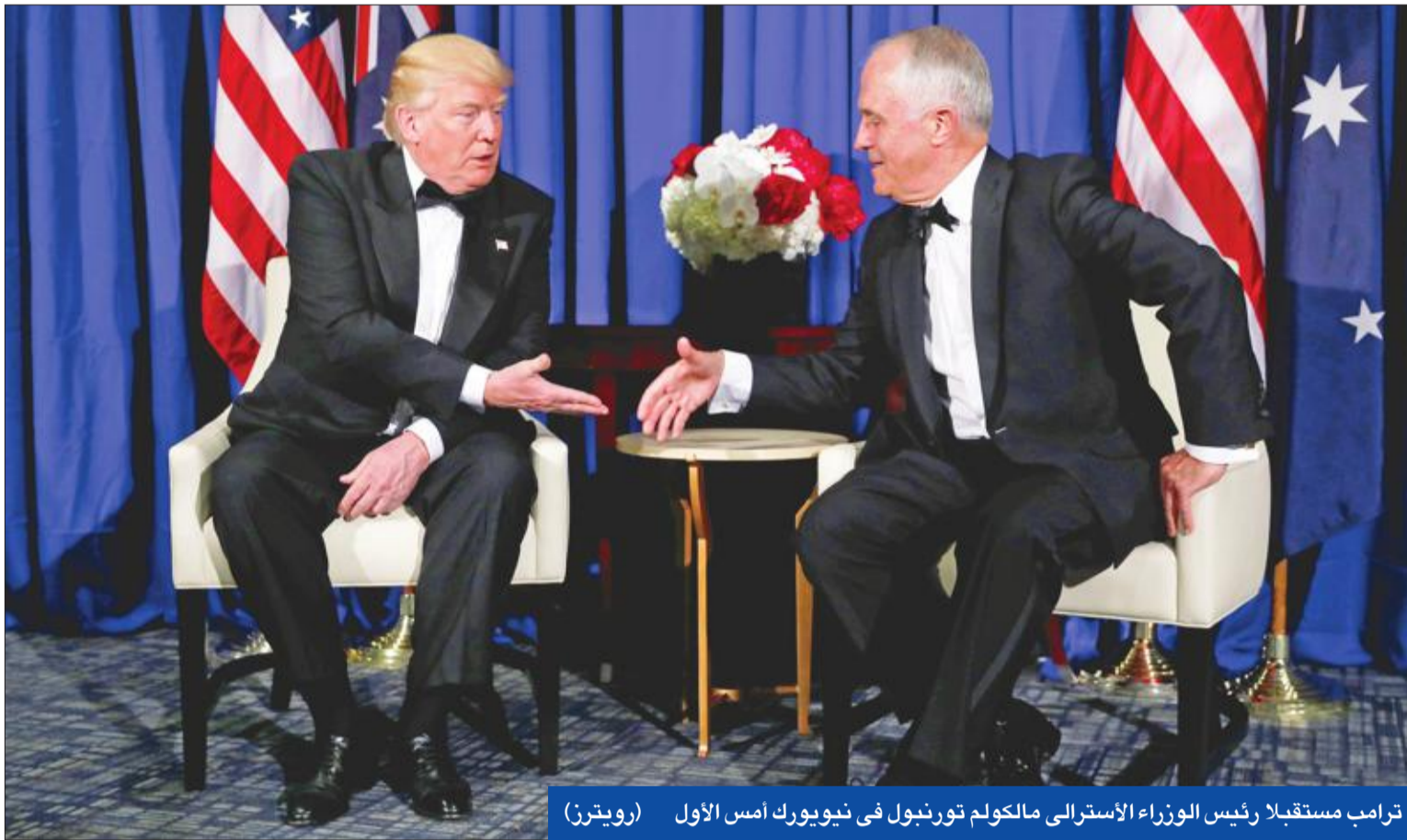
ترامب مستقبلا رئيس الوزراء الأسترالي مالكولم تورنبول في نيويورك أمس الأول

الرئيس الأميركي نجح في محو «أوباماكير» ومرشحه لـ سلاح البر» يعتذر