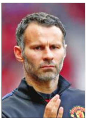
لكنني كنت أشعر بسوء شديد حين أكون مصاباً أو في حالة بدنية غير جيدة»

أبقي نفسي منشغلاً وفعلت ذلك من خلال الذهاب لكأس أمم أوروبا في فرنسا كممثل تلفزيوني ثم للهند لبطولة كرة قدم صالات دعوني إليها» وأضاف: «اشتركت أيضاً في صالة ألعاب رياضية لأول مرة في حياتي لأنها تقع على بعد نصف ساعة فقط من منزلي جعل الأمر يتحول إلى جزء من روتيني اليومي»