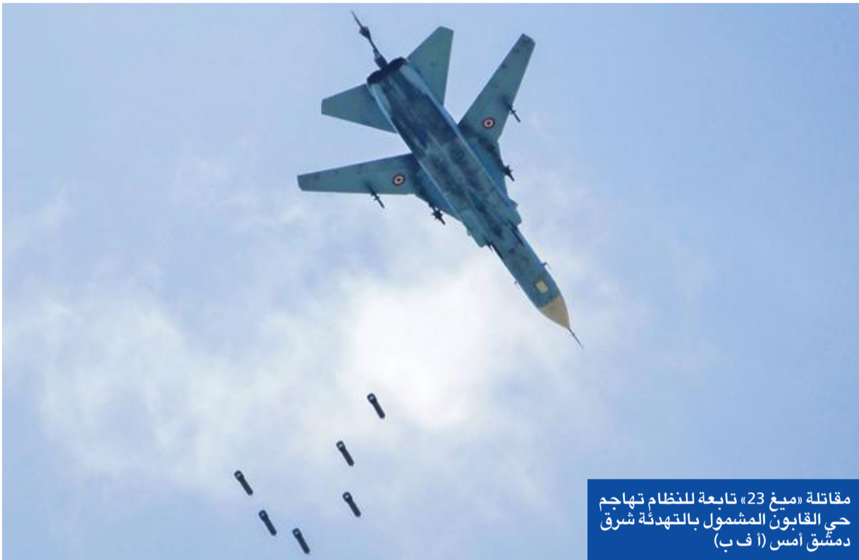
مقاتلة «ميج 23» تابعة للنظام تهاجم حي القابون المشمول بالتهمة شرق دمشق أمس

● وفد أستانة لم ير الخرائط و«الهيئة» تحذر من الغموض ● النظام يسيطر على القلمون الغربي ويصله بالزبداني