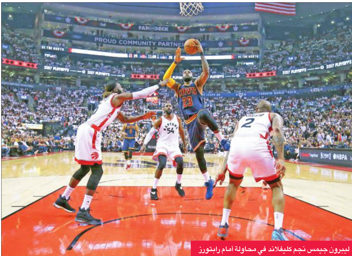
ليبرون جيمس نجم كليفلاند في محاولة أمام رايتورز

ونقطة و10 متابعات و7 تمريرات حاسمة، فيما أضاف المخضرم الإسباني باو غاسول 12 نقطة و9 متابعات. وسجل أولدريدج 12 محاولة من أصل 20 تحت السلة، أي أفضل بكثير من النقاط الأربع التي سجلها خلال فوز هيوستن الكبير في المباراة الأولى. وتقام المباراة الرابعة اليوم في هيوستن. ولم ينجح الثلاثي البديل في روكس البرازيلي نيني هيلاريو وأريك غوردون ولو وليامس في تسجيل أكثر من 3 سلات في 19 محاولة. وسجل هيوستن بنسبة 36 في المئة فقط مقابل 45 في المئة لسبيرز.