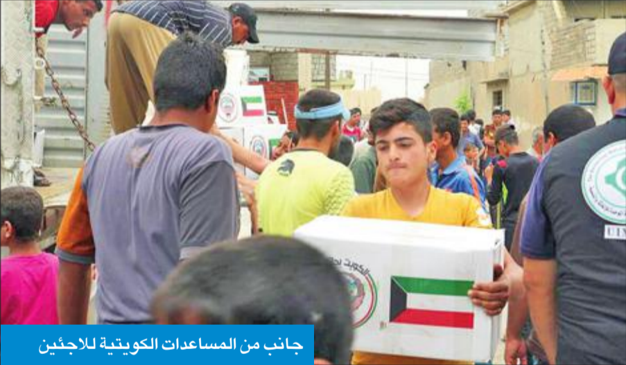
جانب من المساعدات الكويتية للاجئين

النزاع بما في ذلك كممول رئيس لمخيم الخزرتي الكبير للاجئين السوريين في الأردن، لتختبئ بقيادة سمو أمير البلاد الشيخ صباح الأحمد ريادتها العالمية المتحددة، مضيفاً أن تضافر الوقت الذي سعت فيه دول الخليج الأخرى لتكون مراكز مالية أو سياحية نجحت الكويت لتصبح رائدة عالمياً في العمل الخيري، وعملت بجد لتشجيع البلدان الأخرى على تكثيف جهودها في المجال الإنساني. وأشار التقرير بجهود الكويت في حشد المجتمع الدولي في مؤتمرات المانحين لدعم الوضع الإنساني في سورية التي استضافتها في أعوام 2013 و 2014 و 2015 إضافة إلى مؤتمر لندن العام الماضي برئاسة مشتركة بينها وبين بريطانيا وألمانيا والنرويج والأمم المتحدة والتي أسفرت عن جمع مبالغ قياسية.