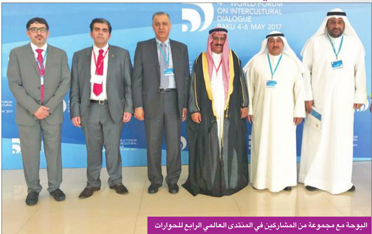
اليوحة مع مجموعة من المشاركين في المنتدى العالمي الرابع للحوارات

اليوحة ينعي عبدالله محارب مستذكراً بصماته في الثقافة والأدب والتنمية البشرية