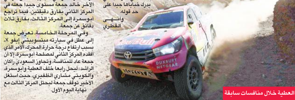
العطية خلال منافسات سابقة

وفرض سيطرته على مراحل اليوم الأول من الرالي،