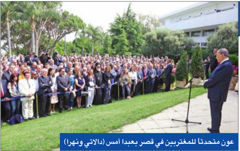
عون متحدثاً للمغتربين في قصر بعبدوا أمس