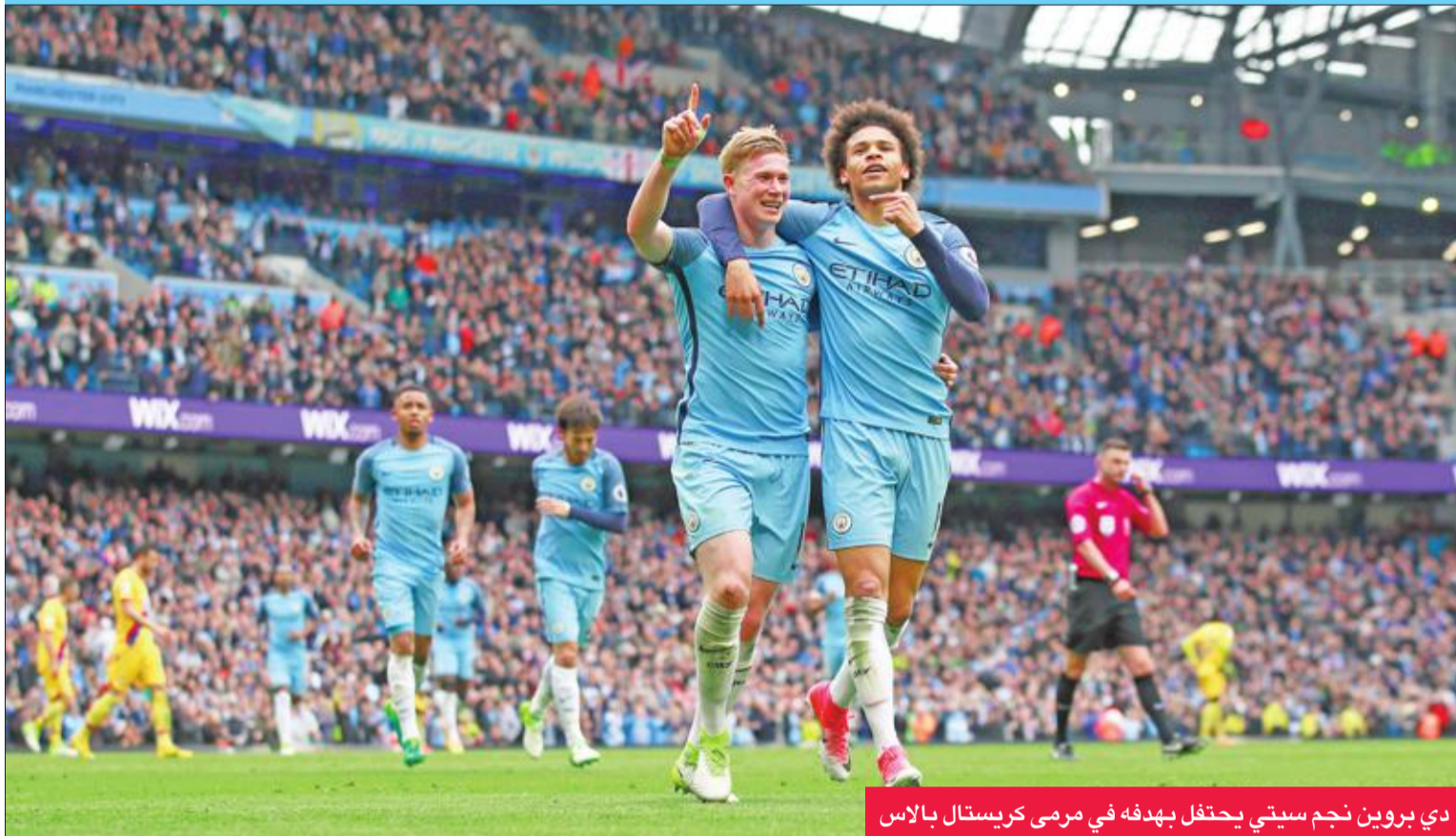
دي بروين نجم سيتي يحتفل بهدفه في مرمى كريستال بالاس

عاد مانشستر سيتي إلى سكة الانتصارات وعزز حظه في المشاركة بدوري أبطال أوروبا الموسم المقبل بفوزه الكبير على ضيفه كريستال بالاس 5 - صفر أمس في المرحلة السادسة والثلاثين من الدوري الإنجليزي لكرة القدم. ودخل فريق المدرب الإسباني جوسيب غوارديولا إلى اللقاء وهو يبحث عن استعادة توازنه بعد اكتفائه بالتعادل في مباراته السابقة على أرضه مع جاره اللدود مانشستر يونايتد (صفر-صفر)، منافسه على التأهل إلى دوري الأبطال، ثم مع ضيفه ميدلزبره (2-2).