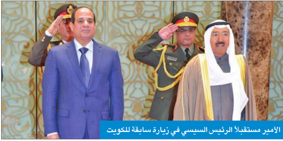
الأمير مستقبلاً الرئيس السيسي في زيارة سابقة للكويت

يصل إلى البلاد اليوم رئيس جمهورية مصر العربية الشقيقة عبدالفتاح السيسي والوفد الرسمي المرافق له، في زيارة رسمية للبلاد تستغرق يومين يجري خلالها مباحثات رسمية مع صاحب السمو أمير البلاد الشيخ صباح الأحمد، حول العلاقات الثنائية بين البلدين والقضايا الإقليمية والدولية ذات الاهتمام المشترك.