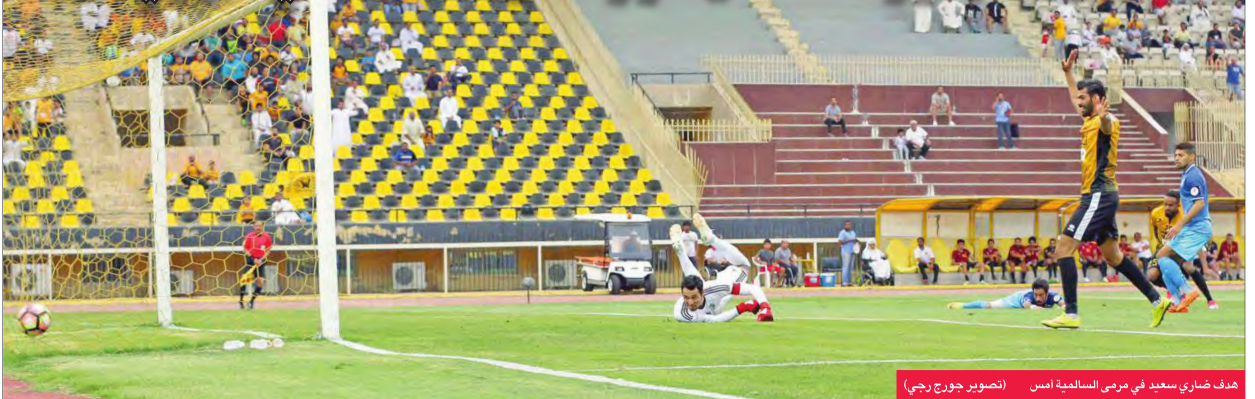
هدف ضاري سعيد في مرمى السالمية أمس