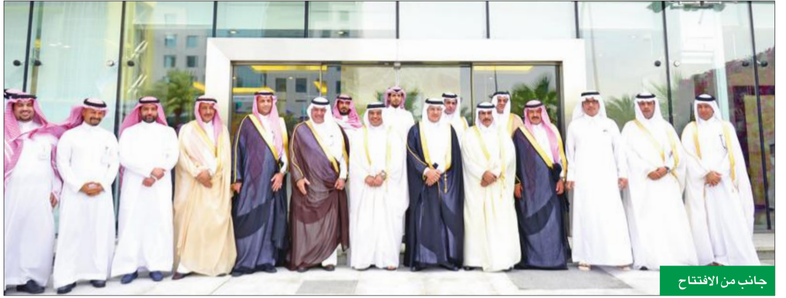
جانب من الافتتاح

يأتي دخول المجموعة السعودي ضمن خطة استراتيجية وضعتها لتكوين موجودة في الأسواق التي تتمتع بميزة تنافسية عالية، خصوصاً أن المملكة من أقوى اقتصاداً حول العالم.