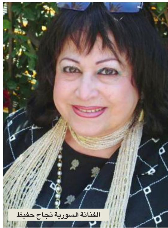
الفنانة السورية نجاح حفيظ

رحلت الفنانة السورية نجاح حفيظ، التي عرفها الجمهور باسمها الدرامي «فظومة»، أو «فظوم حبيب بيص»، أمس، إثر أزمة قلبية، حسب بيان نشرته نقابة فناني سورية فرع دمشق، على موقعها الإلكتروني. وعرفت الفنانة الراحلة باسم «فظومة»، الذي اشتهرت به في أعمالها الدرامية، حيث كانت المطلة التي لا تتبال «غوار الطوشة» الغرام، والذي يؤدي دوره الفنان دريد لحام. وكان أشهر ظهور لاسم «فظومة» في أغنية «فظوم فظوم فظومة، خبيني بيت المونة» التي غناها «غوار الطوشة» دريد لحام، لها، وهو في السجن، في مسلسل «صح النوم» المعروف سوريا وعربياً. وأشار البيان إلى أن الفنانة رحلت أمس بمستشفى ابن النفيس بدمشق، وسينعج جثمانها اليوم. ويعد الفضل في اختيار الراحلة لأداء دور «فظوم حبيب بيص» الذي اشتهرت به، إلى المخرج الراحل خلدون المالح. وكانت الراحلة عبرت، في تقارير إعلامية، عن بالغ حزنها من تجاهل نقابة الفنانين لها ولتاريخها الفني، منتقدة التثنية التي أعمت القائمين على هذه النقابة، على حد تعبيرها. يشار إلى أن الفنانة الراحلة لم تنجب، لكنها تعتبر أي طفل ابنها. وكانت حفيظ تعتبر أن أقرب مسلسل إلى قلبها هو مسلسل «البقة السوداء» الذي أدت فيه دور أم لولدين. يشار إلى أن الفنانة الراحلة من مواليد مدينة دمشق عام 1941، وبدأت التمثيل عام 1966، وأبرز أعمالها صح النوم وحمام الهنا، وهجرة القلوب إلى القلوب ونهاية رجل شجاع وملح وسكر ويوميات أبو عنتر. وظهرت في بعض الأفلام، منها «انت عمري»، وعندما تغيب الزوجات، وأعمال أخرى درامية وسينمائية مختلفة.