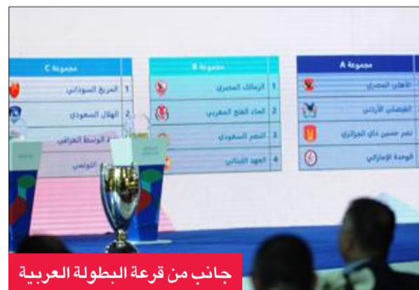
جانب من قرعة البطولة العربية

وخصصت اللجنة المنظمة خمسة فنادق بسعة 1000 غرفة للوفود والأندية المشاركة في البطولة، إضافة إلى ترتيبات واتفاقيات أولية مع عدة شركات للطيران والمواصلات، وقامت بحجز مبدئي لـ2 ألف غرفة فندقية لتقديم عروض خاصة للجمهور الرياضية خلال فترة البطولة التي من المتوقع أن تشهد حضوراً جماهيرياً كبيراً.