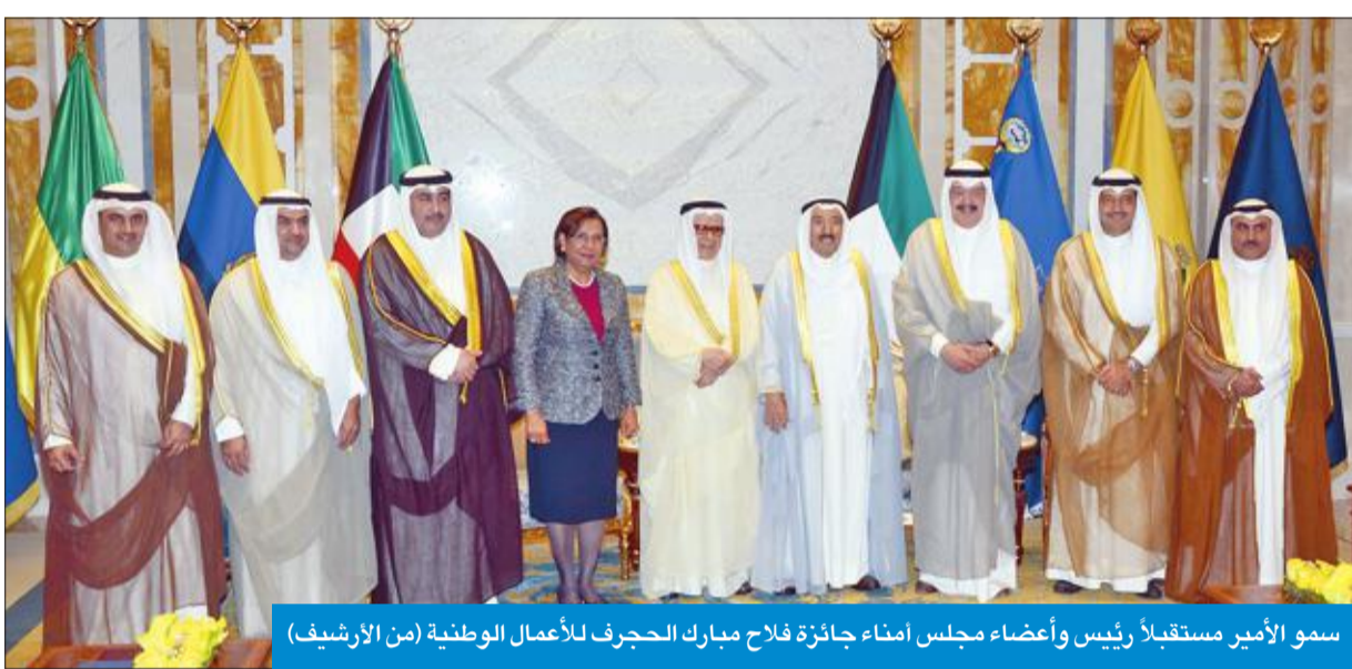
سمو الأمير مستقبلاً رئيس وأعضاء مجلس أمناء جائزة فلاح مبارك الحجرف للأعمال الوطنية