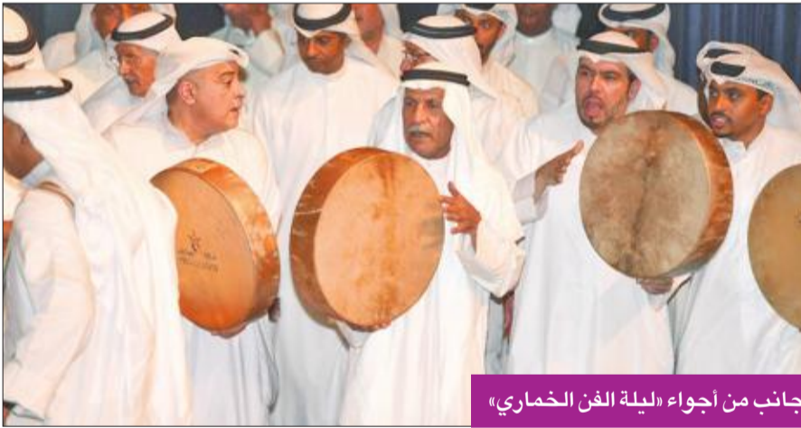
جانب من أجواء «ليلة الفن الخماري»

والمنظر الزين / ماي وظلي/ ما أحلى قوامه لا مشى مابين نختين / وأقبل يهلي، وتفنن في تقديم الوان مختلفة من «الخماري»، ليقدم «إما وصل أو هجر» و«يا ذا الحمام»، و«مسكين قلب برا».