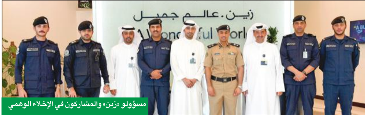
مسؤولو «زين» والمشاركون في الإخلاء الوهمي

موظفها في جميع الحالات، بالإضافة إلى استضافة ممثلي الوزارتين لعقد الندوات التوعوية والمشاركة في الحملات الصحية كحملات التطعيم والتبرع بالدم وغيرها، حيث تضع «زين» العنصر البشري في مقدمة أولوياتها، إيماناً منها بأن قدرة أي مؤسسة على التفاسر قائمة على تطوير موظفيها والاهتمام بمتطلباتهم واحتياجاتهم.