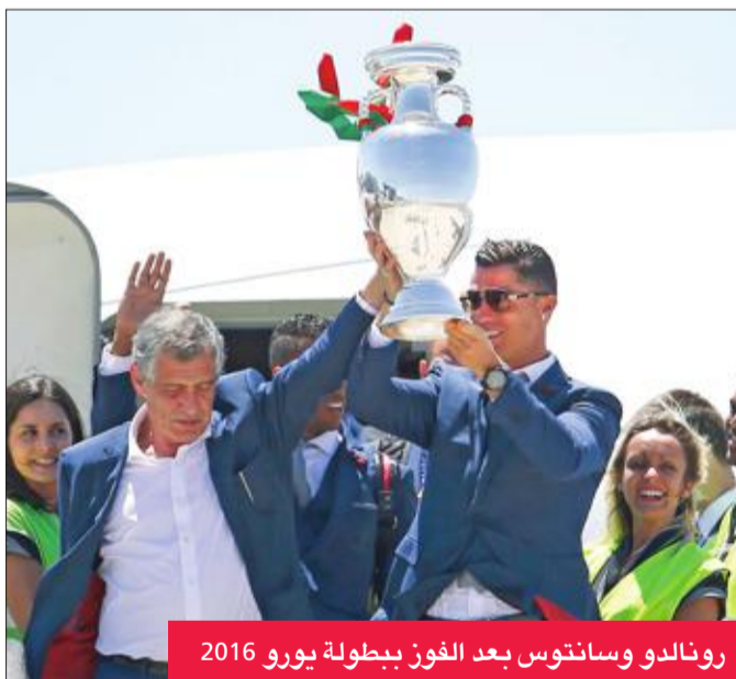
رونالدو وسانتوس بعد الفوز ببطولة يورو 2016

أعرب المدير الفني للمنتخب البرتغالي فرناندو سانتوس، أمس الأول، عن أسفه لعدم حصول مواطنه كريستيانو رونالدو على التقدير يستحقه في بلاده ومواصلة التشكيك فيه. وقال سانتوس للصحافيين «أعجز عن تفهم كيف لا يقدر البرتغاليون أحياناً كريستيانو بالصورة المطلوبة. خلال تصفيات اليورو كانت هناك انتقادات، وتحدث البعض أنه لا يسجل، وحينما بدأ هز الشباك قالوا إنه يحجز الأهداف بأي طريقة».