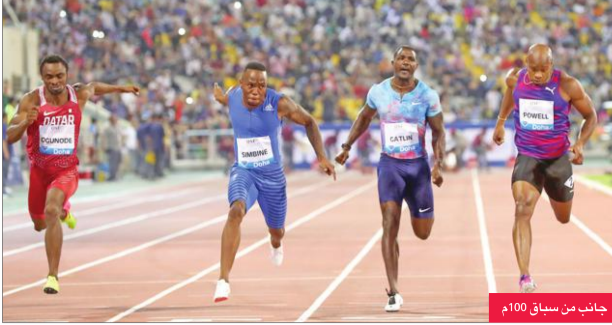
جانب من سباق 100م

إلى علو 4 أمتار و80 سنتيمترا، بفارق 5 سنتيمترات عن موريس و15 سنتيمترا عن سيلفا.