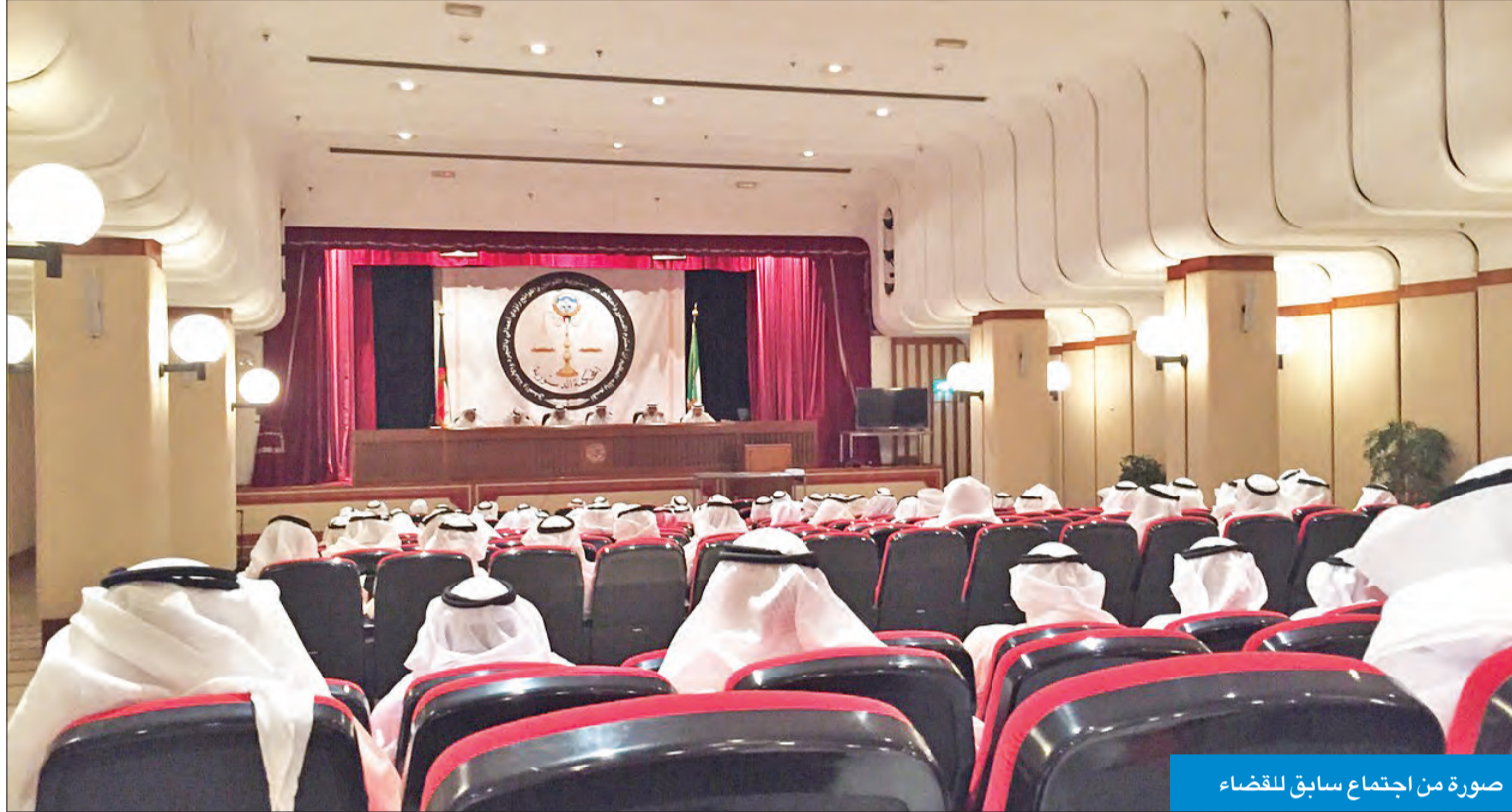
صورة من اجتماع سابق للقضاة

وزير المالية مسؤول عن الشؤون المالية عموماً وعن إعداد الميزانيات والرقابة على تنفيذها خصوصاً