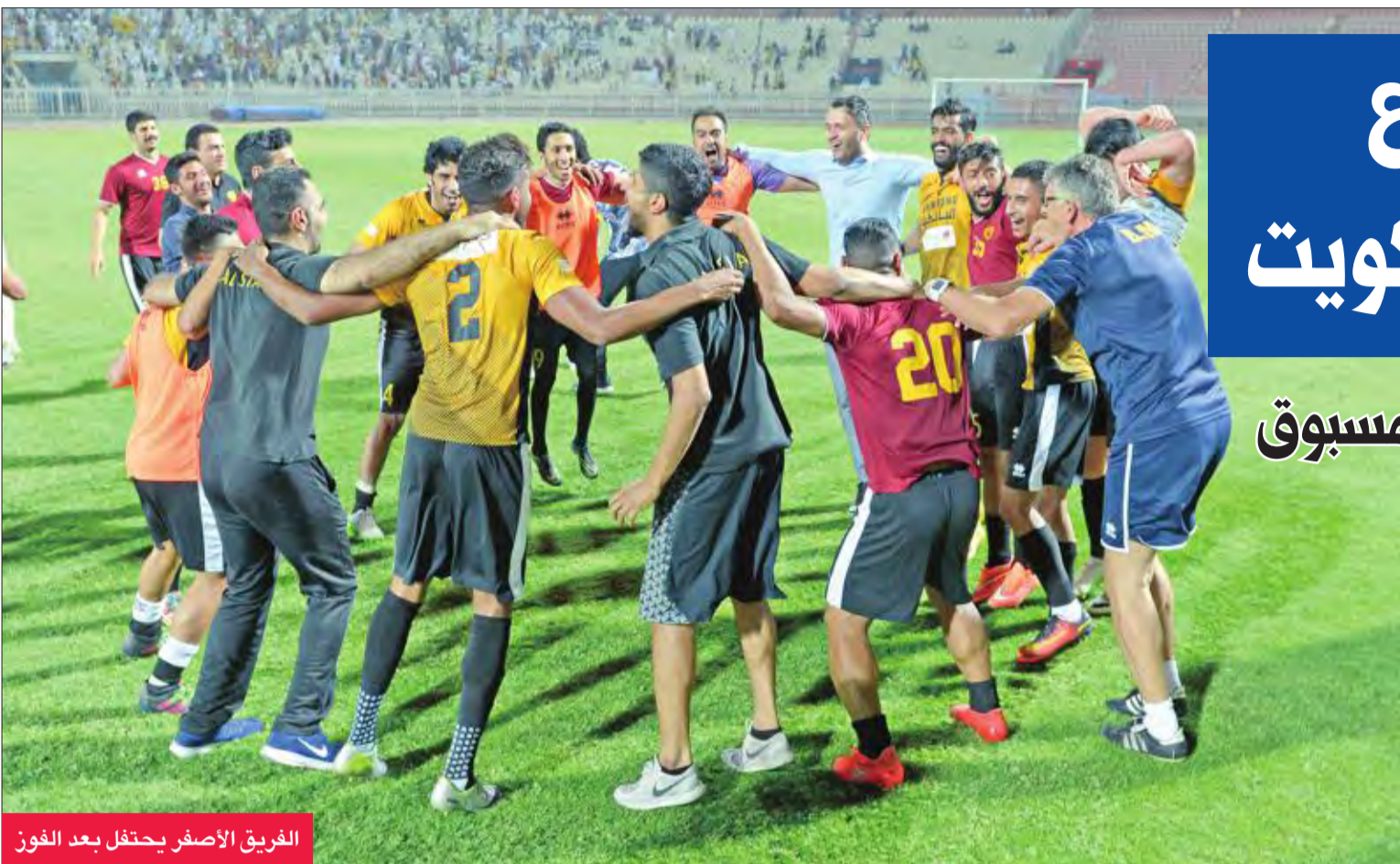
الفريق الأصفر يحتفل بعد الفوز

اشتعل الصراع على لقب دوري قيفا لكرة القدم، بفوز القادسية على الكويت بثلاثة أهداف لهدف في الجملة 29، لتفرض الحسابات نفسها بقوة على الجملة الأخيرة التي ستقام بعد غد الخميس، بعد أن استرد الأصفر القمة مؤقتاً.