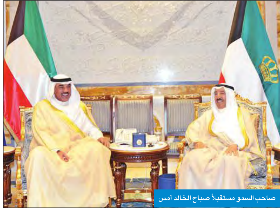
صاحب السمو مستقبلاً صباح الخالد امس

استقبل سمو أمير البلاد الشيخ صباح الأحمد، بقصر بيان صباح أمس، سمو ولي العهد الشيخ نواف الأحمد، كما استقبل سموه رئيس مجلس الأمة مرزوق الغانم. واستقبل سموه كذلك رئيس مجلس الوزراء سمو الشيخ جابر المبارك، ثم النائب الأول لرئيس مجلس الوزراء وزير الخارجية الشيخ صباح الخالد.