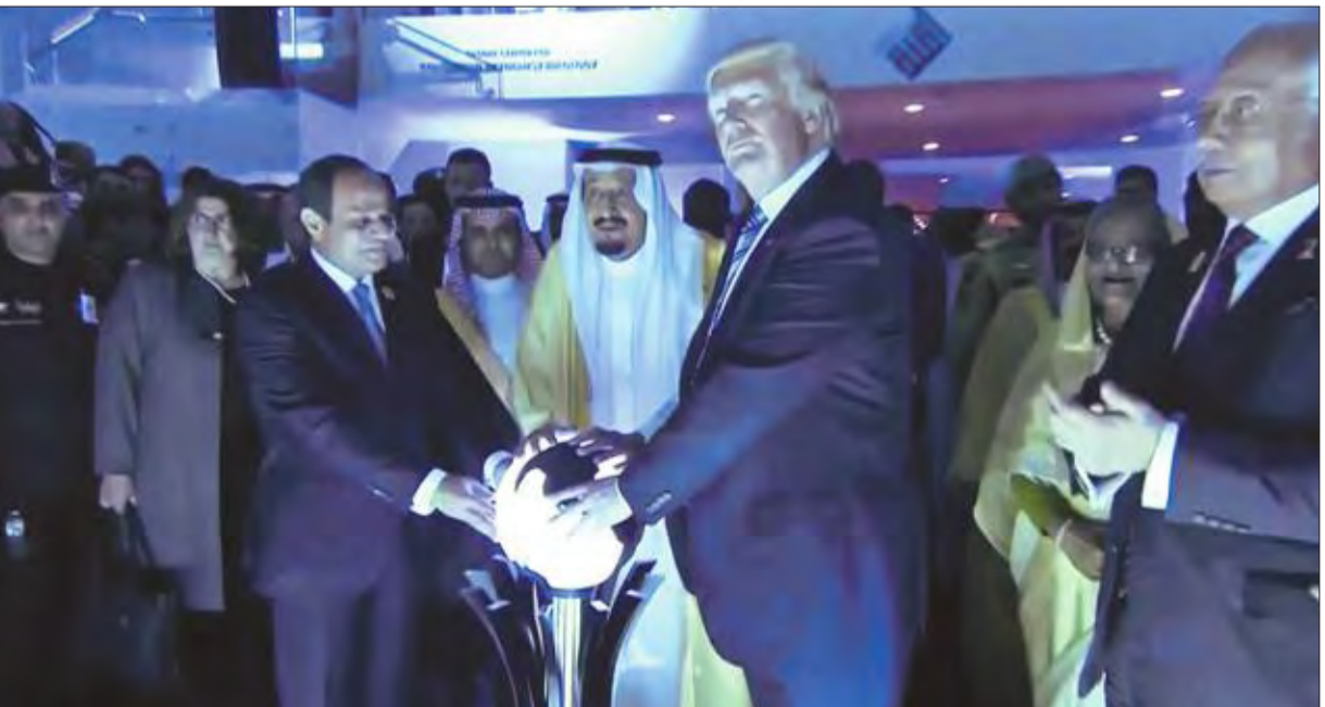
الملك سلمان وترامب والسيسي خلال افتتاح مركز «اعتدال» أمس الأول

في مجال مكافحة الخطاب الإعلامي المتطرف على كل وسائل الإعلام التقليدية والفضاء الإلكتروني. ويعمل المركز بمختلف اللغات واللهجات الأكثر استخداماً لدى المتطرفين، كما يجري تطوير نماذج تحليلية متقدمة لتحديد مواقع منصات الإعلام الرقمي، وتسلط الضوء على البؤر المتطرفة، والمصادر السرية الخاصة بأنشطة الاستقطاب والتجنيد.