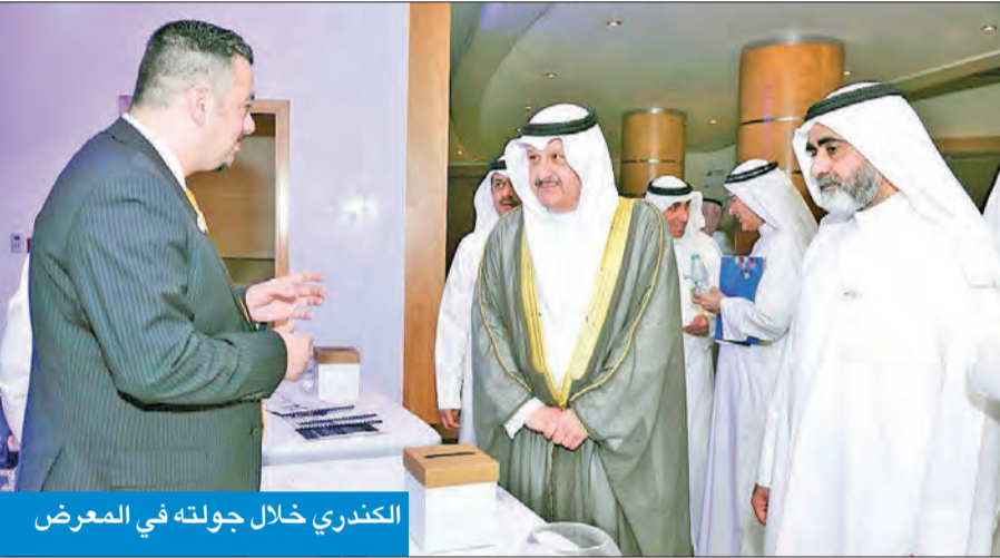
الكندري خلال جولته في المعرض

أكد نائب رئيس مجلس الأمة عيسى الكندري، أن الشباب الكويتيين يمتلكون الموهبة والحس الإبداعي ما يؤهلهم لخوض المنافسات الدولية، معتبراً إياهم ثروة الوطن الحقيقية، ومشيداً بجهود العاملين في جامعة الكويت. جاء ذلك خلال تنظيم جامعة الكويت عرضاً للمشاريع الفائزة في تحدي الابتكار الوطني وريادة الأعمال، برعاية رئيس مجلس الأمة مرزوق الغانم، الذي حضر نيابة عنه نائب رئيس مجلس الأمة عيسى الكندري، أمس الأول، في قاعة سلوى بفندق المارينا في السالمية، بمشاركة جامعات ومؤسسات تعليمية في الكويت، وقد شهد العرض مدير الجامعة د. حسين الأنصاري، ورؤساء ومدراء الجامعات والكليات والمؤسسات التعليمية، وعدد من قياديي الجامعة والجامعات والكليات المشاركة. وقال الكندري