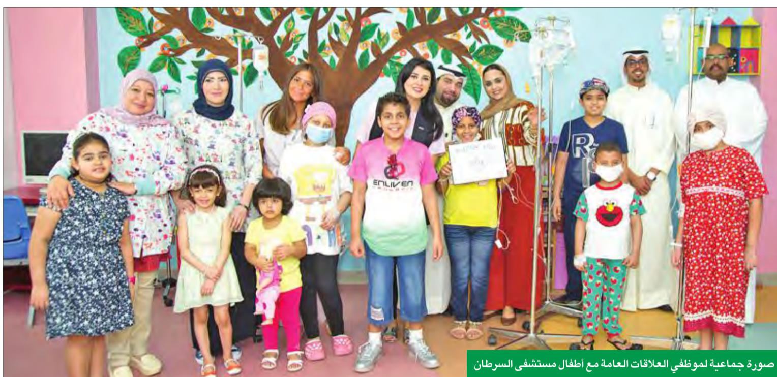
صورة جماعية لموظفي العلاقات العامة مع أطفال مستشفى السرطان

حملة مساعدة الأسر ذات الدخل الضعيف في تحسين معيشتها خطوة إضافية لتعزيز مساهمات «الوطني» هذا العام