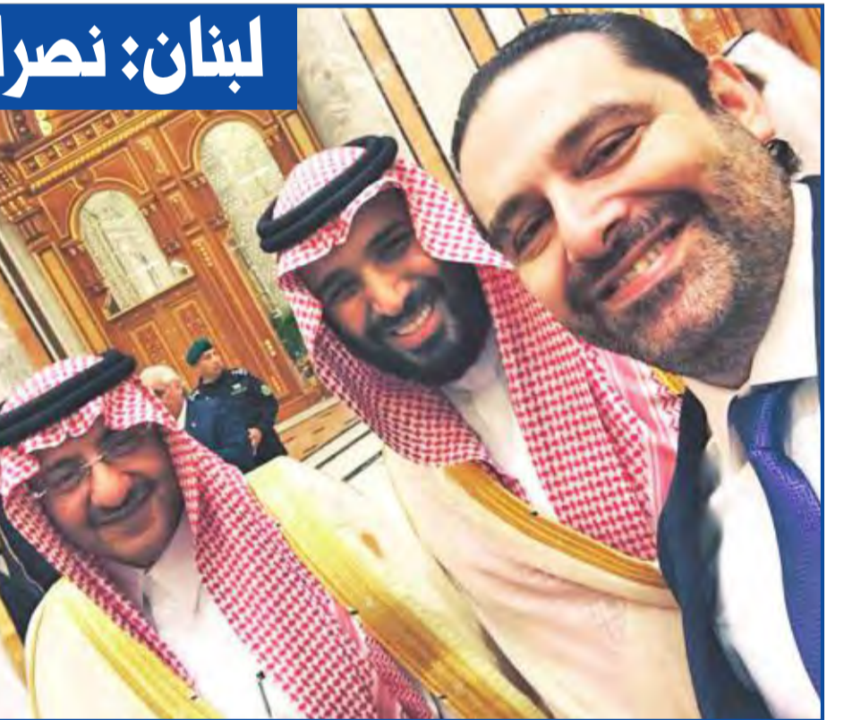
الحريزي يلتقط سيلفي مع ولي العهد السعودي الأمير محمد بن نايف وولي ولي العهد الأمير محمد بن سلمان خلال قمة الرياض مساء أمس الأول

وتنحج الأ نظار فعليا إلى موقف «حزب الله» العلني والرسمي من حديث باسيل ومن القمة بشكل عام، مع إطلالة الأمين العام للحزب السيد حسن نصرالله، بعد غد، في مناسبة عيد «المقاومة والتحرير» خلال مهرجان يقميه الحزب في مدينة الهرمل البلقاعية. وتوقعت مصادر متابعة أن ينطرق نصرالله إلى «المستجدات، وأبرزها مقررات قمة الرياض، والإجراءات المتعلقة بالإرهاب، بعد تصنيف رئيس المجلس التنفيذي في الحزب السيد هاشم صفي الدين على لأخعة الإرهاب الأميركي والسعودي على حد سواء». ورجحت المصادر أن «تكون كلمة نصرالله تصعيدية وشبهية