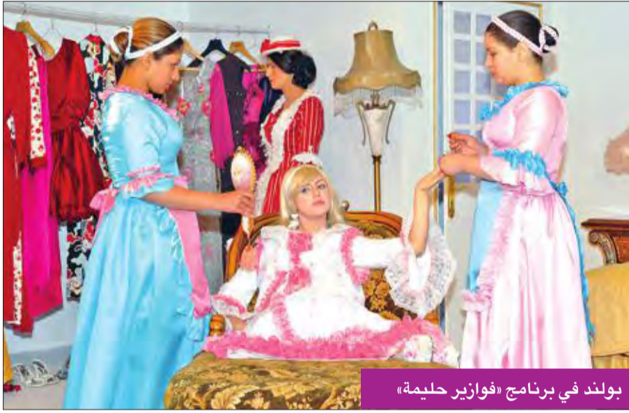
بولند في برنامج «فوايز حليمة»

وأعربت حليمة عن سعادتها بهذا البرنامج وبالعودة إلى أجواء المسابقات الرمضانية، وقالت: "بالفعل مشتاقة للقاء الجمهور على الهواء مباشرة، حيث أشعر بسعادة كبيرة،