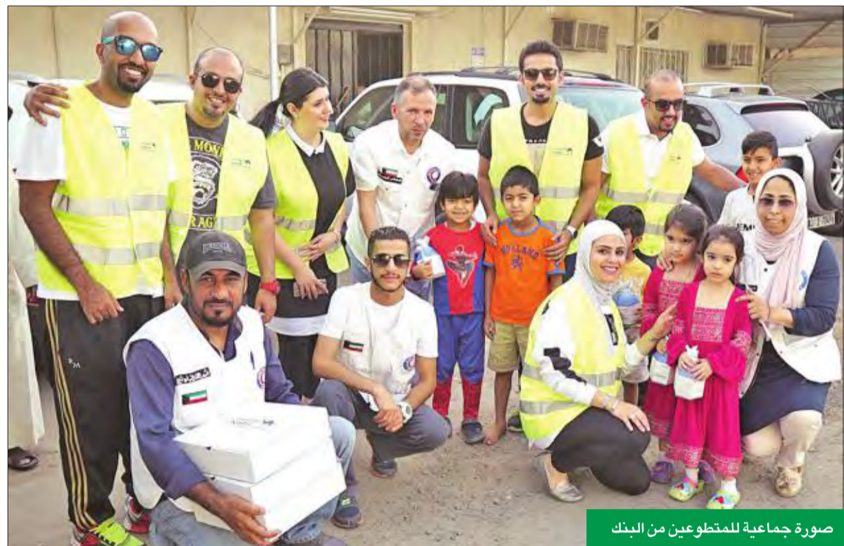
صورة جماعية للمتطوعين من البنك

أكثر من 20 جولة ميدانية تتوزع بين زيارة المستشفيات والمرافق العامة والمناطق الحيوية والمساجد لتوزيع وجبات الإفطار