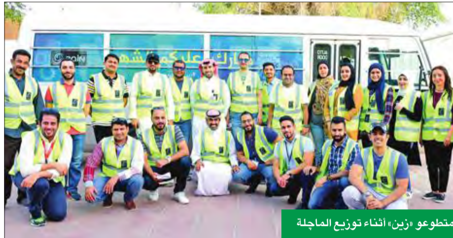
متطوعو «زين» أثناء توزيع الماجة

هذا الشهر من معان وقيم تعزز ثقافة العطاء والبذل لدى أطراف المجتمع المختلفة. وذكرت الشركة أنها دائماً ما كانت تتبنى نهجاً واضحاً في تحقيق التزاماتها الاجتماعية، وهو النهج الذي ينص على إعادة الروح الإنسانية إلى مجال الأعمال التجارية، وخلق أجواء مفعمة بالمودة والترابط داخل نسج المجتمع، من خلال التزامها الكامل بمبدأ المسؤولية الاجتماعية.