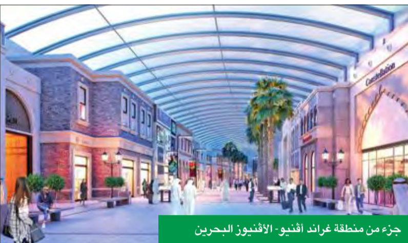
جزء من منطقة غراند أفنيو - الأفنيوز البحرين

بالمجمع، ما سيجعل من الأفنيوز - البحرين الوجهة المفضلة للمواطنين والسياح ورجال الأعمال من منطقة الخليج العربي وغيرها من الدول. ويتميز الأفنيوز بتصميم فريد، يعتمد على تصميم مناطق مختلفة لكل منها أجواءه وتجربته التسويقية المختلفة، والتي تلي طلائع الزوار من مختلف الفئات والشرائح المجتمعية.