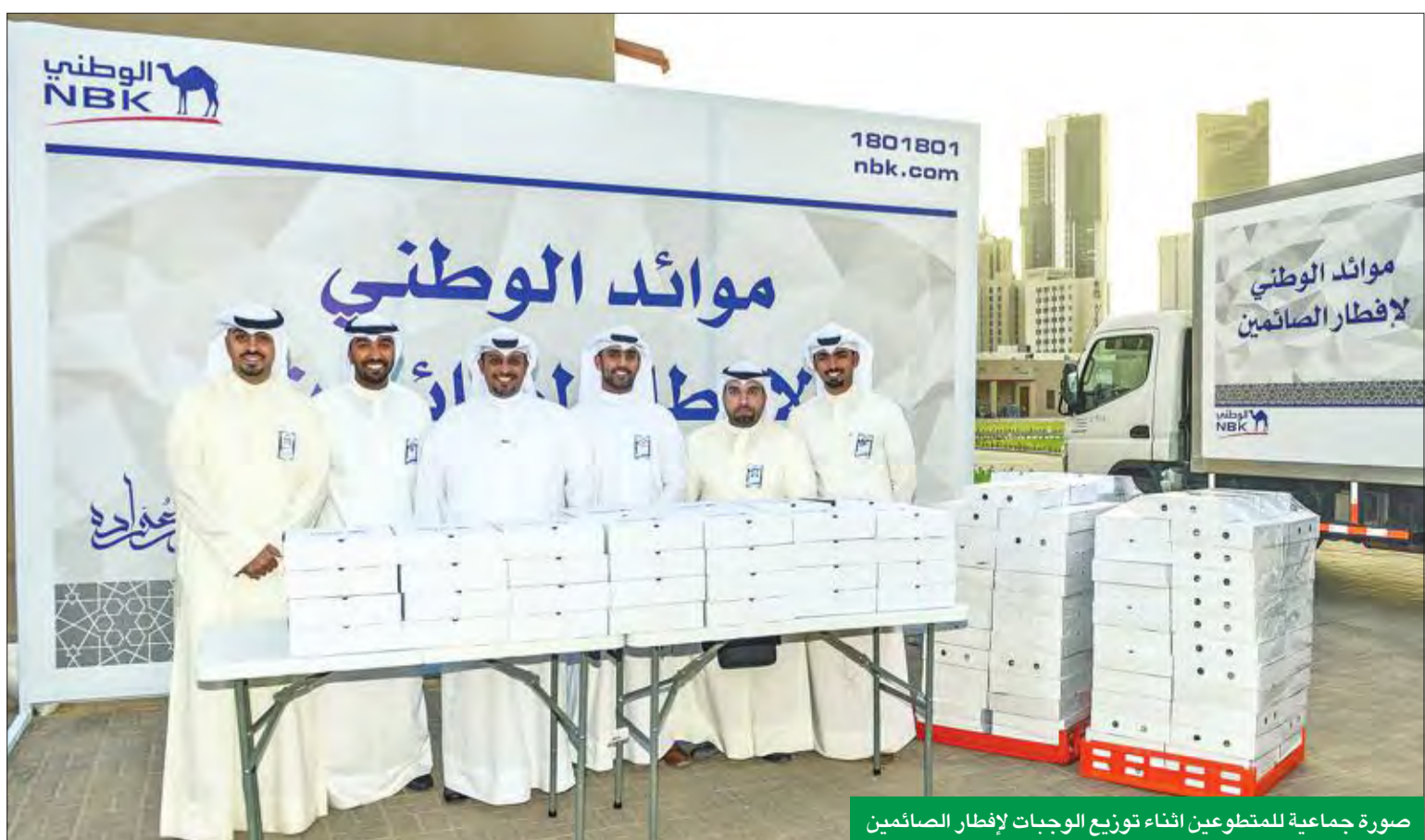
صورة جماعية للمتطوعين أثناء توزيع الوجبات لإفطار الصائمين