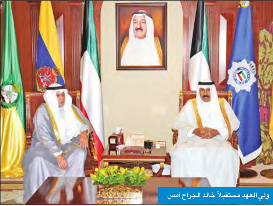
ولي العهد مستقبلاً خالد الجراح امس

استقبل سمو ولي العهد الشيخ نواف الأحمد صباح أمس النائب الأول لرئيس مجلس الوزراء وزير الخارجية الشيخ صباح الخالد، ثم استقبل نائب رئيس مجلس الوزراء وزير الدفاع الشيخ محمد الخالد، فنائب رئيس مجلس الوزراء وزير الداخلية الشيخ خالد الجراح. واستقبل سموه وزير الدولة لشؤون مجلس الوزراء وزير الإعلام بالوكالة الشيخ محمد العبدالله، ثم رئيس جهاز الامن الوطني الشيخ فامر العلي.