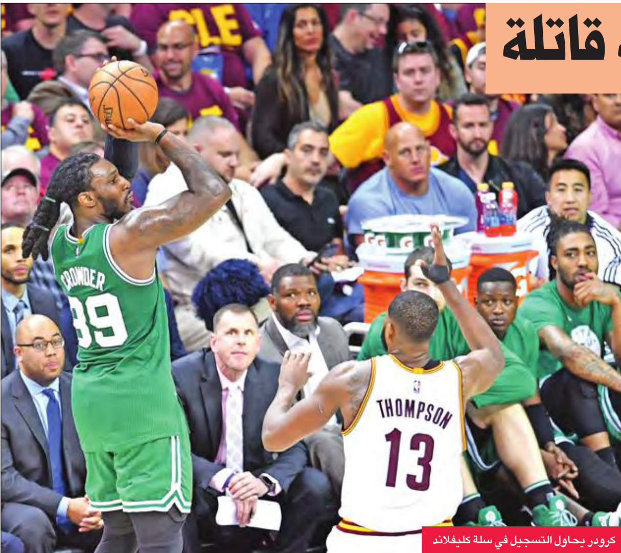
كزور يحاول التسجيل في سلة كليفلاند