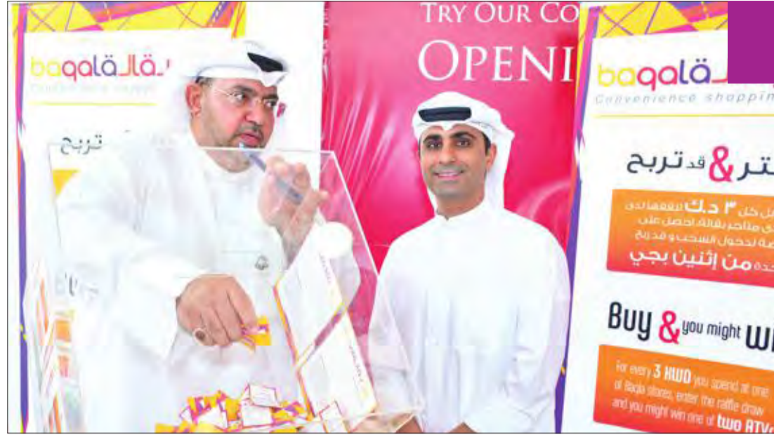
أشكناني خلال عملية سحب الأسماء الفائزة