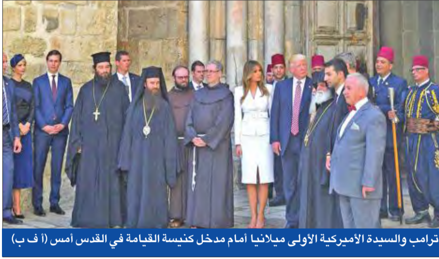
ترامب والسيدة الأميركية الأولى ميلانيا أمام مدخل كنيسة القيامة في القدس أمس