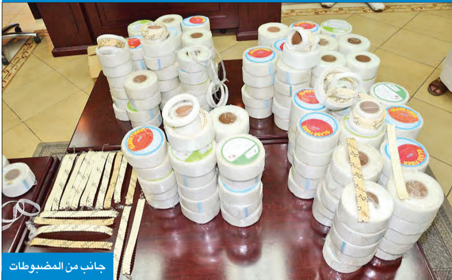
جانب من المضبوطات

أحبط رجال إدارة جمارك مراقبة التفتيش، بالإدارة العامة للجمارك، بالتعاون والتنسيق مع الإدارة العامة لمكافحة المخدرات، محاولة تهريب 90 ألف حبة مخدرة قادمة من لبنان عن طريق الشحن الجوي، وتمكن رجال مكافحة المخدرات من ضبط وافد سوري حضر لتسلم الشحنة المخفية داخل رولات تستخدم في أعمال الديكور. وفي التفاصيل التي رواها مصدر جمركي لـ «الجريدة» أن رجال الجمارك العاملين في إدارة مراقبة التفتيش اشتبهوا بثلاثة طرود بريديّة قادمة من لبنان، ومسجلة في أوراق الشحن الجمركي على أساس أنها رولات تستخدم في أعمال الديكور، فأخطر رجال الجمارك الإدارة العامة لمكافحة المخدرات بالشكوك التي تساورهم تجاه الطرود. وأضاف المصدر أن رجال الجمارك ورجال المباحث فتشوا الطرود، وتبين أنها تحتوي على حبوب مخدرة مخبأة بطريقة سرية، فاعادوا على وضعها السابق، وظلوا وعلى حبوب مخدرة مخبأة بطريقة سرية، فاعادوا الذي يريد تسلمها، ومن ثم حضر وافد سوري لتسلم الشحنة، وألقي القبض عليه، واعترف بأنه جلب الحبوب المخدرة التي تم إحصاؤها بـ 90 ألف حبة لاتجار بها.