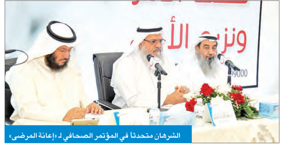
الشرهان متحدثاً في المؤتمر الصحفي لـ «إعانة المرضى»

أطلقت حملتها الرمضانية ووقعت اتفاقاً لتوفير الأدوية للفلسطينيين