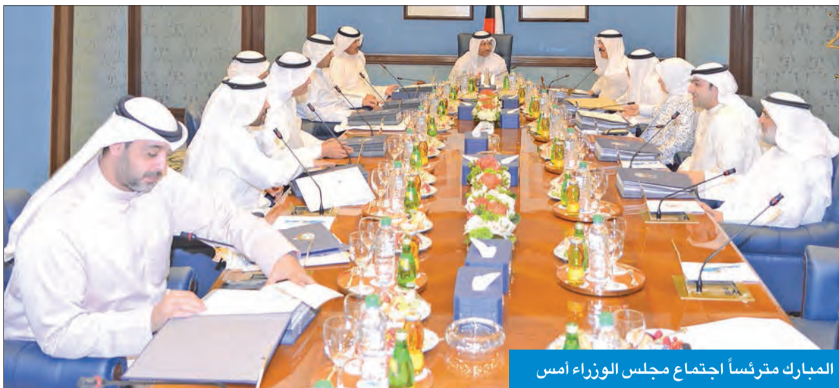
المبارك مترئساً اجتماع مجلس الوزراء أمس

هنا الشعب الكويتي بحلول رمضان وروحاني بمناسبة إعادة انتخابه رئيساً لفترة جديدة