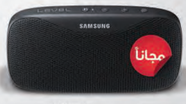
SAMSUNG Level BOX