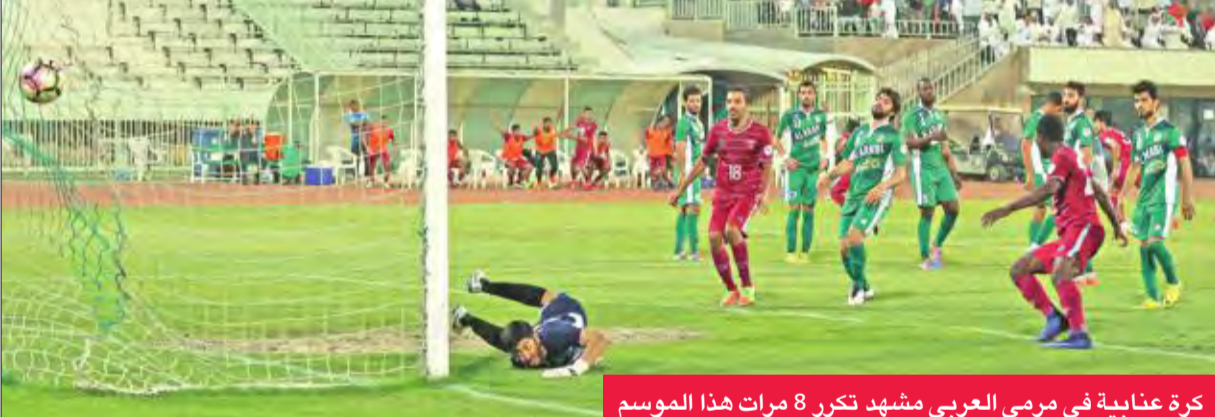
كرة عنابية في مرمى العربي مشهد تكرر 8 مرات هذا الموسم

الانتصار، نظير ما قدمه من مستوى وتركيز عال، مضيفاً: "قدمنا مباراة جيدة على المستوى الفني، لكن التوفيق كان لصالح النصر في استغلال الفرص وقتاليتها". وتابع العيكل: "لا نريد اختلاق الأعداء لكن عانينا من غيابات عديدة تزيد على 10 لاعبين لأسباب مختلفة بين إصابات واعتذارات شخصية، مبيناً أن الجهاز الفني بقيادة ناصر الشطي لا يتحمل هذه الهزيمة لاسيما أنه لعب وفق الإمكانيات المتاحة له في كل المباريات التي خاضها.