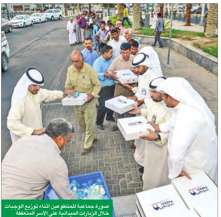
صورة جماعية للمتطوعين أثناء توزيع الوجبات خلال الزيارات الميدانية على الأسر المتعففة