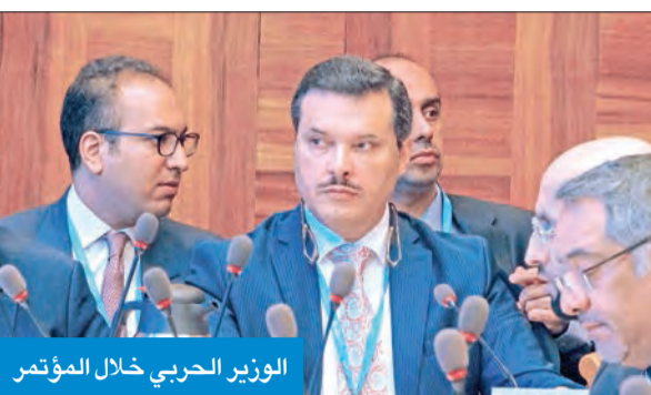
الوزير الحربي خلال المؤتمر

المجلس العالمي الاستشاري العلمي يعقد اجتماعه الأول في «دسمان»