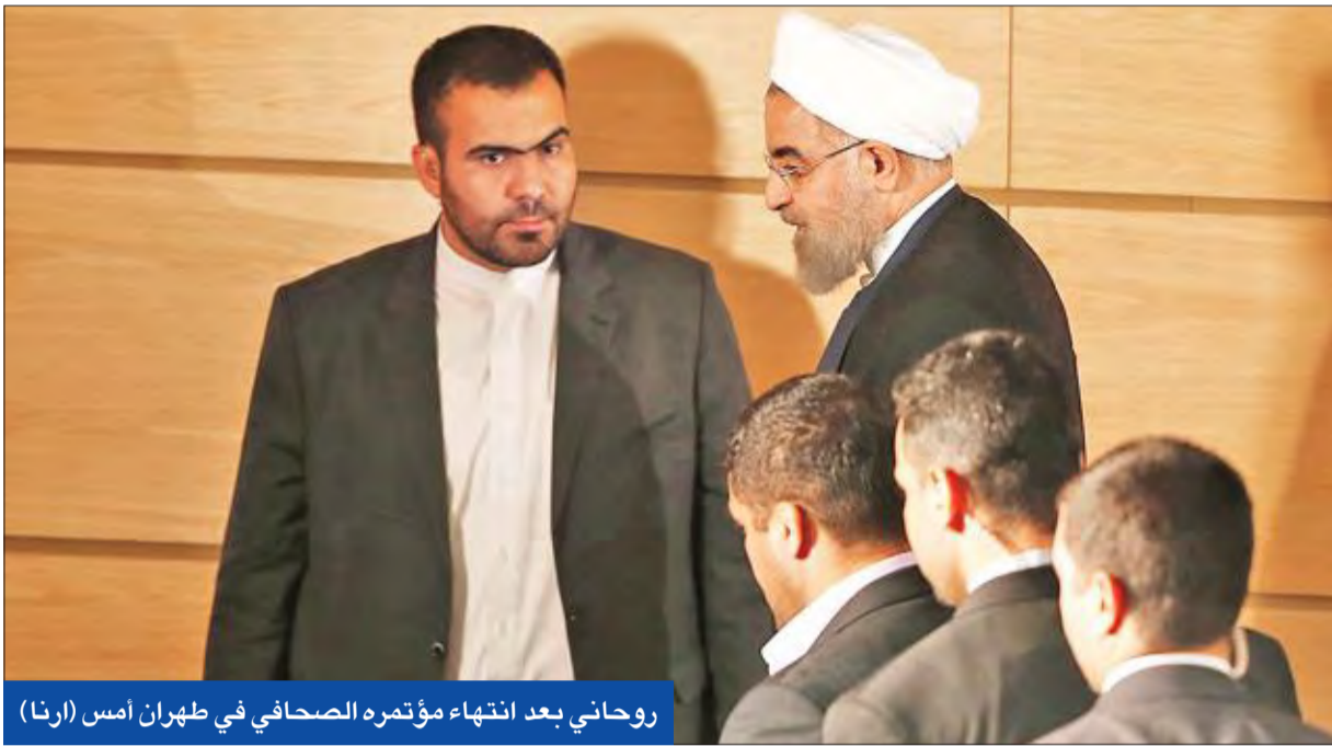
روحاني بعد انتهاء مؤتمره الصحفي في طهران أمس

الإصلاحيون يحصدون بلديات المدن الكبرى والمرأة تعزز حضورها... والأصوليون غاضبون