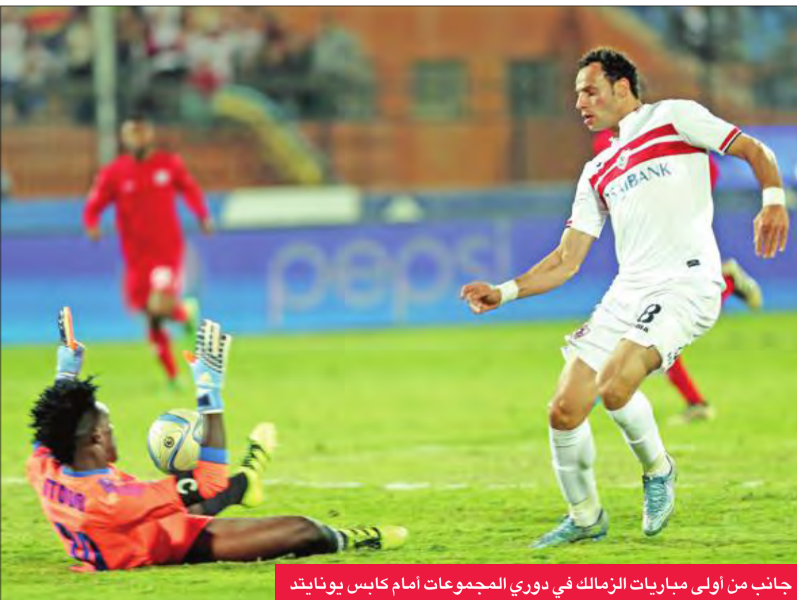
جانب من أولى مباريات الزمالك في دوري المجموعات أمام كاس يونائيد