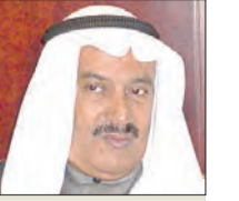
السفير يوسف عبدالله الصيدي

من المسرحيات الرائعة للاديب الإنكليزي «وليم شكسبير» التي مزج فيها بين عالم الواقع وعالم الجن والخيال، مع التأكيد على مبدأ أن القوانين الوضعية وإن كانت تهدف في مجملها لتوفير المساواة والعدالة وتنظيم الحياة والمحاكمة وحقوق وواجبات الأفراد، إلا أن بعضها قد يحمل ظلما وقسوة على بعض فئات المجتمع.