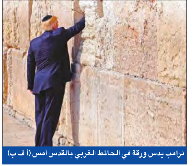
ترامب يدس ورقة في الحائط الغربي بالقدس أمس

أيضاً، وأشار الوزير الأميركي إلى أن «نقطة الإدارة الأميركية بإمكانية إعادة إطلاق عملية السلام المتعثرة، تنبع من البيئة والظروف في المنطقة بأكملها، وهذا ما يحاول الرئيس تسليط الضوء عليه خلال هذه الزيارة». وتابع أن «الدول العربية وإسرائيل والولايات المتحدة تواجه جميعها تهديداً مشتركاً هو صعود تنظيم داعش والمنظمات الإرهابية»، مضيفاً: «اعتقد أن هذا يخلق دينامية مختلفة». وتوسّع إدارة ترامب، التي تبحث عن سبل لإحياء جهود عملية السلام المتعثرة بين إسرائيل والفلسطينيين، إلى دفع الجانبين إلى اتخاذ تدابير تساعد على بناء جو من الثقة لاستئناف مفاوضات السلام.