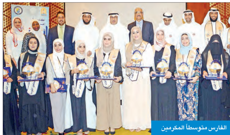
الفارس متوسطاً المكرمين

ترأس وزير التربية وزير التعليم العالي د. محمد الفارس، أمس الأول، الجلسة الأولى لدور الانعقاد التاسع للمجلس الأعلى للتعليم ومجلس أمناء المركز الوطني لتطوير التعليم في اجتماعين منفصلين. واستهل الفارس الجلسة بشكر أعضاء المجلس، لقبولهم تحمل المسؤولية الملقاة على عاتقهم، ثم جرى عرض مرئي، لمتابعة آخر مستجدات مشاريع المركز الوطني لتطوير التعليم، وعرض آخر نتائج دراسة «تيمز» لعام 2015، وعرض المركز الوطني للقياس في السعودية لتطبيق مشروع الاختبارات الوطنية بالكويت.