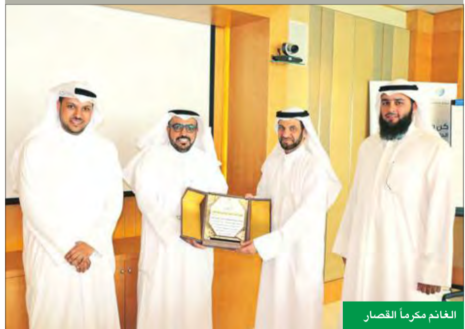
الغائم مكرمًا القصار

إدارة «وربة»، لحرصها على تطبيق القرارات الشرعية، متمنياً للبنك المزيد من التقدم والنمو.