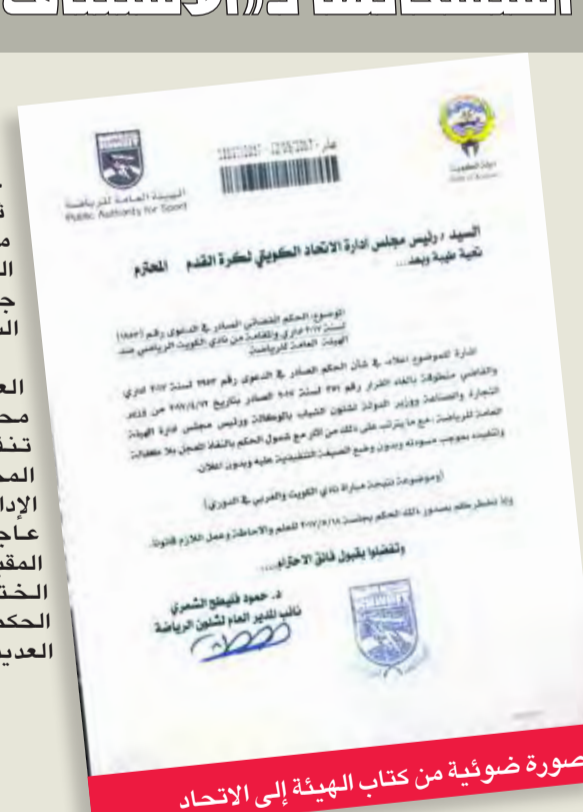
صورة ضوئية من كتاب الهيئة إلى الاتحاد

تسلم اتحاد الكرة، أمس، كتاباً من الهيئة العامة للرياضة، تضمن طلب تنفيذ حكم المحكمة الإدارية، بإضافة ثلاث نقاط للكويت، وخسب مثلها من العربي، بعد اعتماد النتيجة الأصلية للقاء الذي جمع الفريقين في الجملة السادسة.