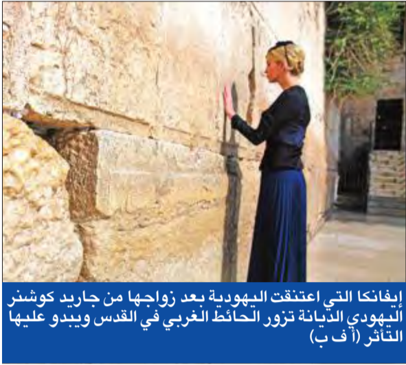
إيفانكا التي اعتنقت اليهودية بعد زواجها من جاريد كوشنر اليهودي الديانة تزور الحائط الغربي في القدس ويبدو عليها التأثر

● زار كنيسة القيامة و«حائط المبكى» في البلدة القديمة بالقدس وسط إجراءات أمنية مشددة