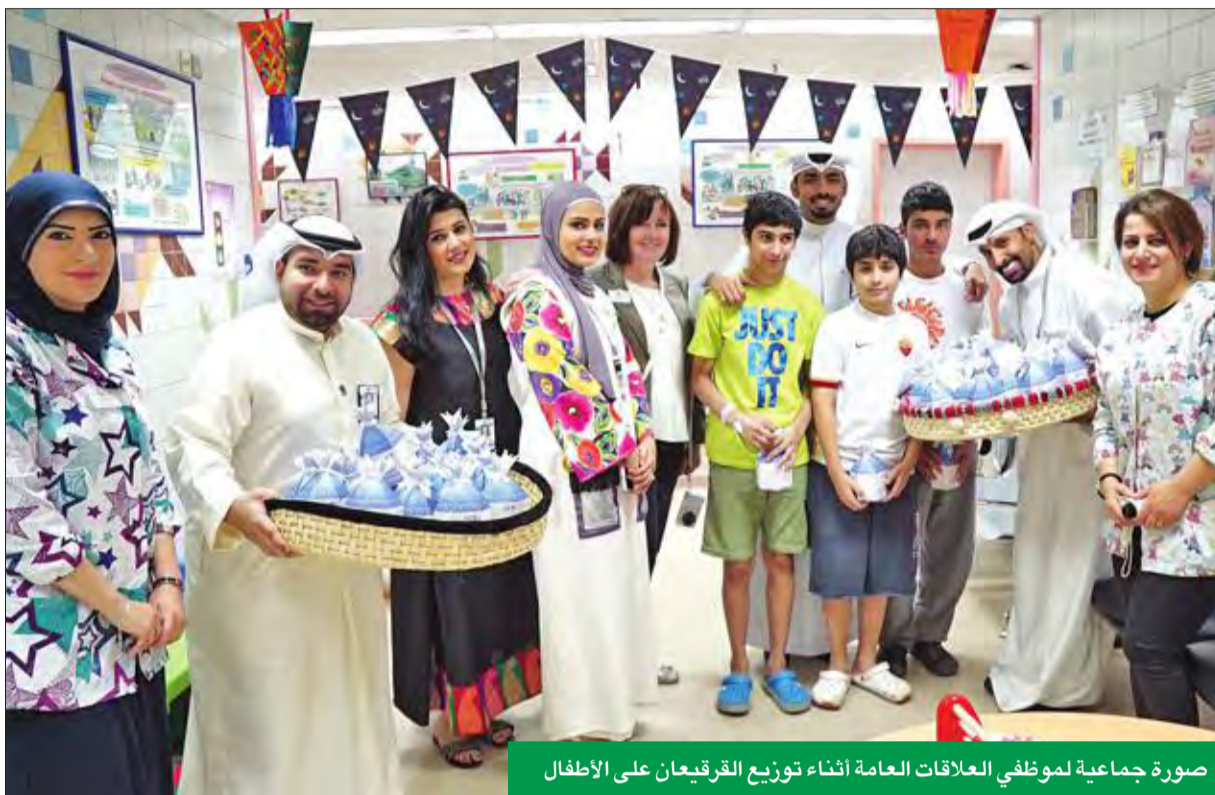
صورة جماعية لموظفي العلاقات العامة أثناء توزيع القرقيعان على الأطفال

يستقبل الصائمين وينظم جولات ميدانية واسعة لتوزيع وجبات الإفطار