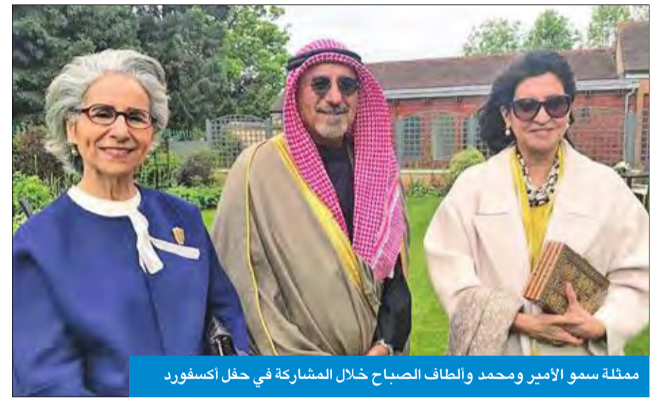
ممثلة سمو الأمير ومحمد والطف الصباح خلال المشاركة في حفل أكسفورد