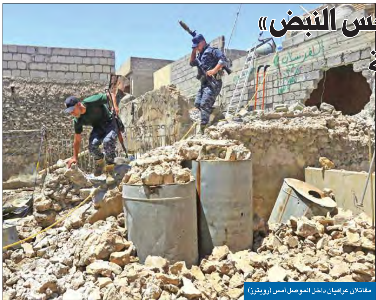
مقاتلان عراقيان داخل الموصل أمس