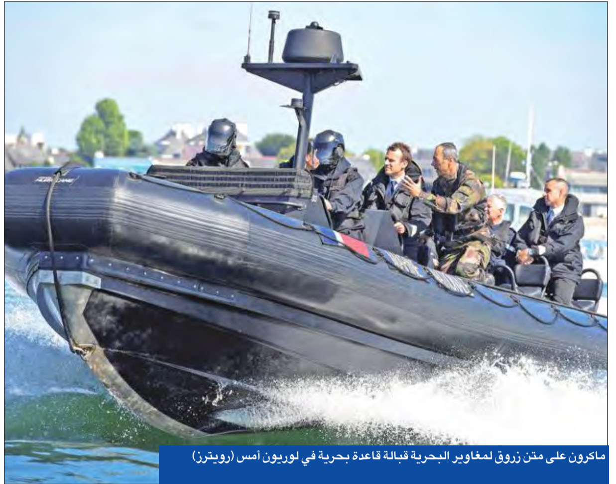
ماكرون على متن زورق لمغاوير البحرية قبالة قاعدة بحرية في لوريون أمس

أعلن القضاء الفرنسي، أمس، فتح تحقيق أولي حول قضية عقارية تمس وزير تماشك الإقليم ريشار فيران المقرب من الرئيس الفرنسي إيمانويل ماكرون. يأتي التحقيق الذي فتح في بريست (غرب) في اليوم نفسه الذي عرض على الصحف مشروع قانون حول فرض مبادئ أخلاقية في السياسة التزاماً بتبعه انتخابي قطعته الرئيس الجديد. وكشفت «لو كانا أنشبينه» الساخرة الأسبوع الفائت، أن شريكة فيران حصلت على استقادات من عملية منح عقد إيجار لشركة تأمين في وقت كان هو مديرها بين 1998 و2012. وثمة جانب آخر في القضية يتصل بتوظيف الوزير ابنه بضعة أشهر كمساعد برلماني.