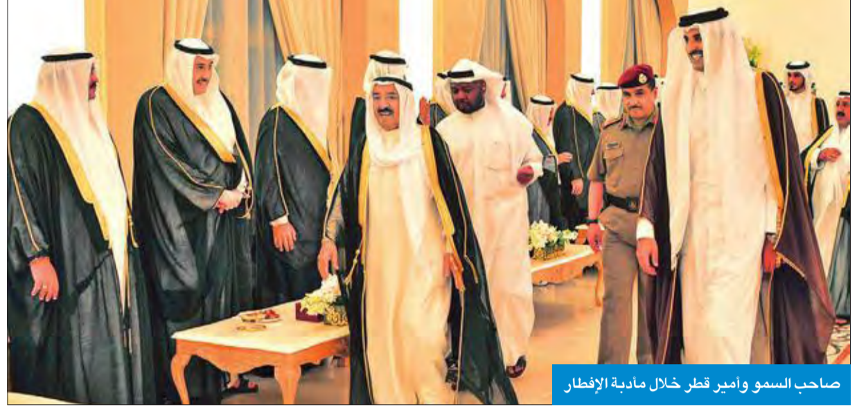
صاحب السمو وأمير قطر خلال مأدبة الإفطار

أرواح الأبرياء الأمنين، والذي يتخافى مع كل الشرائع السماوية والقيم الإنسانية، مجددا سموه موقف الكويت الثابت في رفض الإرهاب بكل أشكاله وصوره ووقوفها مع المجتمع الدولي لمحاربتة والقضاء عليه.