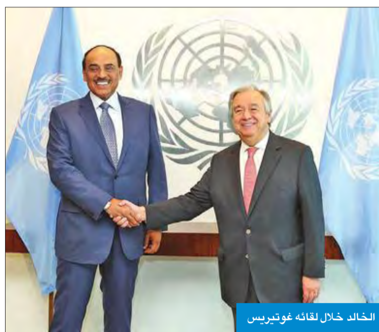
الخالد خلال لقائه غوتيريس

وأوضح الطبطبائي أن اللجنة أُنجزت مرحلة وضع خطة التهيئة ودراسة القوانين للتوافق مع أحكام الشريعة الإسلامية، وانتقلت إلى مرحلة أخرى تتمثل في مساعدة المؤسسات المختلفة على تحقيق الأهداف المنشودة من المشاريع المقدمة لها، وتقدم إلى سمو أمير البلاد الشيخ صباح الأحمد والقيادة السياسية وجميع المواطنين والمقيمين بخالص التهنئة بحلول شهر رمضان المبارك، سائلاً الله تعالى أن يعيده عليهم بالصحة والعافية.