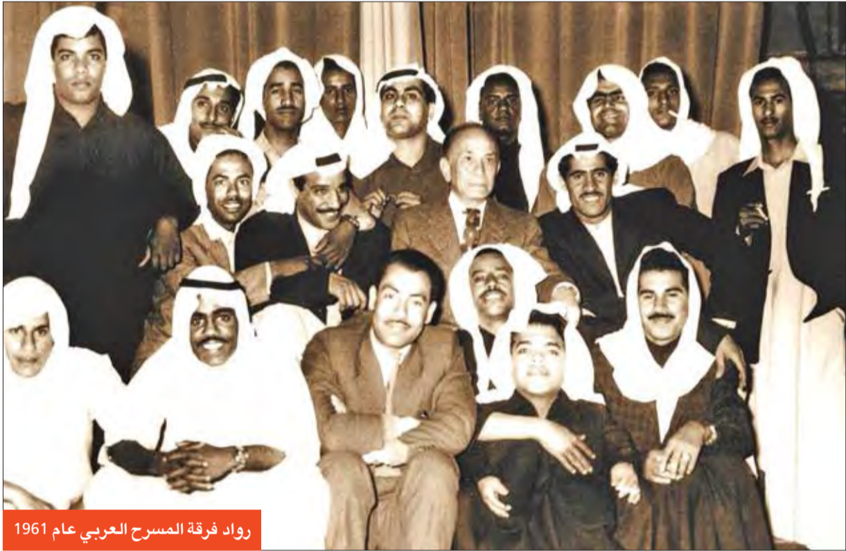
رواد فرقة المسرح العربي عام 1961