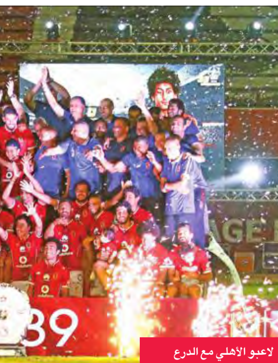
لاعبو الأهلي مع الدرع