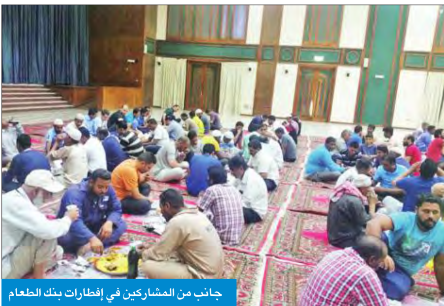
جانب من المشاركين في إفطارات بنك الطعام

تطلق لأول مرة بالكويت تحت رعاية «الشؤون»