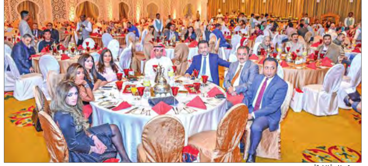
صورة جانبية للغبقة