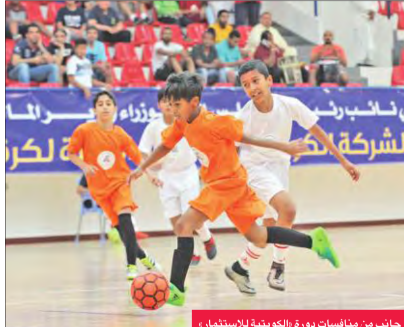
جانب من منافسات دورة «الكويتية للاستثمار»