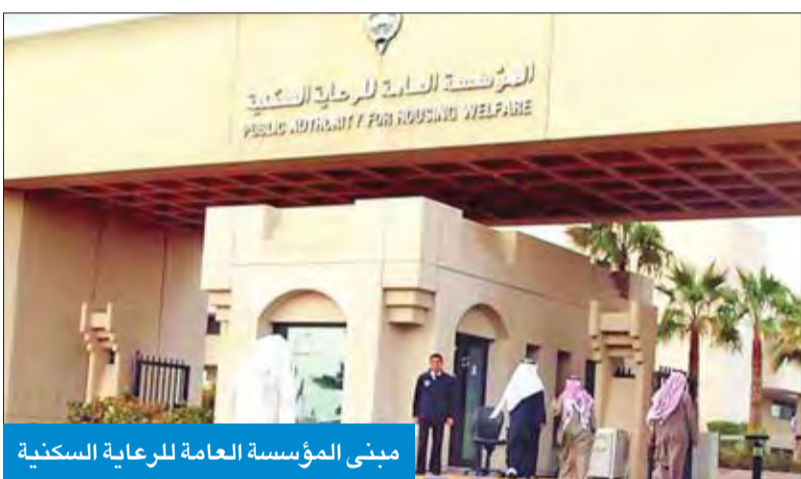
مبنى المؤسسة العامة للرعاية السكنية

وعلمت «الجريدة» من مصادر المؤسسة أن العمل جارٍ لتنفيذ آلية تأهيل وتدريب الموظفين في كافة الأقسام للنهوض بقدراتهم الشخصية وتعميم فكرة «الموظف الشامل» لما يقوق 1162 عاملاً من كل المستويات. وأضافت المصادر أن مجلس إدارة المؤسسة وافق أخيراً على عقد 28 دورة تدريب لرفع أداء 574 موظفاً من جميع المجالات الهندسية والمالية والإدارية داخل الدولة تشمل المرحلة الأولى بإجمالي 222 موظفاً بدورات داخلية في الجهات الحكومية الأخرى، مبيناً أن المرحلة الثانية تشمل 16 دورة تدريب داخلية لدى القطاع الخاص بمشاركة 352 موظفاً، إلى جانب دعم أدايتهم الإلكتروني، تمهيداً لتحويل نظام العمل داخل المؤسسة إلى إلكتروني بشكل كامل من خلال الربط والتنسيق مع الجهات الحكومية وإيقاف التعامل بالوراق.