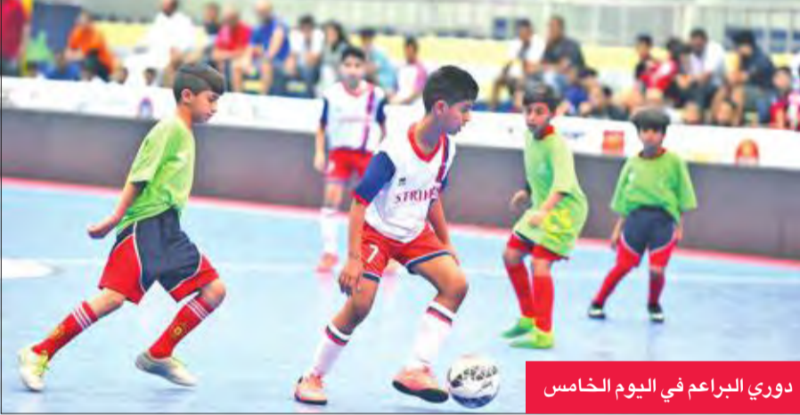
دوري البراعم في اليوم الخامس

وأضاف أن المشاركة بـ«الروضان» تمثل إضافة كبيرة للاعبين، لاسيما العناصر الواعدة التي تظهر لأول مرة، لافتا إلى أن الدورة لعبت