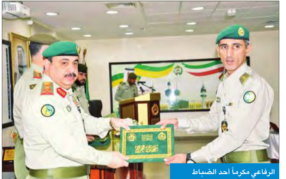
الرفاعي مكرماً أحد الضباط

مشيداً بمراحل الدورة التأسيسية المختلفة التي توجت بتنفيذ تمرين رأس الرمح. وأكد الرفاعي الحرص على المضى قدماً في سياسة التطوير وتحديث مختلف وحدات الحرس التي تنتهجها القيادة العليا للحرس الوطني، لتواكب مستجدات العصر، تطبيقاً لوثيقة الأهداف الاستراتيجية 2020، منوها بالتقدم الكبير الذي شهدته مدارس الحرس الوطني في أساليب التعليم التي تواكب أفضل النظم المعمول بها في المؤسسات العسكرية النظم المتقدمة، ومنتخبا على مشاركة ضباط من الجيش الكويتي ومملكة البحرين الشقيقة في الدورة، لما تمثله من أهمية في تعزيز التعاون وتبادل الخبرات بين الحرس الوطني والجهات المشاركة.