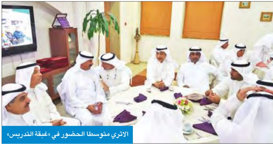
الأثري متوسط الحضور في «غبة التدريس»

وفي تصريح آخر، أعرب الأثري عن شكره أعضاء مجلس الأمة ووزير التربية وزير التعليم العالي د. محمد الفارس على الثقة التي منحوها لإدارة «التطبيقي»، من خلال الموافقة على حسابها الختامي وميزانيتها للعام المالي 2016/2017، معتبراً أن ذلك يأتي تقديراً لجهودها في عملية الإصلاح التي انتهجتها مؤخراً، حيث أنها السبيل الوحيد للإرتقاء والنهوض بالعملية التعليمية والأكاديمية للمؤسسة على كل الصعد المحلية والإقليمية والدولية. وأوضح أن «التطبيقي» ستضع بعين الاعتبار توصيات لجنة الميزانيات والحساب الختامي حول بعض بنود الميزانية لتفادي أي ملاحظات عليها خلال الأعوام المقبلة، مؤكداً أن الهيئة تنظر في جمع الملاحظات والأسئلة والبيانات