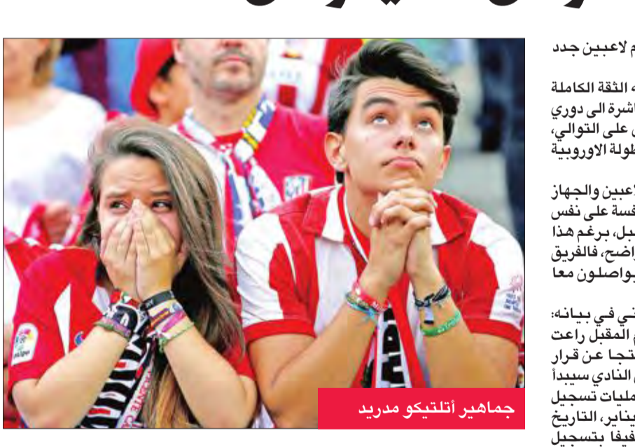
جماهير أتلتيكو مدريد

لا يتم في هذه الحالة الا بعد موافقة لجنة خاصة في الفيفا.