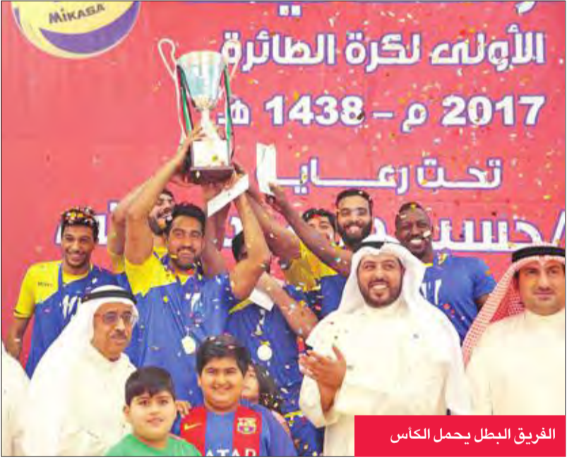
الفريق البطل يحمل الكأس