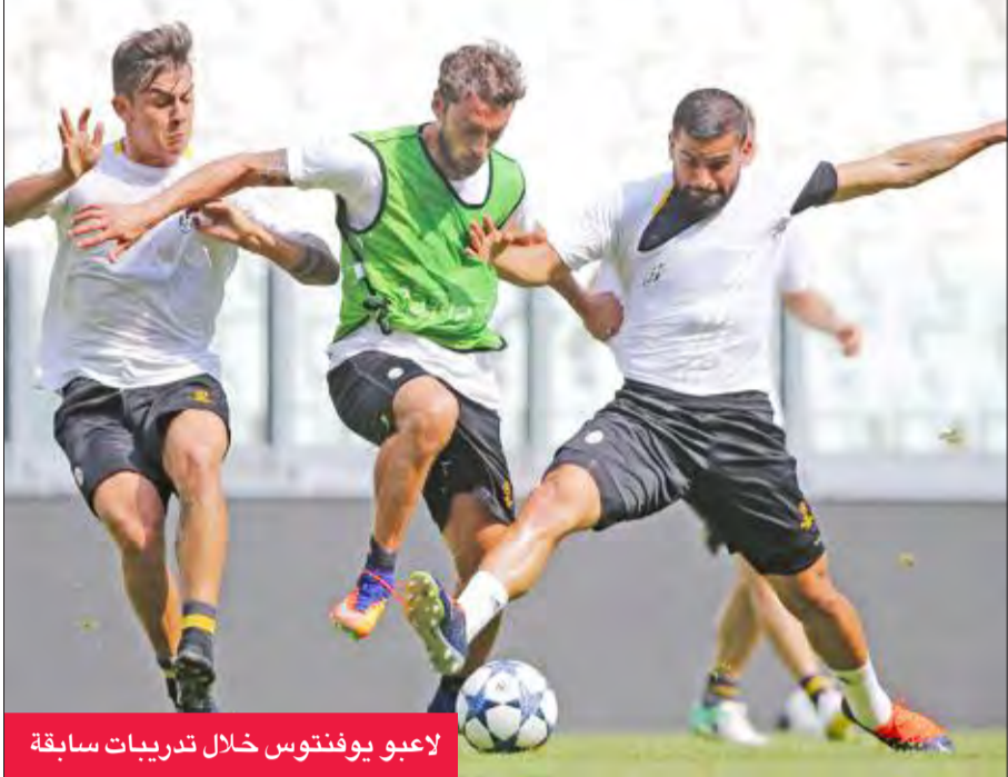
لاعبو يوفنتوس خلال تدريبات سابقة

ميونخ الألماني، وأصبح ذكيا للغاية في سوق الانتقالات. أنفق كثيرا على لاعبين مثل الهدف الأرجنتيني غونزالو هيجواين والبوسني ميراليم بيانيش، لكنه حصل على خدمات آخرين مقابل لا شيء تقريبا. هذا ما حدث مع أندريا بيرلو، والفرنسي بول بوغا، والبرازيلي داني الفيش، والفرنسي كينغسلي كومان، والألماني سامي خضيرة، لكن هل سيخوله دهاؤه في سوق الانتقالات إحراز لقب دوري الأبطال؟