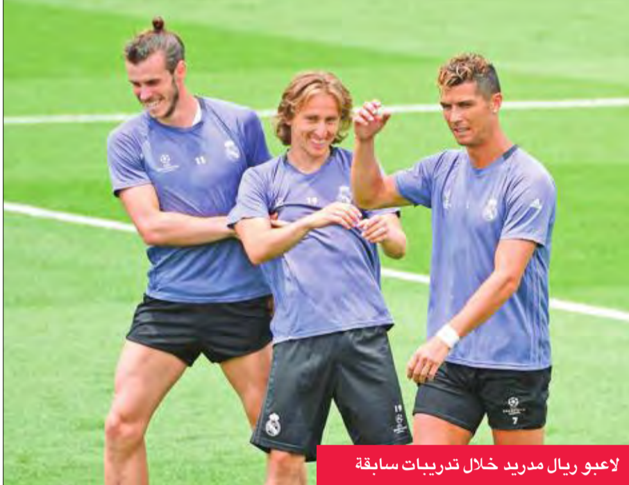
لاعبو ريال مدريد خلال تدريبات سابقة

المالية ارتفعت في السنوات الخمس الأخيرة من 213 إلى 387 مليون يورو نهاية الموسم الماضي. ويتبين الفارق الكبير من خلال العائدات التجارية والتسويق، بالإضافة التي دخل ملعبه الذي تبلغ سعته نصف ساعة ملعب سانتياغو برنابيو. ويخص بييرو أوزيليو المدير الرياضي في إنتر سلطة يوفنتوس المحلية، "بعد هبوطه إلى الدرجة الثانية (إثر فضيحة كالتشوولي في 2006)، ركزوا على خطة عمل محددة... بنوا