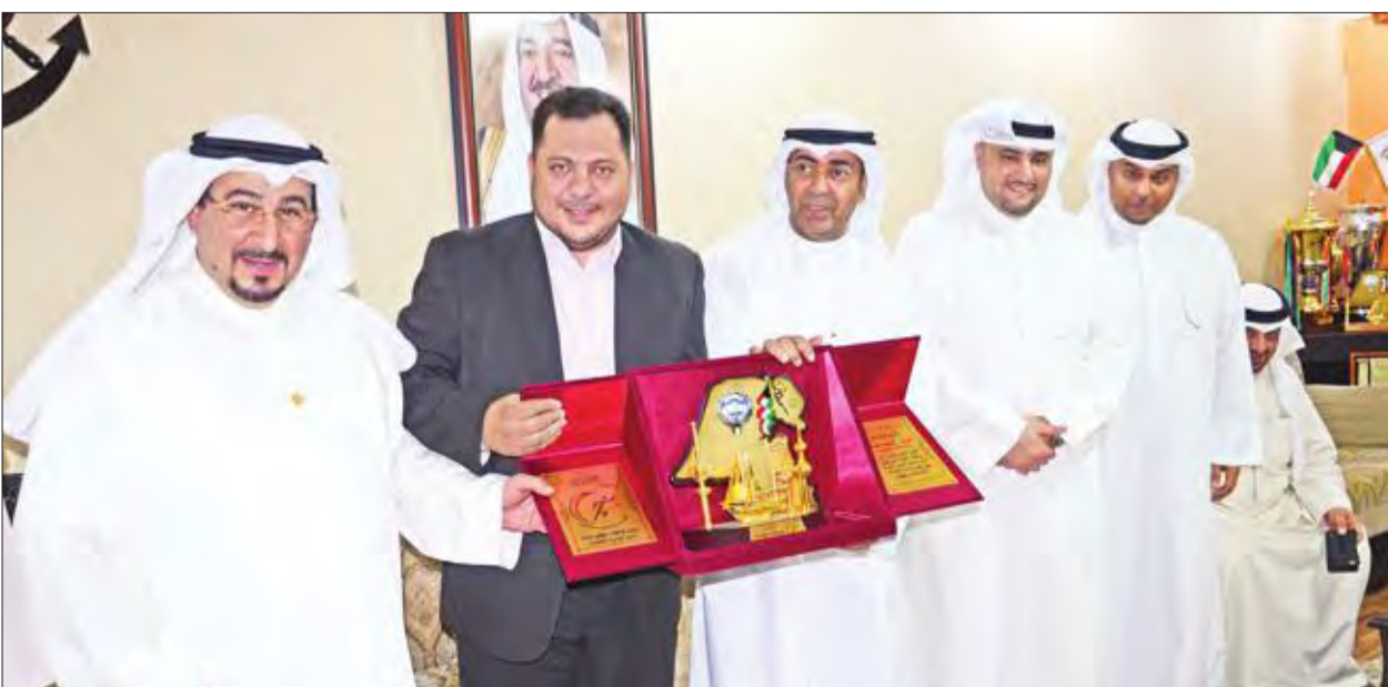
تكريم شركة طواف للسفرات