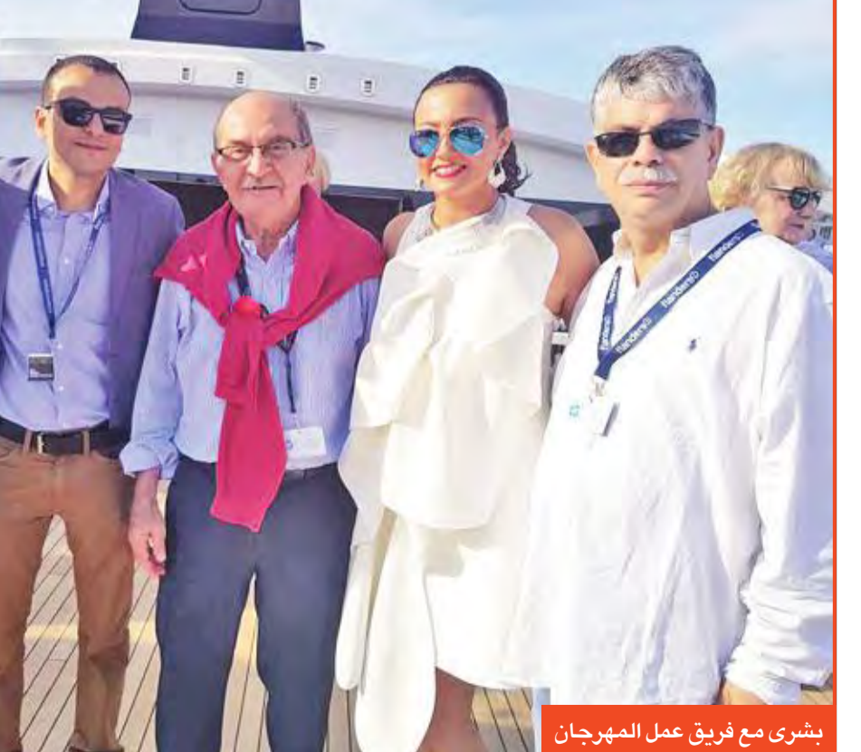
بشري مع فريق عمل المهرجان

تستضيف مدينة الجونة الساحلية في مصر نجوم العالم في مهرجانها السينمائي الدولي الأول من 22 إلى 29 سبتمبر المقبل، تحت شعار «سينما من أجل الإنسانية». وسيتم نخبة من كبار النجوم سيخادرون مهرجان الجونة السينمائي إلى تقديم فنون سينمائية مؤثرة تعكس الملامح الإنسانية، إلى جانب تقديم سلسلة من الأفلام الهادفة، ويامل المهرجان أن يتم من خلاله تقديم فرصة لتبادل الثقافات وإذابة الحدود والاحتفال بالأفلام المبدعة من كل أنحاء العالم.