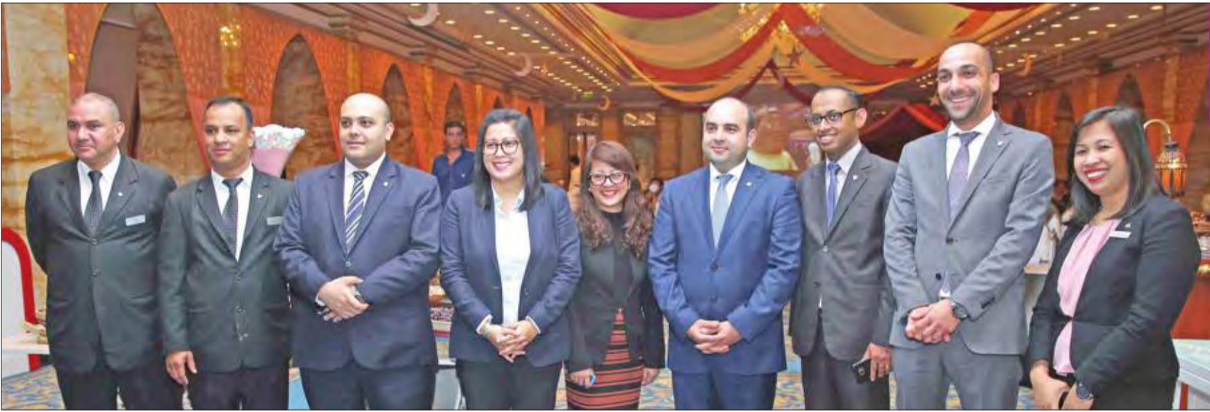
صورة جماعية لفريق العمل