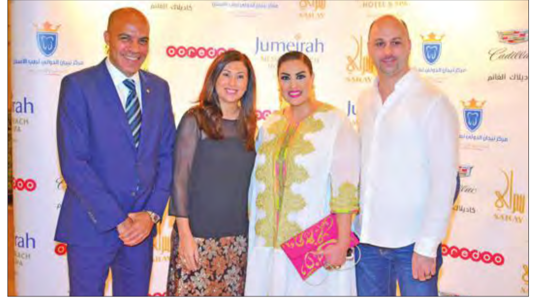
رونكوليتا وجرس خلال استقبال الضيوف