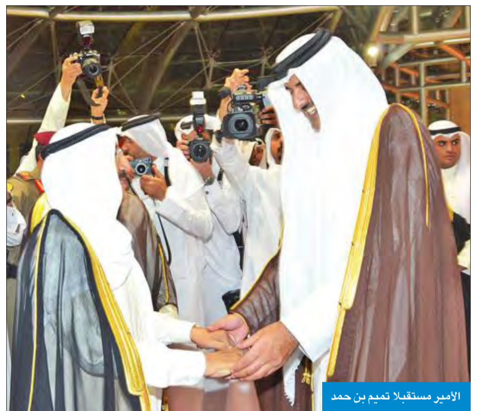
الأمير مستقبلا تميم بن حمد

حضر اللقاء رئيس مجلس الأمة مرزوق الغانم، والشيخ