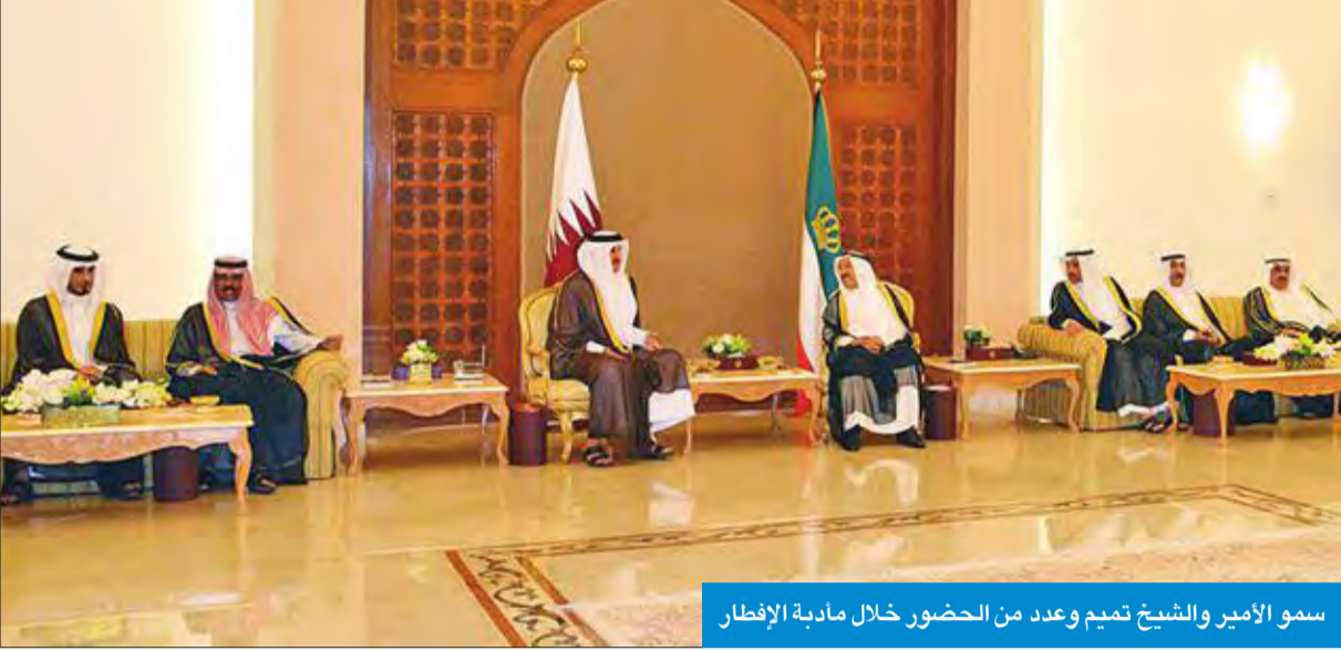
سمو الأمير والشيخ تميم وعدد من الحضور خلال مأدبة الإفطار

سموه أقام مأدبة إفطار على شرف تميم بقصر دسمان... وعزى العراق وأفغانستان وروسيا