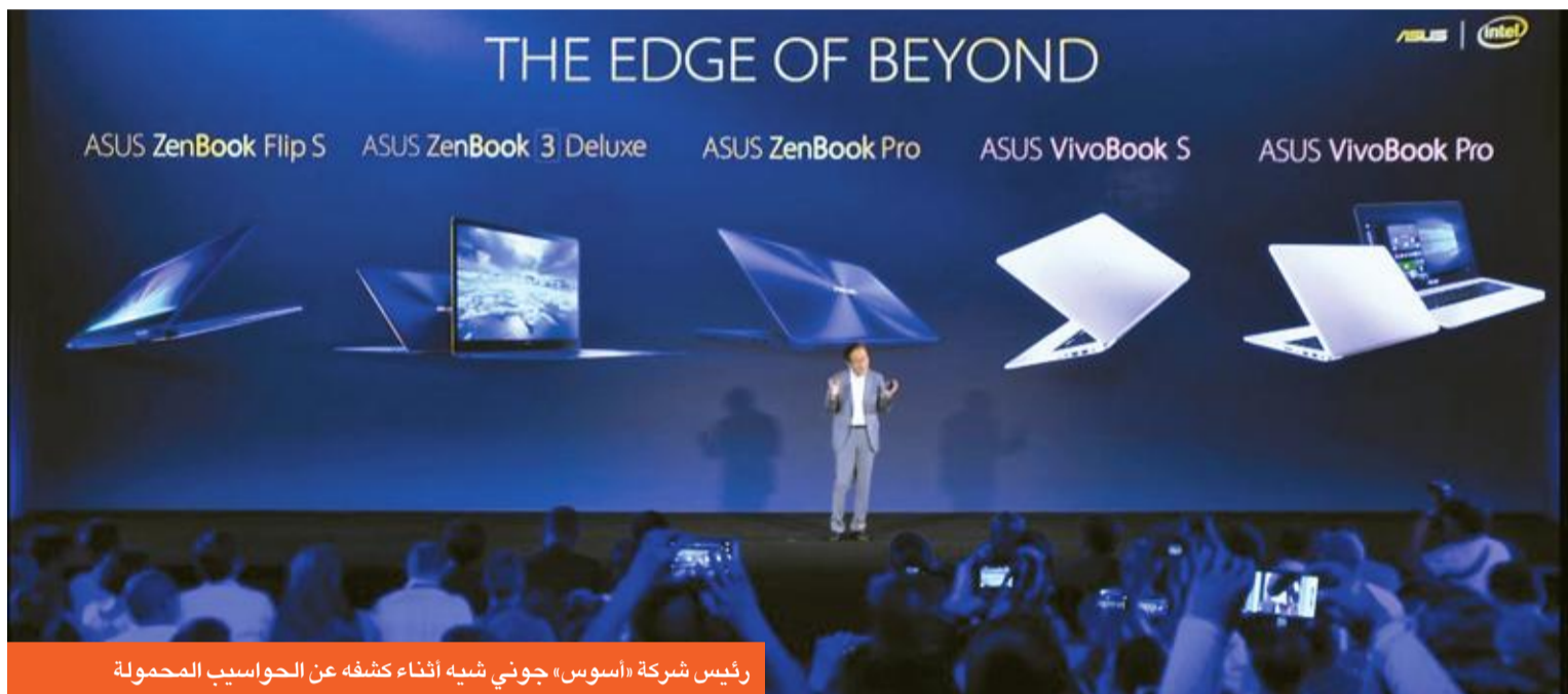
رئيس شركة «أسوس» جوني شيه أثناء كشفه عن الحواسيب المحمولة

15.6» بتقنية HD الكاملة مع دعم تقنية نفيديا G-SYNC، ومزود بمنفذ Thunderbolt 3 واثنين من منافذ USB-C وإضاءة RGB خلفية للوحة المفاتيح الميكانيكية. وسيتم بيعه في أمريكا الشمالية بداية بسعر يبدأ من 2999 دولاراً أميركياً.