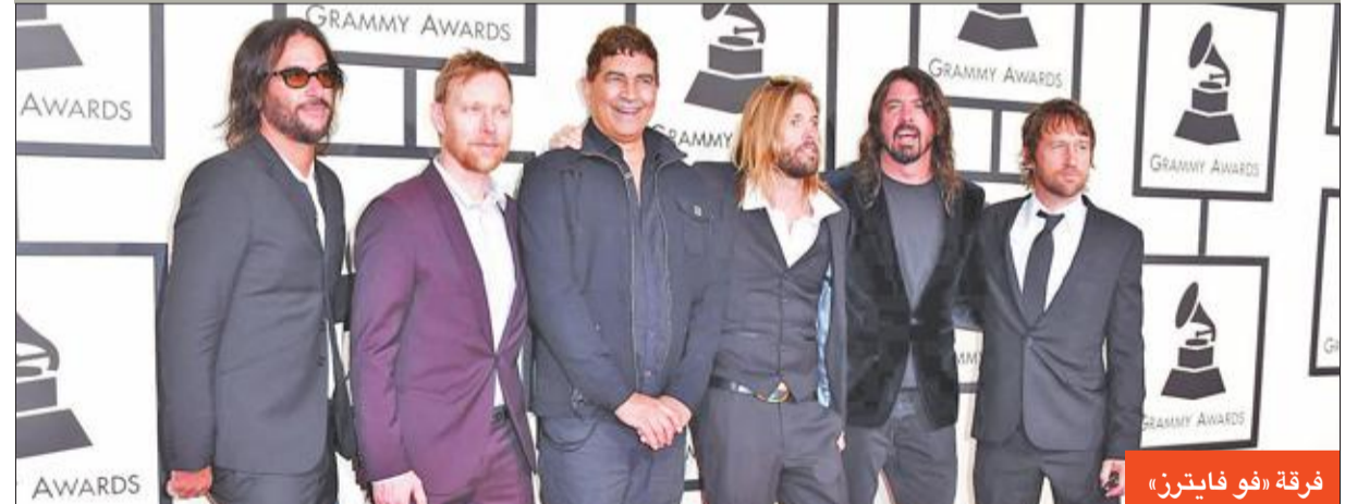
فرقة «فو فايترز»

وتقول الأغنية «م وكرض معي لإنقاذ حياتك»، وقد صدرت من دون إعلان سابق، ولم تحدد الفرقة إذا ما كانت تمهد لليوم مقبل. وتطرق أعضاء «فو فايترز» التي أنبقت من رما «نيرفانا» سنة 1994 مرات عدة إلى احتمال الاعتزال، قبل العدول عن رأيهم. وتستعد الفرقة حاليا لجولة في أوروبا وآسيا عما قريب والمشاركة في عدة مهرجانات موسيقية، من قبيل غلاستنبوري في بريطانيا و«سامر سونيك» في اليابان.