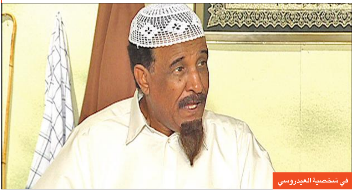
في شخصية العيدروسي