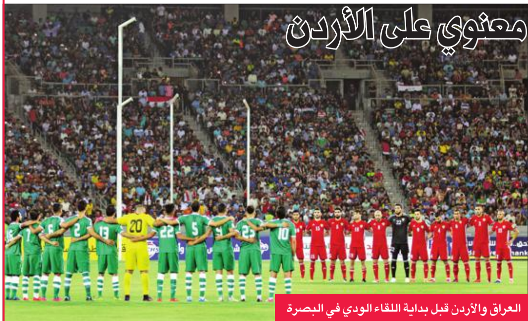
العراق والأردن قبل بداية اللقاء الودي في البصرة

أكد الاتحاد القطري لكرة القدم رسميا امس الأول استمرار الأوروغوياني خورخي فوساتي في منصبه كمدرب للمنتخب الأول وأصدر الاتحاد القطري بيانا أكد فيه أن فوساتي مستمر في عمله لإرتباطه بعقد يمتد حتى نهاية تصفيات كأس العالم 2018، والبطولات القادمة أبرزها كأس الخليج الثالثة والعشرين، التي تستضيفها قطر في ديسمبر المقبل. وأوضح الاتحاد أنه في حال تقدم فوساتي باستقالته من منصبه فإنه سيدرس الخيارات البديلة المطروحة لاختيار المدرب الجديد الذي سيتولى مهمة الفريق خلال المرحلة المقبلة.