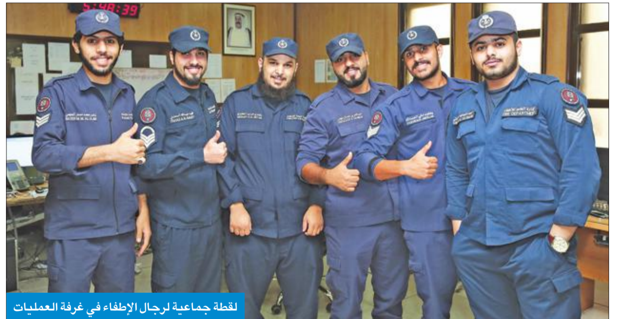
لقطة جماعية لرجال الإطفاء في غرفة العمليات