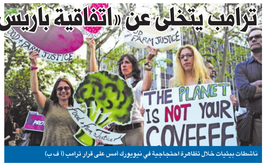
ناشطات بيئات خلال تظاهرة احتجاجية في نيويورك أمس على قرار ترامب

أثار قرار الرئيس الأميركي دونالد ترامب بشأن الانسحاب من اتفاقية باريس للمناخ، رغم أنه كان متوقعاً، حالة من الصدمة في الأوساط الأميركية السياسية والاقتصادية، وكذلك في الأوساط الدولية، خصوصاً في أوروبا، التي وجدت نفسها فجأة في الجبهة الامامية لقيادة العالم، وهو أمر تخلفت عنه القارة العجوز منذ سنوات طويلة، كانت الريادة المطلقة خلالها للضفة الغربية للأطلسي. وقراره الذي أعلنه مساء أمس الأول من حديقة البيت الأبيض، قفز ترامب فوق كل الاعتراضات والتحذيرات السياسية في 02