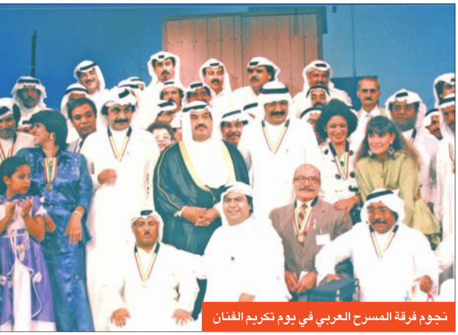
نجوم فرقة المسرح العربي في يوم تكريم الفنان