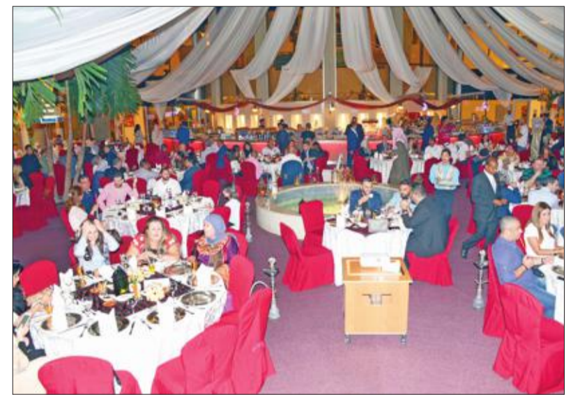
جانب من الغبقة