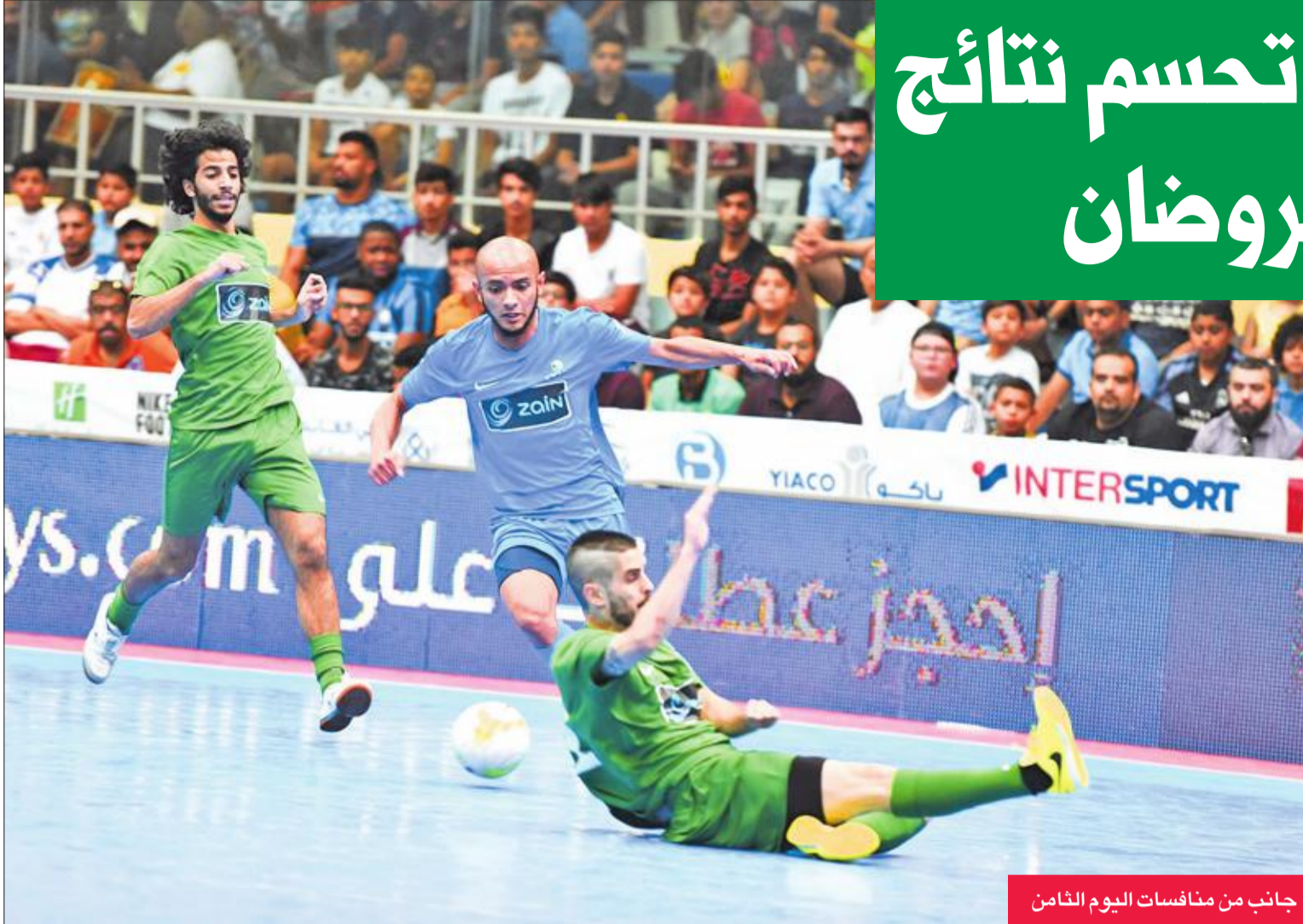
جانب من منافسات اليوم الثامن