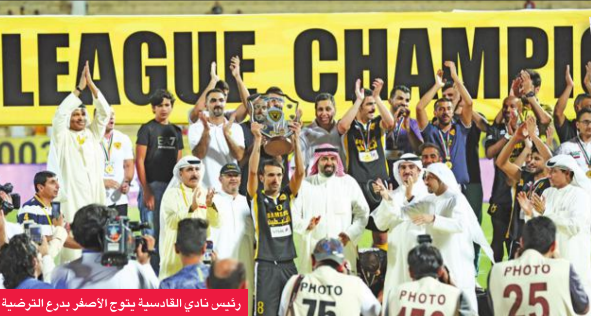
رئيس نادي القادسية يتوج الأصفر بدرع الترضية

الثاني، وتم الاكتفاء بالمطالبة بالحصول على مكافأة الفريق في دوري فيفا لسبب في نفس بن يعقوب.