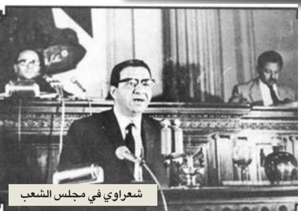
شعراوي في مجلس الشعب