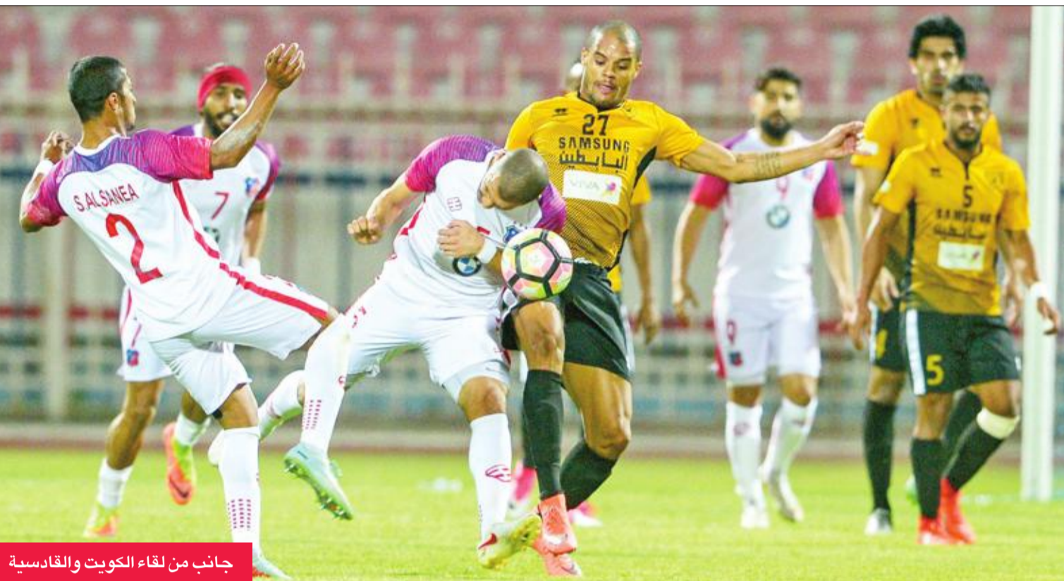
جانب من لقاء الكويت والقاسية