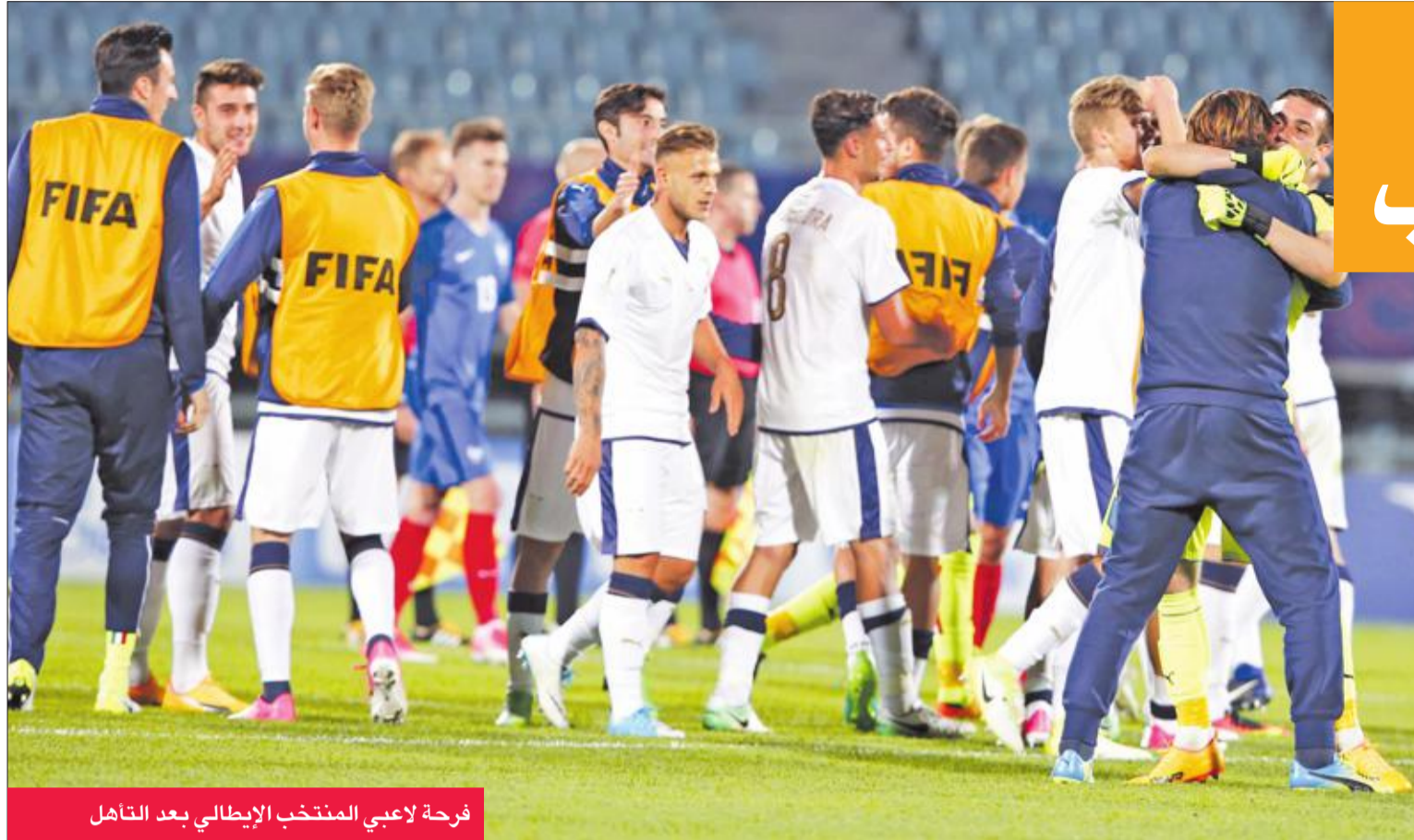
فرحة لاعبي المنتخب الإيطالي بعد التأهل

الخامسة على التوالي التي يغيب فيها المنتخب البطل عن البطولة (الارجنتين وغانا والبرازيل وفرنسا وصربيا). وخرجت الأرجنتين، حاملة الرقم القياسي في عدد الألقاب في البطولة (6 الألقاب وحلت وصيفة عام 1983)، من الدور الأول للمرة الثانية على التوالي.