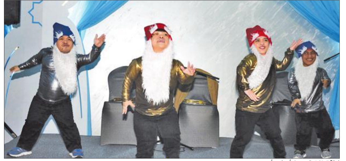
فرقة الباندا تقدم عرضاً ترفيهياً