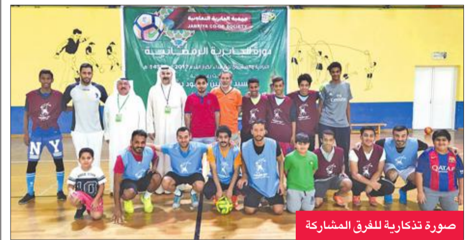
صورة تذكارية للفرق المشاركة