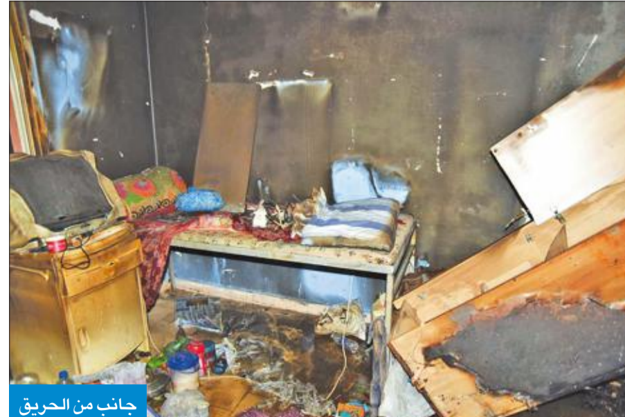
جانب من الحريق

قال الإطفائيون العاملون في مركز العمليات إنهم يستعدون للانتقال إلى مركزهم الجديد في منطقة غرب مشرف، وتحديداً بالقرب من مركز إطفاء مشرف، حيث تم تجهيز غرفة عمليات حديثة ومتطورة وجديدة، نظراً لأهميتها في جهاز الإدارة العامة للإطفاء.