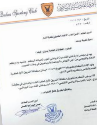
صورة ضوئية لكتاب القادسية