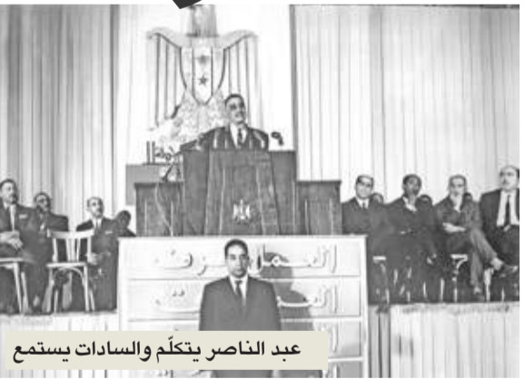
عبد الناصر يتكلم مع السادات يستمع

قواعد الاتحاد الاشتراكي في المحافظات رفضت ترشيح السادات رئيساً