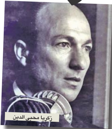
زكريا محبي الدين

ورغم أن نتيجة الاستفتاء على السادات كانت أقل من نتائج الاستفتاءات السابقة، فإنها في رأيي لا تعتبر بصدق رأي الشارع المصري آنذاك. كانت لا شك في جزء منها تعبير عن رجل الشارع، ولكن في جزء آخر لا يستهان به كانت تعبير عما حدث في لجان الاستفتاء، وكان السادات ترك القاهرة يوم الاستفتاء إلى قرية «بيت أبو الكوم» في محافظة المنوفية، وتحدثت إليه هاتفياً، وأبلغته قرار إعلان نتيجة الاستفتاء.