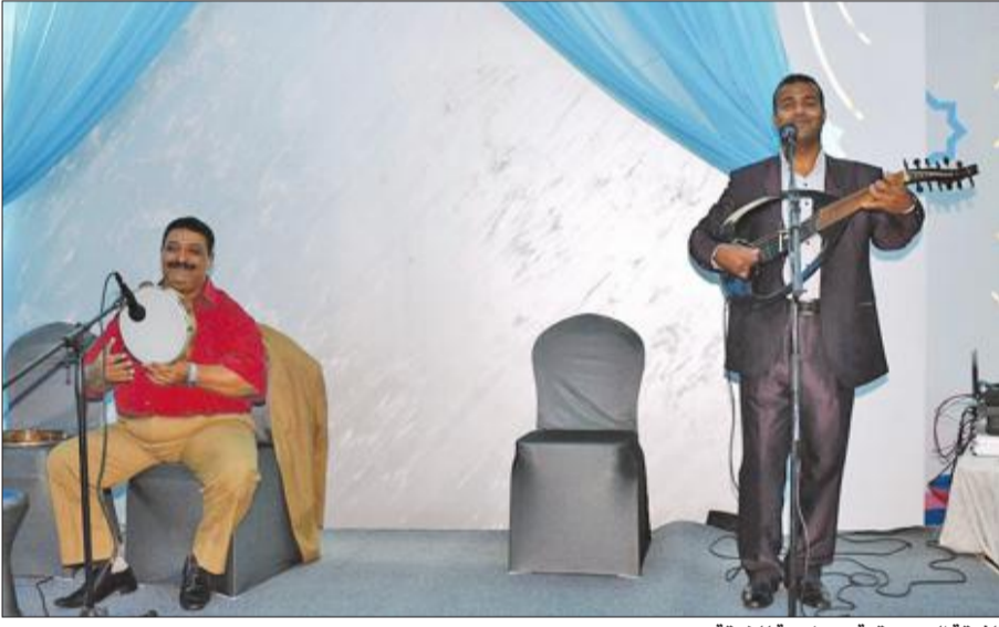
الفرقة الموسيقية مصاحبة للغبقة