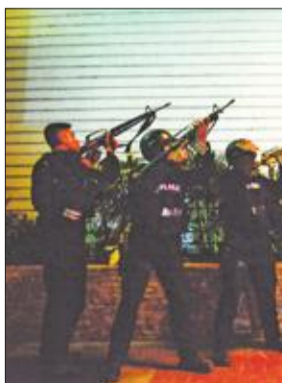
قوات أمن فلبينية خلال المواجهات في مانيلا أمس الأول

مانيلا: منفذ المدراء انتحر حرقاً ودافعه السرقة لا الإرهاب