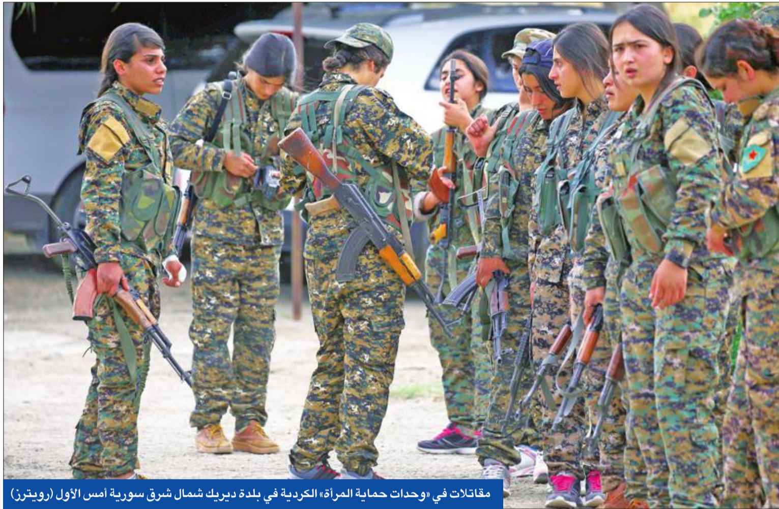
مقاتلات في وحدات حماية المرأة الكردية في بلدة ديريك شمال شرق سورية أمس الأول

● 200 ألف غادروا الرقة ● مقتل 19 بتفجير وقصف في درعا ● اقتتال الغوطة يحرق المحاصيل