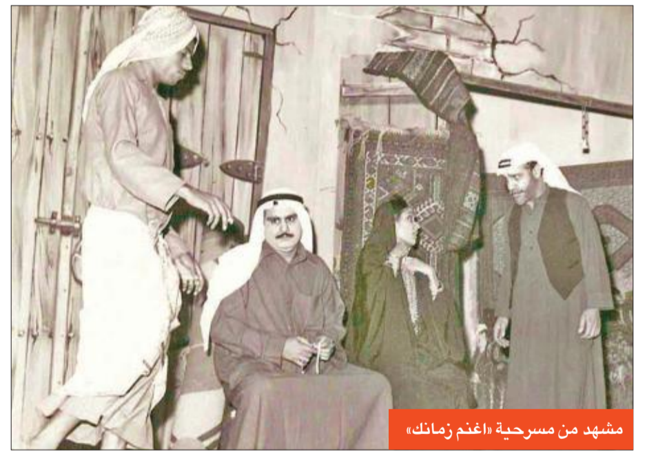
مشهد من مسرحية «اغتم زمانك»

- أجل، لقد طلب مني المخرج أن أقدم شخصية مختلفة عن شخصية الإنسان الاعتيادي، ورحت أفكر في خلق شخصية جديدة، ولأنني أعشق المطرب الراحل عبداللطيف الكويتي، وأحب أسلوبه في الغناء والحديث، فاقبست منه طريقته في الكلام الحاد، وطلقة صوته، وقدمت تلك الطبقة من خلال شخصية «الملأ»، وقدمتها أمام المخرج الذي بدوره أعجب بها كثيراً، وطلب مني أن تطلق اسماً على الشخصية، فقلت