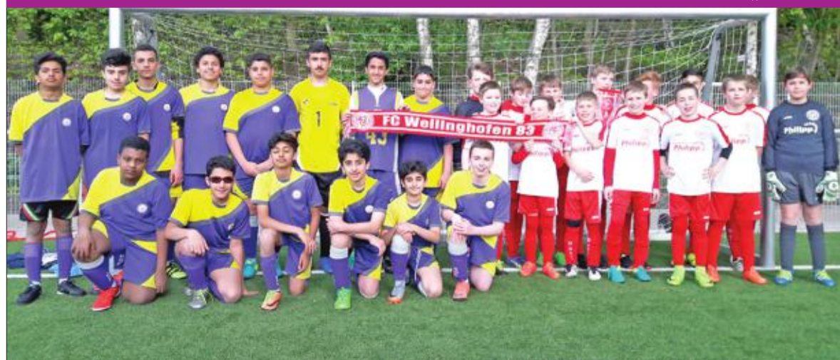
صورة جماعية للطلاب المشاركين