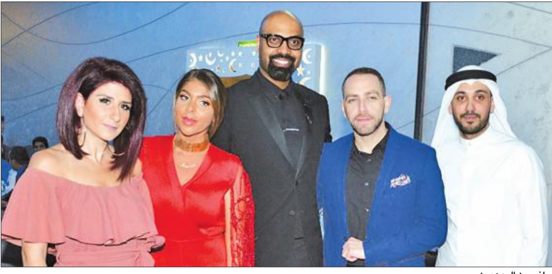
جانب من المدعوين