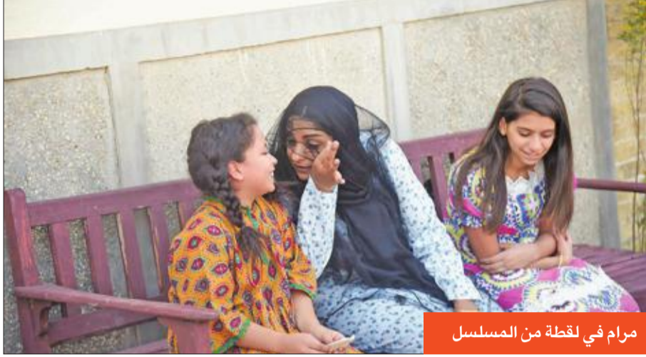
مرام في لقطة من المسلسل