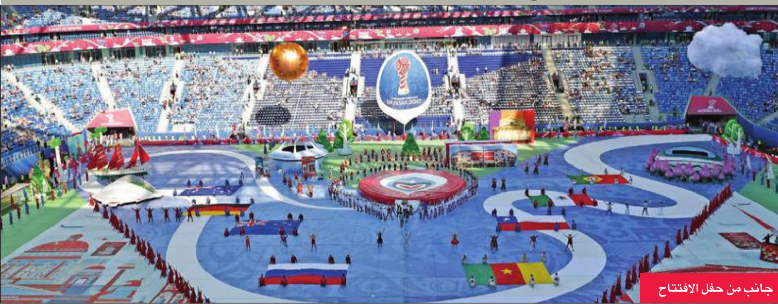
جانب من حفل الافتتاح

بدأت بطولة كأس القارات لكرة القدم، أمس الأول، بحفل افتتاح رائع على ملعب سان بطرسبورغ الذي افتتح مؤخرا ويتسع لـ 68 ألف متفرج. وعزز الأمن وجوده في البطولة، وتم إغلاق منطقة ملعب