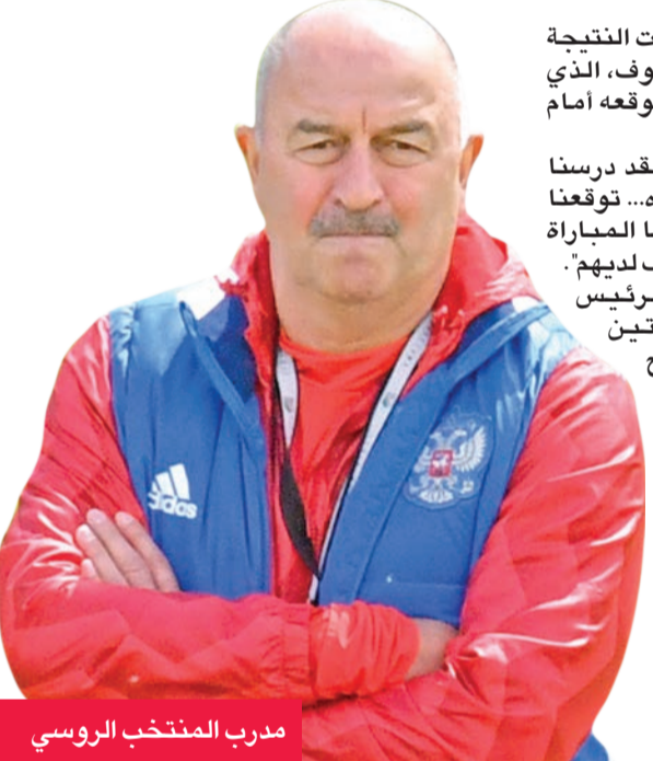
مدرب المنتخب الروسي

أبدى ستانيسلاف تشيرتشيسوف، المدير الفني للمنتخب الروسي، سعادة بالفوز الذي حققه فريقه على نظيره النيوزيلندي 2- صفر، أمس الأول، في افتتاح منافسات بطولة كأس القارات 2017 لكرة القدم بروسيا، رافضا الحديث عن الضغوط على منتخب أصحاب الأرض.