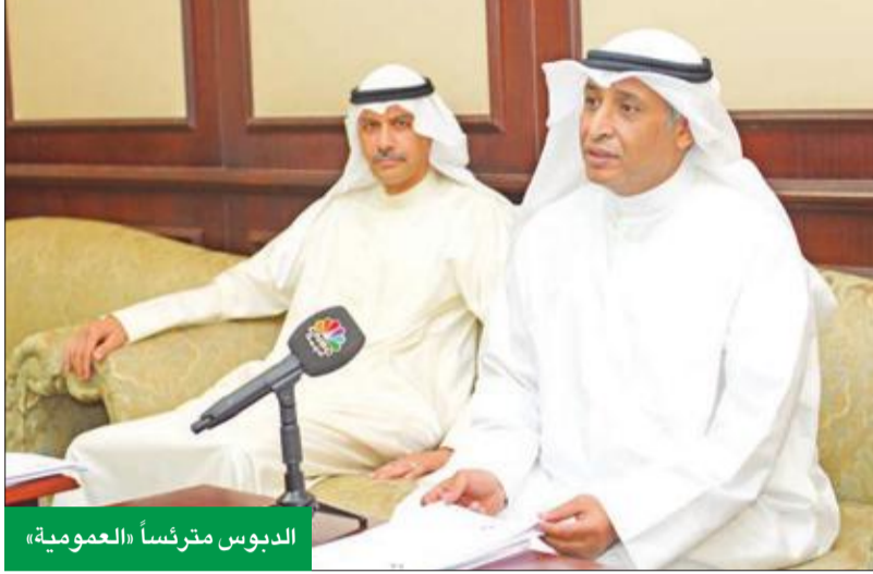
الدبوس مترئساً «العمومية»

وفيما يتعلق بإداء الشركات التابعة والزميلية، قال إنها حققت صافي ربح قدره 4.6 ملايين دينار، إضافة إلى 5.9 ملايين دينار أرباح إعادة تصنيف شركة نفائس من استثماراتها متاحة للبيع إلى شركة زميلة. أما فيما يتعلق بالمخصصات، فقال