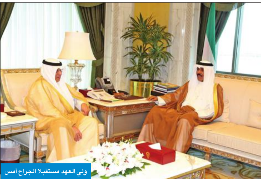
ولي العهد مستقبلاً الجراح أمس

كما استقبل سمو ولي العهد وزير الدولة لشؤون مجلس الوزراء وزير الإعلام بالوكالة الشيخ محمد العبدالله.