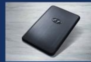
مفتاح ذكي بشكل بطاقة