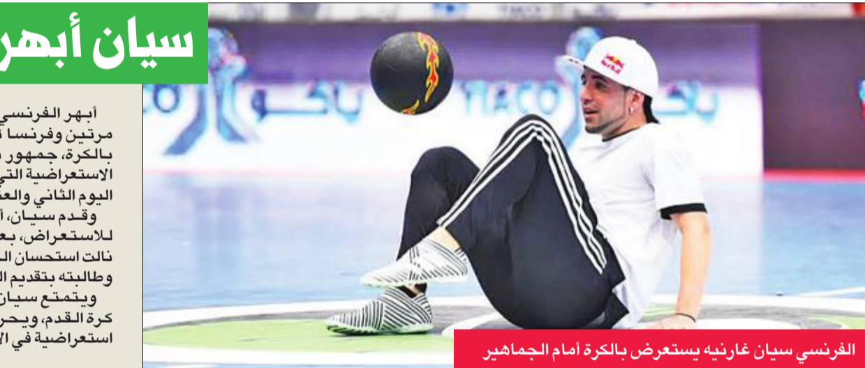
الفرنسي سيان غارنيه يستعرض بالكرة أمام الجماهير

أبهر الفرنسي سيان غارنيه، بطل العالم مرتين وفرنسا ثلاث مرات في الاستعراض بالكرة، جمهور دورة الروضان، خلال الفقرة الاستعراضية التي قدمها على هامش منافسات اليوم الثاني والعشرين. وقدم سيان، أحد أعضاء فريق ريد بول للاستعراض، بعض الحركات الجديدة التي نالت استحسان الجماهير، التي شجعتها بحرارة، وطالته بتقديم المزيد من المهارات. ويتمتع سيان بشهرة واسعة بين عشاق كرة القدم، ويحرص دوما على تقديم فقرات استعراضية في الأحداث الرياضية الكبيرة.