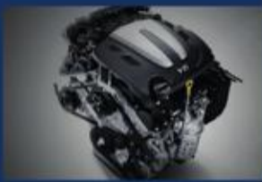
محرك لامبدا 3.5 لتر 290 حصان 8 سرعات