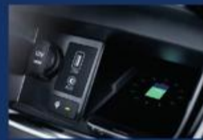
شاحن لاسلكي للهاتف