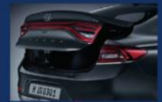
صندوق خلفي يفتح تلقائياً