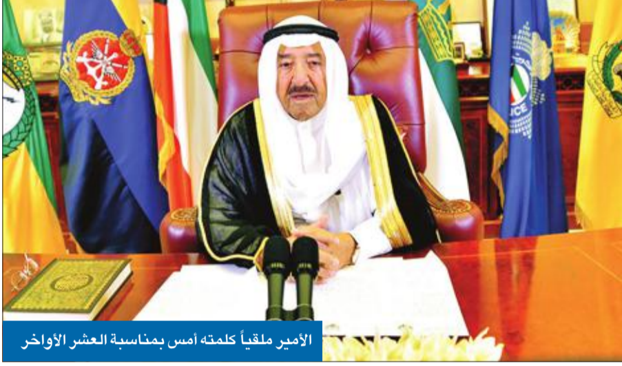
الأمير ملقباً بكلمته أمس بمناسبة العشر الأواخر

«أدعو الشباب إلى الاستفادة من المشاريع الصغيرة والمتوسطة بما يعود عليهم وعلى وطنهم بالخير»