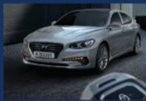
التشغيل عن بعد