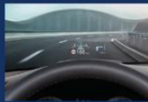
عرض البيانات على الزجاج الأمامي