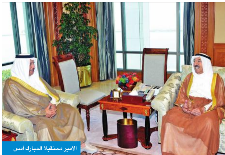
الأمير مستقبلاً المبارك أمس

وبعث سمو ولي العهد وسمو رئيس مجلس الوزراء ببرقيات تهنئة مماثلتين.