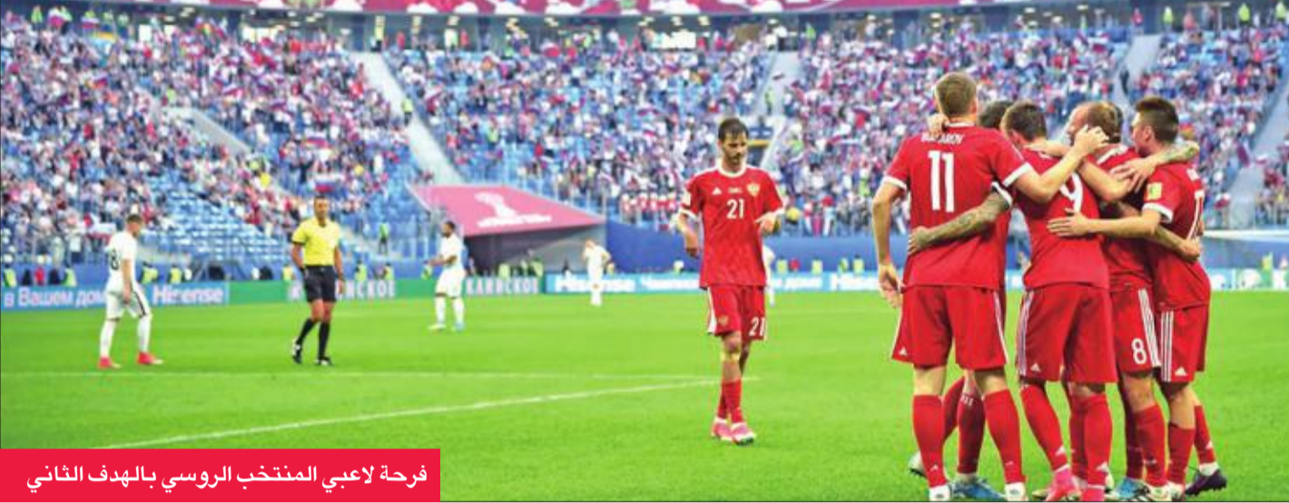
فرحة لاعبي المنتخب الروسي بالهدف الثاني

تصدرت الساحة الأوقيانسية بعد انتقال استراليا للمنافسة في مسابقات الاتحاد الآسيوي في 2006، فأجا راين توماس المخضرم إيجور اكينفيف بتسديدة خاطفة أبعدها بصعوبة الحارس الذي خاض مباراته الدولية التاسعة والتسعين (77)، ومن الركبة التالية أبعده يوري جيركوف ببراعة عن خط المرمى. وأهدر البديل الكسندر بوخاروف من مسافة قريبة فرصة الهدف الثالث (3+90) لتنتهي المباراة بفوز روسيا 2- صفر.