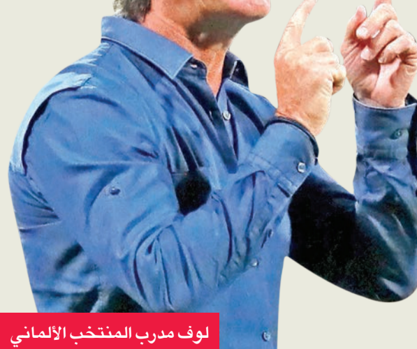
لوف مدرب المنتخب الألماني

الجنوبية في نهائي كأس آسيا 1-2 بعد التمهيد، لتكون المشاركة الرابعة له. وميزة المنتخب الأسترالي الحالي الذي يعرف أيضا باسم "الكنغوروس"، انه غير معروف ما يجعله "أكثر خطورة" بالنسبة إلى منافسيه في المجموعة التي تضم أيضا الكاميرون بطلا إفريقيا (2017) وتشيلي بطلا أميركا الجنوبية (2015 و 2016).