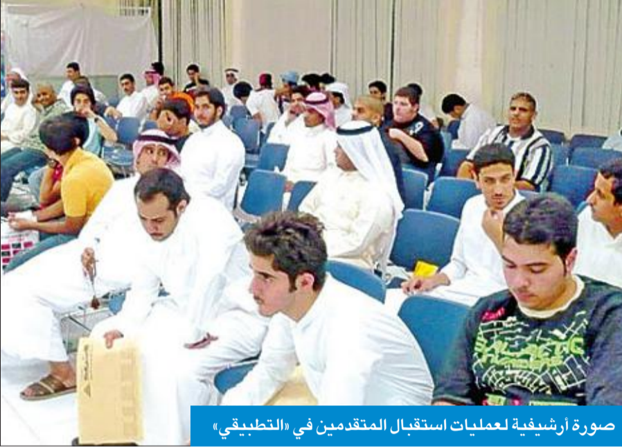
صورة أرشيفية لعمليات استقبال المتقدمين في «التطبيقي»

النجادة لـ الجريدة: ليس كل من تقدم للالتحاق في التسجيل تنطبق عليه شروط القبول