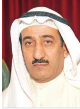
المستشار أحمد العجيل

أفعلاً من شأنها المساس بوحدة وسلامة أراضي دولة الكويت هي «جلب وتخزين ونقل مواد متفجرة وأسلحة وذخائر» وتدريبوا على استعمالها بقصد استخدامها في أعمال غير مشروعة وبأنهم سعوا لدى دولة أجنبية هي «جمهورية إيران الإسلامية» وتخابروا معها ومع جماعة «حزب الله» التي تعمل لمصلحتها على القيام بأعمال عدائية هي إشاعة الذعر والفوضى في دولة الكويت.