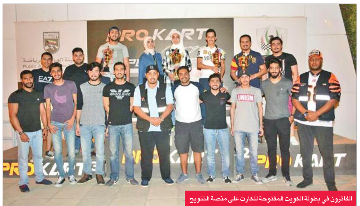
الفائزون في بطولة الكويت المفتوحة للكارت على منصة التتويج