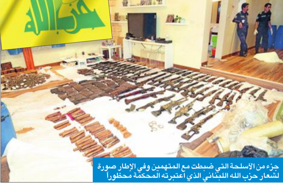
جزء من الأسلحة التي ضبطت مع المتهمين وفي الإطار صورة لشعار حزب الله اللبناني الذي اعتبرته المحكمة محظوراً