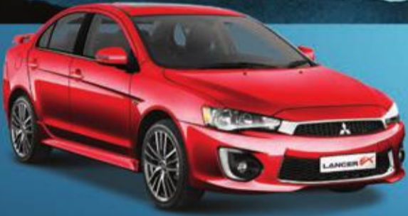
LANCER EX 4,499 د.ك.