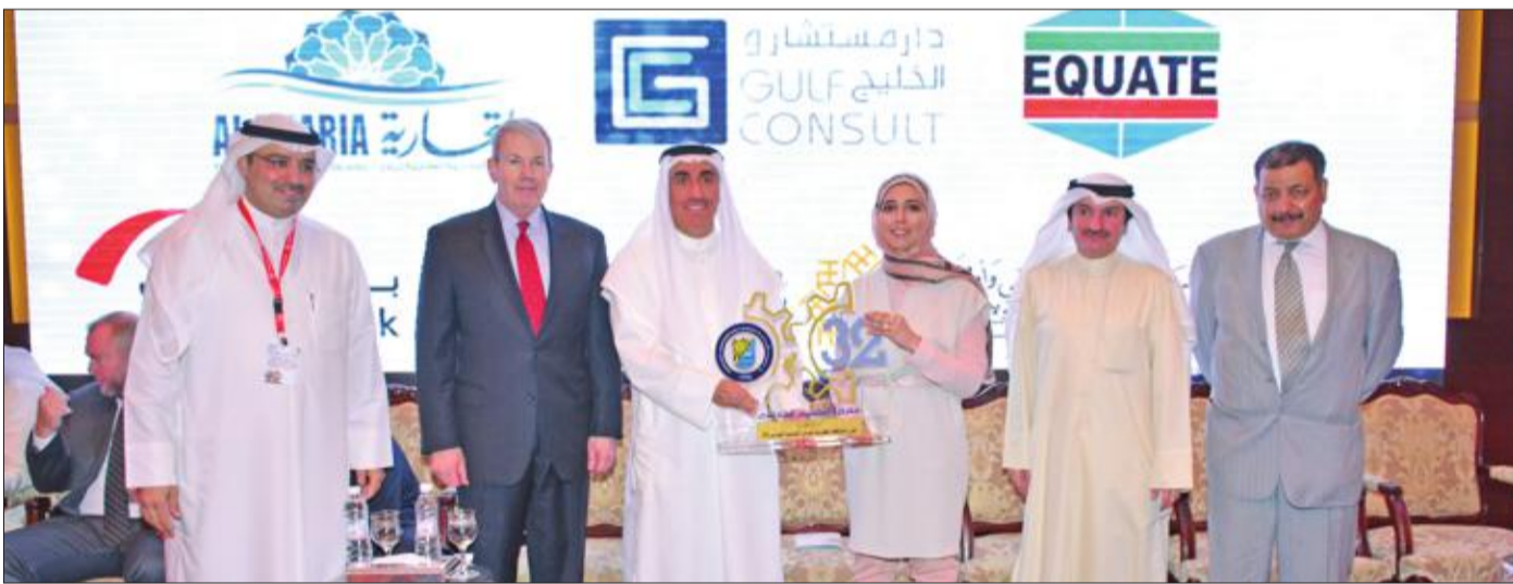
دع مقدمة إلى إحدى الشركات الراعية للمعرض