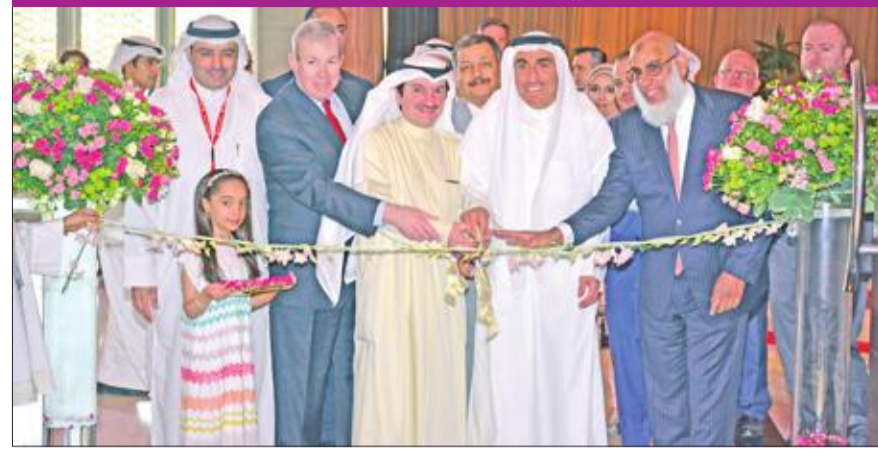
قص شريط الافتتاح

أقيم معرض التصميم الهندسي الـ 32 لطلبة كلية الهندسة في فندق كراون بلازا برعاية وزير التجارة والصناعة ووزير الدولة لشؤون الشباب خالد الروضان، وحضور مدير جامعة الكويت د. حسين الأنصاري، وبدعم من مؤسسة الكويت للتقدم العلمي لمشاريع التصميم الهندسية. وذكر الأنصاري أن الطلبة قدموا أفكاراً جديدة يمكن تطويرها لدعم خطة التنمية في البلاد، وأن المعرض فرصة للتعرف إلى أفكار الطلبة من خلال عرض مشاريعهم على المجتمع والشركات التي تهتم بالهندسة.