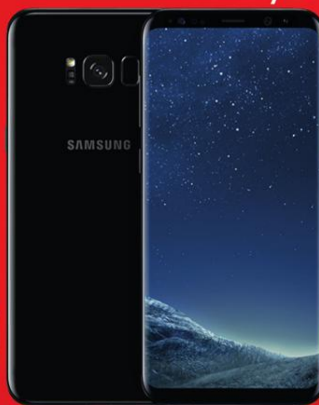
تطبيق الشبكات والأجهزة