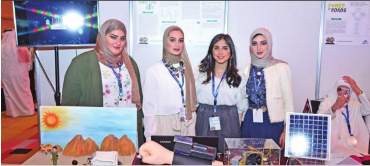
طالبات مشاركات في المعرض