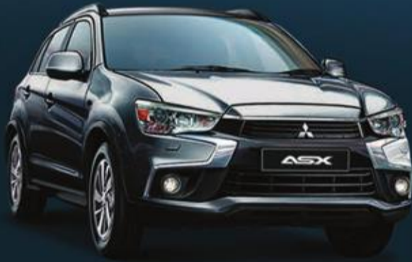
ASX 5,399 د.ك.