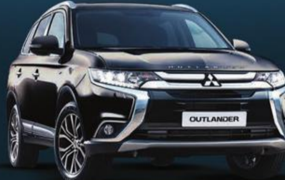
OUTLANDER 6,399 د.ك.