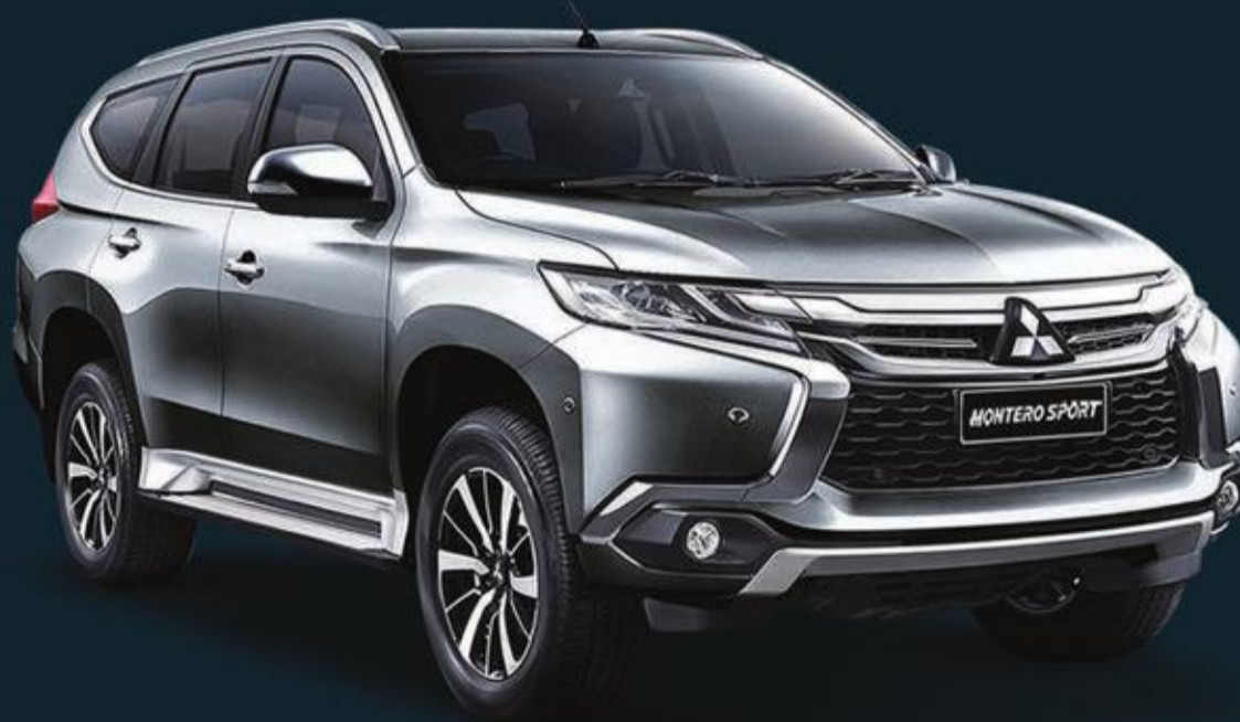
MONTERO SPORT 7,099 د.ك.