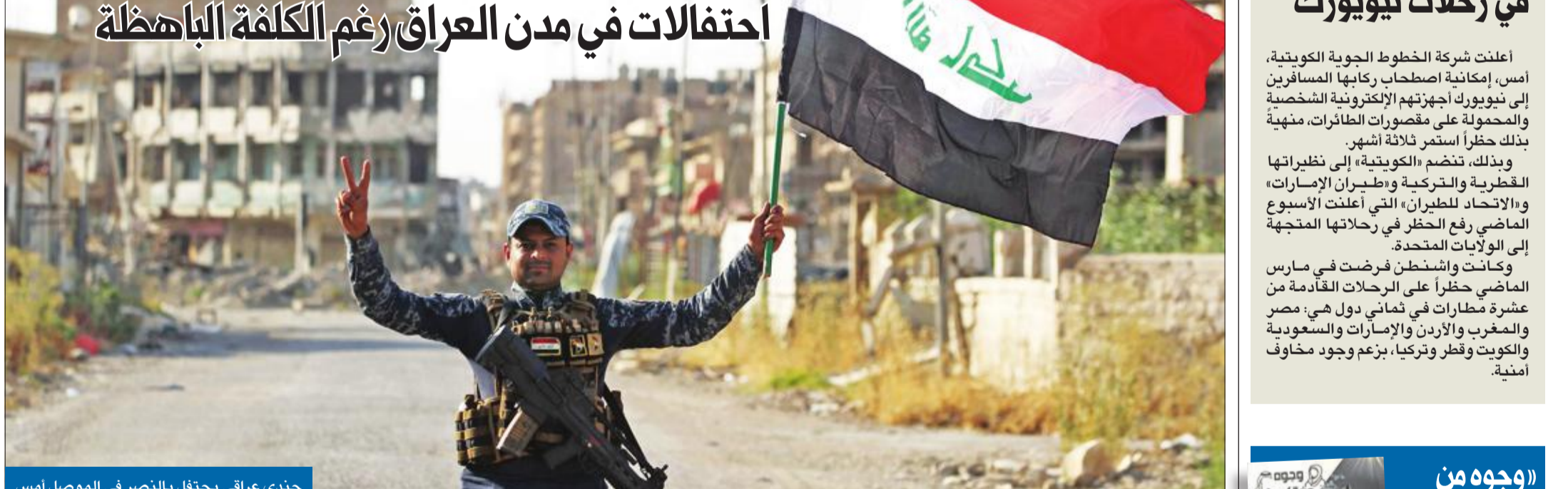
جندي عراقي يحتفل بالنصر في الموصل أمس

بغداد - محمد البصري بعد نحو تسعة أشهر من انطلاق عملية استعادة ثاني أكبر مدن العراق من تنظيم «داعش» الإرهابي، في عملية عسكرية وُصفت بأنها الأشرس منذ سقوط نظام صدام حسين، زار رئيس الحكومة حيدر العبادي، أمس، مدينة الموصل، مركز محافظة