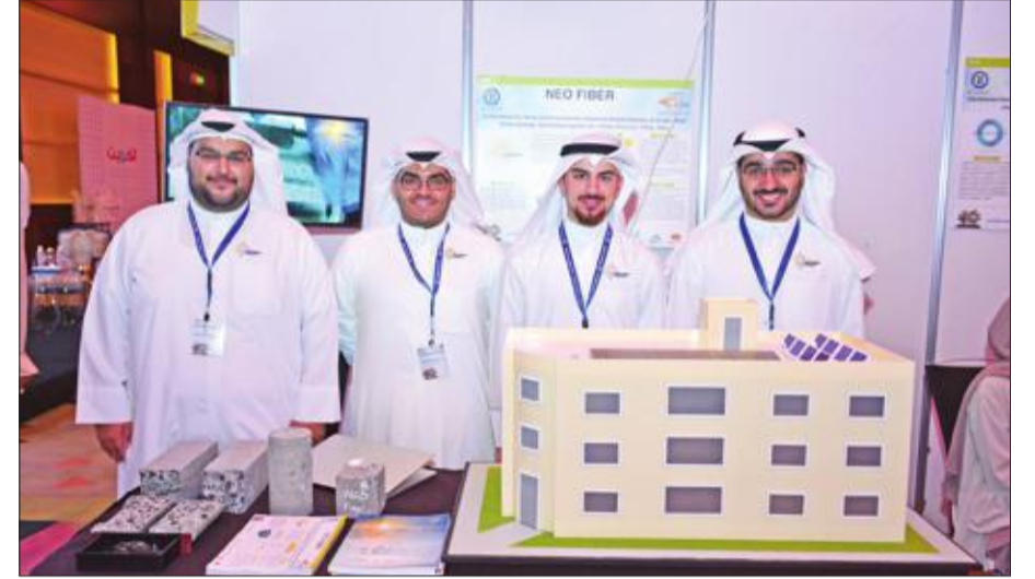
طلاب مشاركون في المعرض يعرضون مشروعاتهم