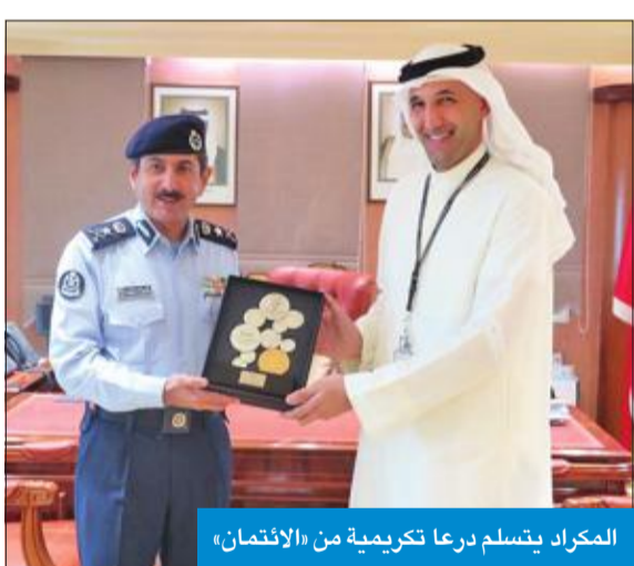
المكراد يتسلم درعا تكريمية من «الائتمان»

من المشروع التي تشمل جميع المباني الاستثمارية أيا كانت ارتفاعاتها، تليها المرحلة الثالثة التي خصصت للمباني الصناعية، فيما تتضمن المرحلة الرابعة المباني التجارية. وذكر أن نجاح كل مرحلة من عملها يرجع إلى كفاءة المكاتب الهندسية، ومدى مطابقتها لنظم واشتراطات «الإطفاء»، ما سينعكس على إنجاز التراخيص بالسرعة اللازمة.