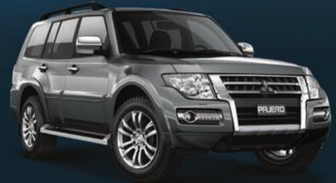
PAJERO 8,099 د.ك.