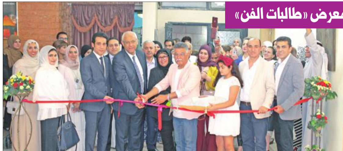
قص شريط الافتتاح