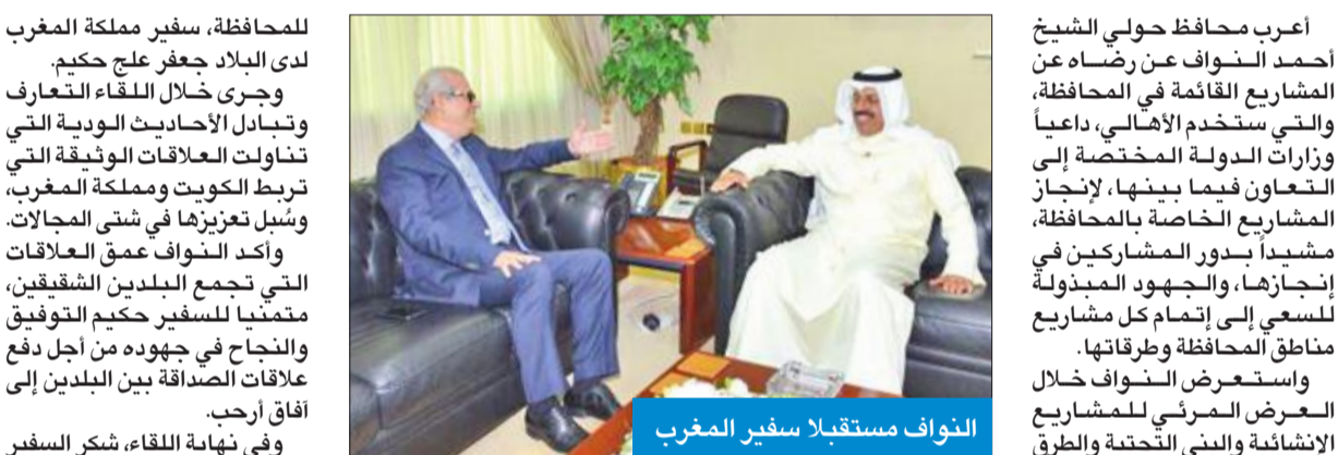
النواف مستقبلاً سفير المغرب لدى البلاد جعفر عالج حكيم.

وزير الأشغال العامة م. عواطف الغنيم، أن محافظة حولي من أهم المحافظات التي تسعى الوزارة لاستحداث مشاريع عديدة فيها، سواء للطرق أو المباني أو تطوير المناطق، لافتة إلى أنه من خلال الاجتماعات الدورية ما بين وزارات الدولة تكون هناك مراجعات لتلك المشاريع ونسبة إنجازها. من جانب آخر، استقبل محافظ حولي الفريق أول م. الشيخ أحمد النواف، في مكتبه بالديوان العام للمحافظة، سفير مملكة المغرب لدى البلاد جعفر عالج حكيم. وجرى خلال اللقاء التعاريف وتبادل الأحاديث الودية التي تناولت العلاقات الوثيقة التي تربط الكويت ومملكة المغرب، وسبل تعزيزها في شتى المجالات. وأكد النواف عمق العلاقات التي تجمع البلدين الشقيقين، متمنياً للسفير الحكيم التوفيق والنجاح في جهوده من أجل دفع علاقات الصداقة بين البلدين إلى آفاق أرحب. وفي نهاية اللقاء، شكر السفير حكيم محافظ حولي على حسن الاستقبال، مشيداً بالعلاقات التاريخية والمتميزة بين الكويت والمغرب، والتعاون الكبير بينهما في كل المجالات بما يخدم مصالح الشعبين الشقيقين.