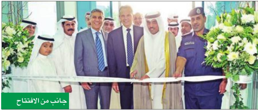
جانب من الافتتاح

جهز البنك الاهلي المتحد فرعه الجديد بكل التجهيزات الحديثة والتصميمات العصرية لضمان مستوى خدمة متميزة وتوفير الوقت للعميل.