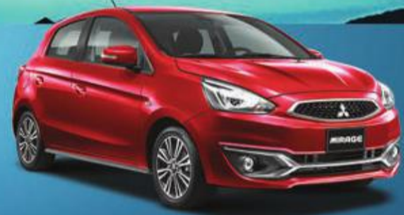
MIRAGE 2,899 د.ك.