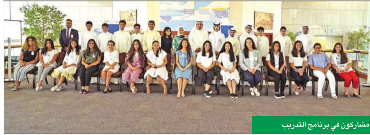
مشركون في برنامج التدريب

افتتح بنك الكويت الوطني أولى دورات برنامجه السنوي للتدريب الصيفي لعام 2017، والمخصص لطلبة المدارس والكليات الذين تتراوح أعمارهم بين 14 و 21 عاماً، بحضور الرئيس التنفيذي صلاح الفليح. ويأتي تنظيم «الوطني» للبرنامج، انطلاقاً من التزامه بمسؤولياته الاجتماعية، وليضاف إلى مبادرات البنك السنوية الهادفة إلى توفير جميع أشكال الدعم للشباب، لا سيما الطلبة.