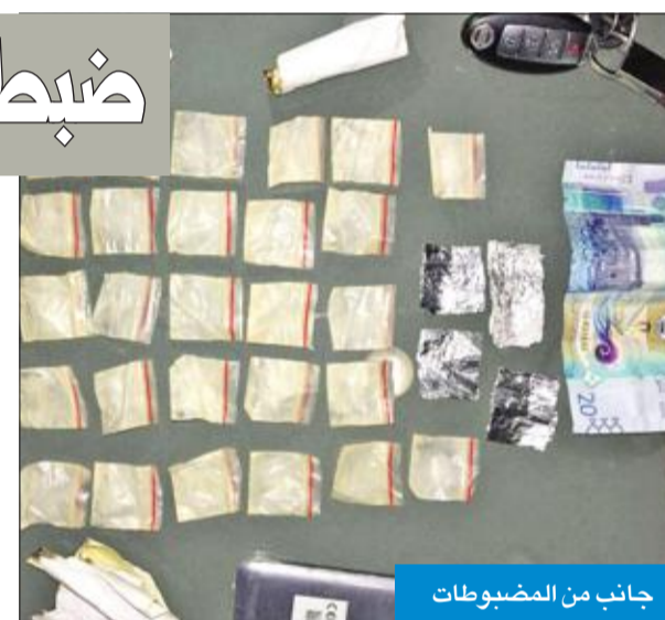
جانب من المضبوطات