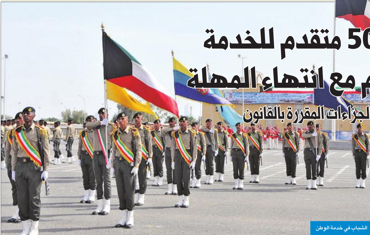
الشباب في خدمة الوطن