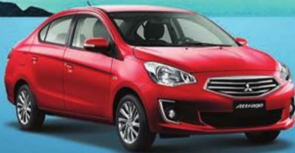
Attrage 3,199 د.ك.