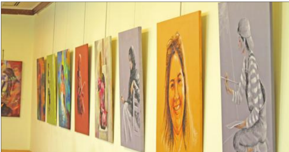
عدد من لوحات المعرض