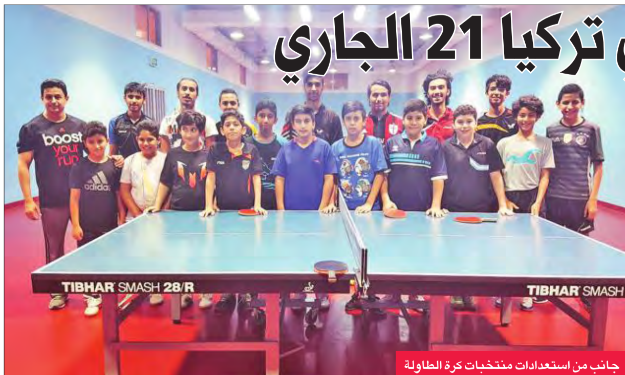
جانب من استعدادات منتخبات كرة الطاولة

أمرًا طبيعياً، في ظل الإيقاف المفروض على نشاطنا الخارجي، مع العلم بأننا كنا أبطال العرب في آخر مشاركة عربية لنا".