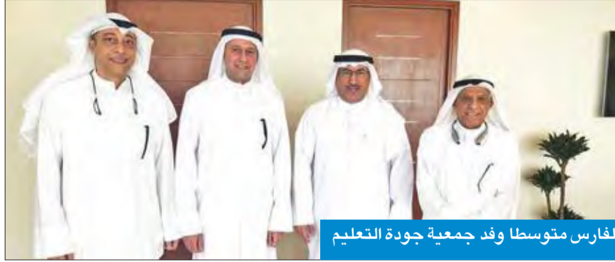
الفارس متوسط وفد جمعية جودة التعليم

كما يمكن للسادة المساهمين القوام مراجعة الشركة على العنوان: مشرق شارع خالد بن الوليد - برج كيبكو - الدور (٤٢) ت ٢٢٩١٠٦٦٦ مجلس الإدارة