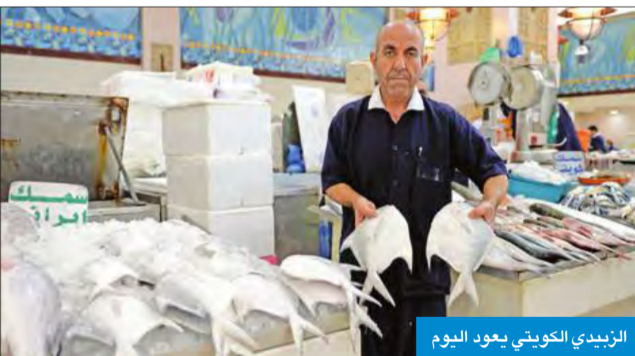
الزبيدي الكويتي يعود اليوم

صيد الروبيان بالمياه الدولية في 1 أغسطس، حتى تتمكن من تجهيز التصاريح قبل بداية الموسم، لأن أصحاب لشركات صيد اتحاد الصيادين والخاصة