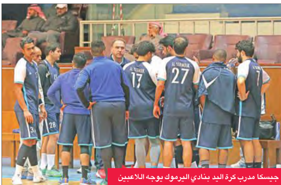
جيسكا مدرب كرة اليد بنادي اليرموك يوجه اللاعبين

يتمتع بخبرة جيدة وقراءة مميزة لفريق الدوري نتيجة توليه تدريب الفريق أواخر الموسم الماضي، متمنياً أن يظهر اليرموك بالشكل والمستوى اللائق، وأن يكون منافسًا قويًا في الموسم الجديد.