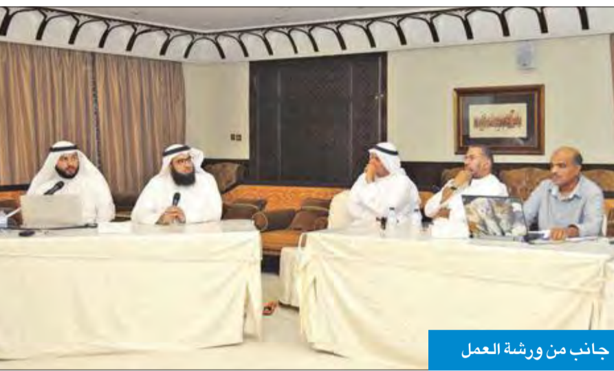
جانب من ورشة العمل

عمل المسار ستسهل الكثير من الأمور التي ربما تكون عائقاً أمام حملات الحج، لإسبما خاصية الدفع الإلكتروني التي حازت ثناء أصحاب الحملات الكويتية للجهود المبذولة من قبل الوزارة، لتسهيل أمور الحجاج، موضحاً أن ممثلي حملات الحج لديهم الخبرة الكافية لاستخدام المسار، إذ لم يواجهوا أي مشاكل تذكر أثناء عملهم على المسار الإلكتروني.