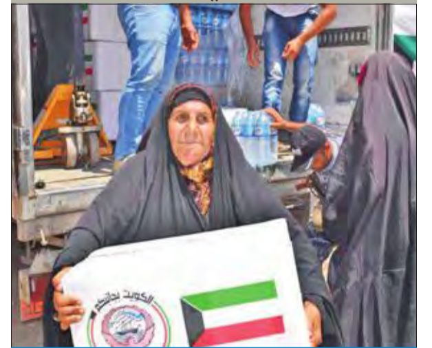
جانب من توزيع المساعدات الكويتية في الموصل

واصلت الكويت جهودها الإنسانية لدعم الدول التي تعاني وييلات الحروب والكوارث.