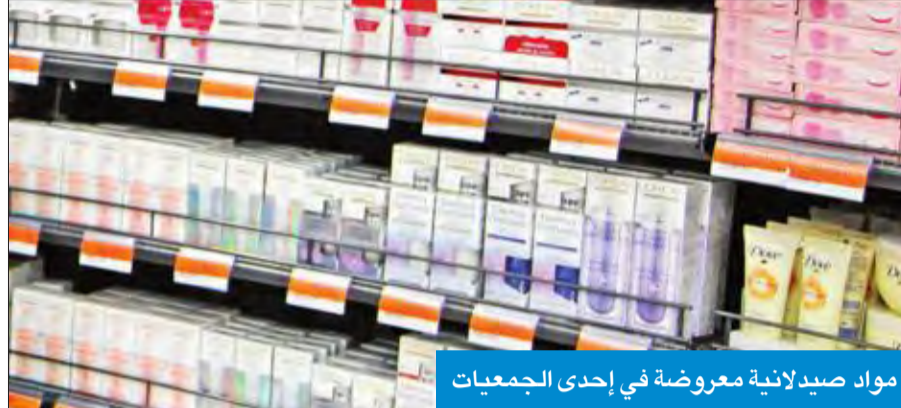
مواد صيدلانية معروضة في إحدى الجمعيات

«الجمعيات التعاونية بضرورة سحب أي مواد أو منتجات تحتوي على مواد صيدلانية غير مسموح بتداولها»، شددت على أن «ثمة عقوبات ستخدها الوزارة حيال المخالفين وغير المتعاونين في هذا الصدد، إلى جانب العقوبات التي حددها المرسوم بقانون (28 / 1996) الصادر بشأن تنظيم مهنة الصيدلة وتداول الأدوية».