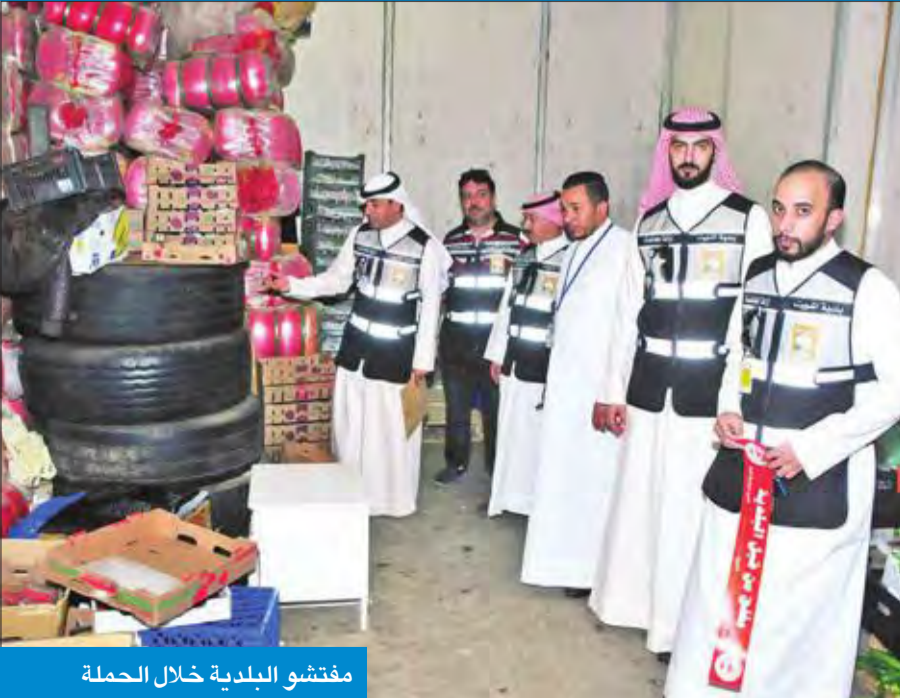
مفتشو البلدية خلال الحملة

حملات التفتيش مستمرة في جميع المحافظات، مضيفاً أن حملات العاصمة أسفرت عن غلق قسيمة إدارياً بمنطقة الشويخ، تحتوي على 39 براداً للمواد الغذائية، ما يبرهن على أن البلدية وضعت على عاتقها صحة وسلامة المادة الغذائية التي تقدم للمواطنين والمقيمين، والتأكد من التزام أصحاب تلك المخازن بالاشتراطات الصحية طبقاً للوائح وأنظمة البلدية.