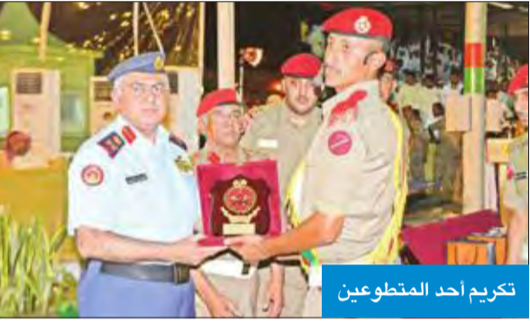
تكريم أحد المتطوعين

احتفلت قيادة الشرطة العسكرية، مساء أمس الأول، بتخريج دورة المتطوعين الأغرار رقم (81) من أبناء الكويتيات، بحضور رئيس هيئة التعليم العسكري اللواء الركن أنور المرزوقي، بعدما أنهوا فترة التدريب الأساسي بنجاح ليلتحقوا بوحدة الجيش المختلفة.