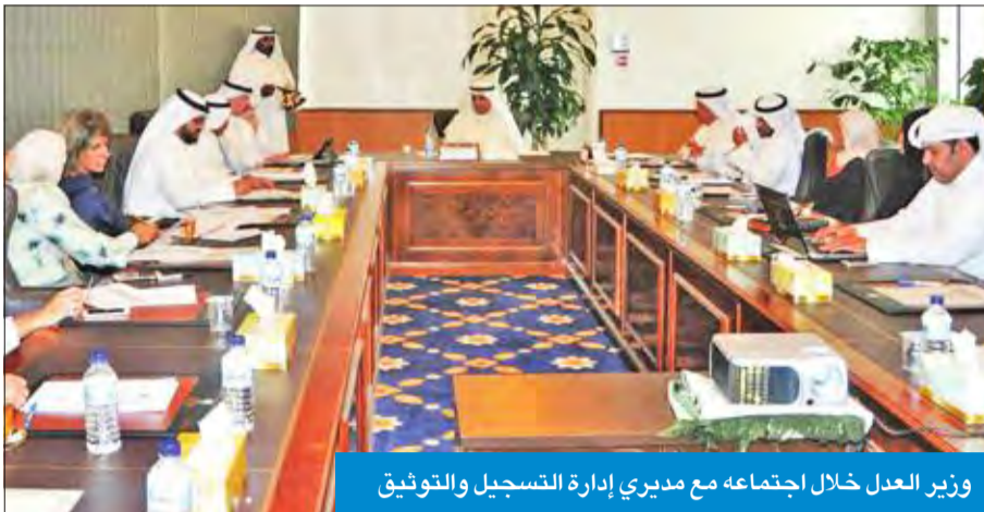
وزير العدل خلال اجتماعه مع مديري إدارة التسجيل والتوثيق

وأضاف «نتوقع المزيد من التعاون من جانب الدول العربية خصوصا الكويت»، من أجل الاستمرار في مكافحة ما يسمى بتنظيم الدولة الإسلامية (داعش)، ليس فقط على الصعيد العسكري وإنما على الصعيد الديدولوجي أيضاً. وأعرب الدبلوماسي