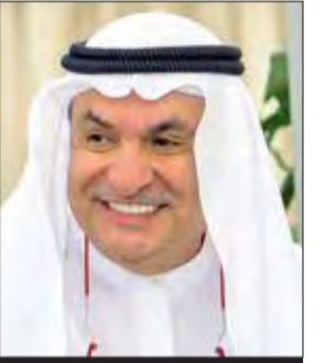
بقلم محمد جاسم الصقر رئيس مجلس العلاقات العربية والدولية

يا صاحب السمو، هذه رسالة من أحد أبنائك، الذين قدّر لهم أن يعيشوا معك ما يقارب أربعة عقود من الزمن، عشقتها مع سموك في السراء والضراء، شهدت فيها معكم أفراح البلاد وأتراحها، مجتمعين في كلتا الحالتين على حب الكويت وأحلامنا بأن نراها يوماً أقوى وأجمل، اختلفنا واتفقنا، وكان الأصل الكويت ومستقبلها، وكانت اختلافاتنا بشأن ما هو الصالح للبلد، وأنفع لاهلها... تعلمت منكم عبر هذه السنوات أن أقول رايي لسموكم بتجرّد، وبلا تردّد، فكنتم خير من يسمع، وأصدق من يُقنع. عايشتك، يا صاحب السمو، في أصعب التجاذبات السياسية المحلية، وعاشرتك عن قرب في أحلك التوترات والاضطرابات الإقليمية والدولية، لذا أقرُّ لسموكم، بل كل أهل الكويت يقرون لا أنا فقط، بأنكم حميت البلاد، وحفظتموها بأمان واستقرار وطمانينة.