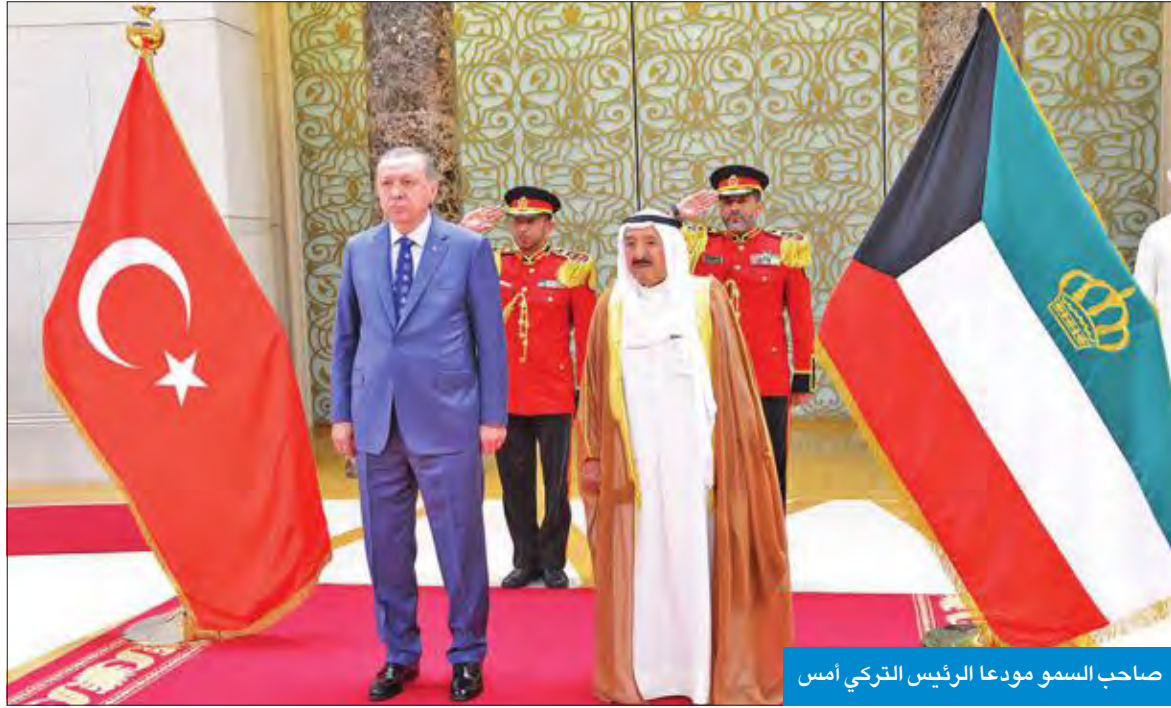
صاحب السمو مودعا الرئيس التركي أمس

غادر البلاد، صباح أمس، رئيس الجمهورية التركية رجب طيب إردوغان والوفد الرسمي المرافق له، بعد زيارة عمل للكويت، أجرى خلالها مباحثات رسمية مع صاحب السمو أمير البلاد الشيخ صباح الأحمد. وكان على رأس مودعيه على أرض المطار صاحب السمو أمير البلاد الشيخ صباح الأحمد، ورئيس مجلس الأمة مرزوق الغانم، ورئيس مجلس الوزراء سمو الشيخ جابر المبارك، والنائب الأول لرئيس مجلس الوزراء وزير الخارجية الشيخ صباح الخالد، ونائب رئيس مجلس الوزراء وزير الدفاع الشيخ محمد الخالد، ونائب رئيس مجلس الوزراء وزير الداخلية الشيخ خالد الجراح، ونائب رئيس مجلس الوزراء وزير المالية أنس الصالح، والمستشار بالديوان الأميري محمد صيف الله شرار، ووزير الدولة لشؤون مجلس الوزراء وزير الإعلام بالوكالة الشيخ محمد عبدالله، وكبار القادة بالجيش والشرطة، والحرس الوطني، والإدارة العامة للاطفاء.