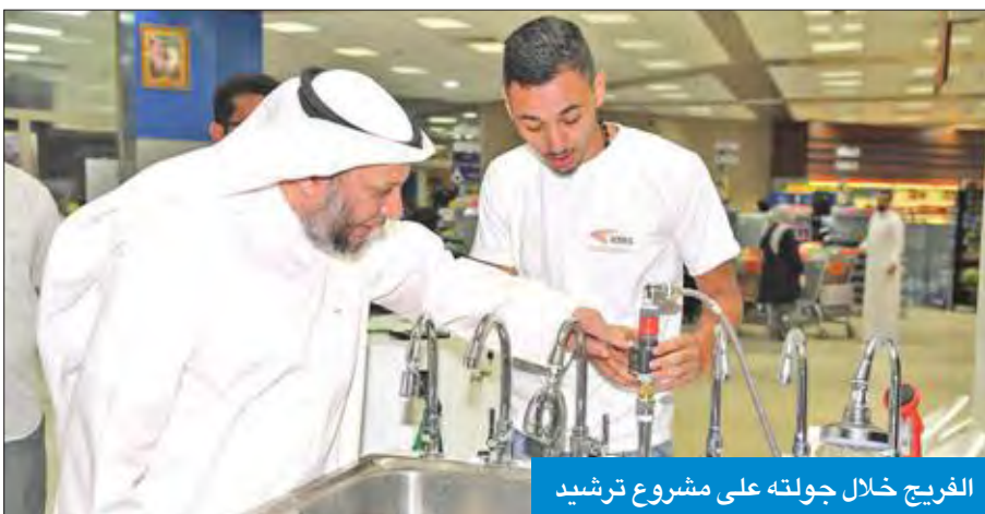
الفريج خلال جولته على مشروع ترشيد