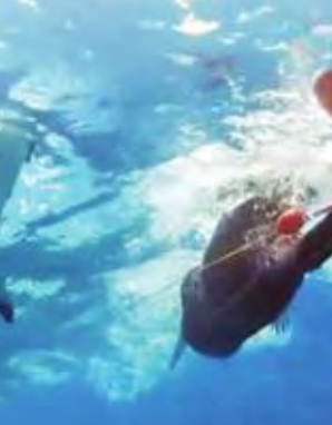
فيلبس والقرش الأبيض