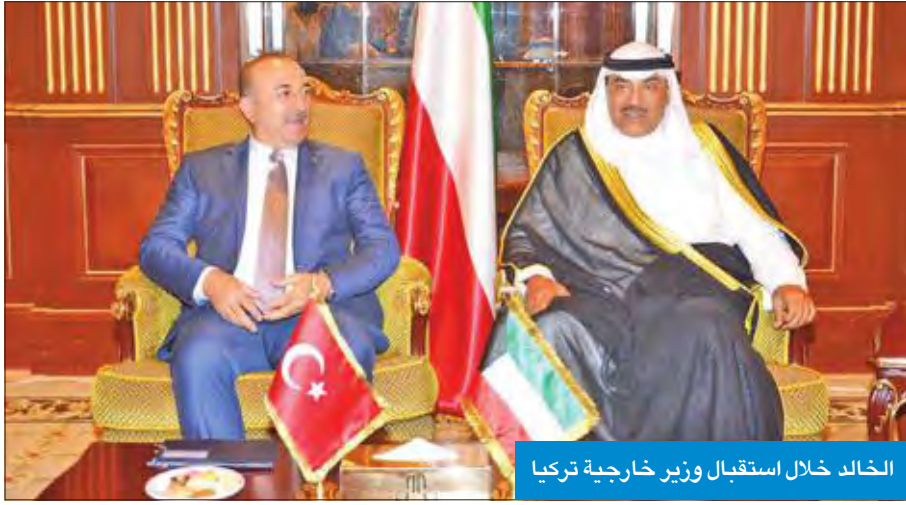
الخالد خلال استقبال وزير خارجية تركيا

التي قام بها رئيس الجمهورية التركية رجب طيب إردوغان إلى البلاد. وتم خلال اللقاء بحث سبل تعزيز العلاقات الثنائية الوطيدة بين البلدين الصديقين في كل المجالات ومختلف الصعد، إضافة إلى مناقشة آخر التطورات على الساحتين الإقليمية والدولية.