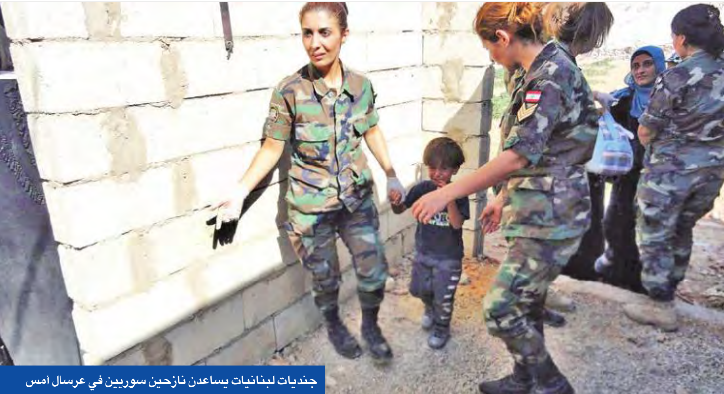
جنديات لبنانيات يساعدن نازحين سوريين في عرسال أمس

وردت على البيان، اعتبر رئيس حزب "التوحيد العربي"، الوزير السابق وثام هباب أن "مشاركة حزب الله في الحرب المستقبل لن تقع في هذه الخطيئة الوطنية، مهما بلغ حجم التهديدات والرسائل المكتوبة والمتفردة التي تهدد المعارضين على سياسات "حزب الله" بالقتل والإبادة والملاحقة". وعبر "المستقبل" عن أسفه لتلك الدونية في مقاربة الاعتراض السياسي على زج لبنان بالحرب السورية، مؤكداً موقفه المبدئي الذي لا تراجع عنه، ويتمسك باعتباره الجيش اللبناني والقوى الأمنية الشرعية، الأداة الحصرية للدفاع عن لبنان واللبنانيين وحماية الحدود.