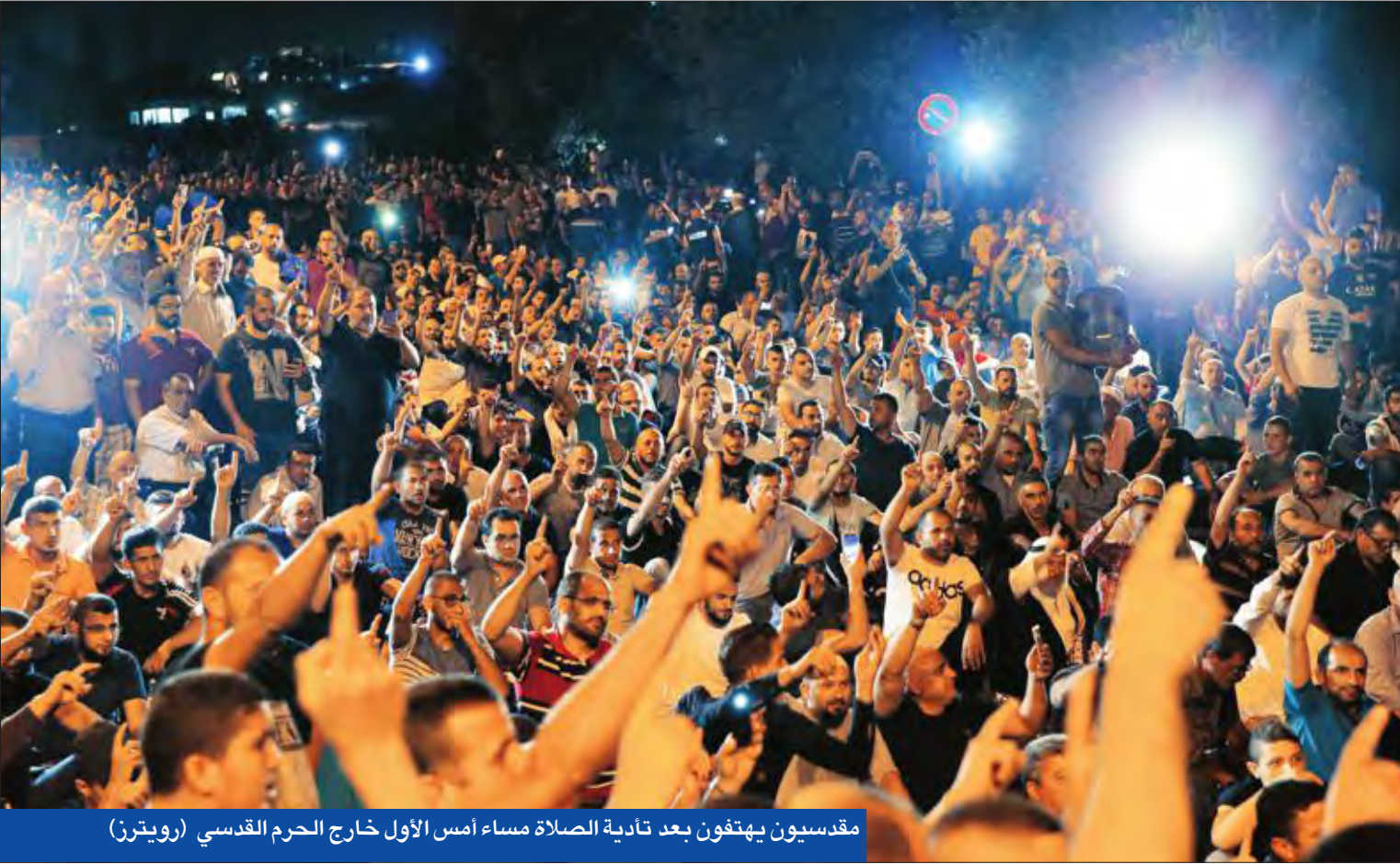
مقدسيون يهتفون بعد تادية الصلاة مساء أمس الأول خارج الحرم القدسي

عمان تطلب التحقيق مع حارس إسرائيلي قتل أردنيين... وتنتياهو يتعهد بإعادته