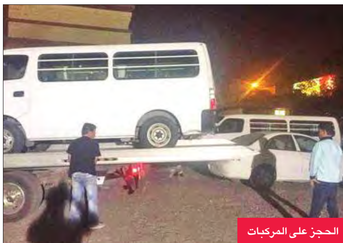
الحجز على المركبات

حصل عضو في الجمعية العمومية بنادي خيطان، شُطب منذ عام 2014، على حكم من محكمة التمييز بالعودة، مع الحصول على تعويض مالي وأدبي، وهو ما يفتح الباب أمام أحكام مماثلة لقرابة 1000 عضو، ويضع خيطان في ورطة حقيقية.