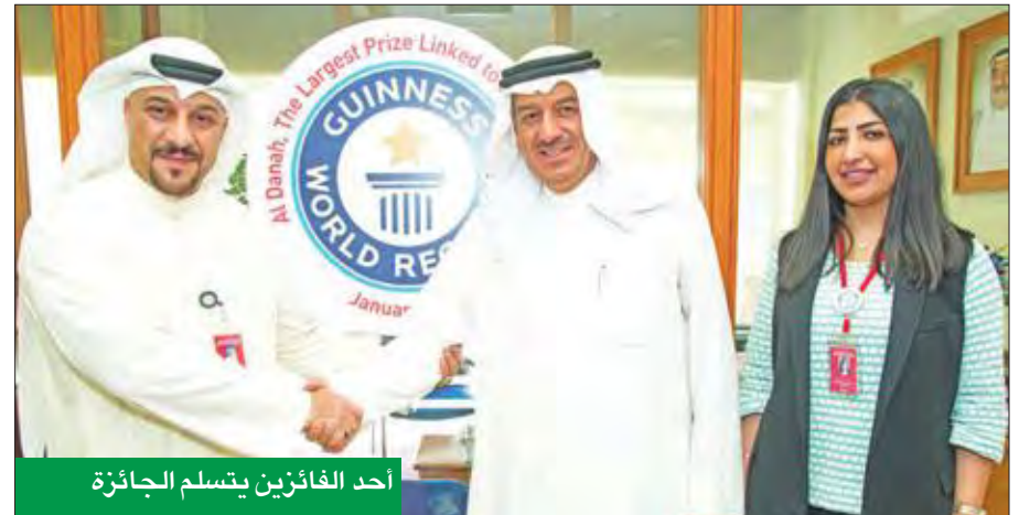
أحد الفائزين يتسلم الجائزة