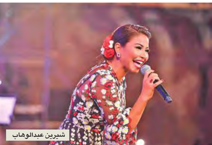
شيرين عبد الوهاب

النجوم اللبنانيون غابوا عن الساحل لارتفاع أجورهم