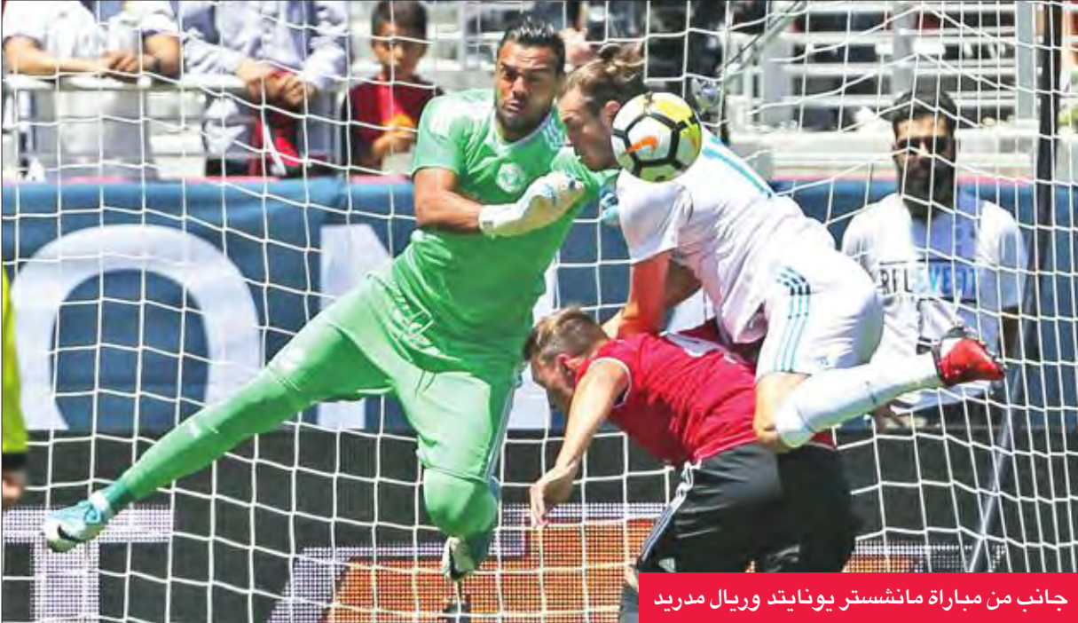
جانب من مباراة مانشستر يونايتد وريال مدريد

ونجمه البرتغالي كريستيانو رونالدو، الذي لا يزال يمضي عطلة الصيف، بسبب تأخر نهاية موسمهم، لمشاركته مع منتخب بلاده في كأس القارات التي أقيمت في روسيا بين يونيو ويوليو.