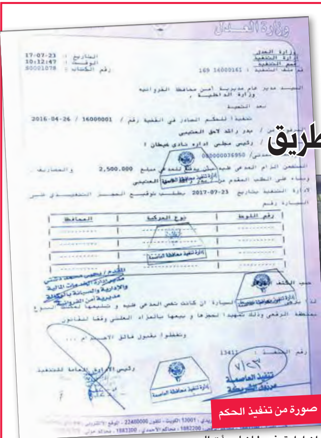
صورة من تنفيذ الحكم