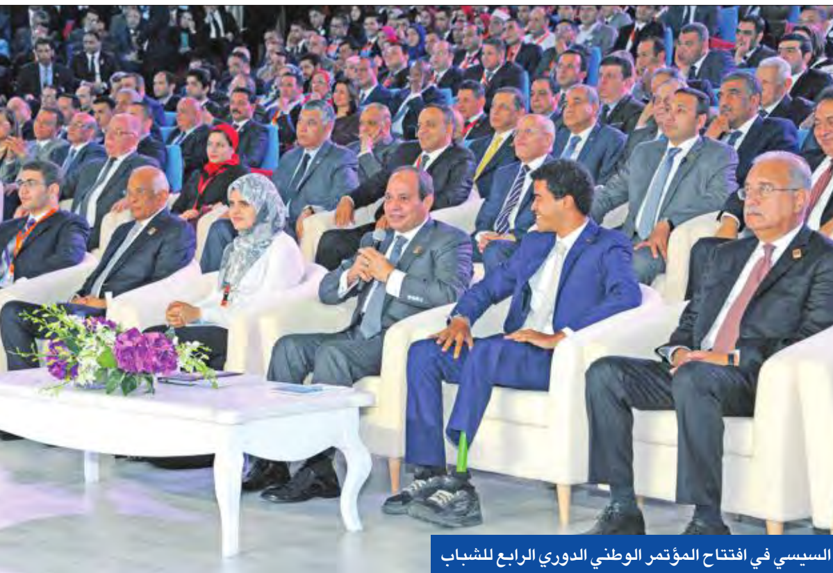
السياسي في افتتاح المؤتمر الوطني الرابع للشباب