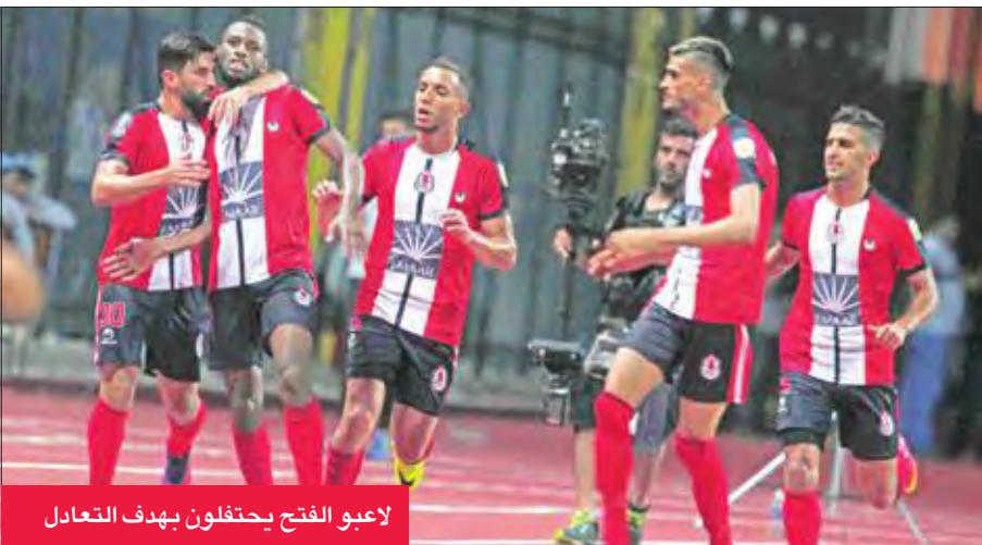
لاعبو الفتح يحتفلون بهدف التعادل