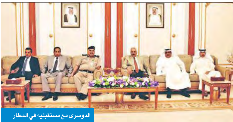
الدوسري مع مستقبليه في المطار

اطلع على أولى الطائرات العمودية المخصصة لـ «الداخلية»