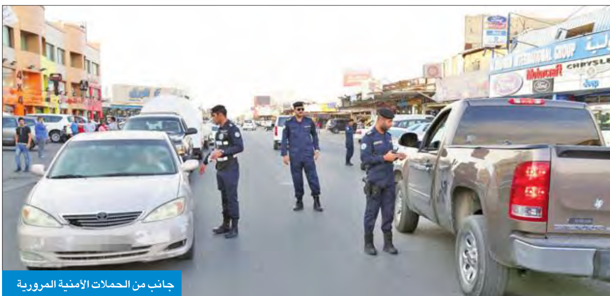
جانب من الحملات الأمنية المرورية

إحالة 32 حدثاً إلى نيابة الأحداث لقيادتهم مركبات من دون رخص قيادة