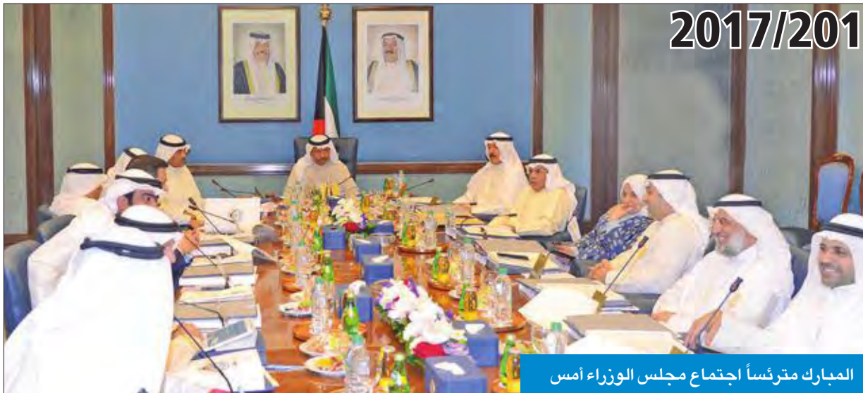
المبارك مترئساً اجتماع مجلس الوزراء أمس

بينما اعتمد مجلس الوزراء الحسابات الختامية عن السنة المالية 2016/2017، وافق على إحالة ملف تضخم حساب العهد للوزارات والجهات الحكومية إلى ديوان المحاسبة.