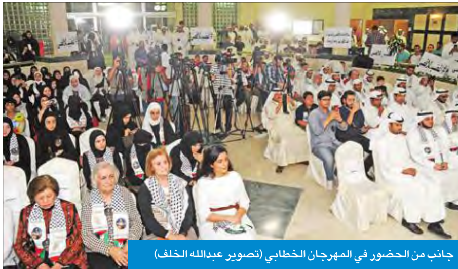
جانب من الحضور في المهرجان الخطابي

وأوضحت أن القضية اليوم ليست قضية إغلاق الأقصى في وجه المتعبدين القاصدين وجهه، بل هي قضية إغلاق باب