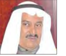
السفير يوسف عبدالله النيزري