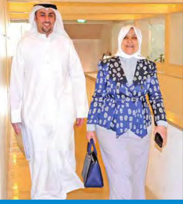
الصبيح في مجلس الأمة (أرشيف)

ضد الوزارة 157 قضية، والأحكام الصادرة لصالح الوزارة 130، والأحكام الصادرة ضد الوزارة 27، أما فيما يتعلق ببيان عما إذا قامت الوزارة بأي دراسة أو تقييم للقانون رقم 118 لسنة 2013، فنود الإفادة بأن الوزارة تقوم حالياً بدراسة وتقييم بعض مواد القانون المشار إليه، وتعمل على تعديله فيما يصب في المصلحة العامة».