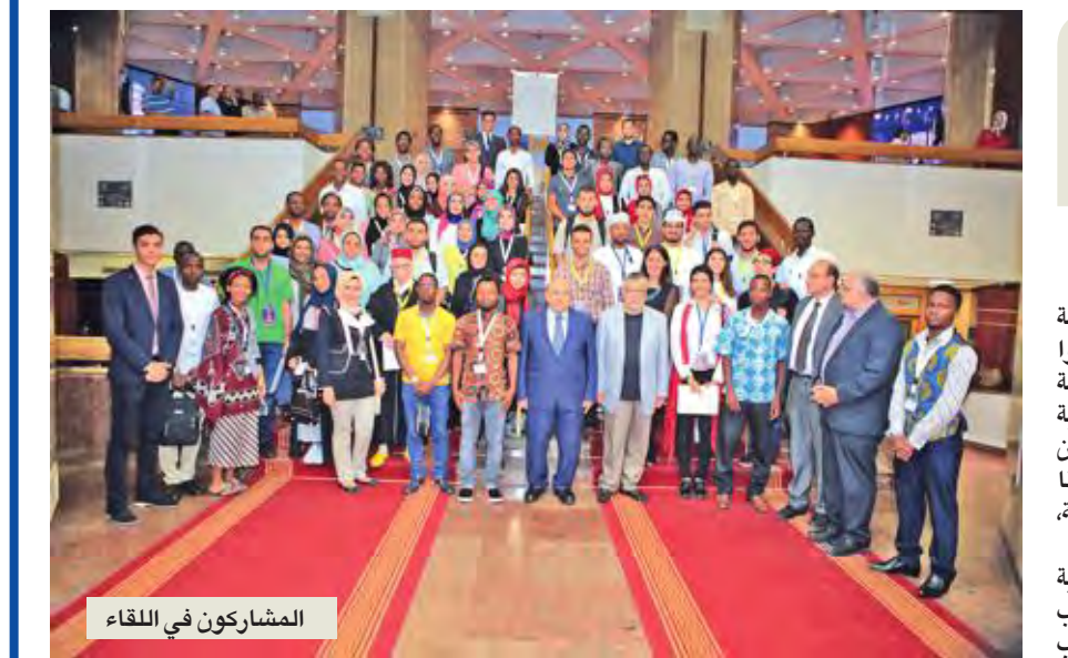
المشاركون في اللقاء

طالب رئيس اتحاد الكتاب العرب والكاتب والأديب الإماراتي حبيب الصايغ، الحكومات العربية بضرورة تحسين الشباب العرب بالتعليم والتوير والثقافة لمواجهة خطر التطرف والإرهاب الذي تعانيه المجتمعات العربية والإسلامية، وأن تكون «الثقافة» في العالم العربي هي القائد وليست السياسة.