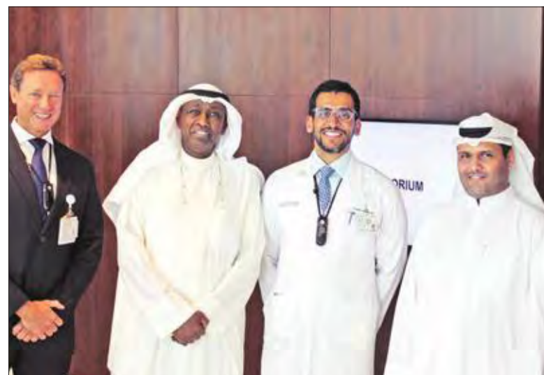
أمان متفقداً مستشفى «كليفاند كلينيك أبوظبي»

أمان تفقد أوضاع المرضى في «كليفاند كلينيك أبوظبي»