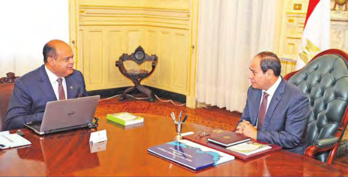
السياسي مجتمعاً بمحافظ مطروح اللواء علاء أبو زيد في القاهرة أمس

وفيما تتواصل مواجهة قوات الجيش والشرطة للارهاب، حذر الرئيس المصري مما وصفه بسحاولات بث إسقاط الدولة بين المصريين»، وأكد أن استراتيجية النظام هي تثبيت الدولة المصرية، ومحاور الحركة التي تعاملت معها الحكومة على مدار السنوات الأربع الماضية، هي معالجة كل الأسباب التي تؤدي إلى إسقاط الدولة، مشدداً على أن هناك محاولات لنزع سقوط الدولة، وأشار السياسي، خلال مشاركته في جلسة «البيات الصعبة مناخ خصب، الناس عازوه أداء جيد، لكن الأداء الجيد مش هيجي دلوقت، وأي نقد فيه هيجي نقد في محله، لكن النقد في محله بيأثر في ثبات الدولة، لازم نقفي عارفين إنا هناخد مرحلة لأمينة ويجب أن نكون متماسكين». وبدأت أجهزة الدولة