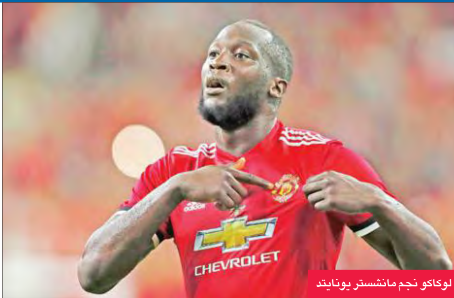
لوكاكو نجم مانشستر يونايتد

لا خوف على المستقبل لأن «الربحية تتحسن. الأمر الأكثر أهمية هو أن تكون تكاليف اللاعبين نسبة مئوية من حجم الأعمال».