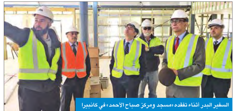
السفير البدر أثناء تفقده «مسجد ومركز صباح الأحمد» في كانبيرا

وأوضح البدر إنه التقى عددا من المسؤولين والمهندسين المنفذين للمشروع، للاطلاع على مراحله النهائية. وكان البدر وقع اتفاقية مع مركز كانبيرا الإسلامي في إبريل 2016 تم بموجبها تمويل الكويت مشروع إنشاء مسجد ومركز صباح الأحمد للدراسات الإسلامية. ويهدف المشروع الى مساعدة اعضاء الجالية المسلمة في كانبيرا على الاندماج في المجتمع، من خلال إتباع القوانين واحترام القيم الثقافية، والالتزام بنشر رسالة الدين الإسلامي المنجسة في الاعتدال والتسامح وبناء جسور للحوار والتعاون البناء.