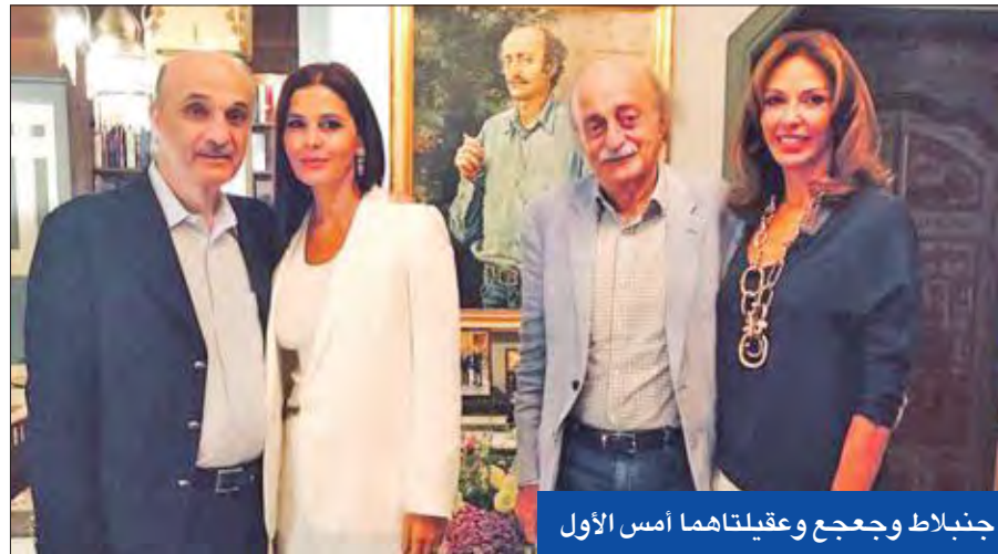
جنبلاط وجعج وعقيلتها أمس الأول

استمرار التنسيق لاسيما في العمل الحكومي والتشريعي، بما يساهم في علاج الكثير من القضايا الحياتية والمعيشية للمواطن اللبناني». وتابع: «يكتسب اللقاء أهمية كبيرة في هذه المرحلة بالذات، وفي ظل التطورات المتسارعة التي يشهدها لبنان والمنطقة، وعلى أبواب الانتخابات النيابية التي لن يخوضها الحزب التقدمي الاشتراكي إلا تحت سقف المصالحة وضمن الائتلاف الوطني الأوسع الذي يستطع تحقيقه في الجبل».