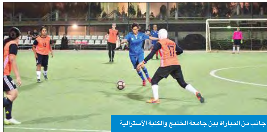
جانب من المباراة بين جامعة الخليج والكلية الأسترالية