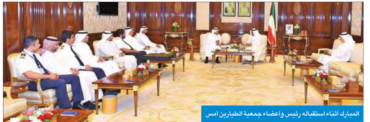
المبارك أثناء استقباله رئيس وأعضاء جمعية الطيارين أمس

استقبل سمو رئيس مجلس الوزراء الشيخ جابر المبارك، في قصر بيان، أمس، رئيس وأعضاء جمعية الطيارين ومهندسي الطيران الكويتية.