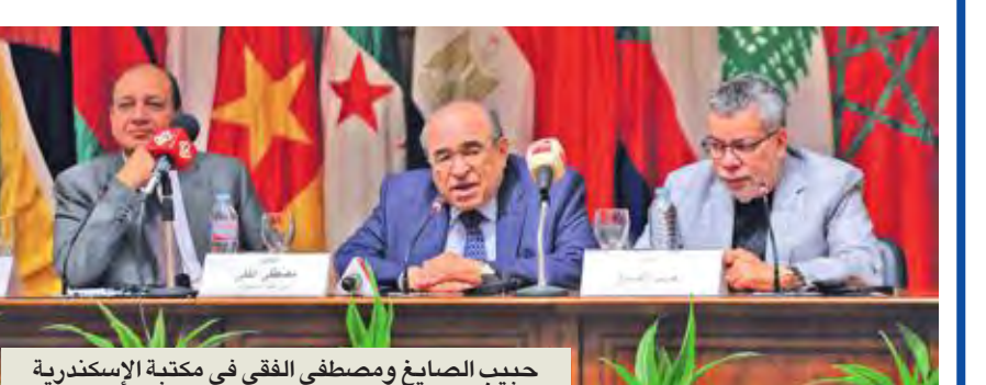
حبيب الصايغ ومصطفى الفقي في مكتبة الإسكندرية

ضمن مجموعة اللقاءات التي تنظمها مكتبة الإسكندرية لاستطلاع آراء النخبة والمثقفين والشباب حول مستقبلها خلال السنوات المقبلة، عقد أخيراً لقاء مع مئة شاب وفئة من مصر وعدد من الدول العربية والإفريقية، من بينها: السعودية، والبحرين، وسلطنة عمان، وتونس، والأردن، وموزبيق، وجنوب إفريقيا، وسالواي، لاستطلاع آراءهم بشأن مستقبل الثقافة العربية والإفريقية، بحضور مدير المكتبة مصطفى الفقي، ومدير إدارة المشروعات د. خالد عزب. رئيس اتحاد الكتاب العرب والكاتب والأديب الإماراتي حبيب الصايغ الذي شارك في اللقاء، أعلن تخصيص العام المقبل ليكون عاماً للكتاب العرب، والترتيب لإقامة أول قمة ثقافية «عربية- إفريقية» برعاية جامعة الدول العربية، إضافة إلى تنظيم مؤتمر عالمي للكتاب نجيب محفوظ في سبتمبر المقبل، مع إعادة طباعة بعض الكتب النقدية عنه، وزيارة الأماكن والمقاهي التي كان يكتب فيها، قائلا: «نحن في الوطن العربي نعمل على الثقافة كثيراً»، مشيراً إلى ضرورة تبادل الثقافات بين الدول، خصوصاً في العمق الإفريقي. وقال الصايغ إن العلم يواجه العنف والخطرف، كاشفاً أنه عندما سيطر أعضاء تنظيم جماعة