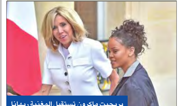
بريجيت ماكرون تستقبل المغنية ربهانا على درج إليزيه أمس

قال الرئيس الفرنسي إيمانويل ماكرون خلال إحياء ذكرى الكاهن جاك هاميل، أمس، إن المراهقين اللذين قتلاه ذبحاً إثر مباحثتهما تنظيم "داعش" فشلاً في إحداث شرخ ديني في فرنسا. وكان الكاهن هاميل (84 عاماً)، يقيم قداماً في كنيسة في بلدة سانت اتيان دو روفريه في شمال البلاد، حين اقتحم المهاجمان الكنيسة وذبحاه أمام 5 من المصلين. وتسبب الهجوم الوحشي في بث الرعب، خصوصاً أنه وقع بعد أقل من أسبوعين على مجزرة نيس التي ذهب ضحيتها 84 قتيلًا و435 جريحاً في 14 يوليو، وارتكبتها تونسيتي وتيناها تنظيم "داعش". وفي حفل تابيني في الكنيسة التي شيدت بالقرن السادس عشر، أشاد ماكرون بالضمان الذي أظهره الفرنسيون المسلمون بعد الهجوم، وعدم تعرض الكاثوليك للاستفزاز. وقال ماكرون إن "الإرهابيين الآنين ظننا أنهما سيتران رغبة لدى الكاثوليك في الانتقام، لكنهما فشل". وفيما أكد الرئيس الفرنسي أن فرنسا "لا تحارب أي ديانة"، شدد ماكرون على أن كل ديانة "لديها دور تلعبه لضمان أن الكراهية لن تكسب أبداً". وشهدت 3 راهبات وزوجان مسنان مقتل هاميل على يد عادل كرميش وعبدالمالك بوتيجان في صباح أحد الأيام. وقتل المهاجمان البالغان 19 عاماً برصاص الشرطة خارج الكنيسة. وحضر القداس أمس المئات بينهم أقارب هاميل، وأعضاء في المجلس الفرنسي للديانة الإسلامية. وخارج الكنيسة، أراح ماكرون الستار عن نصب فولاذي نحت عليه الإعلان العالمي لحقوق الإنسان، فيما كانت حشود تتابع المراسم على شاشة عملاقة. وإذ ذكر بأنه هو من أصدر بوشن ضربة عسكرية بصواريخ كروز على قاعدة الشعيرات الجوية بعد اتهامه الطيران السوري بشن هجوم كيميائي، اضاف ترامب: "أنا لست شخصاً سينظر إلى ذلك ويدعه يفلت مما حاول القيام به". ولم ينس تحميل سلفه باراك أوباما