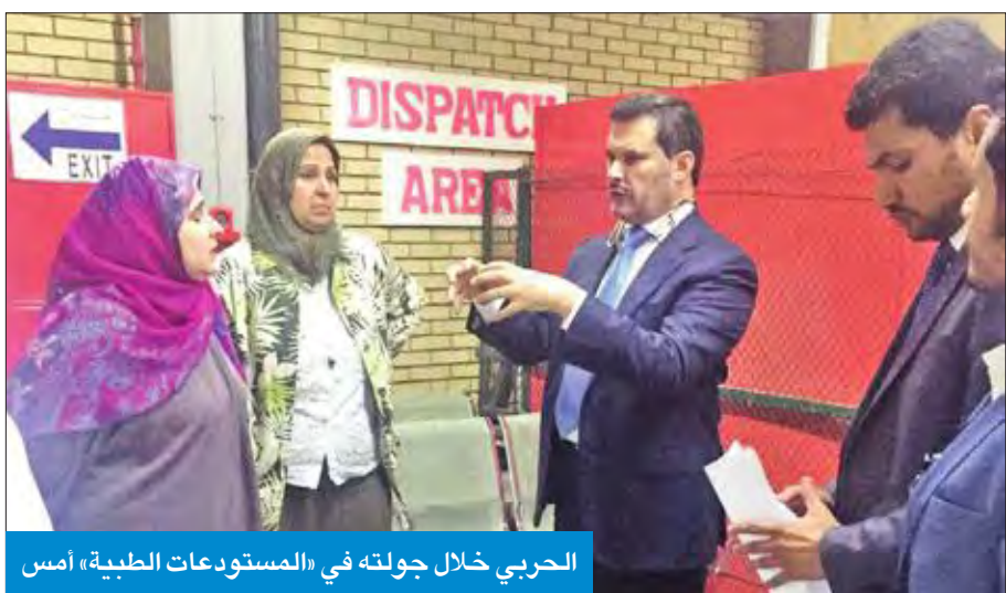
الحربي خلال جولته في «المستودعات الطبية» أمس

«مراجعة سياسات صرف واستخدام الأدوية تفادياً للهدر»