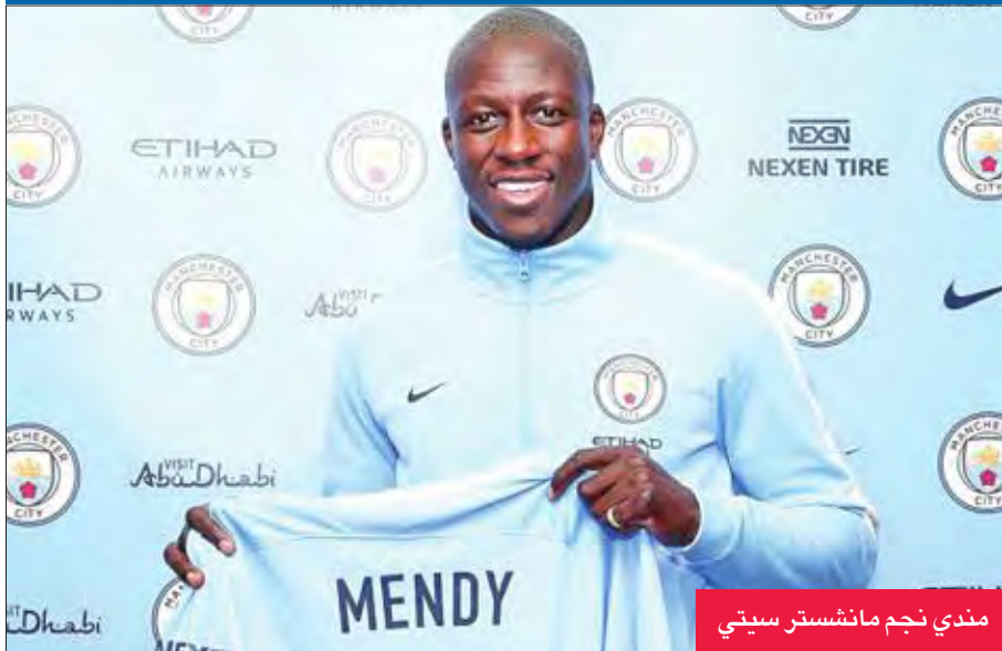
مندی نجم مانشستر سيتي