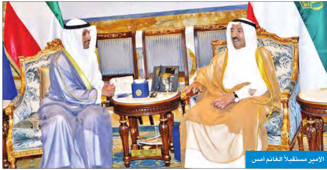
الأمير مستقبلاً الغانم أمس

لجمهورية المالديف، متمنياً له موفور الصحة والعافية ولبلد الصديق دوام التقدم والأزدهار. كما بعث سموه، ببرقية تهنئة إلى رئيسة جمهورية ليبيريا الصديقه إيلين سيرليف، عبر فيها سموه عن خالص تهنئته بمناسبة العيد الوطني لجمهورية ليبيريا، متمنياً لها موفور الصحة والعافية ولبلد الصديق دوام التقدم والأزدهار. وبعث سمو ولي العهد الشيخ نواف الأحمد، وسمو رئيس مجلس الوزراء الشيخ جابر المبارك ببرقيتي تهنئة مماثلة.