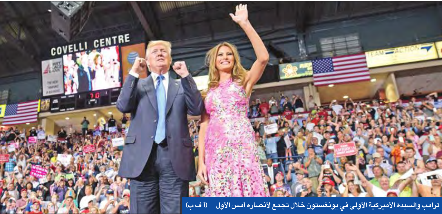
ترامب والسيدة الأميركية الأولى في يونغستون خلال تجمع لانتصاره أمس الأول

فرض الكونغرس الأميركي حزمة عقوبات جديدة على روسيا وإيران وكوريا الشمالية، في وقت تمكن من حد سلطة الرئيس دونالد ترامب، إننا حاول رفع العقوبات عبر آليات غير مسبوقة، كما وافق مجلس الشيوخ على بدء مناقشة إلغاء نظام «أوباما كير» للرعاية الصحية بصورة متعززة. كبل المشرعون الأميركيون يدي الرئيس الأميركي دونالد ترامب، أمس الأول، إذ أقر مجلس النواب الأميركي بشبه إجماع، أمس الأول، مشروع قانون يفرض عقوبات جديدة على كل من روسيا وإيران وكوريا الشمالية، وبهذا تنتقل الكرة إلى مجلس الشيوخ، الذي يتعين عليه إقرار النص بشكل نهائي، كي يحيله الكونغرس إلى البيت الأبيض للمصادقة عليه. وحاز مشروع القانون تأييداً ساحقاً، إذ لم يعترض عليه إلا ثلاثة نواب، مقابل 419 نائباً صوتوا بالتأييد، في خطوة يتوقع أن تثير الغضب في موسكو، وأوروبا أيضاً، إذ إن مشروع القانون يتحجج فرض عقوبات على شركات أوروبية تعمل في قطاع الطاقة في روسيا.