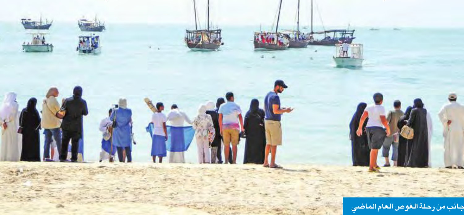
جانب من رحلة الغوص العام الماضي

وفي تخليد ذكرى الريجل الأول من الآباء والأجداد. وبحرص النادي على أن تكون رحلة كل عام متميزة بمعانيها النبيلة وأهدافها الوطنية الواسعة ومضامينها الهادفة، وهي تحمل اسمي معاني الوفاء والعرفان للأمير الراحل الشيخ جابر الأحمد طيب الله ثراه ولسمو أمير البلاد الشيخ صباح الأحمد على ما يحظى به النادي من دعم ورعاية لاسيما في شرف تنظيم هذا النشاط الوطني الكبير.