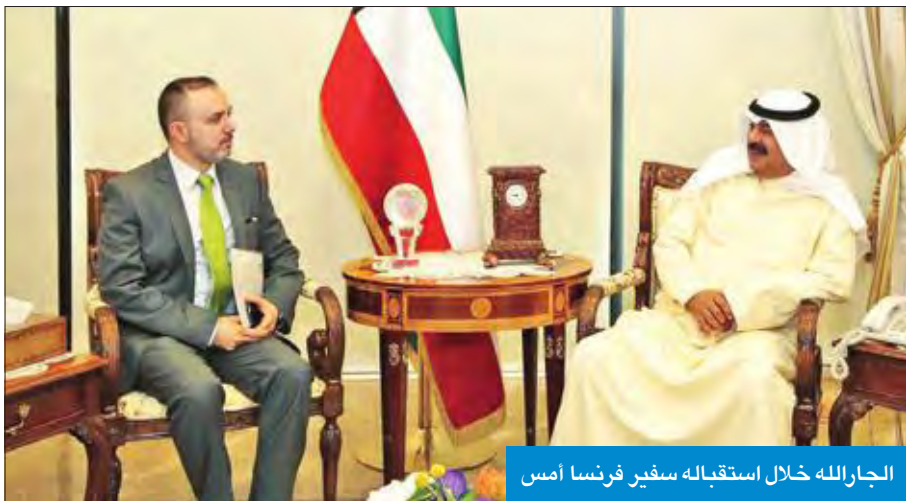
الجارالله خلال استقباله سفير فرنسا أمس

اجتمع نائب وزير الخارجية خالد الجارالله، أمس، مع سفير جمهورية فرنسا لدى الكويت كريستيان نخلة، حيث تم خلال اللقاء بحث عدد من أوجه العلاقات الثنائية بين البلدين، إضافة إلى تطورات الأوضاع على الساحتين الإقليمية والدولية.