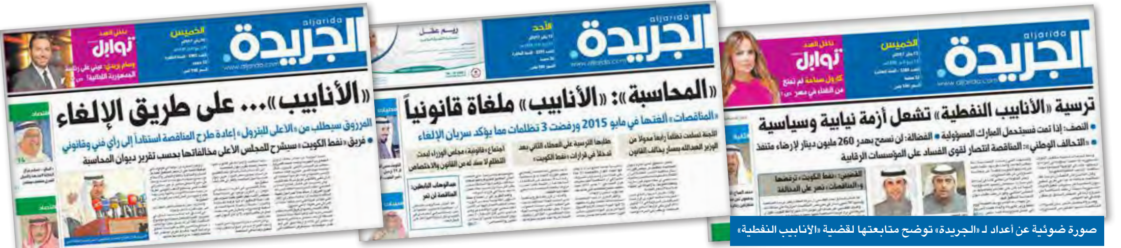
صورة ضوئية عن أعداد لـ «الجريدة» توضح متابعتها لقضية «الأنابيب النفطية»

● «المركزي للمناقصات» أقر توصية «نفط الكويت» وقبل أقل الأسعار بقيمة 257 مليون دينار ● النصف: حفظنا المال العام والقانون من التلاعب بعد إعلاننا استجواب المبارك