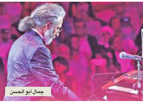
جمال أبو الحسن

المقبل عن الدبدا، وشاركته غناء الميلودى غارود التي عزفت منفردة على الكمان مقطوعة Baby I am fool. ولأنه فخور بجذوره اللبنانية كانت معزوفته الموسومة بعبارة «يا هلا» التي يشتهر بها البعلبكيون كقبة اللبنانيين المرحبين بضيوفهم، واللوحة الأخيرة أدخل في توليفتها الفولكلور اللبناني والديكة التراثية على أنغام «الدلعونا» دخل إبراهيم معلوف بحفلة هذه في تاريخ مدرجات بعلبك التي لا تخلد إلا الميادين، وهو تقلد ميدالية مهرجان بعلبك الجيش اللبناني الذي يحتفل اللبنانيون بعيدة الشهر المقبل أغسطس، خصص له عاصي الحلاني سهرته في مهرجانات زحلة الدولية بمشاركة فرقة «مجد بعلبك» وعبر الحلاني عن دعمه للجيش اللبناني قائلاً: «حامي الحمى، وأمل لبنان، أكان في الماضي، أو الحاضر،