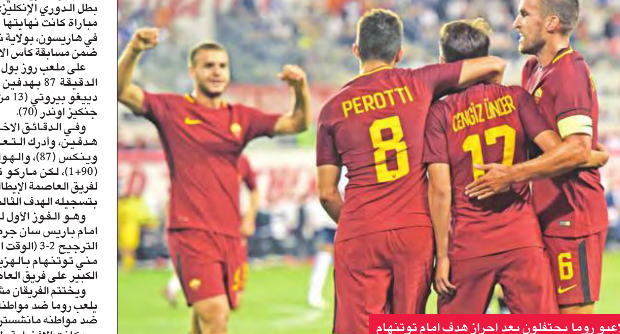
لاعبو روما يحتفلون بعد إحراز هدف أمام توتنهام

فاز روما الإيطالي على توتنهام، وصيف بطل الدوري الإنكليزي لكرة القدم، 2-3 في مباراة كانت نهايتها مجنونة، أمس الأول، في هاريسون، بولاية نيو جيرسي الأميركية، ضمن مسابقة كأس الأبطال الدولية الودية. على ملعب روز بول أرينا، تقدم روما حتى الدقيقة 87 بهدفين نظيفين للارجلندي ديفغو بيروتي (13 من ركلة جزاء) والتركي جنكينز أوندر (70). وفي الدقائق الأخيرة، سجل توتنهام هدفين، وأدرك التعادل، بواسطة هاري وينكس (87)، والهولندي فنسن ينسن (1+90)، لكن ماركو تومينيلو منح الفوز لفريق العاصمة الإيطالية، بعد دقيقة واحدة، بنسجيله الهدف الثالث (2+90). وهو الفوز الأول لروما، بعد خسارته أمام باريس سان جرمان الفرنسي، بركلات الترجيح 3-2 (الوقت الأصلي 1-1)، في حين منى توتنهام بالهزيمة الأولى بعد فوزه الكبير على فريق العاصمة الفرنسية 2-4. ويحتتم الفريقان مشاركتها، الأحد، حيث يلعب روما ضد مواطنه يوفنتوس، وتوتنهام ضد مواطنه مانشستر سيتي. وكانت الأفضلية طوال شوطي المباراة،