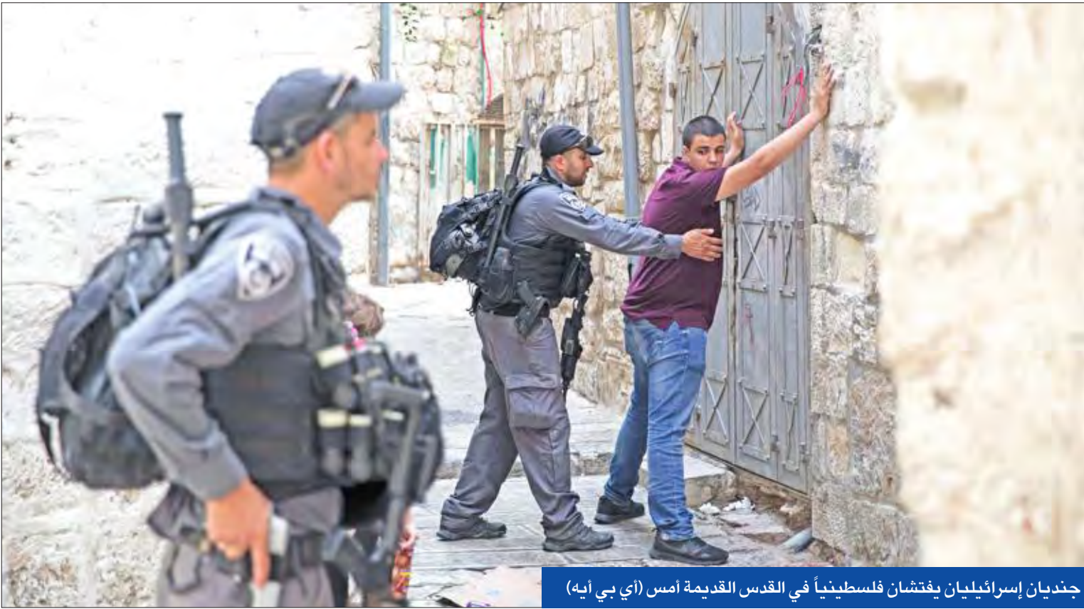
جنديان إسرائيليان يفتشان فلسطينياً في القدس القديمة أمس

الفصائل الفلسطينية تدعو إلى احتجاجات الجمعة وترقب لتقييم لجنة تضم الأوقاف «الكاميرات الذكية»