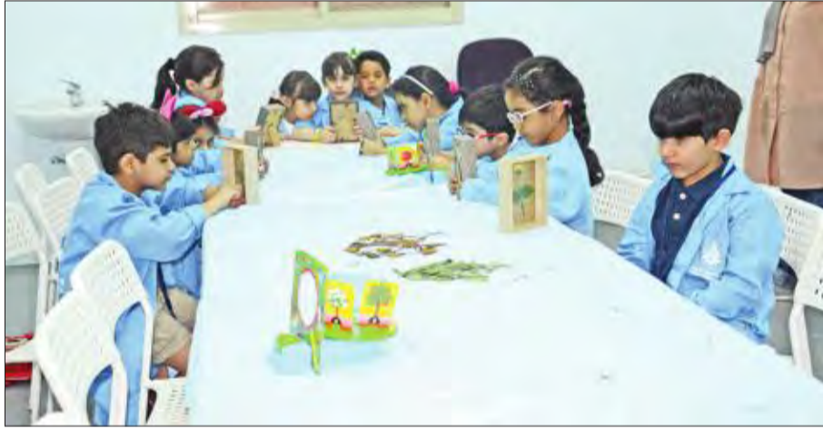
تعليم الأطفال مراحل نمو النبات وزراعة بذور بدون تربة ومتابعتها