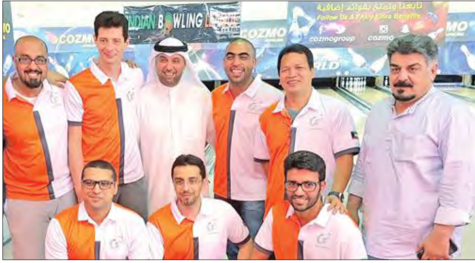
صورة جماعية مع فريق بولينغ المصارف