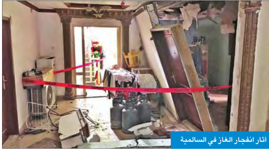
أثار انفجار الغاز في السالمية