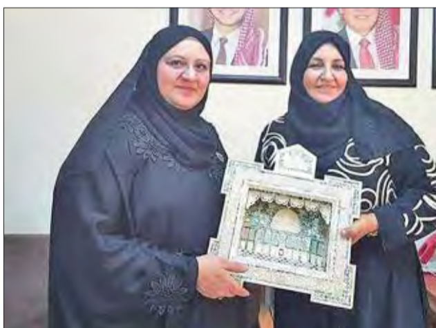
بركات تكريم إحدى المشاركات