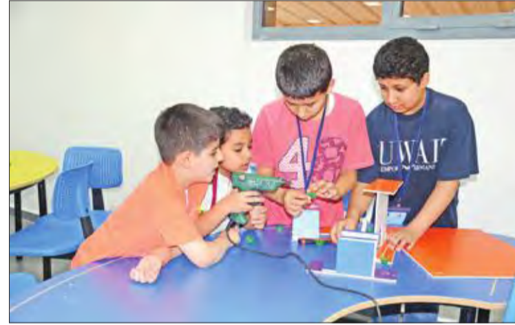
عدد من الطلبة المشاركين في النادي الصيفي