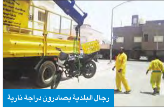
رجال البلدية تصادرون دراجة نارية