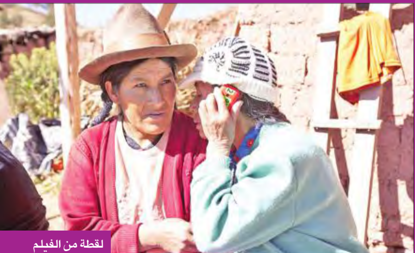
لقطة من الفيلم

معظمهم من السكان الأصليين، جرى تعقيمهم في إطار الحملة التي أمر بتدشينها فوجيموري، ومن بين هؤلاء، أكثر من 2000 سيدة قلن إنهن خضعن لعمليات التعقيم دون إبلاغهن بما سيحدث، أو تم خداعهن أو إرهابهن للخضوع للعملية. وجاء في شهادة أخرى لحن مرضى، لدينا عدوى خطيرة، أجسامنا تعاني الألم. صححتنا ليست بخير، ونحن نريد فالعدالة. وعلى الرغم من أننا جازنا بالشكاوى طوال أعوام كثيرة، فإنه لم يستمع لنا أحد. إن النساء اللاتي في المناطق الريفية، اللاتي لا يظنن أي شيء مطلقاً، يحضرن. ويعد مرور أكثر من 20 عاماً من بدء حملة التعقيم، أصبحت عدة سيدات، من اللاتي تضررن من الحملة، ناشطات ويطالبن بالعدالة بمساعدة جماعات حقوق الإنسان. (د ب أ)