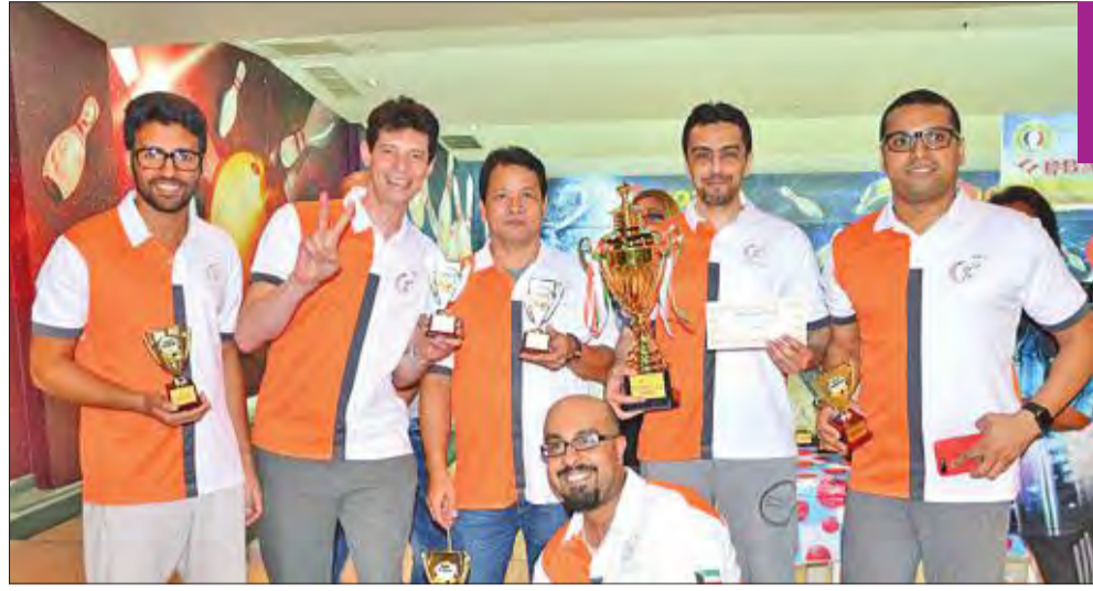
فريق المصارف الفائز بالبطولة الهندية للبولينغ