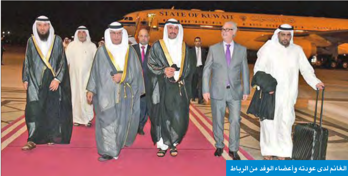
الغانم لدى عودته وأعضاء الوفد من الرباط

الغانم خلال مشاركة في المؤتمر الطارئ للاتحاد البرلماني العربي حول الأوضاع في القدس. وقالت النقابة، في بيان لها أمس: «بدأ رئيس مجلس الأمة كلمته الحاسية والرابعة في المؤتمر الطارئ للاتحاد البرلماني العربي بعبارة عبرت خلالها نشاطاً جسدياً العربي المه ومصابه بسبب الاعتداءات الصهيونية المتكررة على المسجد الأقصى ومنع المصلين من أداء الصلاة فيه». وأكدت النقابة فخراً بالرئيس الغانم حين قال «من يريد إن يستسلم فليذهب إلى الجحيم، ونحن أبناء الشيخ صباح الأحمد وتلاميذ مدرسته، وسندقي لينة في طريق النصر، وسهماً من سهام الحق ولن نلتفت لأقوال المثبطين». وأضافت: «كان لكلمات الرئيس الغانم صدى عميق واهتمام كبير لدى الجميع، لأنها طالبت بحق لظالم عبرت دولة الكويت عنه في المحافل العربية والدولية».