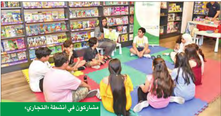
مشاركون في أنشطة «التجاري»

ويستطيع أولياء أمور أصحاب حسابي الأول الذين لم يتسن لهم تسجيل أبنائهم في فعاليات الأسبوع الأول، القيام بتسجيلهم في الأنشطة المقبلة التي ستقام في 2 و9 الجاري، من خلال زيارة قسم العروض على موقع البنك www.cbk.com، أو بإمكانهم الاتصال على خدمة العملاء 1888225. ومن المعروف أن حسابي الأول هو حساب توفير مصمم خصيصاً للأطفال حتى 14 سنة. ويعد هذا الحساب الطريقة المثلى للأباء والأمهات الذين يرغبون في تأمين مستقبل أفضل لأبنائهم، وتوفير الأموال لهم في مراحلهم العمرية المبكرة.