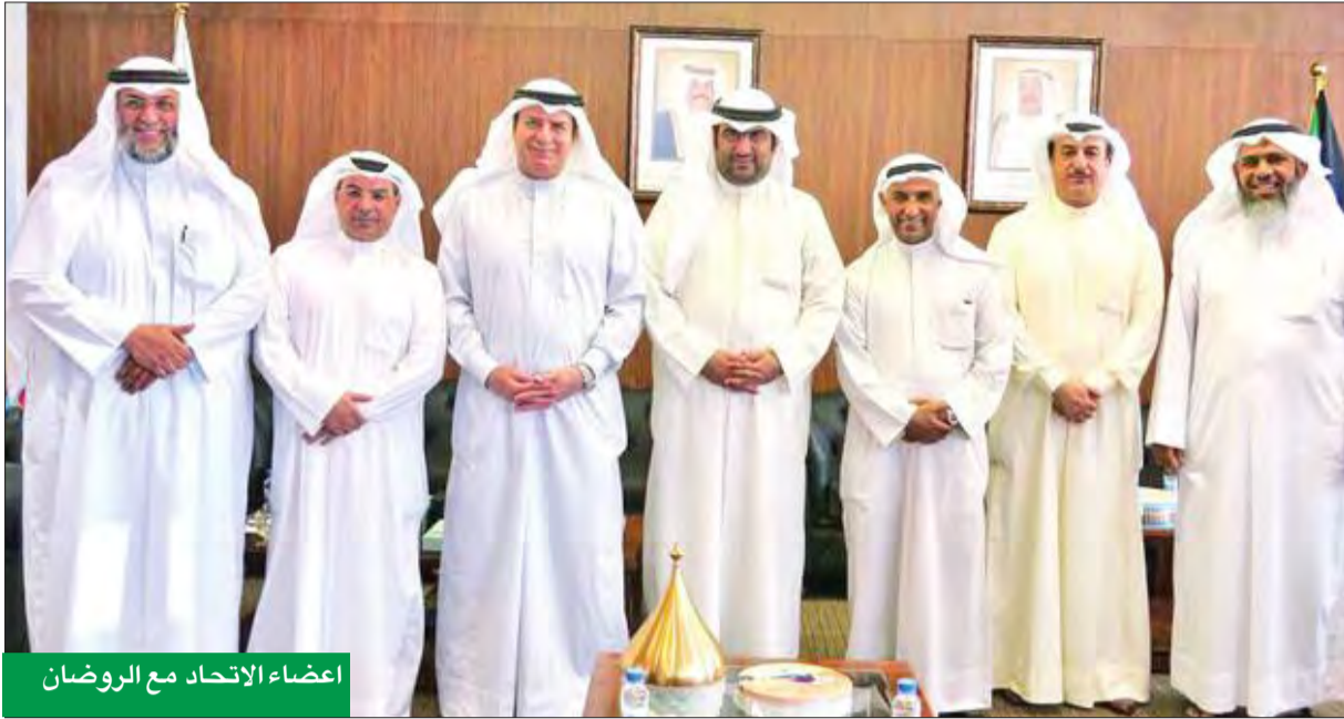
أعضاء الاتحاد مع الروضان

فترة إجراءات تجديد الرخصة ودفتري السوق، موضحاً مدى تأثيرها على السوق بشكل عام. وذكر أن الاتحاد بصدد تقديم رؤية شاملة تتعلق بتطوير السوق إلى الأفضل، حيث إن الوزارة يمكنها الاستفادة من تلك الرؤية عند تقديمها، إذ إن السوق بحاجة إلى إعادة هيكلة بعض القرارات، لتطويره وتنظيمه، ليواكب الأسواق العالمية.