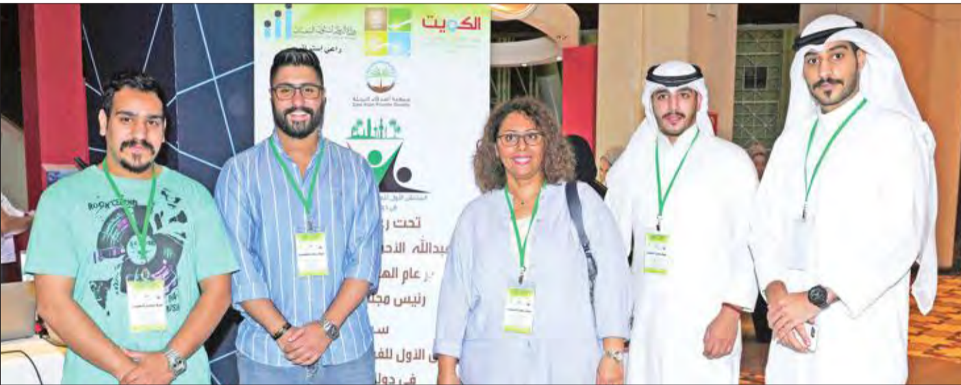
عدد من أعضاء الفرق المشاركة