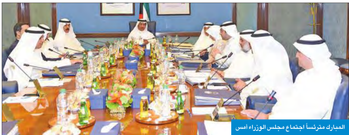
المبارك مترئسا اجتماع مجلس الوزراء أمس

تم استعراض مجلس الوزراء توصية لجنة الشؤون الاقتصادية بشأن تحديد الثمن الرمزي لقسائم الرعاية السكنية في منطقة خيطان الجنوبي قطعتي 3 و4، وقرر الموافقة على الثمن الرمزي لقسائم الرعاية السكنية في القطعتين بسعر 15 ألف دينار، وتكليف المؤسسة العامة للرعاية السكنية اتخاذ الإجراءات اللازمة في هذا الشأن، مع الأخذ بالاعتبار عدم السماح بتصريف المستفيدين بالتنازل أو التبادل