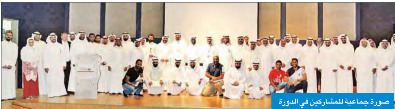
صورة جماعية للمشاركين في الدورة

المحلين والإقليميين، للاستفادة من خبراتهم، وإثراء المعارف في مستويات مختلفة من حقل العمل المتعددة، لتقديم خدمات تدريبية هادفة وتمييزة تساعد في تحقيق التطوير، ورفع الكفاءة على المدى البعيد بسوق العمل في الكويت.