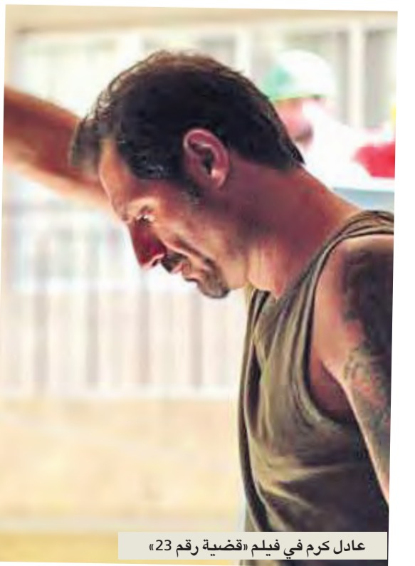
عادل كرم في فيلم «قضية رقم 23»