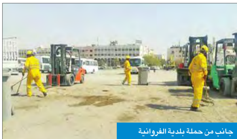
جانب من حملة بلدية الفروانية

ودعت إدارة العلاقات العامة أصحاب المحلات إلى التأكد من استخراج التراخيص اللازمة، إلى جانب مراجعة تاريخ صلاحية المواد الغذائية، وفي حال وجود مواد منتهية الصلاحية يتطلب الأمر تسليمها إلى مركز البلدية لإتلافها تجنباً للمخالفات والغرامات، مشددة على تطبيق القانون بحزم على المخالفين.