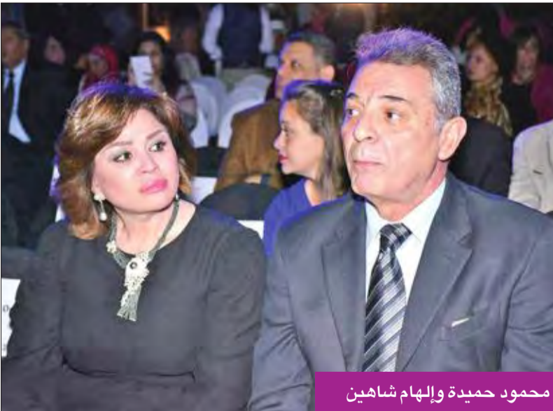
محمود حميدة وإلهام شاهين

السقا وحلمي وحמידة وشاهين وشلبي وزكي للتمثيل