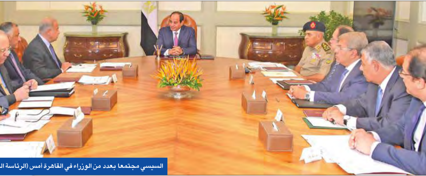
السياسي مجتمعاً بعدد من الوزراء في القاهرة أمس

«القضاء على النصوص البالية، التي لم تعد تصلح الآن للواقع الجديد، الذي تعيشه البلاد، لآفتاً إلى أن هناك عيوباً ومغوقات في إجراءات التقاضي داخل المحاكم المصرية بسبب القوانين العقيمة»، قضائياً، أيدت محكمة النقض في جلساتها المنعقدة أمس، أحكام السجن المؤبد والمشدد الصادرة بحق 26 منتهماً، مع تعديل الأحكام الصادرة بالإعدام بحق 10 منتهمين آخرين، بحيث تصبح السجن المؤبد لمدة 25 عاماً، في منشآت الدولة وقواتها المسلحة وجهاز الشرطة والمواطنين المرتبطين بتنظيم القاعدة يستهدف الأقطاب، بأعمال إرهابية بغية نشر الفوضى وتخريض أمن المجتمع للخطر، والمعروفة إعلامياً ب«خلية الظواهري».