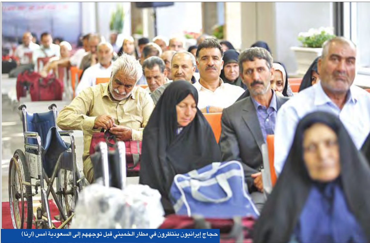
حجاج إيرانيون ينتظرون في مطار الخميني قبل توجههم إلى السعودية أمس (ارنا)

في لفتة إنسانية ضمن مقاربة المملكة العربية السعودية بمواجهة الإرهاب، أمر العاهل السعودي خادم الحرمين الشريفين الملك سلمان بن عبدالعزيز، باستضافة ألف من أسر شهداء القوات المسلحة والشرطة المصرية، ل أداء فريضة الحج التي تحل أواخر أغسطس الحالي. وأعلن سفير المملكة بالقاهرة مندوب الرياض الدائم لدى جامعة الدول العربية عميد السلك الدبلوماسي العربي أحمد قطان في بيان، أن الاستضافة تأتي تكريماً وتقديراً من العاهل السعودي لأسر الشهداء الذين ضحوا أبنائهم بأرواحهم في سبيل الدفاع عن وطنهم. إلى ذلك، غداة إعلان الدول الأربع استعدادها للدخول في حوار مع الدوحة إذا أبدت نية لتنفيذ قائمة المطالب، اعتبر وزير الخارجية القطري محمد عبد الرحمن أن قائمة المطالب التي تقدمت بها الدول الأربع ملغاة، وبيلاه ترفضها. واعتبر وزير خارجية قطر أن بيان المنامة، الذي خرج أمس الأول عن اجتماع وزراء خارجية الدول الأربع، وهي الدول المقاطعة لقطر، حفل بتناقضات عديدة. وقال بن عبد الرحمن «البيان ذكر أنه يجب على دولة قطر أن تستجيب للطلبات الـ13 ومبادئ القاهرة الستة، وهذا فيه مخالفة واضحة وصريحة للقائمة المطالب نفسها التي قالت في أحد بنودها إن المطالب تعد ملغاة بعد مرور 10 أيام، وهذه جزئية فقط من جزئيات التعتن» وتابع «أما البنود الأخرى من بيان المنامة، ففوض أنه ليست