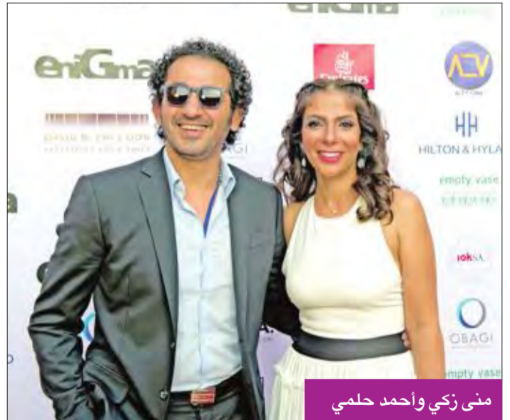
منى زكي وأحمد حلمي

عن «هيبتا»، ناهد السباعي عن «يوم للستات»، نسرين أمين عن «عشان خارجين»، مرفت أمين عن «من 30 سنة»، أفضل فيلم: اشتباك، هيبتا، المحاضرة الأخيرة، نؤارة، قبل زحمة الصيف، من 30 سنة. أفضل إخراج: خالد مرعي «لف ودوران»، هادي الباجوري «هيبتا»، هالة خليل عن «نؤارة»، كريم السبيعي «من شهر راجل»، محمد دياب عن «اشتباك». أفضل سيناريو: أحمد عبدالله «الماء والخضرة والوجه الحسن»، أيمن بهجت قمر «من 30 سنة»، محمد دياب وخالد دياب «اشتباك»، وائل حمدي «هيبتا»، هالة خليل «نؤارة». أفضل مصمم أزياء: أمينة علي «هيبتا»، مونييا فتح الباب «من 30 سنة» في جلال «لف ودوران»، ريم العدل «نؤارة» و«اشتباك». أفضل أغنية فيلم: «حكاية واحدة» دنيا سمير غانم في «هيبتا»، «أنا لوجدي» أحمد سعد في «الهرة الرابع»، «البقاء» محمد حماقي في «من 30 سنة»، و«أحنا الحياة» جنات في «الي اختسوا ماتوا».