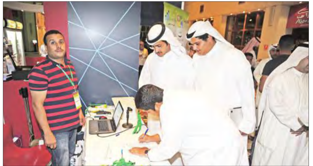
المشاركون في الملتقى أثناء تسجيل بياناتهم