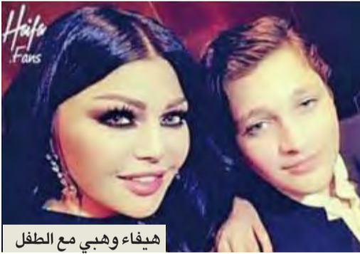
هيفاء وهبي مع الطفل