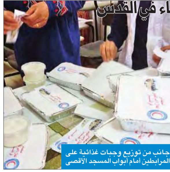
جانب من توزيع وجبات غذائية على المرابطين أمام أبواب المسجد الأقصى