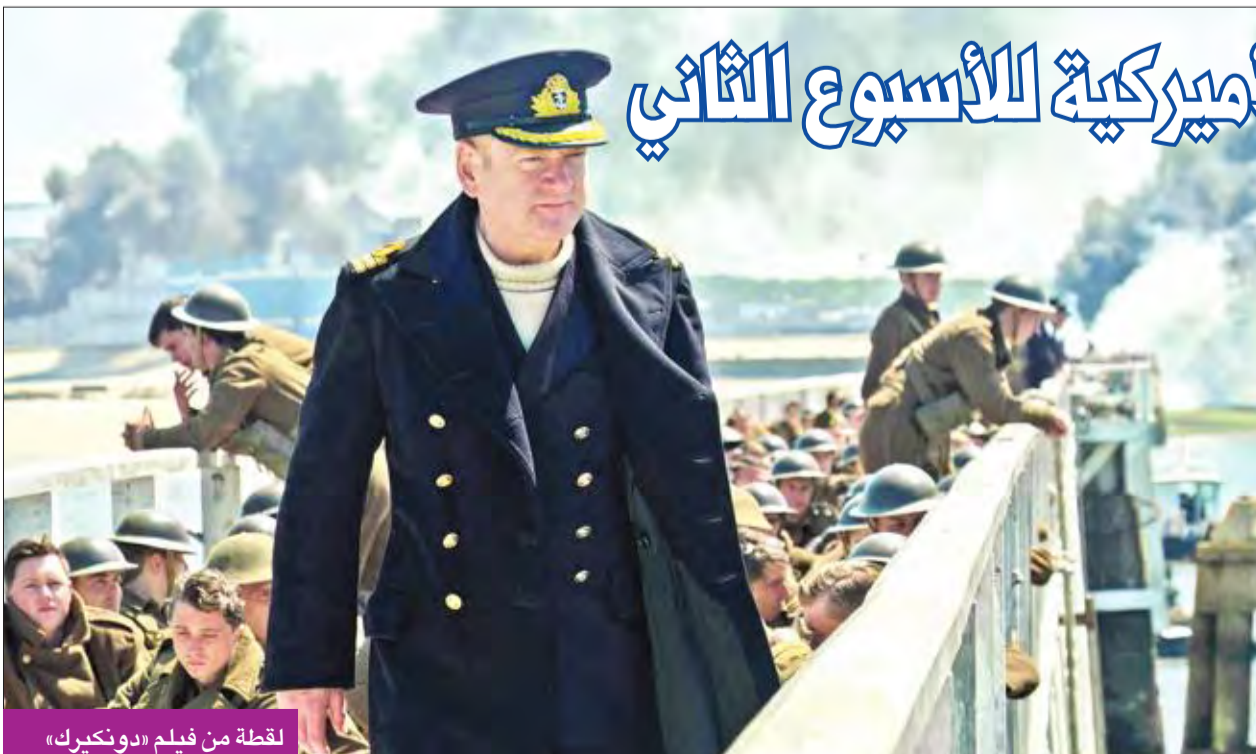
لقطة من فيلم «دونكيرك»

تصدر الفيلم الملحمي «دونكيرك» إيرادات دور السينما في أميركا الشمالية للأسبوع الثاني على التوالي، حسبما أظهرت تقديرات استوديوهات السينما، مساء أمس الأول. وحقق الفيلم، الذي تدور أحداثه في فترة الحرب العالمية الثانية، ويشارك في بطولته كل من توم هاردي ومارك ريلانس وهاري ستايلز وكينيث براناه ومن إخراج كريستوفر نولان، إيرادات بلغت 28.21 مليون دولار، وحل في المركز الثاني فيلم الرسوم المتحركة ثلاثي الأبعاد «ذا إيموجي موفي»، الذي يشارك في أداء أصوات شخصياته كل من تي جي ميلر وأنا فارس وصوفيا فيرغارا، محققاً إيرادات بلغت 25.7 مليون دولار.