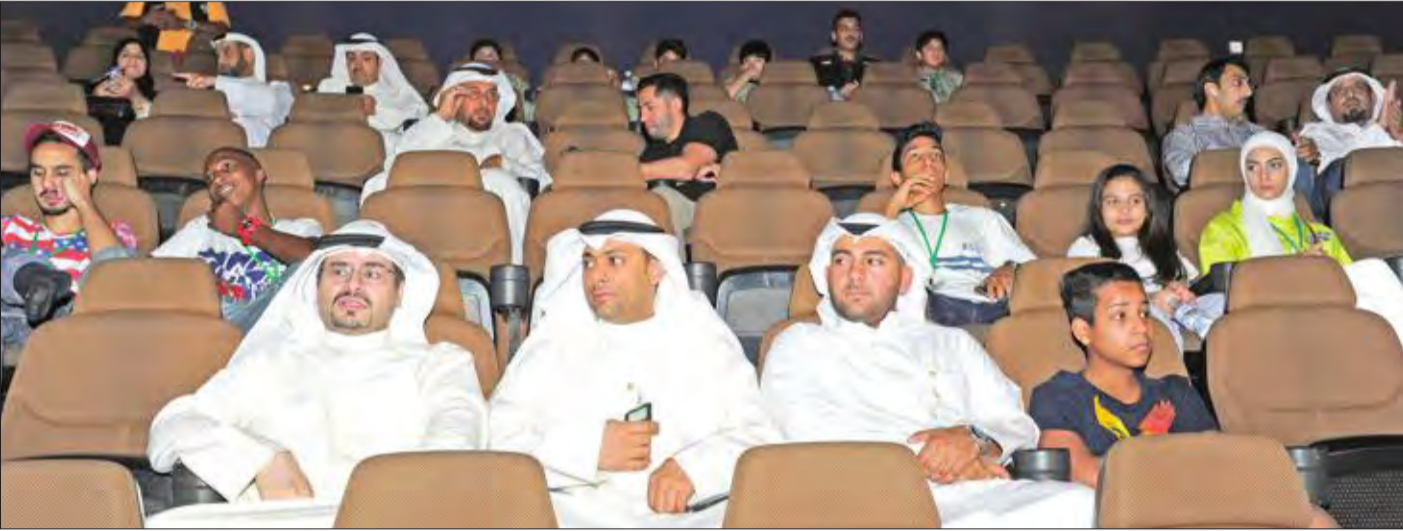
عدد من الحضور