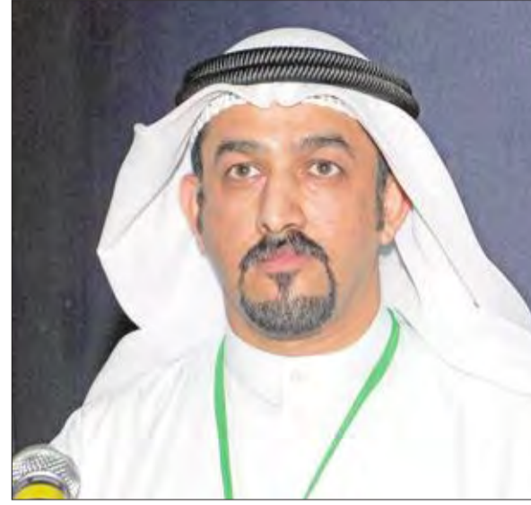
عريف الملتقى براك الهندان