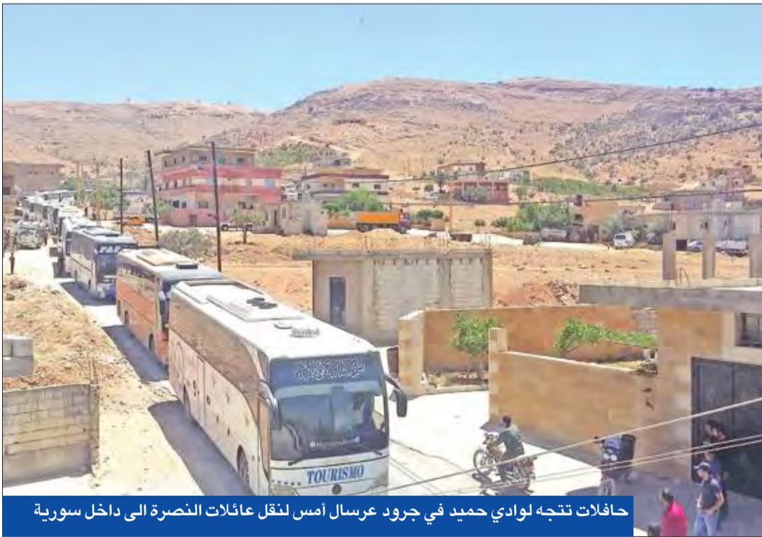
حافلات تجتو لوادى حميد في جرود عرسال أمس لنقل عائلات النصر إلى داخل سورية

ووفق قيادي ميداني سوري، فإن القوات الحكومية والعشار تحاصر الآن بقية عناصر تنظيم «داعش» في بلدات زور شمر والصخبة والشريفة والجبلي والرجعي ورجم هارون وتل المروء، مؤكداً أن مسلحي التنظيم يتخذون من المدنيين دروعاً بشرية، مما يؤخر تقدم الجيش. وفي دير الزور، تمكنت قوات النظام من التوغّل داخل المحافظة خلال الـ24 ساعة الفائتة، لتقلص المسافة بينها وبين بقية مناطق سيطرتها المحاصرة من قبل تنظيم «داعش» منذ مطلع 2015، بحسب المرصد، الذي أوضح أن المعارك المتواصلة على محاور البادية الغربية أسفرت عن مقتل 45، ليرتفع إلى نحو 360 عدد قتلى الطرفين خلال أسبوعين. وفي تطور هو الأول من نوعه منذ شهرين ينذر بمعركة واسعة في المحافظة الخارجة بالكامل عن سلطة، التي النظام منشورات ورقية في قرى وبلدات إدلب دعت المسلحين إلى إلقاء السلاح والخروج من