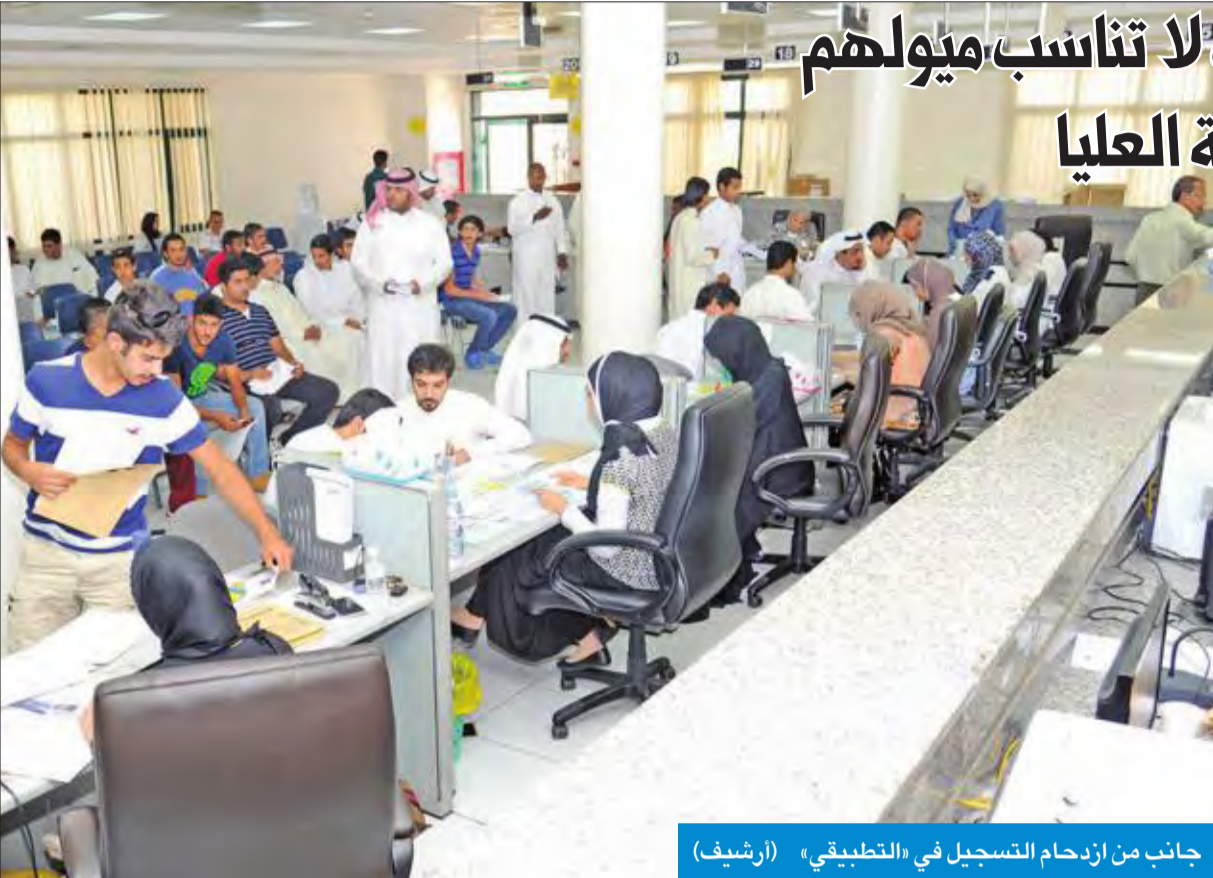
جانب من ازحام التسجيل في «التطبيقي»

نتائج المقبولين شهدت تسجيل الطلبة في تخصصات لا تناسب ميولهم الأثري: الآلية وفق مسطرة واحدة وحسب لوائح اللجنة العليا