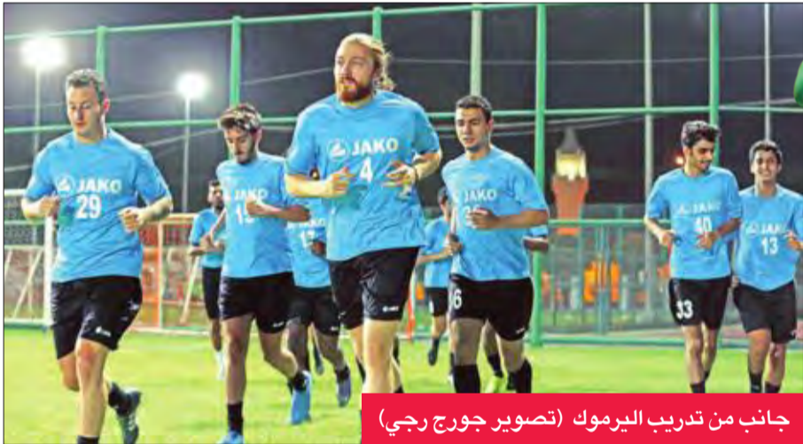
جانب من تدريب البرموك