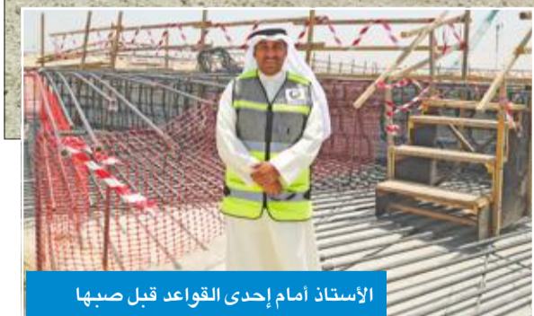
الأستاذ أمام إحدى القواعد قبل صبها

عاملاً، لافتاً إلى أن ذروة الأعمال في المشروع ستصل فيها أعداد العمالة إلى 12 ألف عامل. وأضاف: مع زيادة العمال وفتح الأعمال المختلفة في المشروع ستكون هناك أعمال مختلفة تحتاج إلى هذه الأعداد الكبيرة من العمالة في المشروع. وأعرب الأستاذ عن الشكر إلى وزارة الكهرباء والماء على التنسيق مع «الأشغال» لافتاً إلى أنه يتم حالياً بناء محطتين رئيسيتين للكهرباء وسيتم الانتهاء منهما قبل انتهاء المشروع.