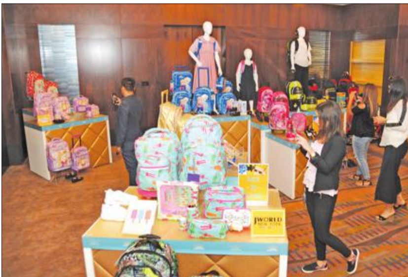
جانين من التشكيلة الجديدة من الحقائب وإكسسوارات المدارس