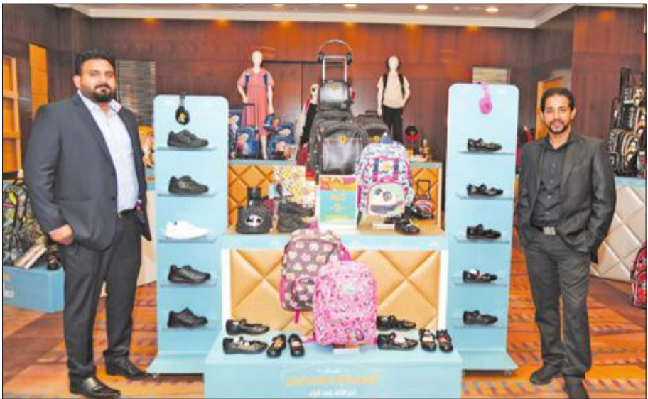
موظفان أمام تشكيلة من الأدوات المدرسية