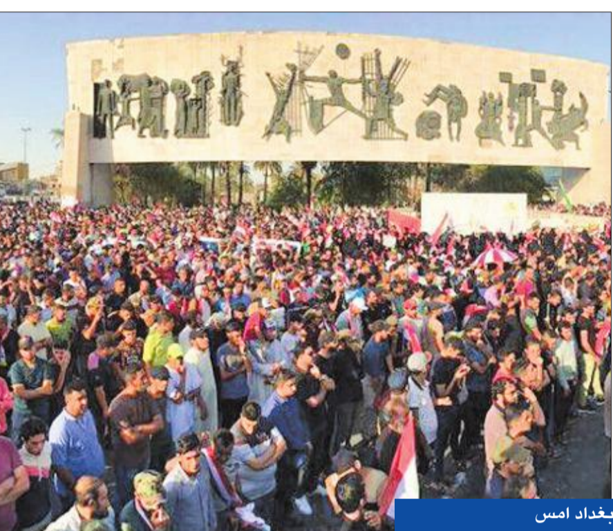
جانب من تظاهرات التيار الصدري في ساحة التحرير وسط بغداد أمس

وقال البارزاني في رسالته، إن «الدولة العراقية تشكلت على أساس التعايش والشراكة الحقيقية واحترام حقوق المكونات والقوميات، معرباً عن أسفه من «أن حصتنا من تلك الشراكة تدمير 4500 قرية كردية وضرب حليلة والمناطق الأخرى بالأسلحة الكيماوية وعمليات الأنفال والمقابر الجماعية في جنوب العراق». وأضاف البارزاني، أنه «بعد مشاركة الأكراد في إعادة تأسيس الجيش العراقي وكتابة الدستور عام 2005 والتصويت عليه، لا فرق بين كردستان والعراق». وأضاف البارزاني، أنه «بعد مشاركة الأكراد في إعادة تأسيس الجيش العراقي وكتابة الدستور عام 2005 والتصويت عليه، لا فرق بين كردستان والعراق». وأضاف البارزاني، أنه «بعد مشاركة الأكراد في إعادة تأسيس الجيش العراقي وكتابة الدستور عام 2005 والتصويت عليه، لا فرق بين كردستان والعراق».