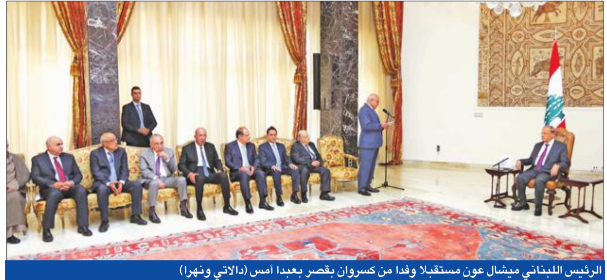
الرئيس اللبناني ميشال عون مستقبلاً وفداً من كسروان بقصر بعبداً أمس (الدائني ونهرا)