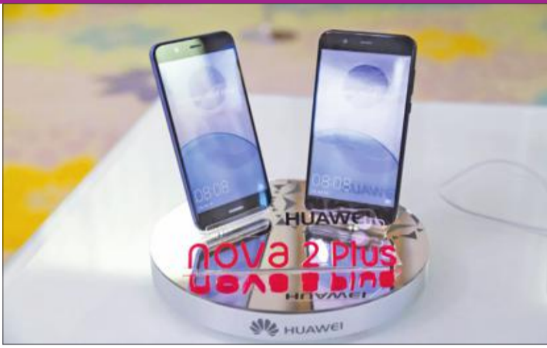
EMUI 5.1 مع Kirin 659 ويوفر مزيج معالجة Kirin 659 Mha، كما يضم بطارية بسعة 3340mAh التي تتفرد بفضل طول عمرها عند الاستخدام وسرعة شحنها إذ تحتاج إلى 30 دقيقة فقط لشحن 39 في المئة من بطارية «نوبا 2» و 43 في المئة من بطارية «نوبا 2 بلس».

(Sensor) المصمم ليقلل فرص جمع الأوساخ والغبار، وضمان الأداء المستمر. كما عملت هواوي مع موسيقيين محترفين ومنهم راينر مايلارد الحائز جائزة غرامي لأفضل اليوم هندسي وكلاسيكي، لتوفير تجربة صوتية لا تضاهي، إذ تم تزويد الهاتف بشريحة «هيفي» لتقليل الضوضاء ومعالجة الصوت لجعل سماع الموسيقى تجربة ممتعة. كما قامت باعتماد نظام تستخدمه للمرة الأولى وهو نظام هواوي «هيسستن» الذي يتضمن 10 وحدات مستهدفة لتأثيرات مختلفة، مثل صوت ستريو ثلاثي الأبعاد. ولضمان جودة صوت متميزة، وضعت تكنولوجيا بلوتوث aptX اللاسلكية، التي عندما يتعلق الأمر بالفيديو والألعاب الإلكترونية توفر وقت تأخر عند التقاط شبكة البلوتوث للصوت. وهذا يضمن المزيد من التزامن بين الصورة والصوت مثلما يقدمه القرص المضغوط.