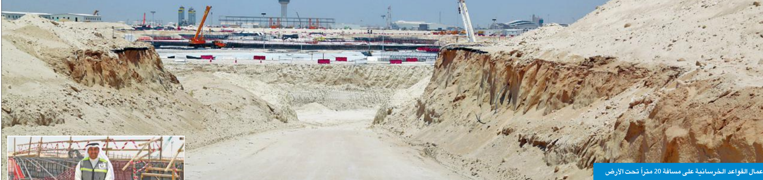
أعمال القواعد الخرسانية على مسافة 20 متراً تحت الأرض