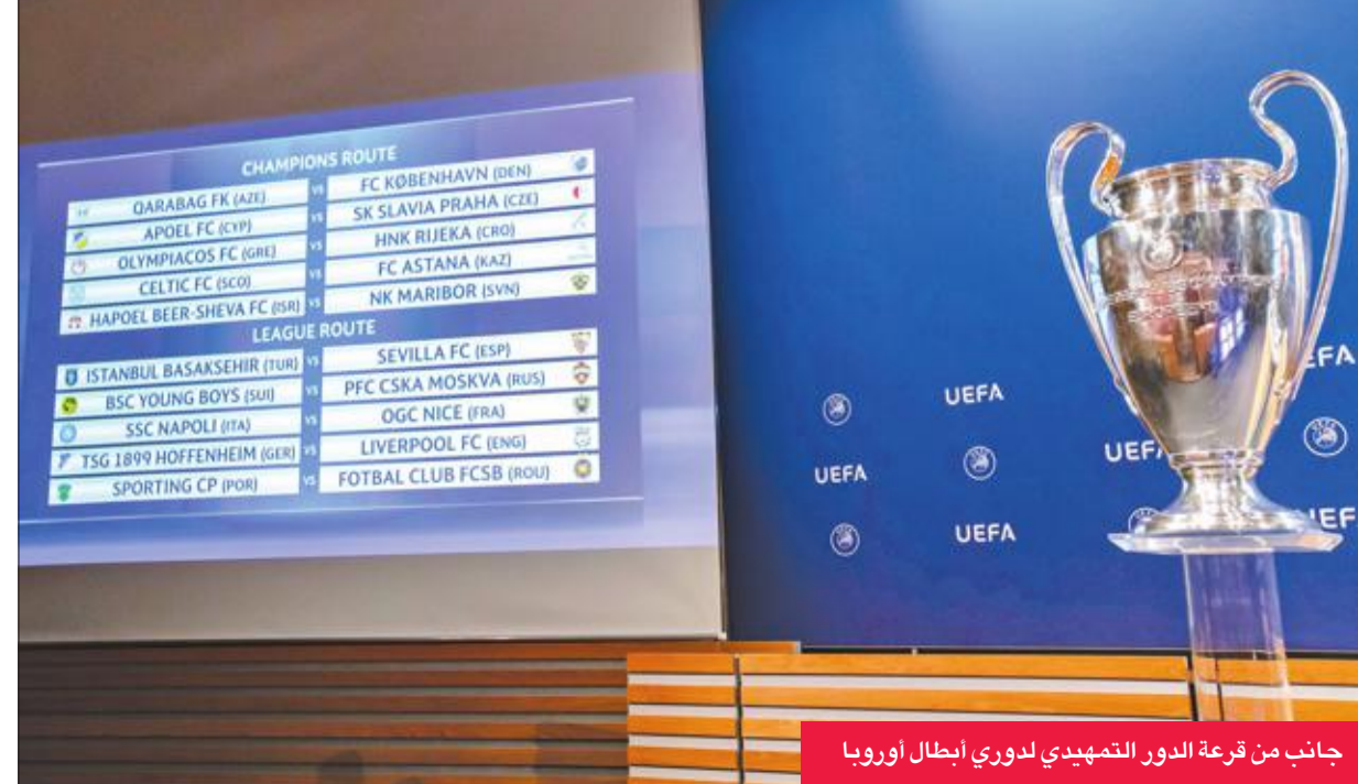
جانب من قرعة الدور التمهيدي لدوري أبطال أوروبا

ويبدأ فريق المدرب الألماني يورغن كلوب مشواره في المسابقة القارية الأم من الدور الفاصل، بعد أن حل رابعاً في الدوري الإنجليزي الموسم الماضي، وهو المركز الذي حصل عليه هوفنهايم أيضاً في الدوري الألماني، ما خوله الحصول على فرصة المشاركة في دوري الأبطال للمرة الأولى في تاريخه. ووزعت مباريات الدور الفاصل كالعادة إلى قسمين حيث تتواجه في ما بينها الفرق المتوجة بطلة لدوريات بلادها مثل سلتيك الإسكتلندي وأولمبياكوس اليوناني، والفرق