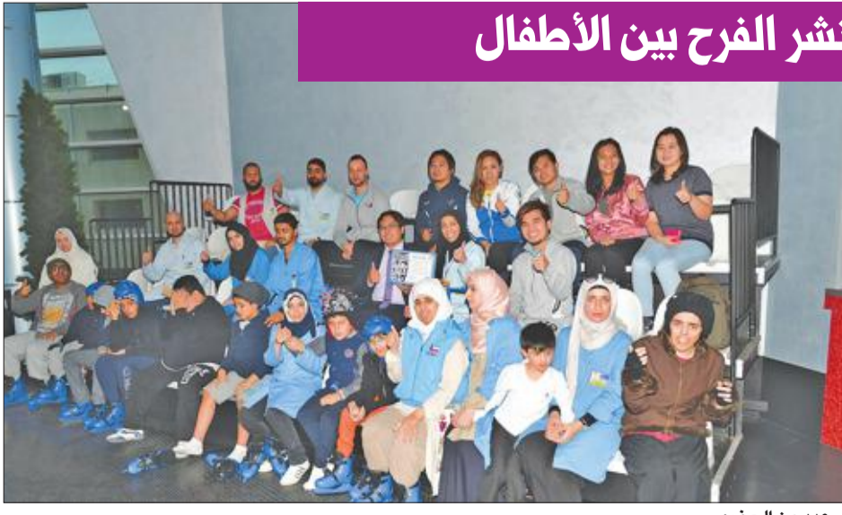
عدد من الحضور

احتفلت «البروميناد آيس»، صالة التزلج المغلقة الوحيدة داخل مول في الكويت والموجودة في مول «البروميناد»، بنجاح مبادراتها التي استمرت عدة أيام بالشراكة مع مركز الكويت للتوحد، في إطار جهودها المستمرة لدعم المجتمع المحلي. واصطحب أكثر من 24 طفلاً من أطفال التوحد إلى حلبة التزلج ببرفقة فريق من المحترفين لاختبار مهارات الأطفال ضمن دورة مدتها يومان، واستمتع الصغار بتناول الغداء في مطعم «ويتش ويتش الكويت». وبهذه المناسبة، قال عثمان العثمان، مدير مجتمعات محفظة المرجوم عبدالله العثمان: «من المهم بالنسبة لنا في (البروميناد)، وكأفراد في هذا المجتمع المتنامي أن نساهم في رد الجميل لمجتمعنا، ونشكل العالمية الأخيرة جزءاً من مبادراتنا المستمرة في إطار المسؤولية الاجتماعية للشركات، وننتقل إلى المساهمة في العديد من الفعاليات الناجحة في المستقبل القريب».