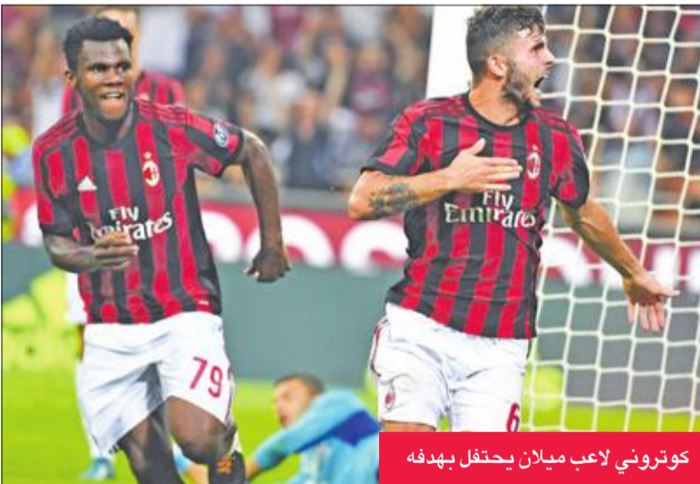
كوتروني لاعب ميلان يحتفل بهدفة

فاز ميلان 2-صفر على ضيفه يونيفرسيتاتيا كرايوفا الروماني في إياب الدور الثالث لتصفيات الدوري الأوروبي لكرة القدم، أمس الأول، ليوسع جماهيره في سان سيرو.