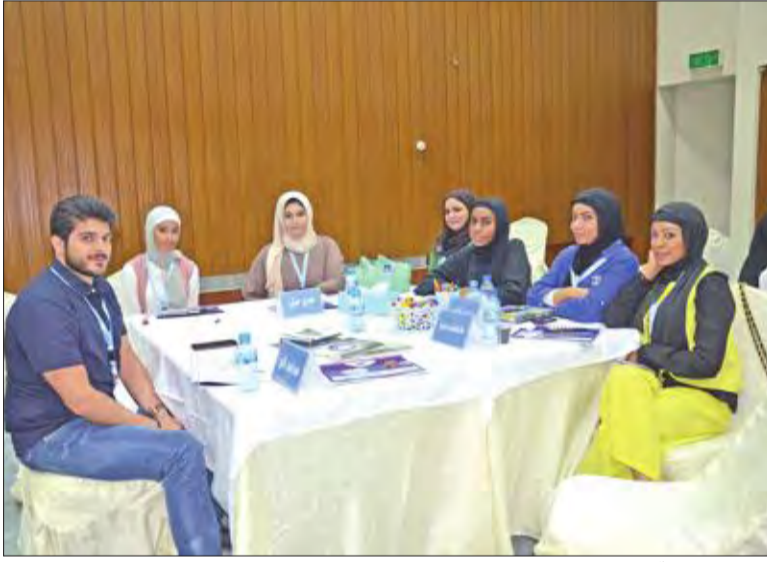
صورة جانبية لعدد من المتطوعين