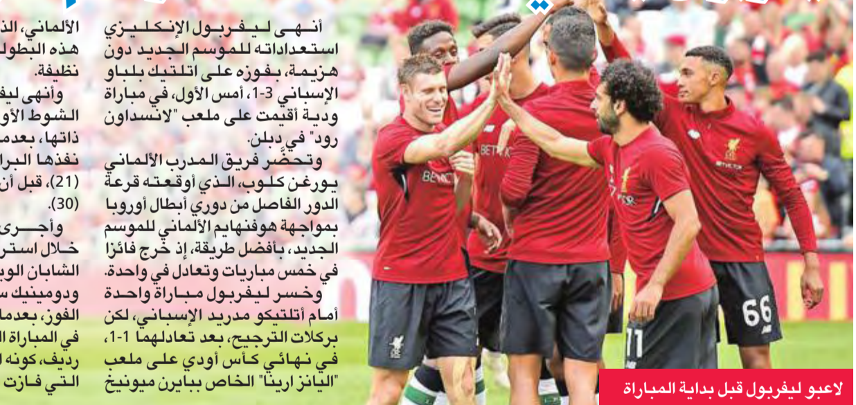
لاعبو ليفربول قبل بداية المباراة

الأماني، الذي مني بهزيمة مذلة في هذه البطولة أمام 'الحمر' بثلاثية نظيفة. وأنهى ليفربول ومنافسها الباسكي الشوط الأول، وهما على المسافة ذاتها، بعدما تقدم الأول بركلة جزاء نفذها البرازيلي روبرتو فرمينيو (21)، قبل أن يعادل ايناكي وليامس (30). وأجرى كلوب 10 تغييرات خلال استراحة الشوطين، ونجح الشبان الويلزي بنجامين وودبيرن ودومينيك سولانك في منح فريقهما الفوز، بعدما سجلا هدفين (59 و 80) في المباراة التي خاضها بلباو بفريق رديف، كونه استبدل بالكامل تشكيلته التي فازت الخميس على دينامو