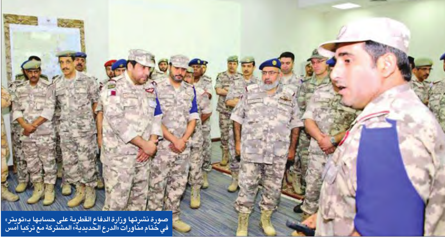
صورة نشرتها وزارة الدفاع القطرية على حسابها بـ«تويتر» في ختام مناورات «الدرع الحديدية» المشتركة مع تركيا أمس

مع دخول الأزمة الخليجية شهرها الثالث أمس، دعت المناهضة للسلطات القطرية إلى «فتح تحقيق مستقل» إذا أصرت على وصف العقوبات المتخذة ضدها من الدول الأربع بـ«الحصار». في وقت دعمت اليابان جهود الوساطة الكويتية لإنهاء الخلاف بين الأشقاء.