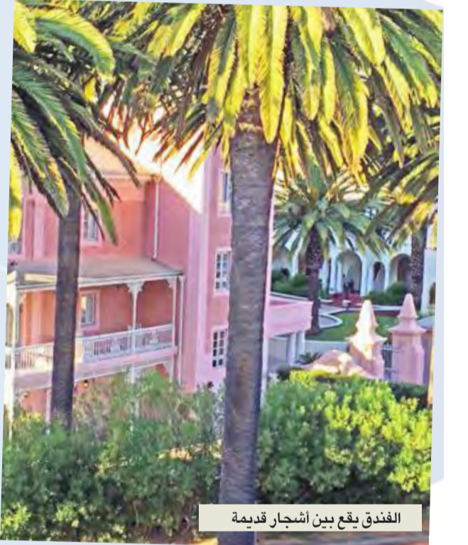
الفندق يقع بين أشجار قديمة

تماشياً مع نوعية التصميم الفنية في الغرف، يمكن أن يخار العملاء في متجر «سيغناشور بوتيت»، أفضل أنواع الحرف اليدوية المصنوعة محلياً والمعروضة