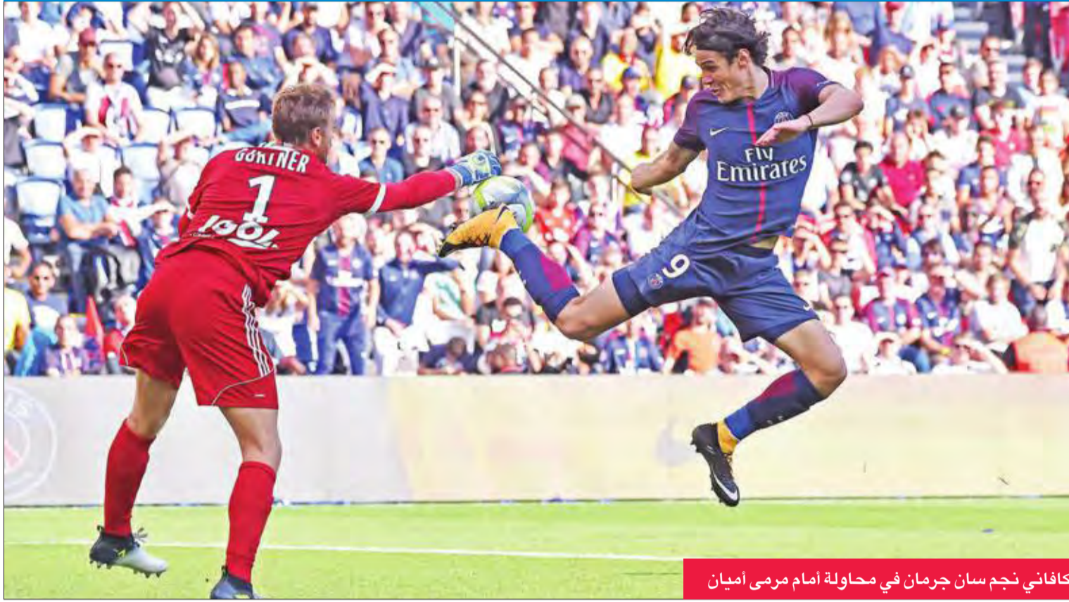
كافانجي نجم سان جرمان في محاولة أمام مرمى أميان

احتفل النجم البرازيلي نيمار من المدرب الجديد بالبرازيل الجيدة لفريقه الجديد باريس سان جرمان، الذي استهل حملته نحو استعادة لقب الدوري الفرنسي لكرة القدم من موناكو، بفوز على الوافد الجديد أميان 2-0 صفر على ملعبه 'بارك دي برينس'.