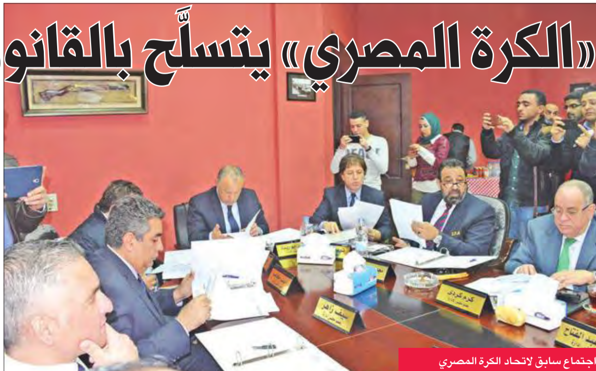
اجتماع سابق لاتحاد الكرة المصري

وتابع: "اتحاد الكرة سيتسلح بقانون الرياضة الجديد، الذي يمنح اللجوء أيضاً للمحاكم القضائية في النزاعات الرياضية، ويمكن تقبل أي فكرة