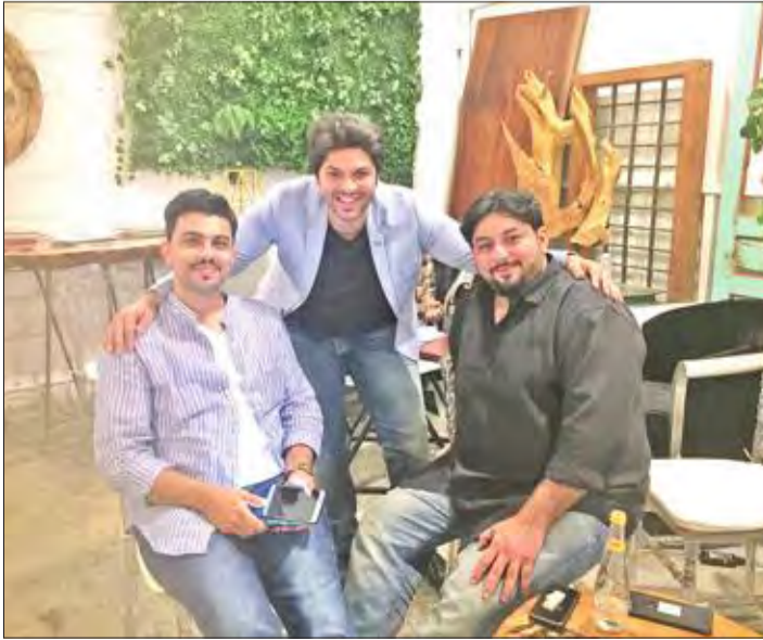
عدد من الفنانين في صورة تذكارية

تحت رعاية كريمة من مركز "سفانا دزاین سنتر"، بالتعاون مع قطاع الفنون التطبيقية التابع لنقابة الفنانين والإعلاميين، أقيمت أمسية صيفية للمصممين. وتخلل الأمسية الكثير من الفقرات، منها العزف على العبتار، وانتهت بتوزيع هدايا تشمل دورات تدريبية تقام بالمركز.