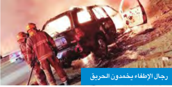
رجال الإطفاء يخمدون الحريق