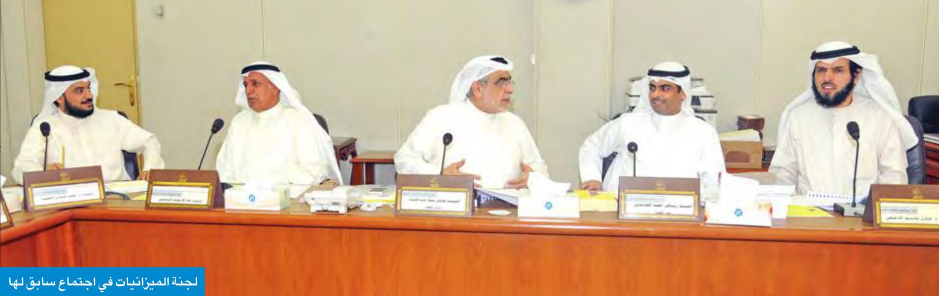
لجنة الميزانيات في اجتماع سابق لها

1.9 مليون دينار، وإيراداتها 394 الفاً، وحقق الصندوق الكويتي للتنمية الاقتصادية العربية إيرادات بنحو 252 مليوناً، ومصروفاته الفعلية 22 مليوناً، أي أنه حقق أرباحاً قدرها 229 مليوناً، ونص مشروع الإحالة على تحويل 23 مليوناً إلى المؤسسة العامة للرعاية السكنية، و206 ملايين إلى الاحتياطي العام للصندوق، في المقابل، بلغت مصروفات الهيئة العامة للاستثمار عن السنة المالية 2016-2017، نحو 55 مليون دينار، في حين بلغت إيراداتها 109 آلاف.