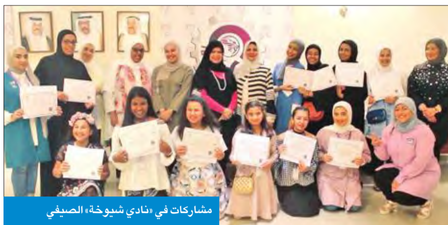
مشاركات في «نادي شيوخة» الصيفي

طلبة المدارس والجامعات في الفترة الصيفية لعام 2017.