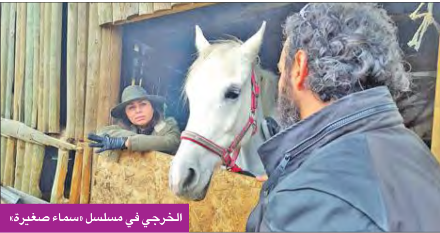
الخرجي في مسلسل «سماة صغيرة»

عرض آخر عبارة عن فيلم شبابي سيتم تصويره في أكتوبر المقبل، لم أبت في موضوع الموافقة عليه أو رفضه».