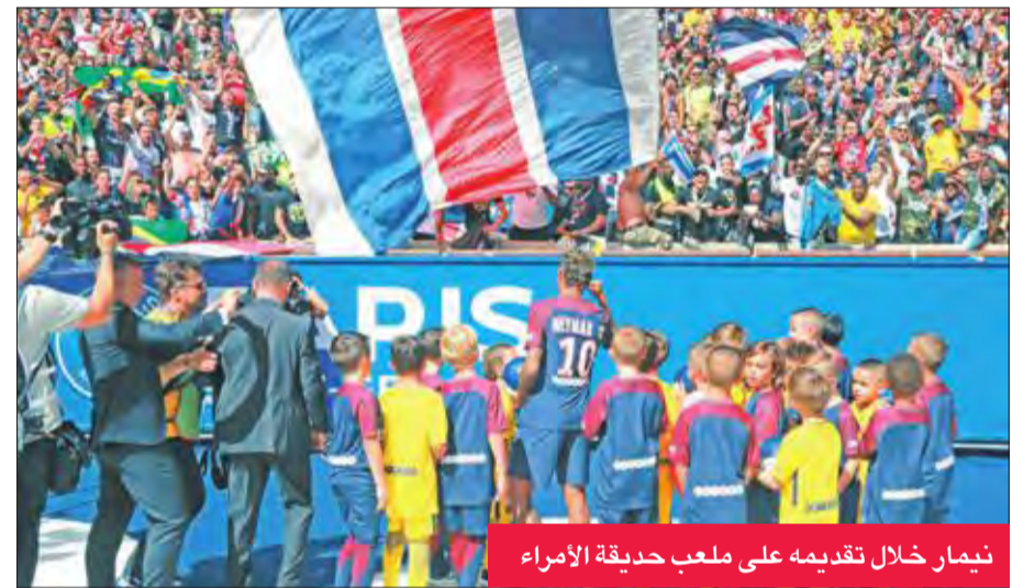
نيمار خلال تقديمه على ملعب حديقة الأمراء

الانتقال إلى الاتحاد الجديد (الاتحاد الذي ينترف على فرقة الجديد).