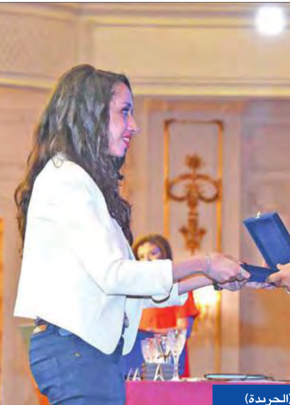
السياسي مكرماً إحدى المتفوقات في عيد العلم بالقاهرة أمس

من 70 «تكفيرياً»، وتدمير عدد من البؤر الإرهابية. إعادة محاكمة مرسي قضائياً، بدأت محكمة جنابات القاهرة، أمس، أولى جلسات إعادة محاكمة 22 متهماً من قيادات وعناصر جماعة الإخوان، يتقدمهم الرئيس السابق محمد مرسي، والمرشد العام للجماعة محمد بديع، وثلاثة خيرت الشاطر، في قضية اتهامهم بارتكاب جرائم التخريب مع منظمات وجهات اجنبية خارج البلاد، وإفشاء أسرار الأمن القومي، والتنسيق مع منظمات العنف المسلح داخل مصر وخارجها، بقصد الإعداد لعمليات إرهابية داخل الأراضي المصرية.