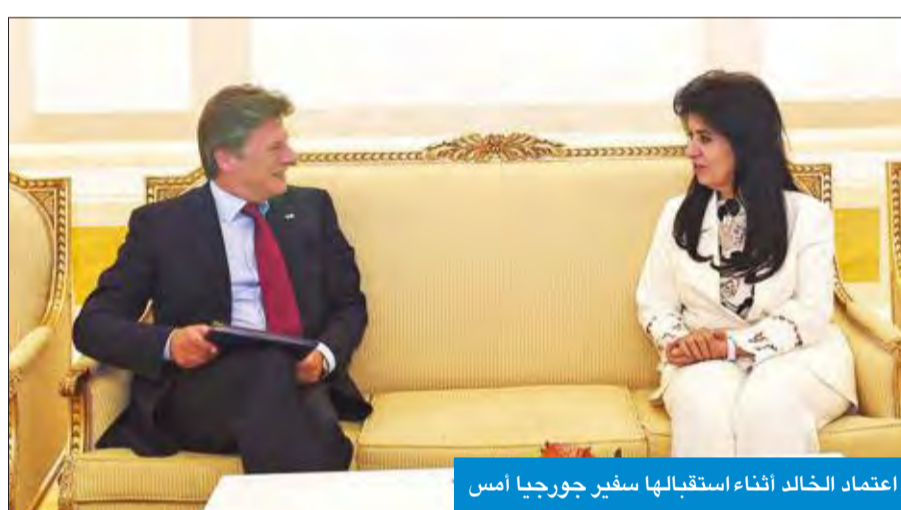
اعتماد الخالد أثناء استقبالها سفير جورجيا أمس

استقبلت رئيسة ديوان سمو رئيس مجلس الوزراء الشبيخة اعتماد الخالد في قصر بيان أمس، سفير جورجيا الصديقة لدى الكويت رولاند بيريزة، حيث سلمها رسالة خطية من رئيس وزراء جورجيا الصديقة جيورجي كفيركاشفيلي موجهة إلى رئيس مجلس الوزراء سمو الشيخ جابر المبارك، تتضمن العلاقات الثنائية بين البلدين الصديقين.