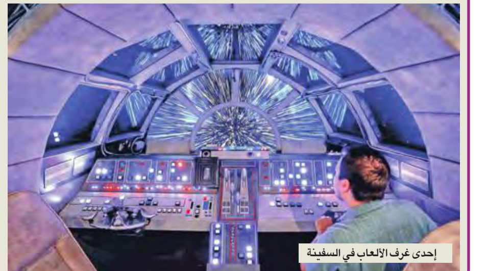
إحدى غرف الألعاب في السفينة

لم تحصل في الواقع على تفاصيل كثيرة عن السفن الثلاث الجديدة باستثناء أن وزنها الكلي 135 ألف طن، ما يعني أنها ستكون أكبر بقليل من Dream و Fantasy، اللتين يبلغ وزنها الكلي 130 ألف طن. ولكن من المتوقع أن تضاعف وزنها من 1250 غرفة.