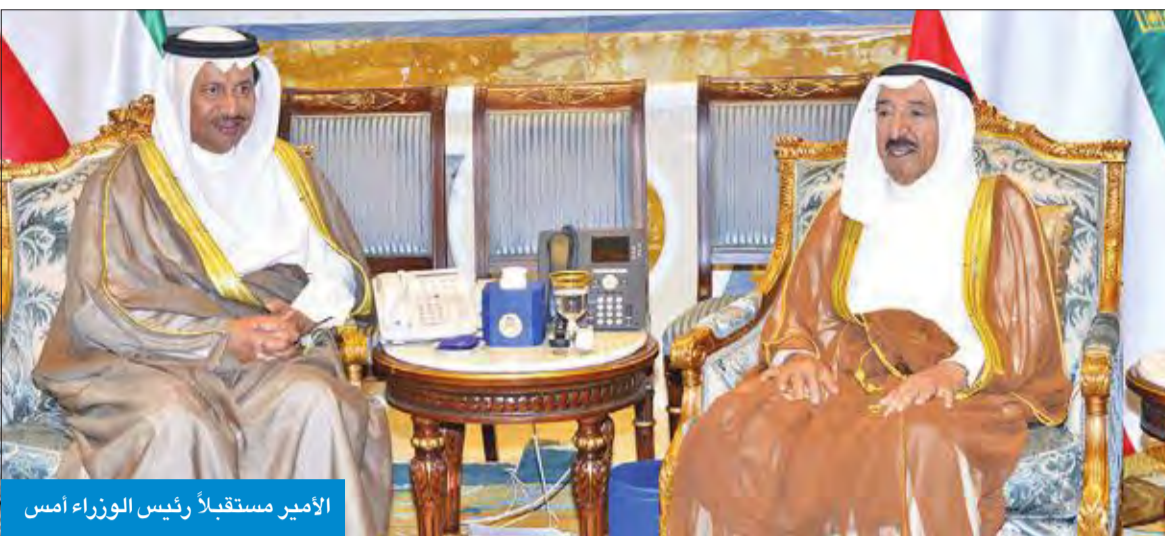
الأمير مستقبلاً رئيس الوزراء أمس