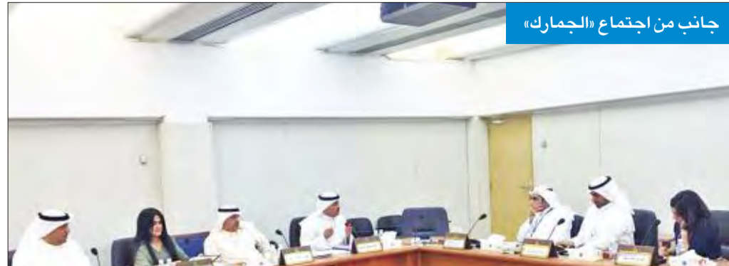
جانب من اجتماع «الجمارك»