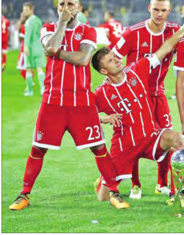
لاعبو بايرن يحتفلون بعد الفوز بكأس السوبر

أحرز بايرن ميونيخ لقب كأس السوبر الألمانية، بفوزه على مضيغمة بروسيا دورتموند بركلات الترجيح 5-4، بعد تعادلهما في الوقت الأصلي 2-2، أمس الأول، على ملعب 'سيغنال ايدونا بارك'. وكان دورتموند البائد بالتسجيل منذ الدقيقة 12 عبر الأمريكي كريستيان بوليزيتش، الذي استفاد من خطأ دفاعي في منتصف ملعب النادي البافاري، وانطلق بالكرة قبل أن يسدها في شباك الحارس سفين أورتيتش، الذي لعب أساسيا لأن مانويل نوير ما زال في مرحلة التعافي من عملية جراحية في قدمه. لكن بايرن رد سريعا عبر مهاجم دورتموند السابق البولندي روبرت ليفاندوفسكي، الذي وصلته الكرة من الجهة اليمنى بتمريرة من جوشوا كيميش، فتابعها في الشباك (18). وبقي التعادل سيد الموقف حتى الدقيقة 71 عندما نجح الهدف الغابوني ييار-إيميريك أوباميانغ في منح دورتموند التقدم في أول تسديدة له على المرعى ساقطة فوق الحارس. وعندما كانت المباراة تلتفظ انفاستها الأخيرة حصل بايرن على ركلة حرة على الجهة اليمنى، ووصلت الكرة إلى البديل نيكلاس شوله الذي حولها برأسه، فارتدت من العارضة وأحدثت معمة داخل المنطقة، قبل أن يسد كيميش لترتد من المدافع البولندي لوكاس ميشيك، وإلى شباك فريقة (88). واحتكم بعدها الفريقان مباشرة إلى ركلات الترجيح بحسب نظام كأس السوبر، وابتسم الحظ لبايرن الذي كان أول من أهدر عبر كيميش، لكنه عوض بفضل أورتيتش الذي صد محاولتي سيباستيان روده والأسباني مارك بارترا، وأهدى فريقة لقبه الثاني على التوالي في المسابقة، والسادس في تاريخه ليفرند بالرقم القياسي.