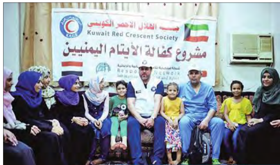
عبدالرحمن العون أثناء زيارته لأحد دور الأيتام في اليمن

قبل المسؤولين في اليمن وأشاد العون بالجهد الكويتية في دعم ومساعدة وإغاثة المحتاجين والمتضررين في اليمن، مشيداً بدعم أهل الكويت الدائم الذي ساهم في استمرار نشاط الجمعية الإغاثية لخدمة الأشقاء في اليمن الشقيق.