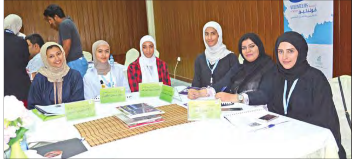
الفريق البيئي التطوعي