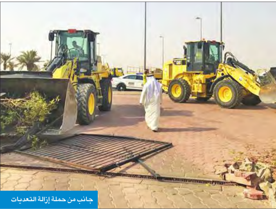
جانب من حملة إزالة التعديلات