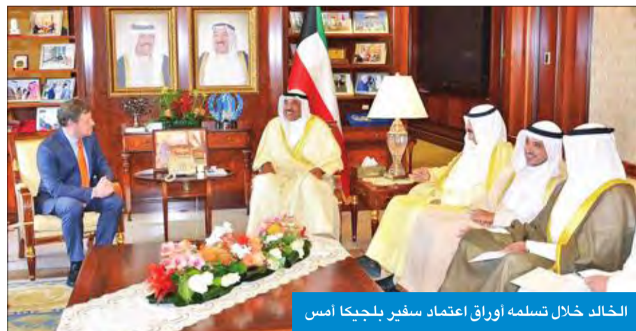
الخالد خلال تسلمه أوراق اعتماد سفيري بلجيكا أمس

ترازي، حيث تمنى له التوفيق في مهام عمله، وللعلاقات الثنائية بين البلدين الصديقين المزيد من التقدم والازدهار. حضرت اللقاء نائب وزير الخارجية السفير خالد الجارالله، ومساعد وزير الخارجية لشؤون مكتب النائب الأول لرئيس مجلس الوزراء وزير الخارجية السفير الشيخ د. أحمد ناصر المحمد، ومساعد وزير الخارجية لشؤون المراسم السفير ضاري العجران، وعدد من كبار المسؤولين في وزارة الخارجية. تسلم النائب الأول لرئيس مجلس الوزراء وزير الخارجية الشيخ صباح الخالد، نسخة من أوراق اعتماد سفير مملكة بلجيكا الصديقة لدى البلاد بيت هيربوت. وأعرب الخالد خلال لقائه هيربوت، أمس، عن تمنياته للسفير بالتوفيق والنجاح في مهام عمله الجديد، وللعلاقات الثنائية بين البلدين بالمزيد من التقدم والنماء. كما تسلم الخالد نسخة من أوراق اعتماد سفير جمهورية غينيا الصديقة لدى البلاد مامادي