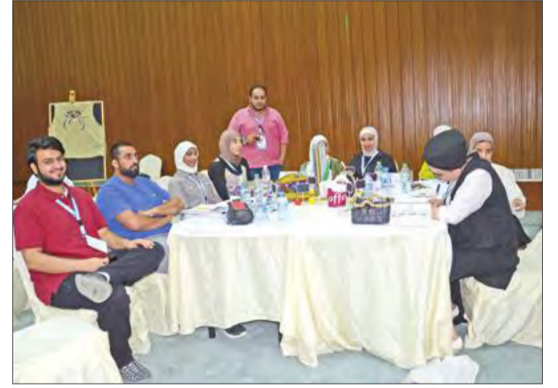
المجموعة التطوعية في المجال الصحي