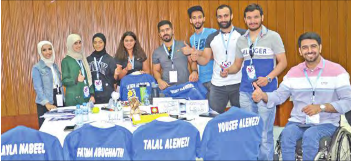
فريق المجال الرياضي التطوعي