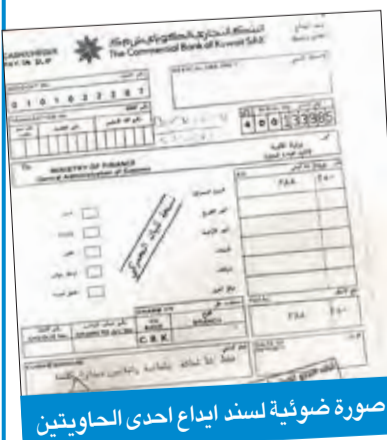
صورة ضوئية لسند ابداع احدي الحاويتين

نفت الإدارة العامة للمحكمة ما أشيع عن تفريغ حاويتين في ميناء الشويخ في 30 يوليو 2014. وقالت الإدارة في بيان صحفي، إنه بالإشارة إلى ما ذكر في بعض مواقع التواصل الاجتماعي بشأن تفريغ حاويتين من ميناء الشويخ لم تبلغ بهما لجنة التحقيق كما جاء بالخبر، فإن الإدارة العامة للمحكمة تحب أن توضح وتؤكد أن الإرسالياتين سالفتي الذكر خضعتا إلى جميع إجراءات التوثيق والتدقيق والتفتيش، وتم توثيق الإرسالياتين بموجب البيان رقم 72056، 72112 المؤرخين في 2014/7/30 وسددت الضريبة الجمركية المستحقة عليهم بموجب سندي الإيداع رقمي 400133985، 400133989 بتاريخ 2014/7/29 و 2014/7/26 لدى بنك الكويت التجاري، وتم التدقيق عليهما وكذلك تفقيشهما وفقاً للإجراءات المتبعة والمنصوص عليها في القانون الجمركي رقم 10 لسنة 2003 وقد خرجتا من بوابة الخروج بتاريخ 2014/7/31. وأرقت الإدارة العامة للمحكمة ووافق تبرهن على سلامة الإجراءات المتبعة بما في ذلك الضريبة الجمركية المستحقة على الحاويتين والصادر بهما سند ابداع كما أرقت في بيانها تفويت خروج الحاويتين، وهو ما يؤكد عدم صحة تفريغ الحاويتين كما أشيع في وسائل التواصل.