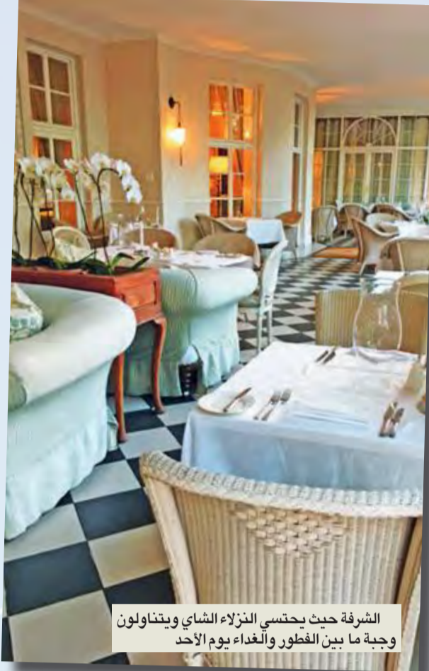
الشرقة حيث يجتسي النزلاء الشاي ويتناولون وجبة ما بين الفطور والغداء يوم الأحد

لا تعرف مطلقاً أية غرفة اختارت أغاناً كريستي الإقامة فيها حين زارت فندق «بيليموند ماونت نيلسون» في «كيب تاون» بجنوب إفريقيا، لكنها كانت تشعر براحة تامة كي تكتب قصصها الغامضة في الجناح الذي أقامت فيه علماً بأنه خضع للتجديد منذ أن كانت هناك في عام 1922. يمكنني أن أتخيل أيضاً وينستون تشرشل يدخن سيجاره في حوض استحمام يتصاعد منه البخار خلال حرب «بوير» (1900-1902) حين كتب: «إنه أفضل وأكمل مكان يمكن الاستمتاع فيه بعد رحلة بحرية».