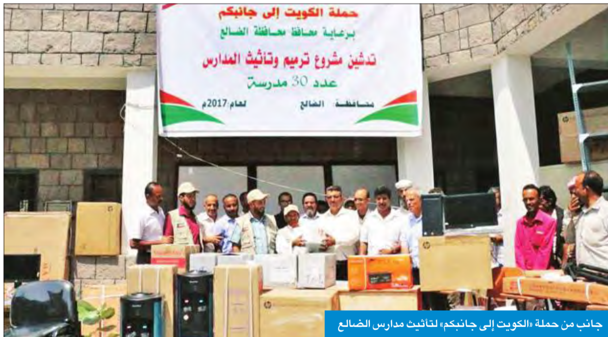
جانب من حملة «الكويت إلى جانبكم» لتأثيث مدارس الضالع

دشنت حملة «الكويت إلى جانبكم» ترميم وتأثيث 30 مدرسة في محافظة الضالع جنوب غرب اليمن، في إطار المشاريع الخيرية والإغاثية التي تنفذها الحملة في مختلف محافظات.