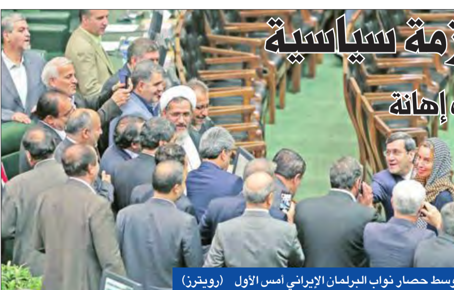
موغيريني وسط حصار نواب البرلمان الإيراني أمس الأول

وفي اعتذاره، قال نائب مدينة شبيران فرج الله رجبي إن بعض النواب حاولوا التودد لموغيريني كي يعطوها صورة جميلة وودية عن زيارتها إلى طهران،