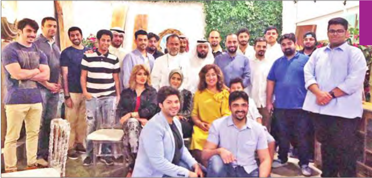
صورة جماعية للمشاركين