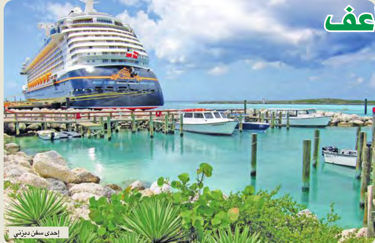
إحدى سفن ديزني