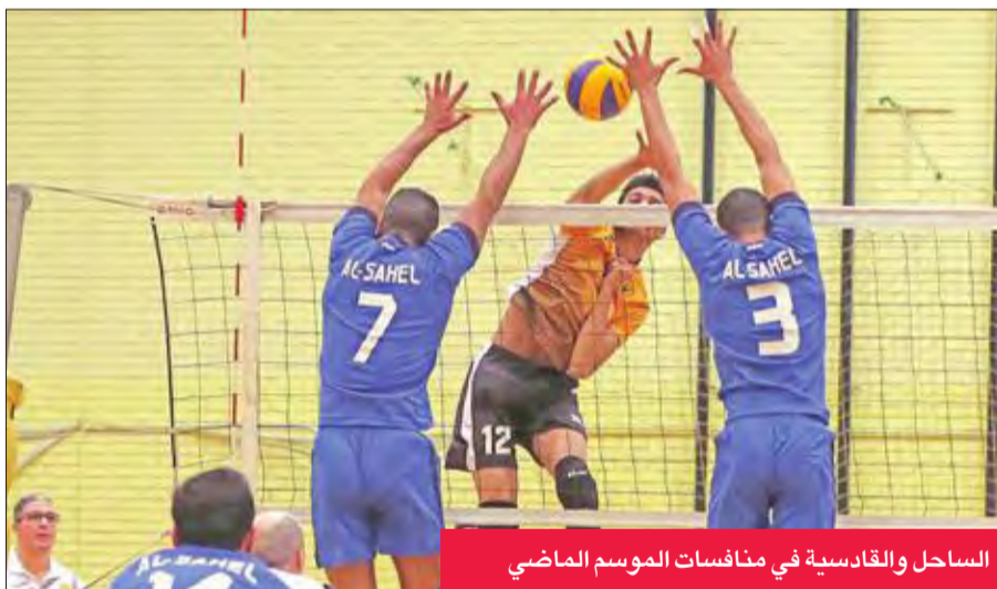
الساحل والقادسية في منافسات الموسم الماضي