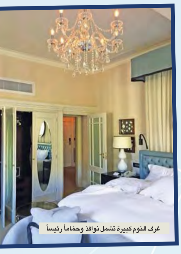
غرف النوم كبيرة تشمل نوافذ وحماماً رئيسياً

المراقبة على مشهد بانورامي المتنوعة. لكن كانت العربية التي تشمل الحانة الأكثر شعبية طبعاً وشاهدت فيها استراليين وبريطانيين وأميركيين وجنوب إفريقيين فضاءً عن حاملي جنسيات أخرى استفادوا بأفضل طريقة من المشروبات والوجبات المتاحة. في فترة بعد الظهر تقدّم عربية مجهزة مجموعة من الساندوتشات مع الشاي وكعكا مع كريمًا ومعجنات على صوان فضية، ولا ننسى شاي روبيوس الذي تشتهر به منطقة جنوب إفريقيا. تقدّم العشاء الرسمي مع وجبتي الغداء في عربية الطعام الفخمة. نشطت مخيلتي مجدداً فيما كنت أتجه إلى طاولتي المرتبة بدقة وعليها بلورات لامعة. كانت خربة رئيس الطهاة والتصميم الداخلي الجميل كافتين لإضفاء جو ساحر وضمان تجربة لا تُنسى.