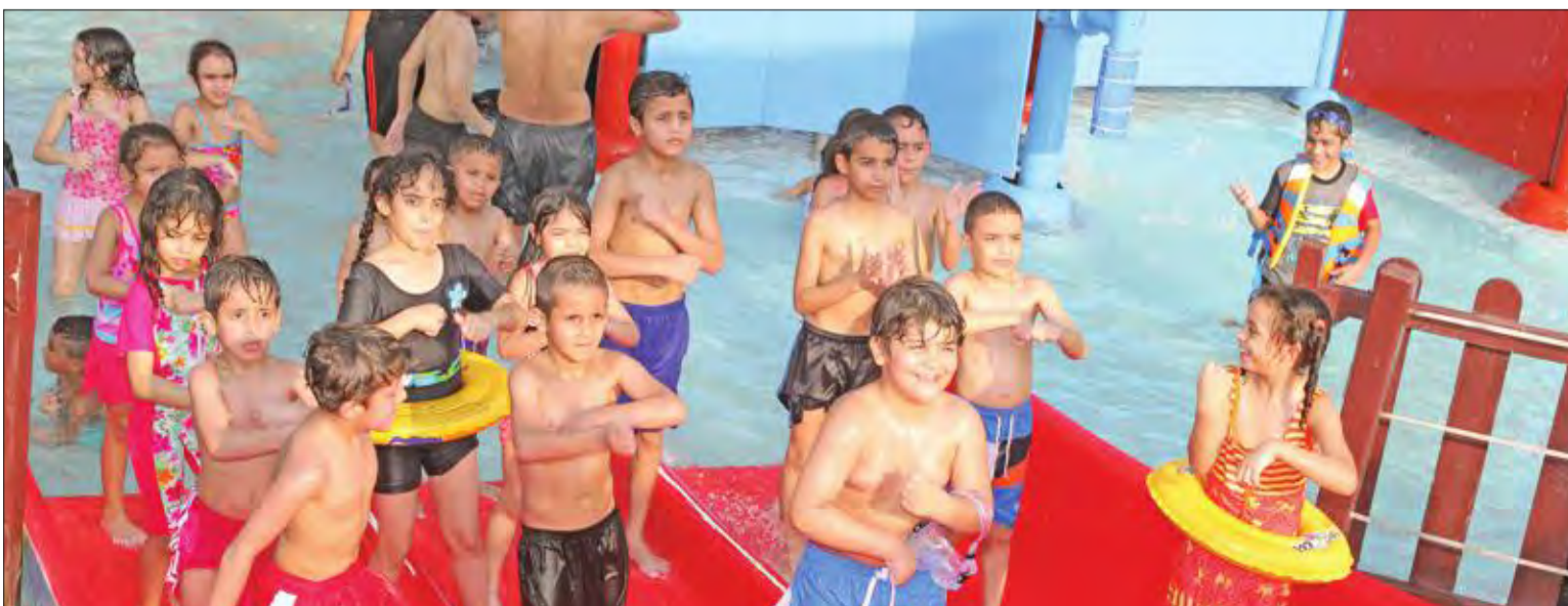
مسابقة «من الأسرع في الرقص»

أقامت المدينة المائية (أكوأبارك) مهرجاناً بعنوان «عيلنا ديرتنا»، بحضور حشد كبير من الأطفال وعائلاتهم. تخلل المهرجان فقرات وبرامج متنوعة قدمها نمر النجار.