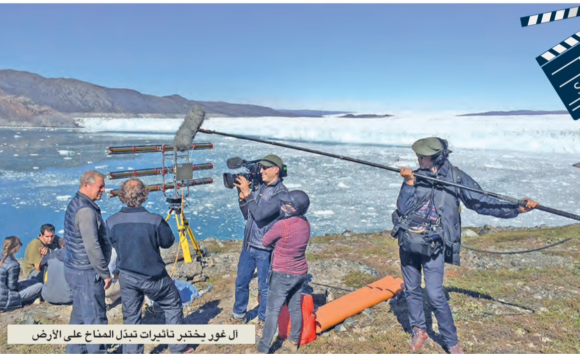
آل غور يختبر تأثيرات تبدل المناخ على الأرض

مع انتشار المقالات عن تبدل المناخ على وسائل التواصل الاجتماعي، واحتلال التقارير عن الأحوال الجوية المتطرفة وذوبان الأنهار الجليدية حيزاً مهماً من الأخبار، وقرار الرئيس الأميركي الأخير الانسحاب من اتفاقية باريس، يبدو أن ما من وقت أفضل وأكثر اضطراباً من اليوم لنزول An Inconvenient Sequel: Truth to Power إلى صالات العرض.