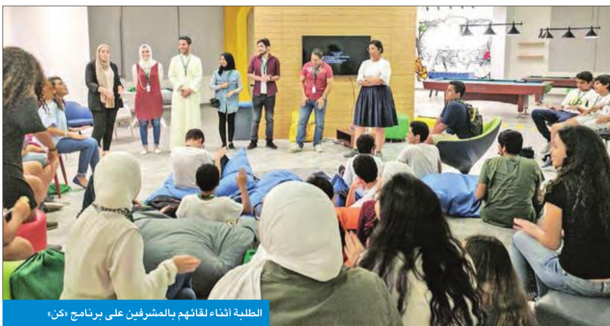
الطلبة أثناء لقاءهم بالمدرسين على برنامج «كن»

في إطار اتفاقية التعاون مع كلية «بابسون»