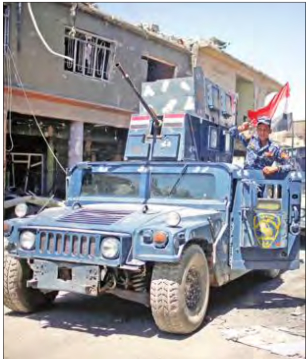
عناصر من قوات الشرطة العراقية تمشط شوارع مدينة الموصل القديمة أمس

في غضون ذلك، رد المتحدث باسم زعيم التيار الصدري مقتدى الصدر، جعفر الموسوي، أمس، على أطراف وصفتها بأنها «أصحاب مشاريع رخيصة