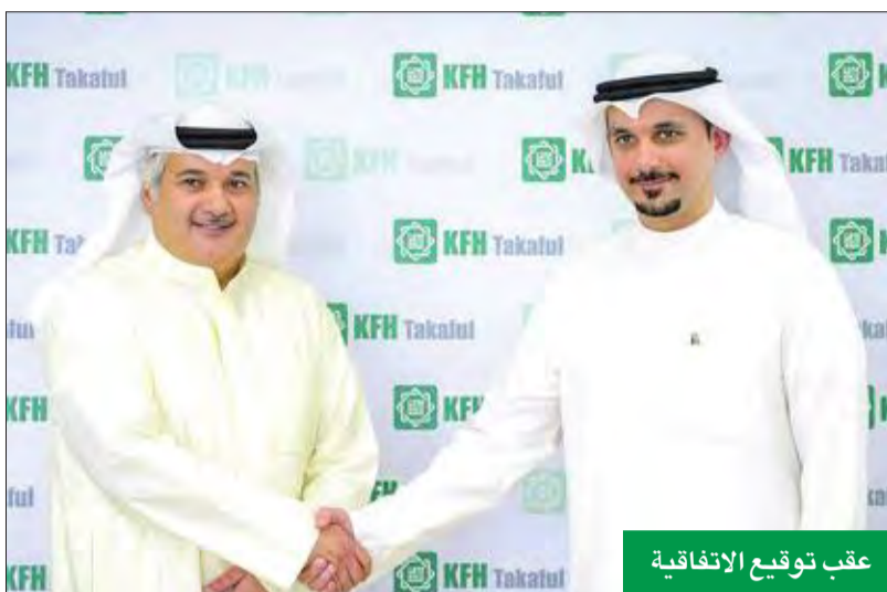
عقب توقيع الاتفاقية

تنظم الأندية مسابقات للسيارات بمستويات مختلفة لأعضائها، حيث يحرض قانديو بورشه على الاستمتاع بسياراتهم الرياضية والالتقاء ببعضهم في حلبات السباق والتمتع بأنشطة الطرق الوعرة مع سيارات بورشه كابين، كما تركز فعاليات بورشه كلاسيك على الموديلات التاريخية العربية للماركة وطرق العناية بها وصيانتها، وتبادل الخبرات بين الأعضاء في مختلف الأنشطة المرتبطة بسياراتهم.