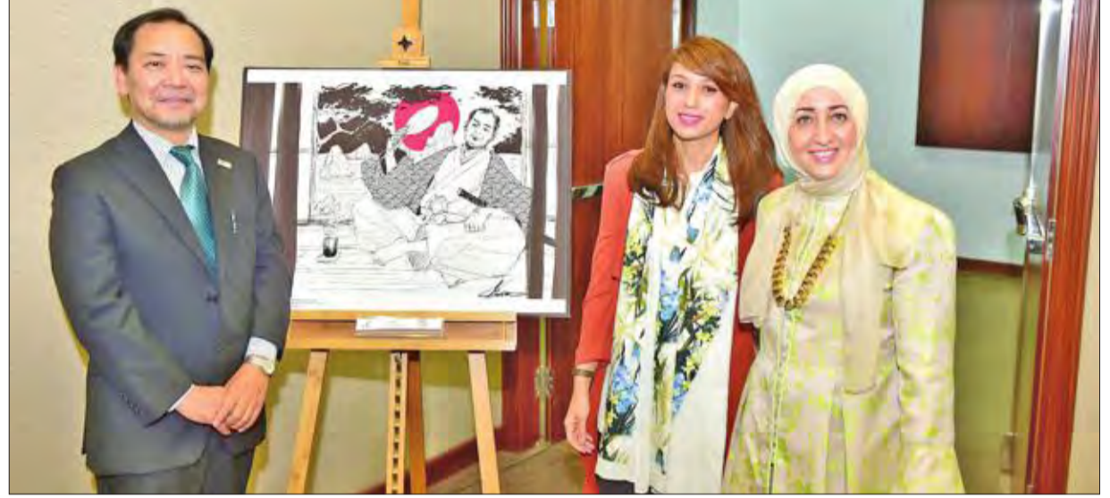
السفير الياباني والقعود أمام إحدى اللوحات