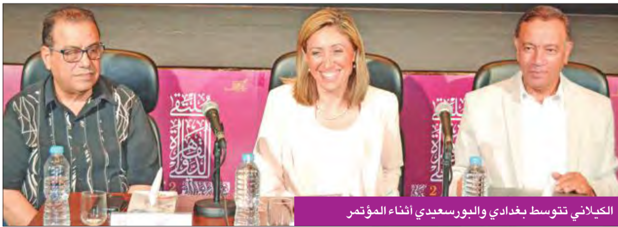
الكيلاني تتوسط بغدادوي والبورسعيدي أثناء المؤتمر

يطلق ملتقى القاهرة الدولي لفن الخط العربي دورته الثالثة هذا الأسبوع تحت شعار "جني الثمار"، بمشاركة نحو 120 فناناً من 21 دولة عربية وأجنبية.