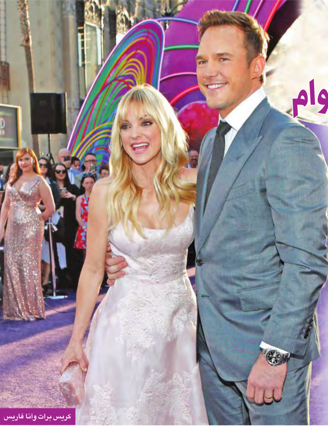
كريس برات وأنا فارييس

أعلن الممثل كريس برات وزوجته الممثلة أنا فارييس في بيان مشترك على مواقع التواصل الاجتماعي، مساء أمس الأول، انفصالهما بعد زواج دام ثمانية أعوام. وقال الزوجان في بيانهما المشترك: «أنا وأنا نشعر بالحزن للإعلان أننا انفصلنا قانونياً، لقد حاولنا كثيراً فترة طويلة إنقاذ زواجنا... ونحن فعلاً نشعر بخيبة الأمل». وقال برات وفارييس: «مازالنا نكن حباً كل منا للآخر، ودائماً سوف نقدر الوقت الذي قضيناه سوياً وسوف نستمر في أن نكن أعمق الاحترام كل منا للآخر، ومن أجل مصلحة ابنتنا سنحاول أن نبقي هذه القضية ضمن خصوصياتنا قدر الإمكان». وقد أصبح برات (38 عاماً) أحد أنجح ممثلي هوليوود بفضل دوره في فيلم «جوراسيك بارك» و«غارديينز أوف ذا غالاكسي». وقد أشاد برات مطولاً بفارييس (40 عاماً) في أبريل عند تلقيه نجمة على رصيف الفن في هوليوود، قائلاً لها «من دونك لما تحقق كل ذلك». وقد التقى الزوجان خلال تصوير الفيلم الكوميدي «تيك مي هوم تونايت» عام 2007 عندما كانت فارييس تستعد للمطلاق من زوجها الأول الممثل بن إندرا،