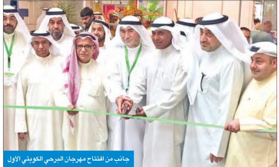
جانب من افتتاح مهرجان البرحي الكويتي الأول

نظمت جمعية أصدقاء النخلة، أمس، «مهرجان البرحي الكويتي» الأول، برعاية وزيرة الشؤون الاجتماعية والعمل وزيرة الدولة للشؤون الاقتصادية هند الصباح، في سوق جمعية الزهراء التعاونية، بحضور عدد من المزارعين.