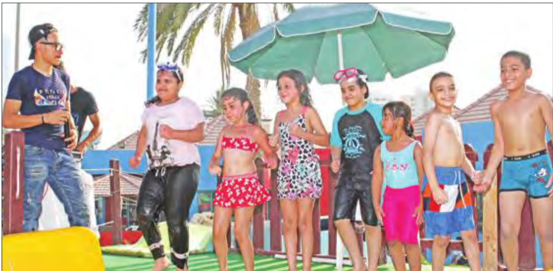
مسابقات متنوعة للأطفال