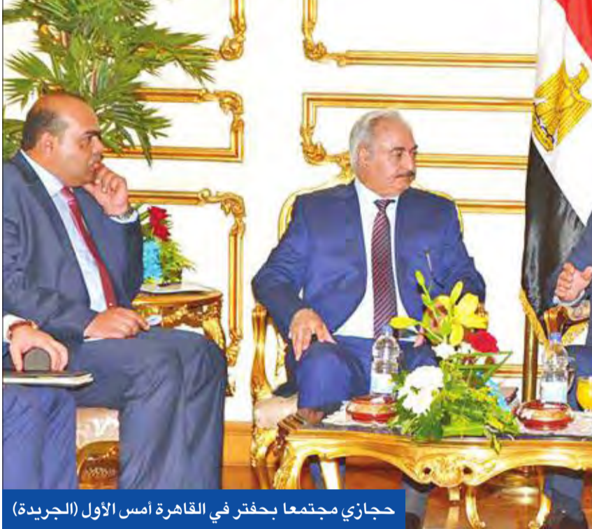
حجازي مجتمعاً بحفتر في القاهرة أمس الأول

وأشار عدد من الأهالي إلى أن إغلاق الطريق الدائري جنوب مدينة العريش للأسبوع الثالث، حد من قدرة الأفراد المصروح لهم بتعبئة أسطوانات الغاز المسال على توصيلها إلى المستودعات الحكومية المنوط بها توزيع تلك الأسطوانات. وعن رحلة معاناة الأهالي للحصول على اسطوانة غاز مسال، قال سكان محليون إنهم يضطرون إلى الذهاب إلى مركز "بئر العبد"، الذي يبعد نحو 80 كيلومتراً عن الشيخ زويد. للحصول على أسطوانة غاز، وأن سكان الشيخ زويد باتوا يطهون الطعام على نيران الحطب.