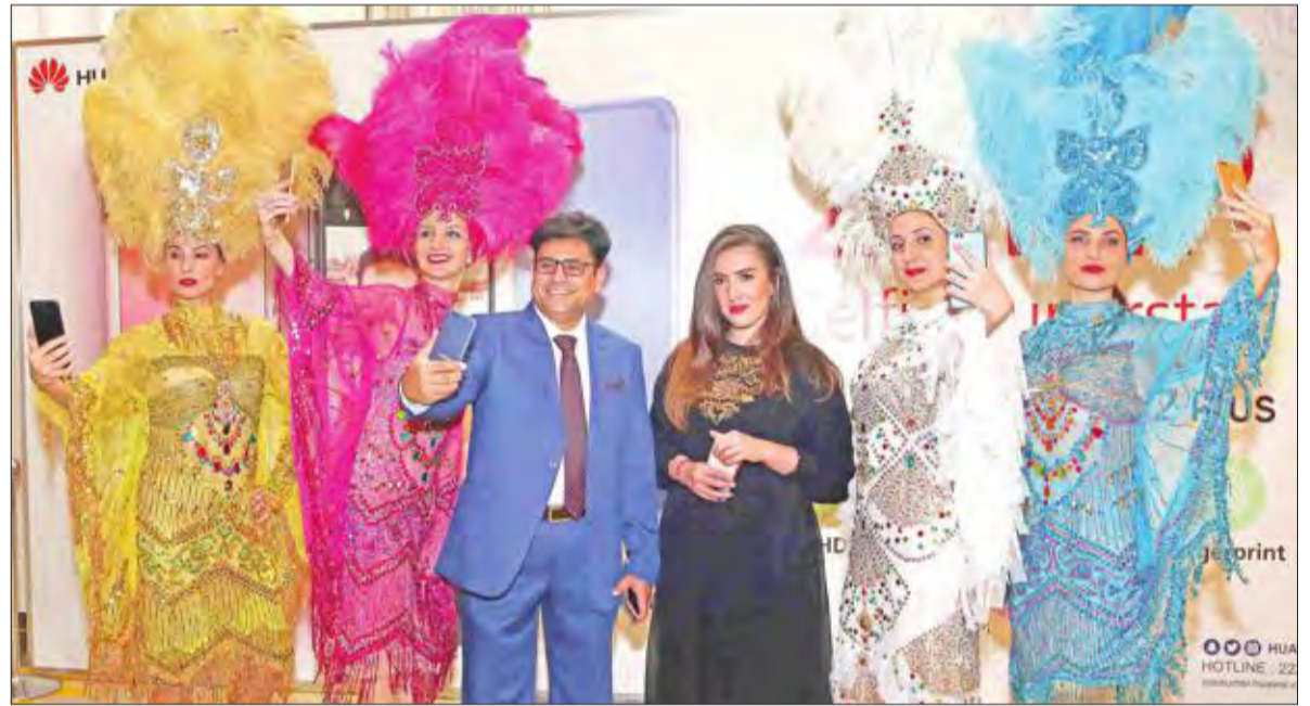
التقاط صور سيلفي