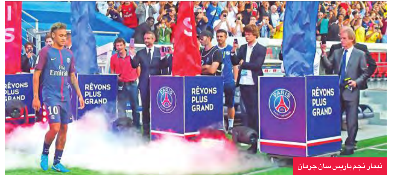
نيمار نجم باريس سان جرمان

وقال اللاعب، الذي انتقل من برشلونة بعدما دفع فيه النادي الباريسي 222 مليون يورو ليصبح أعلى صفقة في تاريخ كرة القدم: "لم أكن أتخيل ذلك حتى في أفضل أحلامي".