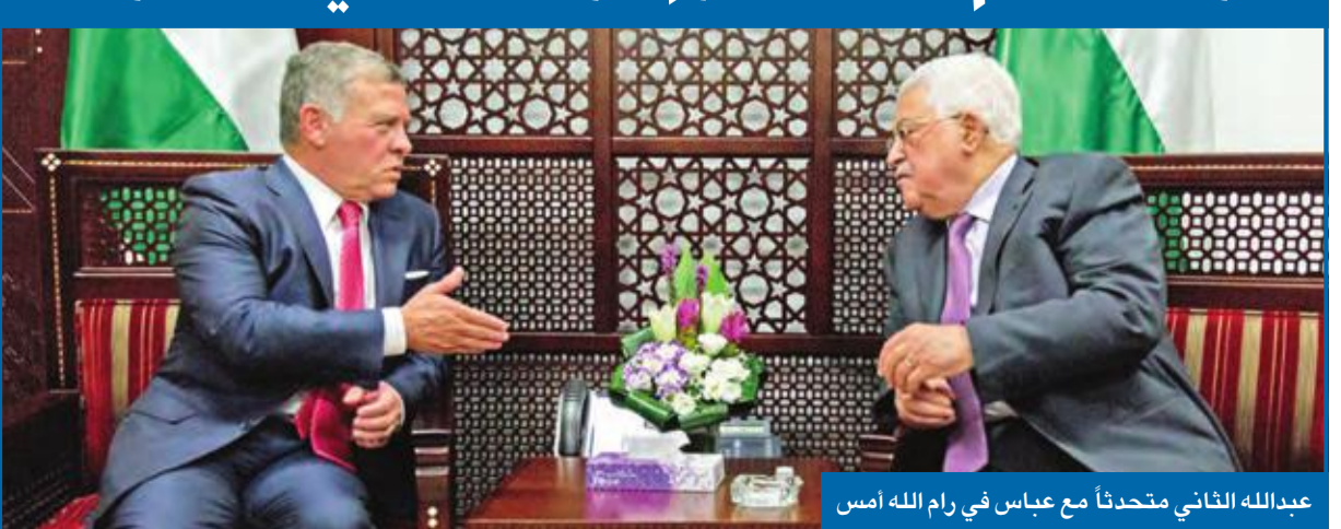
عبدالله الثاني يتحدث مع عباس في رام الله أمس

الأردن يدعم عباس... وإسرائيل تنفي احتجازه