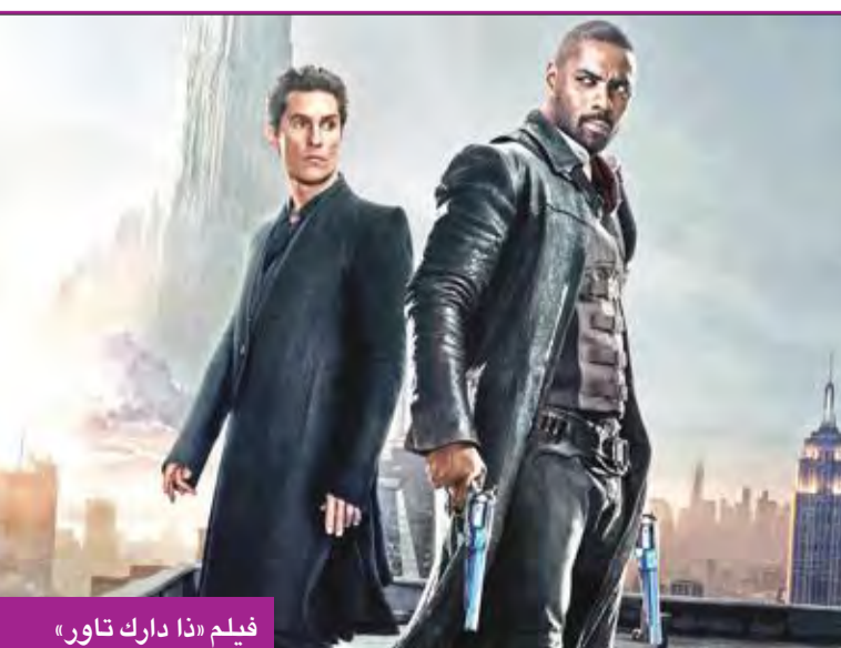
فيلم «ذا دارك تاور»