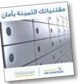
مقتنياتك القيمة بأمان

الحجم الصغير والمتوسط والكبير، مع إمكانية الحصول على أكثر من صندوق للتعليق الواحد. كما تتميز صناديق أمانات «المتحد» بسهولة الوصول إليها في أي وقت خلال ساعات الدوام الرسمية، وفقاً للإجراءات المتبعة لدى البنك. ويقدم «المتحد» خدمة صناديق الأمانات برسوم معن عنها في قائمة لأئحة عمولات البنك، والتي يمكن الاطلاع عليها من خلال فروع المختلفة، أو من خلال موقعه الإلكتروني، للتسهيل على العملاء الراغبين في حفظ مقتنياتهم وثائقهم المهمة بأماكن موثوقة ومضمونة. تتوافر خدمة صناديق الأمانات في فروع: المبنى