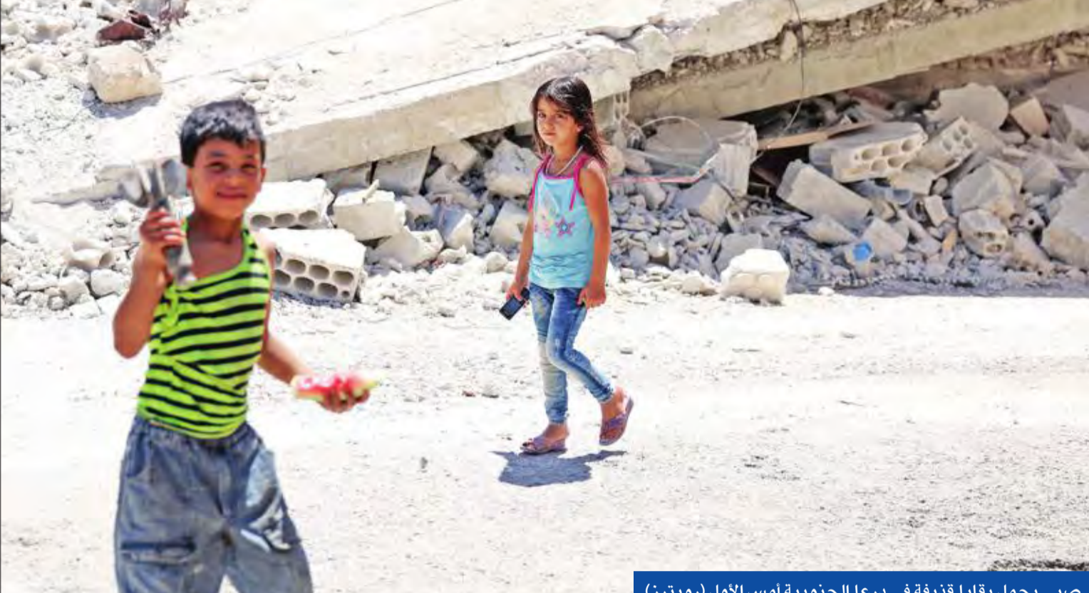
صبي يحمل بقايا قذيفة في درعا الجنوبية أمس الأول

• أبناء عن مقتل 100 طفل بمعسكر في دير الزور • موسكو تختبر مروحية جديدة • السعودية موقفها ثابت