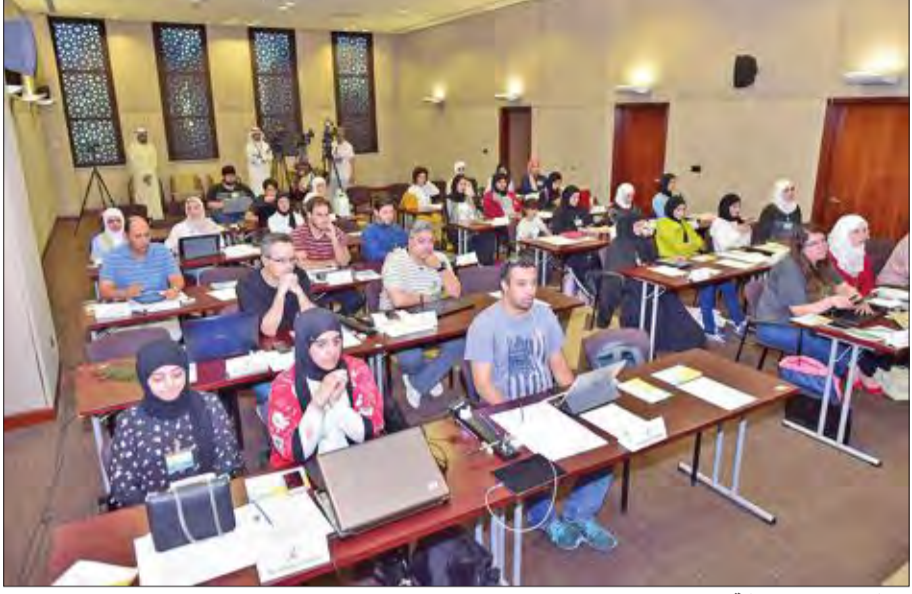
المشاركون في الورشة