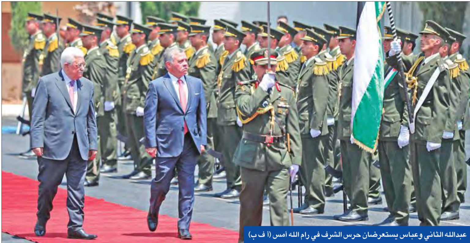
عبدالله الثاني وعباس يستعرضان حرس الشرف في رام الله أمس

«فتح»: لا مبادرة مصرية لإنهاء الانقسام • «حماس» تتمسك بإدارة غزة • تل أبيب تسحب الجنسية من عربي