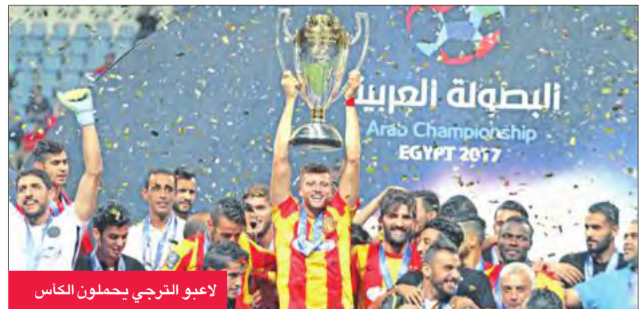
لاعبو الترجي يحملون الكأس