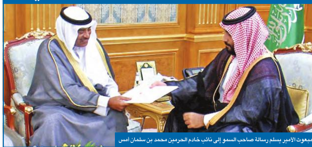
مبعوث الأمير يسلم رسالة صاحب السمو إلى نائب خادم الحرمين محمد بن سلمان أمس

«التربية» تحقق في استثناء المعلمين من بصفة الدوام