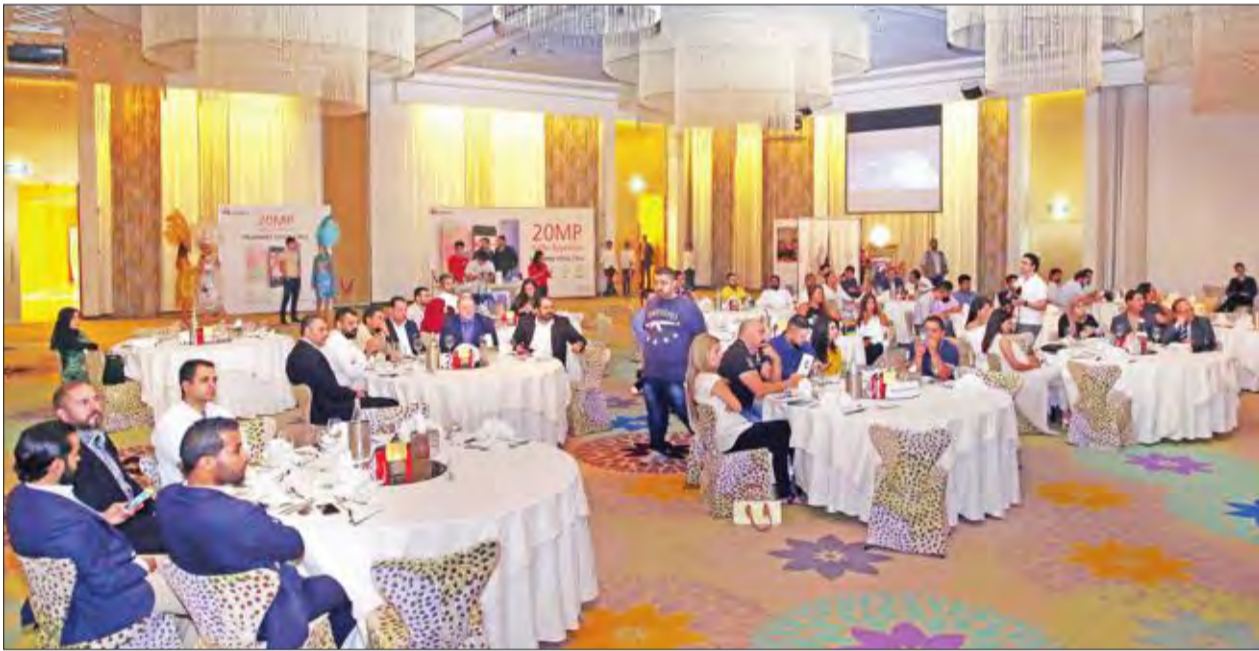
صورة جانبية للحضور

أقامت شركة «هاواي تكنولوجيز» الكويت أمسية تعريفية في فندق سيمفوني، للكشف عن أحدث هواتفها الذكية التي تطرحها في السوق المحلي، «نوبا 2» و«نوبا 2 بلس»، اللذين تم تصميمهما بميزات مبتكرة وجريئة، أبرزها كاميرا أمامية متطورة جداً، وتجربة صوت متقدمة.