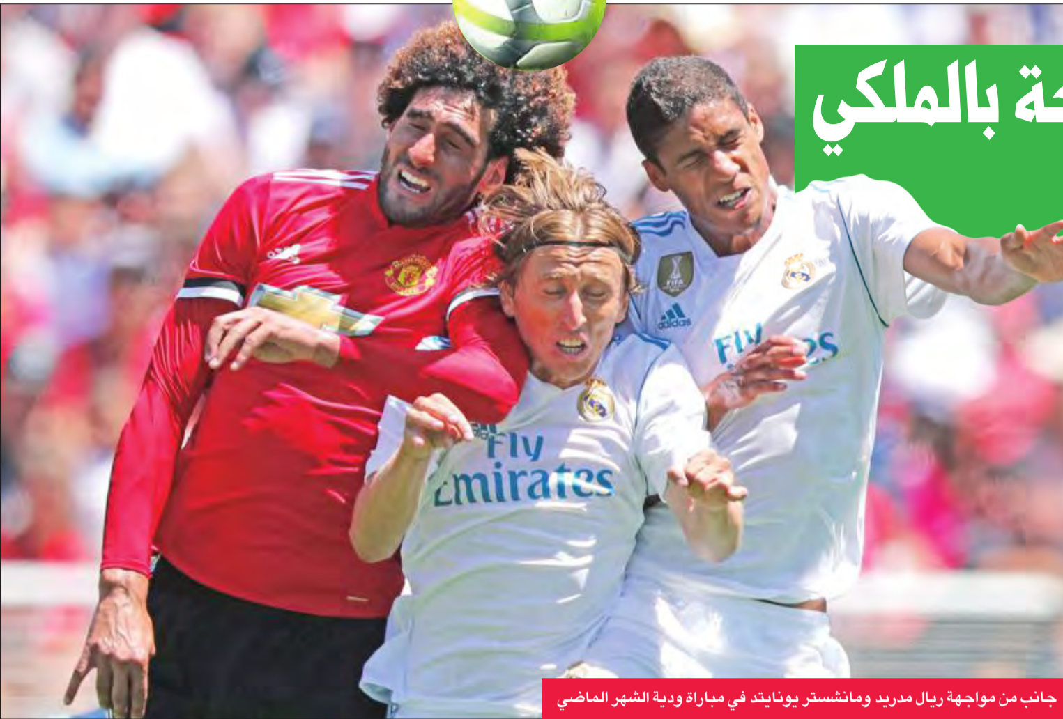
جانب من مواجهة ريال مدريد ومانشستر يونايتد في مباراة ودية الشهر الماضي

الدوري الإنكليزي، والكولومبي خاميس رودريغيز المعار إلى بايرن ميونخ الألماني. في المقابل، تعاهد النادي مع لاعبين صاعدين هما داني سيبايوس من بيتيس، والفرنسي ثيو هرنانديز من اتليكو مدريد.