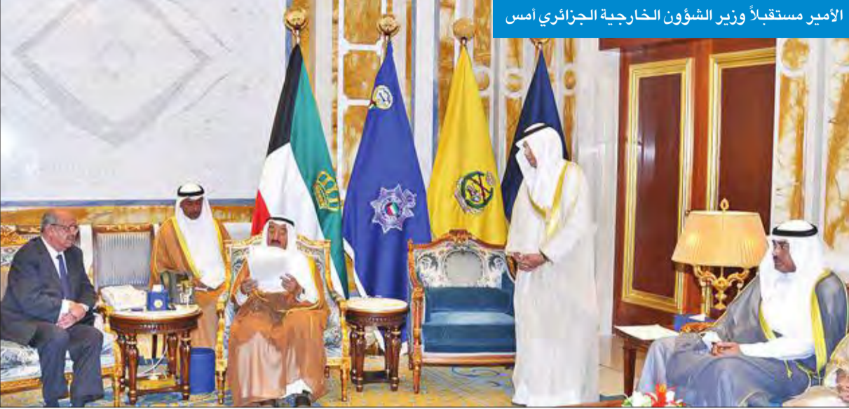
الأمير مستقبلاً وزير الشؤون الخارجية الجزائري أمس

سموه هنا رئيسي رواندا وساحل العاج ورئيس وزراء باكستان