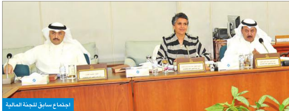
اجتماع سابق للجنة المالية

تتويع مصادر الدخل للمواطنين ودعم المواطن للعمل في القطاع الخاص وإعطاء مجال أكبر لسوق العمل لجميع المقيمين على أرض الوطن. يذكر أن رأي الأقلية بني على رفضهم شكل الاقتراح وليس الفكرة، حيث أنه يفترض أن يقدم في صيغة اقتراح بقانون، ثم وافق المجلس على تقرير اللجنة المالية في جلسته المنعقدة بتاريخ 23 مايو وأحالته بدوره إلى الحكومة.