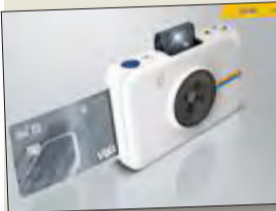
جدير بالذكر، أنه بإمكان

العملاء تقديم طلب للحصول على البطاقة الجديدة في أي من فروع البنك، لكن الاستلام سيتم مباشرة، كما يمكن للعملاء الذين يقومون بطلب استبدال بطاقتهم المتفردة أو التالفة الاستفادة من هذه الخدمة أيضاً. وتتوافر خدمة الإصدار الفوري للبطاقات حالياً في الفرع الرئيسي للبنك بالعاصمة، إلى جانب فرع حولي والشويخ والزهراء وسعد العبدالله.