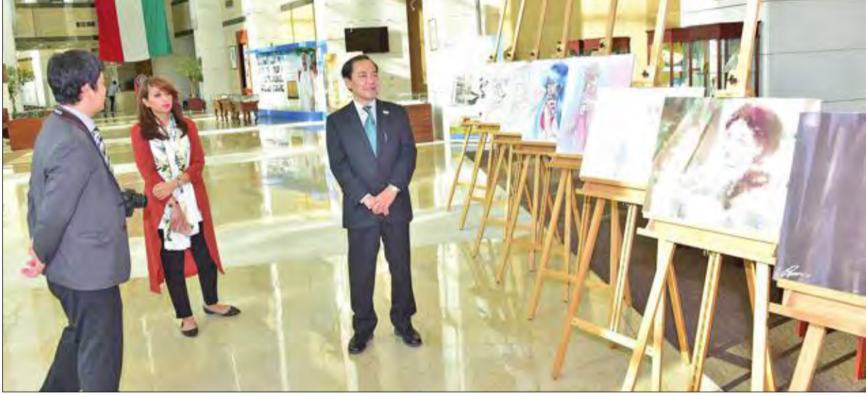
جولة في ورشة رسم الأنمي