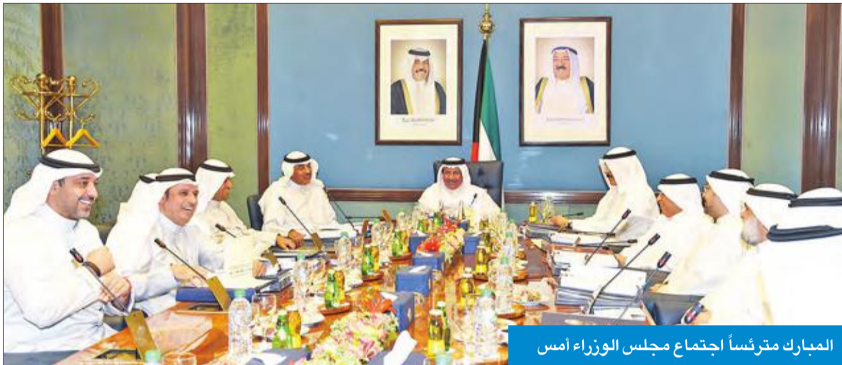
المبارك مترئساً اجتماع مجلس الوزراء أمس

● الأمير يزور الولايات المتحدة 6 سبتمبر ● الحكومة تشيد بإجراءات «الداخلية» حيال «خلية العبدلي»