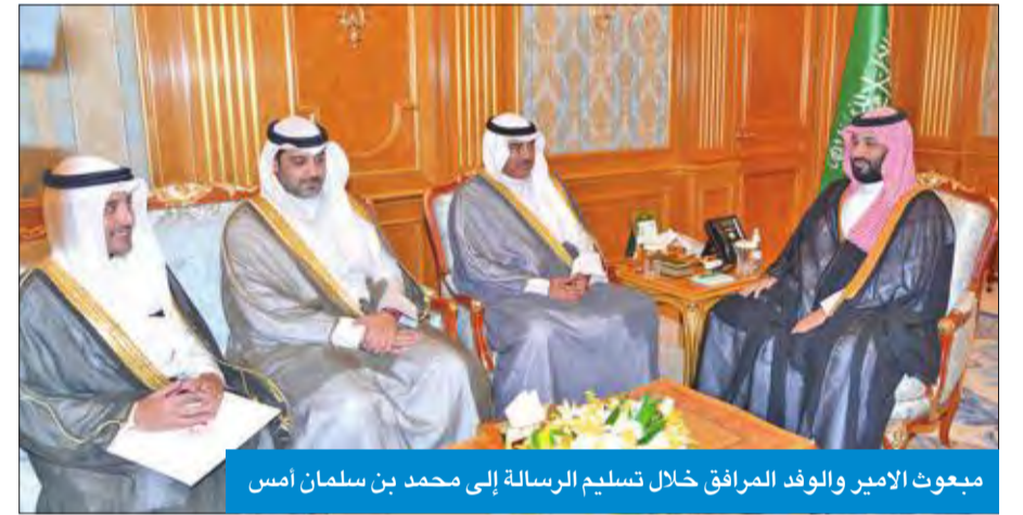
مبعوث الأمير والوفد المرافق خلال تسليم الرسالة إلى محمد بن سلمان أمس

الشرين صاحب السمو الملكي الأمير محمد بن سلمان، وحضر اللقاء مساعد وزير الخارجية لشؤون مكتب النائب الأول لرئيس مجلس الوزراء وزير الخارجية، السفير الشيخ د. أحمد ناصر المحمد، وسفير الكويت لدى المملكة العربية السعودية الشقيقة الشيخ ثامر الجابر. وتوجه مبعوث سموه إلى جمهورية مصر العربية الشقيقة لتسليم رسالة خطية من سموه إلى أخيه رئيس جمهورية مصر العربية الشقيقة عبدالفتاح السيسي.