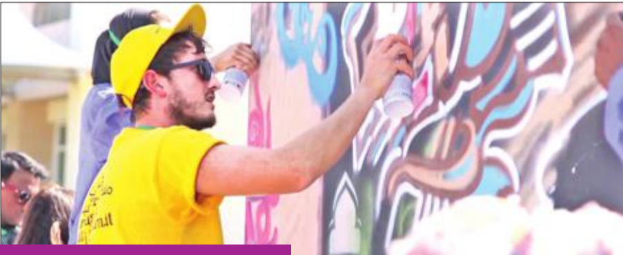
من مشاركات سابقة في ملتقيات الشباب