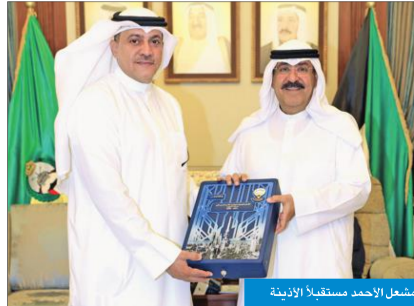
مشعل الأحمد مستقبلاً الأدينة

هو جديد في هذا المجال، كما يفتح المجال للتعاون مع كل المؤسسات ذات الصلة من خلال تسخير القدرات التكنولوجية وتأهيل الموارد البشرية وتحسين القدرة على التعامل مع قضايا الأمن السيبراني في الكويت. من جانبه، أكد الأدينة أن الاستراتيجية الوطنية للأمن السيبراني تدعم الاستخدام الآمن والصحيح للفضاء الإلكتروني، إضافة إلى حماية وحماية الأصول والبنى التحتية الحيوية والمعلومات الوطنية والشبكة المعلوماتية بدرجة عالية. حضر اللقاء مدير ديوان نائب رئيس الحرس الوطني، اللواء جمال ذياب.