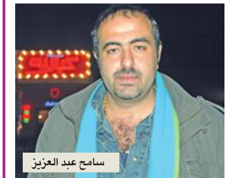
سامح عبد العزيز

كذلك قدّم «الفرح» عام 2009 وتضمّن عدداً من المشاهد يعاطي فيها الحاضرون في الفرحة بعض المواد المخدرة، والفيلم من بطولة: خالد الصاوي، وجومانة مراد، وياسر جلال، وصلاح عبد الله، وكريمة مختار، ومي كساب، وماجد الكدواني، وباسم سمرة، ومحمود الجندي، وسوسن بدر، ودنيا سمير غانم، وروجينا، ومن