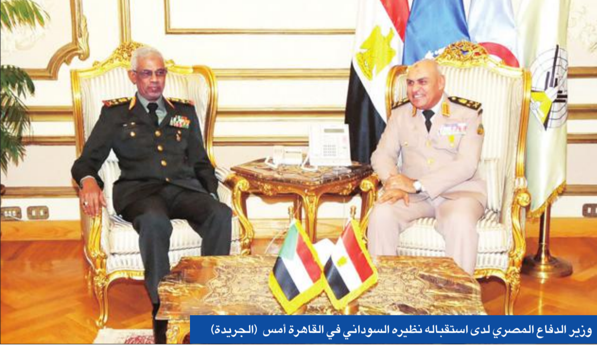
وزير الدفاع المصري لدى استقباله نظيره السوداني في القاهرة أمس

وبعد فترة من التوتر بين القاهرة والخرطوم استمرت لأشهر، استقبل وزير الدفاع المصري، الفريق أول صدقي صبحي، نظيره السوداني