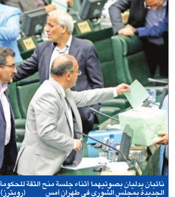
نائبان يبدلان بصوتيهما أثناء جلسة منح الثقة للحكومة الجديدة بمجلس الشورى في طهران أمس (رويترز)

بعد مناقشة استمرت 5 أيام، منح مجلس الشورى الإيراني (البرلمان) الثقة، أمس، لتشكيلة الحكومة الجديدة التي طرحها الرئيس حسن روحاني بعد فوزه بولاية رئاسية ثانية، ما دعا مرشح واحد. ومنح النواب أمس الثقة، بشكل فردي، إلى 16 من 17 وزيراً قدمهم روحاني الذي أعيد انتخابه في مايو الماضي لولاية ثانية تستمر 4 سنوات، وحده الإصلاحي حبيب الله بيطرف لم يحصل على ثقة البرلمان بـ26 صوتاً من مجموع 288. وبلغ عدد الأصوات المعارضة 10 أصوات، إضافة إلى 4 أصوات ملغاة، وامتنع 13 نائباً عن التصويت. وفي كلمة أمام المجلس عقب منح الثقة، أقر روحاني الذي لا يسيطر على الأجهزة الأمنية