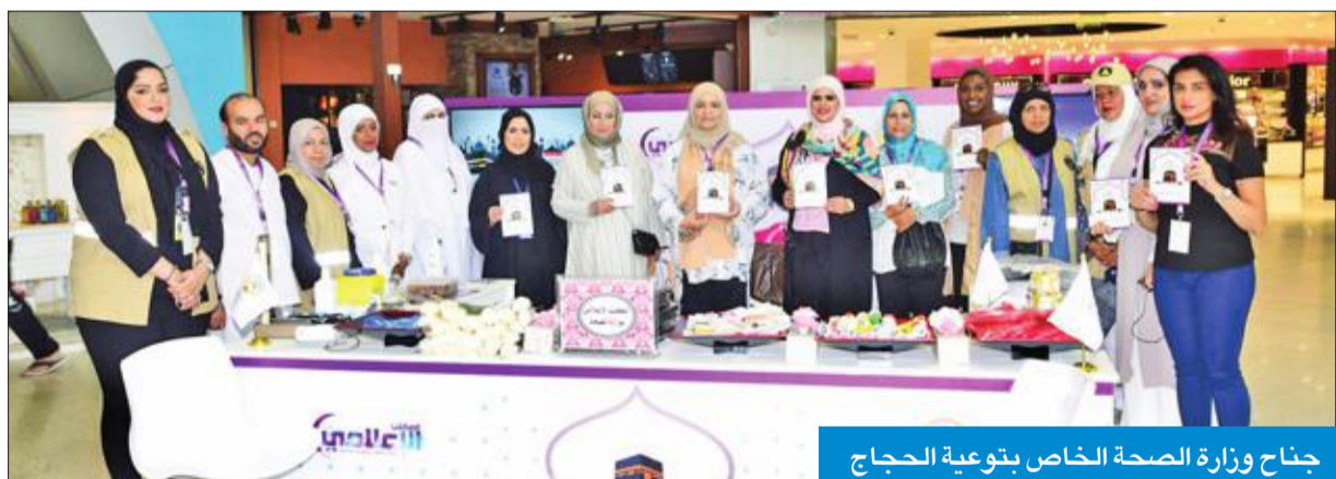
جناح وزارة الصحة الخاص بتوعية الحجاج

زيادة عيادات العظام في مستشفى العedan الشهر المقبل