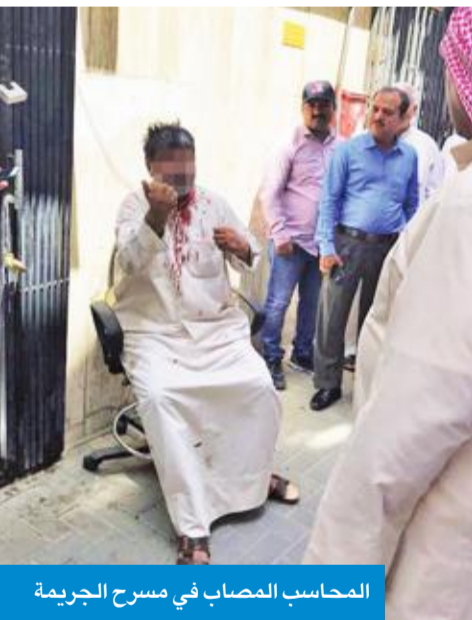
المحاسب المصاب في مسرح الجريمة

سوريا مصابا، وبالإستفسار منه، أفاد بأنه يعمل محاسبا في إحدى شركات الصرافة بمحافظة الفروانية، وحضر لاستبدال عمليات خاصة بالشركة التي يعمل بها، وكان بحوزته 11 ألف دينار وعمليات أجنبية أخرى، وعند خروجه من محل الصرافة متوجها إلى سيارته، هاجمه 3 أشخاص وطعنوه بالآلات حادة، واستولوا على حقيبة النقود ولانوا بالفرار جريا على الأقدام.