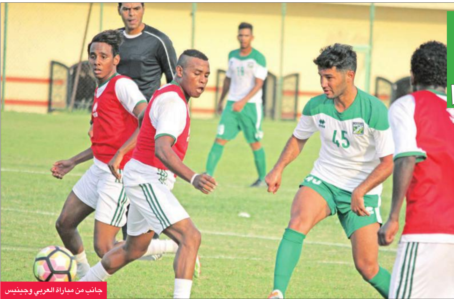
جانب من مباراة العربي وجينيس