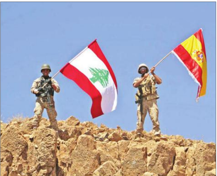
جنديان يرفعان علمي لبنان وإسبانيا على جبل مخايرم في رأس بعلبك أمس الأول تضامناً مع ضحايا هجمات برشلونة وكامبرليس

«الحشد» يؤكد وجود إيران... وسليماني ينفى السعي وراء نفط كركوك