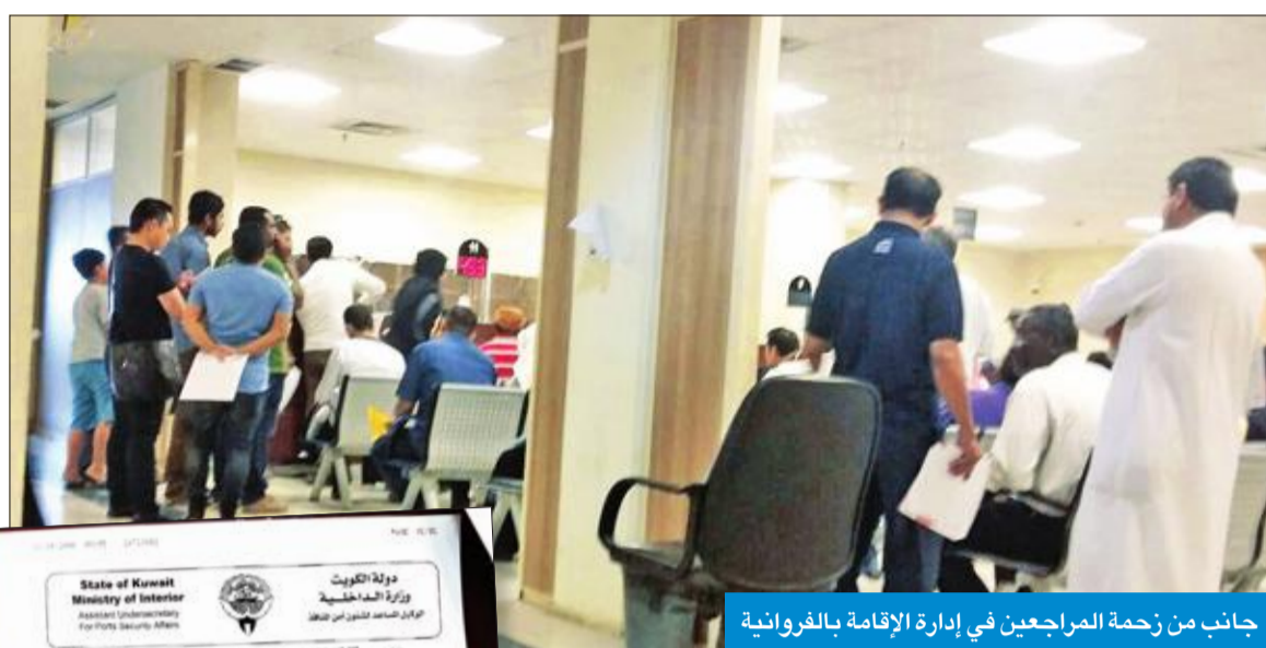
جانب من زحمة المراجعين في إدارة الإقامة بالفروانية