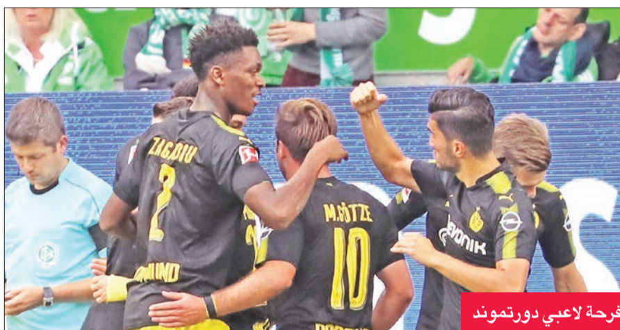
فرحة لاعبي دورتموند

مايو ل لاعب استثنائي وسيكون مهما جداً بالنسبة لنا»، مضيفاً: «لكن علينا أيضاً أن نكون صبورين، وأنا سعيد لأنه شارك ولم يتعرض للاصابة».