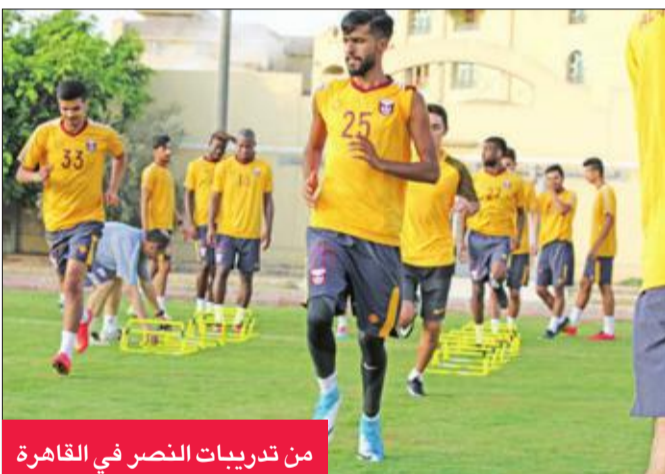
من تدريبات النصر في القاهرة

استعداداته اليوم لمباراة العروبة الإماراتي المقرر إقامتها غداً بملعب فندق موفنتيك مقر إقامة الفريق الذي خاض مباراة ودية أمام الأسيوطي يوم الخميس الماضي وخسرها بهدفين لهدف.