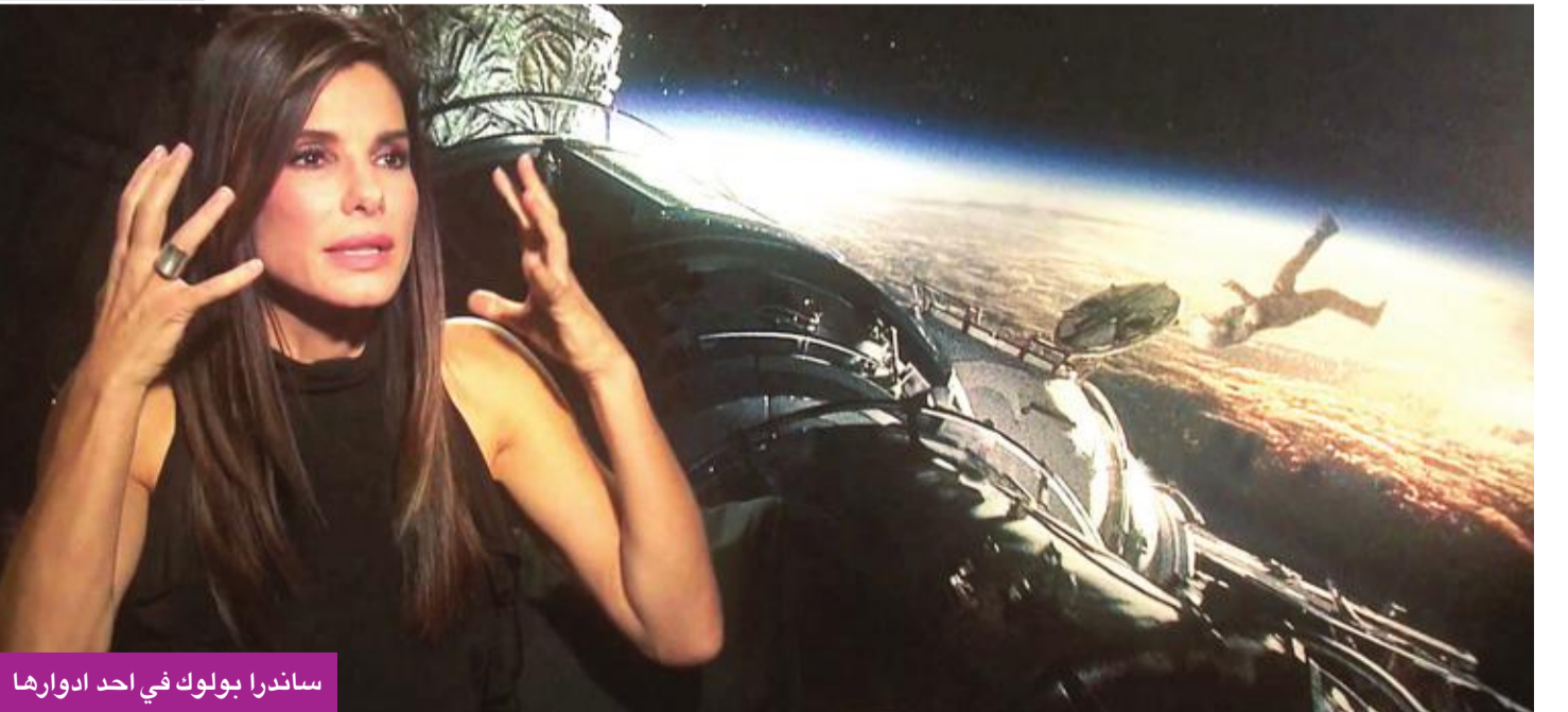
ساندرا بولوك في أحد ادوارها

رصد برنامج أمريكي، مساء أمس الأول، حقق أعلى مشاهدة، بعض أغرب العادات لأشهر 10 نجوم من هوليوود، ومنها أن النجمة أوليفيا مون تعاني حالة نفسية تدعى «تريكتيلومانيا»، تجعلها تنزع بقوة شعر حاجبها. وتحافظ فيكتوريا بيكهام على جلدها ناعماً بشكل مستمر، عن طريق وضع كريم مرطب على يديها وقدميها، وترتدي فوقها جوارب صوفية، ويغلق الممثل إيمينيوم نوافذه بالكامل في الليل، حتى يتمكن من النوم في الظلام الحالك بدون أي نقطة ضوء. وأغرب الغرائب ما صرحت به ساندرا بولوك بأنها تضع كريم «مرض البواسير» على وجهها للمحافظة على نضارته وحيويته، وتعاني كامبرون ديان وسواساً قهرياً يجعلها تفتح كل الأبواب عن طريق دفعها بمرقها. واحتفظت ليدى غاغا ببيضضة العملاقة التي ظهرت معها في إحدى حفلاتها وتستخدمها للتلطيف، وسايمون يتسلق شجرة كل يوم كجزء من طقوسه اليومية، وهي عادة عنده منذ طفولته.