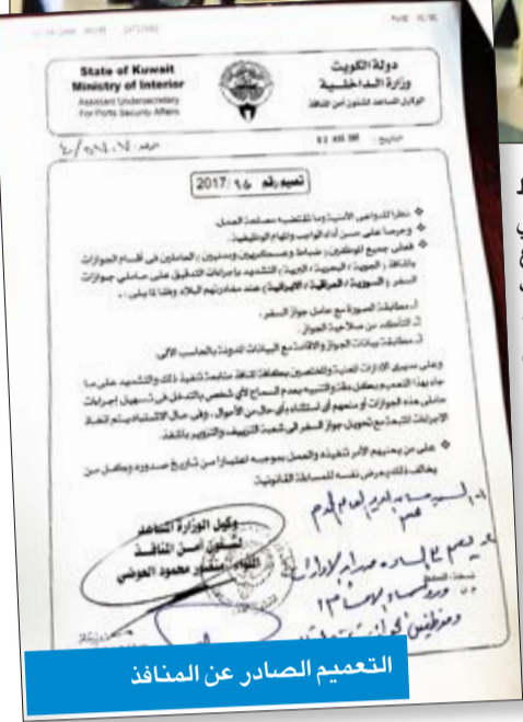
التعميم الصادر عن المنافذ

وتفى المصدر أن قطاع المنافذ منع أي وافد من السفر باستثناء الجنسيات الثلاث، التي نص عليها التعميم، حيث طلب من رعايا تلك الدول من لديهم إقامات صالحة في البلاد ضرورة مطابقة بيانات جواز سفرهم مع البيانات المدونة بالحاسب الآلي.