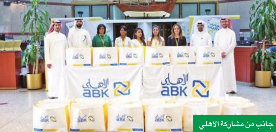
جانب من مشاركة الأهلي

شارك البنك الأهلي الكويتي في اليوم العالمي للعمل الإنساني، الذي يحتفل العالم به في 19 أغسطس من كل عام، من خلال تطوع مجموعة من موظفيه لتوزيع مساعدات على عمال النظافة في الكويت، إيماناً منه بدعم هؤلاء العاملين، وتعزيز مفهوم العمل الإنساني في المجتمع.