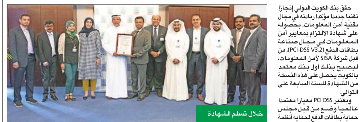
خلال تسلم الشهادة

في تحقيق هذا الإنجاز الرائع، بدوره، أكد السويديان أن "الدولي" يعمل دائماً على تطوير منظومة قوية قائمة على أعلى المعايير العالمية لتأمين الحماية المطلوبة لبطاقات العملاء من المخاطر الداخلية والخارجية، لافتاً إلى اختيار "الدولي" البنك الأول في الكويت الذي يحصل على النسخة الجديدة V3.2 من الشهادة. وأضاف أن التركيز على أمن المعلومات أصبح مهماً اليوم أكثر من أي وقت مضى، في ظل عمليات الاحتيال التي تزايد عددها وتنوعت أساليبها وطرقها، ومع تزايد الهجمات الإلكترونية التي شهدتها القطاعات المصرفية في العالم مؤخراً لانتهاك خصوصيتهم والحصول على بيانات بطاقاتهم الائتمانية بطرق غير مشروعة.