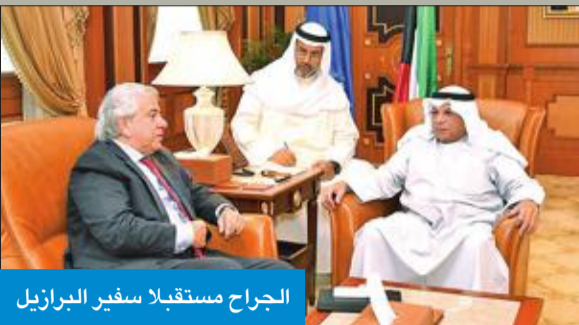
الجراح مستقبلا سفير البرازيل

بحث نائب رئيس مجلس الوزراء وزير الداخلية الشيخ خالد الجراح، مع سفير البرازيل لدى الكويت نورتون رابستا تعزيز التعاون المشترك بين البلدين الصديقين. ونقلت إدارة الإعلام الأمني في وزارة الداخلية، في بيان صحافي، عن الجراح تأكيداً خلال اللقاء عمق العلاقات التي تجمع بين البلدين. وأضاف البيان أنه جرى خلال اللقاء بحث عدد من الموضوعات والأمور ذات الاهتمام المشترك، لاسيما المتعلقة بالجوانب الأمنية وسبل تطويرها.