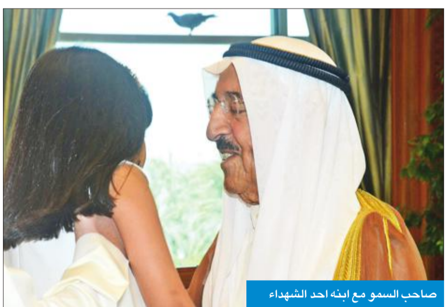
صاحب السمو مع ابنة أحد الشهداء

استقبالات ولي العهد استقبل سمو ولي العهد الشيخ نواف الأحمد، بقصر السيف صباح أمس، رئيس مجلس الأمة مرزوق الغانم، وسمو رئيس مجلس الوزراء الشيخ جابر المبارك. واستقبل سموه الشيخين وليد العلي وفهد الحسيني بك السبل الدبلوماسية والبرلمانية، مبيناً ان الدم الكويتي ليس رخيصاً. وقال الغانم في تصريح صحفي عقب استقباله ذوي الشهيدان العلي والحسيني في مكتبه أمس ان