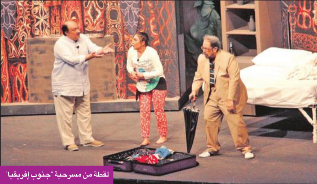
لقطة من مسرحية «جنوب إفريقيا»

أحداثها في منتجع جنوب إفريقيا يجتمع فيه عدد من الأشخاص، الذين يأتون إلى هذا المكان بأهداف مختلفة، منها التجارة أو السياحة وغيرهما. والفكرة الرئيسية للعمل تطرقت إلى قدرة الشعوب على التخلص من العنصرية العنصرية التي تنخر في جسد المجتمع، وكيفية التحول من الهدم إلى البناء والتعمير ونمو البنية التحتية والاقتصاد خلال رسالة وطنية تحافظ على الهوية المحلية ولا تفقد روحها وأصالتها وركزتها.