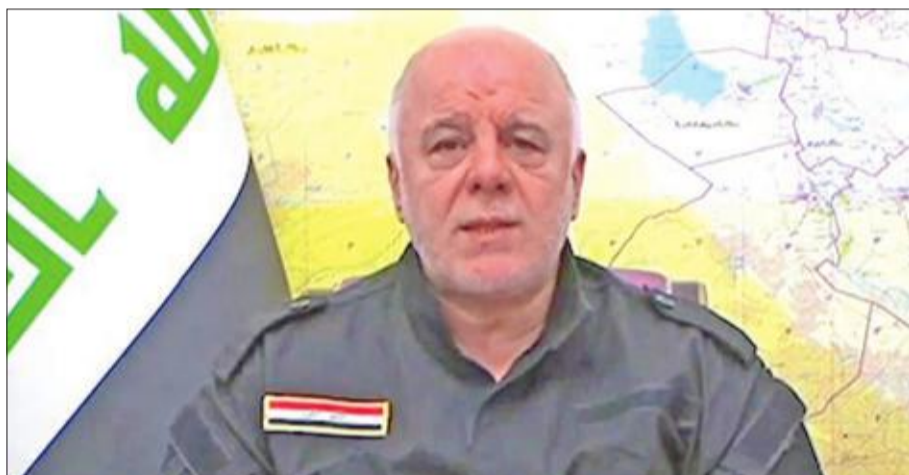
العبادي لحظة إعلانه بدء العمليات العسكرية في قضاء تلعفر أمس

• انسحابات تجتاح حزام المدينة... و«داعش» بلا اتصالات • أربيل تفتتح أول مركز انتخابي للاستفتاء