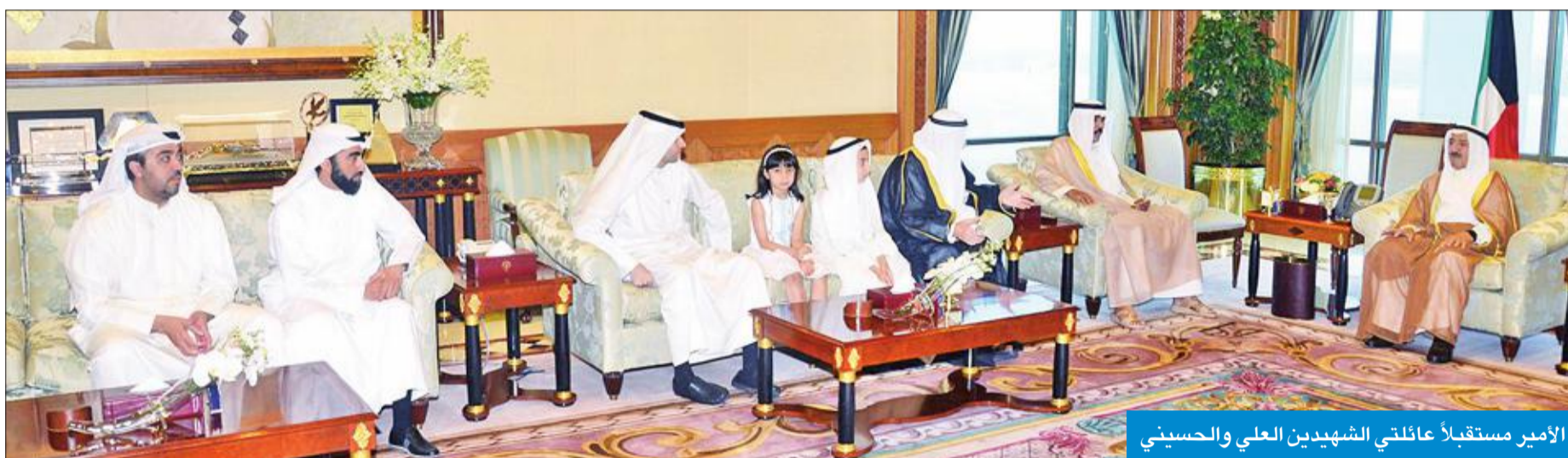
الأمير مستقبلاً عائلتي الشهيد العلي والحسيني

أعرب سمو الأمير عن بالغ فخره واعتزازه بما قدمه الشهيدان العلي والحسيني، مشيراً إلى أنهما أعطيا بكل وفاء وإخلاص وبدلاً جهودهما في جميع المجالات من أجل خدمة وطنهما الغالي ورفعته، شأنه، مجسدين بأعمالهما مثالا يحتذى به للأجيال.