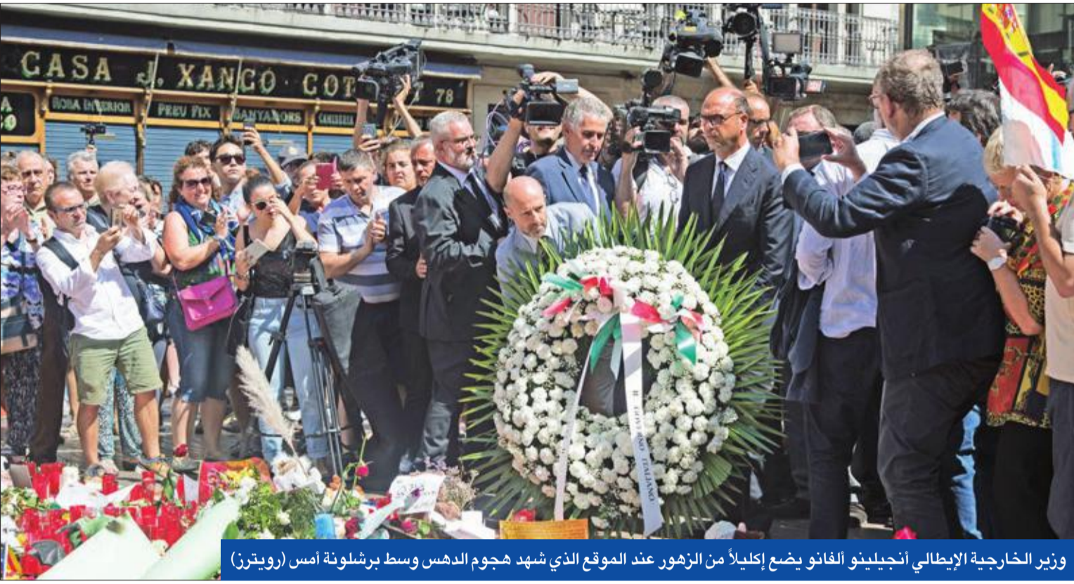
وزير الخارجية الإيطالي أنجيلينو ألفانو يضع إكليلاً من الزهور عند الموقع الذي شهد هجوم الدهس وسط برشلونة أمس (رويترز)

بعد ساعات من إعلانها عن تورط 12 متهماً في هجوم برشلونة الدامي، عثرت شرطة كتالونيا على 120 قنبلة غاز معدة لتنفيذ هجمات إرهابية، في وقت امتد البحث عن منفذ عملية الدهس المغربي يونس أبو يعقوب إلى الحدود الفرنسية.