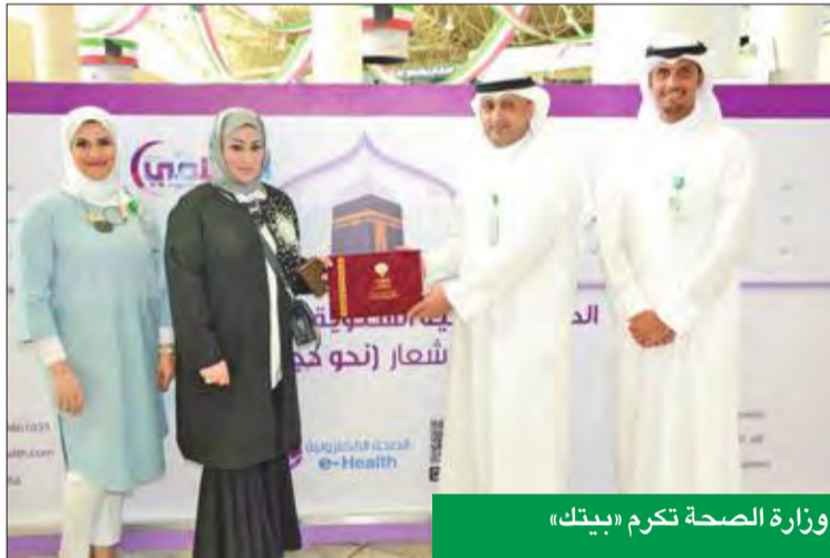
وزارة الصحة تكرم «بيتك»

وحضوره بشكل دائم وفاعل كمشارك رئيسي في كل ما من شأنه خدمة المجتمع، وخاصة أن المناسبات الدينية لها خصوصية وأهمية لدى «بيتك»، إضافة إلى ما تتيحه الحكومة من جهود لتوفير وسائل الراحة والرعاية للحجاج في سفرهم وعودتهم وأثناء أداء المناسك.