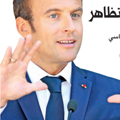
يحدد خريطة عملهم، مع استئناف العمل السياسي بعد العطلة الصيفية.

شعبية رئيس فرنسا في أدنى مستوى... وتعبئة ضخمة للتظاهر