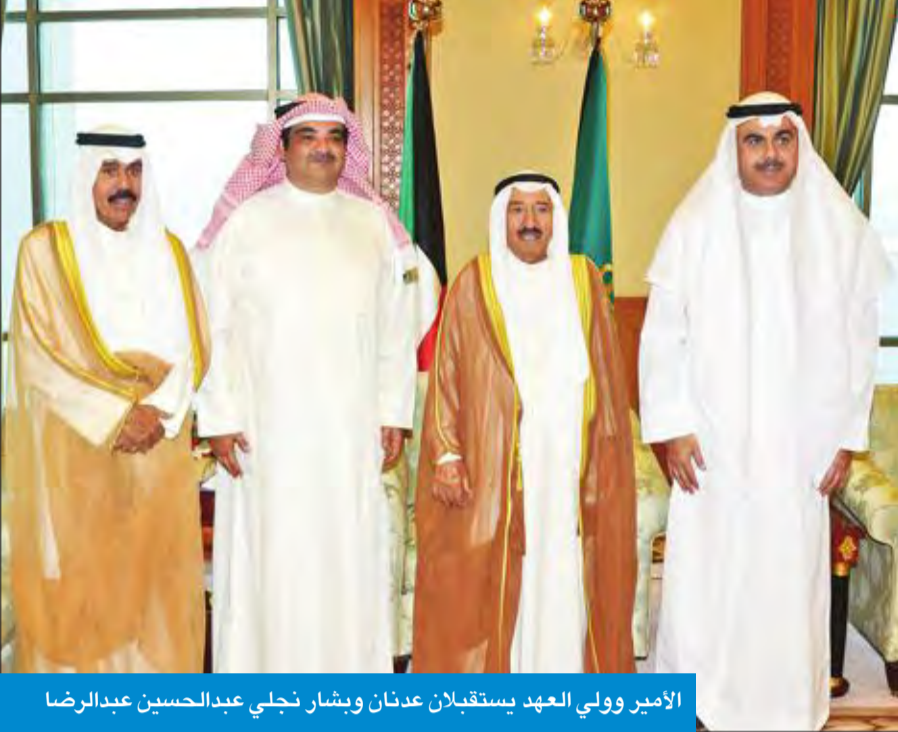
الأمير ولي العهد يستقبلان عدنان وبنشار نحلي عبدالحسن عبدالرضا

ولي العهد لنجلي الفقيه: كونوا يداً واحدة متكاتفين على نهج الخير