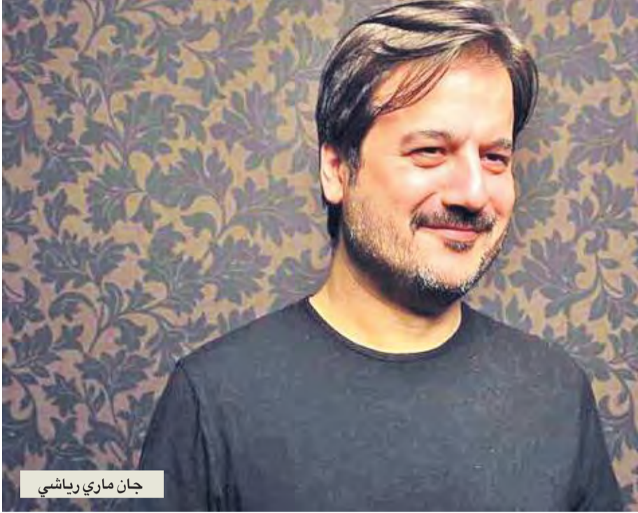
جان ماري رياشي

جان ماري رياشي الذي أبدع أعمالاً غنائية عدة لنجوم كثيرين في العالم العربي، يخطو اليوم خطوة فريدة من نوعها من خلال برنامج Out of the Blue الذي يقدم كل ما هو خارج عن المألوف بطريقة مبتكرة، كما يقول. للوقوف على تفاصيل هذه الخطوة كان لنا لقاء معه.