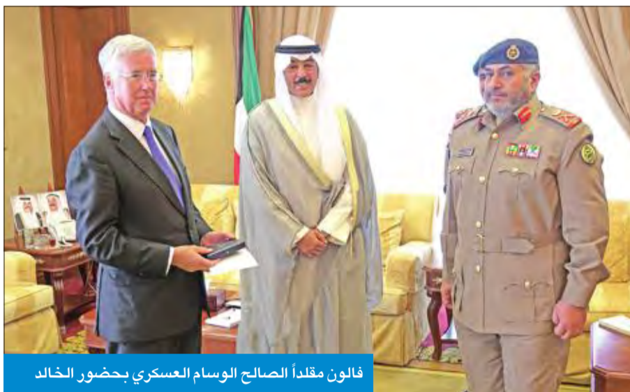
فالون مقلداً الصالح الوسام العسكري بحضور الخالد

استقبل رئيس مجلس الوزراء سمو الشيخ جابر المبارك، بحضور نائب رئيس مجلس الوزراء وزير الدفاع محمد الخالد، في قصر السيف، أمس، وزير الدفاع بالملكة المتحدة الصديقة السير مايكل فالون والوفد المرافق له، بمناسبة زيارته للبلاد.