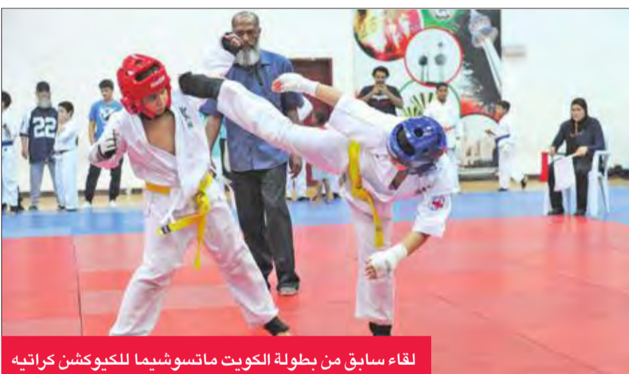
لقاء سابق من بطولة الكويت ماتسوشيم للكيوكشن كراتيه