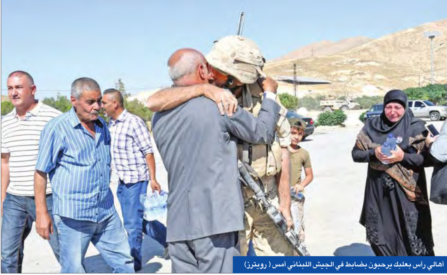
أهالي رأس بعلبك يرحبون بضابط في الجيش اللبناني أمس

مع دخول عملياته في جرود رأس بعلبك والقاع أسبوعها الثاني، قرر الجيش اللبناني، أمس، وقف إطلاق النار مع تنظيم «داعش» قرب الحدود مع سورية، كما قام «حزب الله» والجيش السوري من جهتهما بالأمر ذاته، لإفساح المجال للمفاوضات المتعلقة بجنود مخطوفين منذ 2014.