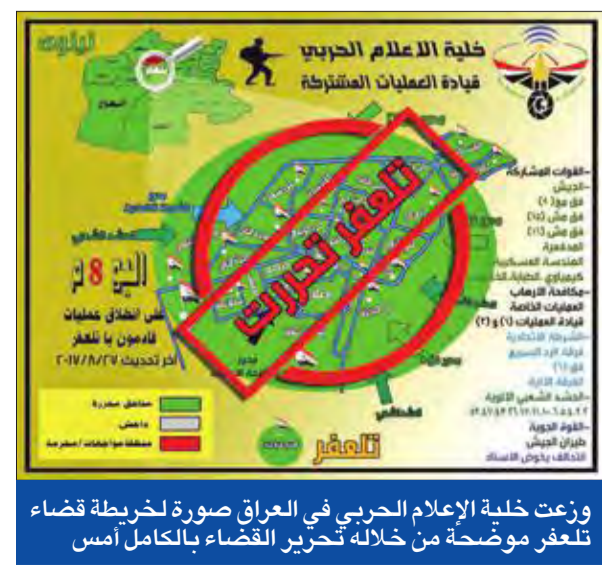
وزعت خلية الإعلام الحربي في العراق صورة لخريطة قضاء تلعفر موضحة من خلاله تحرير القضاء بالكامل أمس

كشفت نائب رئيس كتلة الحزب الديمقراطي الكردستاني الذي يتزعمه رئيس الإقليم مسعود بارزاني، شاخوان عبدالله، مساء أمس الأول، أن التحالف الوطني لم يقدم طلباً رسمياً للكر، من أجل تأجيل استفتاء استقلال الإقليم، مؤكداً أن "مناطق سيطرة قوات البيشمركة المحررة، وبينها أكثر من 25 قرية شكيكية في سهل نينوى، إضافة إلى عدد من القرى الأيزيدية، تعتبر ضمن حدود كردستان، وستكون هناك مفاوضات مع الحكومة بشأن ضمها إلى الإقليم". وأشار عبدالله إلى أن "طلبات تأجيل الاستفتاء وصلت من بعض سفارات الدول وستتم دراستها"، مؤكداً استعداد الإقليم لتأجيل الاستفتاء، في حال حددت الحكومة