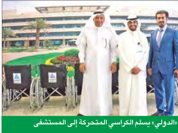
«الدولي» يسلم الكراسي المتحركة إلى المستشفى

في إطار تواصل جهوده الرامية لدعم القطاع الصحي محليا، قام بنك الكويت الدولي مؤخرا بالتبرع بعدد من الكراسي الطبية المتحركة، لخدمة مرضى مستشفى الأمراض الصدرية، في ظل برنامجه الرائد للمسؤولية الاجتماعية.