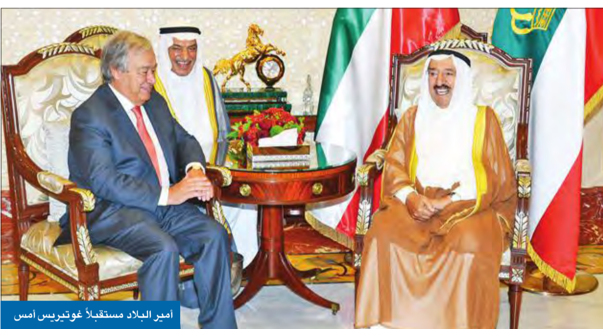
أمير البلاد مستقبلاً غوتيريس أمس