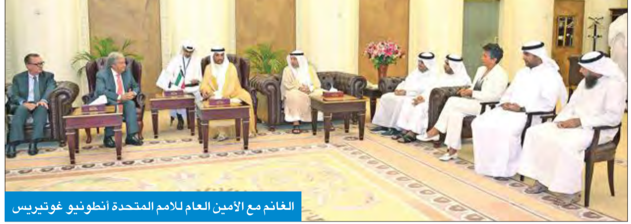
الغانم مع الأمين العام للأمم المتحدة أنطونيو غوثيريس