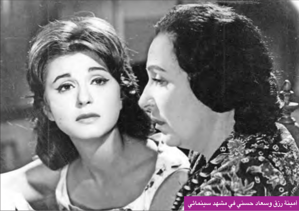
أمينة رزق وسعاد حسني في مشهد سينمائي