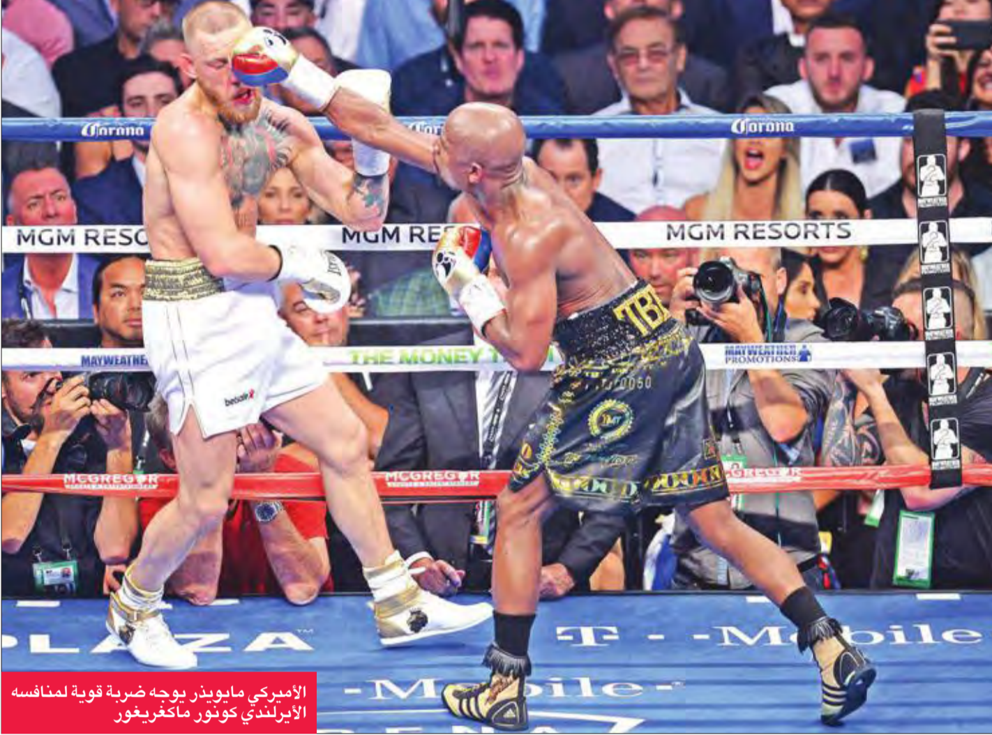
الأميركي مايويذر يوجه ضربة قوية لمنافسه الأيرلندي كونور ماكغريغور

في طريقه لخسارة المواجهة بالضربة القاضية خلال الجولة السابعة.