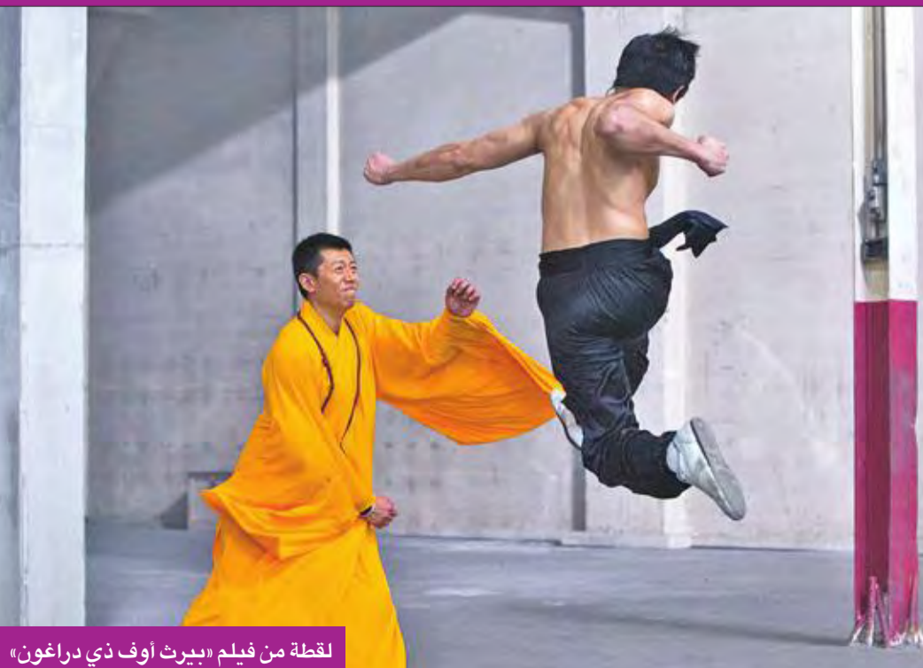
لقطة من فيلم «بيرث أوف ذي دراغون»

وأوضح: "استمعت إلى روايته، وهي تتناقض مع جزء من الأمور التي قرأتها. لدي قناعاتي وفرضياتي حول ما حصل، لكن من المؤكد أنه بعد هذه المواجهة تغيرت طريقة بروس لي في القتال". وهو على ثقة بأن بروس لي خرج منتصراً من القتال.