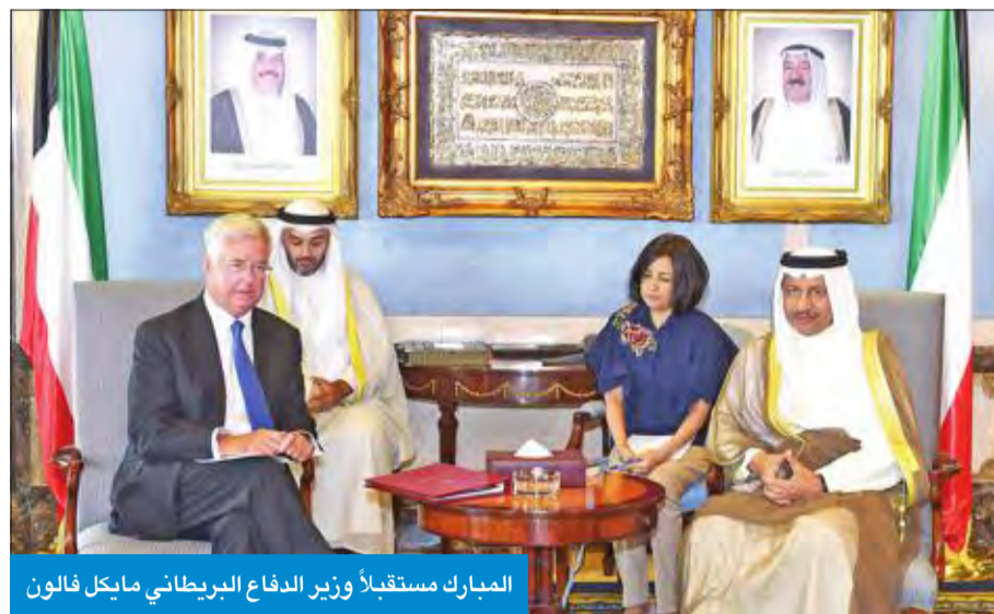
البارك مستقبلاً وزير الدفاع البريطاني مايكل فالون

• الخالد بحث التعاون العسكري مع فالون • تقليد أمر القوة البرية وسام كلية ساندهيرست