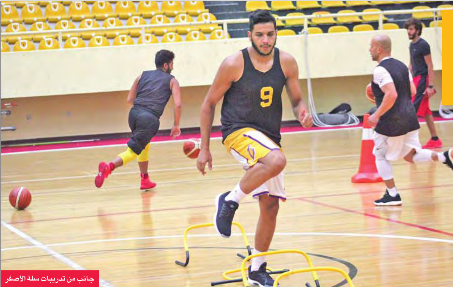
جانب من تدريبات سلة الأصفى