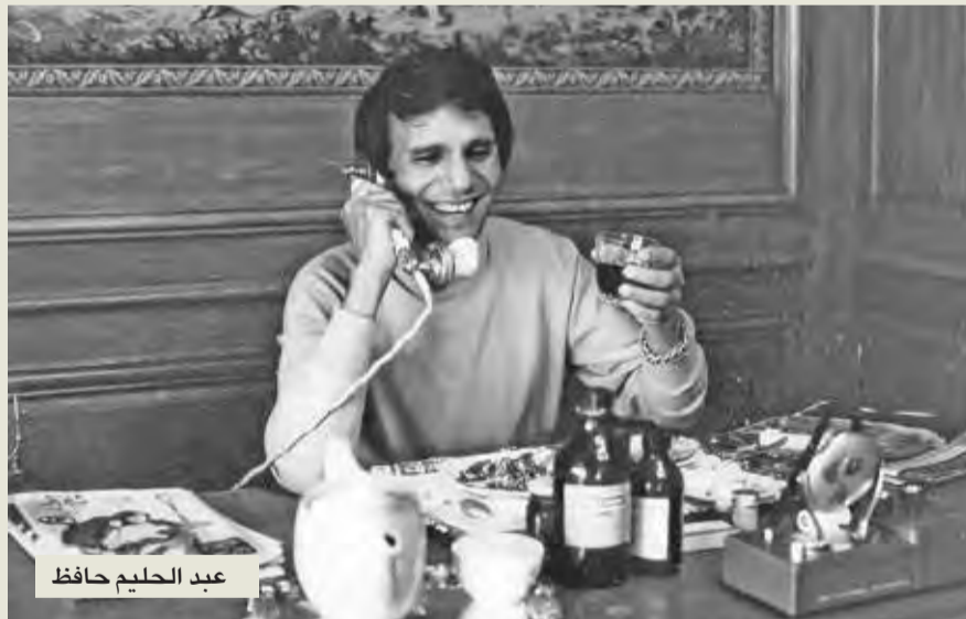
عبد الحليم حافظ