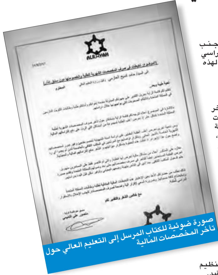
صورة ضوئية للكتاب المرسل إلى التعليم العالي حول تأخر المخصصات المالية

جدير بالذكر أن تأخر صرف المخصصات الشهرية أثار حفيظة الكثير من الطلبة، وسبب ربكة في معيشتهم الدراسية، خاصة أن هناك الكثير من الارتباطات التي تتطلب الصرف من المستحقات المالية. وتساءل الطلبة: «متى تصرفت مخصصاتنا بشكل منظم ودون تأخير؟»، مؤكداً أن هذا الأمر خلق العديد من المشاكل، وطالبوا بضرورة تنظيم عملية الصرف دون تعقيد.