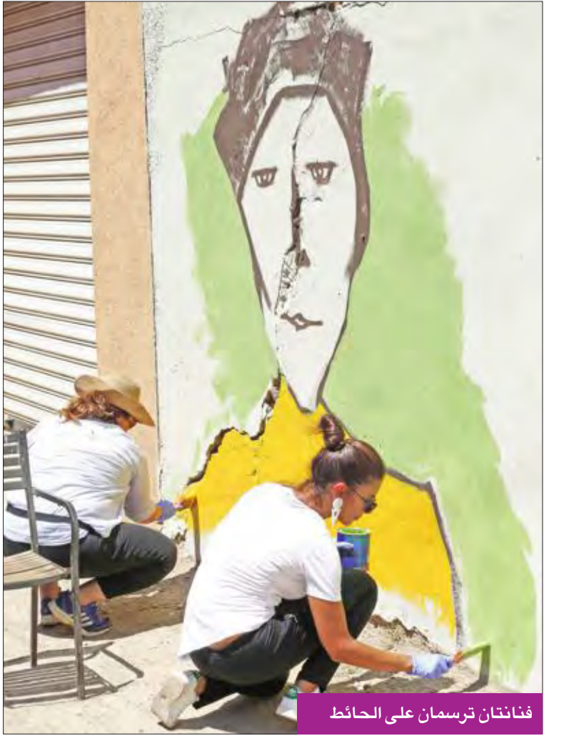
فنانتان ترسمان على الحائط

وأطلق على المشروع الفني اسم «أوزفيل»، وشارك فيه عدد من الفنانين الذين رسموا لوحاتهم الملونة على جدران الأزقة الفقيرة في هذه المنطقة السكنية المقامة بشكل غير قانوني عند مدخل العاصمة.