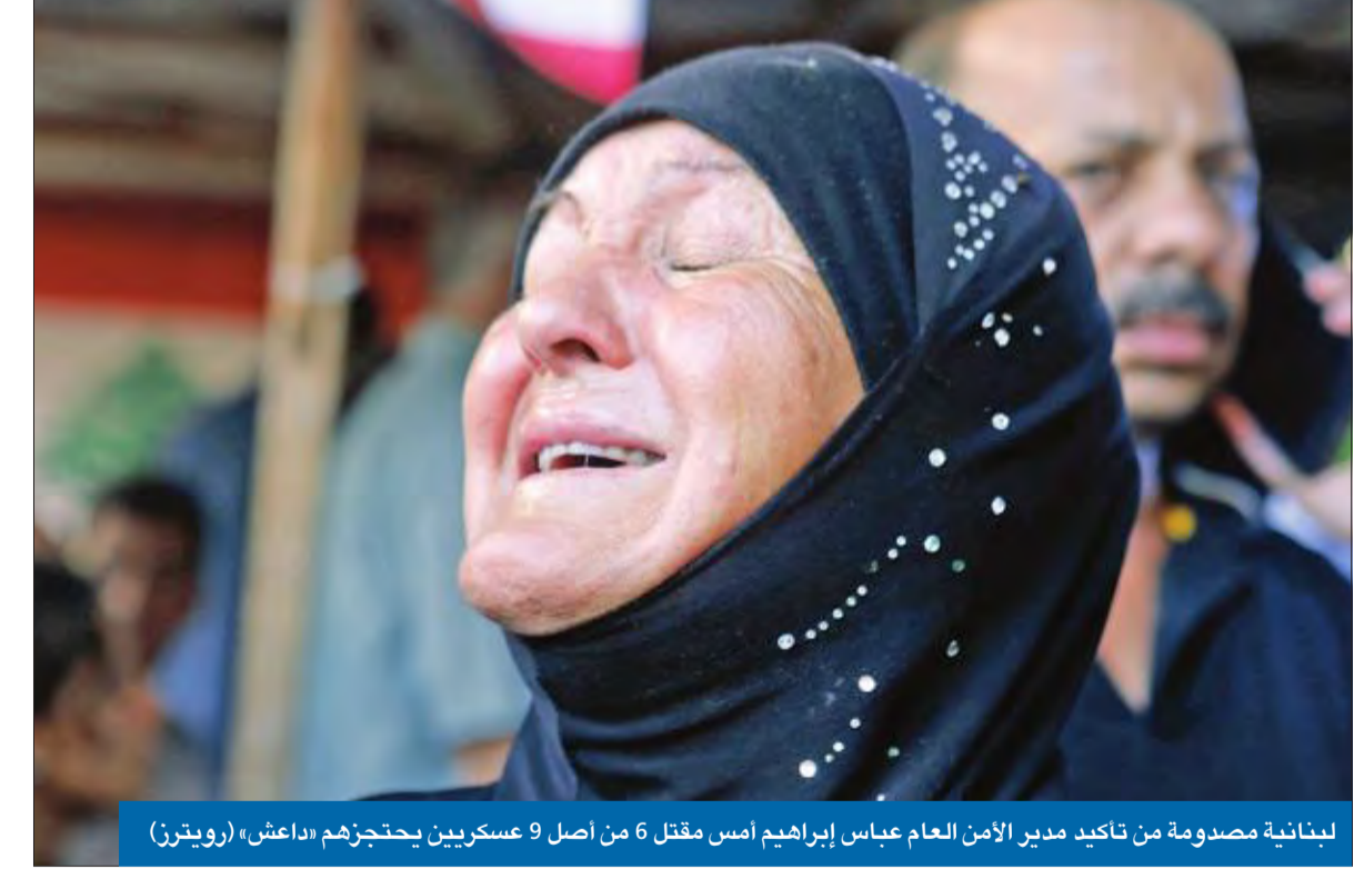
لبنانية مصدومة من تأكيد مدير الأمن العام عباس إبراهيم أمس مقتل 6 من أصل 9 عسكريين يحتجزهم «داعش»

بعد اجتماع بينهما استمر ثلاث ساعات أبلغ خلاله رئيس الوزراء بنيامين نتانياهو الرئيس الروسي فلاديمير بوتين أن تل أبيب لن تقف مكتوفة الأيدي أمام تمدد إيران في سورية، هدد مسؤول إسرائيلي كبير بخطط الأوراق في سورية عبر ضرب أحد مقرات الرئيس بشار الأسد ونسف اتفاقات مناطق خفض التوتر التي توصلت إليها موسكو بموافقة طهران وأنقرة بعد 5 لقاءات في أستانة. وعلمت «الجريدة» من مصدر مطلع، أن لقاء نتانياهو وبوتين لم يسفر عن أي اتفاق، وأن إسرائيل لديها وسائل وقدرات كفيلة بقلب كل الموازين، موضحاً أنه «يكفي فقط أن نقصف أحد مقرات الرئاسة السورية»، في إشارة إلى استهداف رأس النظام لإعادة خطط الأوراق، على حد قوله. وشدد المصدر على أن «إسرائيل لا تزال تنسق مع الولايات المتحدة وروسيا في كل ما يتعلق بسورية، إلا أنها ستغير الأمور إذا بقيت إيران وتموضعت جواً وبراً وبحراً في سورية»، مبدناً أن عراب الترتيبات وقيادة الدقة داخل سورية هو موسكو لا غريمة الأخيرة التقليدية واشنطن. واعتبر أن معارك القلمون وجرد عرسال من الجانبين السوري واللبناني «مهزلة وتمخيلية سيئة الإخراج»، مشيراً إلى أن أغلبية تلك المناطق أراض بور ومساحات شاسعة خالية، وكل الصور في وسائل الإعلام ما هي إلا إخراج غير