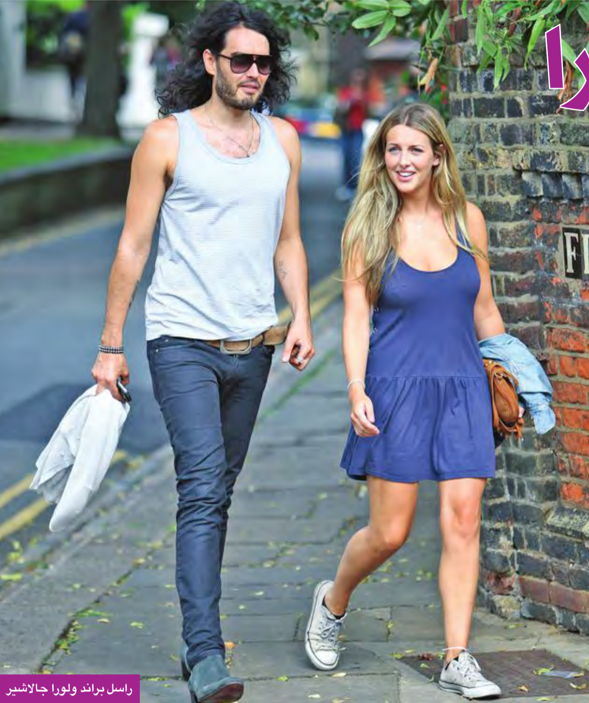
راسل براند ولورا جالاشير

فقط أدرك أنه يمتلك موهبة أداء عروض الستاند أب.