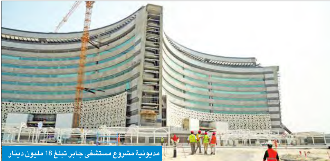
مديونية مشروع مستشفى جابر تبلغ 18 مليون دينار

وأضافت الغنيم، في تصريح صحفي، أنه سيتم تحديد تاريخ تحصيل كل مديونية لتحصيلها بشكل كامل، لافتة إلى أن مجموع المديونيات المؤجلة على قطاع المشاريع الإنشائية سواء الغرامات المؤجلة أو المديونية المبنية 46.5 مليون دينار، وأبرز تلك المشاريع التي عليها مديونية مشروع مستشفى جابر الذي تبلغ مديونياته 18 مليون دينار، بعد احتساب قيمة التعدي المستحق للمقاول وهي حوالي 600 يوم، بالإضافة إلى عدم احتساب المبالغ الخاصة بـ "VIP". وأشارت إلى أن الوزارة سوف تفرض