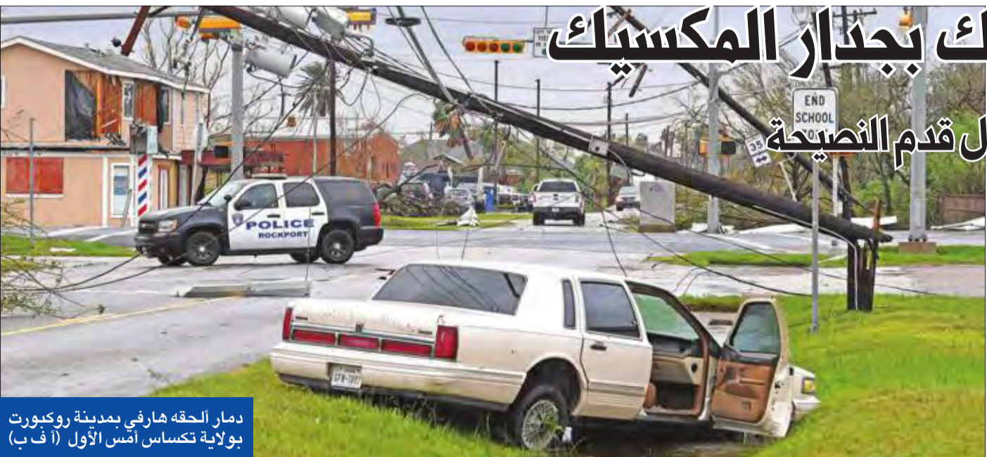
دمار الحقه هارفي بمدينة روكفورت بولاية تكساس أمس الأول

وقرر ترامب السماح بأن يستمر النظر في القضية، لكنه قال إنه سيعفو عن أربايو إذا أزم الأمر، لكن ترامب كان متحمساً لهذه الفكرة، حسبما نقلت الصحيفة عن أحد المصادر. (واشنطن - وكالات)