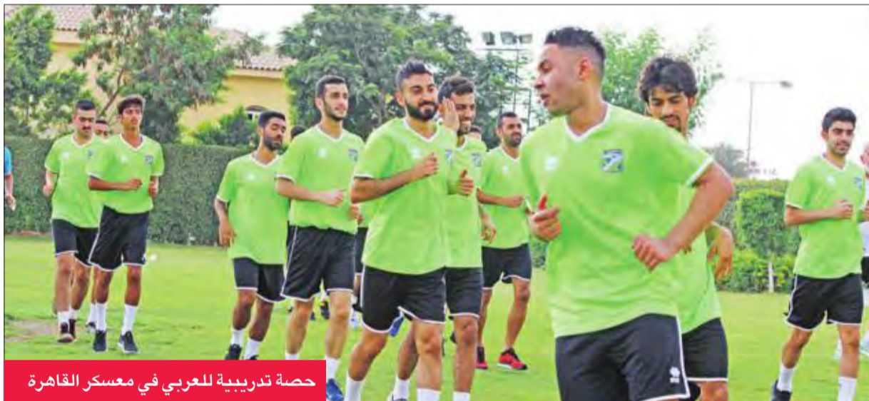
حصة تدريبية للعربي في معسكر القاهرة

أفضل معدلات اللياقة الفنية والبدنية، والاستعداد بقوة لانطلاق دوري فيفا يوم 14