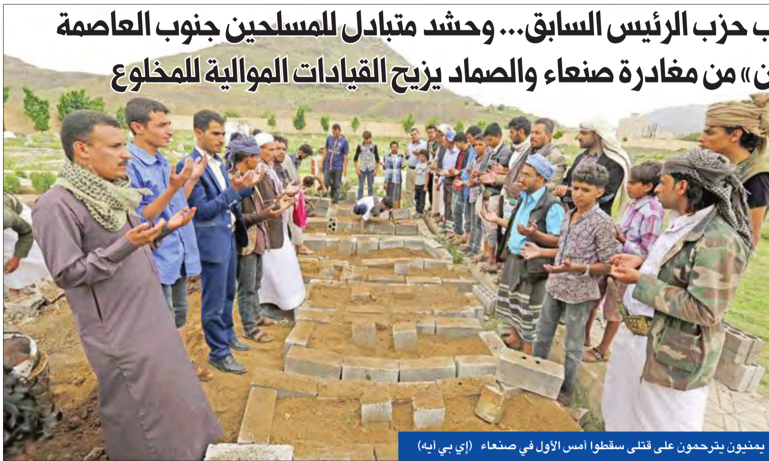
يمنيون يترحمون على قتلى سقوطوا أمس الأول في صنعاء (إي بي آيه)

● مقتل 5 حوثيين ومدير مكتب حزب الرئيس السابق... وحشد متبادل للمسلحين جنوب العاصمة ● «أنصار الله» تمنع «المؤتمرين» من مغادرة صنعاء والصناديق القيادات الموالية للمخلوع