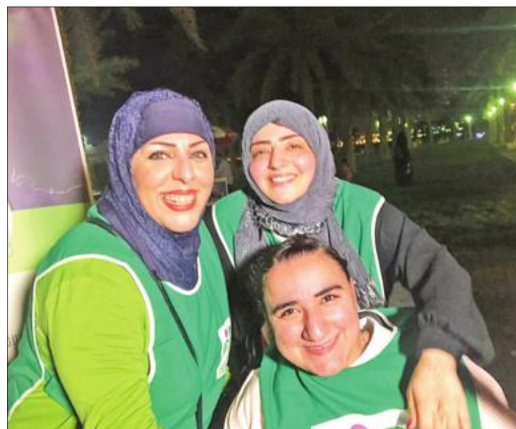
مشاركات في المشروع