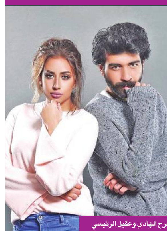
فرح الهادي وعقيل الرئيسي

أعلن الممثل عقيل الرئيسي زواجه من الممثلة فرح الهادي، عبر حسابه بمواقع التواصل، من خلال نشر صورة مشتركة لهما.