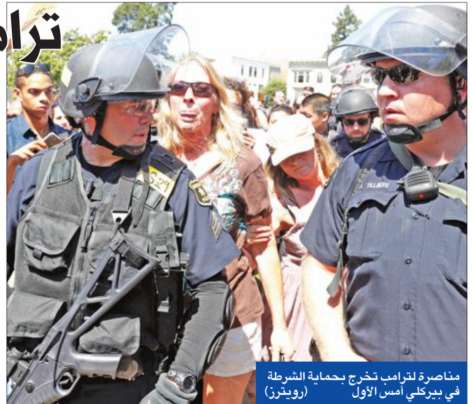
مناصرة لترامب تخرج بحماية الشرطة في بركلي أمس الأول