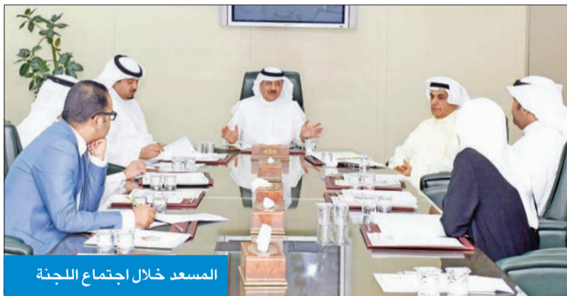
المسعد خلال اجتماع اللجنة

الجهود الوطنية حول الموضوعات التي تخص تطبيق أحكام اتفاقية الأمم المتحدة لمكافحة الجريمة. وبحثت اللجنة ضمن اجتماعها الموضوعات المدرجة على جدول أعمالها، ومنها استعراض مشاركة الكويت في اجتماع الدورة الـ 26 للجنة منع الجريمة