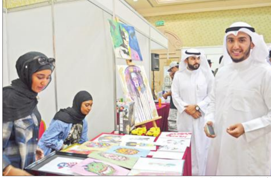
الشيخ راكان خلال جولته في المعرض