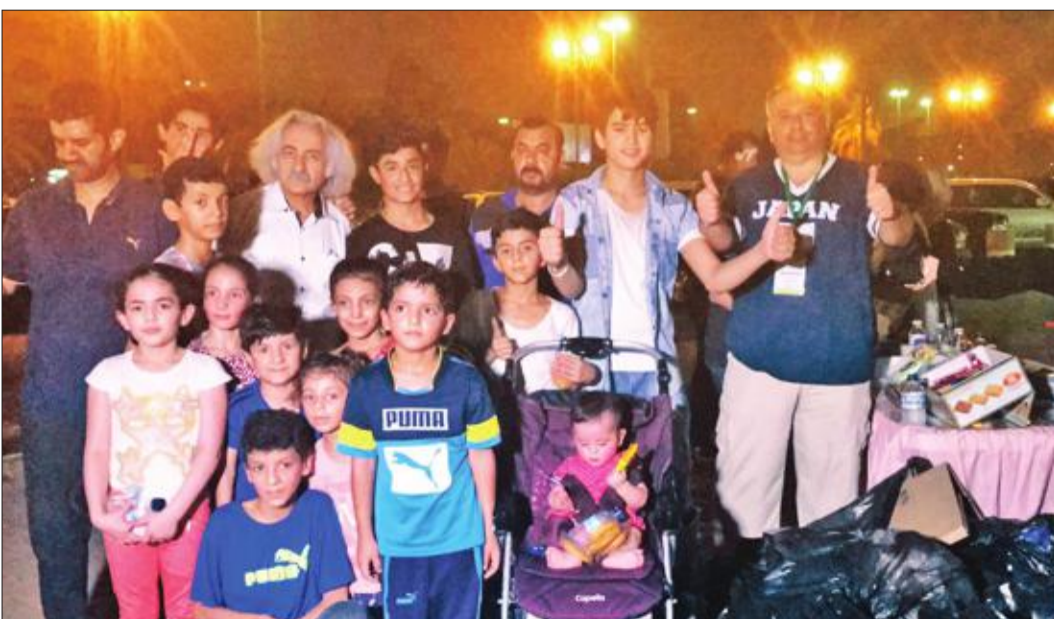
صورة جماعية لفريق العمل