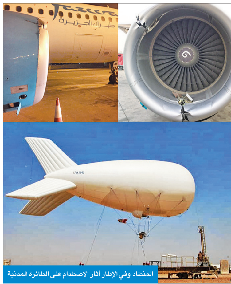
المنطاد وفي الإطار آثار الاصطدام على الطائرة المدنية

وذكرت أنه تم تشكيل لجنة تحقيق من قبل الإدارة العامة للطيران المدني، بالإضافة إلى تشكيل لجنة تحقيق من قبل طيران الجزيرة للنظر فيما حدث. وتواصلت «الجزيرة» رسمياً مع الإدارة العامة للطيران المدني، لدعم ومساندة التحقيقات، وتحديد الظروف الجوية والأرضية التي أدت إلى وقوع هذه العارضة.