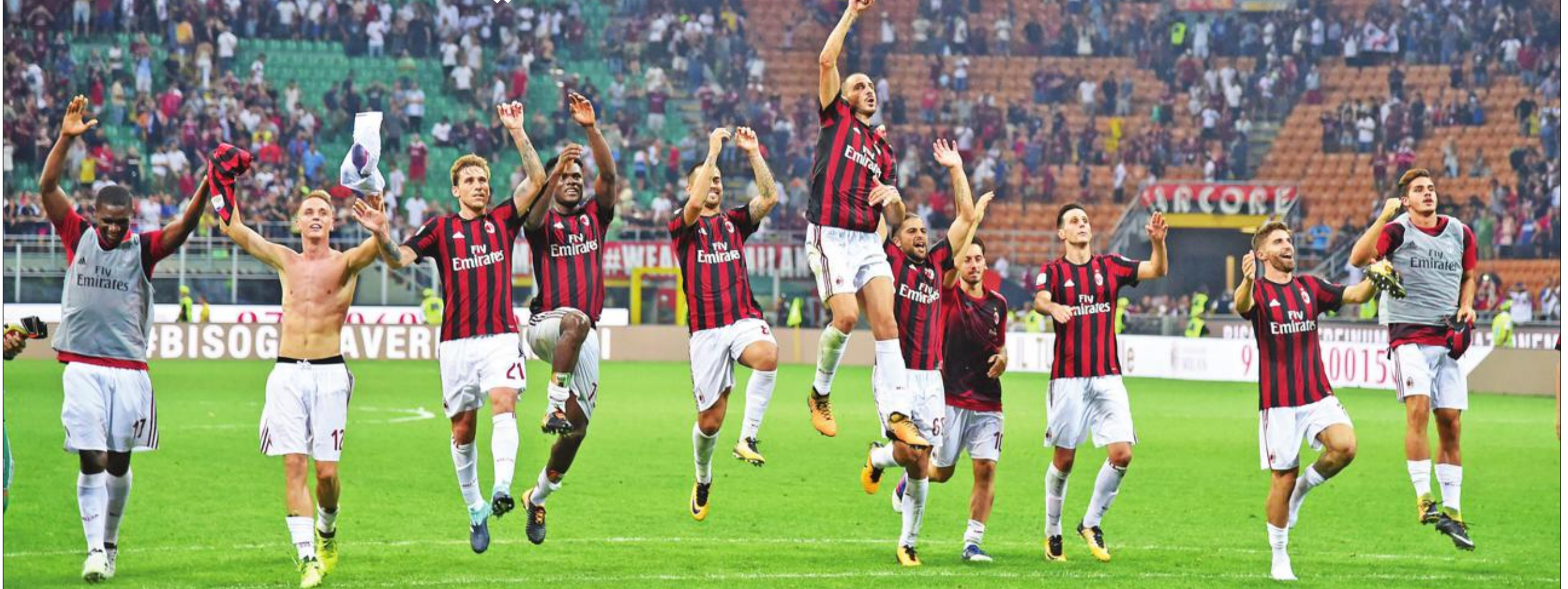
فرحة لاعبي ميلان بعد الفوز على كالياري

واصل ميلان انطلاقته القوية في الدوري الإيطالي لكرة هذا الموسم بتقلبه على كالياري 1-2 خلال المباراة التي جمعتهما، أمس الأول، في الجولة الثانية من مسابقة الدوري.