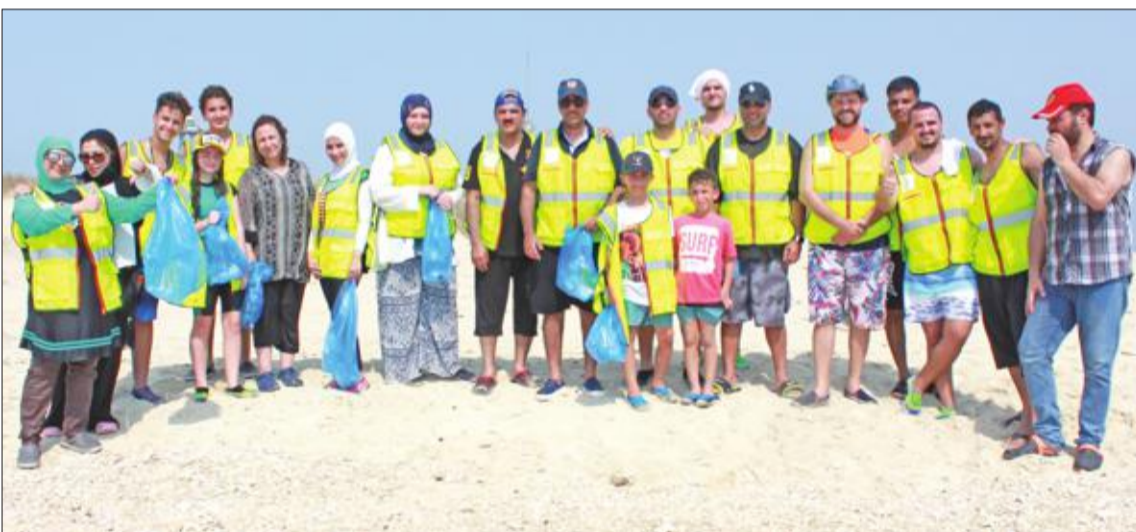
صورة جماعية في جزيرة كبر