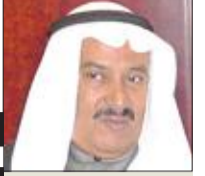
السفير يوسف عبدالله السيزي

وتحن نعيش شهر أغسطس هذا الشهر الذي شهد حادث الغدر والخيانة من جار كنا سنده في أشد الأوقات عسرة، وكاد عدوه يكسره، فكان للكويت وقيادتها وشعبها وقفة بطولية، وكان جزأنا لئلا سف في قيادة النظام السابق جزءاً ستمنا، فعات في بلدنا دمنا وخرابنا، وأهلك الحرث والنسل والزرع، وقتل شبابنا وأسرى إهنا وغابت الشمس عن سماننا، وساد الظلم والقهر، ولكن قدرة المولى العزيز انتصرت للحق على الباطل وعامت الشمس إلى وطن النهار.