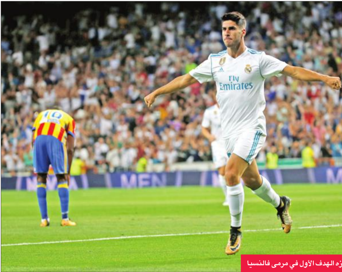
أسينسيو نجم الريال يحتفل بعد إحرازه الهدف الأول في مرمى فالنسيا

أحرز النجم الشاب ماركو أسينسيو هدفين، انقذ بهما فريقه ريال مدريد من تلقي خسارته الأولى في بطولة الدوري الإسباني لكرة القدم هذا الموسم، ليقوده إلى تعادل مثير 2-2 مع ضيفه فالنسيا في المرحلة الثانية للمسابقات مساء أمس الأول.