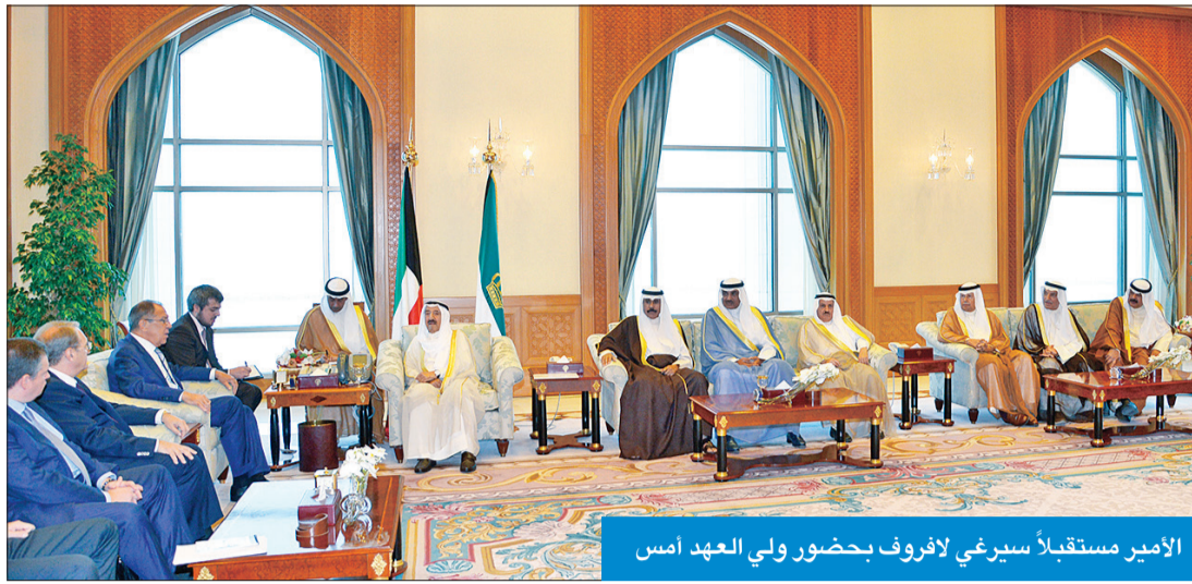
الأمير مستقبلاً سيرغي لافروف بحضور ولي العهد أمس

استقبل سمو أمير البلاد الشيخ صباح الأحمد، بقصر السيف صباح أمس، بحضور سمو ولي العهد الشيخ نواف الأحمد، وزير خارجية روسيا الاتحادية سيرغي لافروف والوفد المرافق، وذلك بمناسبة زيارته للبلاد. حضر المقابلة النائب الأول لرئيس مجلس الوزراء وزير الخارجية الشيخ صباح الخالد، والمستشار بالديوان الأميري محمد ضيف الله شرار، ونائب وزير الخارجية خالد الجارالله.