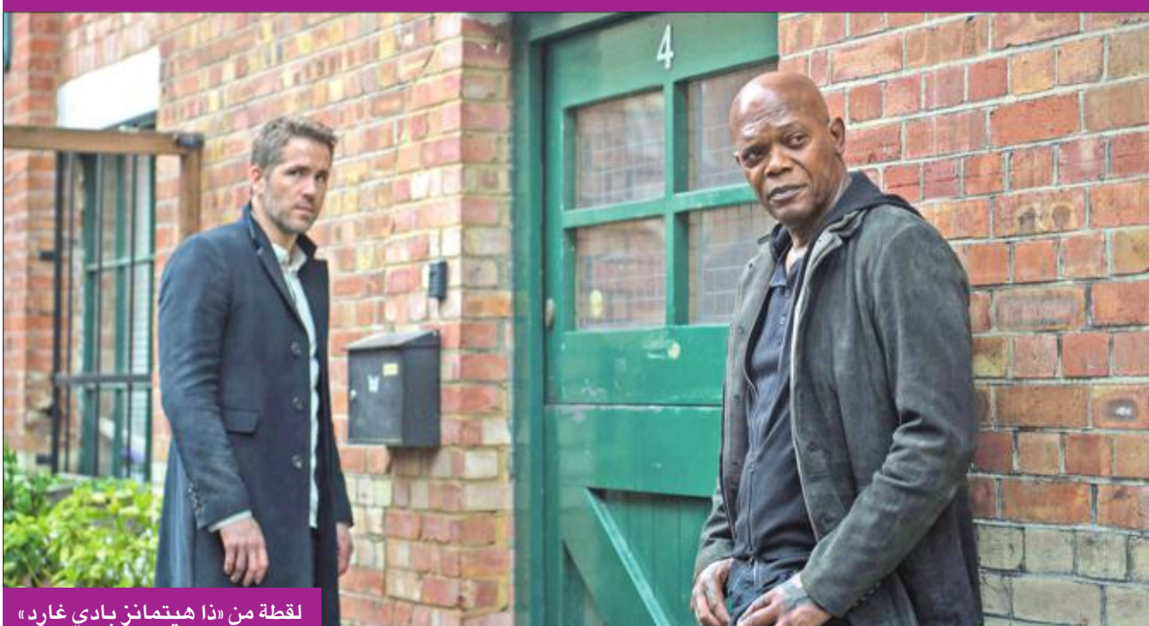
لقطة من «ذا هيتمانز بادي غارد»

محققاً إيرادات قدرها 3.9 ملايين دولار (172.5 مليوناً في ستة أسابيع).