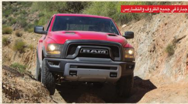
جبارة في جميع الظروف والتضاريس

وبالنظر للمركبة من الخلف، هناك باب خلفي جديد وجري مهور بكلمة "RAM" بحروف سوداء بارزة، وتؤكد شعارنا "Rebel" و "4x4" تفرد الشاحنة كما يتم أيضا التعامل مع المصد الخلفي مع طبقة مسحوق طلاء سوداء تدوم طويلا مع قطععات نارية حول العوادم المزروجة ذات الرؤوس المطلية بالكروم، ومصابيح الذيل حواف سوداء لتتناسب مع الإضاءة الامامية. وتشتمل ريبيل على كاميرا احتياطية اختيارية، توفر مجالاً أفضل للرؤية عند المتابعة، ويزداد غطاء جديد لصندوق الشاحنة الذي يطوي ثلاث مرات بشعار رام. وتتوافر رام 1500 Rebel بخمسة ألوان، من بينها: الغرائب الكريستالي اللامع، الفضي الفاتح اللامع، الأحمر الزاهي، الأبيض الفاتح والأسود الداكن، وهناك خيارات لدعامات من لون واحد ومن لونين. ومن الداخل، تحدد ريبيل قوينة ومفصلة العضلات، كما هو شكلها من الخارج، وتشتمل على مقاعد ممتدة، حصرية بصناعة السيارات، وتكون المقاعد مصنوعة من الفئيل عالي الجودة وتشتمل على اللونين الأحمر والأسود مع المشية من نوعية