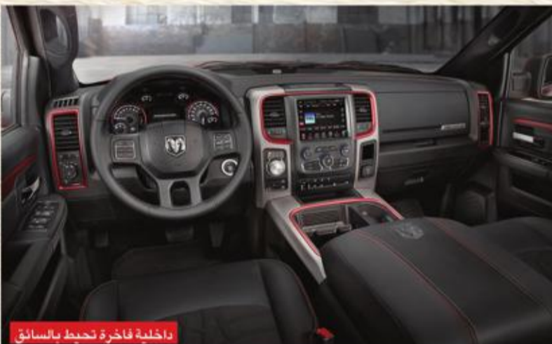
داخلية فاخرة تحيط بالسائق

بضغط زاوية الإطارات بشكل مناسب، وتمتص أذرع A المنخفضة المصنوعة من الألمنيوم الأحمال ويحقق المزيج من الإطارات الكبيرة ورفع نظام التعليق أفضل مستوى ارتفاع عن الأرض ضمن فئة المركبة، حيث يبلغ الخلوص 10.3 بوصات (261.62 ملم)، وتأخذ معايرة لبرنامج الثبات التعديلات التي يشملها طراز ريبيل في الاعتبار. وتتوافر ريبيل حصريا كموديل مقصورة ركاب مع سطح يبلغ طوله 5 أقدام و 7 بوصات (1.7 متر)، ويأتي نظام RamBox مميزة اختيارية وتم تجهيزه بمحرك هيمي V8 HEMI® الأسطوري سعة 5.7 لترات العرق بتقنية إيقاف نصف الأسطوانات الموفرة للوقود ونظام التوقيت المتغير للضمامات VVT، وتبلغ قوة المحرك 395 حصانا وعزم دوران يبلغ 410 رطل - قدم ونسبة علية تروس تبلغ 3.92، ما يسمح للمحرك بتحقيق أقصى استفادة من وقته وعزم دورانه. ويأتي المحرك مع دفرنش خلفي مضاد للدوران، والذي يجعل العجلتين الخلفيتين تتحركان معا عند زيادة عزم الدوران، وهي مسألة مفيدة في ظروف القيادة على الطرق الوعرة.