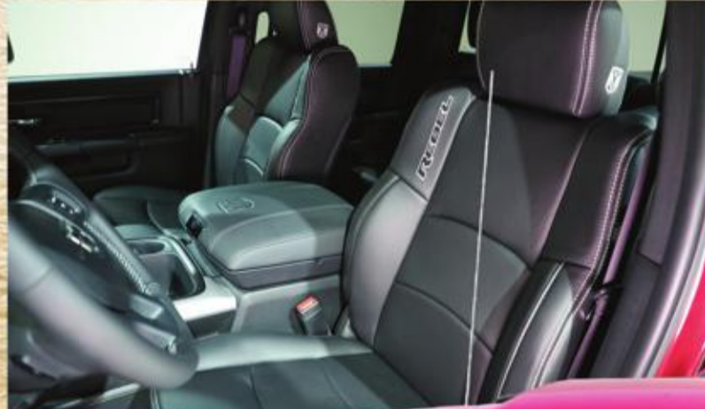
اهتمام بكل التفاصيل

الركوب بمعدل بوصة واحدة (25.4 ملم)، من أجل تحسين زوايا حركة المركبة على الطرق الوعرة. وتقدم علامة بيلستين (Bilstein) أجهزة امتصاص صدمات أمامية وخلفية مع موالفة فريدة من نوعها، وتتناسب معايرة جديدة لعجلة القيادة مع زيادة ارتفاع الركوب بطراز ريبيل، ويساهم قصب خلفي بحقق الاستقرار لتحسين ديناميكية المركبة، ويتم تركيب إطارات تويو أوبن كونتري (Toyo Open Country) قياس 33 بوصة تناسب جميع التضاريس على عجلات جديدة بالكامل من الفضة والألمنيوم الأسود قياس 17 بوصة. وتتم تجهيز شاحنات رام بإطارات جديدة، هي أوبن كونتري (Open Country) تتناسب مع جميع التضاريس، ومتعددة الاستخدامات، وفصمة لتحقيق إطالة جيدة وشريسة، وتحكم في جميع المواسم وركوب مريح. وتشتمل الإطارات على نمط خطوط خاص يحقق عملية جر جيدة في ظروف سيئة، سواء على الطرق العميقة أو الوعرة. وتتميز الإطارات بترتيب خاص منموج لركوب مريح وجر أفضل، وللاطوار حواف بارزة لتعزيز عملية الجر، وكتف مفتوح يزيد من إخلاء المياه، من أجل عملية جر وثبات ممتازة في جميع التضاريس. ويستفيد طراز ريبيل من نظام التعليق الهوائي الحصري لعلامة رام، مع رفع بمعدل بوصة واحدة (25.4 ملم) لمستوى تعليق المصنع، ما يساهم في زيادة ارتفاع المركبة عن مستوى الأرض، وتقوم نسخة معدلة من نظام التعليق الامامي المستقل