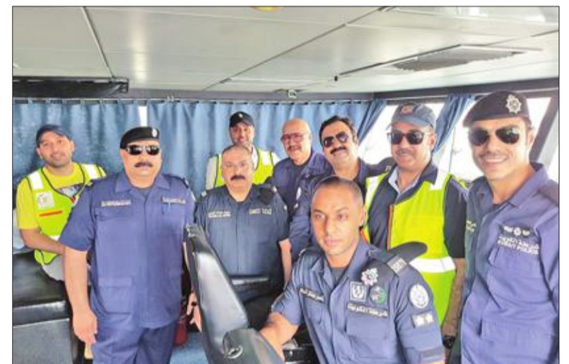
المندي ورجال خفر السواحل