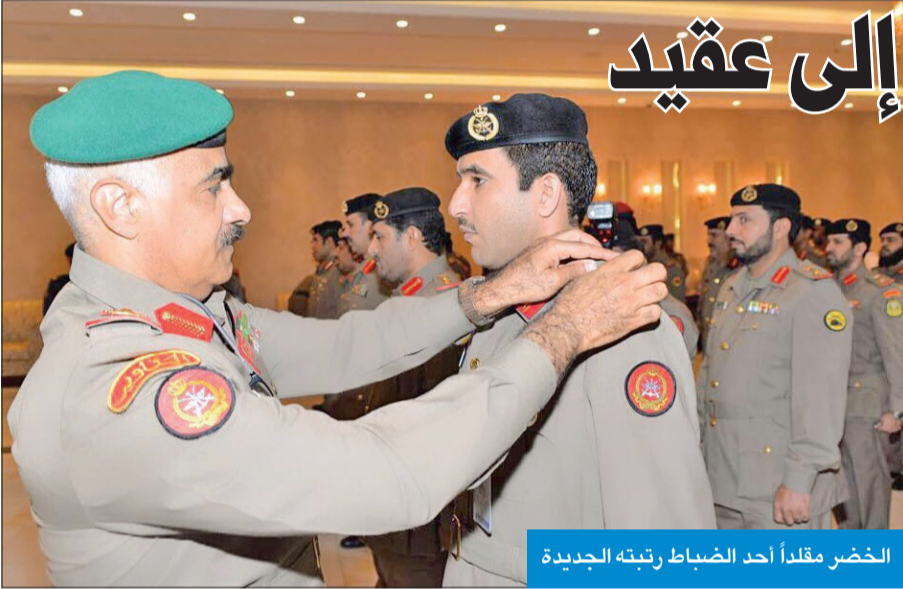
الخضر مقلداً أحد الضباط رتبته الجديدة

ورحب الخضر بالضيف، متمنياً له التوفيق والنجاح في مهام منصبه الجديد، وتم خلال اللقاء تبادل الأحاديث الودية ضمن محور الزيارة، ومناقشة أهم الأمور والمواضيع ذات الاهتمام المشترك، لاسيما المتعلقة بالجوانب العسكرية. حضر اللقاء نائب رئيس الأركان الفريق الركن عبدالله النواف، ومدير مكتب شؤون رئيس الأركان العميد الركن بحري نعمان الراشد.