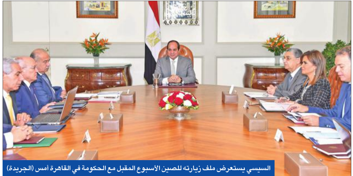
السيسي يستعرض ملف زيارته للصين الأسبوع المقبل مع الحكومة في القاهرة أمس (الجريدة)

« حلوان » تستنفر « الداخلية » • إنتاج حفل « ظهر » في موعده • برلين تعرض وساطتها في ملف سد النهضة