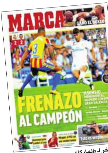
... وآخر لـ الماركا،