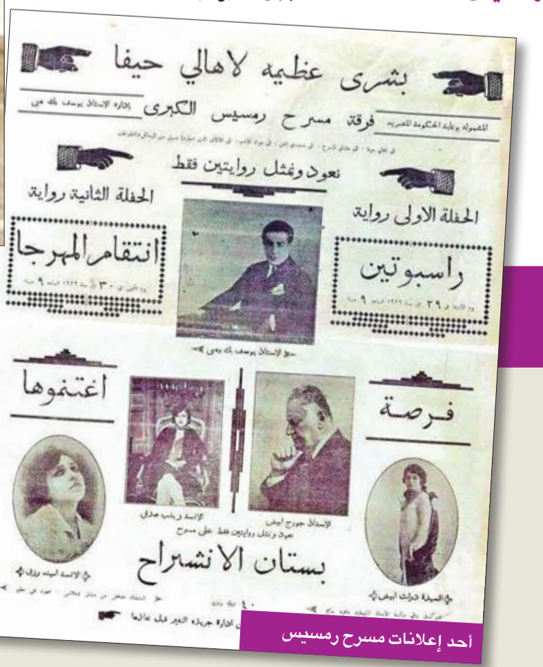
إحد إعلانات مسرح رمسيس