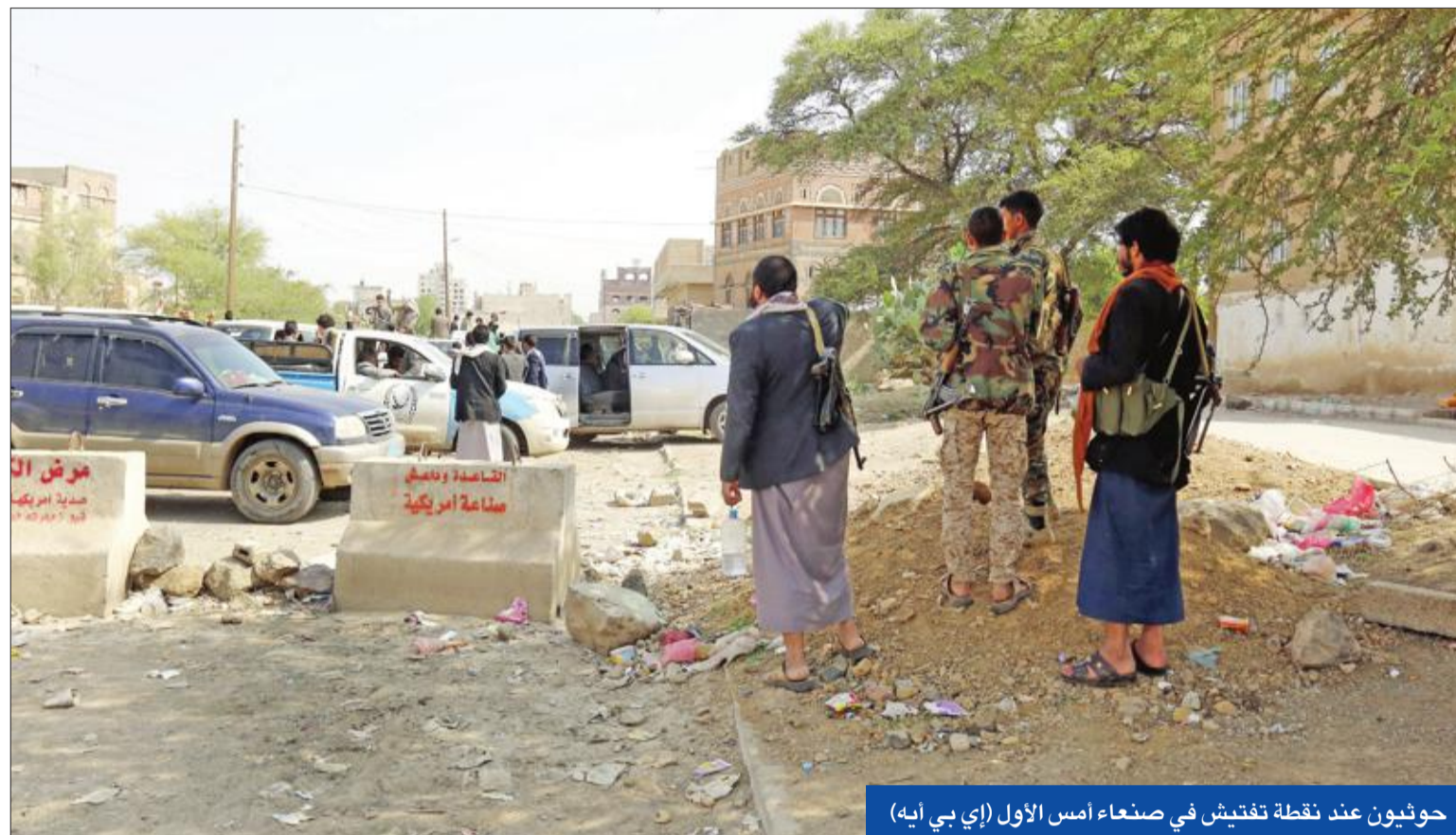
حوثيون عند نقطة تفتيش في صنعاء أمس الأول

أبلغت الميليشيات الحوثية الرئيس اليمني السابق علي صالح أنها غير مسؤولة عن سلامته، وطالبته بعدم مغادرة مقر إقامته في صنعاء، في وقت شدد وزير الدولة الإماراتي أنور قرقاش على ضرورة الاستفادة من الصراع بين الحوثيين وصالح، لتقصير أمد الصراع اليمني.