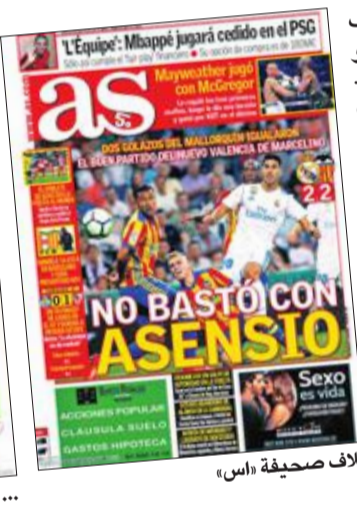
غلاف صحيفة «اس»

الخناشي الموقوف كريستيانو رونالدو وسرخيو راموس. وأشادت «اس» إلى أن أسينسيو نجح في دفع الريال بالجانب الهجومي، وكان قريبا من تسجيل هدفه الثالث وتحقيق عودة تاريخية على ملعب سانتياغو برنابيو.