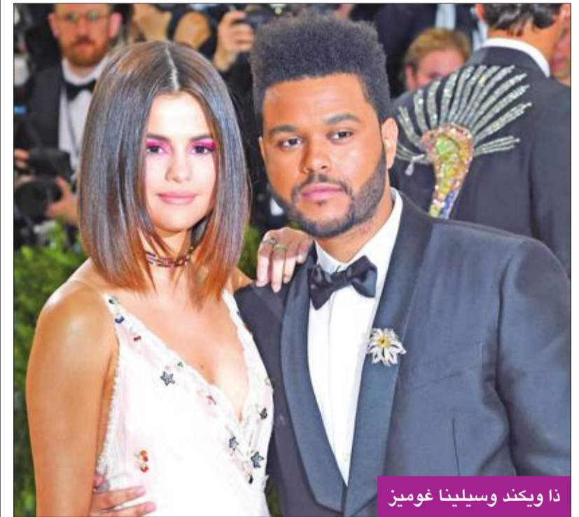
ذا ويكند وسيلينا غوميز

ألغى النجم ذا ويكند جولته الغنائية، ليكون يقرب حبيبته الفنانة العالمية سيلينا غوميز، التي واجهت مرضاً صعباً، وأجرت عملية زرع كلية، والتي لم تكن سهلة أبداً. وصرح مصدر مقرب من الثنائي، بأن «العملية التي خاضتها سيلينا كانت خطيرة جداً، وكان كل من يحبها قلقاً عليها». يُذكر أن سيلينا خضعت لعملية زرع كلية تبرعت لها بها صديقتها المقربة فرانشا رابسا، بعد مضاعفات من معرقتها مع المرض، لتخرج أخيراً عن صمتها، وتعلن من خلال مواقع التواصل الاجتماعي كل ما مرّت به حتى اليوم.