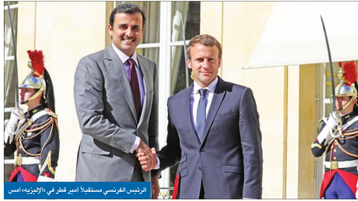
الرئيس الفرنسي مستقبلاً أمير قطر في «الإليزيه» أمس

من محطاته الثانية في جولته الأولى منذ بدء الأزمة الخليجية قبل 100 يوم، جدد أمير قطر الشيخ تميم بن حمد، أمس، تمسكه بمبادرة سمو أمير البلاد الشيخ صباح الأحمد لراب الصدع الخليجي، مؤكداً استعدادة للجلوس إلى طاولة التفاوض لإنهاء النزاع غير المسبوق مع السعودية والإمارات والبحرين ومصر، والوصول إلى حل يرضي الجميع. وشكر أمير قطر، في مؤتمر صحفي مشترك مع المستشارية الألمانية أنجيلا ميركل، برلين على دعمها لمبادرة الكويت التي تتضمن ضرورة التوصل إلى حل سلمي ودبلوماسي للأزمة. وقال الشيخ تميم: «كما تعلمون مضى الآن أكثر من مئة يوم على الحصار، وتحدثنا عن استعداد قطر للجلوس إلى الطاولة لحل هذه القضية»، مضيفاً أن «مبادرة قطر للشيخ صباح التي دعمتها قطر منذ البداية ستظل تدعمها إلى أن نصل إلى حل يرضي جميع الأطراف». وتابع: «كلنا نكافح الإرهاب، لكن يجب أن نركز على جذوره وأسبابه»، مشدداً على ضرورة «التحلي بالاصول الدبلوماسية للتوصل إلى حل عادل وإيجابي للأزمة الخليجية».