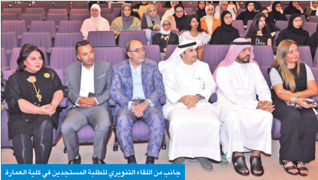
جانب من اللقاء التنويري للطلبة المستجدين في كلية العمارة

ضرورة الالتزام باللوائح والقوانين المؤمن