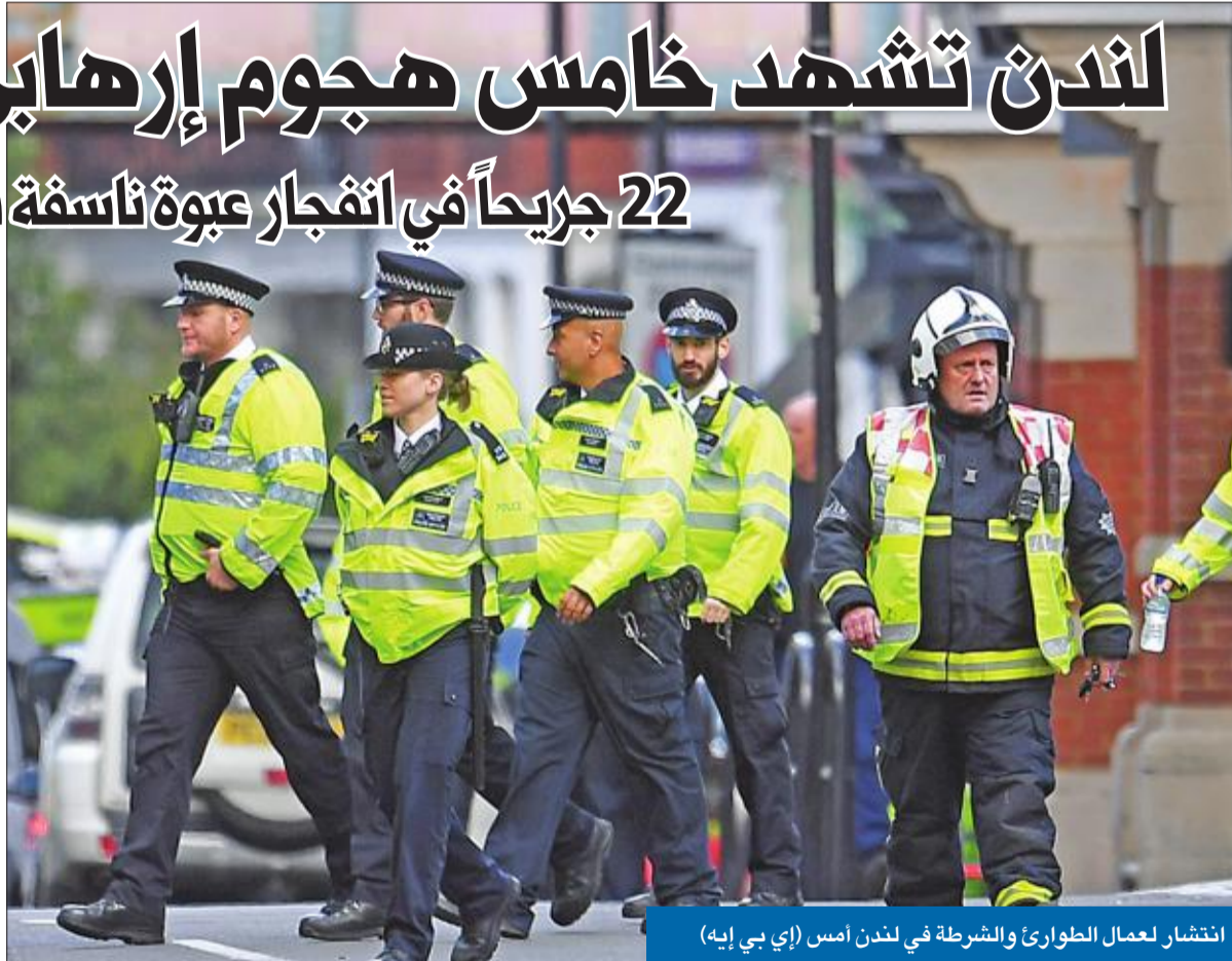
انتشار لعمال الطوارئ والشرطة في لندن أمس (إي بي إي)

في اعتداء هو الخامس من نوعه خلال ستة أشهر، استهدفت العاصمة البريطانية على انفجار عبوة يدوية الصنع استهدفت محطة مترو الأنفاق في «بارسونز غرين» في ساعة الذروة الصباحية، مما أسفر عن إصابة 22 شخصاً بجروح، أودعوا المستشفى لتلقي العلاج. ووسط انباء عن اعتقال شخص يحمل سكيناً قرب محطة قطارات بمدينة برمنغهام، أعلن رئيس وحدة مكافحة الإرهاب بشرطة لندن مارك راوولي أن انفجار محطة «بارسونز غرين» أحدثته عبوة ناسفة يدائية، موضحاً أن جهاز المخابرات الداخلية (إم. أي 5) يدعم التحقيقات في العملية.