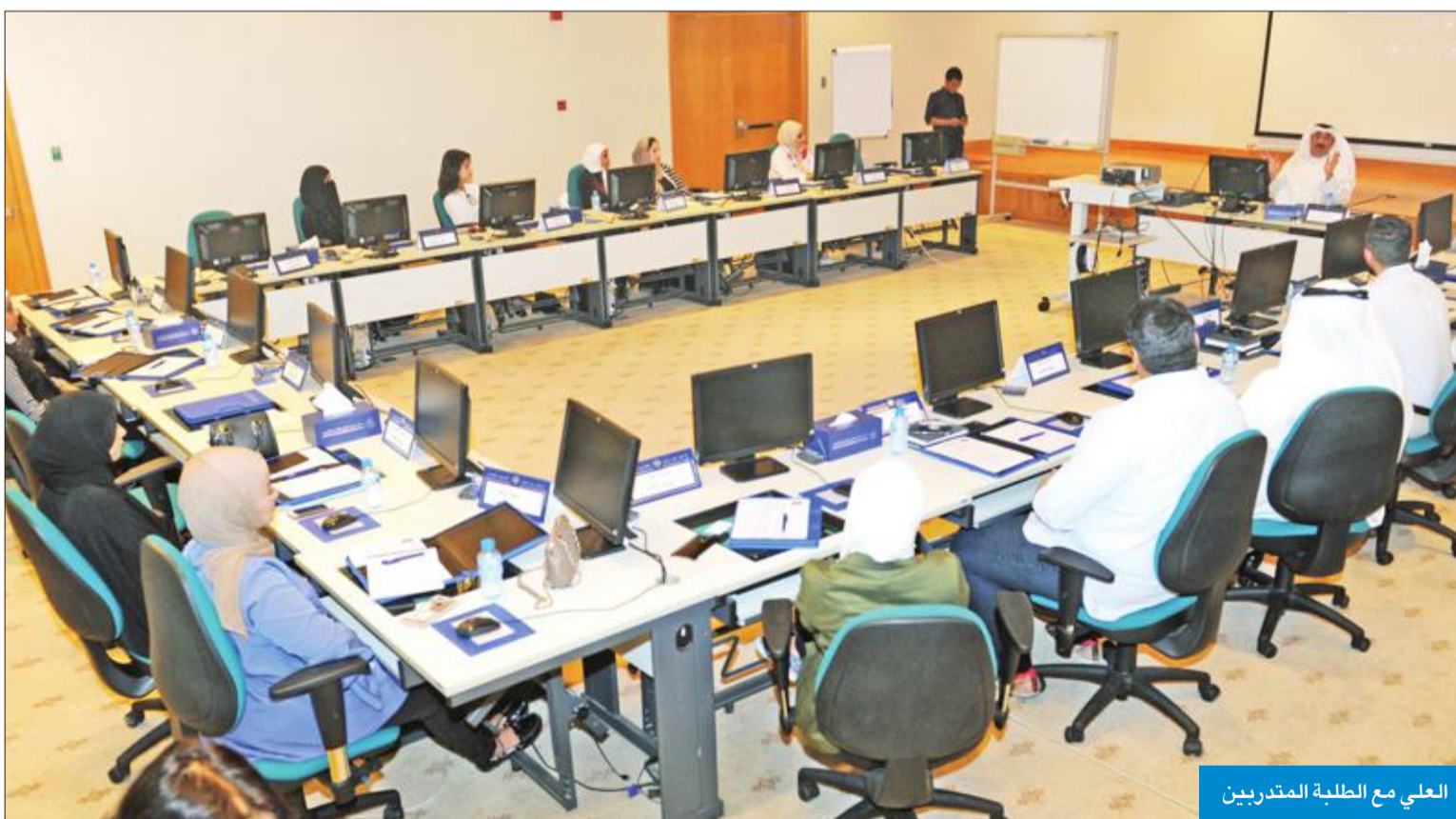
العلي مع الطلبة المتدربين

الصحافة الكويتية رائدة في المنطقة وتتعدى بمراحل كبيرة العالم العربي