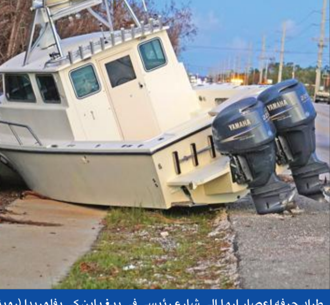
طراد جرفة إعصار إرما إلى شارع رئيسي في بيغ باين كي بفلوريدا

بعد اتهامات له بدعمهم، وقع الرئيس الأميركي دونالد ترامب، أمس الأول، مشروع قرار للكونغرس يدين العنصريين البيض، بعد مناورة من المشرعين لحفه على دعم نص كان رده المهيم على العنف العنصري في مدينة شارلوتسفيل سبياً في صياغته. وحول توقيع ترامب قانون المشروع الذي «يبنذ القوميين البيض والعنصريين البيض وجماعة الكوكلوكس كلان والنازيين الجدد وجماعات الكراهية الأخرى»، بعد أن نال إجماعاً في الكونغرس عند التصويت عليه بداية الأسبوع. وقال ترامب إنه مسرور بالتوقيع على القرار، مضيفاً: «أميركيين نحن ندين أحداث العنف الأخيرة في شارلوتسفيل، ونعارض الكراهية والتعصب والعنصرية بكل أشكالها».