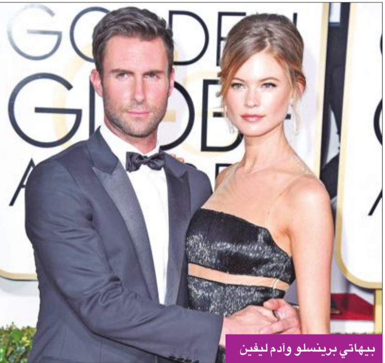
بيهااتي برينسلو وآدم ليفين

أعلنت عارضة الأزياء الشهيرة بيهااتي برينسلو، عبر حسابها الخاص بأحد مواقع التواصل الاجتماعي، خيراً ساراً لمحبيها، مفاده أنها تنتظر مولودها الثاني من زوجها المغني الشهير والعارض الموسيقي آدم ليفين، الذي عرفه الناس بأغانيه الشهيرة، كعضو لجنة تحكيم برنامج «ذا فويس». وظهرت في الصورة التي نشرتها وهي ترتدي لباس البحر وقد بدت علامات الحمل واضحة عليها، وعلقت على الصورة بقولها: «المرحلة رقم 2». يُذكر أن آدم وبيهااتي استقبلا طفلتهما الأولى في سبتمبر 2016، واسماها داستي روز.