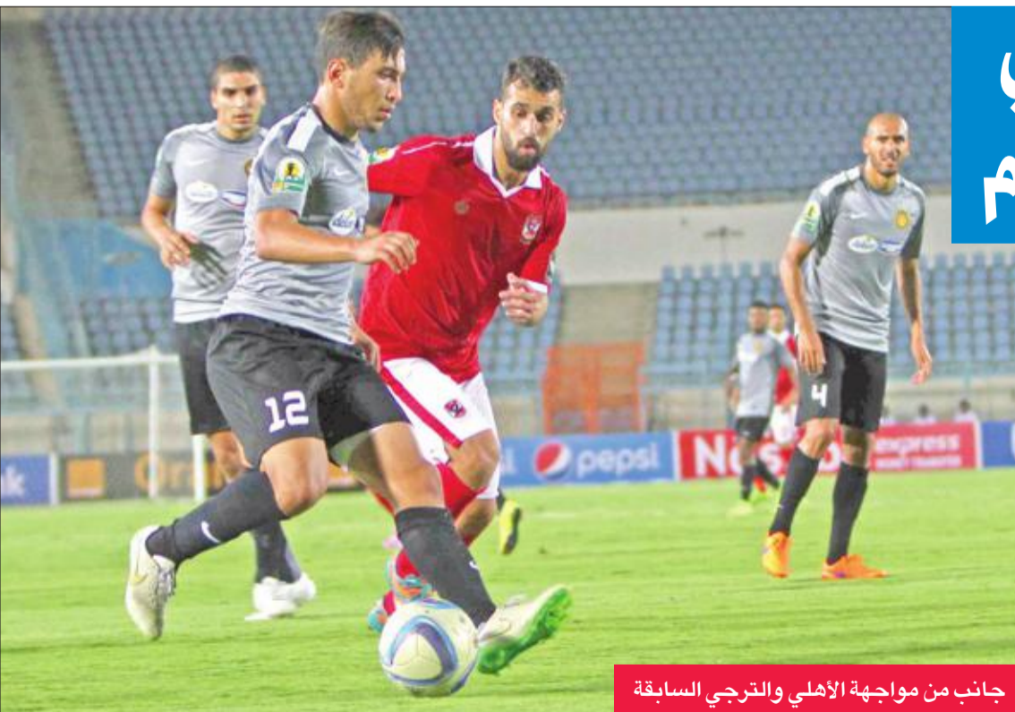
جانب من مواجهة الأهلي والترجي السابقة