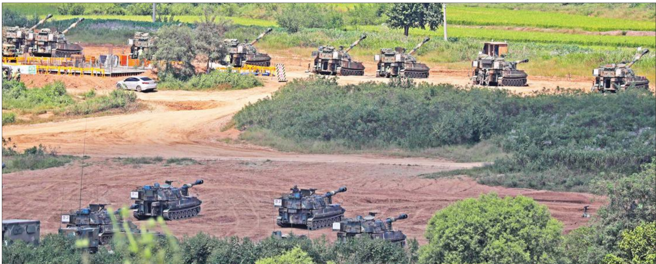
قوات كورية جنوبية تجري تدريبات باستخدام المدفعية لمواجهة هجوم محتمل من بيونغ يانغ بالقرب من المنطقة المنزوعة السلاح في باجو امس (إي بي آيه)

دعت كل الأطراف إلى ضبط النفس. وقالت المتحدثة باسم الخارجية الصينية، هوا شونينج، في بكين إن بلادها ستواصل تنفيذ كل قرارات العقوبات بشكل شامل وكامل، مشيرة إلى أن الوضع في شبه الجزيرة الكورية «معقد وخطير». ووصف المتحدث الرسمي باسم الرئاسة الروسية، دميتري بيسكوف، الخطوة الكورية الشمالية بـ«الاستفزاز الجديد» الذي يؤدي إلى تصعيد الوضع في المنطقة. وقال بيسكوف للصحافيين: «روسيا قلقة من عمليات الإطلاق الاستفزازية التي تؤدي إلى مواصلة تصعيد الوضع، وزيادة التوتر في شبه الجزيرة، نحن ندين بشدة استمرار هذه الأعمال».