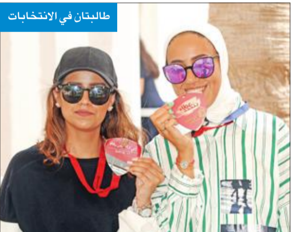
طالبتان في الانتخابات