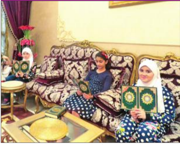
عدد من الطالبات الحافظات للقران

للسنة السابعة على التوالي، تعود دار العثمان لاستئناف دورة المرحوم عبد الله عبد اللطيف العثمان لتحفيظ القرآن الكريم واللغة العربية، والمخصصة للمرحلتين الابتدائية والمتوسطة، إضافة إلى فصل خاص للنساء، حيث تقام الدورة كل عام ويشارك فيها أكثر من 100 مشترك ومشاركة، ويصاحبها العديد من الأنشطة والفعاليات التوعوية الهادفة. وقالت الدار إنه سيرها إبتداء دورة 2017، التي ستقام ابتداء من نوفمبر 2017 وتستمر إلى مايو 2018.