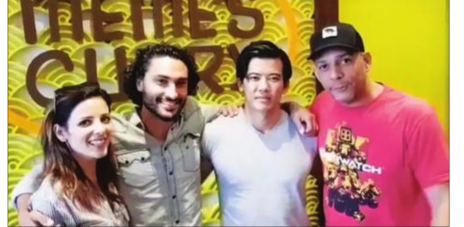
مؤدي أصوات لعبة أوفر واتش