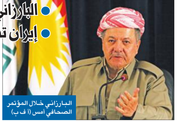
البارزاني خلال المؤتمر الصحافي أمس

● البارزاني: الاستفتاء ليس لترسيم الحدود ● إيران تقفل أجواءها الجوية أمام الإقليم في خطوة تاريخية قد تؤدي إلى أزمة إقليمية تشمل 4 دول، وتضاف إلى لائحة طويلة من الأزمات التي تعيشها منطقة الشرق الأوسط، يتوجه الآلاف من أكراد العراق اليوم، بالإضافة إلى أقليات قومية وأثنية ودينية مذهبية، في إقليم كردستان