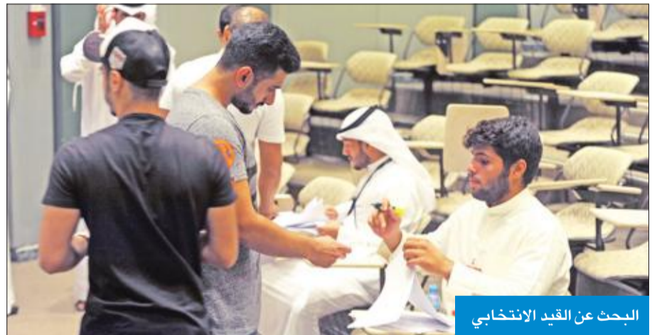
البحث عن القيد الانتخابي

لقتات • فتحت صناديق الاقتراع في أغلب مواقع الاقتراع في الساعة الثامنة صباحاً. • حضرت القوائم الطلابية بشكل مقرب لدى قاعات الاقتراع لحث الطلبة على التصويت. • لوحظ إقبال خجول على التصويت. • جهود رجال الأمن والسلامة كانت واضحة في مختلف الكليات. • تميزت الكليات بالالفتات والبروشورات عند مداخلها وبين القاعات. • حضرت دوريات الشرطة خارج الكليات في كيفان والخالدية لتنظيم حركة السير. • القوائم الطلابية وزعت المرطبات والإيس كريم على الطلبة.