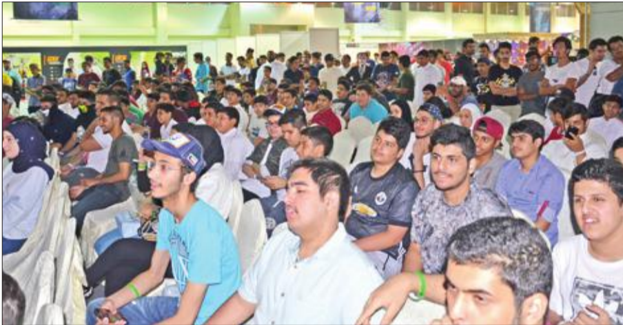
حضور كبير من الجمهور