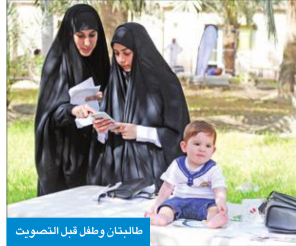
طالبتان وطفل قبل التصويت

الكلية لا تتدخل في اختيارات لقوائمه ولكن دورنا تنظيمي الهزاع