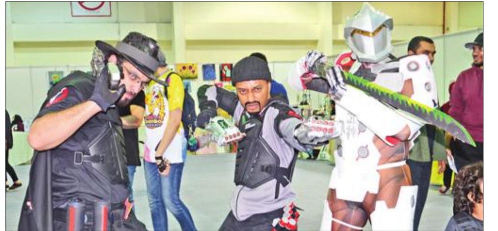
شباب يؤدون شخصيات ميري جرين وريبر و كينجي