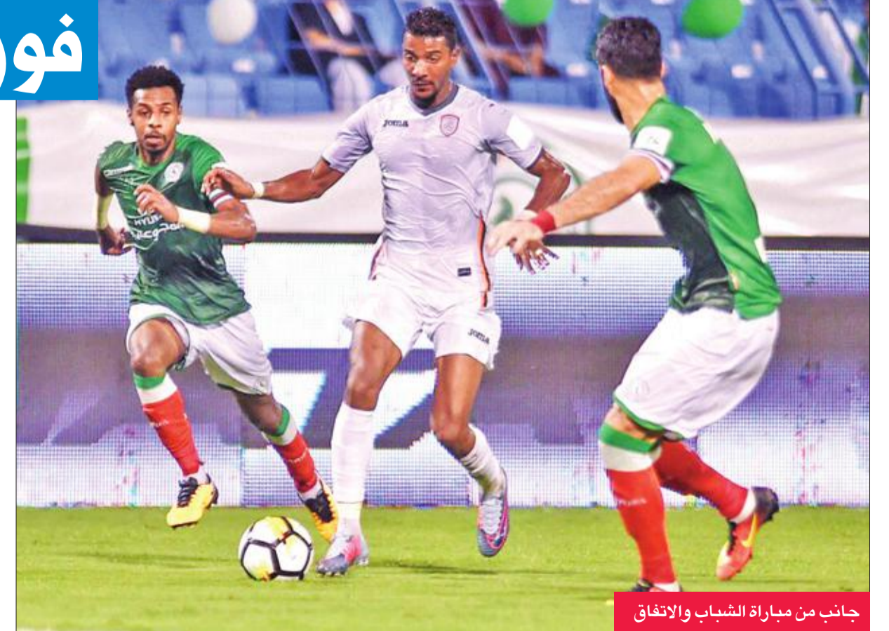
جانب من مباراة الشباب والاتفاق

في المرحلة الرابعة من الدوري السعودي لكرة القدم، حقق الشباب فوزاً متأخراً على المباراة التي أقيمت وسط أجواء مناسبة اليوم الوطني 87.