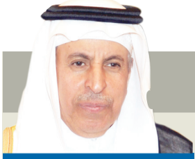
بقلم د. عبدالعزيز الفاييز*