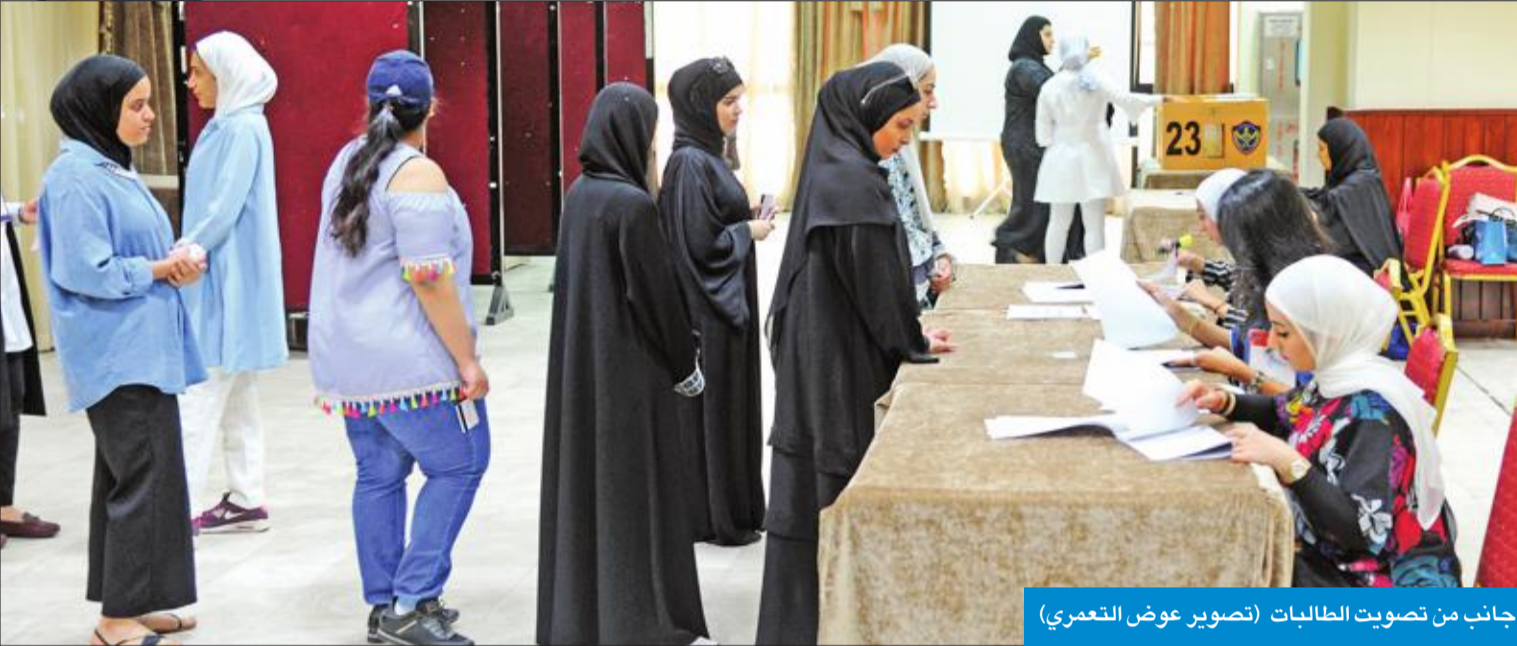
جانب من تصويت الطالبات

في أجواء هادئة أقرب إلى الركود، أنهى عرس انتخابات الاتحاد الوطني لطلبة جامعة الكويت الذي تنافست فيه على مقاعد الهيئة الإدارية أربع قوائم طلابية هي "الائتلافية والاتحاد الإسلامي"، و"المستقلة" و"الإسلامية" و"الوسط الديمقراطي". مع ما يرافق تلك العملية من صحاح وشبهات في أغلب مواقع التصويت بمختلف الكليات، ولم تخل كليات الجامعة من الازدحام المروري منذ الصباح الباكر، إلا أن ذلك كان بسبب حضور الطلاب محاضراتهم، لا بسبب الإقبال على العملية