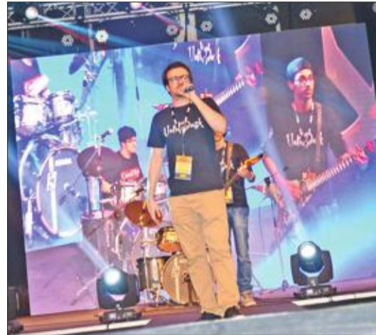
جانب من الفعالية