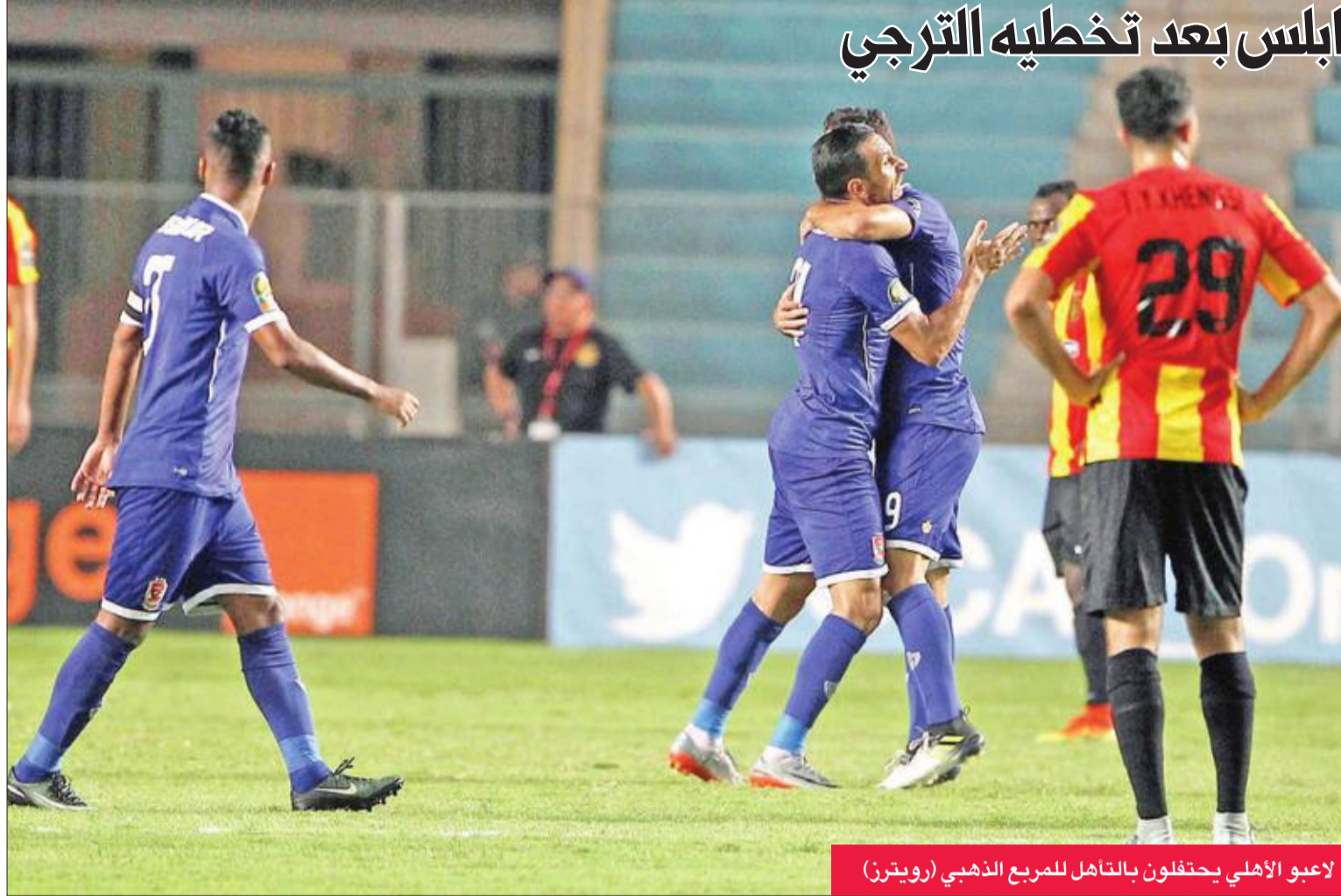
لاعبو الأهلي يحتفلون بالتأهل للمربع الذهبي