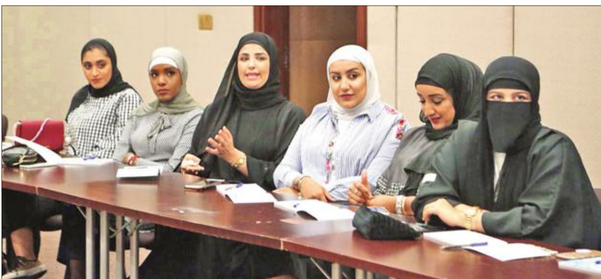
عدد من المتطوعات

الابداع في العمل التطوعي والمهارات اللازمة لكسب ثقة الآخرين، وكذلك برنامج تدريب لاكساب المتطوعين مبادئ الأمن والسلامة والمسح الأمني حيث تقام الورشة بالتعاون مع وزارة الداخلية.