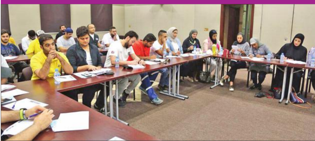
جانب من المتدربين