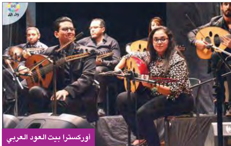
أوركسترا بيت العود العربي

أحمد عزت الألفي، وهو عرض ماخوذ عن نص للكاتب والمترجم النمساوي بيتر هاندك.