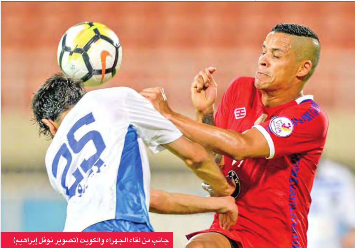
جانب من لقاء الجهراء والكويت

وكاظمة الشوط الأول بمستوى غابت فيه أبعديات كرة القدم تماماً، على الرغم من أن الفريقين لديهما دوافع عديدة لتحقيق الفوز.