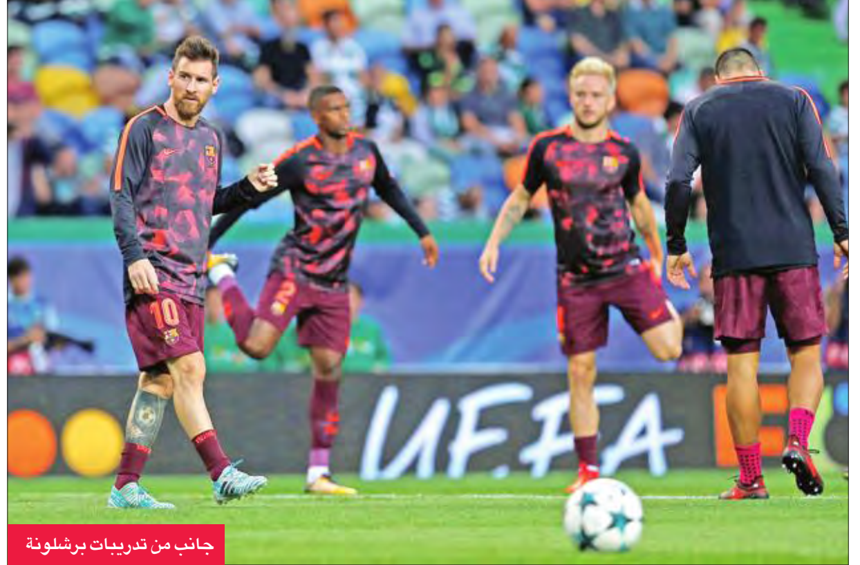
جانب من تدريبات برشلونة

(1-2) في دوري الأبطال، البقاء قريبا من برشلونة قبل مواجهته الأخير في 14 أكتوبر، حيث حل فريق المدرب الأرجنتيني دييغو سيميوني ضيفا على ليغانيس، الذي حقق نتائج مميزة حتى الآن، وهو يحتل المركز السابع، بفارق 4 نقاط فقط عن "لوس روخيبلانكوس".