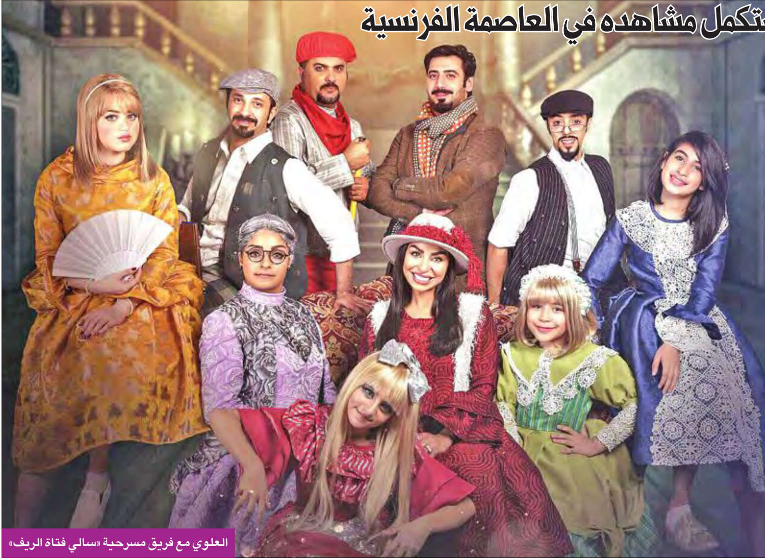
العلوي مع فريق مسرحية «سالي فتاة الريف»

دخل الفنان محمد العلوي «لوكيشن» تصوير مسلسله الدرامي الاجتماعي «روز باريس» في الكويت، ثم يستعد بعد ذلك للسفر إلى العاصمة الفرنسية باريس لاستكمال المشاهد الأخرى هناك.