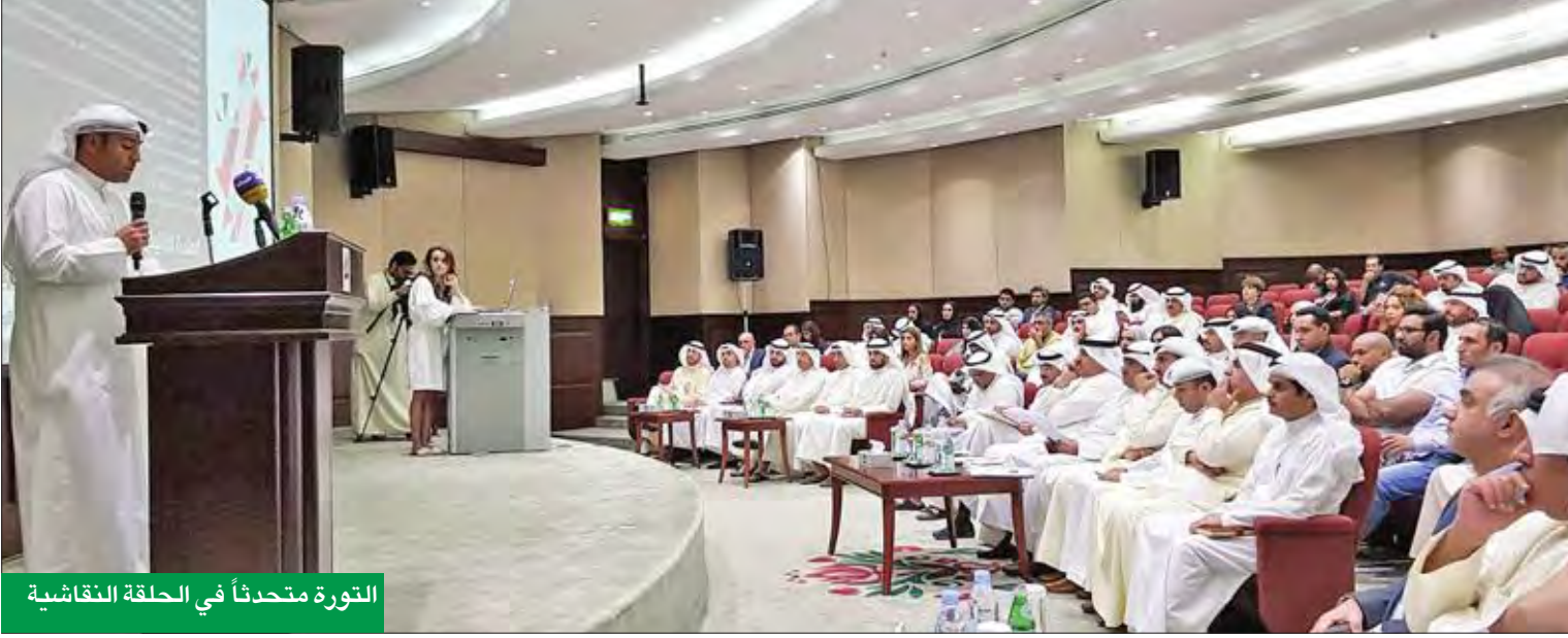
التورة متحدثاً في الحلقة النقاشية

الأسواق- وتوضيح للاشتراطات المطلوبة تحصيلها للموافقة على إعطاء ترخيص لمزاولة الأعمال وحظر السلع المسموح ببيعها، وغيرها من المواد التي تكونت منها المسودة، ومن ثم فتح المجال للمناقشة حول مواد المسودة.