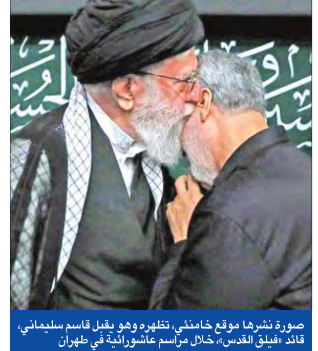
صورة نشرها موقع خامنئي، تظهره وهو يقبل قاسم سليمان، قائد «فيلق القدس»، خلال مراسم عاشورائية في طهران

استخدامه طائرات خاصة في رحلات رسمية. وينضم برايس إلى قائمة طويلة من سبعة مسؤولين كبار اضطروا إلى الاستقالة منذ تولي ترامب الرئاسة في 20 يناير. وأشار برايس (الخصاصي العظام - 62 عاماً)، غضب ترامب بسبب تنقله على متن طائرات خاصة بكلفة تجاوزت 400 ألف دولار، بحسب موقع «بوليتيكو»، كما يدع برايس ثمن استياء ترامب من فشل مشروعه لإصلاح برنامج «أوباماكير»، رغم تعهده بإلغائه. إلى ذلك، أعلنت منظمات حقوقية ولاجونز، أمس، رفع دعوى ضد الإدارة الأميركية بشأن المرسوم الأخير حول الهجرة، في فصل جديد من هذه المعركة المستمرة منذ فترة أمام المحاكم. وتقدم