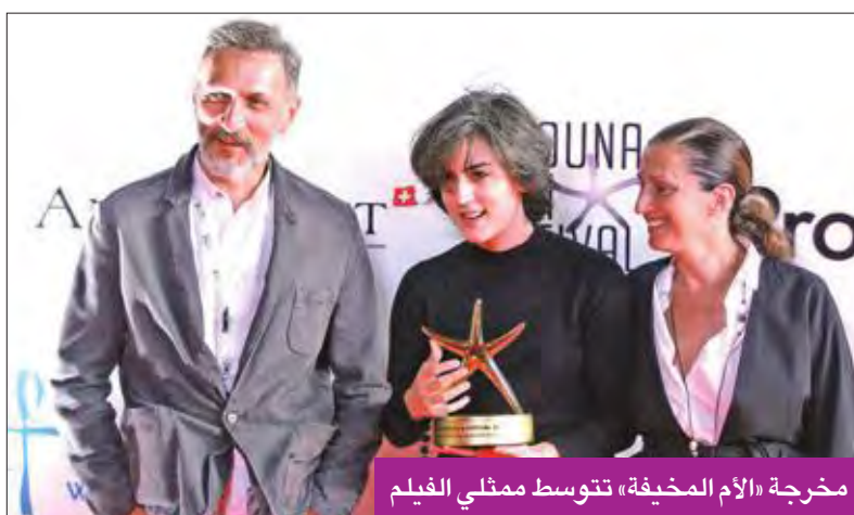
مخرجة «الأم المخيفة» تتوسط ممثلي الفيلم