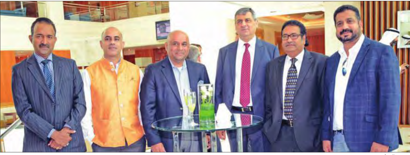
عدد من الحضور

أطلق فندق كورت يارد ماربوت قائمة طعام جديدة بمطعمه الهندي الشهير «سول أند سبايس» في حفل حضره السفير الهندي بالكويت سونيل جين، والمدير العام لفنادق ماربوت بالكويت جورج عون، وعدد من الشخصيات من مختلف الشركات بالكويت، إضافة إلى حشد من الإعلاميين. وقال عون بهذه المناسبة: «يعد المطبخ الهندي أحد أشهر المطابخ في العالم، نظرا للاطباق والتكهات التي يقدمها». وتضم القائمة الجديدة بمطعم «سول أند سبايس» أشهر والذ الأطباق الهندية الأصلية بأسعار مناسبة جدا.