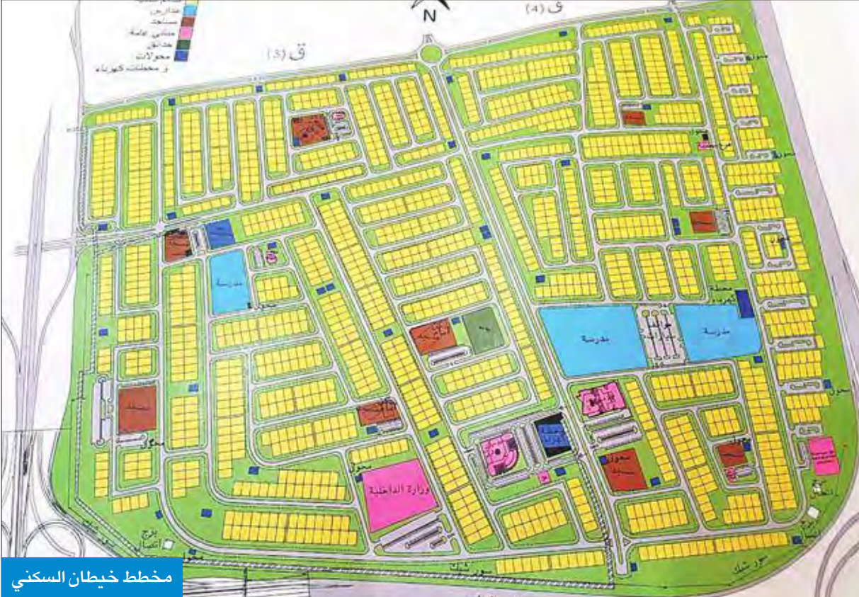
مخطط خيطان السكني

من مجلس الوزراء، وفقاً لأحكام المادة (8) من القانون رقم (27) لسنة 1995 بشأن إسهاام نشاط القطاع الخاص في تعمير الأراضي الفضاء المملوكة للدولة لغراض الرعاية السكنية. في هذا الشأن بإدارة المؤسسة الى مخاطبة مجلس الوزراء بكتابها رقم (2861) بتاريخ 2017/2/19 يطلب تحديد الثمن الرمزي للقسمة في المشروع المشار اليه.