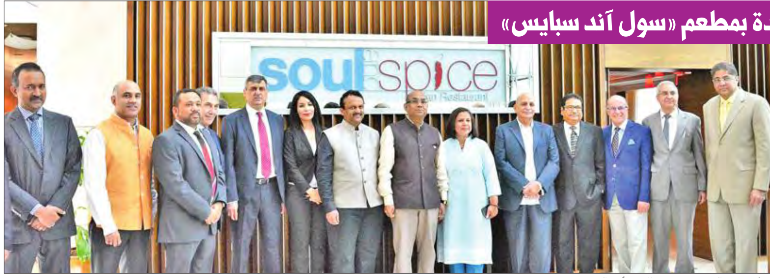
السفير جين والمدير عون يتوسطان عددا من المدعوين