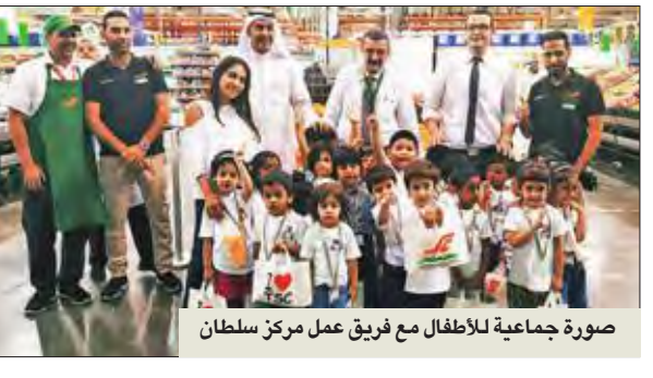
صورة جماعية للأطفال مع فريق عمل مركز سلطان

استضاف مركز سلطان أطفال حضانة كيدز بلاي غروب في متجره للجملة بمنطقة الضجيج، في جزء من البرنامج التعليمي الذي صمّمته الشركة بمناسبة موسم العودة إلى المدارس. تجول الأطفال في المتجر بصحبة موظفي المركز الذين شروحوها لهم عن مختلف المنتجات الموجودة في الفرع.