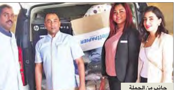
جانب من الحملة

أطلقت مجموعة الضيافة التابعة لفنادق ومنتجعات موشيك لعام 2017 حملة خيرية حول العالم تحت عنوان «كيلوغرام من الإحسان» خلال الفترة من 1 إلى 15 سبتمبر الماضي، ودعت الضيوف إلى التبرع بكيلوغرام واحد على الأقل من المواد في أي من الفنادق المشاركة.