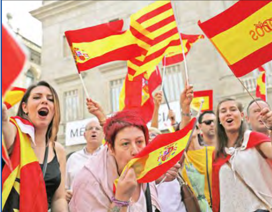
إسبانيات خلال تظاهرة رافضة لانفصال كاتالونيا في مدريد أمس

في واحدة من أكبر الأزمات التي تشهدها إسبانيا منذ تفعليل الديمقراطية بعد وفاة الدكتاتور فرانسيסקو فرانكو في 1975، دعت حكومة إقليم كاتالونيا، أكثر من 5 ملايين ناخب للتصويت في استفتاء يجري اليوم حول الانفصال عن إسبانيا وتشكيل دولة مستقلة، وذلك رغم رفض مدريد للاستفتاء ومحاولتها وقفه. ووسط العراقيل الكبيرة التي وضعتها الحكومة المركزية في مدريد، بدأ الانفصاليون الكاتالونيون مصممين على المضي قدماً في تنظيم الاستفتاء، واحتلوا عشرات المدارس التي تم اختيارها مراكز تصويت بهدف منع الشرطة من إغلاقها. وقالت الحكومة الإسبانية، أمس، إن الشرطة أغلقت 1300 مدرسة من أصل 2315 مدرسة في كاتالونيا. وقال مصدر حكومي إن 163