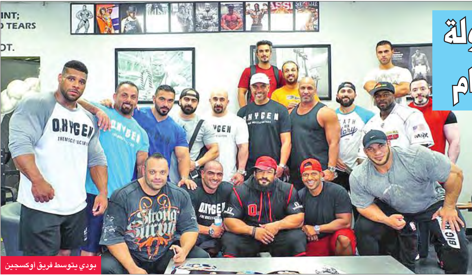
بودي يتوسط فريق أو كسجين

للظلم من قبل اتحاداتهم الأهلية بمنعهم من المشاركة، بالحصول على كروت الاحتراف سالفة الذكر.