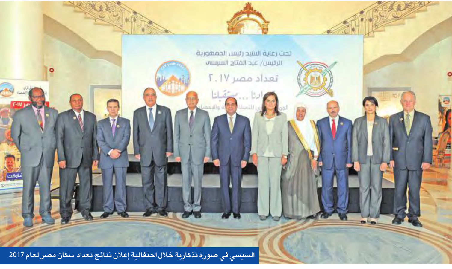
السياسي في صورة تذكارية خلال احتفالية إعلان نتائج تعداد سكان مصر لعام 2017