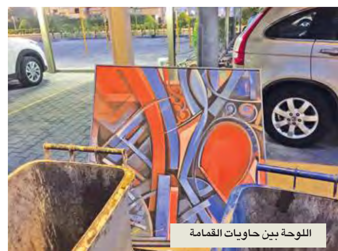
اللوحة بين حاويات القمامة