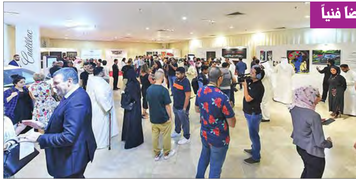
صورة جانبية للمعرض الفني