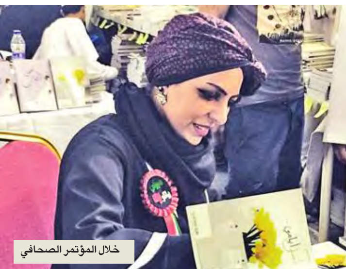
خلال المؤتمر الصحفي

● تتناول في «انتخبوا فاطمة» الانتخابات والديمقراطية