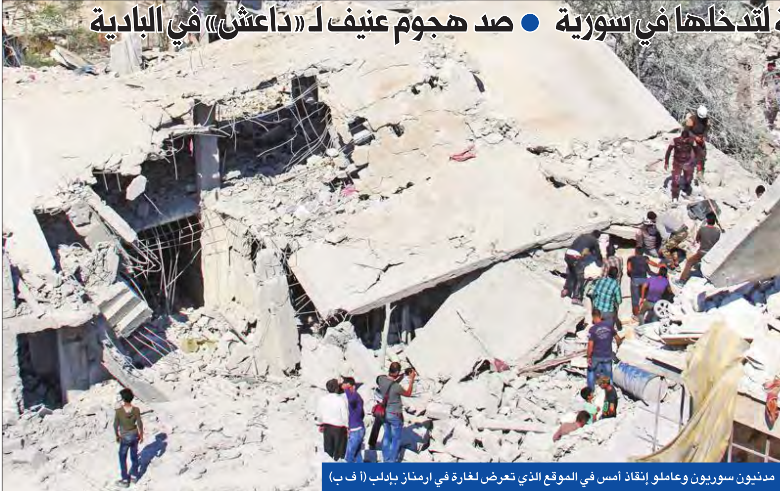
مدنيون سوريون وعاملو إنقاذ أمس في الموقع الذي تعرض لغارة في ارمناز بإدلب

في خطوة قد تساهم في دفع التسوية الدولية لحل الأزمة السورية، بدأت الشرطة العسكرية التركية تنفيذ انتشار في محافظة إدلب بالكمال، على وقع غارات روسية وسورية تهدف إلى تصفية ما تبقى من جماعات مسلحة هناك.