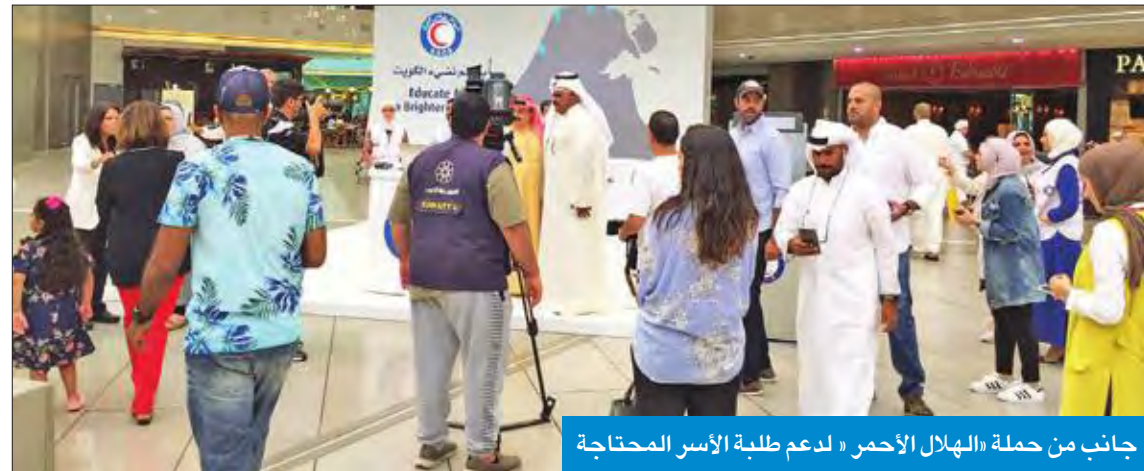
جانب من حملة «الهلال الأحمر» لدعم طلبة الأسر المحتاجة

الحساوي: جناح خاص في «الأفنيوز» لاستقبال التبرعات حتى 12 الجاري