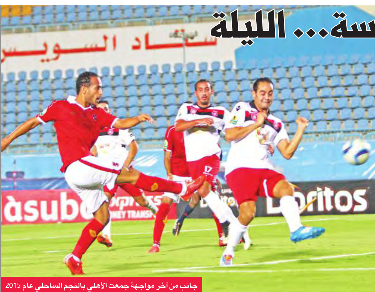
جانب من آخر مواجهة جمعت الأهلي بالنجم الساحلي عام 2015