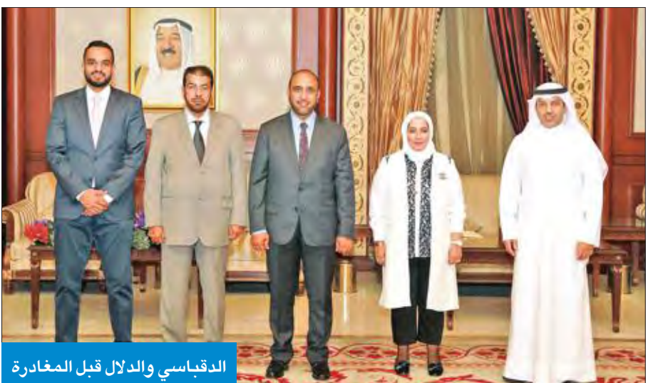
الدقاسي والدلال قبل المغادرة

يقوم وفد مجموعة الصداقة البرلمانية السابعة برئاسة النائب علي الدقاسي بزيارة رسمية إلى جمهورية سنغافورة خلال الفترة من 1 - 3 الجاري.