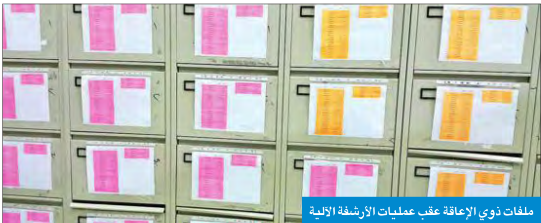
ملفات ذوي الإعاقة عقب عمليات الأرشفة الآلية

الصرف «الآلي» أظهر استفادة 769 من الأصحاء و1122 يحملون درجات إعاقة أعلى من حالاتهم الحقيقية