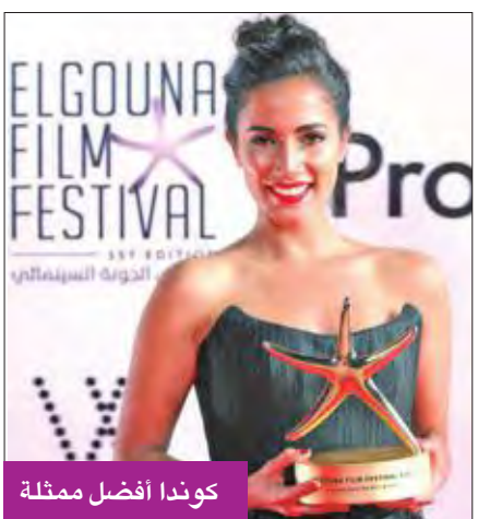
كوندا أفضل ممثلة

وأقيم هذا المهرجان بمبادرة من رجلي الأعمال المصريين الأخوين نجيب وسميح ساويرس، علماً بأن معظم المهرجانات تؤمّل عادة من الوزارات أو المؤسسات العامة المعنية، مثل: مهرجان القاهرة السينمائي الدولي، ومهرجان الإسكندرية لسينما حوض البحر الأبيض المتوسط، ومهرجان الأقصر للسينما الإفريقية، ومهرجان شرم الشيخ للسينما العربية الأوروبية.