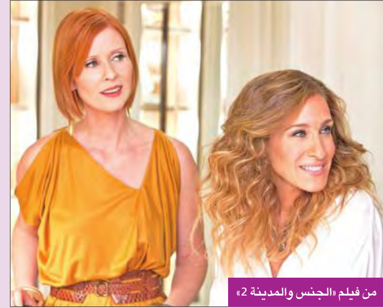
من فيلم «الجنس والمدينة 2»

منذ المسلسل التلفزيوني، وهن باركر وكاترال وسينثيا نيكسون وكريستين دافيسن رغم الاستقبال الفاتر من النقاد للجزء الثاني من الفيلم الذي صدر في 2010 ودارت أحداثه في أبوظبي. ولم تفصح باركر عن أسباب إلغاء خطط الجزء الثالث، لكن كاترال نفت أنها المسؤولة عن الإلغاء، فيما أوضحت في ذات الوقت أنها لا تؤيد الفكرة.