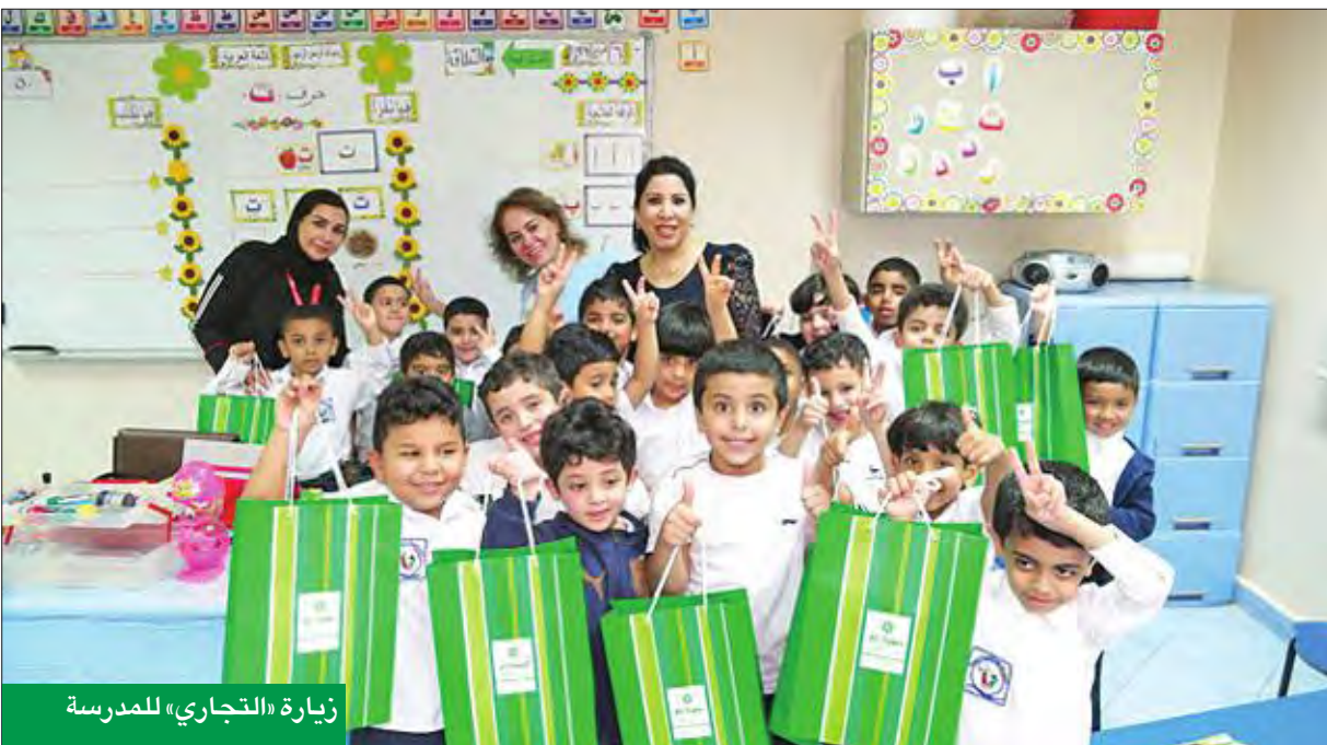
زيارة «التجاري» للمدرسة

وتقدير لإدارة البنك على اهتمامه وزيارته لطلاب مدرسة الفضل بن العباس الابتدائية، متمنين للبنك التوفيق والنجاح في مساعيه النبيلة وعمله الدؤوب لخدمة شرائح المجتمع كافة.