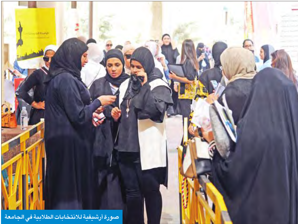
صورة أرشيفية للانتخابات الطلابية في الجامعة

بأفضل صورة، مشيدا بجهود اللجان والفرق والطاقت المنبثقة من اللجنة العليا. وأوضح أن مشاركة طلبة الجامعة بالانتخابات الطلابية في الجمعيات العلمية تعكس مدى الوعي النقابي لطلبة جامعة الكويت واهتمامهم بالعملية الانتخابية.