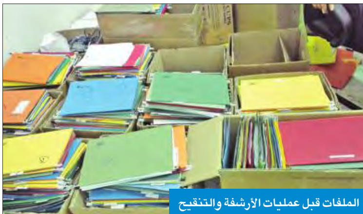
الملفات قبل عمليات الأرشفة والتفتيح

زيادة 120 حالة جديدة عن شهر أغسطس الذي صرفت خلاله لـ 4028 حالة، هذه الحالات الجديدة زادت الصرف على هذا البند بواقع 36 ألف دينار شهرياً.