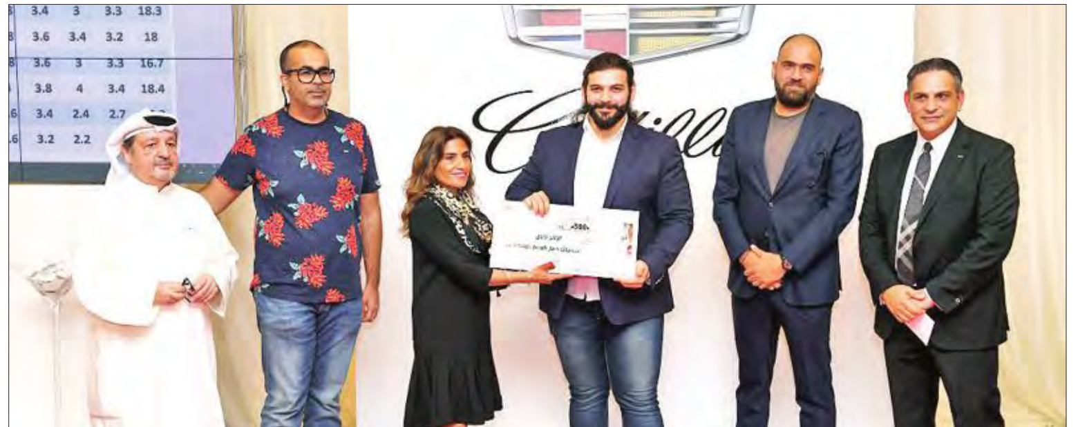
جانب من تكريم المشاركين