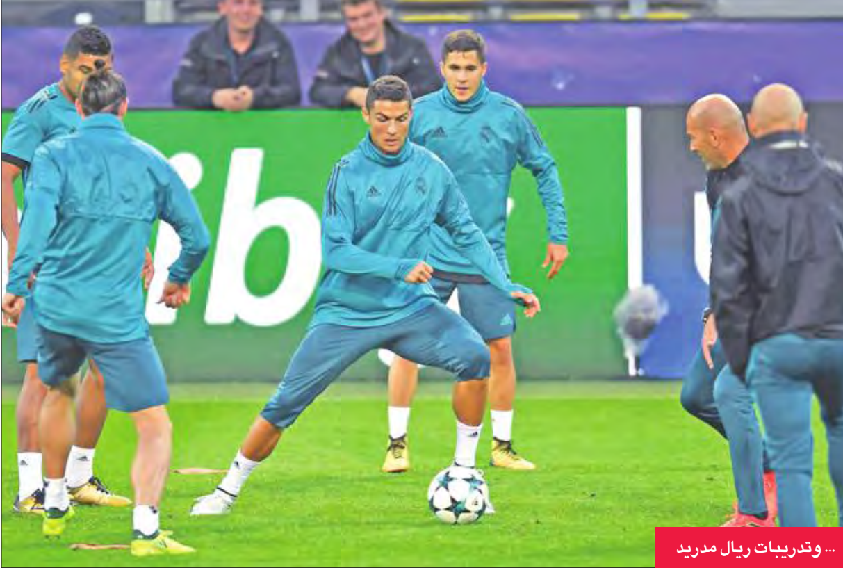
... وتدريب ريال مدريد