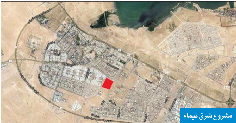
مشروع شرق تيماء

طرحت المؤسسة العامة للرعاية السكنية، أمس، مناقصة لأول مشاريعها لخدمة «من باع بيته» لإنشاء وإنجاز وصيانة 509 بيوت في مشروع شرق تيماء، مع أعمال الطرق وشبكات البنية التحتية ومواقف السيارات والمباني العامة ومحطات الكهرباء الفرعية، على أن يكون الإقبال في 26 ديسمبر المقبل، وتعكف «السكنية» على تجهيز البيوت لأصحابها من المواطنين، تنفيذاً للقانون الصادر بشأن فئة «من باع بيته» من المشمولين بالقانون للسكن على شكل ارتفاع بصفة إيجار بمبالغ رمزية. وأشارت المؤسسة إلى أنها حددت المناقصة على 11 شركة محلية وهي: الأحمدي، المقاولون العرب، الخليج المتحدة، الغانم إنترناشونال، اتحاد المقاولين، المنشآت المتحدة، كتر، المبانى المتحدة، ساي، سيد حميد وخالد الخرافي، ونوهت بأنه سيبستبعد من قائمة المقاولين المؤهلين التي يتم اعتمادها للاشتراك بالمناقصات المقاولون الذين لم