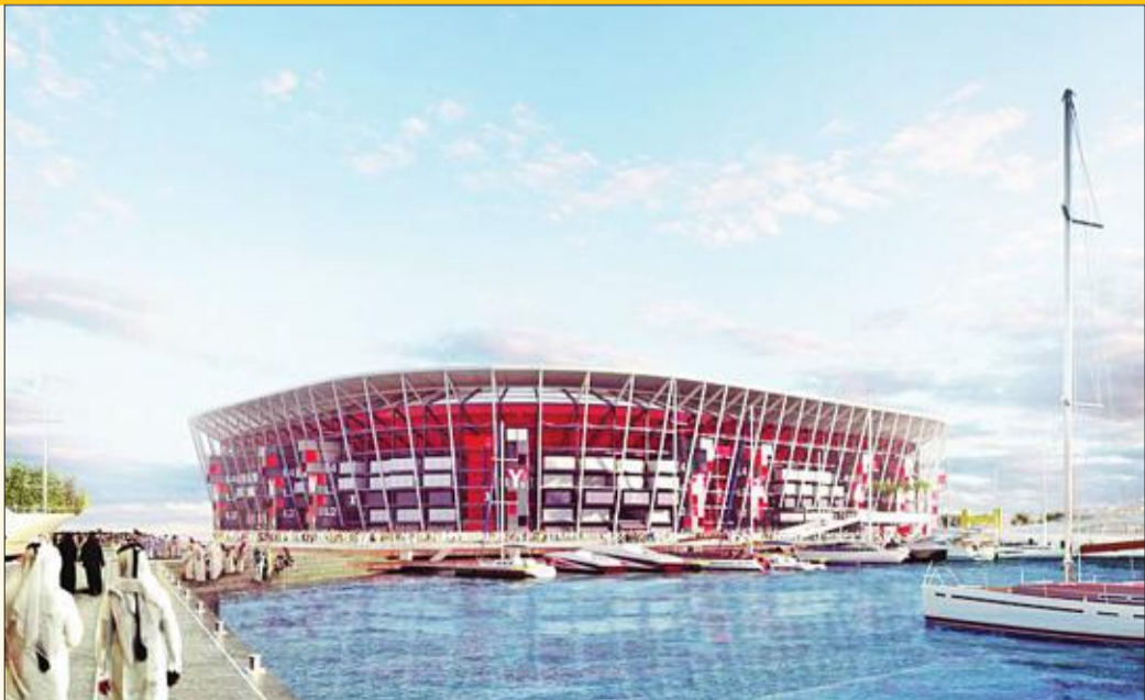
استاد «راس أبوعبود»

راس أبوعبود، وذلك ضمن مسار الخط الذهبي للمترو، ومن المحتمل أيضاً أن يكون الوصول إلى الاستاد ممكناً عبر الناكسي البحري.