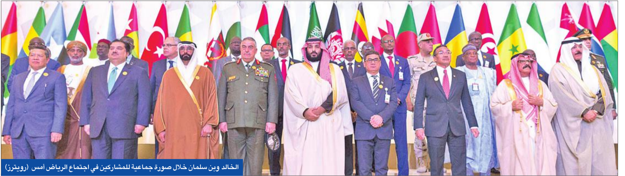
الخالدين وسلمان خلال صورة جماعية للمشاركين في اجتماع الرياض أمس

زيادة التنسيق وتبادل المعلومات والبيانات بين الدول في هذا المجال، وتطوير النظم والإجراءات الخاصة بحرمان الإرهاب من أي مصادر مالية. وأعربت دول التحالف عن التزامها بتأمين القدرات العسكرية والموارد اللازمة لإضعاف التنظيمات الإرهابية والقضاء عليها بالدول التي تعاني منه.