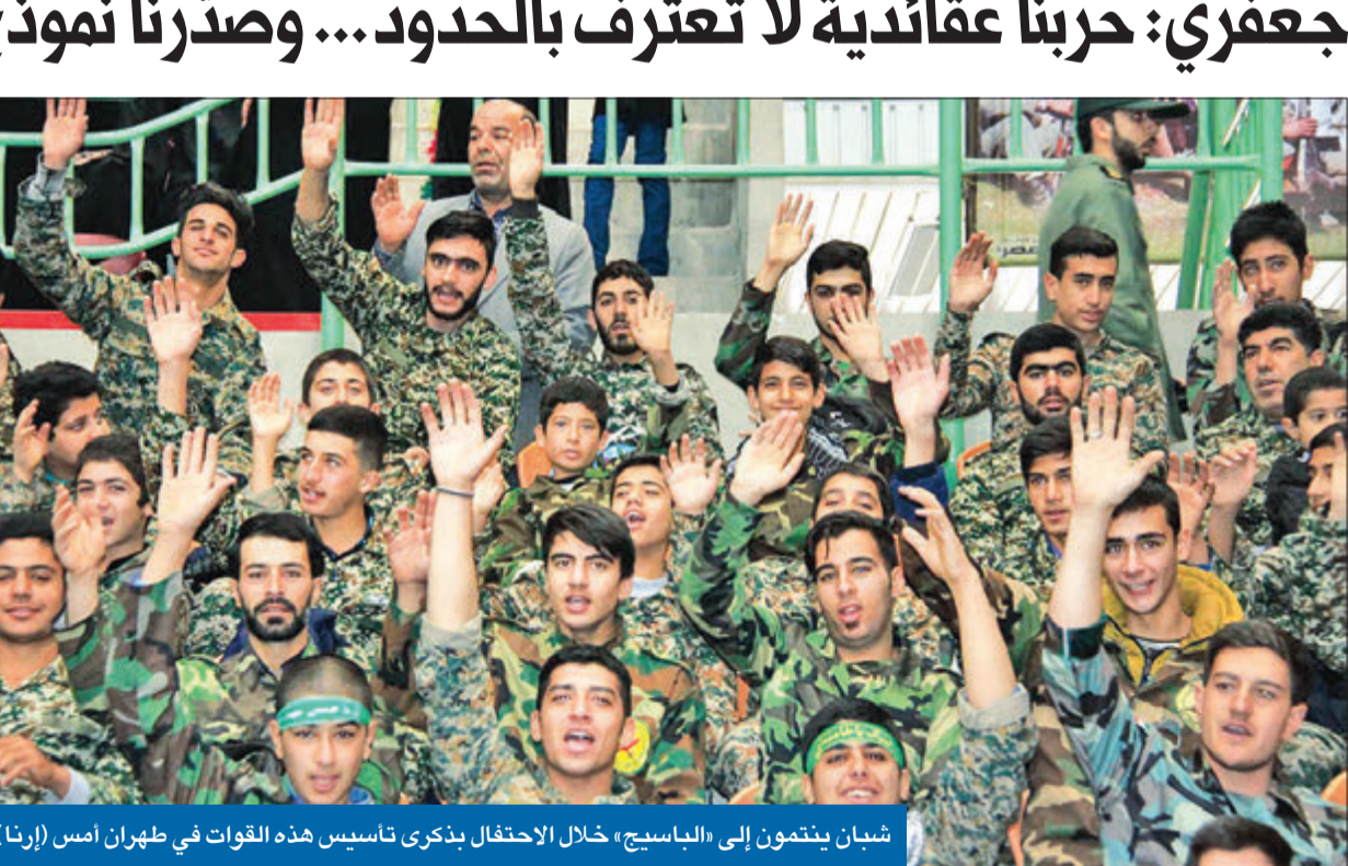
شبان ينتمون إلى «الباسيج» خلال الاحتفال بذكرى تأسيس هذه القوات في طهران أمس (إرنا)

وسط تحذيرات دولية من خطر البرنامج الصاروخي الإيراني، وفي تصعيد غير مسبوق، هدّدت إيران، أمس، أوروبا، بزيادة مدى صواريخها الباليستية لتصل إلى دولها. وفي احتفال بمرور 39 عاماً على تأسيس «قوات الباسيج» أمس، حذر نائب قائد الحرس الثوري الإيراني، اليريجادير جنرال حسين سلامي، أوروبا من أن «الحرس» سيزيد مدى صواريخه لأكثر من ألفي كيلومتر إن هي هدّدت طهران. وأوضح أنه «إلى الآن، نشعر أن أوروبا لا تمثل تهديداً، لذلك لم نزيد مدى صواريخنا، ولكن إذا كانت تريد أن تتحول إلى تهديد فسيزيد ذلك المدى». وخلال الحفل نفسه، قال قائد الحرس محمد جعفري إن حربنا مع العدو عقائدية، ولا تعرف الحدود والجغرافيا، لافتاً إلى أن «الحرب السورية، حرب عالمية حقيقية وانتهت بفضل الاستكبار، وانتقلت تجربة الباسيج إلى باقي البلدان». وذكر جعفري أن «الباسيج نموذج للمقاومة، وتجلّى في حزب الله بلبنان، والحشد الشعبي في العراق، وقوات الدفاع الوطني بسورية، والأمير كذلك في اليمن ودول أخرى».