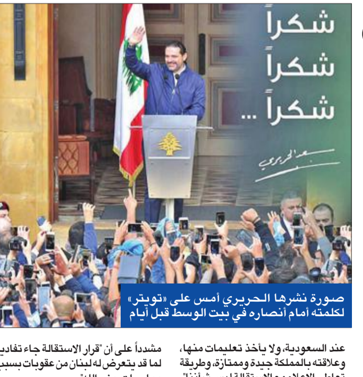
صورة نشرها الحريري أمس على «تويتر» لکلمته أمام أنصاره في بيت الوسط قبل أيام

وقال الحريري: «لبنان اليوم يشهد عاصفة» وأضاف: «لبنان في هذا الموقع».