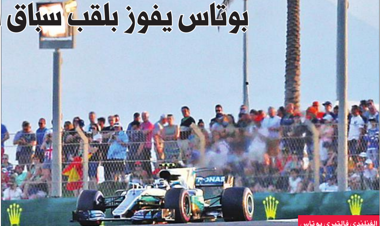
الفنلندي فالتييري بوتاس

سابقا، سائق فريق مرسيدس، أمس، بلقب سباق جائزة أبوظبي الكبرى، آخر سباقات بطولة العالم لسباقات سيارات فورمولا 1، ولكن هذا الفوز لم يكن كافيا لبوتاس لاحتلال المركز الثاني في منافسات ترتيب السائقين خلف زميله بالفريق لويس هاميلتون. وحقق بوتاس لقبه الثالث هذا الموسم، وفي مسيرته، متفوقا على هاميلتون، الذي جاء في المركز الثاني، وسيباستيان فينتيل، سائق فيراري، الذي حل ثالثا. وأنهى هاميلتون، الذي فاز بلقب بطولة العالم للمرة الرابعة في مسيرته قبل سباقين من النهاية وبالتحديد في سباق المكسيك الذي أقيم قبل أربعة