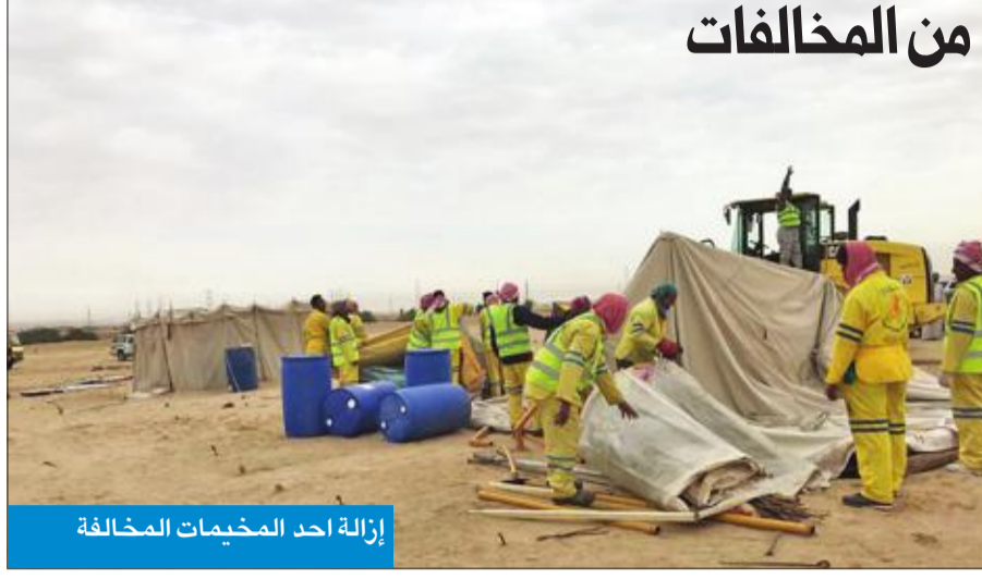
إزالة أحد المخيمات المخالفة

أعلنت إدارة العلاقات العامة ببلدية الكويت انطلاق حملاتها الإعلامية تحت شعار "البر مسؤوليتك"، والتي تستهدف الحد من ظاهرة التخميم في خارج المناطق المسموح بها، وتوعية الجمهور باشتراطات التخميم.