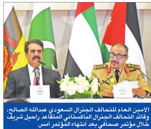
الأمين العام للتحالف الجنرال السعودي عبدالله الصالح، وقائد التحالف الجنرال الباكستاني المتقاعد راجيل شريف خلال مؤتمر صحفي بعد انتهاء المؤتمر أمس.

بحث نائب رئيس مجلس الوزراء وزير الدفاع الشيخ محمد الخالد، أمس، مع ولي العهد نائب رئيس مجلس الوزراء وزير الدفاع الأمير محمد بن سلمان، سبل تعزيز التعاون الثنائي لمكافحة الإرهاب والتطرف بين الكويت والمملكة. وجرى اللقاء على هامش الاجتماع الأول لوزراء دفاع التحالف الإسلامي المتعدد بالرياض.