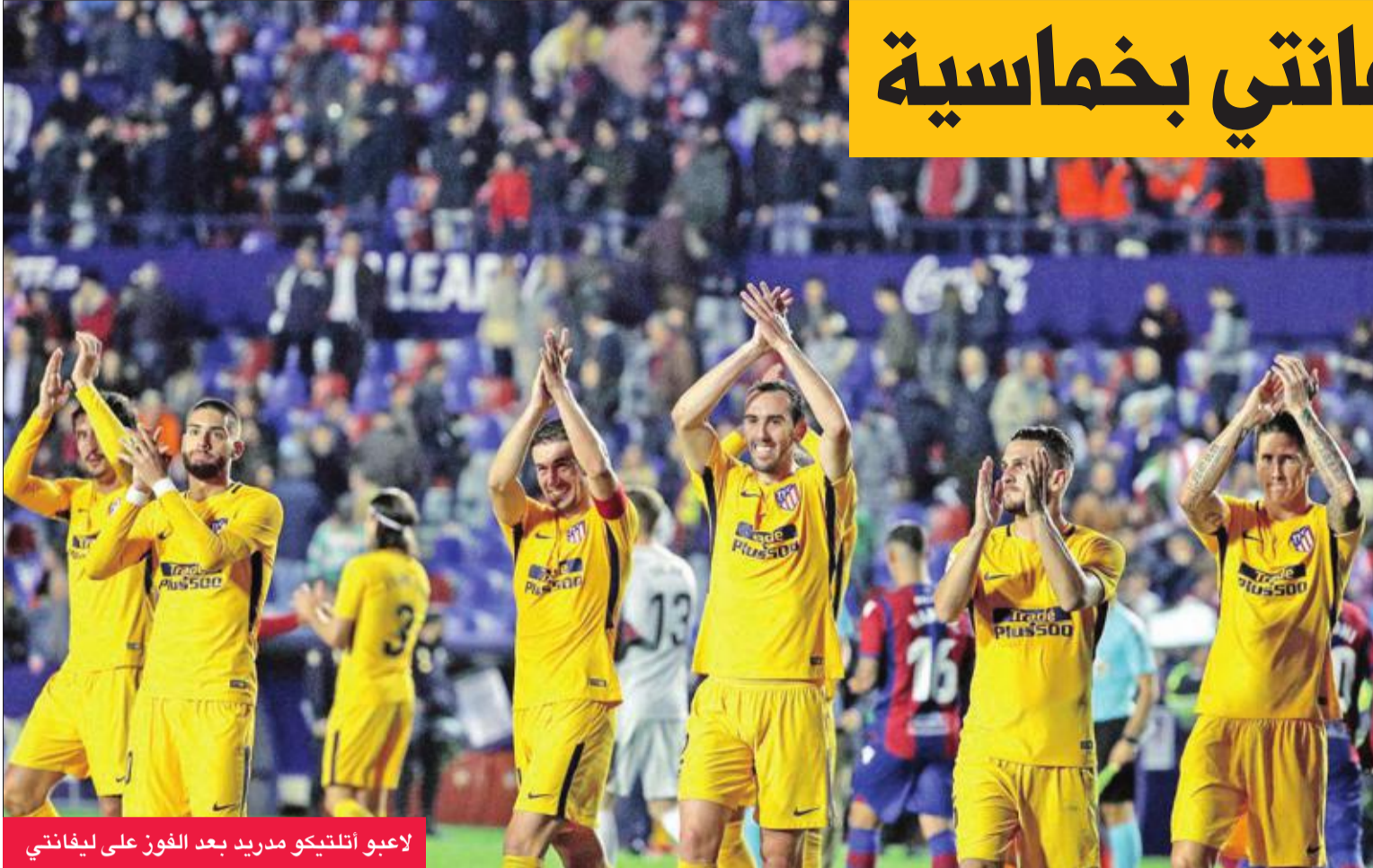
لاعبو أتلتيكو مدريد بعد الفوز على ليفانتي

رصيدته إلى 27 نقطة، منتزعاً المركز الثالث في جدول الترتيب من جاره الريال بفضل فارق الأهداف. وفي المقابل، توقف رصيد ليفانتي عند 15 نقطة وضاعته مؤقتاً في المركز الثالث عشر، إلى حين اكتمال باقي اللقاءات. من جانب آخر، ختم التعادل الإيجابي 2-2 على مباراة ديپورتيفو لاكورونا مع ضيفه أتلتيك بلباو أمس. وتقدم ماركيل سوسايتا بهدف لبلباو في الدقيقة 16، ثم تعادل أدريان لوبيز الفاريز لأصحاب الأرض في الدقيقة 35. وفي الشوط الثاني أضاف اينياكي وليامس الهدف الثاني لبلباو في الدقيقة 60، لكن فابيان شار أدرك التعادل لديپورتيفو في الدقيقة 76. وحصد كل فريق نقطة واحدة، ويرفع بلباو رصيده إلى 13 نقطة في المركز الخامس عشر مقابل 12 نقطة لديپورتيفو في المركز السابع عشر.