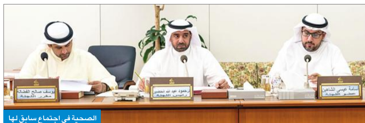
الصحية في اجتماع سابق لها

الخضير: اجتماعات مكثفة لإقرار القوانين المهمة للمواطنين