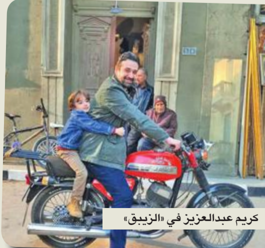
كريم عبدالعزيز في «الزيبق»