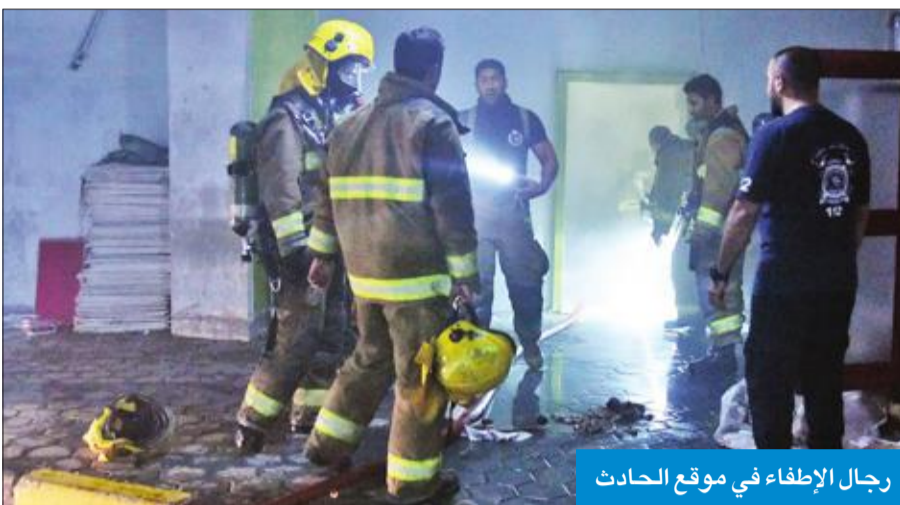
رجال الإطفاء في موقع الحادث

مجمع تجاري، مشيراً إلى أنه، فور تلقي البلاغ، تم تحريك مركزي إطفاء حولي والسالمية إلى موقع الحادث، وتم إرسال سيارات الإطفاء، فور وصولهم، تبين لهم أن الحريق اندلع في سرداب المجمع والمقسم إلى قسمين الأول يستخدم كمخزن للملابس، والأخر مواقف للسيارات، مشيراً إلى أن رجال الأمن شرعوا في إخلاء المجمع من رواده والعاملين فيه، كما تم إخلاء جميع المركبات الموجودة بالسرداب، ومن ثم شرعوا في مكافحة الحريق والسيطرة عليه ومنع انتشاره