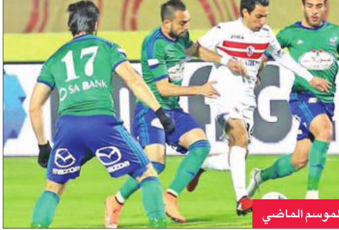
الزمالك والمقاصة في الموسم الماضي

بتروجيت بهدفين دون رد في الجولة التاسعة، وتاجلت مباراته مع الزمالك في الجولة العاشرة. وبحثل طلائع الجيش المشرك في مواجهة الثاني عشر برصيد 11 نقطة، فيما يتقع النصر في المركز السابع عشر بـ4 نقاط.