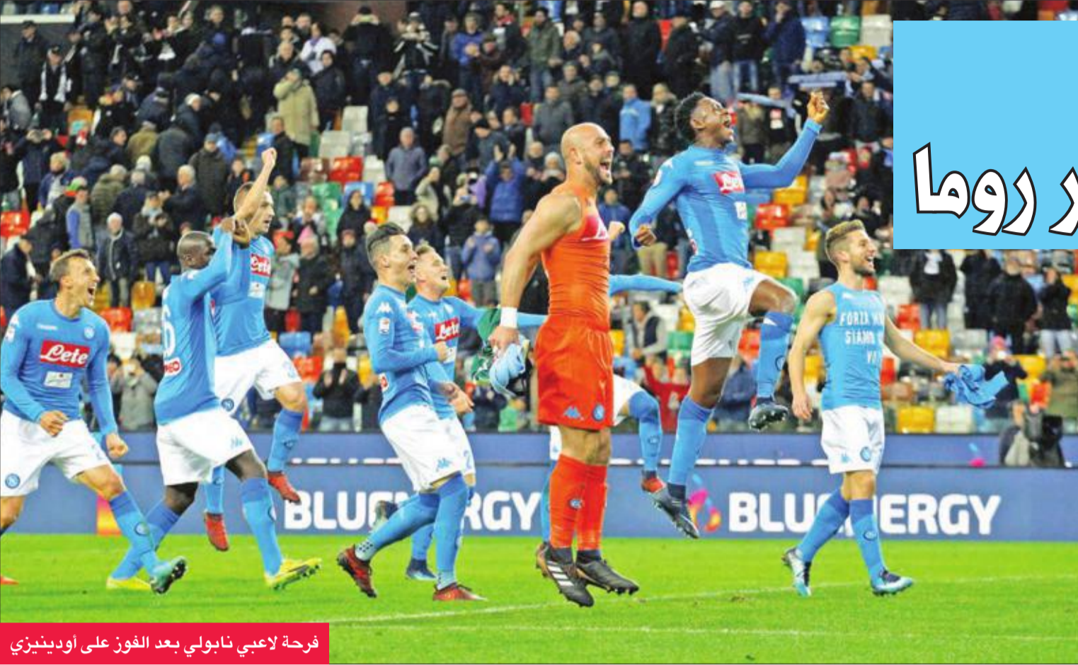
فرحة لاعبي نابولي بعد الفوز على اودينيزي

هذا الموسم وتعادل مع نابولي. وحقق فيرونا وصيف القاع فوزا الأول بعد 5 خسارات متتالية، من أرض ساسوولو السادس عشر بهدف اودينيزي برونو تسوكولوني (22) ودانيلي فيردي (31)، قبل أن يطرد له توماس اورتو (67).