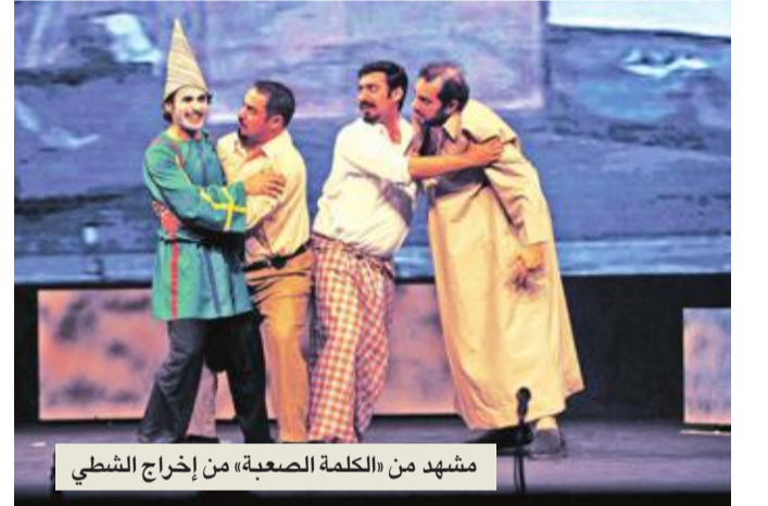
مشهد من «الكلمة الصعبة» من إخراج الشطي

كذلك نحضر لمسرحية جماهيرية أخرى بعنوان «الفتفت»، تأليف حسن المتروك وإخراجه، طبعا لا يعرفه كثيرون من الجيل