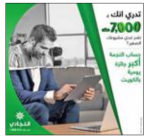
تدري الفل، 7000 دولار، 2000 دولار، 1000 دولار، 500 دولار، 250 دولار

أجرى البنك التجاري الكويتي السحب اليومي على حساب النجمة، أمس، في المركز الرئيسي للبنك، لاختيار 5 من العملاء أصحاب هذا الحساب للفوز بجائزة قدرها 7000 دينار لكل واحد منهم، وأسفر السحب الذي تم بحضور وزارة التجارة عن فوز: