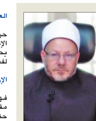
ممثلون الإسلام إطلاقاً، فهم يعيدون تماماً عن الدين الإسلامي ومفاهيمه الصحيحة، والعقيدة التي يستند إليها الإرهابيون لا تعبر مطلقاً عن الدين الإسلامي، بل هي عقيدة فاسدة.

حادث إجرامي هدفه تخفيت نسج الوطن، فكل الأديان السماوية ترفض مثل هذه الأفعال التحريضية وقتل النفس بغير حق، ومن قاموا بهذا الفعل مجرمون لا