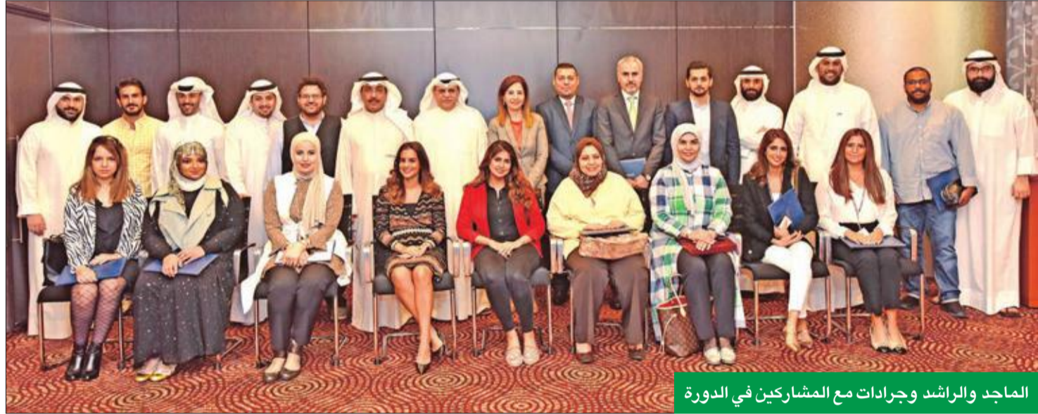
الماجد والراشد وجرادات مع المشاركين في الدورة

الأرقام والبيانات والإحصائيات المالية والمصرفية إلى صور وفيديوهات تبسط المعلومة وتقدمها بطريقة حديثة وعصرية توأمت تطورات العصر.