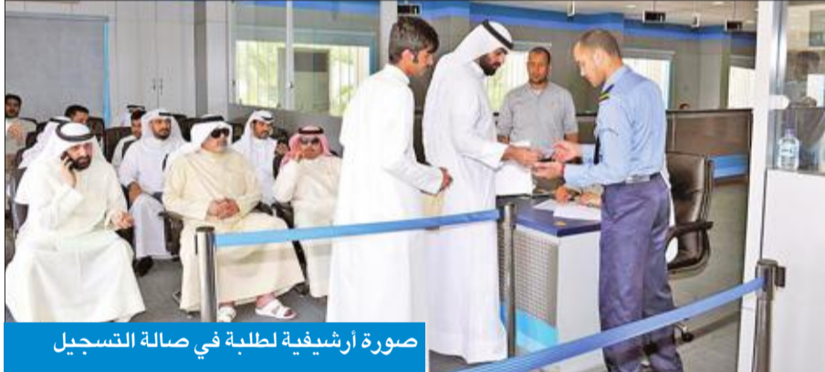
صورة أرشيفية لطلبة في صالة التسجيل

مال الله لـ «الجريدة»: ناقشنا خطة التسجيل مع مساعدي عمداء الكليات رئيس «جمعية التربة» لـ «الجريدة»: استكمال الجداول الدراسية كلها مستحيل