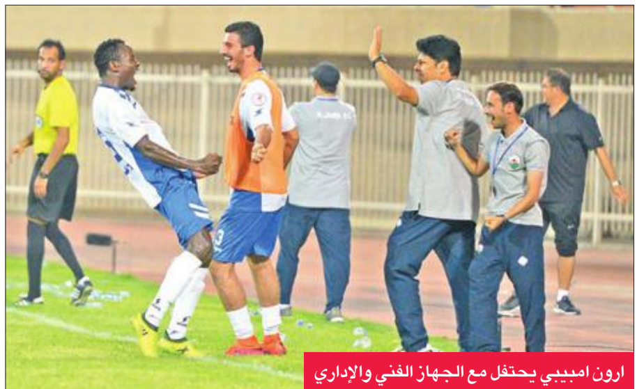
ارون امبيبي يحتفل مع الجهاز الفني والإداري

مساء أمس الأول، مؤكداً أنه انتصار مهم للفريق الساعي بقوة إلى انتزاع إحدى البطاقتين المؤهلين للدور نصف النهائي من المجموعة الثانية في كأس ولي العهد. وقال علي «راضون عن المستوى بشكل عام، فبعد شوط أول غير مرض على مستوى التهديف واكتفاؤنا بهدف وحيد، تمكن اللاعبون من حسم المباراة