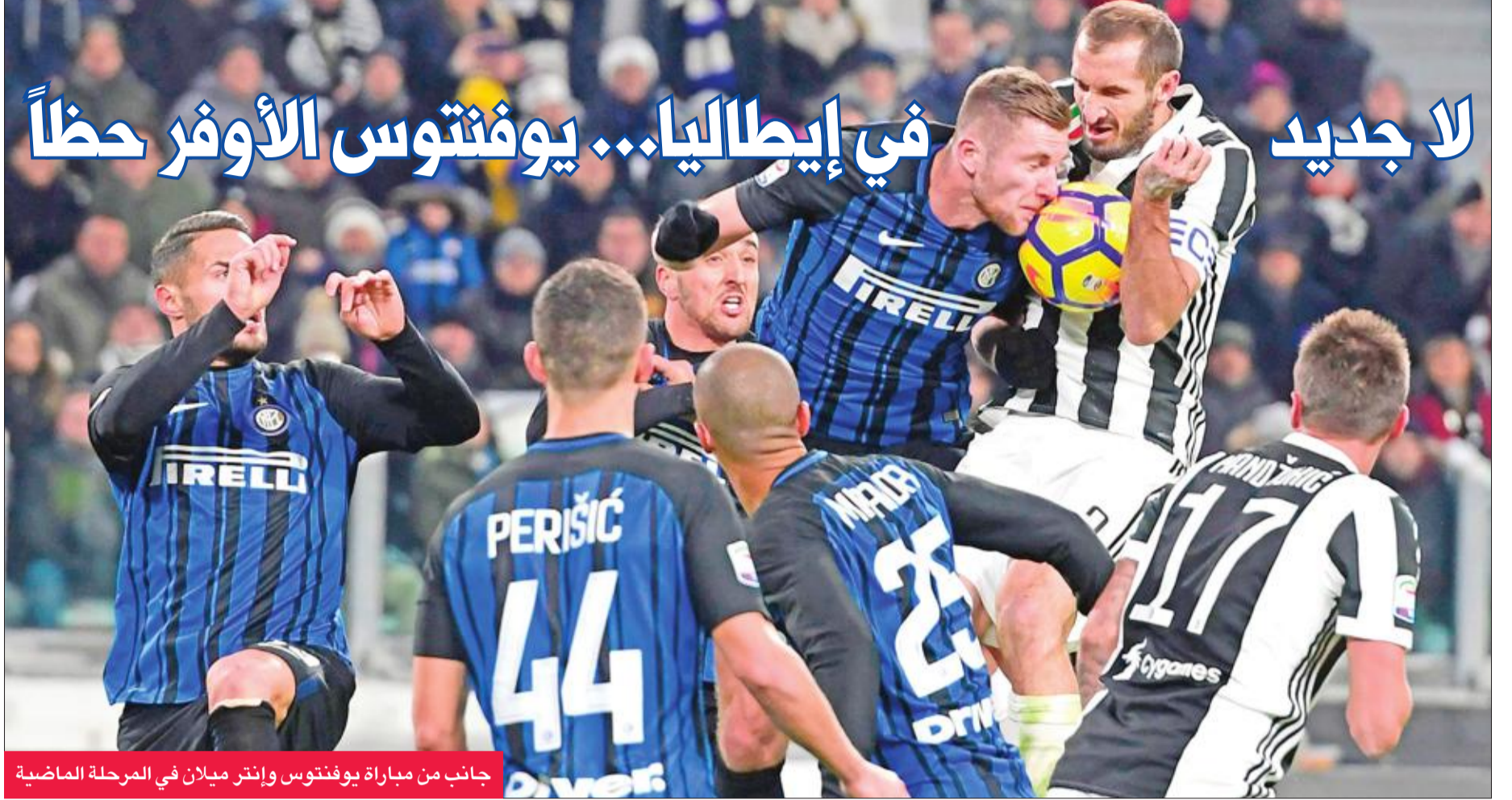
جاناب من مباراة يوفنتوس وإنتر ميلان في المرحلة الماضية