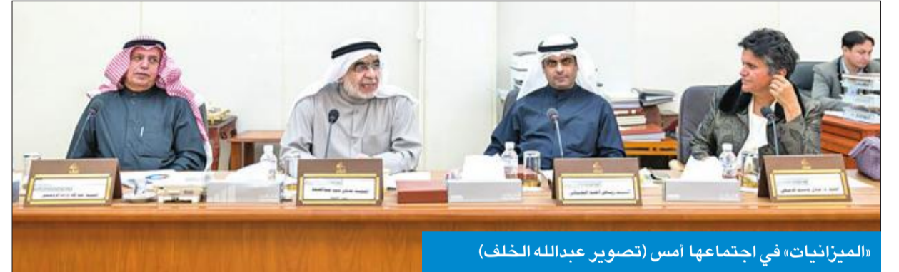
«الميزانيات» في اجتماعها أمس

وبينت أن ديوان الخدمة وممثلي الجهات الحكومية اشتكوا في لجنة الميزانيات مرارا وتكرارا غياب التنسيق الحكومي حول مسألة ربط مخرجات التعليم بحاجة سوق العمل، مشددة على أن غياب التنسيق والتخطيط في الحكومة لا يقتصر فقط على الجهات التعليمية.