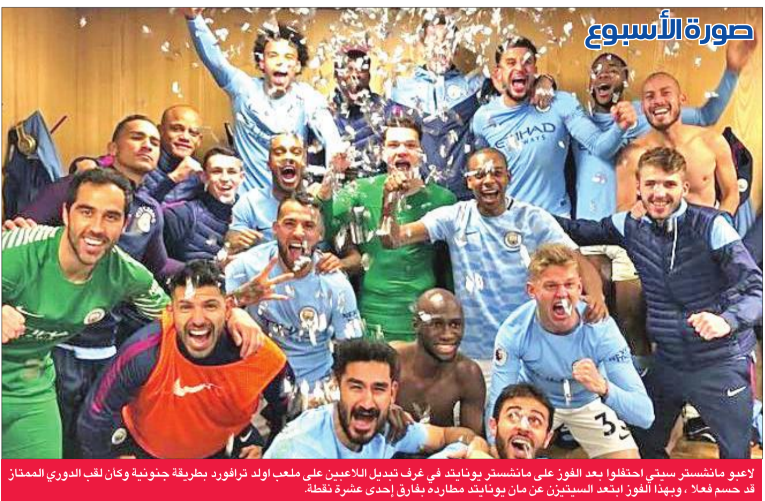
لاعبو مانشستر سيتي احتفلوا بعد الفوز على مانشستر يونايتد في غرف تبديل اللاعبين على ملعب اولد ترافورد بطريقة جنونية وكان لقب الدوري الممتاز قد حسم فعلاً، وبهذا الفوز ابتعد السيتيز عن مان يونايتد مطارده بفارق إحدى عشرة نقطة.

• إنتر ميلان أنهى سلسلة يوفنتوس التي بلغت 44 مباراة على التوالي، بنجح خلالها الفريق في إحراز هدف على الأقل في كل مباراة، كما أنها المباراة الأولى التي يتعادل بها يوفنتوس -صفر-صفر منذ فبراير 2016، وبعد خوض 65 مباراة. • كونتي تلقى 9 هزائم منذ توليه تدريب تشلسي، كانت 5 منها في مباريات ديربي لندن أمام كل من كريستال بالاس، وارسنال، وتوتنهام ووست هام. • يفوزه على تشلسي، ديفيد موييس مدرب وست هام يحقق فوزه الأول على أرضه منذ عام، بعد 11 مباراة خاضها على أرضه خسر في 6 وتعادل في 5 مواجهات. • محمد صلاح نجم ليفربول أحرز 19 هدفاً في جميع المسابقات مع ليفربول هذا الموسم، نفس رصيد أهدافه مع نادي روما الموسم الماضي، التي خاض خلالها 41 مباراة. • شارلي أوستن نجم ساوثهامبتون أحرز 3 أهداف أمام أرسنال في ثلاث مواجهات لعبها أمامه، ويعتبر من بين أفضل ستة لاعبين انكليز هدفين منذ بداية موسم 2014-2015 بإحرازه 30 هدفاً. • يفوزه على نادي سبال، ميلان يحقق أول فوز على أرضه منذ 20 سبتمبر، كما أنهى بونافينورا نجم الروسونيري صيام ميلان عن التسجيل على أرضه، والذي امتد إلى 399 دقيقة. • مورينيو خسر 9 مواجهات أمام غوارديولا مع جميع الفرق التي أشرف عليها المدرب، ليصبح المدرب البرتغالي الضحية الأبرز للعبقري الإسباني. • ديفيد سيلفا نجم مانشستر سيتي أحرز 6 أهداف أمام مانشستر يونايتد في الدوري الإنكليزي الممتاز، 5 منها سجلت على ملعب "اولد ترافورد".