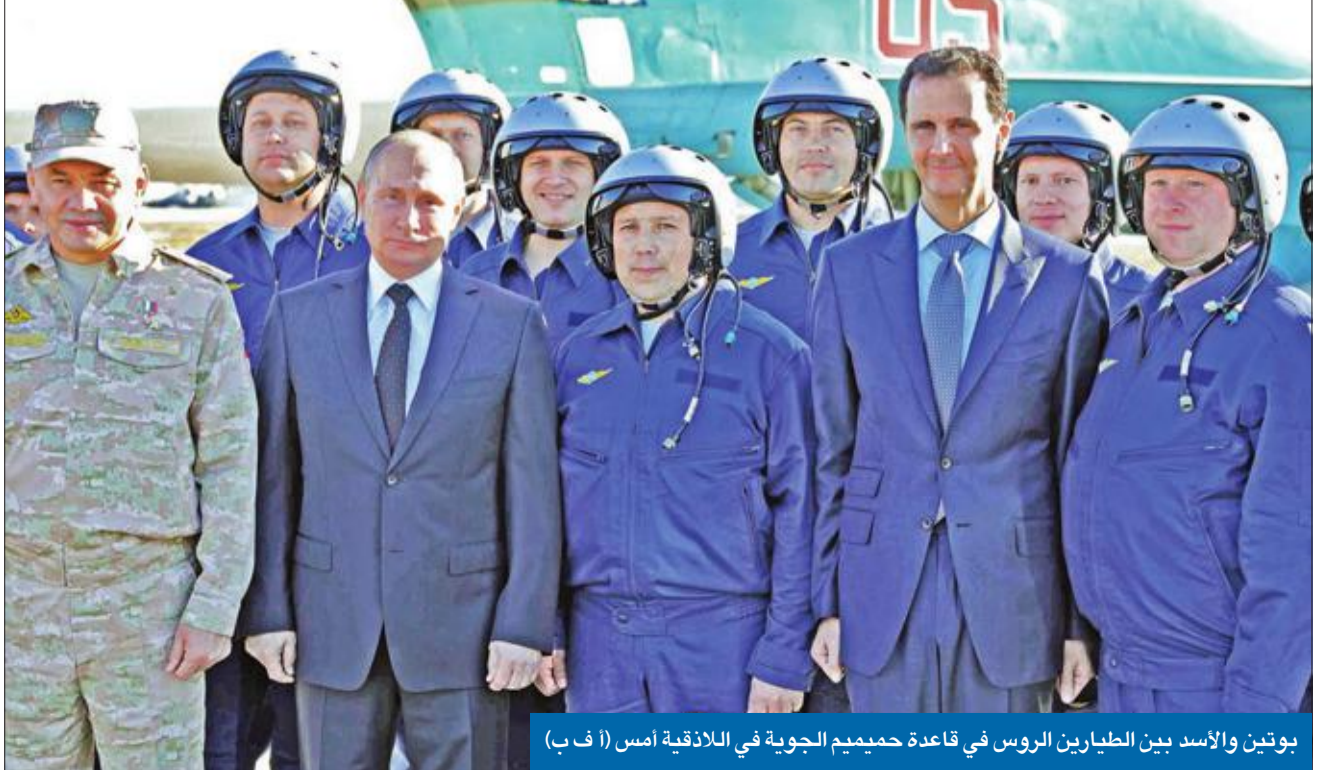
بوتين والأسد بين الطيارين الروس في قاعدة حميميم الجوية في اللاذقية أمس (أ ف ب)

أجرى الرئيس الروسي فلاديمير بوتين أمس جولة مكوكية شملت سورية ومصر وتركيا، تركزت حول تسريع حل الأزمة السورية، بالتزامن مع انتهاء الحرب على «داعش»، ودخول المنطقة مرحلة جديدة. وبدا بوتين، الذي أعلن منذ أيام ترشحه للانتخابات الرئاسية، جولته، من محطة غير معلنة بسورية، حيث زار قاعدة حميميم الروسية في الألفية شمال غرب البلاد، والتقى هناك الرئيس بشار الأسد، ليعلن انسحاباً جزئياً للقوات الروسية بعد أيام من تأكيد الجيش الروسي إنجاز المهمة ودحر تنظيم «داعش». ثم توجه الرئيس الروسي إلى القاهرة والتقى نظيره المصري عبدالفتاح السيسي، مؤكداً أن الأخير يدعم الحل السياسي الذي تقترحه موسكو في سورية. وعن قضية القدس، دعا بوتين إلى مفاوضات مباشرة بين الإسرائيليين والفلسطينيين تتناول كل الملفات، بما فيها وضع المدينة المقدسة، في سورية مستمراً.