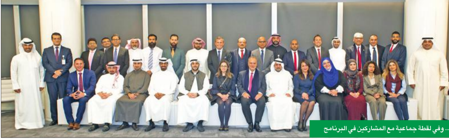
... وفي لحظة جماعية مع المشاركين في البرنامج