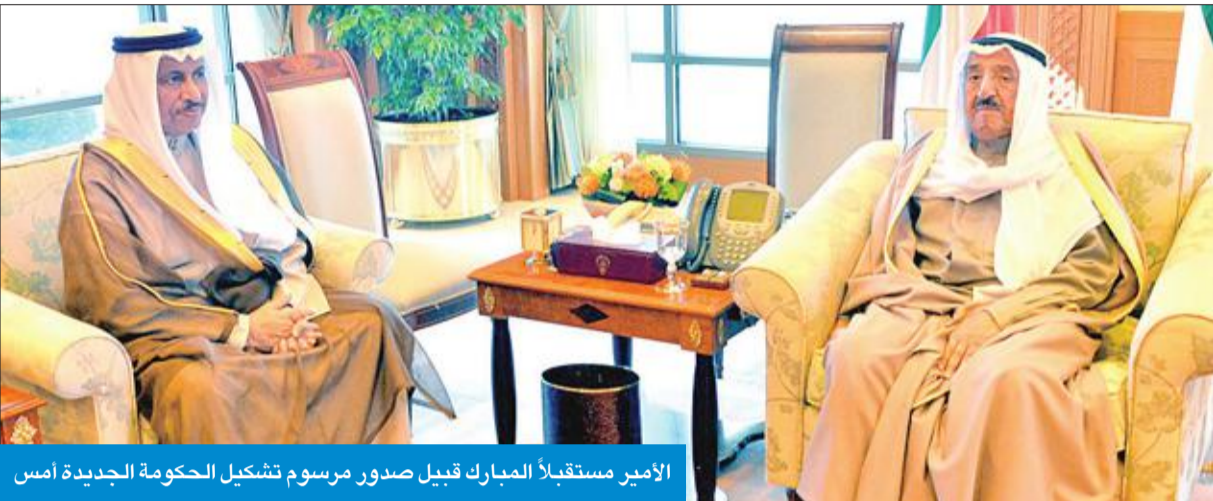
الأمير مستقبلاً المبارك قبيل صدور مرسوم تشكيل الحكومة الجديدة أمس

إليه جميعاً من العطاء والإنجاز. فإن حاز هذا الترشيح قبولاً لدى سموكم، تفضلتم بإصدار المرسوم اللازم بتشكيل الوزارة. وختم المبارك كتابه «أدعو المولى سبحانه أن يعيننا جميعاً على أداء الأمانة التي ارتضينا مسؤولياتها وحملنا على عاتقنا واجباتها، وأن يحقق بالخير أملنا، ويكتب لنا التوفيق فيما نصبو إليه لرفعة وطننا الغالي في ظل قيادتكم الحكيمة وتوجيهاتكم السديدة».