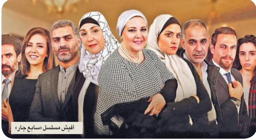
أفيش مسلسل «سابع جار»