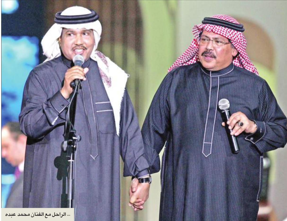
...الراحل مع الفنان محمد عبده

رحم الله أستاذنا الكبير، أبوبكر سالم، نسال الله أن يسكنه فسح جنازته، في حين، كتب عاصي الحلاني على «تويتتر»: «وداعاً أبوبكر سالم، رح يتصل عابش معنا بأعمالك وفنك الراقي». وضمن السياق ذاته، قالت شيرين عبدالوهاب: «يرحلون وتبقى أعمالهم خالدة في قلوبنا، رحم الله الفنان القدير أبوبكر سالم». أما الفنانة دنيا بطمة فكتبت رسالة عن الراحل قالت فيها: «انتقل إلى رحمة الله الأسطورة والكبير بفنك الراقي الذي أطرب قلوبنا، وتعلمنا من فنك وصوته الكرواني الكثير، الله يصبر كل أهلك ويصبرنا ويصبر كل أهل الخليج واليمن على فقدك... ستبقى في قلوبنا إلى الأبد». وعبرت الفنانة أسماء لمنور عن حزنها البالغ وكتبت: «يرحمك الله، ويعوض محبتنا لك صبر حبيبي يا أبوصليل،