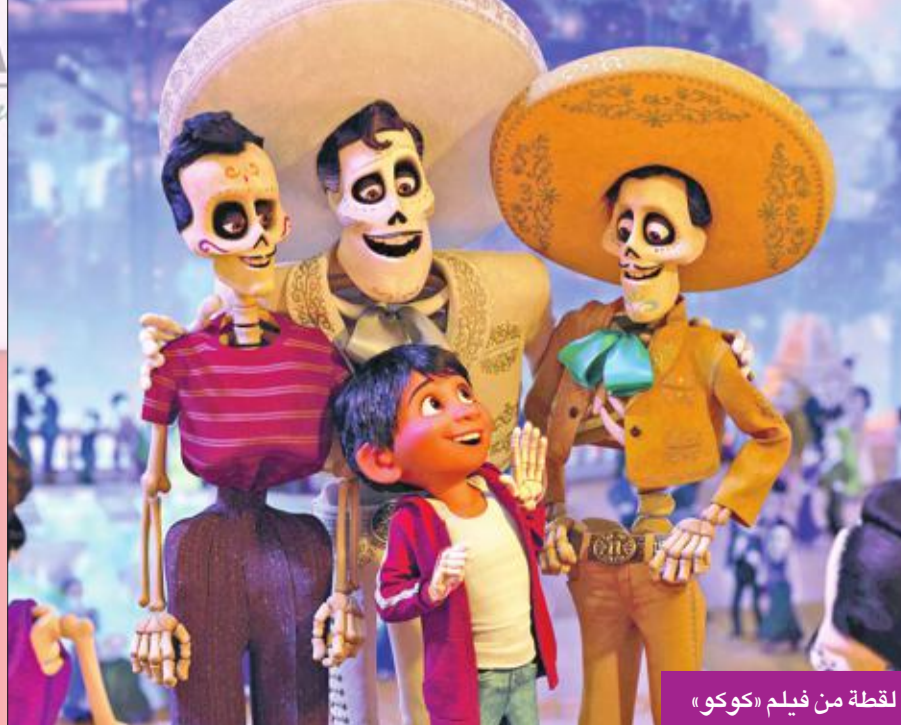
لقطة من فيلم «كوكو»

واصل فيلم الرسوم المتحركة (كوكو) تصدر إيرادات السينما في أميركا الشمالية، للأسبوع الثالث على التوالي، وحصد 18.3 مليون دولار، بعد عرضه في 3748 دار عرض. وولد في الثانية عشرة بُدعي ميچول لدية شغف كبير بالموسيقى، تربي في قرية صاخبة وحيوية بالمكسيك، وسط عائلة تعمل في صناعة الأحذية، والوحيدة بالقرية التي تمنع جميع أنواع الموسيقى، ولاجبال متعاقبة كرهت عائلة ميچول الموسيقي، واعتبرتها لعنة عليهم، لأنه من فترة بعيدة ترك جد العائلة «ميچول» زوجته إمبيلدا، لشغفه بالموسيقى وتاديتها. وحافظ فيلم الحركة والمغامرات (جاستيس لبيغ) على المركز الثاني لهذا الأسبوع، بإيرادات 9.6 ملايين دولار في 3508 دور عرض، والفيلم يبدأ من حيث انتهى فيلم «باتمان فيرساس سوبرمان: دون أوف جاستيس» العام الماضي، أي وفاة سوبرمان، إذ ينضم باتمان إلى