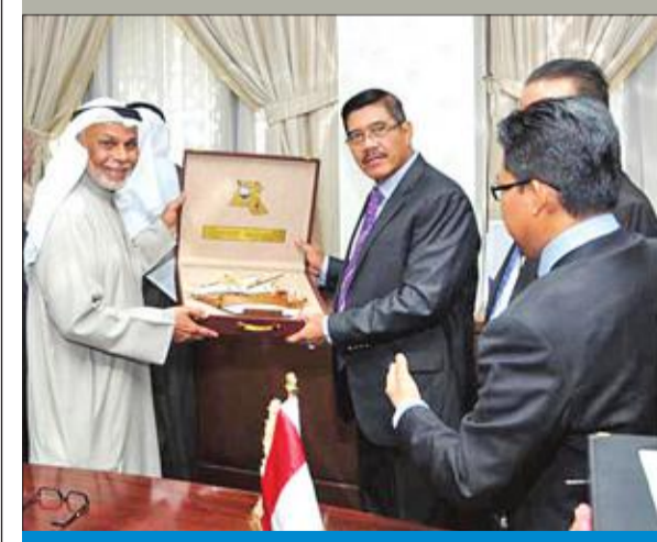
المطاوعة يسلم إلى نظيره الإندونيسي درعاً تكريمية

القضاء ودوره في حماية الحقوق والحريات وتحقيق العدالة». وأشار إلى «أهمية مثل هذه الزيارات المتبادلة، التي تحظى باهتمام المجلس الأعلى للقضاء وجميع رجال السلك القضائي، لإسهامها في تعزيز الروابط القضائية مع الدول الشقيقة والصديقة، وإتاحتها