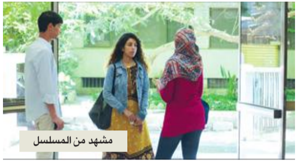
مشهد من المسلسل