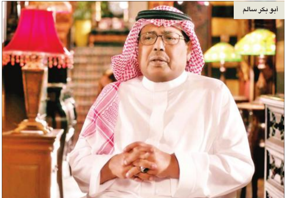
أبو بكر سالم

أجرى رئيس الجمهورية اليمنية عبدربه منصور هادي، اتصالاً هاتفياً بأحمد أبوبكر سالم بلفقيه، حيث عزاه في وفاة والده الفنان الكبير أبوبكر سالم بلفقيه، الذي توفي أمس الأول. وأشاد هادي بمناقب الفقيد الفنان أبوبكر سالم، التي جسدها خلال مشوار حياته الفنية التي أثرى من خلالها الساحة الفنية والثقافية في اليمن والوطن العربي بأعمال غاية في الروعة، من خلال جمال صوته وعبودية كلماته وشجي الحانته. ووفق الموقع الرسمي للرئاسة اليمنية قال هادي إن «الفنان الكبير أبوبكر سالم مدرسة فنية شاملة، وتلمذ على يديه الكثير من الفنانين العرب، وأسهم بشكل كبير في صقل