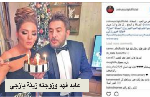
عابد فهد وزوجه زينة يازجي

نشرت الإعلامية زينة يازجي، صورة عبر حسابها الرسمي على إنستغرام، تظهر فيها مع زوجها النجم عابد فهد، وهما يقطعان قالب حلوى احتفالاً بعيد زواجهما، وظهرت بكامل أناتقتهما المعتادة.