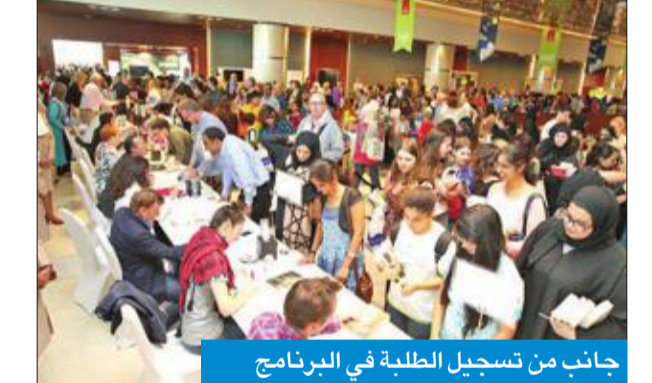
جانب من تسجيل الطلبة في البرنامج

أعلن منظمو مبادرة «برنامج الطلبة العالمي»، الذي يهدف إلى تشجيع طلبة الجامعات، من الكويت ومختلف أنحاء العالم العربي، فتح باب التسجيل في البرنامج، وحضور الجلسات الترية لكبار المثقفين في العالم، والذي يبدأ عام 2018، وسيساعد على التوسع والاستعداد لإكسبو 2020. كما يسعى برنامج الطلبة العالمي إلى تقديم فعاليات تربية ملهمة على مدار ثلاثة أيام لطلاب الجامعات في المنطقة، ولبرنامج دور رئيس في تحقيق أهداف المهرجان في دورته العاشرة، وترسيخ التبادل الثقافي وتداول الأفكار ونشر المعرفة من خلال جلسات ترفيحية غنية بالمعلومات. ويعتبر البرنامج مفتوحاً لجميع الطلبة الجامعيين وطلبة الدراسات العليا، الذين يدرسون في جامعات خارج الأمارة، وسيتمكن الطلاب الذين يشركون في هذا البرنامج من حضور 4 جلسات، ضمن جلسات اليوم الجامعي في 8 مارس 2018. وسيكون للطلبة المشاركين فرصة لحضور ست جلسات رئيسية في برنامج المهرجان، من مجموعة جلسات مخصصة تزيد على 22 فعالية، خلال آخر إجازة أسبوعية في فترة المهرجان. كما وفر المهرجان نظاماً للبرنامج، حيث يتاح للأفراد من الجمهور فرصة للفوز برحلة إلى دبي إذا قام طالب بالتسجيل في برنامج طلبة العالم عن طريقهم، ويمكن للجمهور الاشتراك في السحب من خلال استمارة التسجيل على الإنترنت.