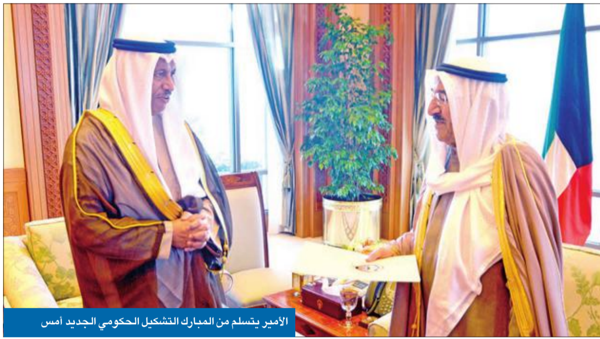
الأمير يتسلم من المبارك التشكيل الحكومي الجديد أمس

القاضي بتشكيل الحكومة الجديدة. وبينا تمنى رئيس مجلس الأمة مرزوق الغانم للحكومة الجديدة التوفيق، مشدداً على أن تقييمها يكون بالأداء لا بالأسماء، أعلن أنه تم الاتفاق معها على تأجيل مناقشة قضية القدس، والقرار الأميركي بنقل سفارة واشنطن إليها، إلى جلسة 19 الجاري. وقال الغانم، في تصريح بمجلس الأمة أمس، إن نائب رئيس مجلس الوزراء وزير الخارجية الشيخ صباح الخالد أكد أهمية هذه الجلسة وطلب تأجيلها لارتباطه بالوفد الكويتي الذي يرأسه سمو أمير البلاد إلى اجتماع منظمة المؤتمر الإسلامي الذي سيعقد في مدينة إسطنبول التركية.