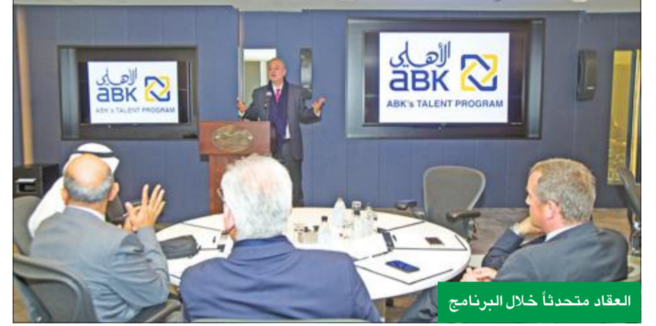
العقاد متحدثاً خلال البرنامج