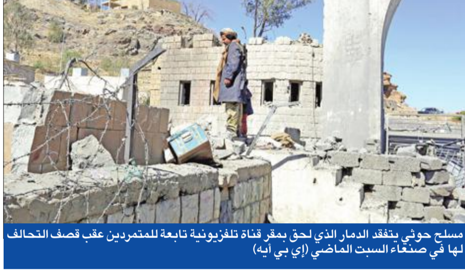
مسلح حوثي يتفقد الدمار الذي لحق بمقر قناة تلفزيونية تابعة للمتمردين عقب قصف التحالف لها في صنعاء السبت الماضي (إي بي آيه)

في وقت تواصل قوات الجيش اليمني المدعومة من التحالف العربي تقدمها داخل محافظة الحديدة الساحلية الخاضعة لسيطرة الحوثيين، أفادت معلومات كشفتها مصادر مطلعة في ميناء الحديدة بأن طهران سحبت 40 مستشارا عسكريا من المنطقة برفقة موظفين تابعين للأمم المتحدة في اليمن. وأفادت مصادر ملاحية بأن سحب إيران لمستشاريها تم بطريقة موهمة، لعدم لفت الأنظار إليهم، ويبدو أن قرار إخراج الخبراء الإيرانيين جاء تلافيا لمصير مشابه لما لاقاه خبير الصورخ الإيراني حسين خسروي، الذي قتل أمس الأول، في قصف لطائرات التحالف على مديرية أرخب بصنعاء. وسبق التحركات الإيرانية، إجلاء طهران موظفي سفارتها من العاصمة اليمنية، وكشفت مصادر إعلامية أنه تم إجلاء موظفي السفارة الإيرانية من صنعاء إلى سلطنة عمان، بعد تعرض مبنى السفارة للصفف خلال المعارك بين الميليشيات المدعومة من طهران وأنصار زعيم «المؤتمر» الراحل علي عبدالله صالح الأسبوع الماضي.