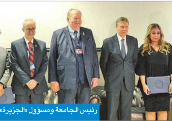
رئيس الجامعة ومسؤول «الجزيرة» يتوسطان الطلبة المشاركين

وذكر أن «الجامعة تبذل قصارى جهدها لتوفير أفضل أنواع التعليم لطلبتها وتسليحهم بالخبرة الجيدة، وما نحن نطوي صفحة عام آخر، ولا شك أن العام الجديد سيكون مثمرا لطلبة الجامعة وكادراهم التعليمي باعتبارهم شهدوا وشاركوا في اتخاذ الخطوات الجديدة من قبل طيران الجزيرة». من جانبه، قال روهبت راماشاندران إن جامعة الخليج للعلوم والتكنولوجيا صنعت علامتها الأكاديمية المميزة على مر السنين الماضية، مبينا أن هذا المشروع وثبتت قدراتها