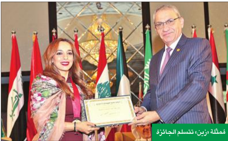
مُتملة «زين» تتسلم الجائزة

الأعمال من خلال إطلاق النسخة الرابعة من برنامجها المبتكر Zain Great Idea، الذي احتضنت من خلاله 12 مشاركاً ممن يملكون أفكاراً إبداعية وطموحاً في دخول بيئة الأعمال عن طريق المشاريع الصغيرة، ووفرت لهم بيئة عملية ذات معايير عالمية لتسريع وإطلاق مشاريعهم الصغيرة والمتوسطة في السوق الكويتي والعالمي. وقامت «زين» أيضاً خلال عام 2017 بتعزيز التعاون المشترك مع مختلف الجهات الصحية الرائدة في الكويت سواء الحكومية منها أو الخاصة، وذلك من خلال عقد الشراكات الاستراتيجية مع وزارة الصحة وبنك الدم المركزي ومستشفى السلام الدولي ومعهد دسمان للمسكري ومستشفى زين وغيرها، إلى جانب إطلاق المبادرات التي تخدم مجالات البيئة، ومنها الشراكة الاستراتيجية مع فريق الفوص الكويتي، ودعم فريق Kayak4Kuwait البيئي، والتعاون المشترك مع مشروع أمينة لإعادة التدوير وغيرها، وذلك باعتبارها قضية في غاية الأهمية بحياة الجميع وسعيها للحفاظ على الموارد الطبيعية، وتعزيز الإدراك بأهمية الوعي البيئي في المجتمع، وخاصة البيئة البحرية التي تعتبر جزءاً لا يتجزأ من التراث الكويتي.