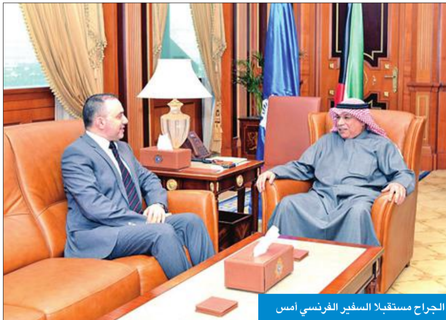
الجراح مستقبلاً السفير الفرنسي أمس

استقبل نائب رئيس مجلس الوزراء وزير الداخلية الشيخ خالد الجراح، صباح أمس، سفير فرنسا كريستيان نخلة، بمناسبة انتهاء مهام عمله سفيراً معتمدا لدى الكويت.