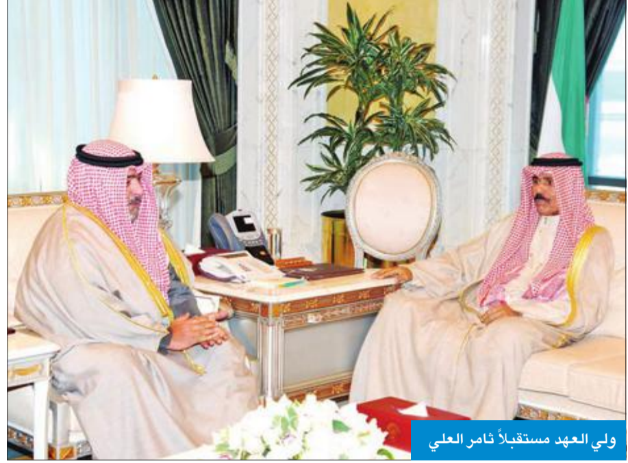
ولي العهد مستقبلاً ثامر العلي

حضر المقابلات رئيس المراسم والتشريفات بديوان سمو ولي العهد الشيخ مبارك الصباح.