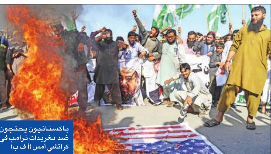
باكستانيون يحتجون ضد تغريدات ترامب في كراتشي أمس

الصين دعمت باكستان، وقال الناطق باسم وزارة الخارجية: «قلنا مراراً إن باكستان بذلت جهوداً كبيرة، وقدمت تضحيات عظيمة في محاربة الإرهاب» (عواصم - وكالات) من ناحية، صرح وزير الدولة في مكتب رئيس الوزراء الهندي جيتندرا سينغ، بأن «تفريده» ترامب دافعت عن موقف الهند فيما يتعلق بالإرهاب، وبدور باكستان في التعامل معه، لكن