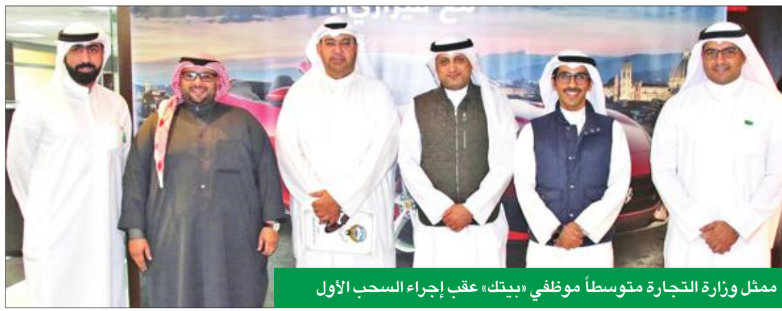
ممثل وزارة التجارة متوسطاً موظفي «بيتك» عقب إجراء السحب الأول

يساهم في تحسين مستوى الرضا لدى العميل. وتهدف الحملة إلى تعزيز وجود البنك، لا سيما أنه يستحوذ على أكبر حصة سوقية في سوق البطاقات المصرفية، وكذلك منح العملاء تجربة تسوق فريدة، من خلال استخدام بطاقات «بيتك» المصرفية. ويواصل «بيتك» إطلاق حملات تسويقية جديدة وعروض حصرية تلبى طموحات وطموحات العملاء، بما يعكس التزام البنك وحرصه على مكافأة عملائه بآروع الخصومات والجوائز غير