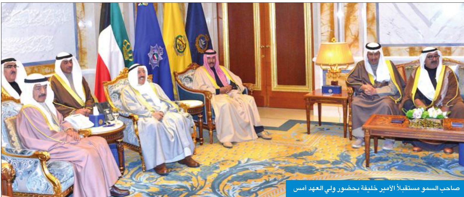
صاحب السمو مستقبلاً الأمير خليفة بحضور ولي العهد أمس