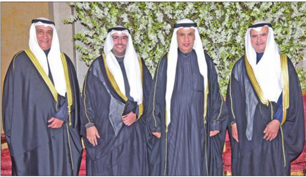
... ومن صالح الفضالة