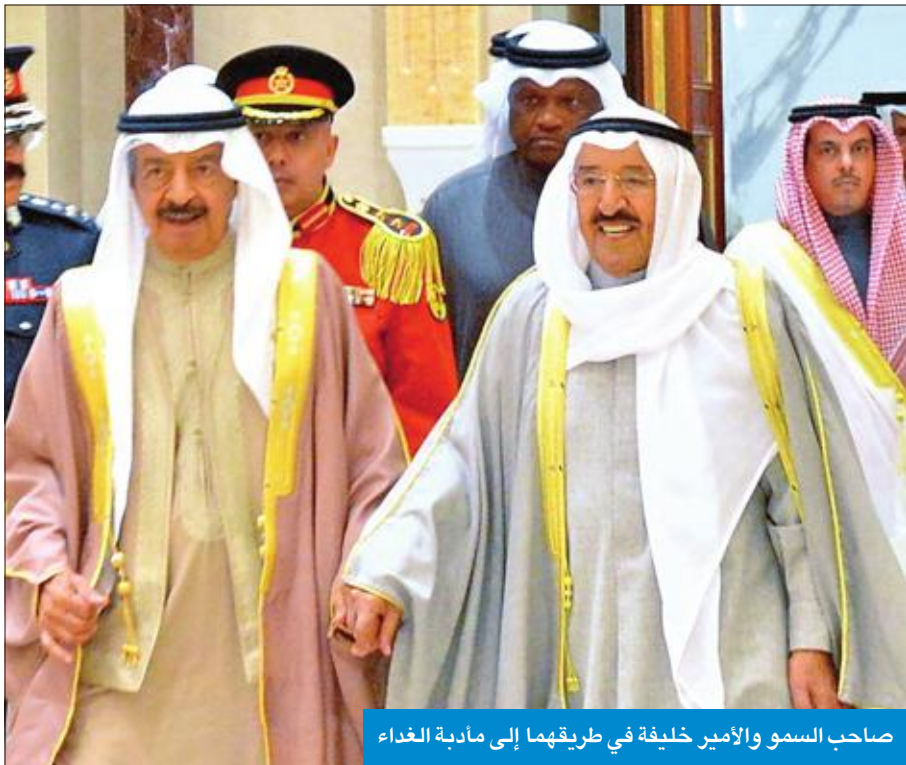
صاحب السمو والأمير خليفة في طريقهما إلى مادية الغداء

بما يخدم مصالح البلدين في إطار دول مجلس التعاون الخليجي