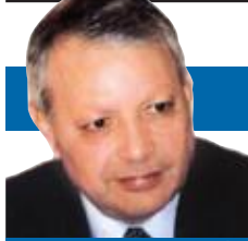
صالح القلب كاتب وسياسي أردني