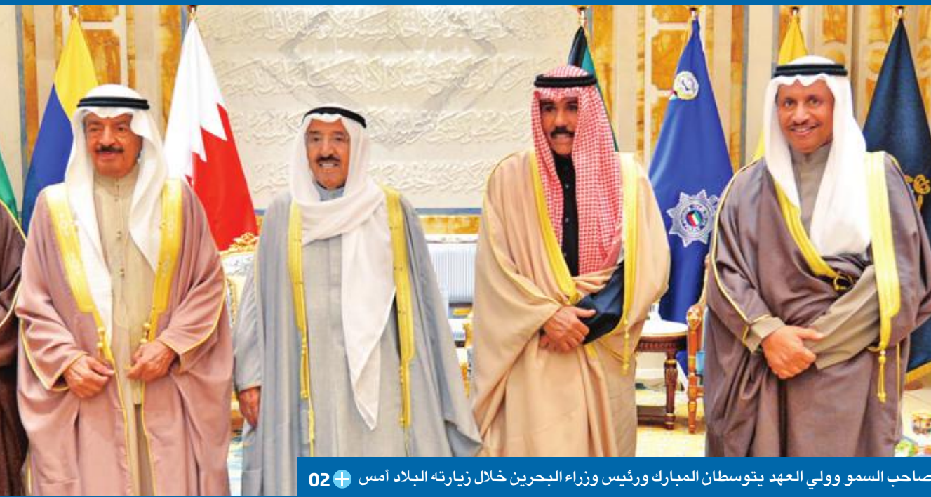
صاحب السمو وولي العهد يتوسطان المبارك ورئيس وزراء البحرين خلال زيارته البلاد أمس 02