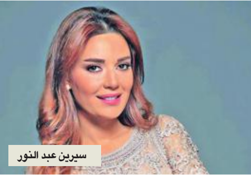
سيرين عبد النور