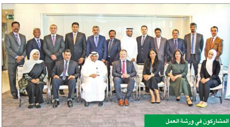
المشاركين في ورشة العمل

أعلنت شركة كامكو للاستثمار، عقد ورشة عمل حول «تطوير الإدارة الوسطى»، بالتعاون مع «يوروبوني» لحلول التعلم. وعقدت ورشة العمل في تشيرمانز كلوب برج كيبكو، حصرياً لموظفي «كامكو» ومجموعة شركات «مشاريع الكويت» (القابضة). وتم تصميم ورشة العمل، التي استمرت 3 أيام، وقام بإدارتها سيمون مكاليف، بهدف تزويد المشاركين بالمهارات اللازمة لإدارة فرق العمل، وتدريب وتطوير أولئك الذين يقدمون تقارير إليهم، وتعزيز روح فريق العمل الواحد في تنفيذ الأهداف المرجوة.