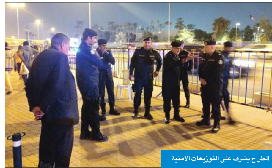
الطراح يشرف على التوزيعات الأمنية

خلال عطلة السنة الجديدة... وغرفة العمليات تلقت 4600 بلاغ