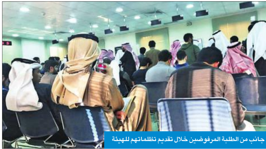
جانبا من الطلبة المرفوضين خلال تقديم تظلماتهم للهيئة

اكتظت صالة القبول والتسجيل في الهيئة العامة للتعليم التطبيقي والتدريب في منطقة العدلية بالعديد من الطلبة، الذين قدموا تظلمات، ويريدون معرفة أسباب رفضهم من الدراسة في «الهيئة».