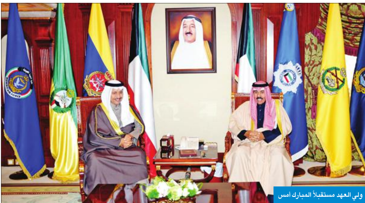
ولي العهد مستقبلاً المبارك أمس

استقبل سمو ولي العهد الشيخ نواف الأحمد بقصر بيان، صباح أمس، رئيس مجلس الأمة مزروق الغانم. كما استقبل سموه نائب رئيس الحرس الوطني الشيخ مشعل الأحمد، ثم رئيس مجلس الوزراء سمو الشيخ جابر المبارك. واستقبل سمو ولي العهد النائب الأول لرئيس مجلس الوزراء وزير الدفاع الشيخ ناصر الصباح، ثم وزيرة الدولة لشؤون الإسكان و وزيرة الدولة لشؤون الخدمات د. جنان بوشهري. واستقبل سموه وزير الإعلام محمد الجبري، ووزير النفط وزير الكهرباء والماء بخت الرشيدي، ووزير التربية وزير التعليم العالي د. حامد العازمي، ووزير العدل وزير الأوقاف والشؤون الإسلامية د. فهد العفاسي، كما استقبل سمو ولي العهد الشيخ محمد الصباح.