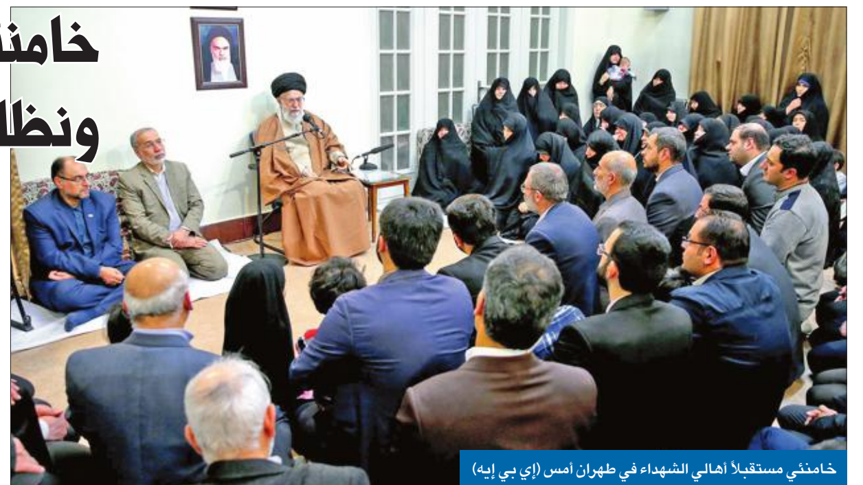
خامنئي مستقبلاً أهالي الشهداء في طهران أمس

وعشية تصريحات المرشد، هاجم المتظاهرون، المطالبون بوضع نهاية للمصاعب الاقتصادية والفساد، مراكز للشرطة في مناطق أخرى من إيران حتى ساعة متأخرة من ليل الاثنين-الثلاثاء، مما أسفر عن مقتل أول شرطي وعناصر من وحدات «الباسيج» في مدينة نجف آباد، إضافة إلى 9 محتجين في أصفهان بينهم فتى عمره 11 عاماً. الاحتجاجات المستمرة منذ ستة أيام إلى 21 قتيلاً، فضلاً عن اعتقال نحو 500 شخص. وهدد رئيس المحكمة الثورية موسى غضنفر آبادي المحتجين بان السلطات ستقدم المعتقلين