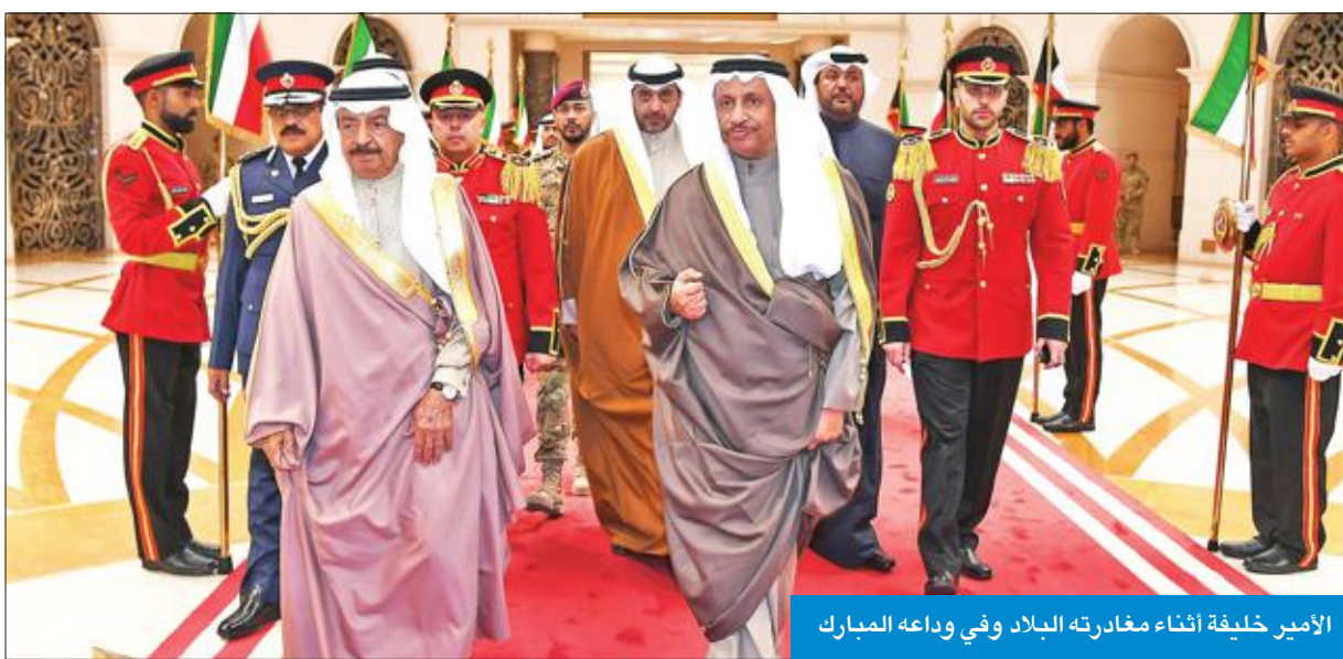
الأمير خليفة أثناء مغادرته البلاد وفي وداعه المبارك

استقبل صاحب السمو أمير البلاد الشيخ صباح الأحمد بقصر بيان، صباح أمس، سمو ولي العهد الدفاع الشيخ نواف الأحمد، كما استقبل رئيس مجلس الأمة مزروق الغانم، ورئيس مجلس الوزراء سمو الشيخ جابر المبارك. وتم خلال اللقاء تبادل الأحاديث الطيبة التي جسدت عمق العلاقات الأخوية المتميزة بين البلدين الشقيقين، والعمل على تعزيزها وتطويرها في جميع المجالات، بما يخدم مصالحهما المشتركة، في إطار ما يجمع دول مجلس التعاون الخليجي من علاقات تاريخية راسخة، لتحقيق طموحات وتطلعات شعوبها. حضر المقابلة النائب الأول لرئيس مجلس الوزراء وزير الدفاع الشيخ ناصر الصباح، ووزير شؤون الديوان الأميري الشيخ علي الجراح، ونائب رئيس مجلس الوزراء وزير الدفاع خالد الخالد، ونائب رئيس مجلس الوزراء وزير الخارجية خالد الجراح، ونائب رئيس مجلس الوزراء وزير الدولة لشؤون مجلس الوزراء أنس الصالح، وكبار المسؤولين بالدولة. وأقام صاحب السمو مآدبة غداء على شرف الأمير خليفة والوفد المرافق، بمناسبة زيارته الأخوية للبلاد. وكان الأمير خليفة غادر الوفد المرافق له في ختام زيارة أخوية قصيرة، وكان في مقدمة استقباله ومودعه على أرض المطار سمو رئيس مجلس الوزراء، والنائب الأول لرئيس مجلس الوزراء وزير الدفاع، ونائب رئيس مجلس الوزراء وزير الخارجية، ونائب رئيس مجلس الوزراء وزير الداخلية، ونائب رئيس مجلس الوزراء وزير الدولة لشؤون مجلس الوزراء، ونائب وزير شؤون الديوان الأميري الشيخ محمد العبدالله، وعدد من الشيوخ والمستشارين وكبار المسؤولين بديوان سمو رئيس مجلس الوزراء.