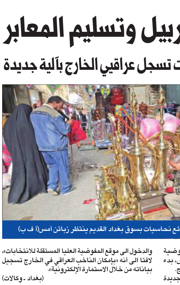
بائع نحاسيات بسوق بغداد القديم ينتظر زبائن أمس

إيران تعيد فتح الحدود مع كردستان • مفوضية الانتخابات تسجل عراقي الخارج بألية جديدة