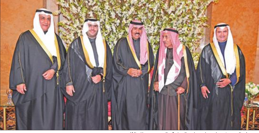
سمو ولي العهد يتوسط عصام وجاسم المرزوق والمعرس وصالح الفليج