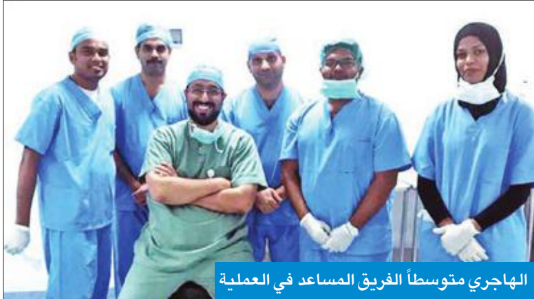
الهاجري متوسط الفريق المساعد في العملية