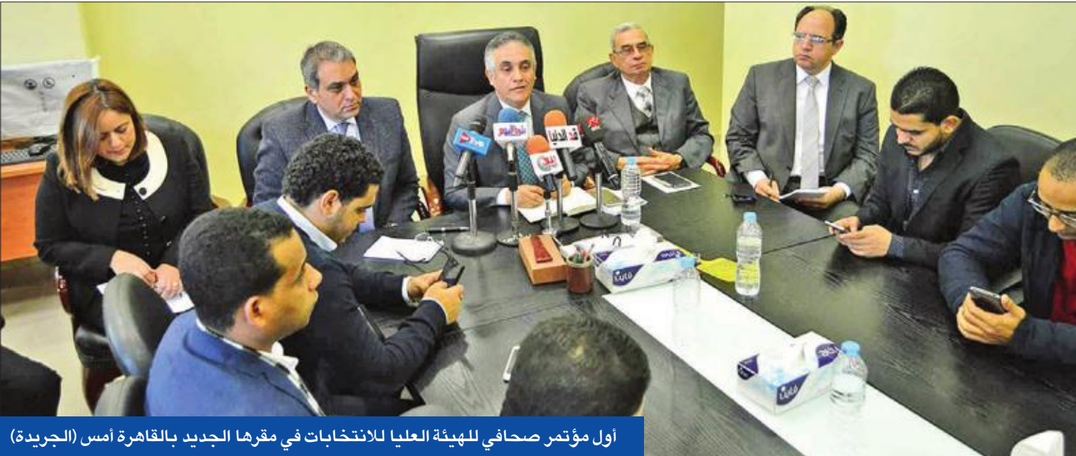
أول مؤتمر صحافي للهيئة العليا للانتخابات في مقرها الجديد بالقاهرة أمس

في سياق آخر، استقبل وزير الخارجية المصري سامح شكري، أمس، وفداً من أعضاء المكتب الرئاسي للهيئة العليا للتفاوض