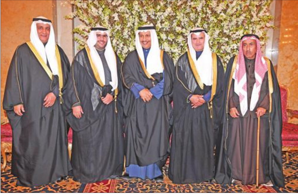
وتهنئة من المبارك