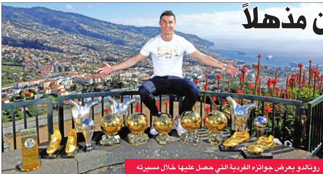
رونالدو يعرض جوائز الفردية التي حصل عليها خلال مسيرته

مستويات عديدة، يا له من شعور رائع النظر إلى الماضي ورؤية ما حققته بعد أن بدأت مشوارتي وأنا أركل الكرة في شوارع ماديرا (مسقط رأسه). والإنجازات، سواء على المستوى الجماعي أو الفردي. وأشارت الصحفية إلى أن رونالدو حصد 5 القاب مع ريال مدريد في 2017، بالإضافة إلى جائزة الكرة الذهبية، وجائزة الاتحاد الدولي لكرة القدم لأفضل لاعب في العالم (مرتين). وأوصحت "أس" أن رونالدو خلال مسيرته الطويلة فاز بخمس كرات ذهبية، وجائزة "الأفضل" في نسختين لحفل جوائز الفيفا، و 4 أندية ذهبية و 3 جوائز للاتحاد الأوروبي لكرة القدم "يوبا" كأفضل لاعب في أوروبا. وقال رونالدو في تصريحات نقلتها عنه "أس": 2017 كان عاماً مذهلاً على