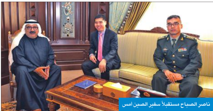
ناصر الصباح مستقبلاً سفير الصين أمس

بحث النائب الأول لرئيس مجلس الوزراء وزير الدفاع الشيخ ناصر الصباح أمس، في قصر بيان، مع سفير جمهورية الصين الشعبية الصديقة لدى البلاد وانغ دي يرافقه الملحق العسكري العميد تشانغ فه المواضيع ذات الاهتمام المشترك. وقالت مديريةية التوجيه المعنوي والعلاقات