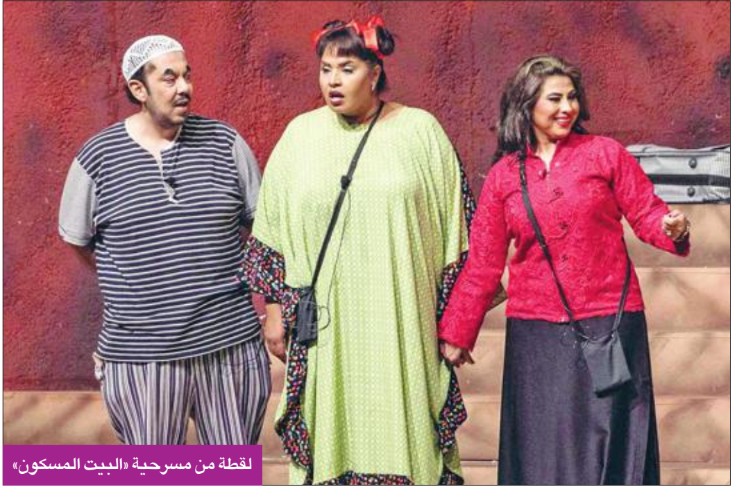
لقطة من مسرحية «البيت المسكون»

وفيما يتعلق بتفاصيل هذا العرض، ألمح المسلم إلى