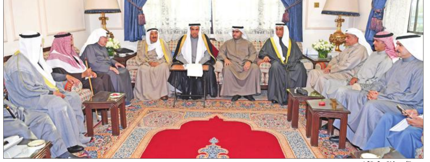
سمو الأمير خلال عقد القران