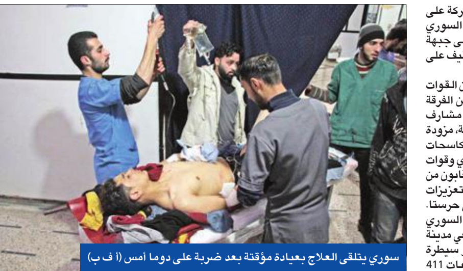
سوري يتلقى العلاج بعبادة مؤقتة بعد ضربة على دوما أمس

● النظام يتسلم تلال بيت جن ● فصائل إدلب تقسم الجبهات