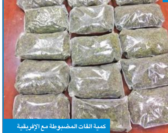
كمية القات المضبوطة مع الإفريقية

مع أول أيام العام الجديد 2018، وبعد ساعات محدودة من ضبط كمية كبيرة من مخدر «الماريغوانا»، تمكن رجال جمارك مطار الكويت الدولي من ضبط وافدة إفريقية شرعت في تهريب نحو 8.4 كيلوغرامات من القات، المدرج في جدول المخدرات.