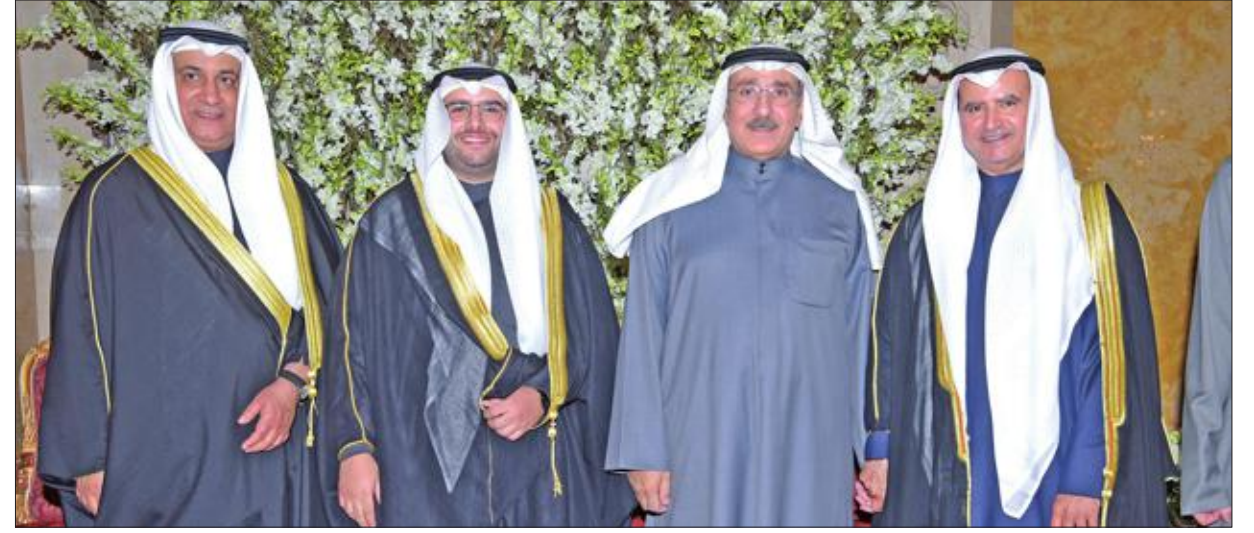
تهنئة من أحمد الجسار