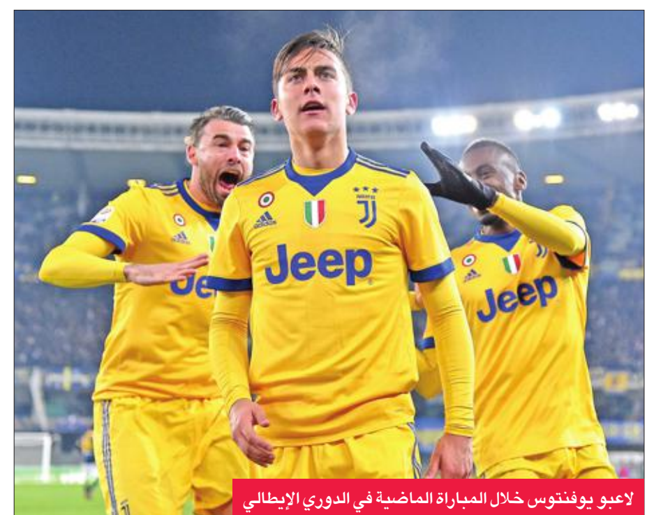
لاعبو يوفنتوس خلال المباراة الماضية في الدوري الإيطالي

يبدو يوفنتوس، في موقع الأفضلية لاقتناص البطاقة الأخيرة للدور نصف النهائي من كأس إيطاليا، عندما يلاقي تورينو اليوم. وبتنتيجة مباراة "دربي" تورينو بين نادي "السيدة العجوز" وغريمه الذي يحمل اسم المدينة، يتكلم عقد الدور نصف النهائي، بعدما ضمن لاتسيو وميلان الأضواء الماضي، بلوغه على حساب فيورنتينا وإنتر ميلان على التوالي. ويدخل يوفنتوس الذي أحرز الموسم الماضي الثنائية المحلية (الدوري والكأس) للمرة الثالثة تالياً، مباراة ربع النهائي ضد تورينو وهو في المركز الثاني في ترتيب الدوري المحلي، بفارق نقطة عن نابولي. أما تورينو، فيحتل المركز العاشر في الترتيب. وتعود آخر مباراة بين يوفنتوس وتورينو في الكأس المحلية إلى عام 2015، وتفوق