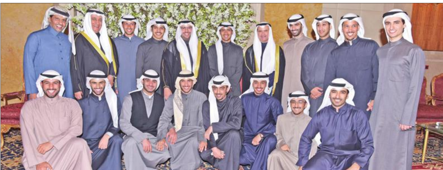
المعرس بين أصدقائه