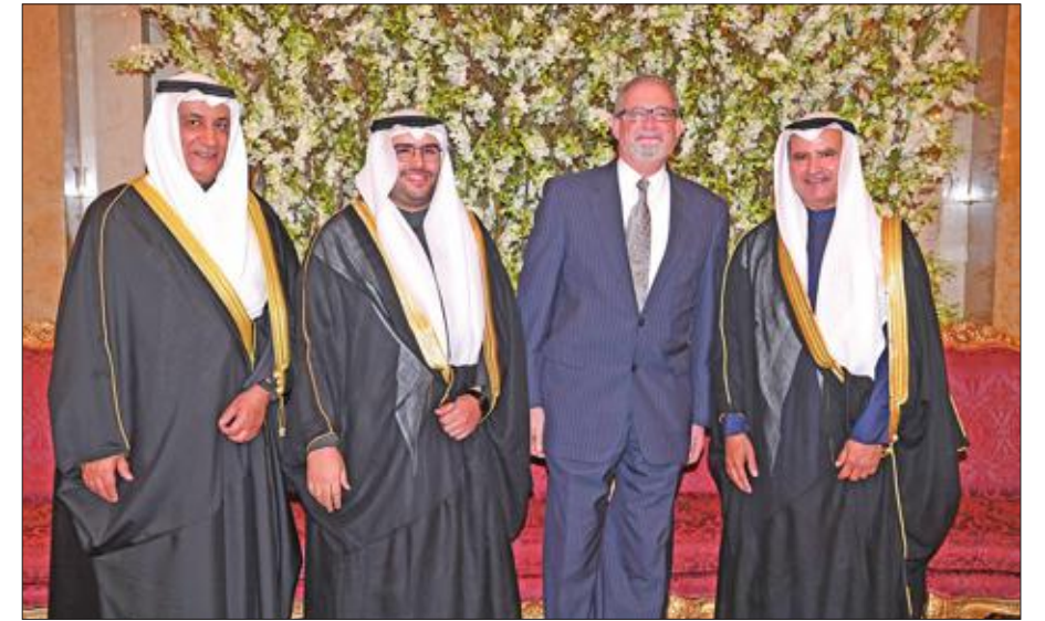
السفير الأمريكي مهنئا