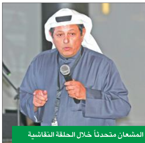
المشعان يتحدثاً خلال الحلقة النقاشية

استهلاك الطاقة وفقاً لمعايير LEED أعلى بنسبة 20 في المئة من تكلفة بناء منزل عادي، لكن الوفورات في الصرف المادي على استهلاك الطاقة والمياه كبيرة جداً تبلغ 67 في المئة سنوياً في استهلاك الكهرباء، و35 في المئة سنوياً في استهلاك المياه.