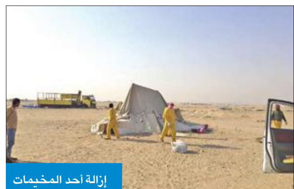
إزالة أحد المخيمات

ملصقات تندر أصحابها بإزالة، فور انتهاء المهلة القانونية لوضع الملصق. ودعت إدارة العلاقات العامة بالبلدية المواطنين والمقيمين الالتزام التام بالتخديم في المواقع التي حددتها البلدية للتخديم بالموسم الربيعي 2017/2018، والالتزام بالشروط