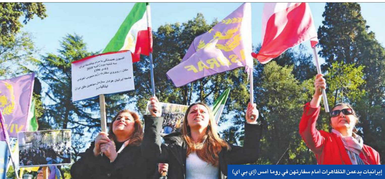
إيرانيات يدعمن التظاهرات أمام سفارتهن في روما أمس

وأفادت وكالة «تسنيم»، بأن أمين المجلس الأعلى للأمن القومي