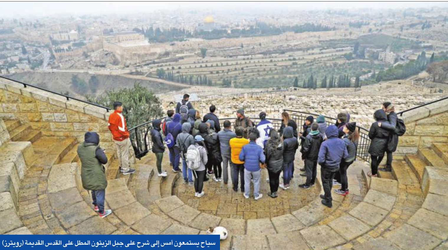
سياح يستمعون أمس إلى شرح على جبل الزيتون المطل على القدس القديمة

ليبرمان يرفض «جرّه» لغزة • «حماس» لإلغاء الاتفاقيات • «المصالح التجارية» يندر بانهايار ائتلاف نتياهو