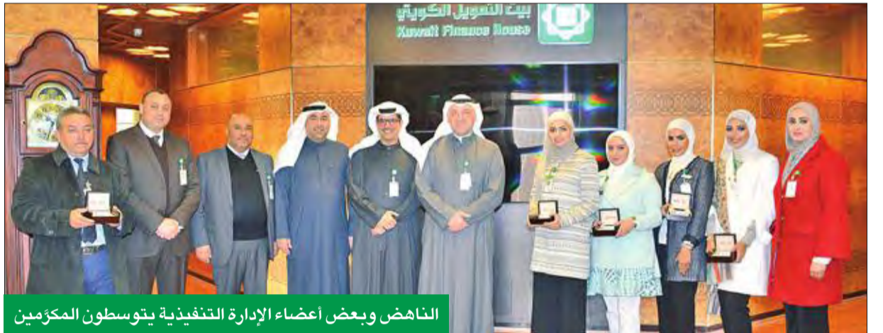
الناهض وبعض أعضاء الإدارة التنفيذية يتوسطون المكرمين

على مستواهم، والمبادرة في تقديم العون والمساعدة والدعم لزملائهم، بما يعزز الصورة الإيجابية عن «بيتك»، ويرتقي بمجالات التعاون بين الزملاء، وينمي روح الفريق الواحد. وأكد الأهمية الكبيرة التي يوليها «بيتك» لخدمة العملاء وتلبية احتياجاتهم بدعم من العصر الشري، رغم التقدم التقني الكبير الذي يتم في مختلف مجالات العمل.