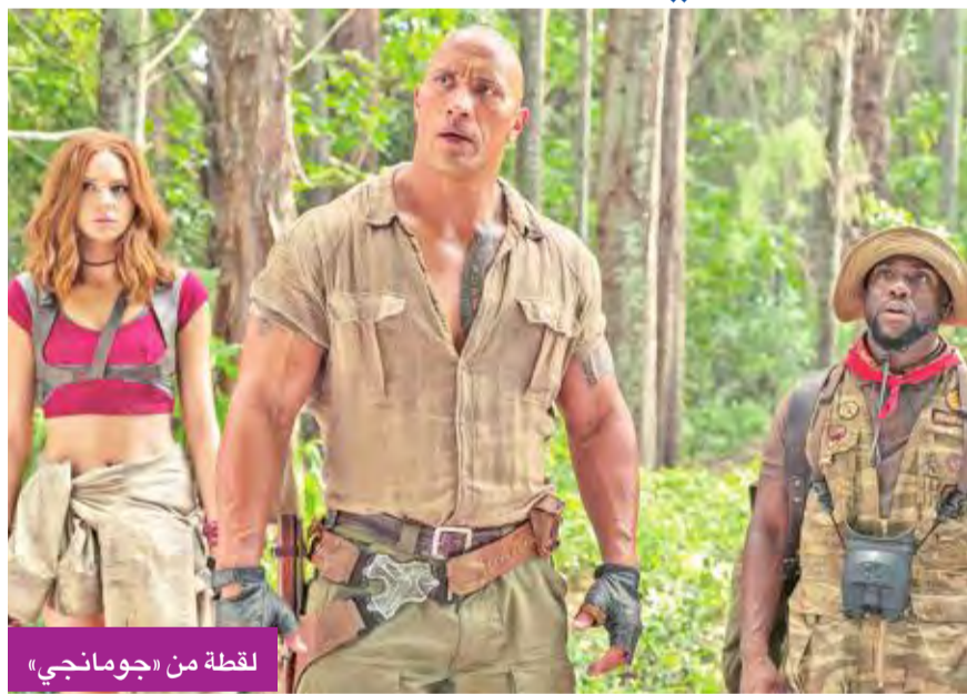
لقطة من «جومانجي»

واحتل فيلم الحركة الجديد (ذا كمبيوتر) المركز الثالث، بإيرادات 13.5 مليون دولار. والفيلم بطولة ليام نيسون وفيرا فارميجا، ومن إخراج جومي كوليت سيربا. وتدور أحداث هذا العمل السينمائي الجديد حول مايكل وليريتش (ليام نيسون) موظف تأمينات، يخرج يوميا في رحلة عمله التي باتت روتينيا بالنسبة له، تتغير الأمور حين يتلقى اتصالا غامضا من غريب لا يعرفه، ويصبح مايكل مضطرا للكشف عن هوية الراكب المتخفي بالقطار، الذي يقله عمله، قبل بلوغ المحطة الأخيرة. وبينما يسابق الزمن لحل اللغز، يكشف عن هناك خطة قاتلة تحاك، وأنه سيخترق في مؤامرة جنائية عن غير قصد، وبذات الوقت ستتوقف على تصرفاته حياة كل من على متن القطار.