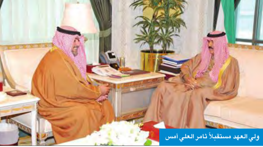
ولي العهد مستقبلاً ناصر العلي امس

استقبل سمو ولي العهد الشيخ نواف الأحمد بقصر السيف، صباح امس، رئيس جهاز الأمن الوطني الشيخ ناصر العلي.