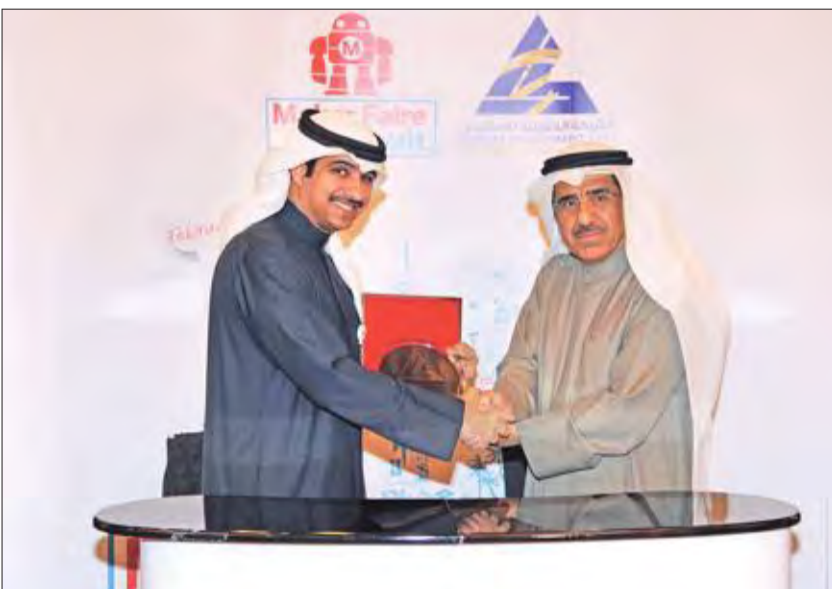
جانب من التكريم