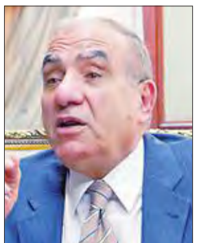
أبو بكر الجندي

بعد ساعات قليلة من حلف اليمين الدستورية وزيراً للتنمية المحلية، أمس الأول، لشعل اللواء أبو بكر الجندي حالة من الغضب ضده في الشارع المصري، بأول تصريح إعلامي له وصلت أصداؤه إلى البرلمان، حيث قال خلال مداخلة هاتفية على فضائية «الحياة»، إنه يستهدف تنمية الصعيد، «لعلنا نبطل جعل الصعايدة يركبوا القطار، ويأتوا للقاهرة عشان يبحثوا عن فرص عمل، ويعملوا لنا هنا عشوائيات»، ما اعتبره برلمانيون إساءة لأبناء محافظات الصعيد، وطالبوا الوزير الجديد بالاعتذار. وحاول رئيس البرلمان،