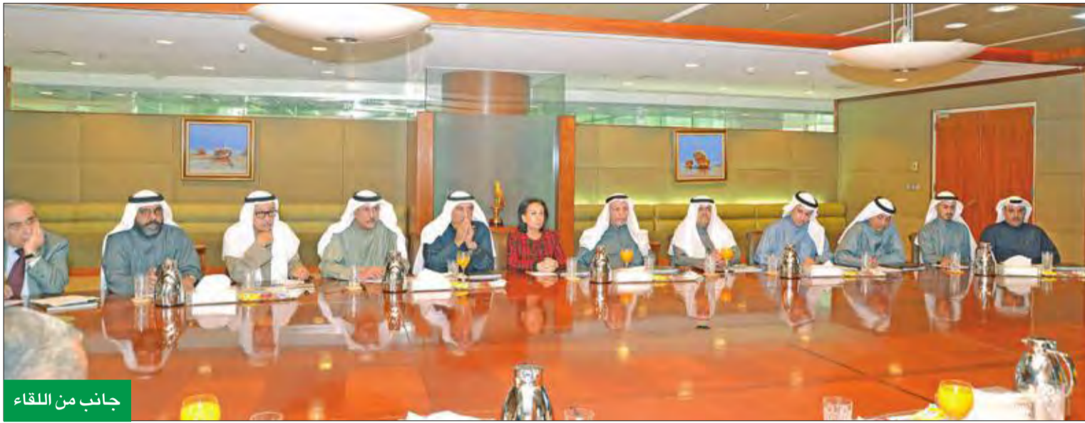
جانِب من اللقَاء