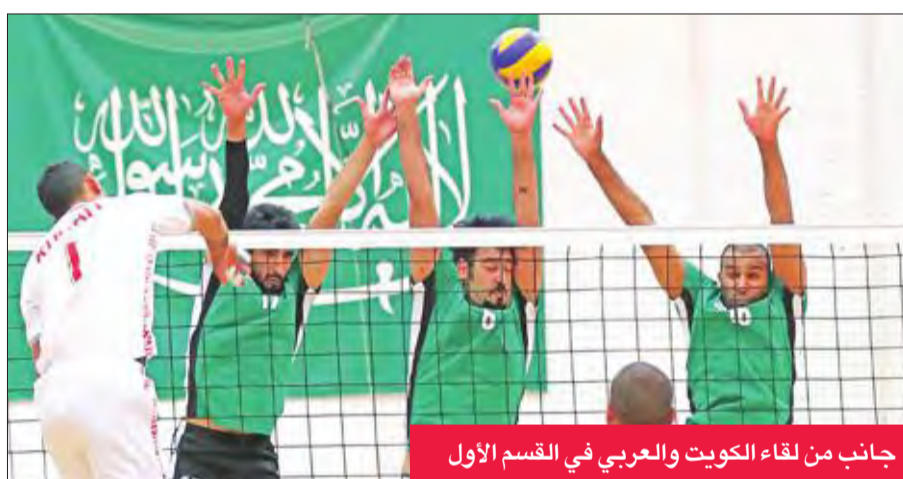
جانب من لقاء الكويت والعربي في القسم الأول

يتطلع فريق الكويت إلى تحطيم عقبة نظيره العربي ومواصلته الصراع على قمة الدوري الممتاز لكرة الطائرة، عندما يلتقي الفريقان في السادسة والنصف مساء اليوم على صالة الأول بكيفان، ضمن منافسات الجولة السابعة «القسام الثاني» من المسابقة، وفي نفس التوقيت يحل القادسية ضيفاً ثقيلاً على التضامن في الفروانية، وفي السابعة مساءً مباراة اليرموك وكاظمة على صالة الأول بمشرف في المباراة الأولى، بإم اليبض الثاني برصيد 11 نقطة، جمعها من 5 انتصارات وهزيمة واحدة أمام القادسية، تكرار الفوز على الأخضر صاحب المركز الرابع برصيد 7 نقاط، ويفارق الأشواط عن التضامن الخامس واليرموك السادس، طمعا في المحافظة على موقعه، أو ربما اعتلاء القمة في حالة تعثر الأصفر المتصدر أمام التضامن اليوم.