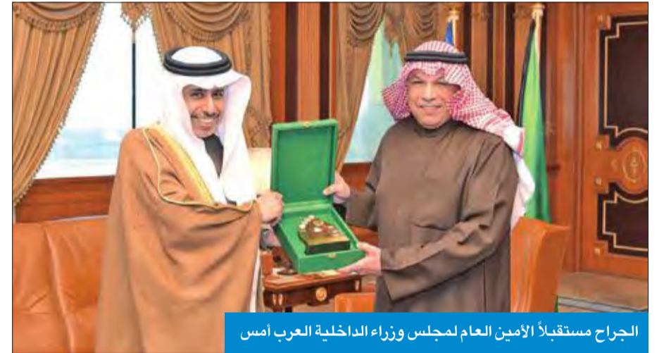
الجراح مستقبلاً الأمين العام لمجلس وزراء الداخلية العرب امس

اجتماع وزراء الداخلية العرب يعقد بالجزائر في مارس المقبل