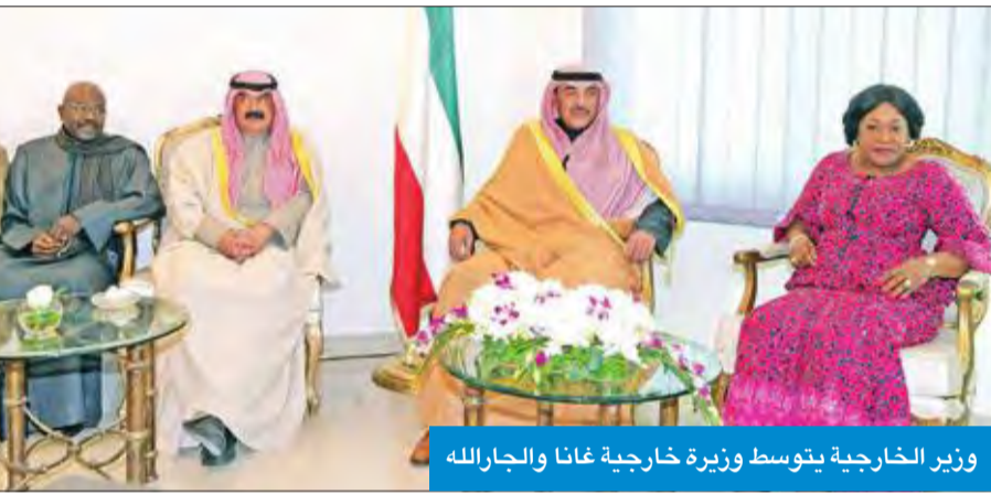
وزير الخارجية بتوسط وزيرة خارجية غانا والجارالله

أكد أن الكويت تثمن رد «الخارجية» المصرية على الافتراءات في العلاقات