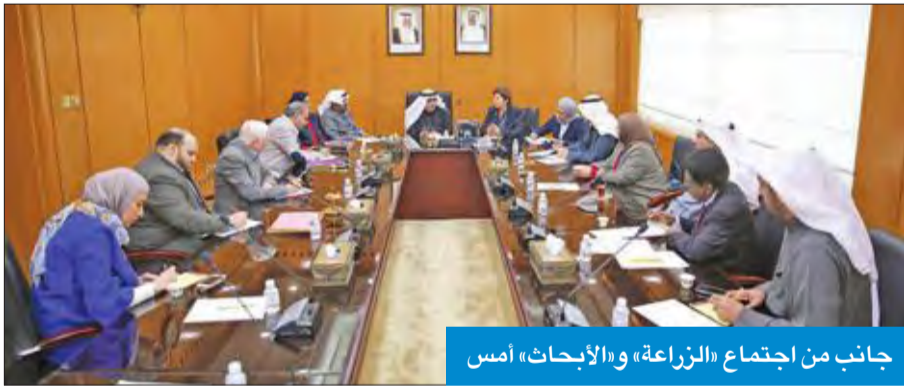
جانب من اجتماع «الزراعة» و«الأبحاث» أمس

بين المعهد ومنظمة الأغذية والزراعة للأمم المتحدة (فاو)، من خلال مكتب الفاو، ونشاطه الفعال مع المكاتب المهمة، ما يوحد الأفراس والأهداف للوصول إلى أفضل النتائج الممكنة، والاستفادة من تجارب المعهد في المجالات الزراعية والسككية، لتنميتها وتطويرها ضمن إطار علمي وبحثي مستنير ومتطور.