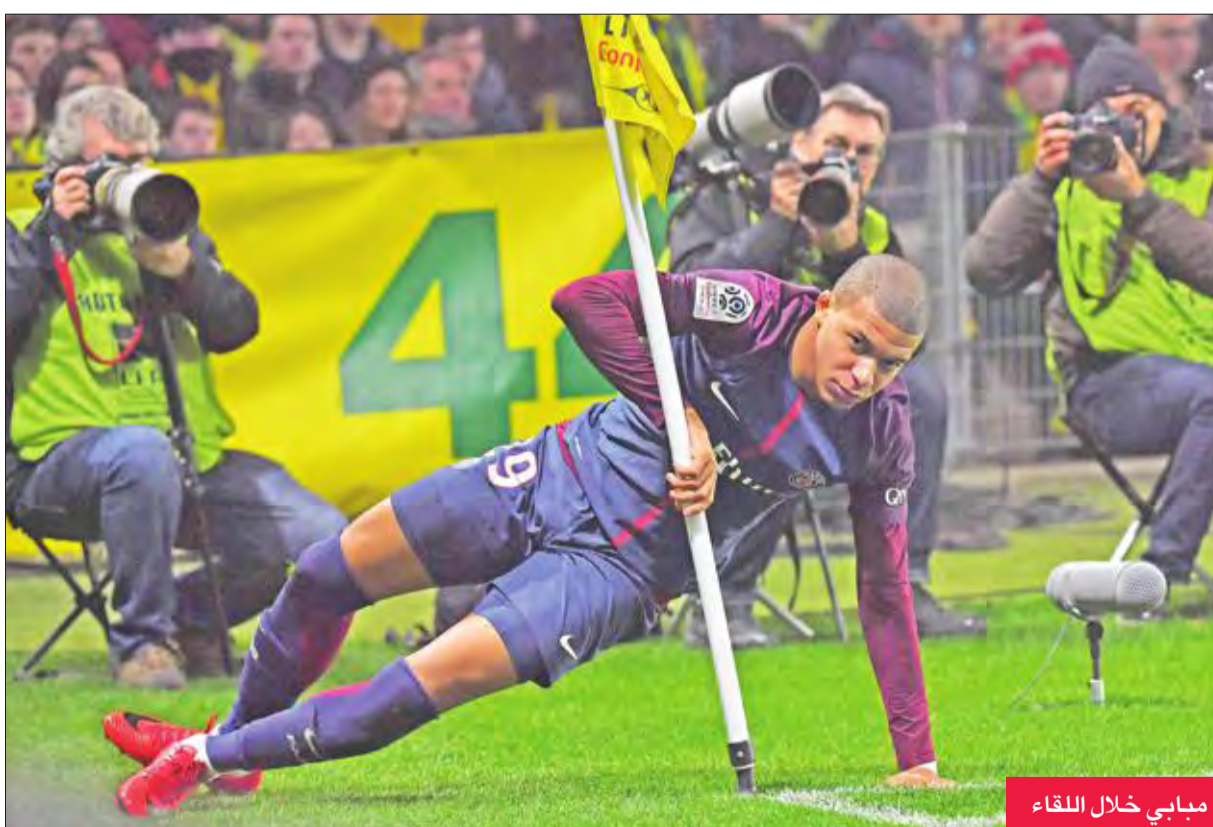
مباي خلال اللقاء

محاولة لحاقه بهجوم مرتد لسان جرمان. وأظهرت الإعادة بين الحكم حاول الرد بعرقلة المصافح قبل أن يشهر الإنذار الثاني في وجهه. وفي المباراة الثانية، كان ليون أمام فرصة إزاحة مونako عن المركز الثاني لكنه فشل في تحطيم ضيفه انجيه.