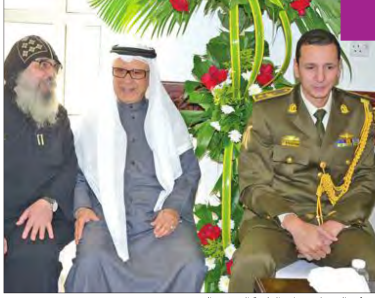
العم فهد المعجل ومساعد الملحق العسكري المصري