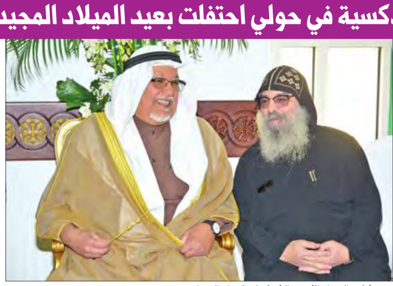
وزير شؤون الديوان الأميري الشيخ علي الجراح الصباح

احتفلت الكنيسة الأرثوذكسية في حولي بعيد الميلاد المجيد، بحضور شخصيات عامة بارزة وشيوخ وسفراء قدموا التهاني للقمص ويجول وقساوسة الكنيسة، وشارك أبناء الكنيسة في الحفل وأدوا الصلاة والترانيم.