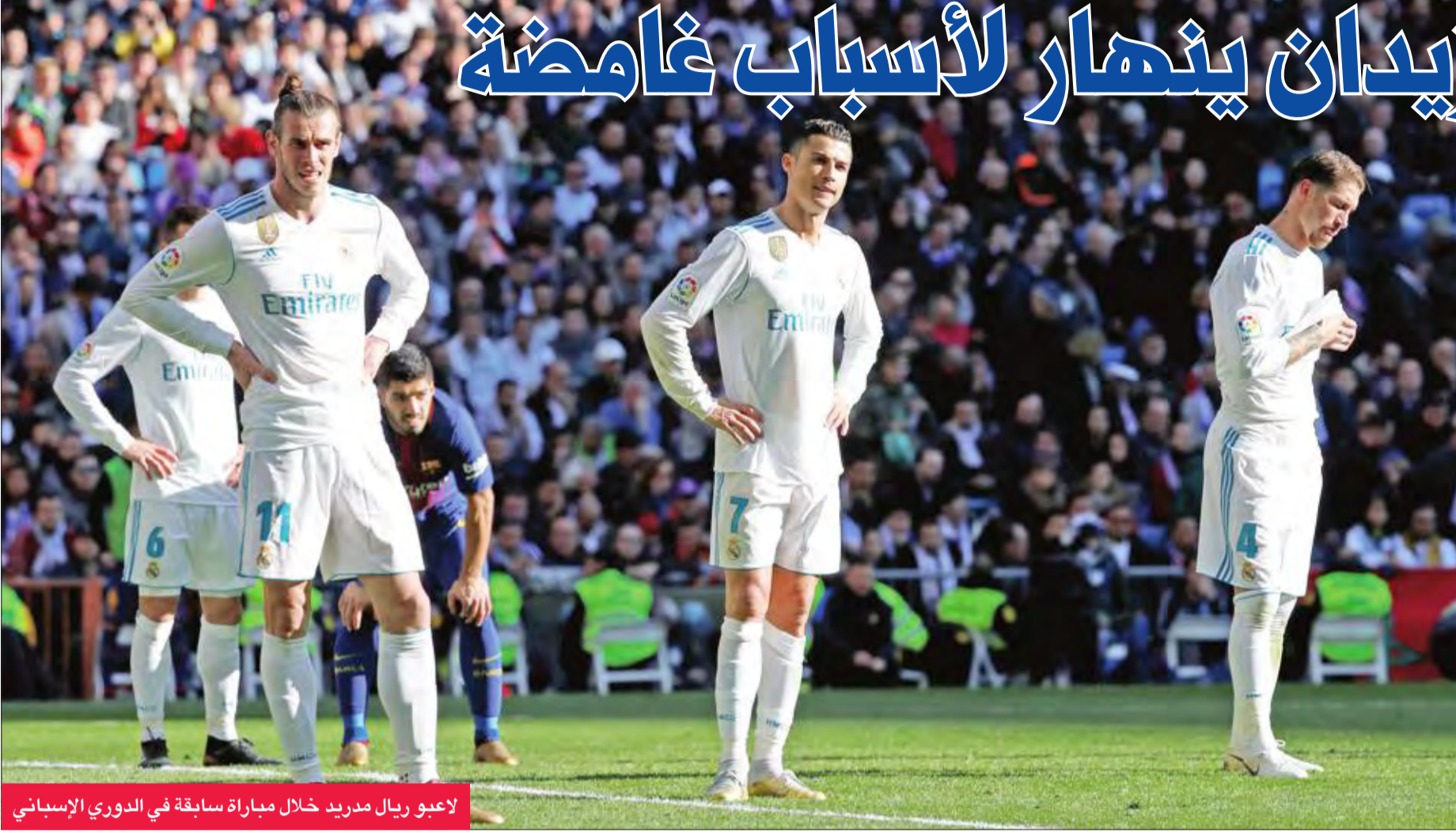
لاعبو ريال مدريد خلال مباراة سابقة في الدوري الإسباني

سيكون نادي ريال مدريد الإسباني ومدربه الفرنسي في موقف صعب جداً خلال ما تبقى من الموسم الحالي، فالجماهير غاضبة من تراجع مستوى الفريق ونتائجه، كذلك وسائل الإعلام، التي شنت هجوماً لاذعاً على المدرب ونجوم الفريق على حد سواء.