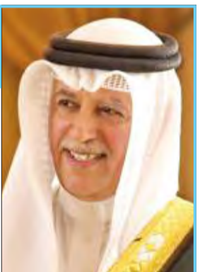
علي آل خليفة

اعتمد محضر الاجتماع السابق، إضافة إلى إقرار الدورات الفنية، ودورات التحكم والتدريب، مشدداً بفريق العمل التطوعي والموظفين بالاتحاد الآسيوي، معرباً عن سعادته باحتضان الكويت لمقر الاتحادين العربي والآسيوي في مجمع ميادين الشيخ صباح الأحمد، أحد أهم وأكبر الميادين في العالم.