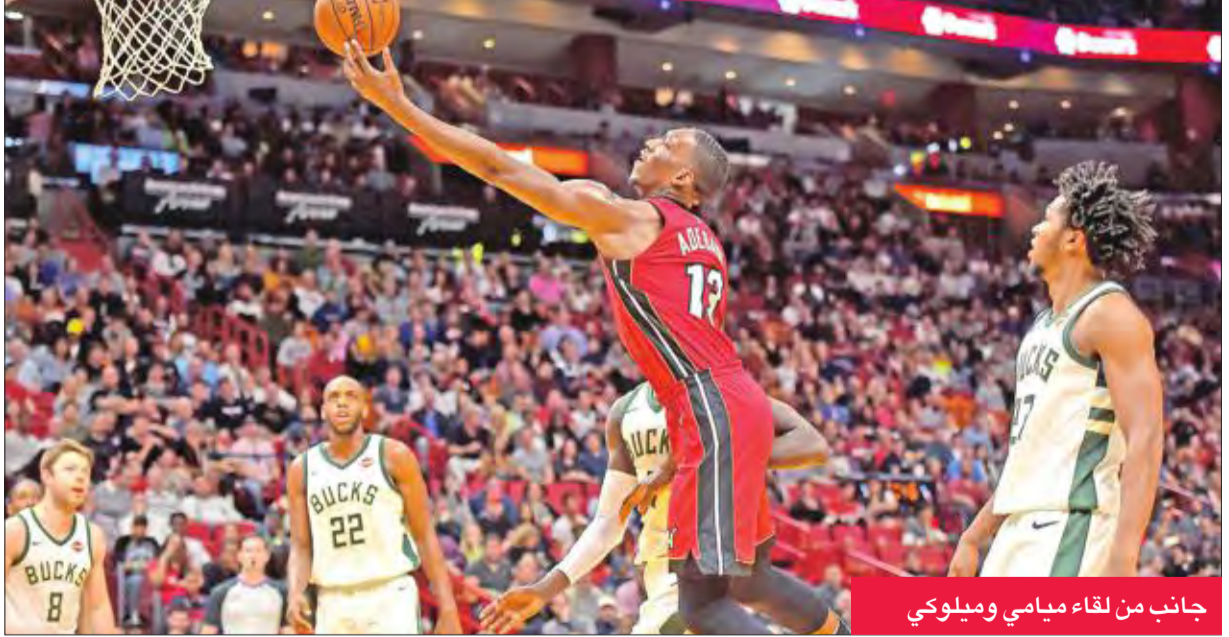
جانب من لقاء ميامي وميلووكي

21 نقطة، وأضاف زميله سي جاي مالكونم 18 نقطة. وفي مباراة أخرى، تغلب إنديانا بايسرز على فينيكس صنز 120-97.