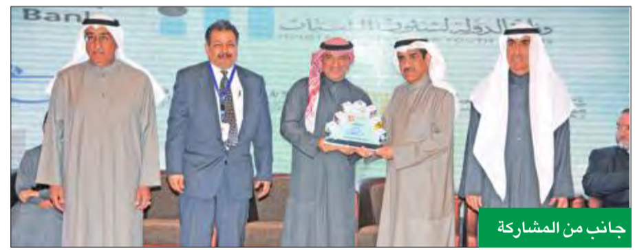
جانب من المشاركة

الإبداعية والمواهب الخلاقة التي يتمتع بها الشباب، وخاصة ما يدعم مسيرتهم التعليمية.