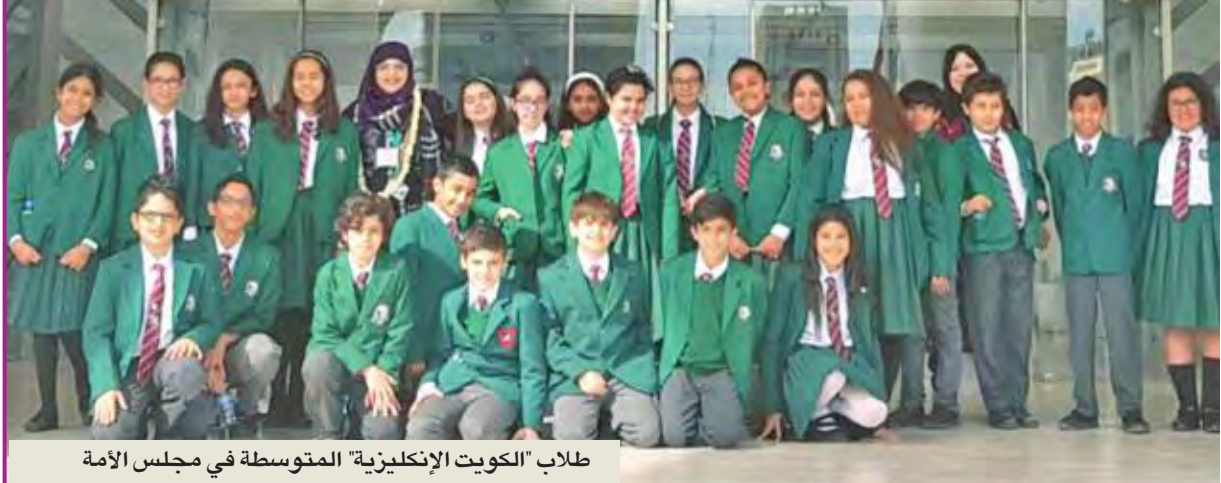
طلاب «الكويت الإنكليزية» المتوسطة في مجلس الأمة