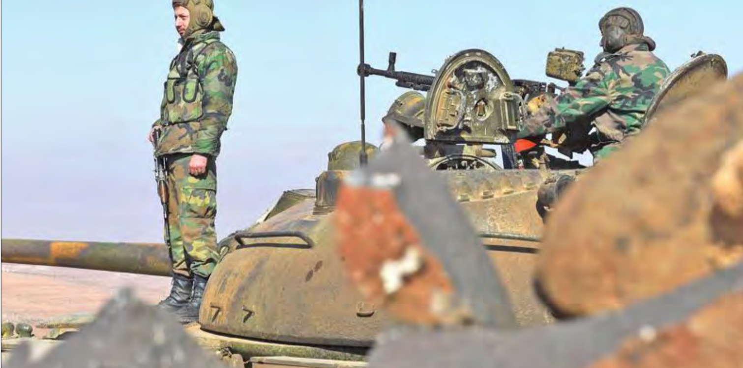
جندي نظامي على دبابة تتقدم من جبل الحص جنوب حلب نحو مطار أبو الظهور ببادب امس الأول

● تركيا تحذر أميركا من «اللعب بالنار» وتتعهد بوأد «جيش الترويع» وتحصن الحدود ● سورية عازمة على إنهاء الوجود الأميركي... وروسيا سترد على تهديد مصالحها