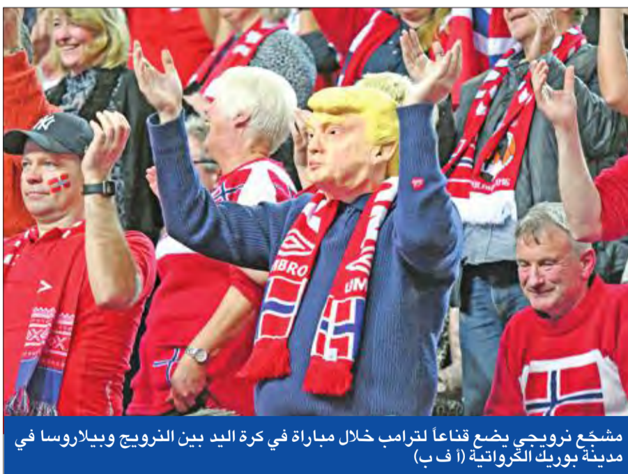
مشجع نرويجي يضع قناعاً لترامب خلال مباراة في كرة اليد بين النرويج وبيلاروسا في مدينة بوريك الكرواتية

● والدة إيفانكا: زوجي السابق يقول أشياء سخيفة ● جنوب إفريقيا تستدعي مسؤولاً أميركياً