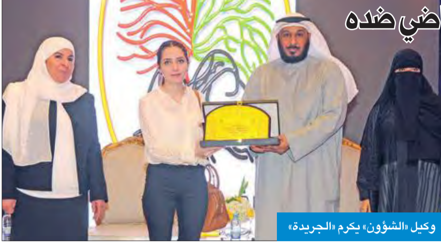
وكيل الشؤون، يكرم «الجريدة»

مع المؤسسات الحكومية الأخرى وجميعيات النفع العام والقطاع الخاص، لتوفير احتياجاتهم الاجتماعية والنفسية والصحية والتأهيلية».