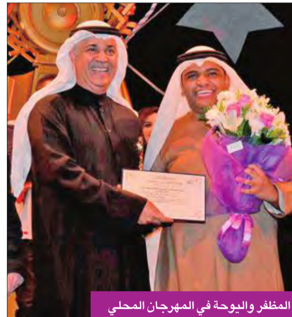
المظفر واليوحة في المهرجان المحلي

يذكر أن الفنان خالد المظفر تخرج في المعهد العالي للفنون المسرحية - تخصص الأت، وحصد جائزة أفضل ممثل دور ثان عن دوره في مسرحية «العائلة الحزينة» لفرقة مسرح الخليج العربي، في مهرجان الكويت المسرحي الـ 17 عام 2016، وجائزة أفضل ممثل واعد عن دوره في مسرحية «مكة العقول الفارغة» لفرقة المسرح الكويتي، في مهرجان الكويت المسرحي الـ 15 عام 2014. وشارك أخيراً في تقديم برنامج المسابقات التلفزيوني «هايدو» على قناة «كويت سبورت»، من إعداد نايف النعمة، وإخراج عبدالرزاق العطار، كما التقى طلبة الجامعة الأميركية في الكويت (AUK) في محاضرة النجاح والإلهام.