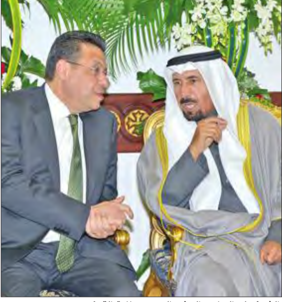
الشيخ علي الجابر والسفير المصري طارق القوني