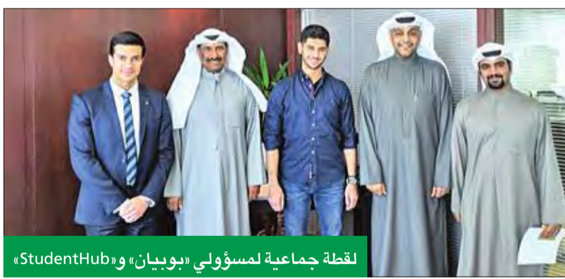
لقطة جماعية لمسؤولي «بوبيان» و«StudentHub»

البحث عن أفضل الموارد البشرية التي يمكن أن تشكل إضافة مهمة لخطط البنك المستقبلية في التوسع، سواء على مستوى خدمات الأفراد، أو الشركات.