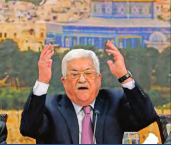
عباس متحدثاً في اجتماع المجلس المركزي لمنظمة التحرير في رام الله أمس الأول

بدوره، حضّ رئيس الوزراء رامي الحمد لله، أمس، دول العالم على الاعتراف بدولة فلسطين كسبيل لإنقاذ رؤية الدولتين لحل الصراع الفلسطيني مع إسرائيل. أما وزير الخارجية والمغتربين الفلسطيني رياض المالكي، فأكد أن طلباً فلسطينياً سيقدم إلى مجلس الأمن قريبا لطلب عضوية كاملة لدولة فلسطين.