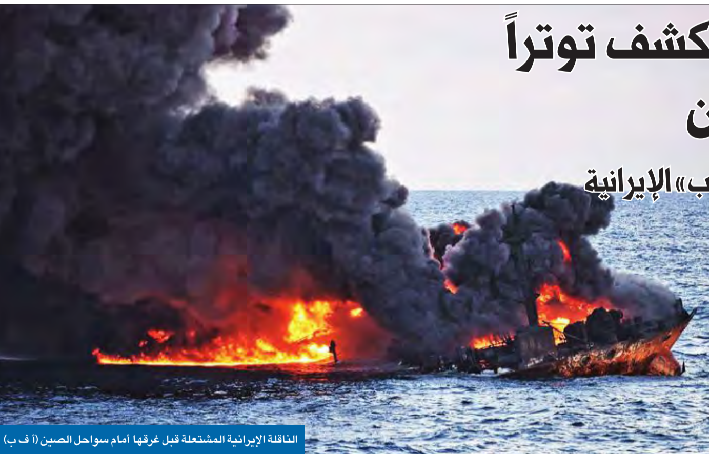
الناقلّة الإيرانية المشتعلة قبل غرقها أمام سواحل الصين