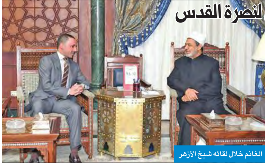
الغانم خلال لقائه شيخ الأزهر

استمع إلى شرح مفصل من القائمين على المركز ودوره في الرد على كل ما يثار عن الإسلام