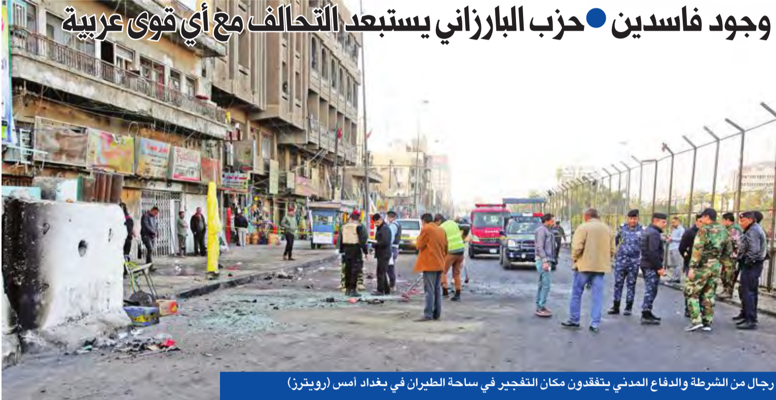
رجال من الشرطة والدفاع المدني يتفقدون مكان التفجير في ساحة الطيران في بغداد أمس

وسط تصاعد التوتر السياسي في العراق مع اقتراب موعد الانتخابات، وحالة الفوضى السياسية، التي تسود البلاد بسبب «زحمة» التحالفات الانتخابية، شهدت بغداد أمس هجوماً انتحارياً مزدوجاً أسفر عن مقتل 38 شخصاً في اندار قوى السطلمات بأن الخديا الإرهابية النائمة مستعدة للهجوم بعد شهر من إعلان هزيمة «داعش». وسمى تصاعد التوتر السياسي في العراق مع اقتراب موعد الانتخابات، وحالة الفوضى السياسية، التي تسود البلاد بسبب «زحمة» التحالفات الانتخابية، شهدت بغداد أمس هجوماً انتحارياً مزدوجاً أسفر عن مقتل 38 شخصاً في اندار قوى السطلمات بأن الخديا الإرهابية النائمة مستعدة للهجوم بعد شهر من إعلان هزيمة «داعش».