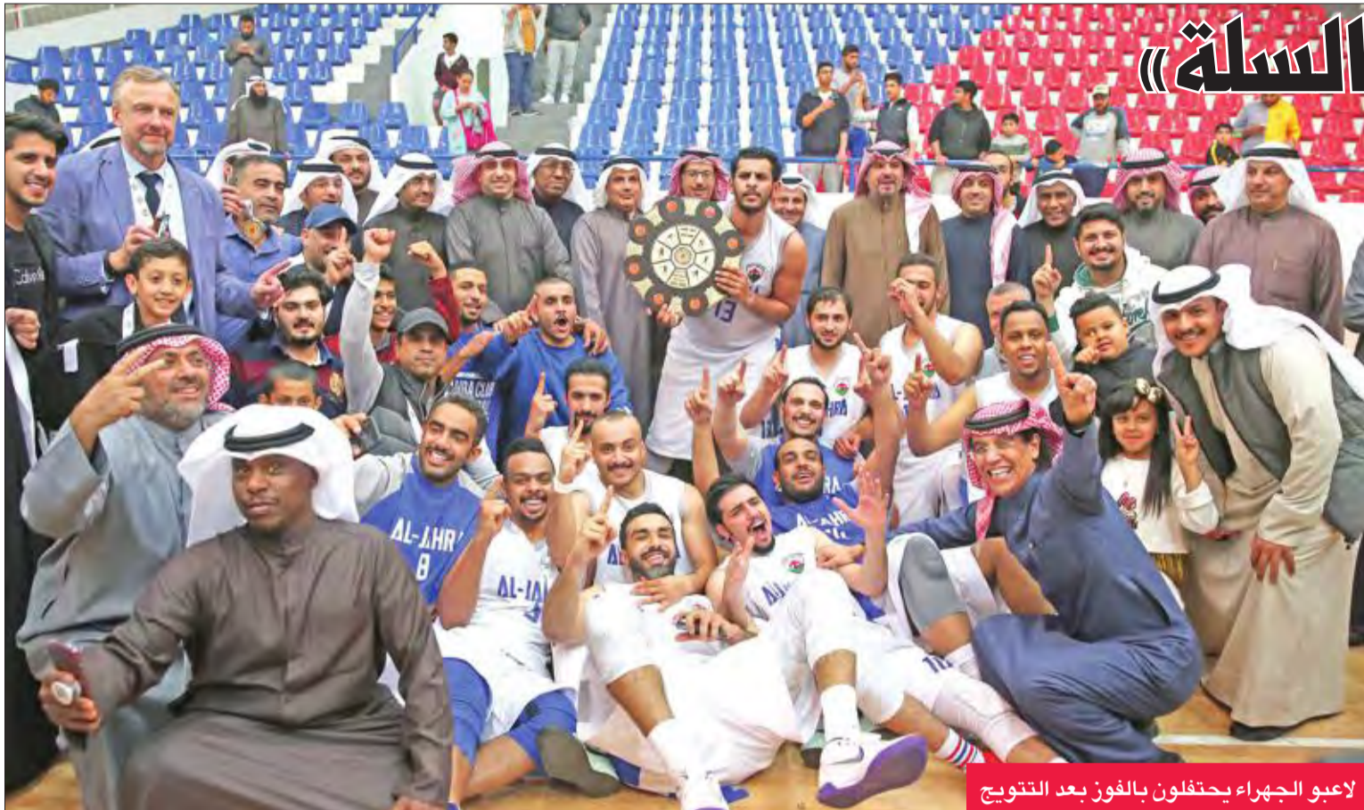
لاعبو الجهراء يحتفلون بالفوز بعد التتويج

وواصل القادسية صحوته في الربع الثالث، بعدما استنصر عجز لاعبي الجهراء عن التسجيل، بسبب دفاع القادسية القوي، ليدرك بعدها