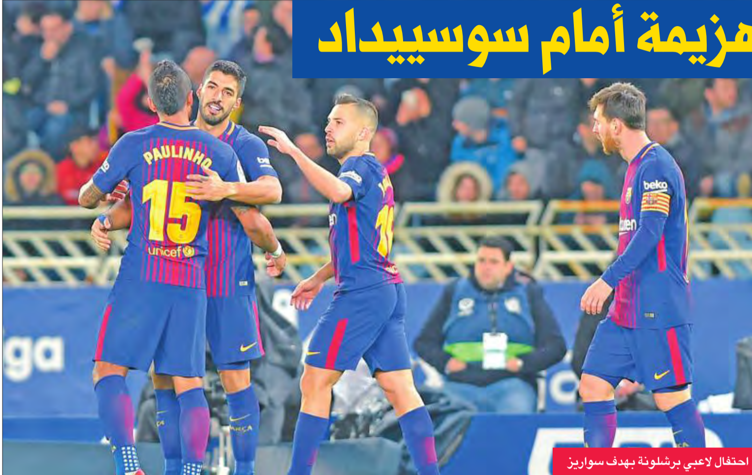
احتفال لاعبي برشلونة بهدف سواريز

بفوزه عليه الأحد 1-صفر بهدف لمانو غارسيا (52). وتوقف رصيد اشبيلية عند 29 نقطة وهو في المركز السادس حاليا، في حين تقدم الأفييس إلى المركز السابع عشر مع 18 نقطة.