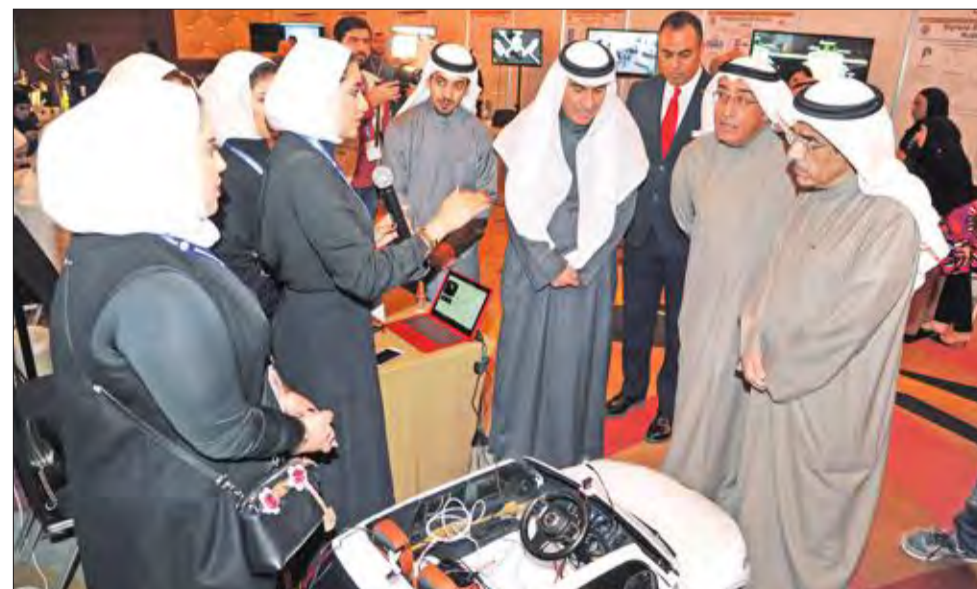
الوقيان خلال جولته في المعرض