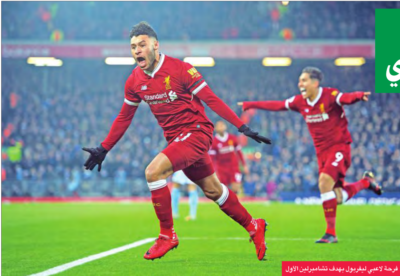
فرحة لاعبي ليفربول بهدف تشامبرلين الأول

في قمة المرحلة 23 من الدوري الإنجليزي الممتاز لكرة القدم، كبد ليفربول ضيفه مانشستر سيتي المتصدر هزيمته الأولى هذا الموسم، عندما هزمه 3-4 على ملعبه «أنفيلد» أمس الأول.