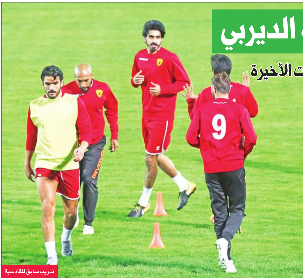
تدريب سابق للقادسية