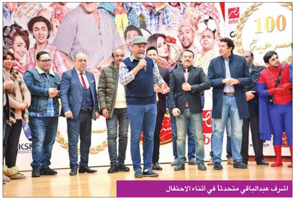
أشرف عبد الباقي متحدئا في أثناء الاحتفال