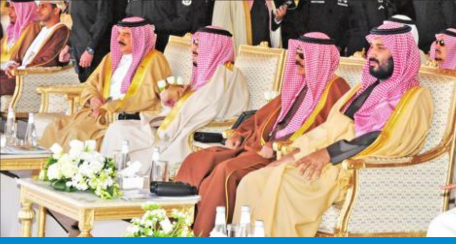
ممثل الأمير وخادم الحرمين خلال الحفل الختامي لمهرجان الإبل بتوسط ملك البحرين ومحمد بن سلمان

بديوان سمو ولي العهد الشيخ أحمد الجابر، وسفير الكويت لدى المملكة الشيخ ثامر الجابر، والأمين العام المساعد للأمانة والمعلومات ودعم اتخاذ القرار بالأمانة العامة لمجلس الوزراء الشيخ عبدالله سالم العلي.