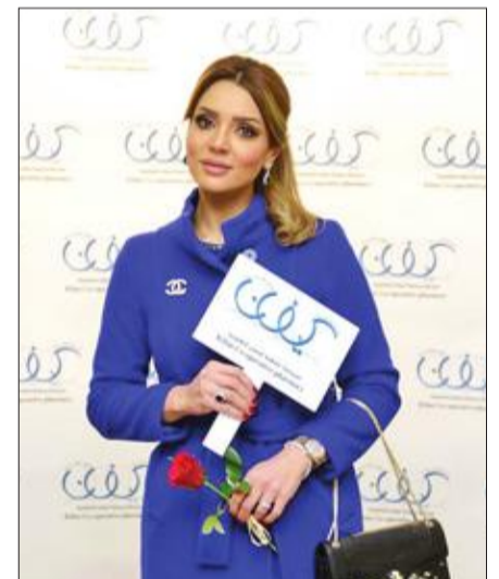
الفنانة عبير أحمد