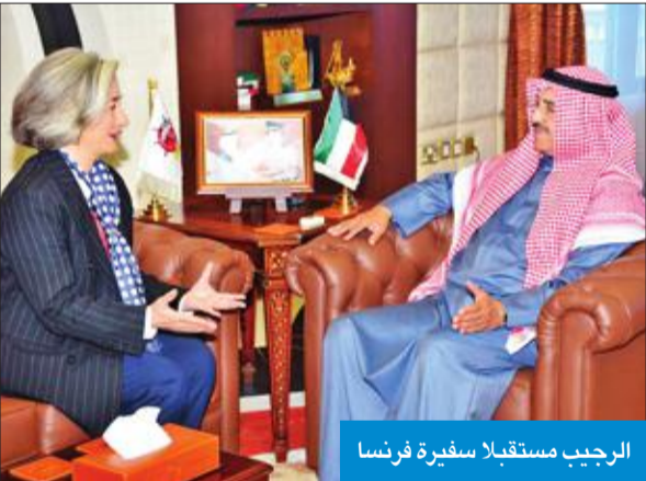
الرجب مستقبلاً سفيرة فرنسا

وحسن الاستقبال، متمنية للكويت حكومة وشعباً مزيداً من النجاح والإزدهار.