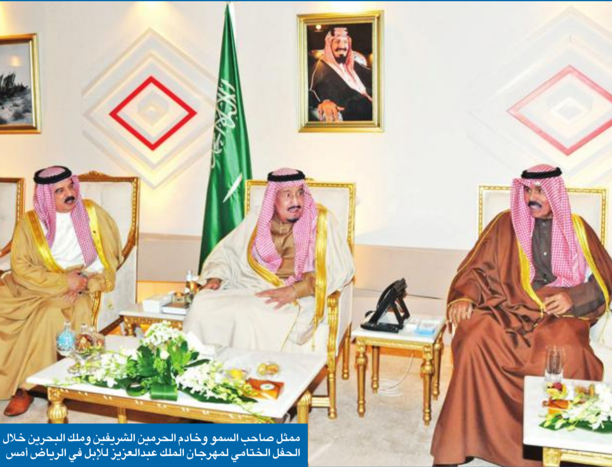
ممثل صاحب السمو وخادم الحرمين الشريفين وملك البحرين خلال الحفل الختامي لمهرجان الملك عبدالعزيز للإبل في الرياض أمس