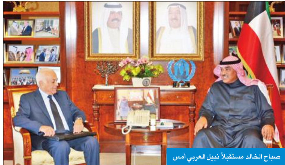
صباح الخالد مستقبلاً نبيلاً العربي أمس

الولايات المتحدة الاعتراف بالقدس عاصمة لإسرائيل، ونقل سفارتها إليها.