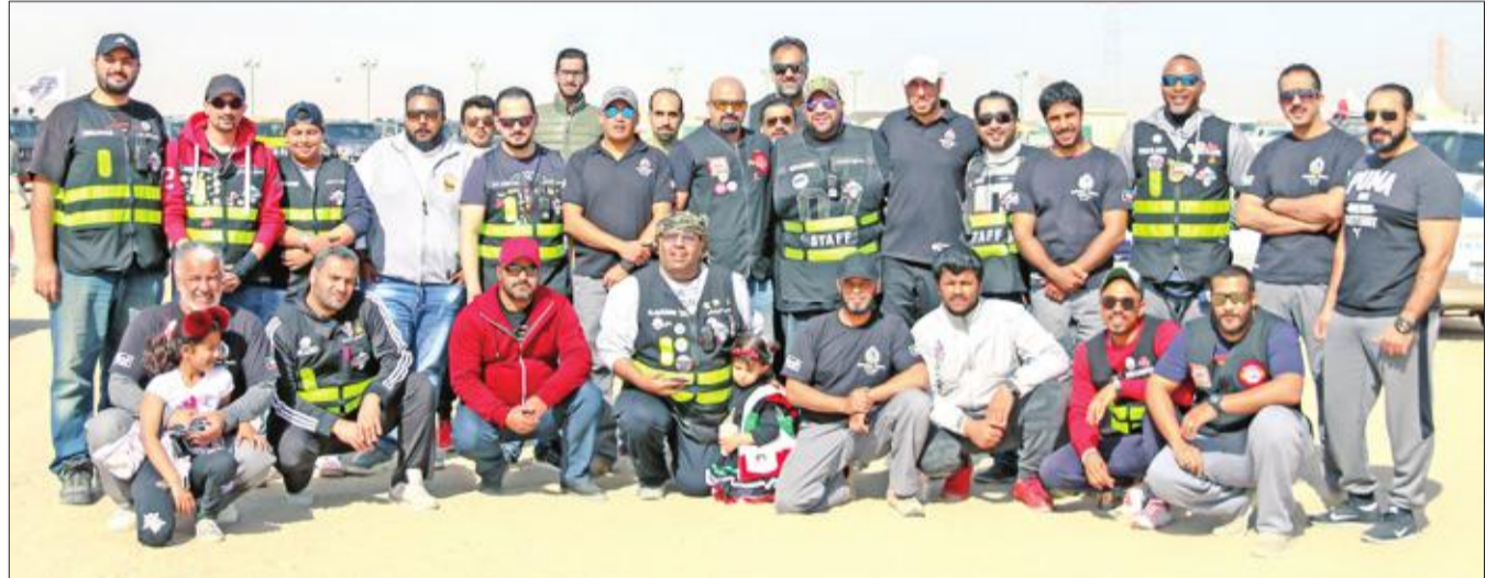
لقطة جماعية لعدد من المشاركين