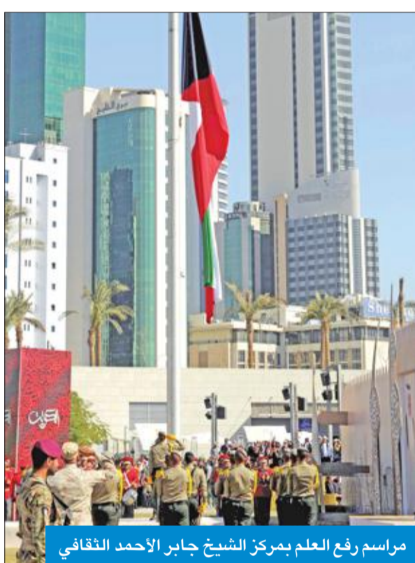
مراسم رفع العلم بمركز الشيخ جابر الأحمد الثقافي

وأوضح أن اختيار شعار الاحتفالات الوطنية لهذا العام «قائد حكيم... شعب وفي» يؤكد ما تتميز به الكويت من تماسك وقوة وحدتها الوطنية، لتظل الكويت واحة للديمقراطية والحرية والأمن والأمان والاستقرار.