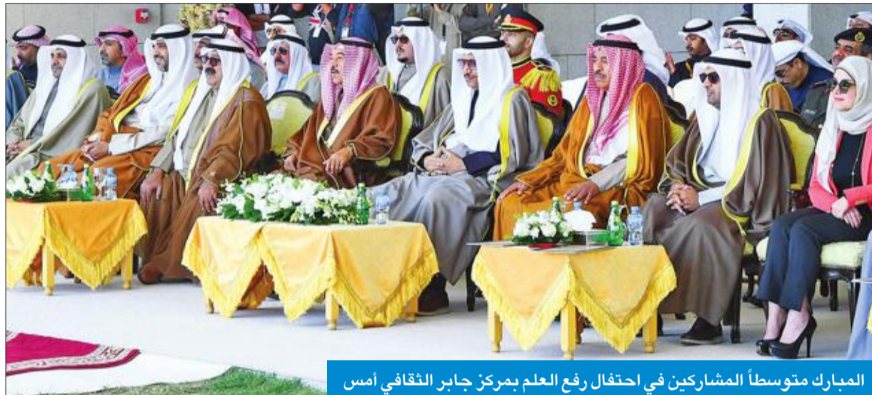
المبارك متوسلاً المشاركين في احتفال رفع العلم بمركز جابر الثقافي أمس

حضر مراسم رفع العلم في مركز جابر الثقافي وأشاد بتلاحم الشعب وتجديد العهد بالقيادة