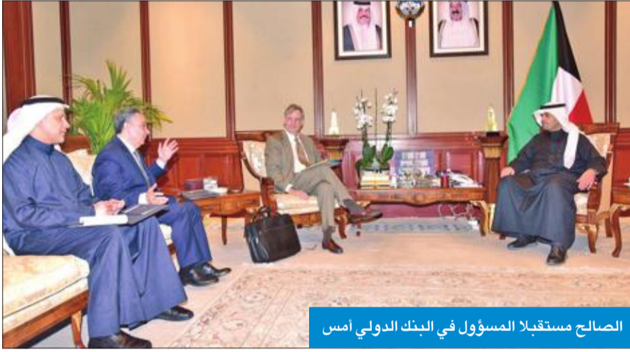
الصالح مستقبلاً المسؤول في البنك الدولي أمس

البلدين الصديقين، وتطرق اللقاء لمناقشة العديد من الموضوعات ذات الاهتمام المشترك لاسيما المتعلقة بتفعيل التعاون الثنائي والعلاقات بين البلدين لتشمل كل المجالات فضلاً عن دعم روابط الصداقة الكويتية الفرنسية.