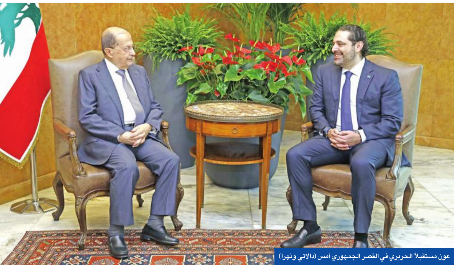
عون مستقبلاً الحريري في القصر الجمهوري أمس

انتشرت، أخيراً على مواقع التواصل الاجتماعي، فيديوهات، لسيارات في داخلها سلاح تجول على الطرقات، وهي تبت أغاني لحركة «أمل» بينها أغنية عنوانها «نحن الأفواج التي ما في قوة بنهزمنا». كما انتشر فيديو مماثل مع أغاني لـ«التيار الوطني الحر»، والقوات اللبنانية، فيها شدّ للعصبة الطائفي واستحضار لرمز الحرب الأهلية. وقال ناشطون، إن السيارة نفسها ظهرت في الفيديو، متهمة جهات لم تتسمها بإشعال الفتنة.