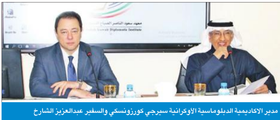
مدير الأكاديمية الدبلوماسية الأوكرانية سيرجي كورزونسكي والسفير عبدالعزيز الشارح

المعهد، السفير عبدالعزیز الشارح، مع السفير كورزونسكي إيماناً بتفعيل اتفاقية التعاون في المجال الدبلوماسي سبق أن وقعت بين المعهدين الأوكراني والكويتي.