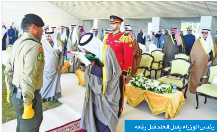
رئيس الوزراء يقبل العلم قبل رفعه

«المناسبات الوطنية ملحمة فريدة قادها الشرفاء دفاعاً عن الوطن»