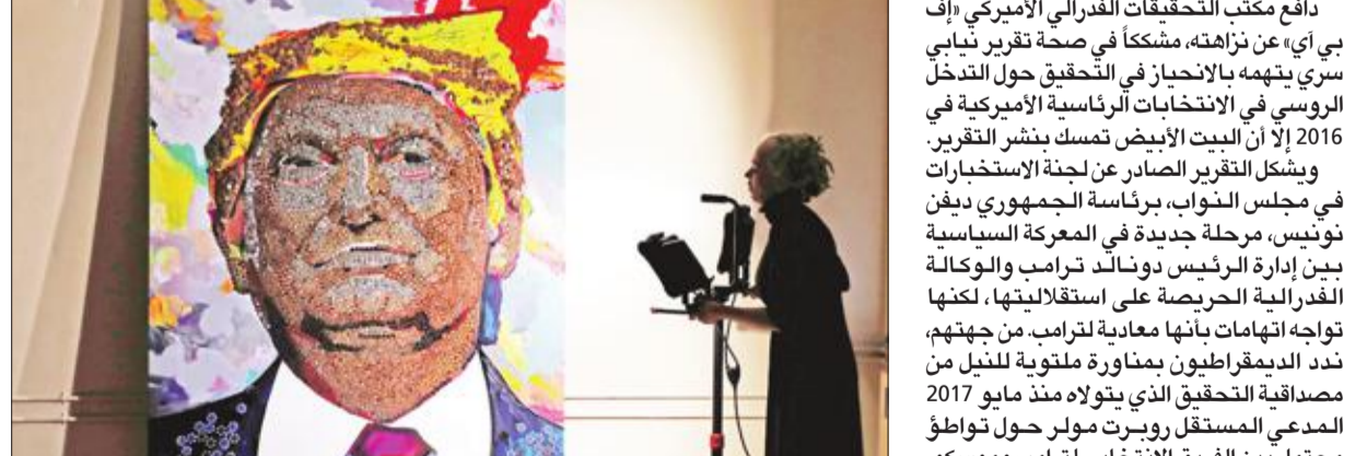
لوحة لترامب من تصميم الفنانين داريا مارتشينكو ودانيال غرين عرضت في نيويورك أمس الأول

دافع مكتب التحقيقات الفدرالي الأميركي «إف بي آي» عن نزاهته، مشككاً في صحة تقرير نيابي سري يتهمه بالانحياز في التحقيق حول التدخل الروسي في الانتخابات الرئاسية الأميركية في 2016 إلا أن البيت الأبيض تمسك بنشر التقرير. ويشكل التقرير الصادر عن لجنة الاستخبارات في مجلس النواب، برئاسة الجمهوري ديفن نونيس، مرحلة جديدة في المعركة السياسية بين إدارة الرئيس دونالد ترامب والوكالة الفدرالية الحرص على استقلاليتها، لكنها تواجه اتهامات بأنها معادية لترامب من جهته. ندد الديمقراطيون بمناورة ملقوبة للنيل من صداقية التحقيق الذي يتولاه منذ مايو 2017 المدعي المستقل روبرت مولر حول تورط محتمل بين الفريق الانتخابي لترامب وموسكو. وكانت وكالات الاستخبارات الأميركية خلصت بالاجتماع في اواخر 2016 إلى حصول تدخل من موسكو، لكن ترامب نفى دائماً أي تواطؤ مع الكرملين. وصارحت اللجنة مساء الإثنين على نشر التقرير الواقع في أربع صفحات، رغم المعارضة الشديدة لوزارة الدفاع والدفاب بي آي، إذ تتضمن الوثيقة على ما يبدو معلومات حساسة حول عمليات مكافحة التجسس الأميركية. وأكد أن ترامب لم يعط أهمية كبرى للموضوع، وإن لاحد النواب مساء الثلاثاء أن الوثيقة «ستنشر 100 في المئة لا تلقوا»، بينما أوضح كبير موظفي البيت الأبيض جون كيلي لشبكة «فوكس نيوز»، أمس الأول، أن التقرير «سينشر قريباً جداً وسيستنى للعالم بأسره الاطلاع عليه»، وتلمح الوثيقة حسب ما أوردت وسائل