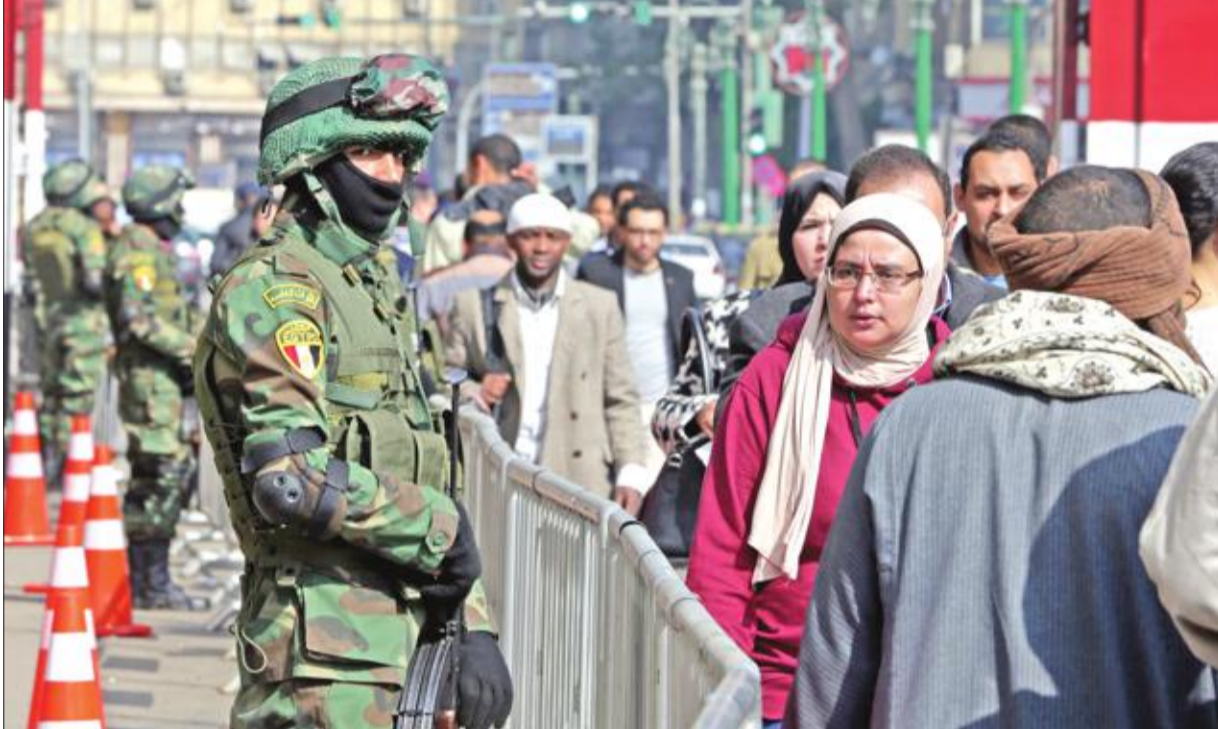
صورة بثت أمس عن التموذج الأمني قرب مقر الهيئة العليا للانتخابات في القاهرة بتاريخ 29 يناير الماضي

● مصر ترحب بتصنيف واشنطن «حسم» إرهابية ● تأجيل زيادة أسعار تذاكر القطارات