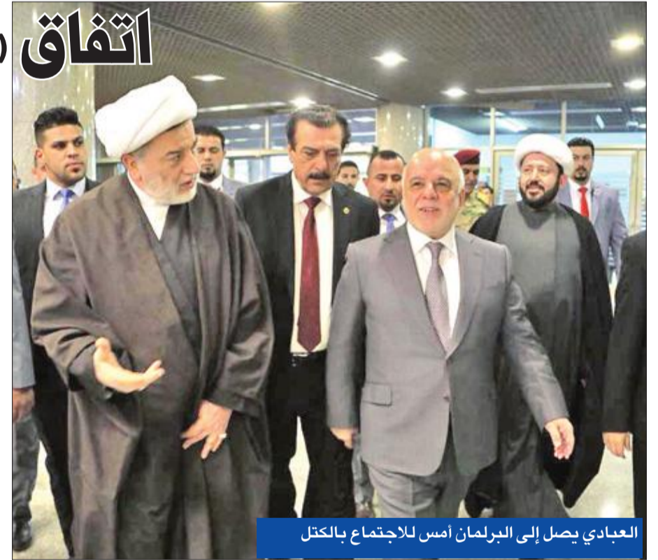
العبادي يصل إلى البرلمان أمس للاجتماع بالكلت

أعلنت حكومة إقليم كردستان العراق، أمس، أن وفد الحكومة الاتحادية، الذي زار الإقليم أخيراً، توصل مع حكومة كردستان إلى «اتفاق مبدئي» موقع من ست نقاط لحل الأزمة بينهما. وقال المتحدث باسم الحكومة سفين درزي، في مؤتمر صحفي: «نحن ننتظر موافقة رئيس الوزراء حيدر العبادي». إلى ذلك، اجتمع رئيس الحكومة العراقية حيدر العبادي، أمس، مع رؤساء الكتل النيابية ومع الكتلة الكردية، في محاولة لتزوير الموازنة التي تلقى خصوصاً رفض الأكراد. واعتبر العبادي أن نسبة الـ 17 في المئة من الموازنة التي كانت تُمنح لإقليم كردستان، «مجرد اتفاق سياسي كان معمولاً به في السابق». وشكا رئيس الحكومة أن «التخصيصات الموجودة في العراق لا تكفي لجميع العراقيين»، مشدداً على أن «التخفيض شمل كل محافظات العراق، ولم يستثن أحداً، وليس لدينا هدف في إقليم كردستان إلا إحقاق العدالة»، مشيراً إلى أنه «منذ 13 عاماً لم نسلم أي بياناً عن الموظفين في الإقليم». وإذ أشار إلى أن العراق «بدأ دفع ديون نادي باريس والكويت»، أكد العبادي أن «حصة البشمركة من الموازنة ثابتة دون تغيير». في الإطار، استقبل نائب رئيس جمهورية العراق نوري المالكي، أمس، باقلاً جلال الطالباني، نجل الرئيس العراقي السابق، والمتهم بتسليم كركوك لبغداد باتفاق مع إيران.