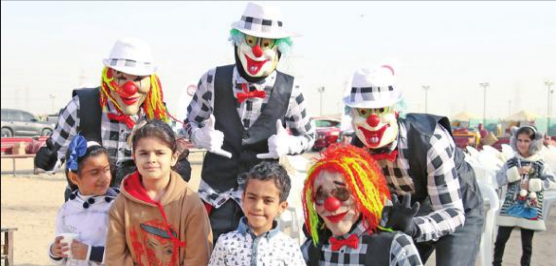
فقرات ترفيهية بمشاركة المهرجين

نظم النادي العلمي الكويتي يوماً مفتوحاً لذوي الإعاقة وكبار السن ومرضى السرطان. واستضاف مخيم النادي للطيران بمنطقة الخيران مجموعة كبيرة من المعاقين وكبار السن وعائلاتهم والجهات والمراكز والفرق التطوعية التي لها دور فعال في مساندة ومساعدة ذوي الإعاقة، وذلك بحضور رئيس مجلس إدارة النادي العلمي طلال الخرافي، والأمين العام علي الجمعة.