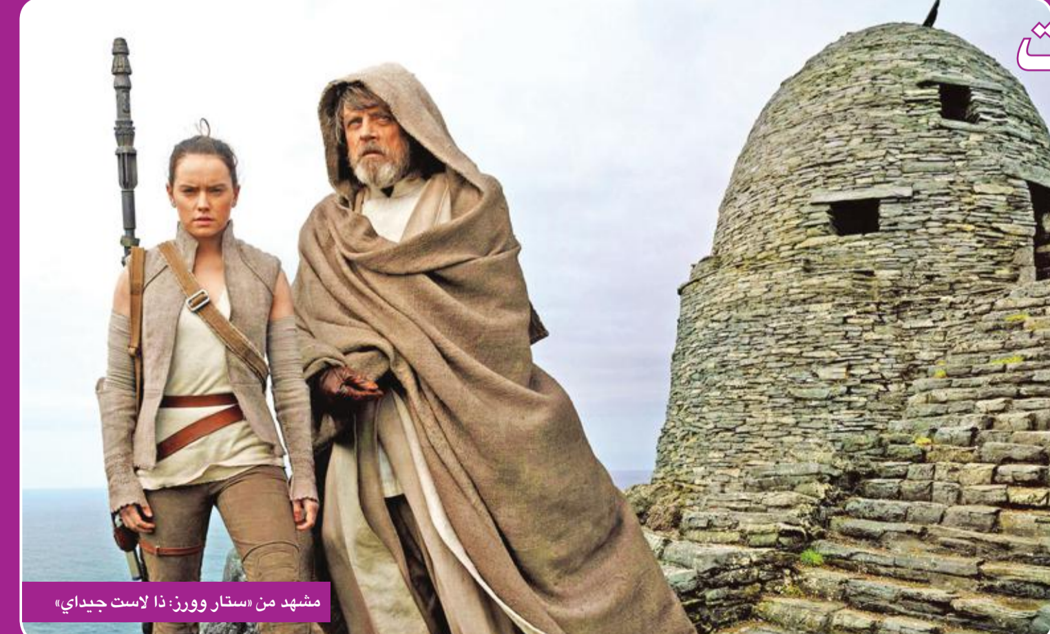
مشهد من «ستار وورز: ذا لاست جيديا»

حقق فيلم "ستار وورز: ذا لاست جيديا"، إيرادات بلغت مليارات 312 مليون دولار، في شبك التذاكر العالمي خلال أسبوعه السابع، وذلك بعد عرضه في أكثر من 4232 دار عرض سينمائية حول العالم، منذ طرحه في 15 ديسمبر الماضي، وفقاً لما ذكره موقع بوكس أوفيس موجو الأميركي.