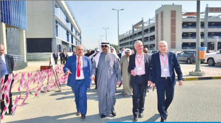
المشعل يفقد مشروع توسعة مستشفى الفروانية

المشعل تفقد المشروع واطلع على آخر مستجداته