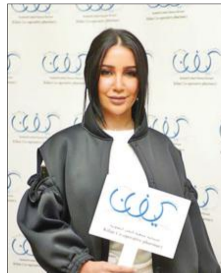
الفنانة أمل العنبري