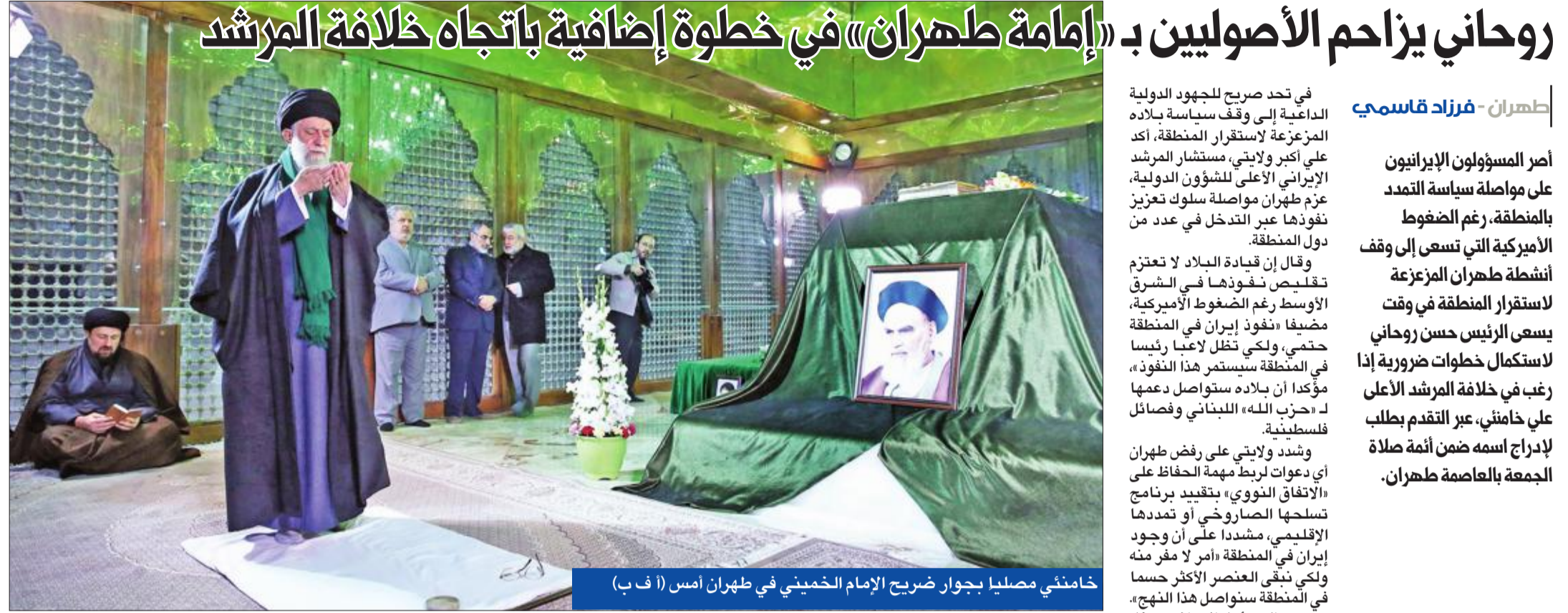
خامنئي مصليا بجوار ضريح الإمام الخميني في طهران أمس