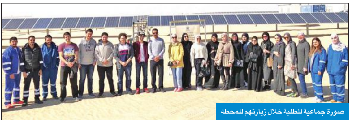
صورة جماعية للطلبة خلال زيارتهم للمحطة

العنزي: القسم حريص على إعطائهم فرصة التعرف على الجانب العملي