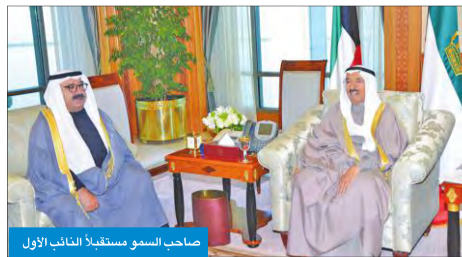
صاحب السمو مستقبلاً النائب الأول

والعافية وللحلاقات الطيبة بين البلدين الصديقين المزيد من التطور والنماء. كما بعث سموه ببرقية تعزية إلى رئيس الولايات المتحدة دونالد ترامب، أعرب فيها سموه عن خالص تعازيه وصادق مواساته بضحانيا الحادث الناجم عن تصادم قطارين، والذي وقع في ولاية ساوث كارولينا، وأسفر عن سقوط عدد من الضحايا والمصابين، راجباً سموه للضحايا الرحمة، وللمصابين سرعة الشفاء. وبعث سمو ولي العهد الشيخ نواف الأحمد، ورئيس مجلس الوزراء سمو الشيخ جابر المبارك ببرقيات ماثلة.