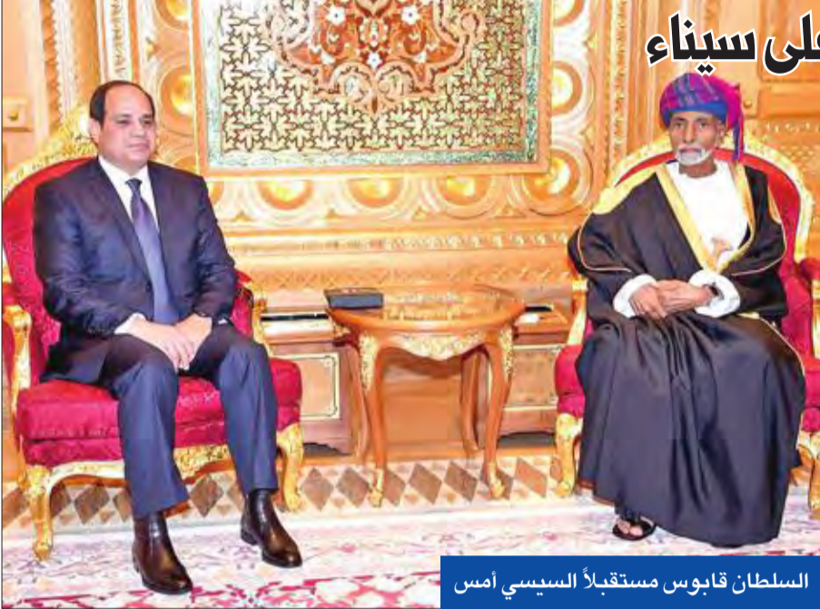
السلطان قابوس مستقبلاً السيسي أمس

وبعد نشر صحيفة "نيويورك تايمز" تقريراً زعمت فيه وجود تنسيق إسرائيلي - مصري لمواجهة الإرهاب في سيناء، عبر السماح للمقاتلات الإسرائيلية بضرب بؤر إرهابية في سيناء المصرية، نفى الناطق باسم الجيش المصري، العقيد تامر الرفاعي، أمس، تقرير الصحيفة الأميركية، وأضاف في تصريحات له، أن حديث "نيويورك تايمز"، افتراء وكذب محض، "الهدف منه إشاعة البلبلة في مختلف الأوساط الداخلية والخارجية". وتابع المتحدث: "العمليات التي تجريها قوات الجيش في شبه جزيرة سيناء، ومشاركة عناصر من الشرطة، تحقق نجاحات كبيرة، ولاسيما خلال الآونة الأخيرة". وقال قائد القوات المصرية في حرب تحرير الكويت، اللواء محمد علي بلال، لـ "الجريدة": "لا تنسيق أمني بين مصر