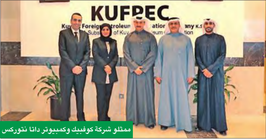
ممثلو شركة كوفبيك وكمبيوتر داتا نتوركس

التي ينبغي توافرها لدى خبراء قطاع تقنية المعلومات والذين يتوقع منهم لعب دور أساسي في دعم الجهود الوطنية الرامية إلى تحفيز عجلة نمو القطاعات الحيوية في الكويت، وبناء اقتصاديات مستدامة قائمة على المعرفة، من خلال الاستفادة من أحدث الحلول والخدمات التقنية.