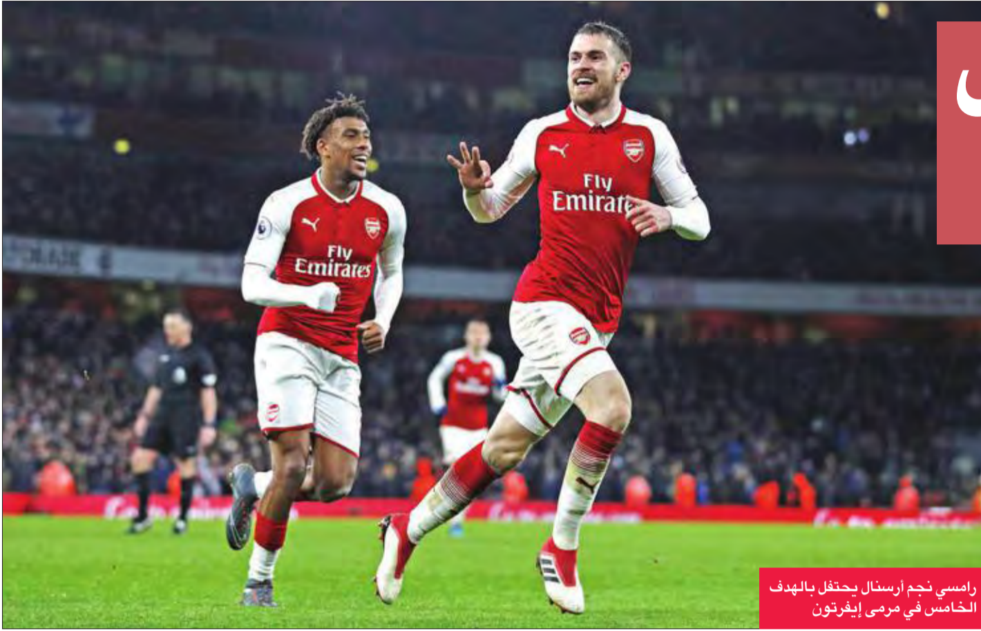
رامسي نجم أرسنال يحتفل بالهدف الخامس في مرعى إيفرتون

حقق الغابوني بيار- إيميريك أوباميانغ بداية مثالية مع فريقه الجديد أرسنال وسجل أحد الأهداف في المباراة التي حسمها فريقه الجديد بنتيجة حاسمة 5-1 ضد ضيفه إيفرتون، أمس الأول، في المرحلة السادسة والعشرين من الدوري الإنجليزي.