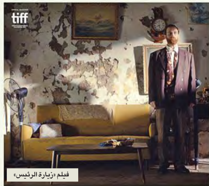
فيلم «زيارة الرئيس»

تتضمّن أمسية الأفلام اللبنانية القصيرة برنامج «البيانون فاكتور» المؤلف من أربعة أفلام قصيرة مشتركة بين مخرجين شباب لبنانيين وأجانب هي: «تشويش» إخراج أحمد عصين ولوسى لاشيميا، و«أوتيل النعيم» إخراج شيرين أبو شقرا ومانويل ماري بيروني، و«سلامات من ألمانيا» إخراج أونا غوجاك بالتعاون مع رامي قديح، و«غران ليبانو» إخراج مينة عقل ونيون فيالوبوس. عرضت هذه الأفلام في افتتاح «أسبوعي المخرجين» ضمن «مهرجان كان» السينمائي الفرنسي في مايو 2017. خلال الأمسية ستعرض للمرة الأولى