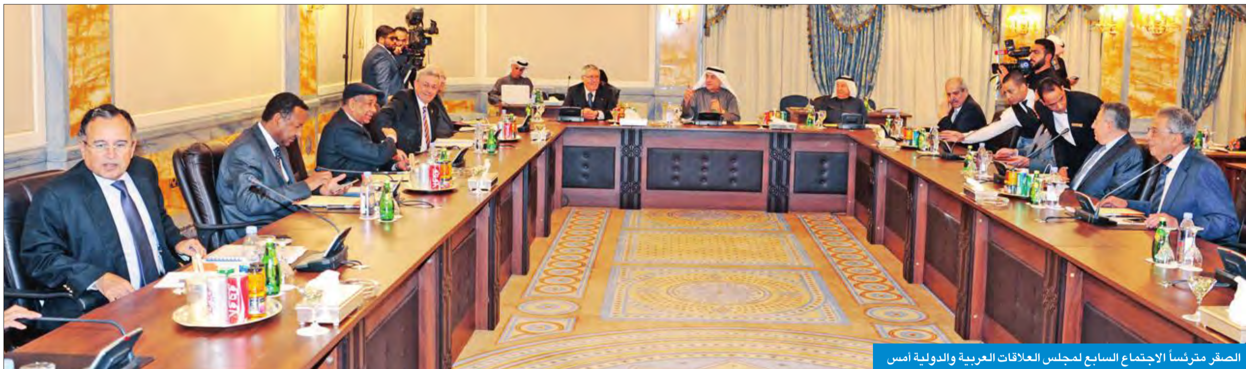
الصقر مترئساً الاجتماع السابع لمجلس العلاقات العربية والدولية أمس

الصقر: الملف الفلسطيني على رأس الأولويات ونأمل إنجاز ما نصبو إليه