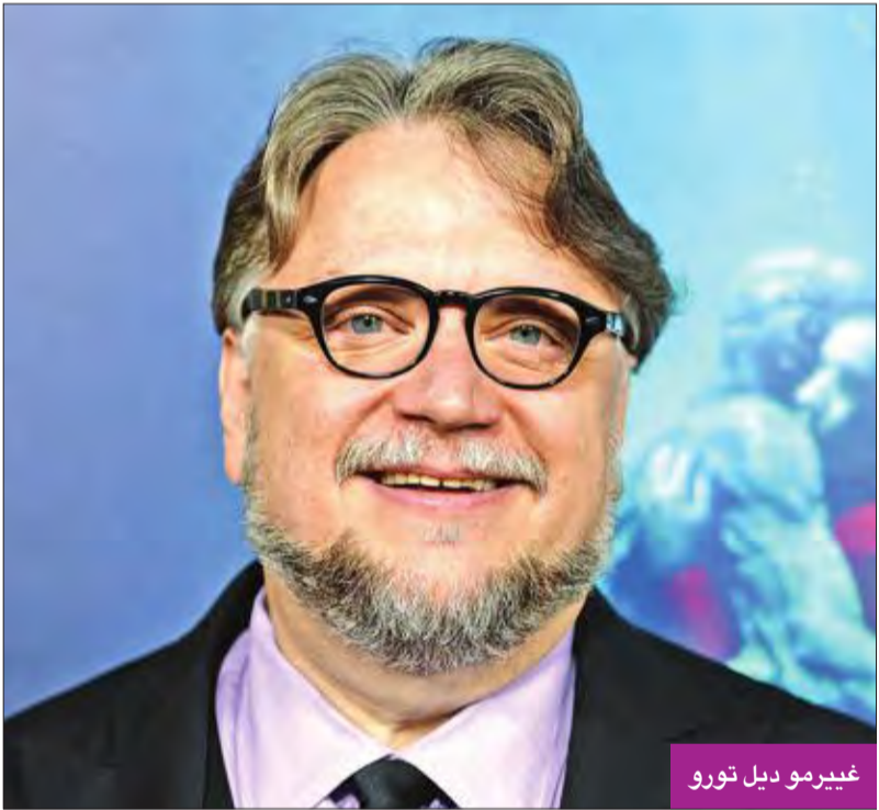
غييرمو ديل تورو

نال المخرج غييرمو ديل تورو في لوس انجلس الجائزة الكبرى لنقابة المخرجين (دي جي ايه) عن فيلمه "ذي شيب أوف ووتر" الذي يتصدر السباق لجوائز أوسكار في دورتها المقبلة مع 13 ترشيحاً. ونال العمل الجائزة الرئيسية لنقابة منتجي هوليوود (بي جي ايه) التي تمثل مع جائزة المخرجين (دي جي ايه) مؤشرين مهمين إلى هوية الفائز المقبل بجائزة أوسكار لأفضل فيلم. (أ ب)