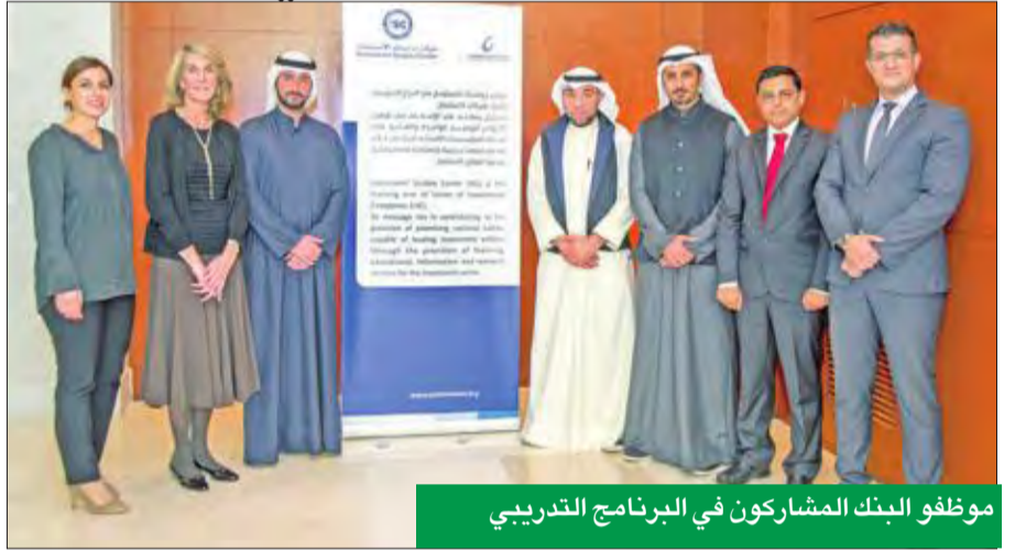
موظفو البنك المشاركون في البرنامج التدريبي

ويهدف البرنامج التدريبي إلى تزويد المشاركين بأفضل الممارسات والأساليب الدولية المتبعة في تمويل المشاريع، وتطوير البنية التحتية الأساسية من الكهرباء والماء والنقل والسكن نظراً للتوسع في المشاريع داخل الكويت، إضافة إلى التوجه الحكومي لإشراك القطاع الخاص في هذه المشاريع وتفعيل هذه الشراكة. وتضمنت ورشة العمل عدة محاور أهمها طبيعة الشراكة بين القطاع الحكومي والخاص والأدوار والمهام المنوطة لكل قطاع ومصادر التمويل وطرق تحديد وتقييم مخاطر المشاريع.