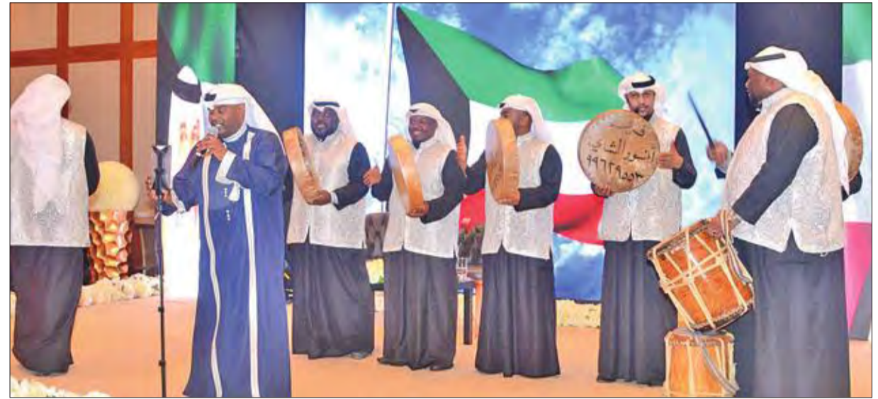
فقره لفرقة أنور الشامي