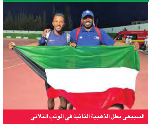
السبعيني بطل الذهبية الثانية في الوثب الثلاثي