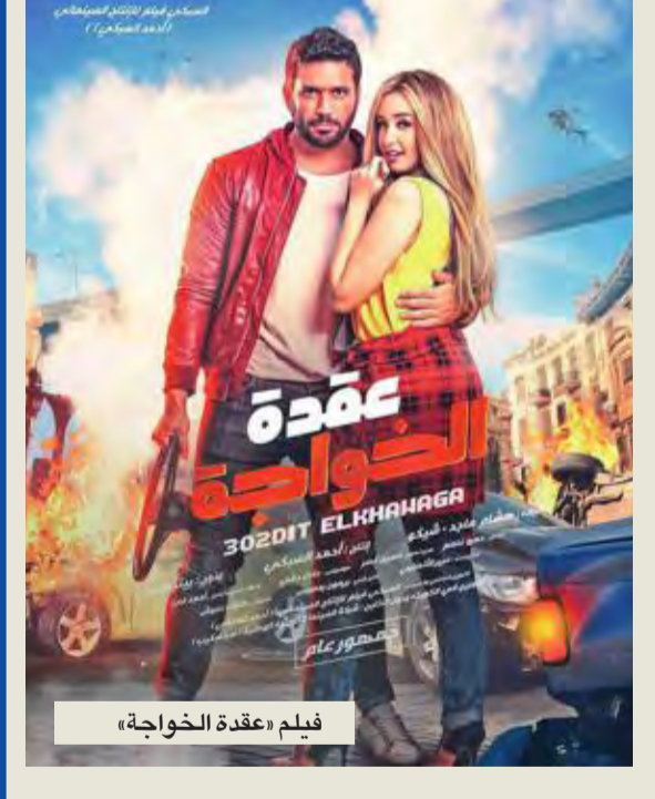
فيلم «عقدة الخواجة»