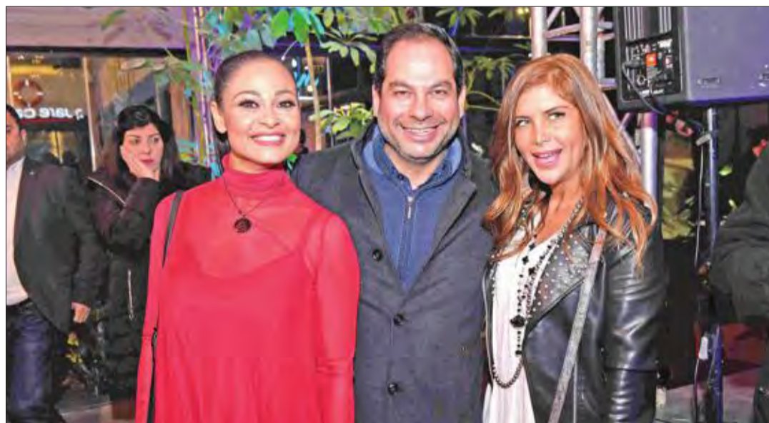
الممثلة برناديت حدب وميشال فزي والفنانة لين لحد