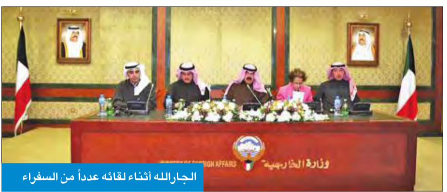
الجارالله اثناء لقاءه عدداً من السفراء

المتوقع مشاركتها بنحو 100 منظمة، في حين سيخصص اليوم الثاني للقطاع الخاص الذي سيشارك للمرة الأولى في مؤتمر معني بالمانحين، حيث أنه وبعد تمديد الفترة المحددة للتسجيل تم تسجيل نحو 1800 شركة ورجل أعمال. وأضاف أن اليوم الثالث سيشهد الافتتاح الرسمي للمؤتمر، والذي ستكون رئاسته مشتركة بين الكويت والعراق والأمم المتحدة، إضافة إلى الاتحاد الأوروبي والبنك الدولي.