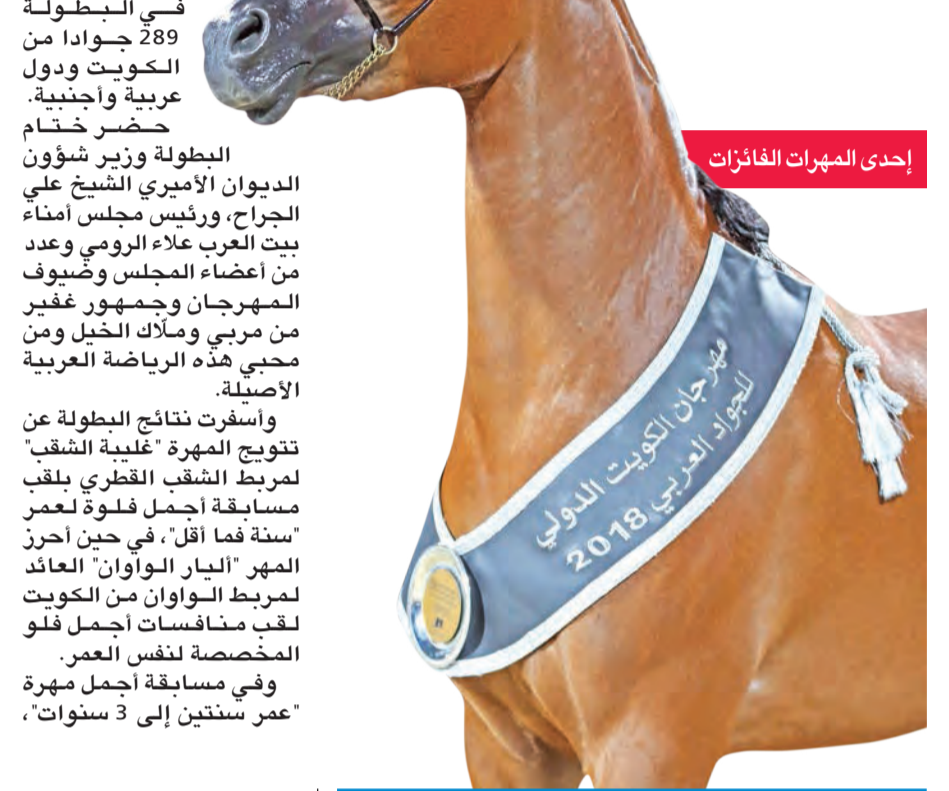
إحدى المهرات الفائزات

توجت المهرة «غلبة الشقب» بلقب أجمل فلوة لعمر «سنة فما أقل»، في حين أحرز الجواد «آر دي هارينادو» المركز الأول لأجمل مهر من عمر سنتين إلى 3 سنوات، في ختام بطولة جمال الخيل العربية.