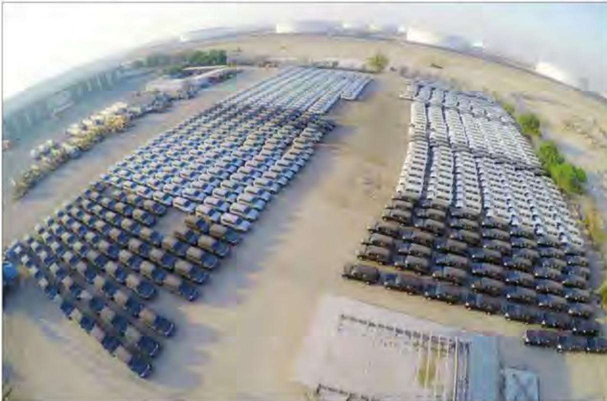
استول سيارات ميتسوبيشي باجيرو الجديدة