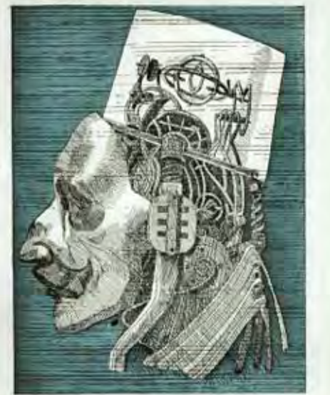
فيلم «آخر أيام رجل الغد»

يتناول فيلم «تشويش» قصة سعيد الذي يتولى وظيفة حارس، مركزه تحت جسر فؤاد شهاب في وسط بيروت. في أول يوم عمل له، يُؤدي سعيد مهمته بكثير من الجدية، لكن مع حلول الصباح، يُدرك أنه عاجز إزاء ما يحصل أمامه، ولا يحرس عملياً أي شيء. أما فيلم «أوتيل النعيم» فيروي قصة شخصين يلتقيان عند شاطئ البحر، وسرعان ما يسر كل منهما إلى الآخر بتفاصيل عن حياته ومشاكله، أحدهما مقاول يسيّد ميني ضخماً في بيروت، والثاني مقامر فقد الكثير مما يملكه بسبب مراهنته الخاسرة، يدير فندقاً متواضعاً ملاصقاً لهذا المبنى. وسرعان