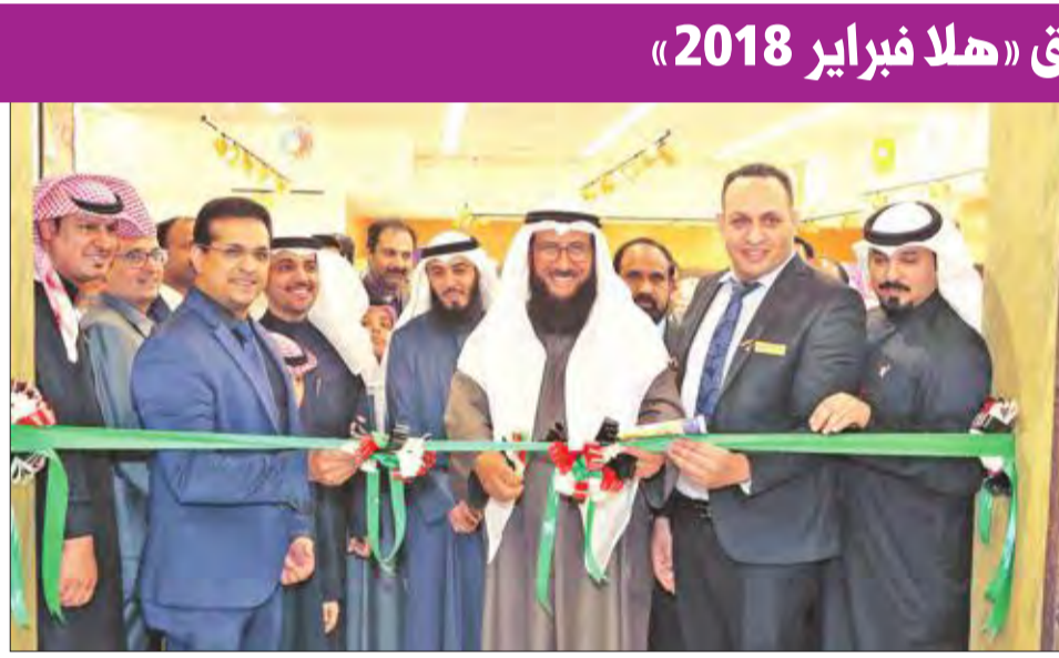
قص شريط الافتتاح