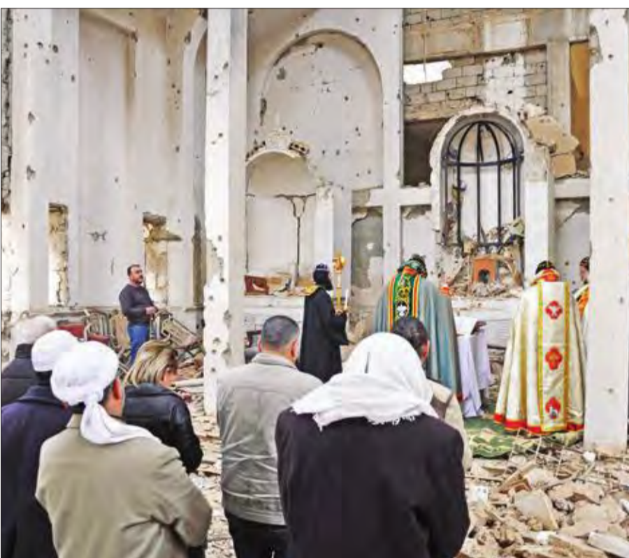
الكنيسة السريانية المدمرة في دير الزور تجري أول قداس أمس الأول (أ ف ب)

«البتاغون» تنفي تسليح حلفائها في سورية بمضادات جوية... وروسيا تستخدم «سلاحاً بالغ الدقة» في إدلب