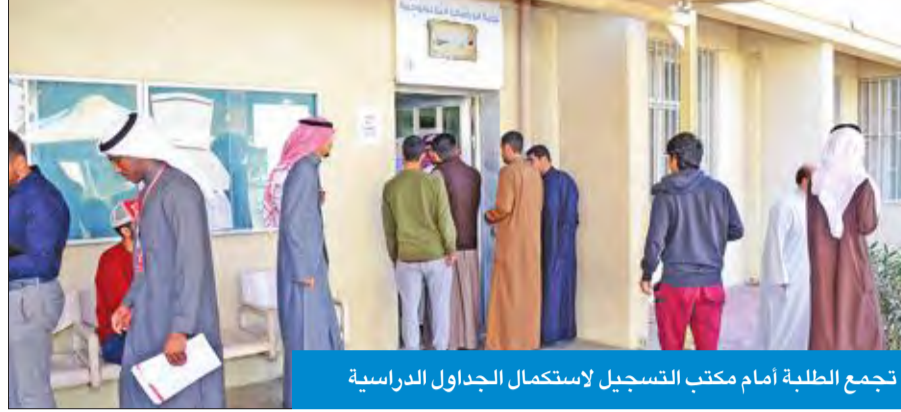
تجمع الطلبة أمام مكتب التسجيل لاستكمال الجداول الدراسية

بالحضور، باستثناء حالات غياب خفيفة لا تذكر. إلى ذلك، أعلنت عمادة القبول والتسجيل في «التطبيقي» عن طرح مواعيد السحب والإضافة للطلبة ممن لديهم 10 وحدات أو أقل من خلال مراجعة نظام التسجيل الإلكتروني.