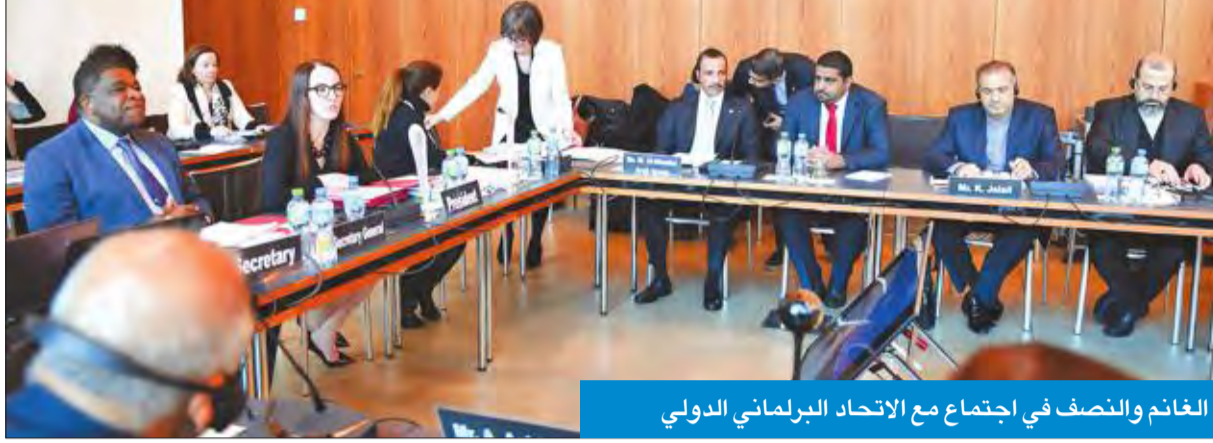
الغانم والنصف في اجتماع مع الاتحاد البرلماني الدولي

النصف: تتضمن اتهامات بالتعدي على حقوق الإنسان وسيتم تنفيذ كل ما جاء فيها