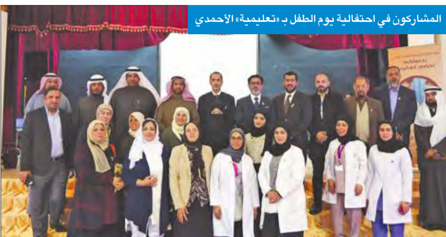
المشاركون في احتفالية يوم الطفل بـ تعليمية الأحمدية

وقال العمومي، إن اهتمام دول مجلس التعاون الخليجي بتخصيص يوم للطفل الخليجي