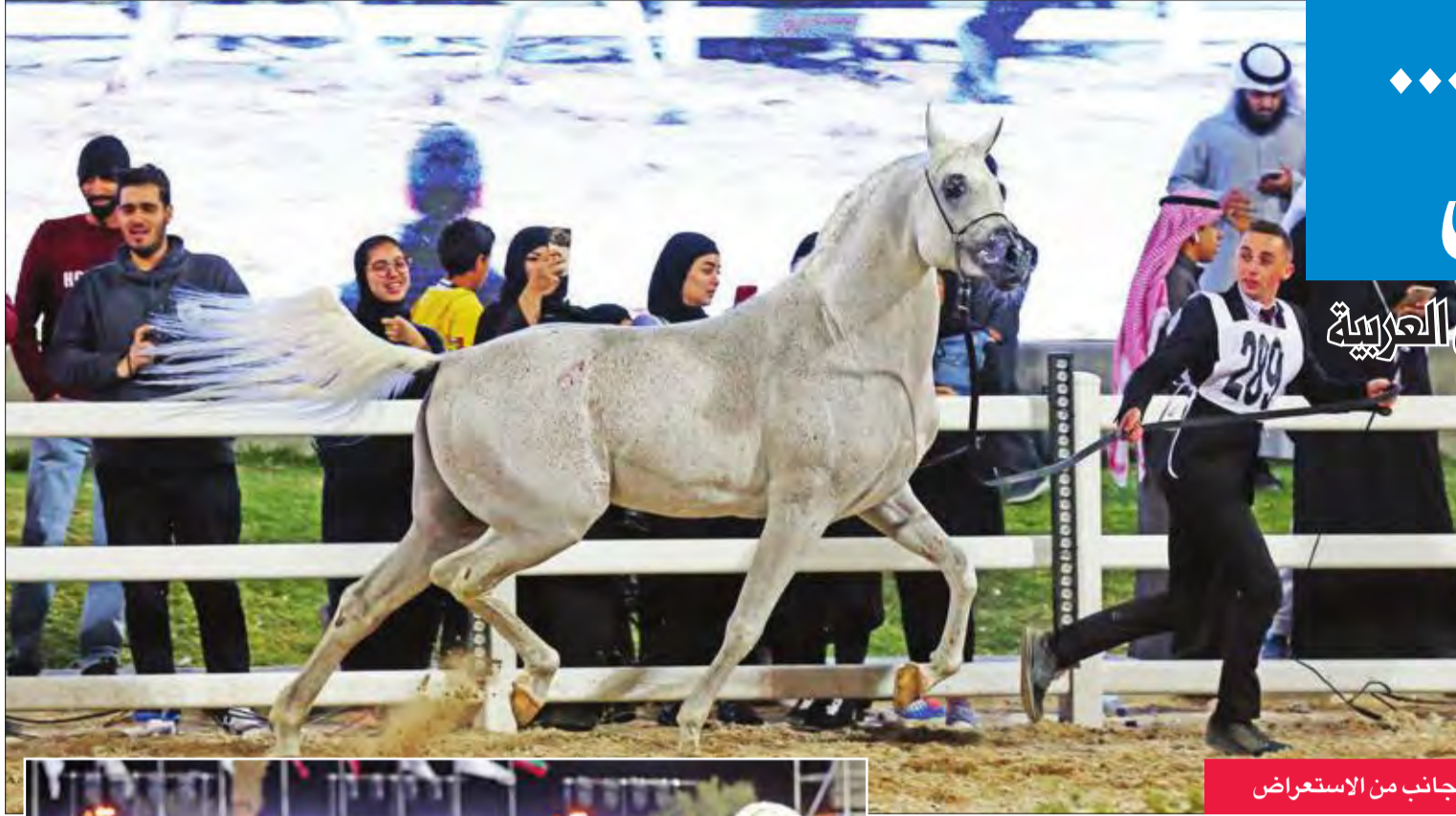
جانب من الاستعراض

في ختام منافسات البطولة الدولية السابعة لجمال الخيل العربي