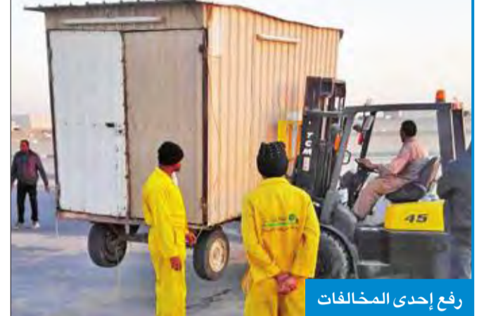
رفع إحدى المخالفات

وأضاف الخرينج أن الحملة أسفرت عن تحرير 11 مخالفة بائع متجول