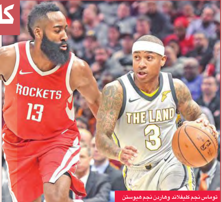
توماس نجم كليفلاند وهاردن نجم هيوستن

أمسية لم يكن فيها نجم هيوستن جيمس هاردن في أفضل أحواله، إذ اكتفى بتسجيل 16 نقطة، أي أقل من نصف معدله في مباريات هذا الموسم، الذي وصل إلى 31 نقطة. أما نجم كليفلاند ليرون جيس، فأنهى المباراة مع 11 نقطة، ولم يشارك في الربع الأخير من المباراة بعدما بدأ واضحا أن نتيجتها حسمت دون رجعة. وهذه الخسارة هي ثاني أسوأ نتيجة لكليفلاند هذا الموسم، بعدما خسر