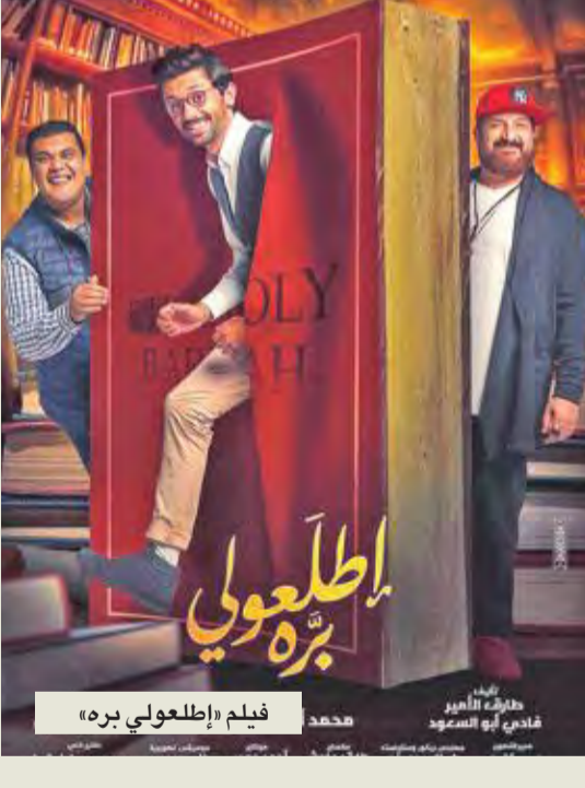
فيلم «اطلعولي بره»