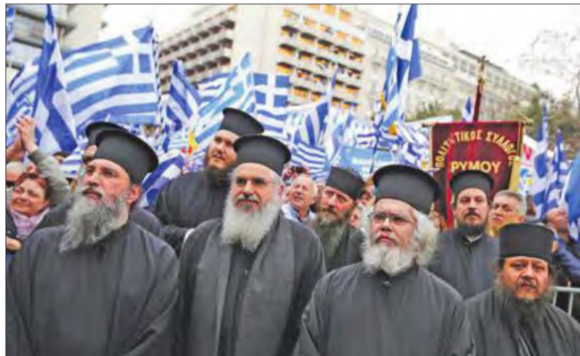
رجال دين مسيحيون ارتوذكس خلال تظاهرة في اثينا ترفض أي تسوية بشأن اسم مقدونيا (رويترز)

شارك مئات الآلاف من اليونانيين، أمس، خارج مقر البرلمان في اثينا، في تظاهرة للتعبير عن معارضتهم لاستخدام اسم مقدونيا في أي تسوية مستقبلية تسعى الحكومة للتوصل إليها مع الجمهورية اليوغسلافية السابقة لإنهاء نزاع على الاسم مستمر منذ عقود. وهذه التظاهرة الثانية خلال 15 يوماً حول موضوع اسم مقدونيا، تنظمها وتمول القسم الأكبر من تكاليفها، جاليات يونانية في الخارج وبناد عسكريين متقاعدين وجمعيات كنسية وثقافية من مقدونيا اليونانية.