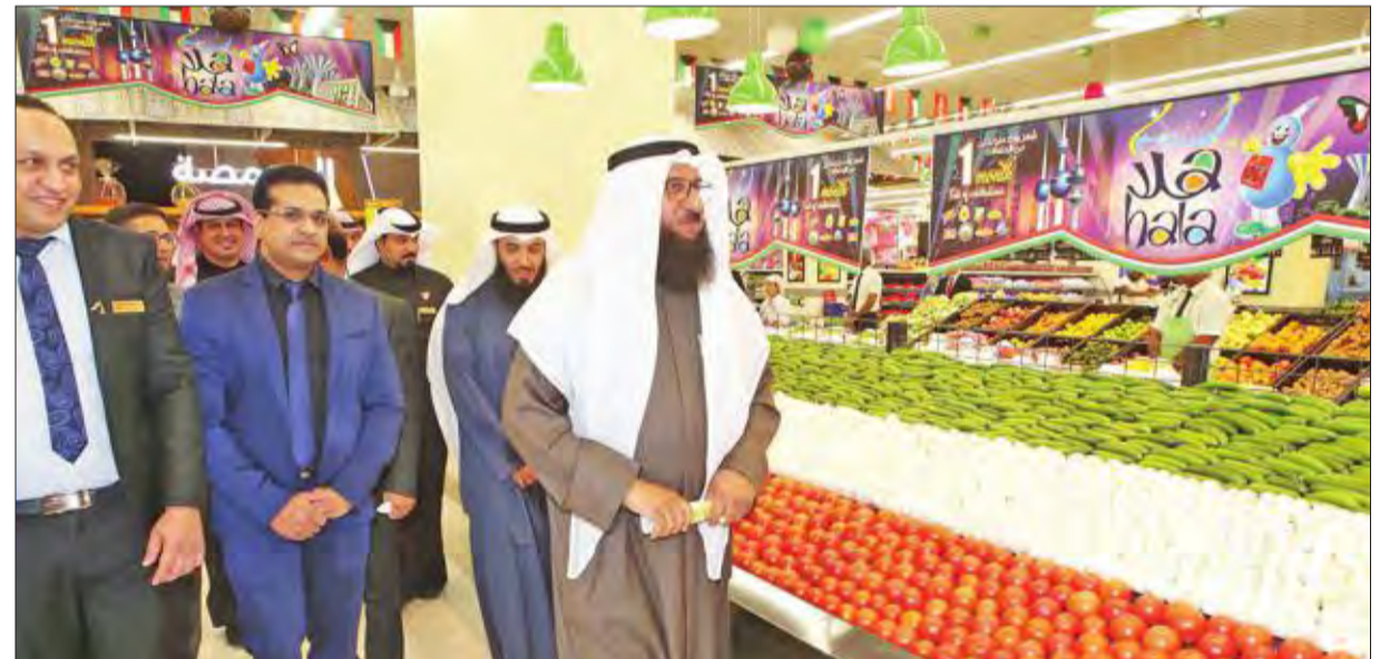
جولة للاطلاع على المنتجات الكويتية المعروضة