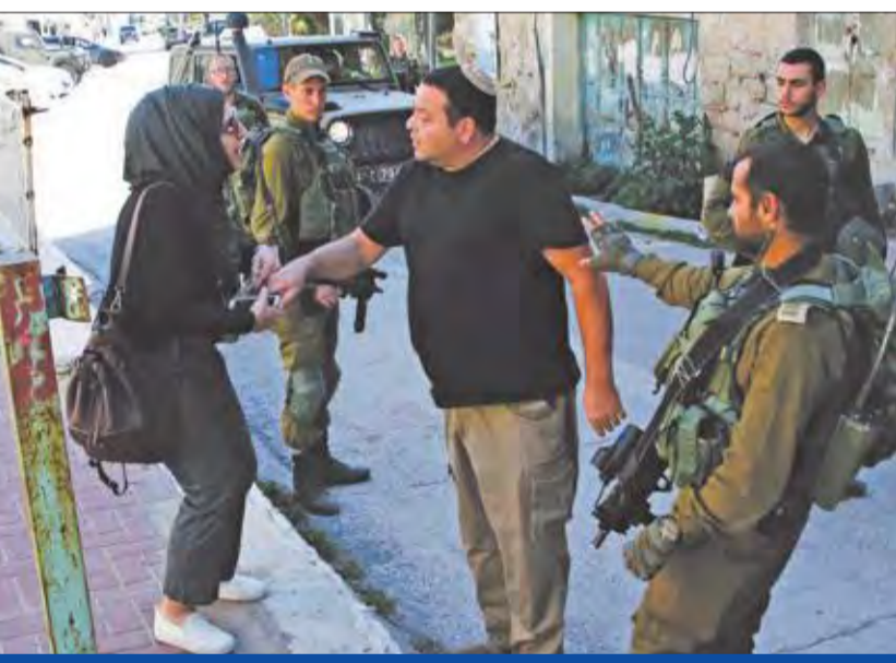
مستوطن إسرائيلي يواجه مراسلة فلسطينية قرب جيب استيطاني في الخليل أمس

اعترافها بـدولة فلسطين على حدود عام 1967، وإلغاء قرار ضم القدس الشرقية، ووقف الاستيطان».