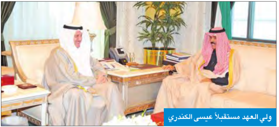
ولي العهد مستقبلاً عيسى الكندري

استقبل سمو ولي العهد الشيخ نواف الأحمد، بقصر السيف، صباح أمس، سمو رئيس مجلس الوزراء الشيخ جابر المبارك، ورئيس مجلس الأمة بالإنيابة عيسى الكندري، والنائب الأول لرئيس مجلس الوزراء وزير الدفاع الشيخ ناصر صباح الأحمد. واستقبل سموه، نائب رئيس مجلس الوزراء وزير الخارجية الشيخ صباح الخالد، ونائب رئيس مجلس الوزراء وزير الداخلية الشيخ خالد الجراح. كما استقبل سموه، نائب رئيس مجلس الوزراء وزير الدولة لشؤون مجلس الوزراء أنس الصالح، ووزيرة الشؤون الاجتماعية والعمل وزيرة الدولة للشؤون الاقتصادية هناد الصبيح.