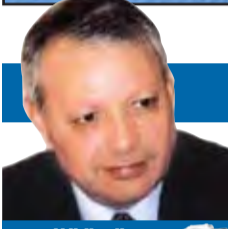
صالح القلب كاتب وسياسي أردني

العربي، وأثبتوا أن هذه الأمة ستبقى معطاءة حتى في أحلك الظروف وأصعبها، وأن ما قدموه أثبت أن العروبة الأصيلة لم تغب ولم تمت. وبقينا، فإنّ ما قدمه أطفالنا في هذا البرنامج العظيم، وفي هذه الفضائيات الطلائعية المعطاءة لا يقل طلائعية عما قدمه روادنا الأوائل في مرحلة سابقة صعبة، أصبح فيها الشعور والوجدان القومي كيصيب ضوء شمعة في كهف مظلم نهايته بعيدة. وعليه، فإنني أعتقد أن جامعتنا العربية يجب أن تتبنى إنجازات هذا البرنامج العظيم في هذه القناة العظيمة بإبداعاتها الفنية والأدبية، وأيضاً السياسية الرائعة، والمؤكد أن هؤلاء الأطفال الذين سمعنا تغريداتهم الجميلة في برنامج "الأصوات الشابة" هم حاضر ومستقبل هذه الأمة، مثلهم مثل نظرائهم في مجالات هامة أخرى تدل كلها على أن هذه الأمة العظيمة معطاءة، وستبقى معطاءة رغم ما تتعرض له من محاولات تخريب وتمزيق واقتلاع وقضاء على ما في قلبها من إبداعات كثيرة.