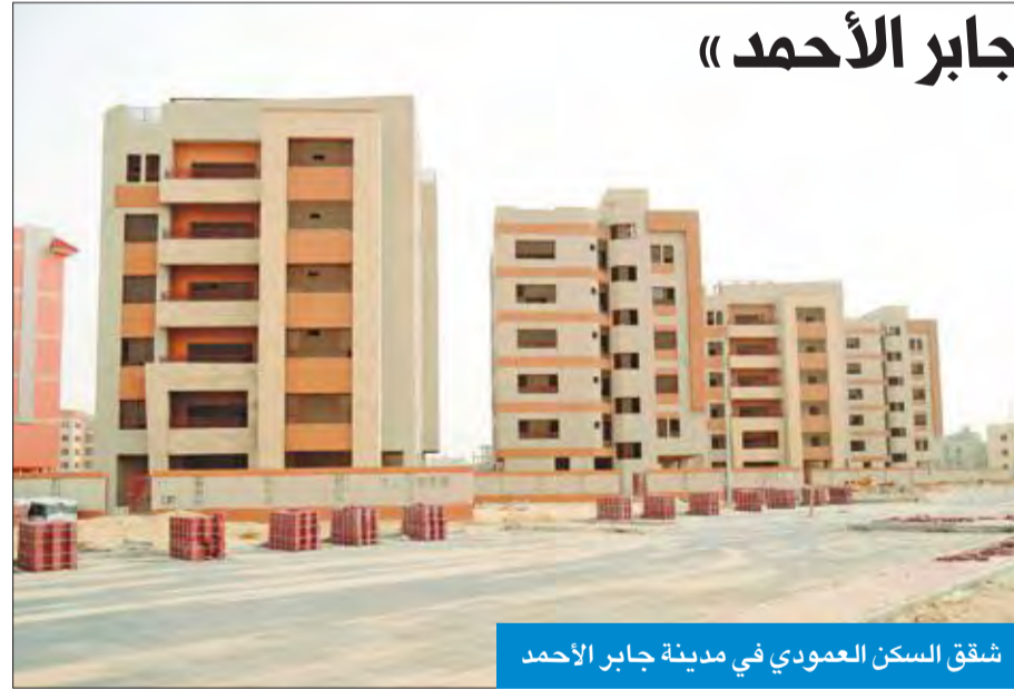
شقق السكن العمودي في مدينة جابر الأحمد

وأضاف التقرير أن قطاع التحفيز يباشر أعمال صيانة مركز الشباب بالقطاع N3 في المدينة ذاتها بقيمة 8 ملايين