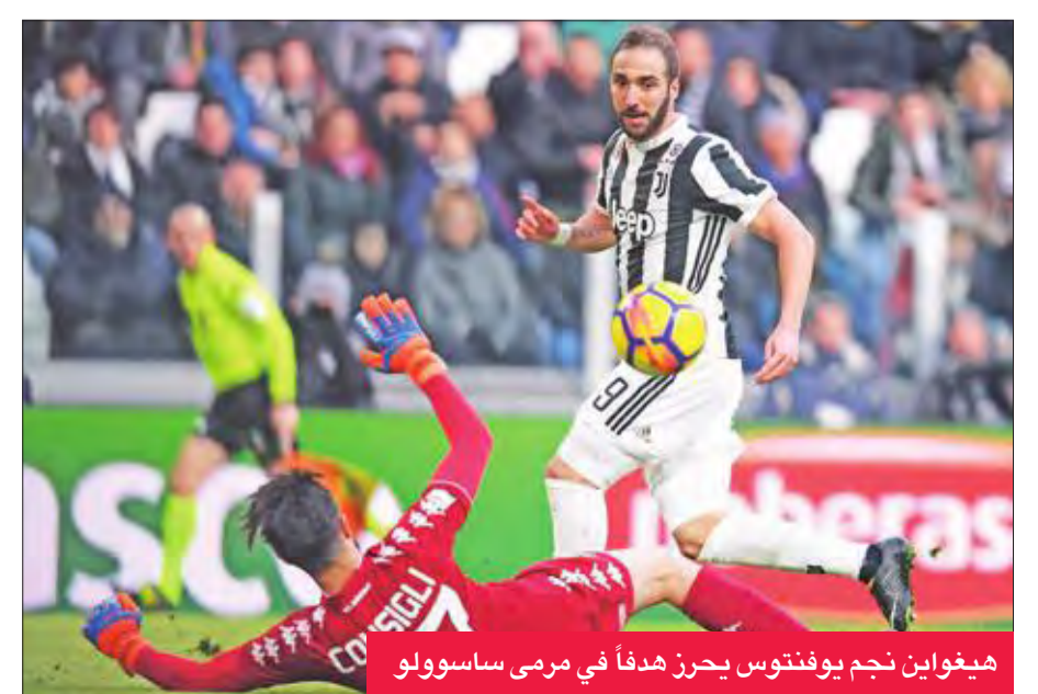
هيغواين نجم يوفنتوس يحرز هدفاً في مرمره ساسوولو

الدقيقتين 24 و27، قبل أن يختم البوسني ميراليم بيانيتش مهرجان الشوط الأول بالهدف الرابع في الدقيقة 38. وفرض المهاجم الدولي الأرجنتيني غونزالو هيغواين نفسه نجماً للشوط الثاني بتسجيله هاتريك في الدقائق 63 و74 و83، رافعا رصيده إلى 13 هدفاً على لائحة الهدافين. روما يهزم فيرونا وفي المباراة الثانية على ملعب مارك أنتونيو بنتيغودي في فيرونا، حقق نادي روما فوزه الأول في سبع مباريات في الدوري يتغلبه بصعوبة على ضيفه هيلاس فيرونا صاحب المركز قبل الأخير 1- صفر، مما أتاح له الاقتراب من المراكز المؤهلة لمسابقة دوري أبطال أوروبا الموسم المقبل. واكتفى روما بهدف للاعبه التركي جنكيز أونس قبل انقضاء الدقيقة