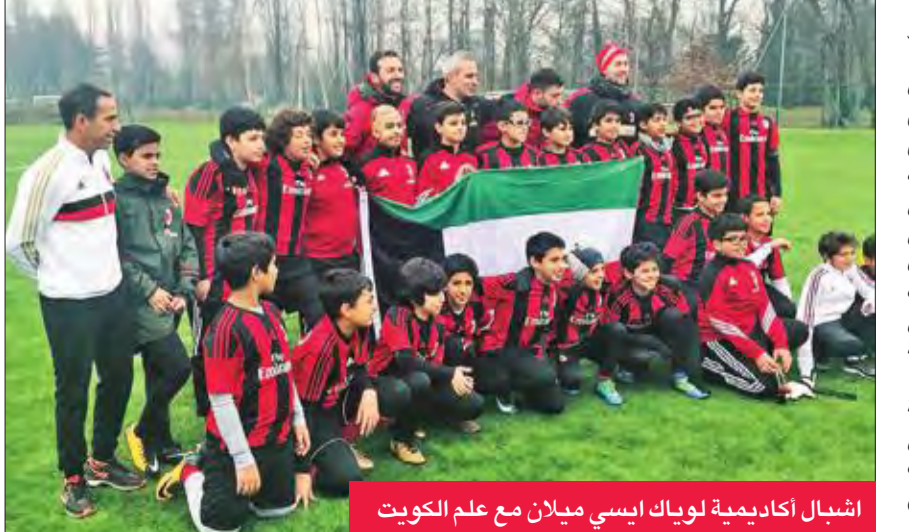
اشبال أكاديمية لويك ايسي ميلان مع علم الكويت

خاض اشبال أكاديمية لويك إي سي ميلان «الكويت» تجربة فريدة من نوعها، وذلك بعد زيارتهم إلى مدينة ميلانو الإيطالية، خلال مسعكر تدريبي في مقر نادي ميلان «الميلانيو»، ومتابعتهم تدريبات الفريق الأول عن كثب ومشاهدتهم نجوم الفريق ولقاؤهم بالمدير الفني جنارو غاتوزو واللاعب الدولي السابق الأسطورة فرانكو باريزي. تضمنت الرحلة زيارة إلى مركز رابطة النادي الميلان والتدريب في مركز النادي التدريبي «فيزارا» بالإضافة إلى زيارة متحف النادي «الموندو ميلان» والاستمتاع بمشاهدة تاريخ وإنجازات النادي العريق، الذي يحمل في طياته العديد من الألقاب والإنجازات التي تصنفه من