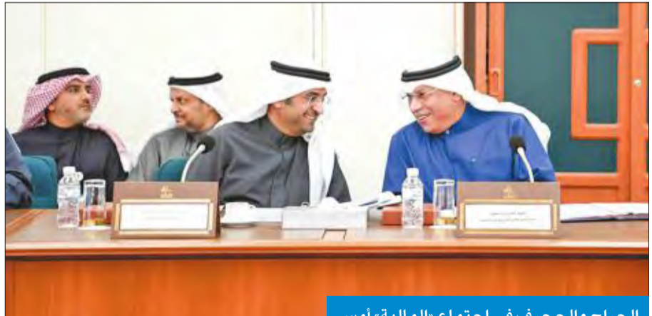
الجراح والحجرف في اجتماع «المالية» أمس

يستفيد منها من أحيل إلى التقاعد من 28 أبريل 2008 حتى 31 ديسمبر 2009