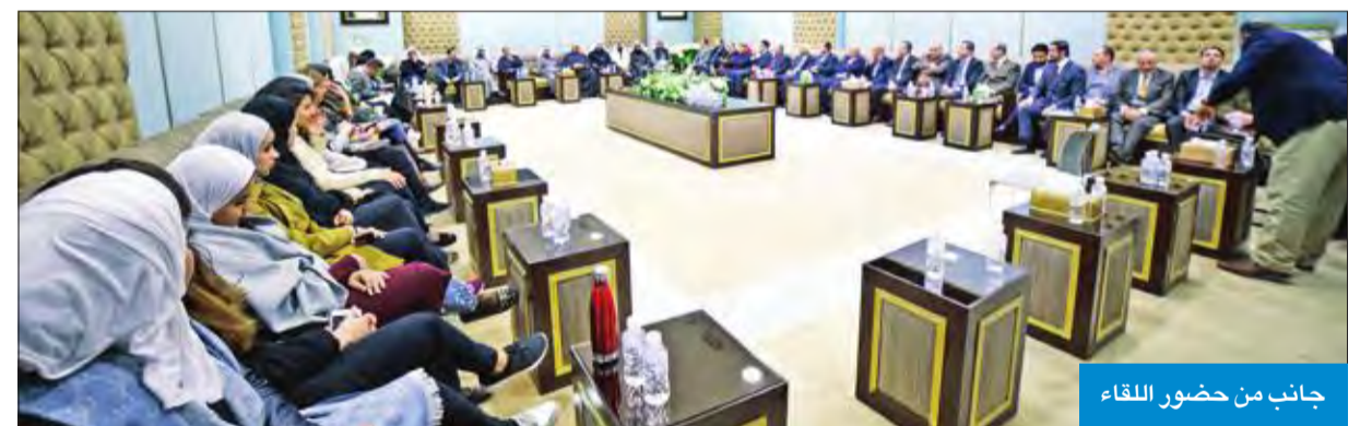
جانب من حضور اللقاء

من تحويل حلم تقديم تعليم قانوني متميز إلى واقع يلتمسه الطلبة والمجتمع مع تميز خريجي الكلية في مختلف الوظائف القانونية التي احتلوها بثقة واقتدار». وقدم لمحة عن الرؤية المستقبلية التي تسعى إدارة الكلية إلى تحقيقها في السنوات المقبلة من أجل الارتقاء بالعملية التعليمية، حتى تحافظ الكلية على تميزها كأول جامعة أهلية متخصصة بتدريس القانون في الكويت