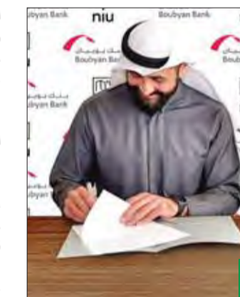
التوجيهي والحواح أثناء توقيع الاتفاقية

الكويتي والأسواق العالمية. وأبدى الطرفان سعادتهما بهذا التعاون الإستراتيجي الذي يساعد في تحقيق الرؤية المشتركة، وهي تطوير بيئة الأعمال، حيث إنها تنطلق تعاوناً مستمرا بين مختلف القطاعات لتشجيع الشباب الكويتي على الإقبال على العمل في المشروعات الصغيرة والأعمال الحرة. من ناحية أخرى، قال التوجيهي إن المرحلة المقبلة ستشهد المزيد من التعاون بين بويان والمشاريع الشبابية الكويتية، وبما يحقق لها المزيد من التوسع بعد أن أثبتت قدرتها على التفوق وإدخال كل جديد إلى السوق الكويتي، وبما يعكس في النهاية على المستهلك.