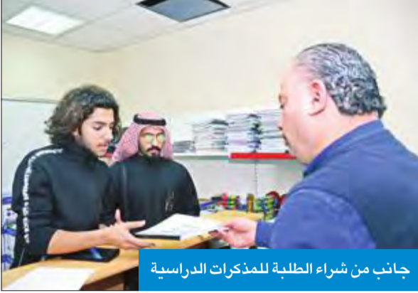
جانب من شراء الطلبة للمذكرات الدراسية