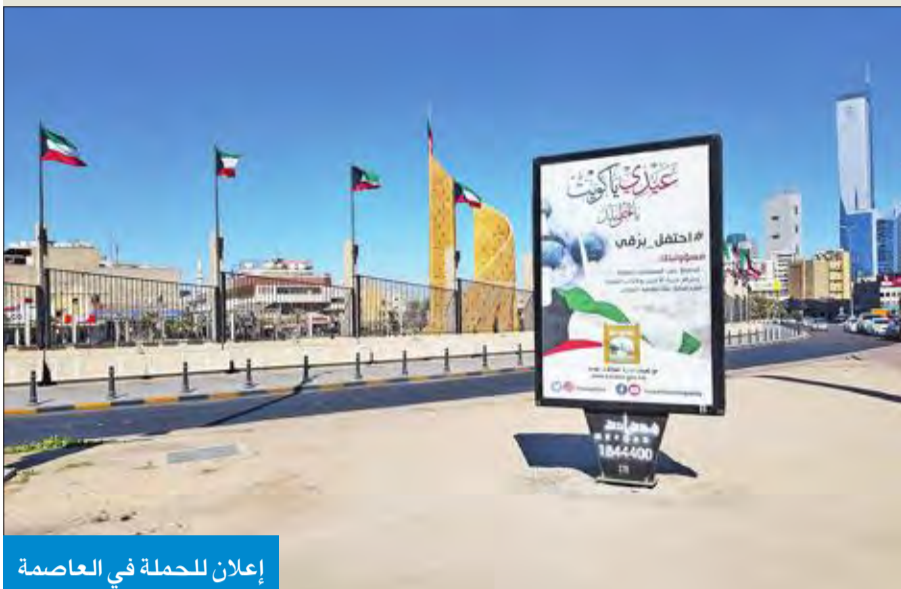
إعلان للحملة في العاصمة

الإعلانات التوعوية الخاصة بالحملة في الشوارع والتقاطعات بجميع المحافظات على مستوى الكويت والتي بلغ عددها 124 إعلان موبلي توزعت بين 42 إعلاناً في محافظة العاصمة، و22 إعلاناً في محافظة الفروانية، و20 إعلاناً في محافظة حولي، و16 إعلاناً في محافظة الجهراء، و15 إعلاناً في محافظة الأحمدية و9 إعلانات بمحافظة مبارك الكبير.