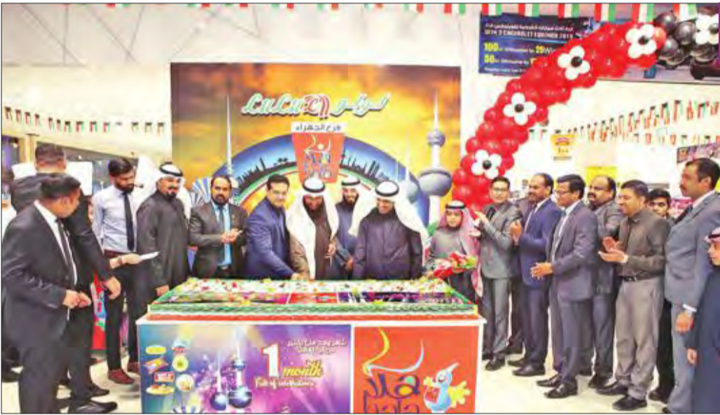
قطع كعكة الحفل