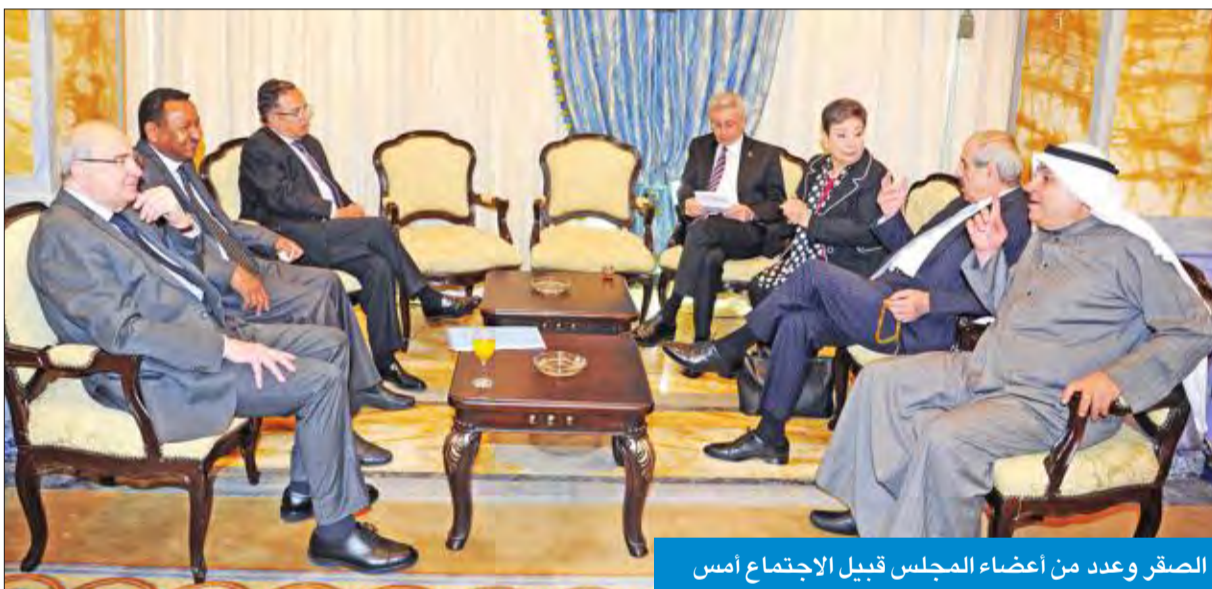
الصقر وعدد من أعضاء المجلس قبيل الاجتماع أمس

الصهيوني وإلغاء القضية الفلسطينية. وأضاف أن هذا المجلس بما يحمله من صفة شعبية غير رسمية حمل على عاتقه مسؤولية تقديم أكبر قدر من الدعم لتوفير حلول للشعب الفلسطيني.