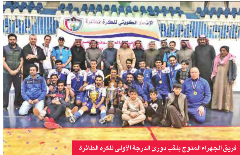
فريق الجهراء المتوج بلقب دوري الدرجة الأولى لكرة الطائرة