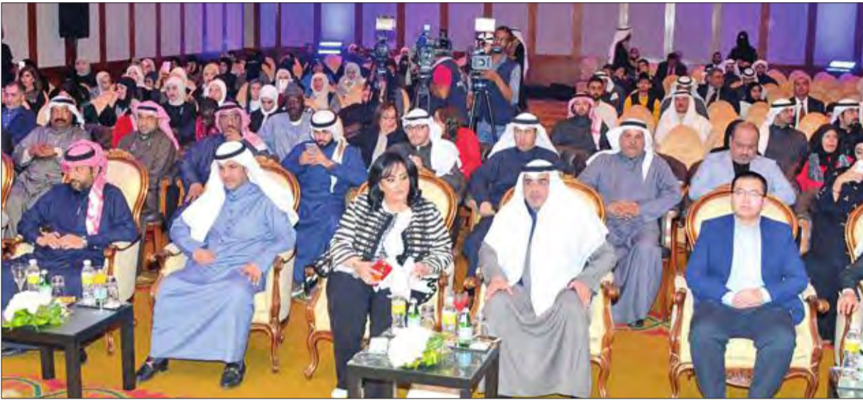
صورة جانبية للحضور

أقامت جمعية شباب الكويت الوطنية حفل تكريم للشباب المبدعين بعنوان "أمل الكويت بشبابها"، في فندق الجميرا، برعاية وحضور رئيسة الجمعية والشيخة أمل الحمود. وتخلل الحفل، الذي بداته الحمود بكلمة ترحيبية، فقرة من تقديم الإعلامي محمد الوسمي، بحضور ضيف الشرف الشاعر عبدالله علوش، وأخرى فنية من ترات الكويت للفنان أنور الشامي. وفي الختام، كرمت الشيخة الحمود، ترافقها المشرفة علي الاحتفال نغم القلعاني، المحترفي بهم، ووزعت عليهم الدروع.