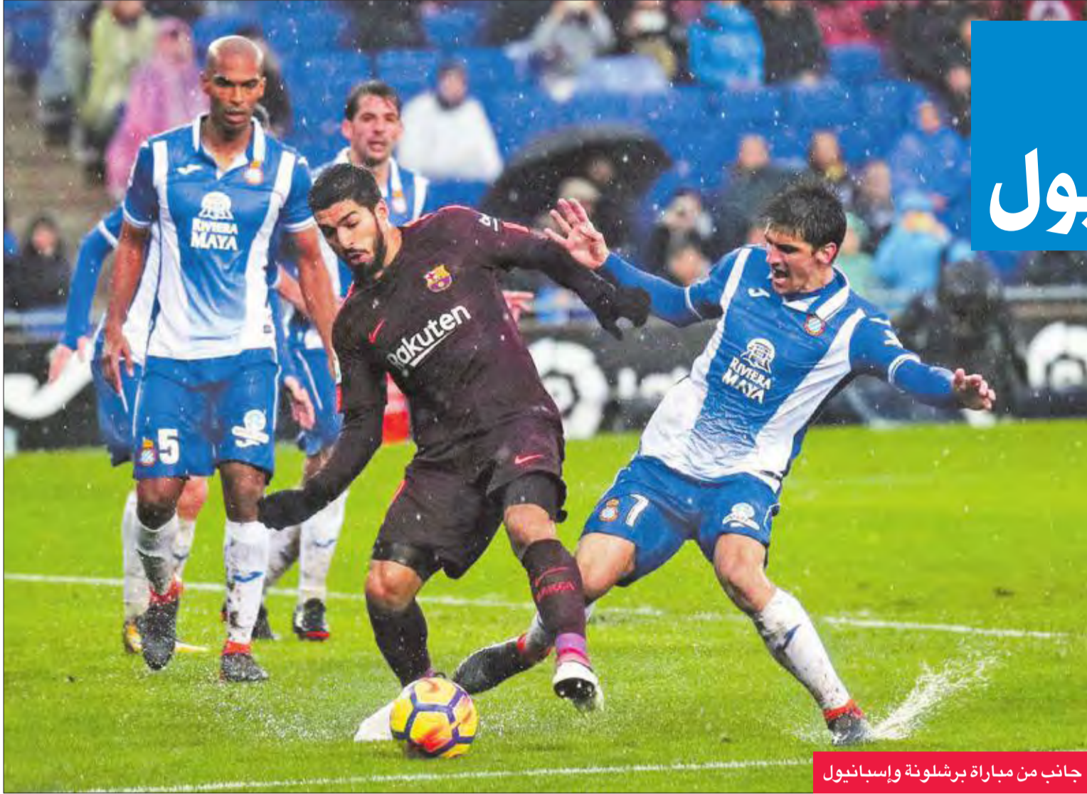
جانب من مباراة برشلونة وإسبانيول

جنب المدافع الدولي جيرارد بيكيه فريقه برشلونة المتصدر من تلقي الخسارة الأولى في بطولة إسبانيا هذا الموسم، بعد أن أدرك التعادل في مرمره جاره إسبانيول 1-1 أمس في المرحلة الثانية والعشرين للمسابقة.