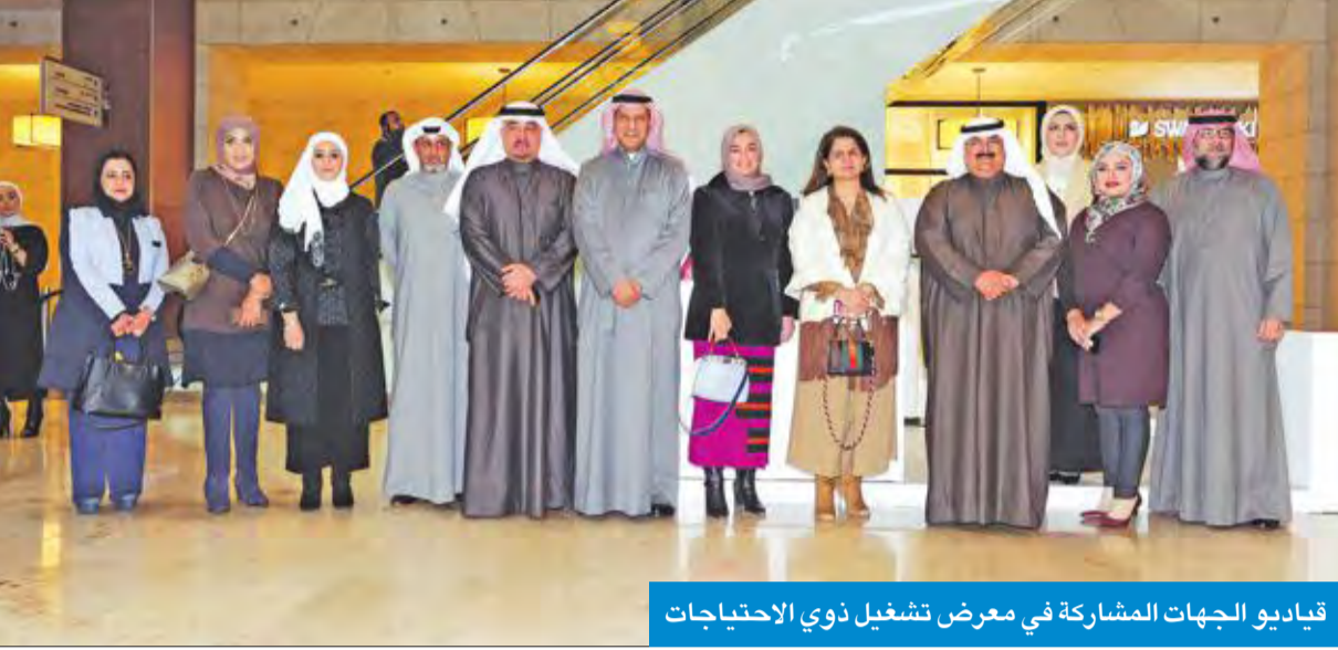
قياديو الجهات المشاركة في معرض تشغيل ذوي الاحتياجات

الإعاقة بالفرض الوظيفية المتاحة لهم في القطاع الخاص تطبيقاً لمواد قانون المعاقين»، «هذا اليوم الأول لتدشين المعرض التعريفي، على أن يتبعه أكثر من معرض خلال الأيام المقبلة لتفعيل إجراءات التعيين بالتنسيق مع هيئتي القوى العاملة والإعاقة»، وأضاف السراشد «نأمل أن نجني ثمار هذا التعاون بما يصب في مصلحة ذوي الاحتياجات الخاصة»، مشيراً إلى أن «قطاع القوى العاملة في برنامج إعادة الهيكلة بابه مفتوح لاستقبال جميع فئات المعاقين».