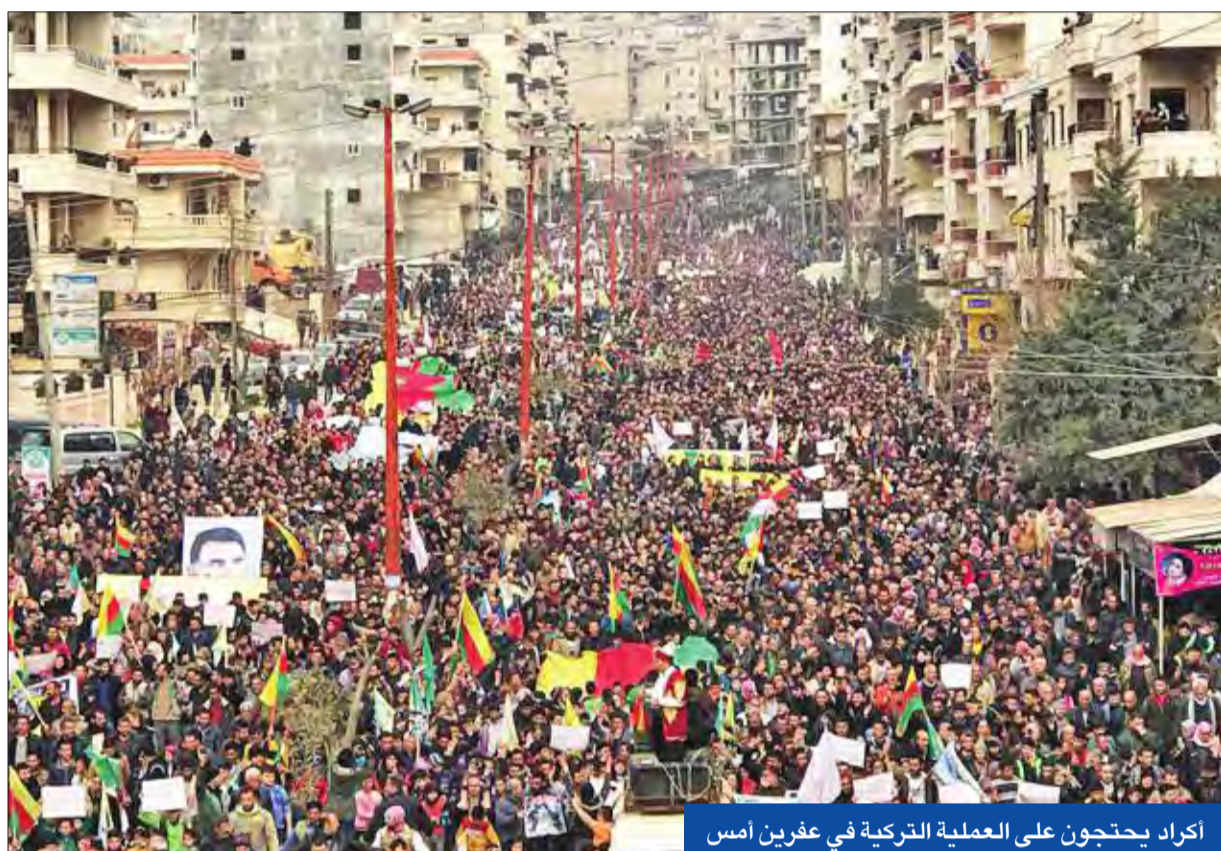
أكراد يحتجون على العملية التركية في عفرين أمس

وأفاد المرصد السوري لحقوق الإنسان بأن هوداً