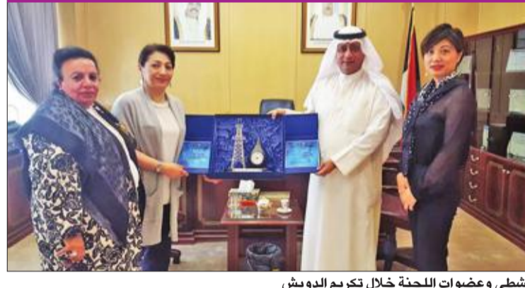
الشمطي وعضوات اللجنة خلال تكريم الدويش

زارت عضوات لجنة المرأة الدولية وحرم سفير أرمينيا وحرم سفير فيتنام ومستشارة للجنة نرجس الشمطي الأمين المساعد لقطاع الفنون والمسرح الدكتور بدر الدويش. وقدمت الزائرات للدويش درع التميز نظراً لدعاه ومساعدته في إنجاز الأنشطة والبرامج التي تعدها اللجنة حسب المناسبات المحلية والعالمية والعربية والعالمية، كما قدمت اللجنة مقترحات لأنشطة الفترة القادمة تخص البرامج الثقافية والتراثية والاجتماعية وسيكون هناك دور للمجلس الوطني للثقافة والفنون والآداب في دعم هذه البرامج. وتمنت عضوات اللجنة المزيد من التقدم والأزدهار لدولة الكويت والجانب الثقافي والفني والتراثي.