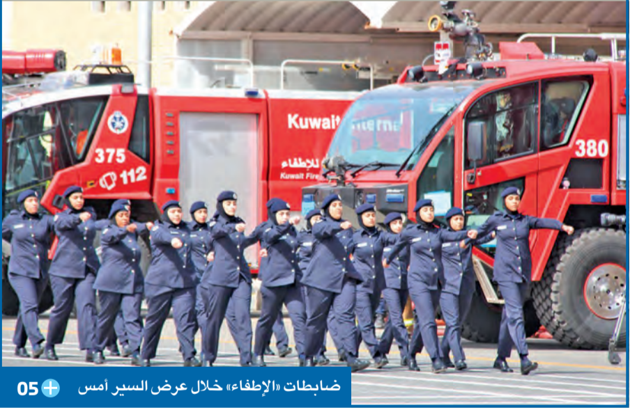
ضابطات «الإطفاء» خلال عرض السير أمس