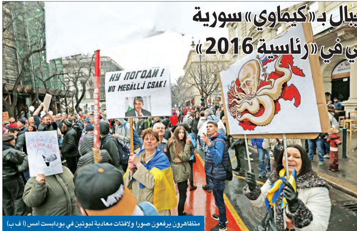
متظاهرون يرفعون صوراً ولافئات معادية لبوتين في بودابست أمس

● موسكو تتخوف من ربط تسميم سكريبال بـ «كيمياوي» سورية ● عقوبات أميركية بسبب التدخل الروسي في «رئاسية 2016»