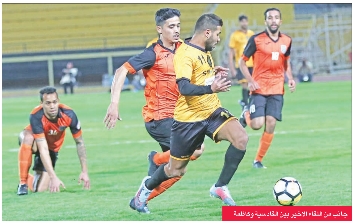
جانب من اللقاء الأخير بين القادسية وكازمة