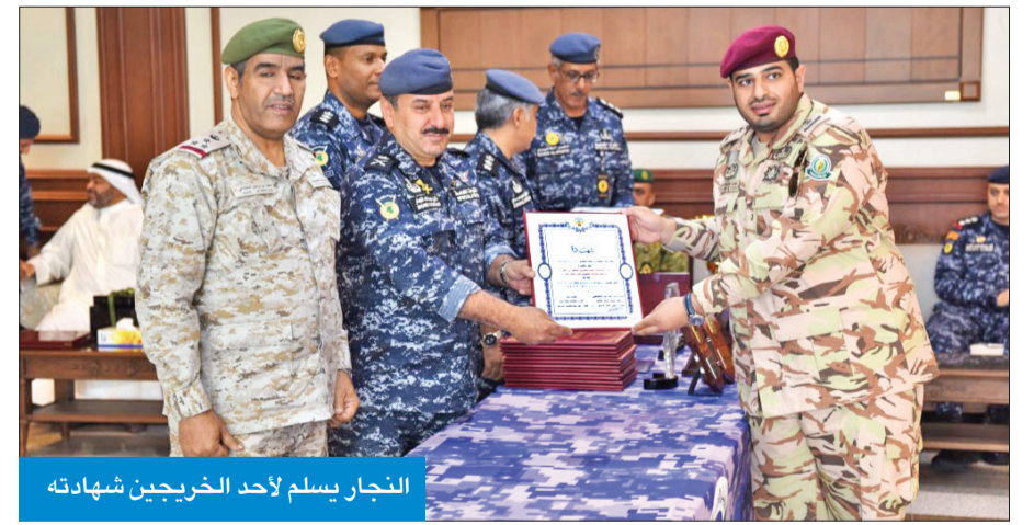
النجار يسلم لأحد الخريجين شهادته

المعنية بالشأن الأمني من جهة، ومن جهة أخرى تدعم جهود التعاون والتنسيق المعلوماتي والعلمي بين دول مجلس التعاون الخليجي. ولفت إلى أن أهمية هذه الدورة التأسيسية تأتي من المحتوى العلمي والخبرات العملية التي تضمنتها وقدمتها للمشاركين، مشيداً بتفاعل المشاركين في الدورة، مع ما قدم لهم من معلومات وتجارب، متمنياً لهم التوفيق في استخدام ما اكتسبوه من مهارات في خدمة أوطانهم والحفاظ على استقرارها من عبث العابثين. وتم تخريج 19 متدرباً، منهم اثنان من السعودية، واثنان من عمان، واثنان من الحرس الوطني، وواحد من الجيش.