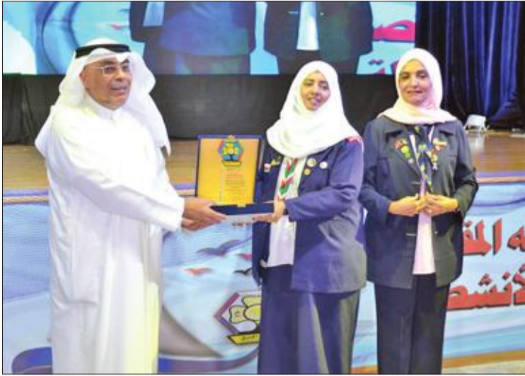
جمعية المرشدات تكرم المقصيد