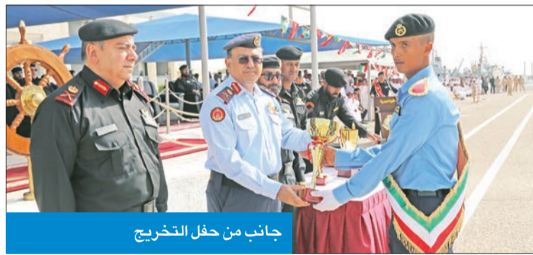
جانب من حفل التخرج

بعد ذلك بدأت مراسم طابور العرض بالمرور أمام المنصة الرئيسية، ثم أدى الخريجون القسم القانوني، وقدمت مجموعة منهم عرضاً لحركات الفصل للصامت للقدرة العسكرية ومهارة الميدان. وفي الختام، قام راعي الحفل بتوزيع الشهادات والجوائز على الخريجين والمتفوقين، وأثنى على الجهود التي تبذل من معهد القوة البحرية في رفع قدرات وكفاءة منتسبي هذه الدورات، وتمنى للخريجين التوفيق والنجاح، وأن يترجموا ما تلقوه من علوم ودروس إلى واقع عملي في حياتهم العسكرية، لتحقيق أعلى درجات الجاهزية في الدفاع عن الوطن.