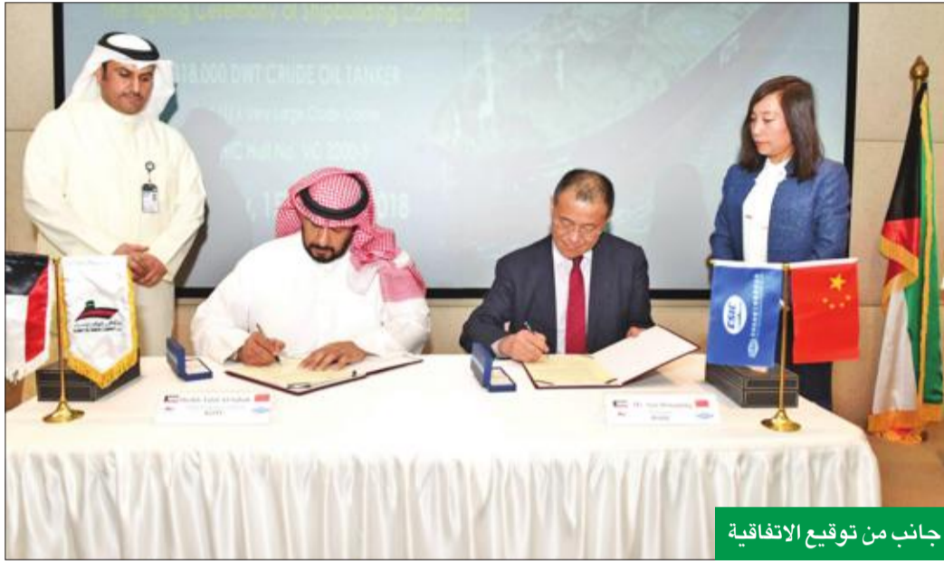
جانب من توقيع الاتفاقية

أبرمت عقداً لبناء ناقلة عملاقة بـ 79.7 مليون دولار