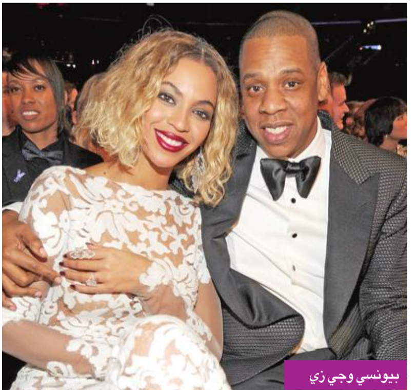
بيونسي وجي زي

قررت النجمة الأميركية، بيونسي، وزوجها المغني الشهير، جي زي، الاستعانة بـ"فريق من المربيات"، لخدمة أبنائهما الثلاثة أثناء قيامهما بجولة غنائية مشتركة في وقت لاحق من العام الحالي، بأمريكا الشمالية وأوروبا. وأفادت تقارير إعلامية، بأن بيونسي وزوجها قررا الاستعانة بفريق المربيات، لانشغالهما بتقديم الموسم الثاني من الجولة الغنائية (On the Run)، التي تم الإعلان عنها، ومن المقرر أن تبدأ في 6 يونيو المقبل، ولمدة 4 أشهر. (د ب أ)