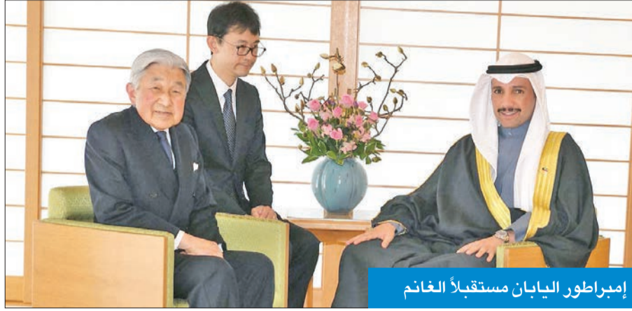
إمبراطور اليابان مستقبلاً الغانم

أكد الغانم خلال لقاء إمبراطور اليابان اعتراز الكويت بمستوى العلاقات التاريخية والمثالية مع اليابان التي تؤدي دوراً متميزاً في حفظ الأمن والسلم الدوليين.