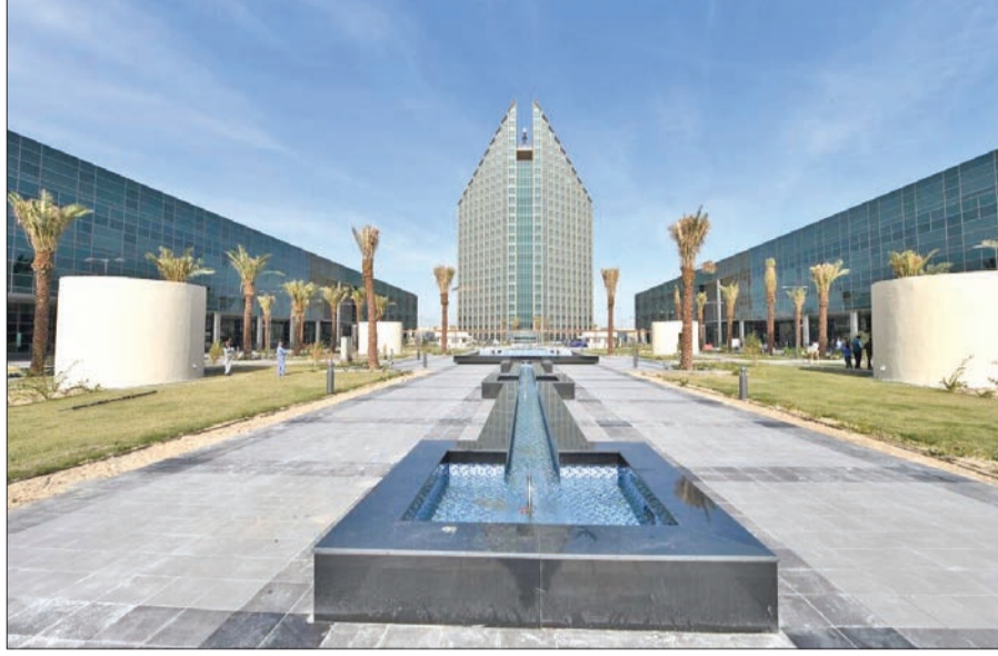
باب التسجيل للفصل الدراسي الصيفي في أبريل المقبل.

وطالب الحيان «التطبيقي» بضرورة أن يتم وضع مصلحة الطلبة بعين الاعتبار، من خلال توفير جميع الشعب الدراسية،