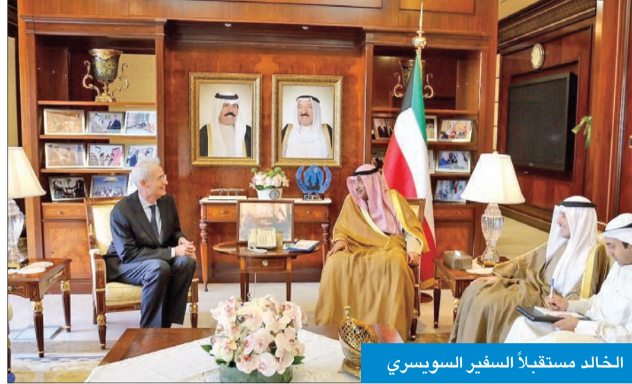
الخالد مستقبلاً السفير السويصري

تسلم نسخة من أوراق اعتماد سفير نيكاراغوا