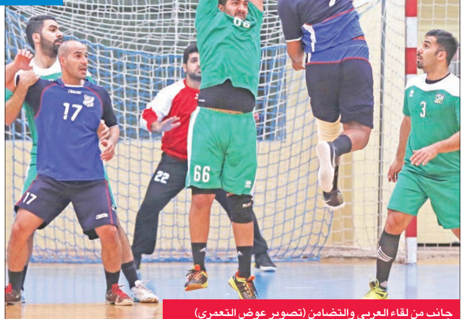
جانب من لقاء العربي والتضامن

حقق فريق النادي العربي أول فوز له في دوري الدرجة الأولى لكرة اليد على منافسه التضامن بنتيجة 27-24، وذلك في المباراة التي جمعت الفريقين أمس الأول على صالة مركز الشهيد فهد الأحمد بالدمية، في ختام منافسات الجولة الثانية من المجموعة الثانية للمسابقات. وأدار اللقاء الحكمان عبدالرحمن المالا ومحمد الدويسان. وفي مباراة أخرى جرت أمس الأول على صالة الاتحاد بالدمية ضمن المرحلة نفسها، حقق فريق الشباب فوزه الثاني على التوالي في البطولة على حساب النصر بنتيجة 28-27، وأدار المباراة الحكمان جاسم السويلم وطلال الهران. بهذه النتائج، اعتلى الشباب ترتيب فرق المجموعة برصيد 4 نقاط، يليه اليرموك في المركز الثاني برصيد نقطتين وبفارق الأهداف عن العربي في الثالث، بينما احتل النصر المركز الرابع والتضامن المركز الخامس الأخير بدون رصيد. يذكر أن دوري الدرجة الأولى يضم 10 فرق تم تقسيمها إلى مجموعتين يتأهل أول وثاني كل منهما للدور قبل النهائي، ويلعب أول المجموعة الأولى مع ثاني المجموعة الثانية، بينما يلتقي أول المجموعة الثانية مع ثاني المجموعة الأولى، ويصعد الفائزان للمباراة النهائية للمنافسة على لقب البطولة.