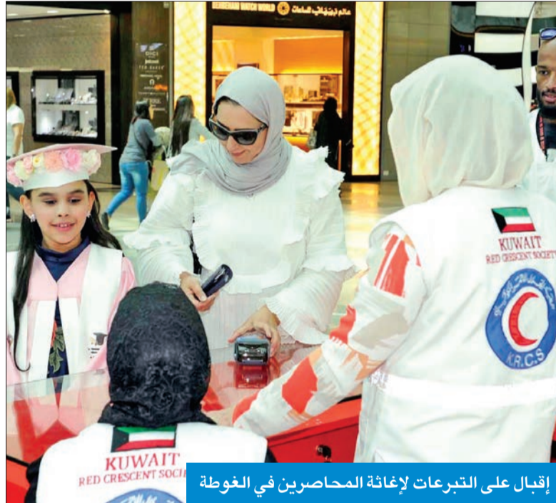
إقبال على التبرعات لإغاثة المحاصرين في الغوطة

بادرت إليها الكويت لتقديم المساعدات الإنسانية والإغاثية لكل الدول الشقيقة.