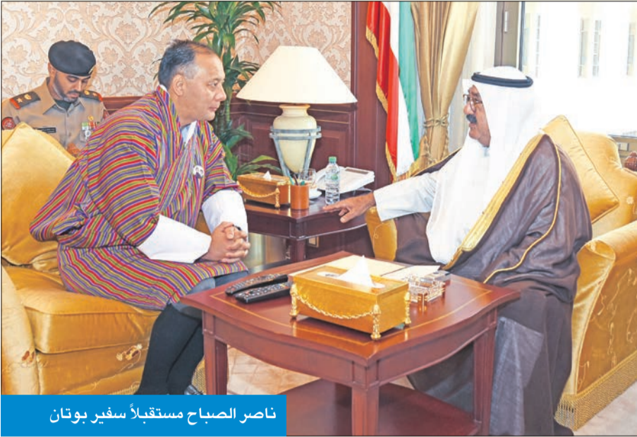
ناصر الصباح مستقبلاً سفير بوتان

استقبل النائب الأول لرئيس مجلس الوزراء وزير الدفاع الشيخ ناصر الصباح، أمس سفير مملكة بوتان الصديقة لدى البلاد تسيرنج جليتنج بنجور. وتم خلال اللقاء تبادل الأحاديث الودية، ومناقشة أهم الأمور والمواضيع ذات الاهتمام المشترك.