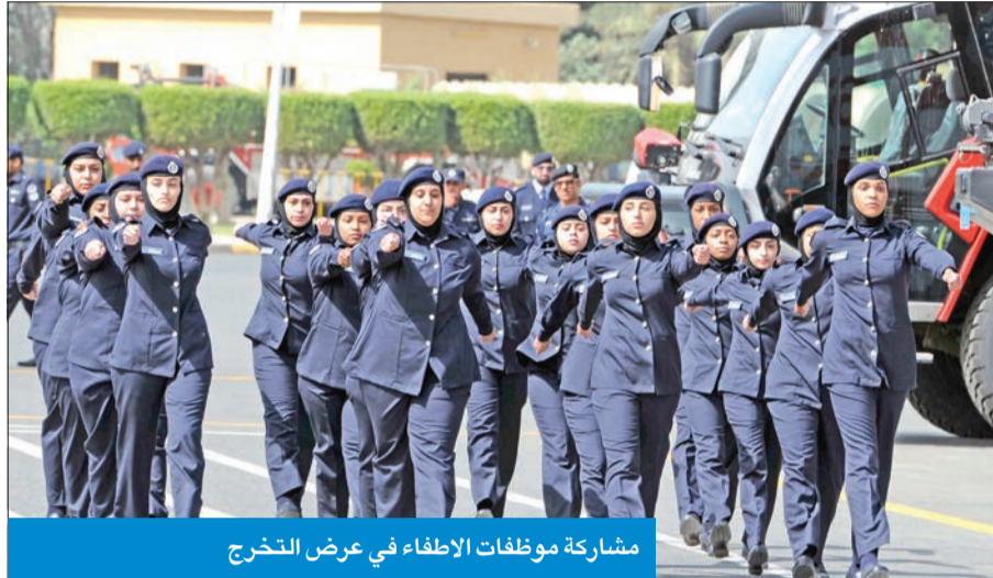
مشاركة موظفات الإطفاء في عرض التخرج

من جانبه، أعرب التركيت عن شكره للوزير الصالح على رعايته وحضوره حفل التخرج، مضيفاً أن هذا العام يشكل علامة فارقة في تاريخ الإطفاء بتخريج دفعة من أبنائنا الضباط وفقاً للاعراف العسكرية المتبعة. وأشار التركيت إلى أن الدفعة 23 مكونة من 54 تخصص مكافحة و28 تخصص ريان زورق، بعد أن أنهوا دراسة مدتها سنتان ونصف السنة حصلوا خلالها على دراسات فنية وعلمية وتخصصية، وذلك بالتعاون مع الهيئة العامة للتعليم التطبيقي والتدريب،