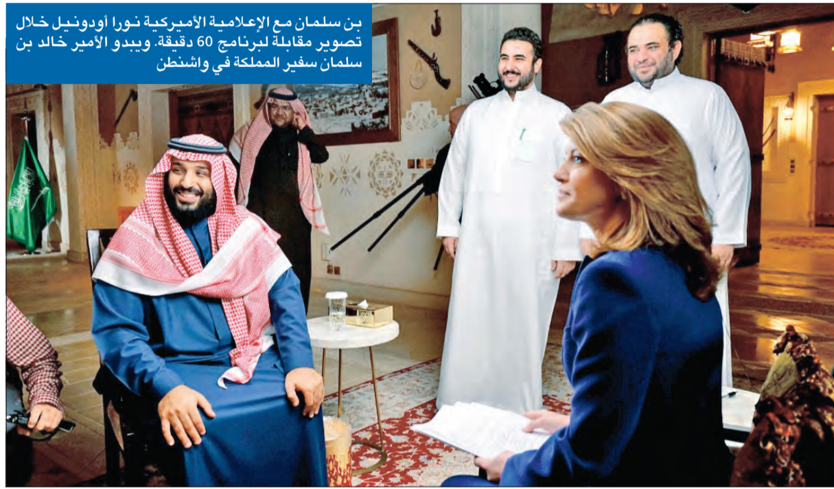
بن سلمان مع الإعلامية الأميركية نورا أودونيل خلال تصوير مقابلة للبرنامج 60 دقيقة، ويبدو الأمير بن سلمان سفير المملكة في واشنطن

«إيران ليست نداءً للسعودية عسكرياً واقتصادياً... ولن نسمح لخامنئي بتكرار ما فعله هتلر» ● المعلمي: الكويت أدت دوراً إيجابياً وقيادياً في بيان مجلس الأمن حول اليمن