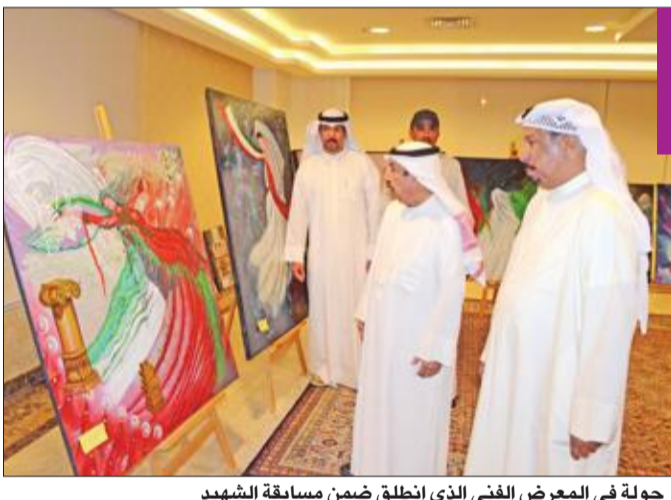
جولة في المعرض الفني الذي انطلق ضمن مسابقة الشهيد

انطلق التعاون بين مبادرتي «قائد» و«كفو» ومركز صباح الأحمد للموهبة والإبداع من خلال برنامج تدريب تحت عنوان «بالموهبة نرتقي»، لتكون «قائد كفو» للطلبة الموهبين على مستوى الكويت، ويتضمن هذا التعاون تقديم الدورات والندوات والخدمات المجتمعية.