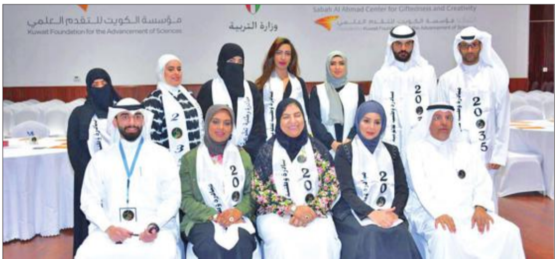
صورة جماعية للمباردين في البرنامج