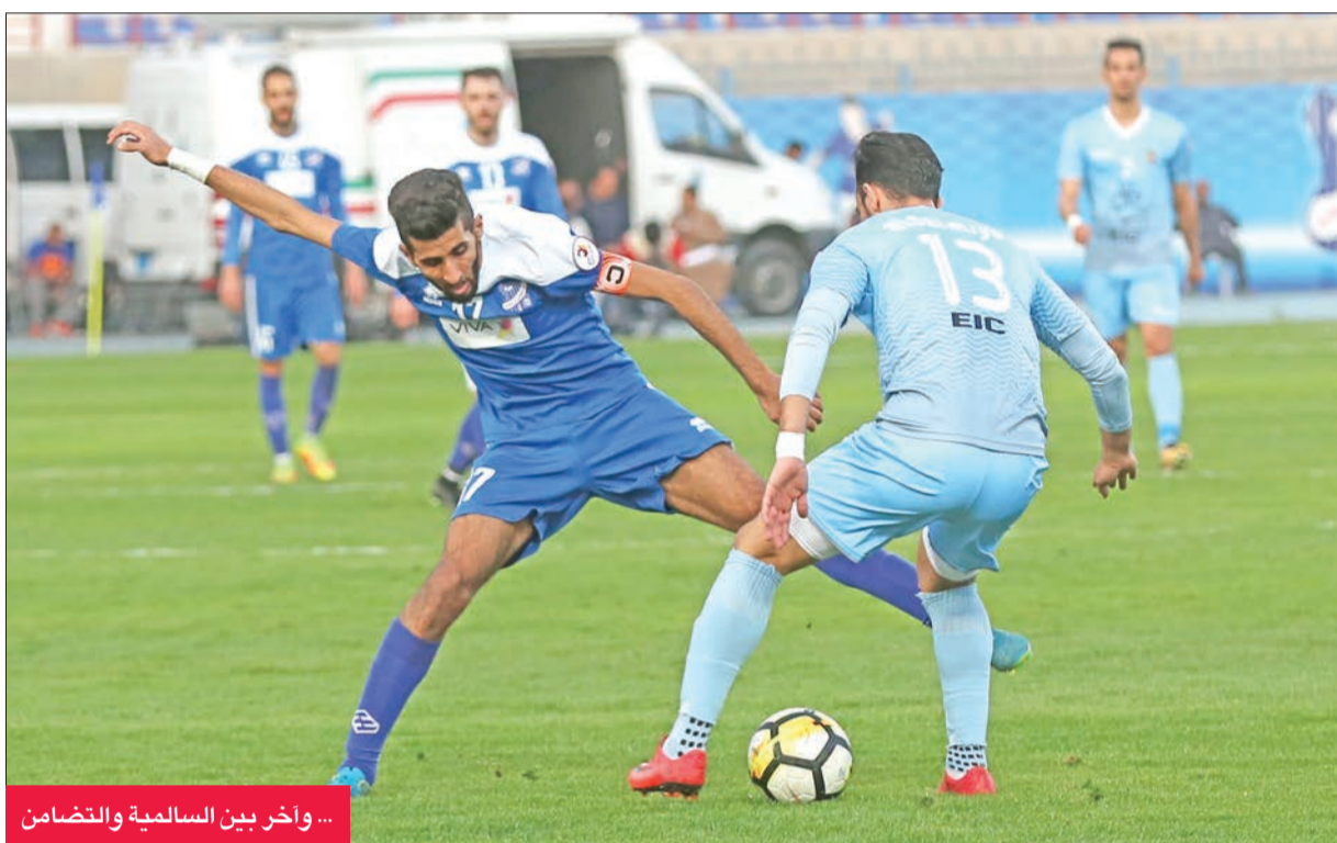
... وآخر بين السالمية والتضامن

في انطلاق منافسات الجولة السادسة عشرة من دوري فيفا لكرة القدم