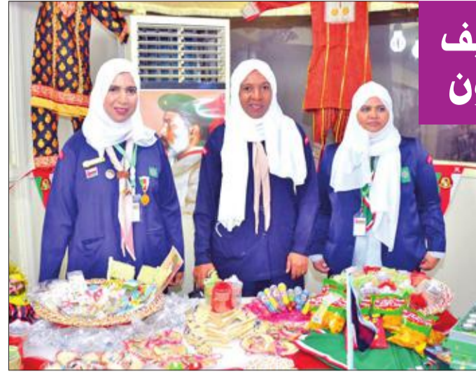
مشاركات في الفعالية