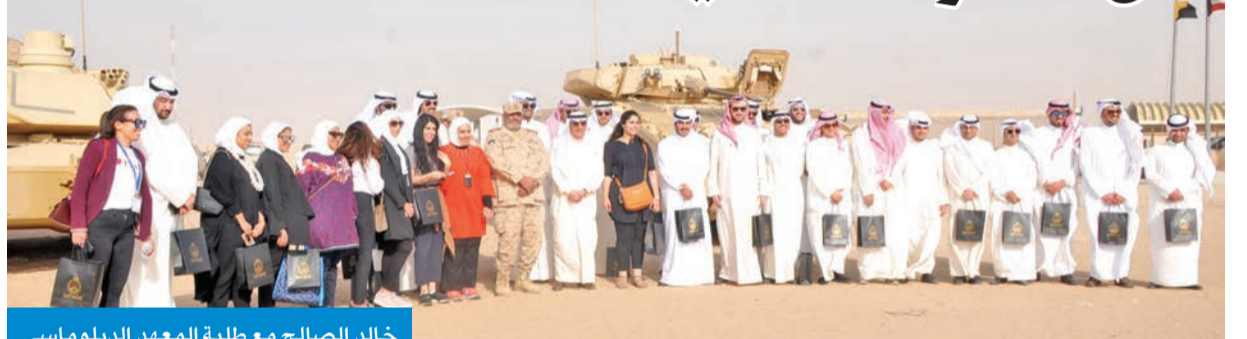
خالد الصالح مع طلبة المعهد الدبلوماسي

والوفد المرافق له إلى الحدود الشمالية الدولية. وأعرب الصالح عن شكره لقيادة القوات البرية المتمثلة في مشاة القوات البرية والفرقة الأولى من مركز الاستقبال المدير العام للإدارة العامة لأمن الحدود اللواء فيصل العيسى، حيث تم الإطلاع على النظم الأمنية المستخدمة في حماية وحفظ أمن الحدود، ثم زاروا الخط الحدودي الفاصل بين الكويت والعراق، وفي ختام الجولة توجه أمر القوة البرية