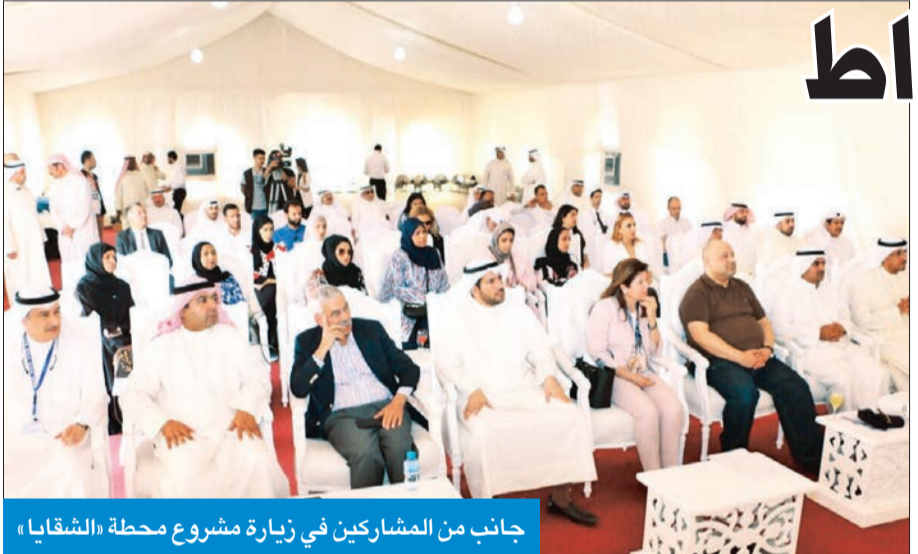
جانب من المشاركين في زيارة مشروع محطة «الشقيا»

ولفتت إلى أن الوزارة لديها نحو 4 مليارات غالون من المياه مخزون استراتيجي لمواجهة زيادة الاستهلاك في المياه خلال الصيف المقبل، مبيّنة أنه من الطبيعي أن تحدث بعض الأعطال المتوقعة، سواء في شبكة الكهرباء أو المياه، ويتم التعامل معها، وتكون تلك