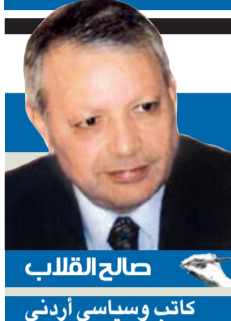
صالح القلب كاتب وسياسي أردني