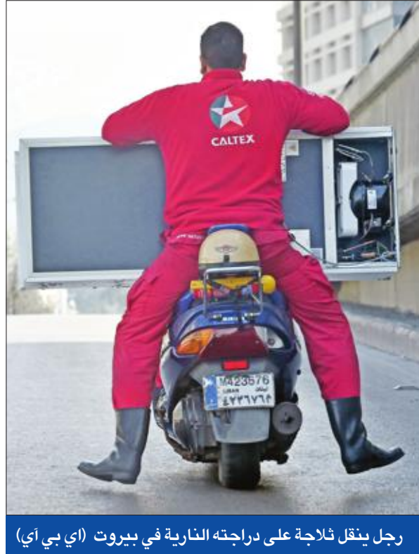
رجل ينقل ثلاجة على دراجته النارية في بيروت

وولد ساركوزي بالآتيم الذي وجه إليه، مؤكدا أنه «منذ 11 مارس 2011، أعيش جحيم هذا التشهير» وتابع أنه «دون أي دليل مادي، بناء على تصريحات معمر القذافي ومقربين منه وأيضا على تقي الدين، بينما تبين مرات عدة أنه (أي تقي الدين) تلقى أموالا من الدولة الليبية». وجاء في أداة ساركوزي: «أريد أن أذكركم فيما يتعلق بتقي الدين أنه لا يعطي أي دليل على لقائه