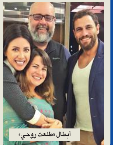
أبطال «طلعت رويحي»

حرص عدد كبير من الفنانين المشاركين في الموسم الشتوي على الحضور هذا العام، ذلك مع ازدياد الأجور مقارنة بالأعوام الماضية، كذلك رفعت القنوات الفضائية الأسعار التي اشترت فيها المسلسلات، وأصبحت للطويلة منها أهمية كبيرة، خصوصاً مع «سابع جار» و«أبو العروسة».