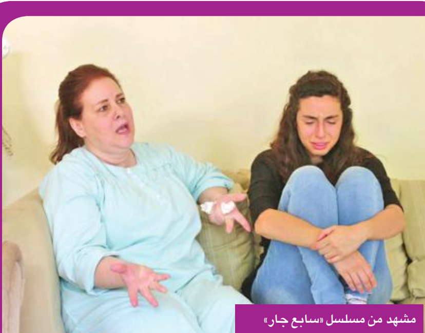
مشهد من مسلسل «سابع جار»