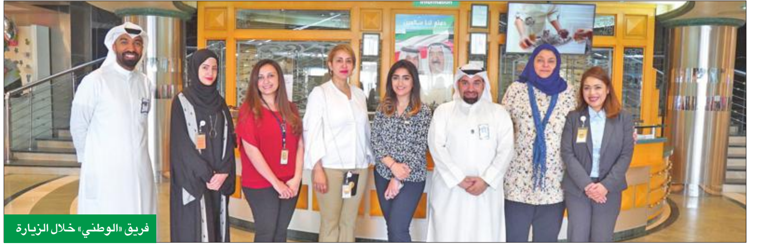
فريق «الوطني» خلال الزيارة

نظم بنك الكويت الوطني زيارة إلى مستشفى دار الشفاء، بمناسبة عيد الأم، وزار فريق العلاقات العامة في البنك قسم الولادة بالمستشفى، حيث قدم المعايدة للامهات وزين غرفهن بالورد والحلويات. وشارك منظومون من موظفي البنك في هذه الزيارة، التي شملت زيارة غرف المواليد الجدد، وتوزيع الورد والحلويات، في مبادرة تعكس التقدير لدور الأم الأساسي في نهضة وقيام المجتمعات وتضحياتها وعطاءاتها، لاسيما الأم العاملة التي نجحت إلى جانب عملها في الحفاظ على دورها الرئيسي