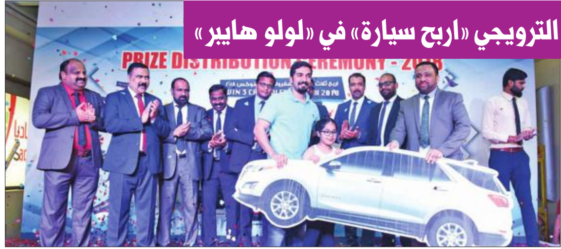
رابح في السحب يتسلم جائزته سيارة شيفروليه