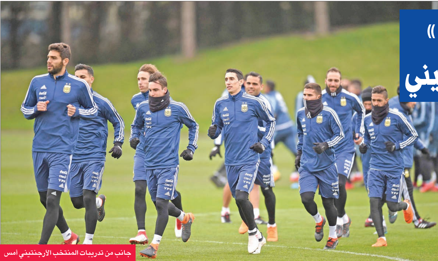
جانب من تدريبات المنتخب الأرجنتيني أمس