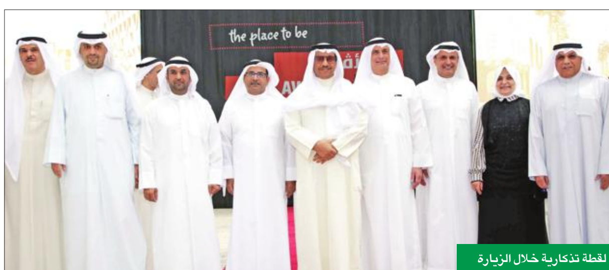
لقطة تذكارية خلال الزيارة

أشاد سمو الشيخ جابر المبارك رئيس مجلس الوزراء بالتوسعة الجديدة المتميزة في مجمع «الأقنيوز» وجهود شركة «المبانى» القائمة على هذا المشروع، الذي يعتبر أحد النماذج التي يفخر بها أبناء الكويت محليا ودوليا. ولفت المبارك، خلال رعايته وحضوره، أمس، حفل افتتاح المرحلة الرابعة من «الأقنيوز» في منطقة الري، إلى النجاحات المشهودة وعمليات التوسع والتطور التي تحققت في العديد من الدول والتي أضافت للكويت سمعة تجارية رائدة وقيمة اقتصادية دولية. وأعرب عن بالغ اعتزازه بما يقوم به القطاع الخاص من مشاريع كبيرة تصب في خدمة الاقتصاد الوطني وجذب رؤوس الأموال الإقليمية والدولية، مؤكدا أهمية هذه المشروعات التي تدعم خطط وجهود التنمية وتساهم في تحقيق مصلحة المواطن والمقيم وتعزيز القطاع السياحي بجميع مرافقه. وشدد على أن الحكومة لا تدخر جهدا في سعيها لتسهيل كافة الخدمات والإسهام في سن القوانين والتشريعات لخدمة ودعم الأفكار والمشاريع الكويتية التي تشجع الاستثمار في الكويت وتعزيز اقتصاد البلاد. وكان في مقدمة مستقبلية سموه لدى وصوله إلى مقر الاحتفال رئيس مجلس إدارة شركة المبانى «مالكة المجمع» محمد الشايح، إن اصطبح سموه في جولة تفقدية بالمجمع، وقدم له شرحا مفصلا عما يضمه من مراكز تجارية متنوعة.