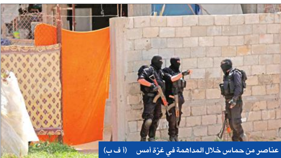
عناصر من حماس خلال المداخلة في غزة أمس

وقر اتخاذ سلسلة إجراءات في القطاع. ودعا عباس، أمس، «حماس» إلى تسليم كل شيء في قطاع غزة لحكومة الوفاق التي تم تشكيلها، وكان الرئيس الفلسطيني محمود عباس اتهم الاثنين الماضي، «حماس» بـ «الوقوف وراء الاعتداء» الذي استهدف موكب رئيس الوزراء الفلسطيني،