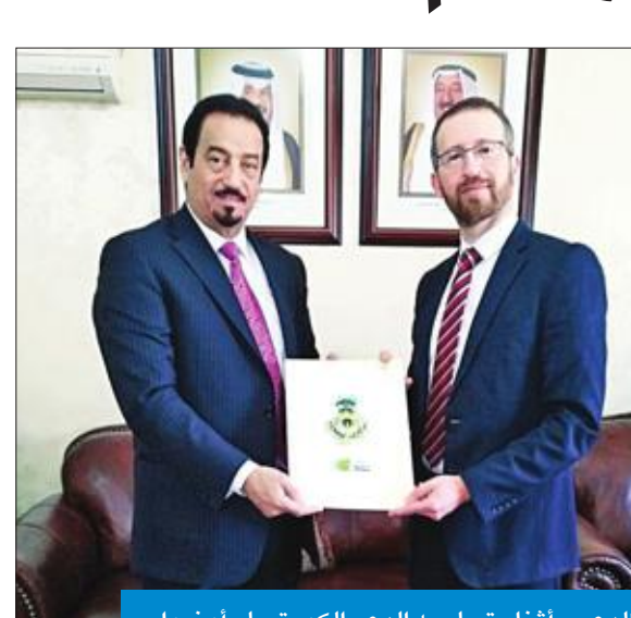
الديعج أثناء تسليمه الدعم الكويتي لـ «أونروا»

في مقدمة المساهمات الدولية نظرا لتأثيرها المباشر على عمليات الوكالة التشغيلية» وذلك في الدول والمناطق الرئيسية التي تغلبها وهي الضفة الغربية وقطاع غزة ولبنان والأردن وسورية.