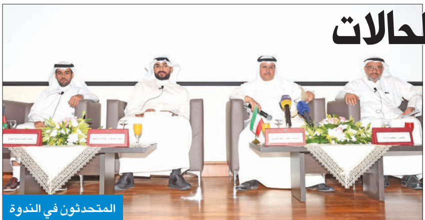
المحتشدون في الندوة

ولفت إلى أن "عدد القضايا المرفوعة من الهيئة وضدها بلغ 1496 قضية، منها 279 قضية صادرة