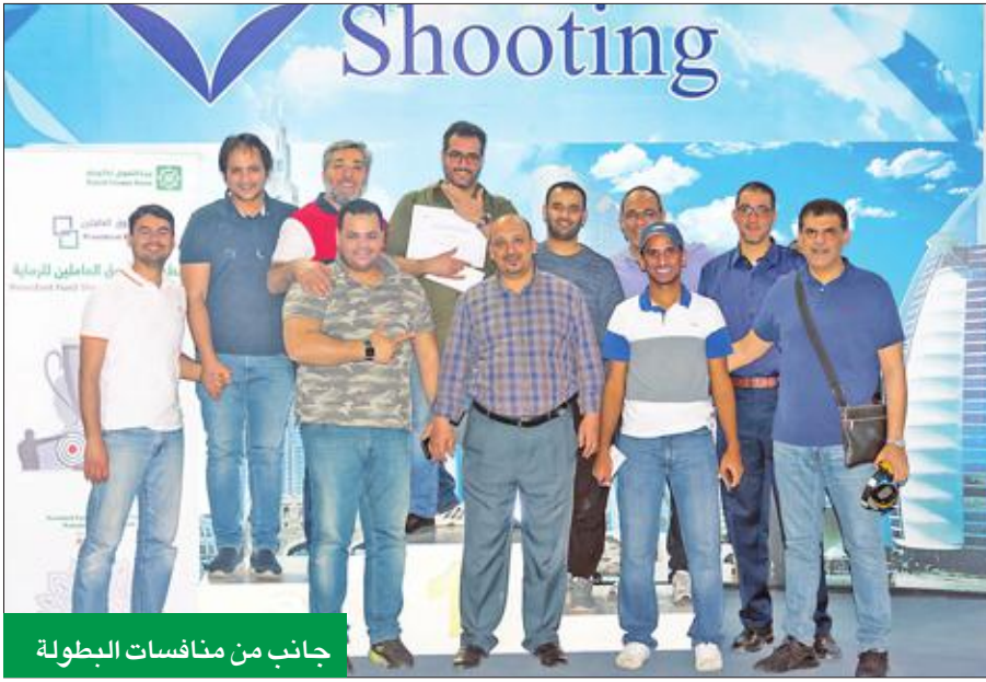
جانب من مناسبات البطولة

وتوجهت بالشكر لإدارة مستشفى دار الشفاء، التي ساهمت في تسهيل زيارة الامهات في غرفهن وتهنئتهن مع أطفالهن بهذه المناسبة المتجددة. وتأتي هذه الزيارة في إطار اهتمام البنك الدائم ومشاركته المستمرة في النشاطات الاجتماعية والإنسانية، كما التي شارك فيها عدد كبير من الموظفين في صالات نادي الرماية، وسط أجواء تنافسية أخوية، وتبارى الموظفون المشاركون في التصويب على الأهداف، وتم تكريم الفائزين في نهاية المسابقة بحضور أعضاء مجلس إدارة صندوق العاملين.