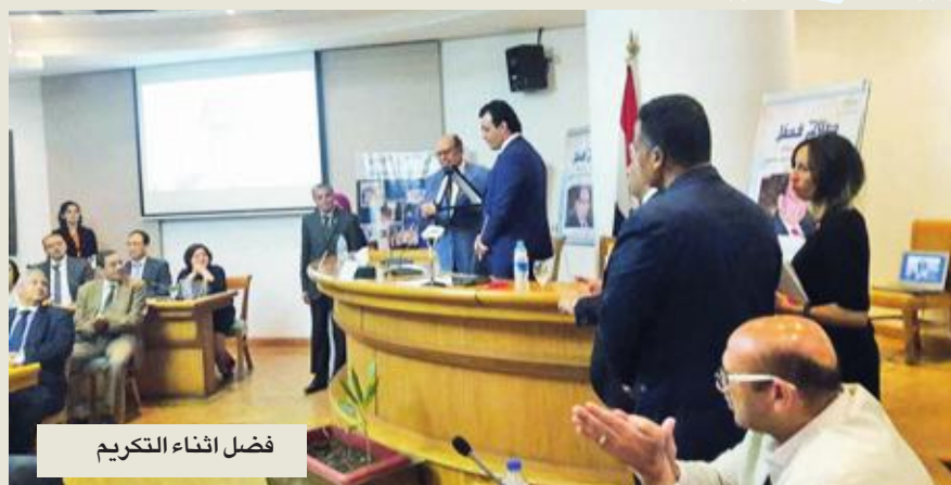
فضل أثناء التكريم

في خطوة متأخرة، كرم المجلس الأعلى للثقافة في مصر الناقد الدكتور صلاح فضل لمناسبة بلوغه الثمانين، في احتفالية شارك فيها نقاد ومثقفون استعرضوا مسيرة فضل ومثروعه النقدي، وطالبوا الدولة بتأمين نفقات علاجه في المستشفى حيث يبرق منذ أكثر من عام، لمعاناته من السرطان، كذلك طالبوا المجلس الأعلى بتكريم الرموز الإبداعية في مصر والعالم العربي.