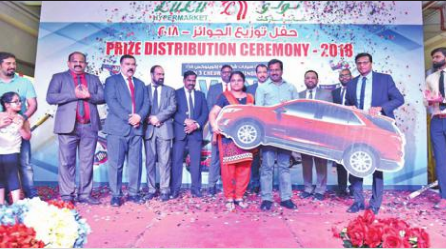
فائزة بالسيارة تقبل جازتها