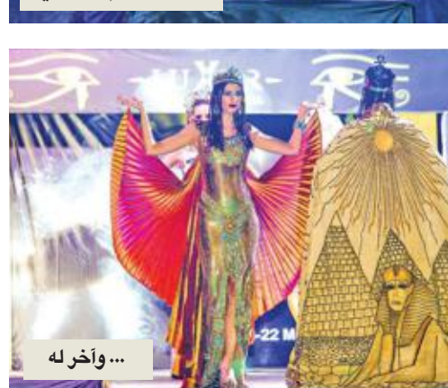
... وأخر له