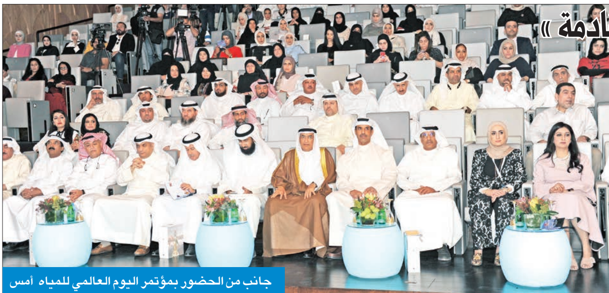
جانب من الحضور بمؤتمر اليوم العالمي للمياه أمس

«مشاريع الكهرباء تغطي احتياجات المستهلكين للسنوات القادمة»