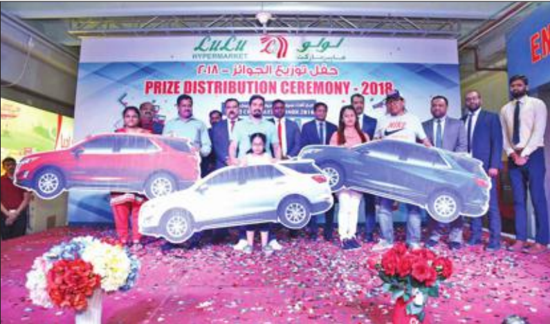
صورة جماعية للفائزين بالسيارات

نظم «لولو هايبر ماركيت» حفل توزيع الجوائز في منفذ «الراي»، لتكريم الفائزين المحظوظين في العرض الترويجي «اربح سيارة» من لولو، الذي أقيم ضمن احتفالات هلا فبراير، وتم إعلان أسماء الفائزين في العرض بعد السحب. وتسلم الفائزون الثلاثة بالمركز الأول فئات السيارات، وأصبح كل منهم يملك بفخر شيفروليه أكويوسكس 2018 إس يو في، وحصل 25 فائزاً إضافياً على قسائم هدايا بقيمة 100 دينار، بينما حصل 100 فائز على قسائم هدايا بـ 50 ديناراً.