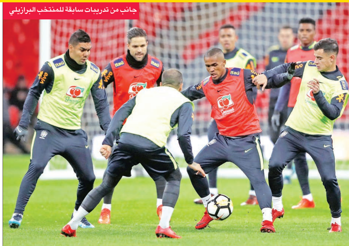
جانب من تدريبات سابقة للمنتخب البرازيلي

يسعى المنتخب البرازيلي إلى الإعداد القوي لخوض نهائيات مونديال يونيو المقبل، بخوض مباريات ودية على مستوى عال، حيث سيلتقي السيليساو منتخب روسيا مستضيف كأس العالم اليوم.