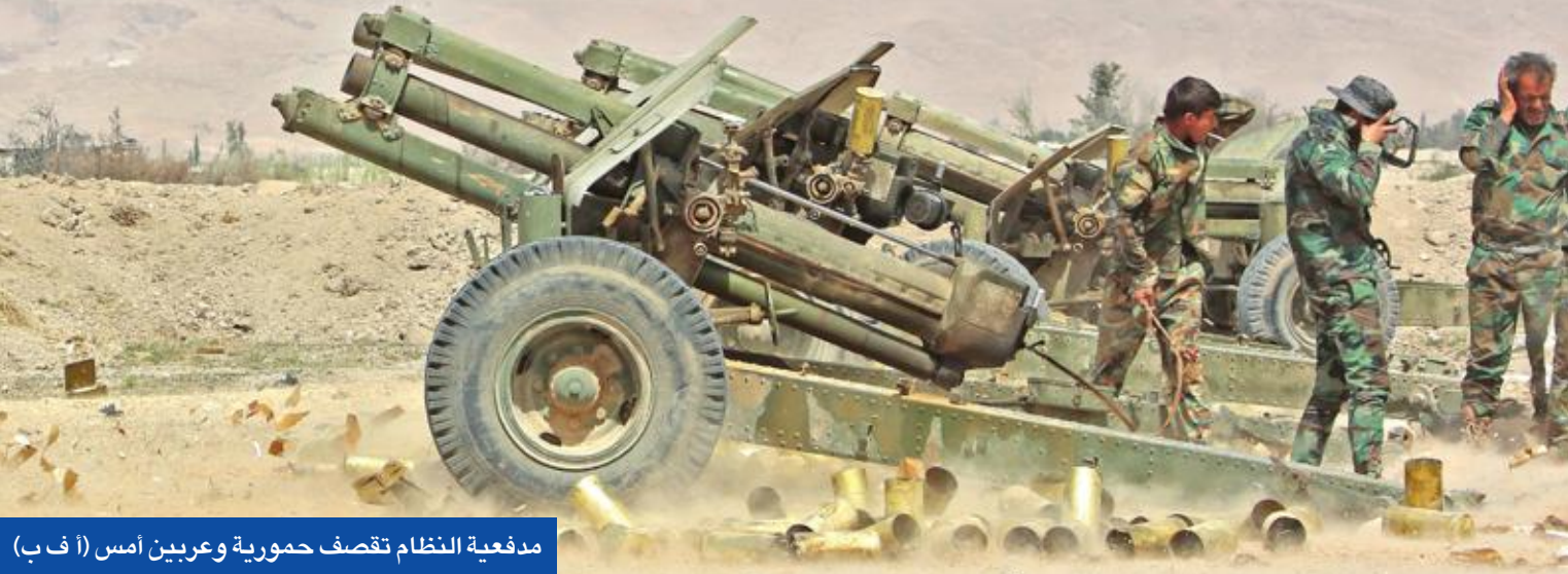
مدفعية النظام تقصف حمورية وعربين أمس

وبلغ جاويش أوغلو محري وكالة "الأناسول" أمس بان "قول الرئيس رجب طيب أردوغان؛ يمكن أن نهاجم ذات ليلة على حين غرة، يشمل مناطق سنجار، وجبل قنديل، وأي مكان آخر يوجد فيه تنظيم ي ب ك (وحدات حماية الشعب) وبي كا كا (حزب العمال الكردستاني التركي)، مؤكداً أنه في حال عدم تطبيق خطة تم التفاهم عليها مع الجانب الأميركي لخروج عناصره من منبج فإنه سيتوجب حينها القضاء على الإرهابيين؛ وهذا مناسب ليس لسورية فقط بل وللعراق أيضاً".