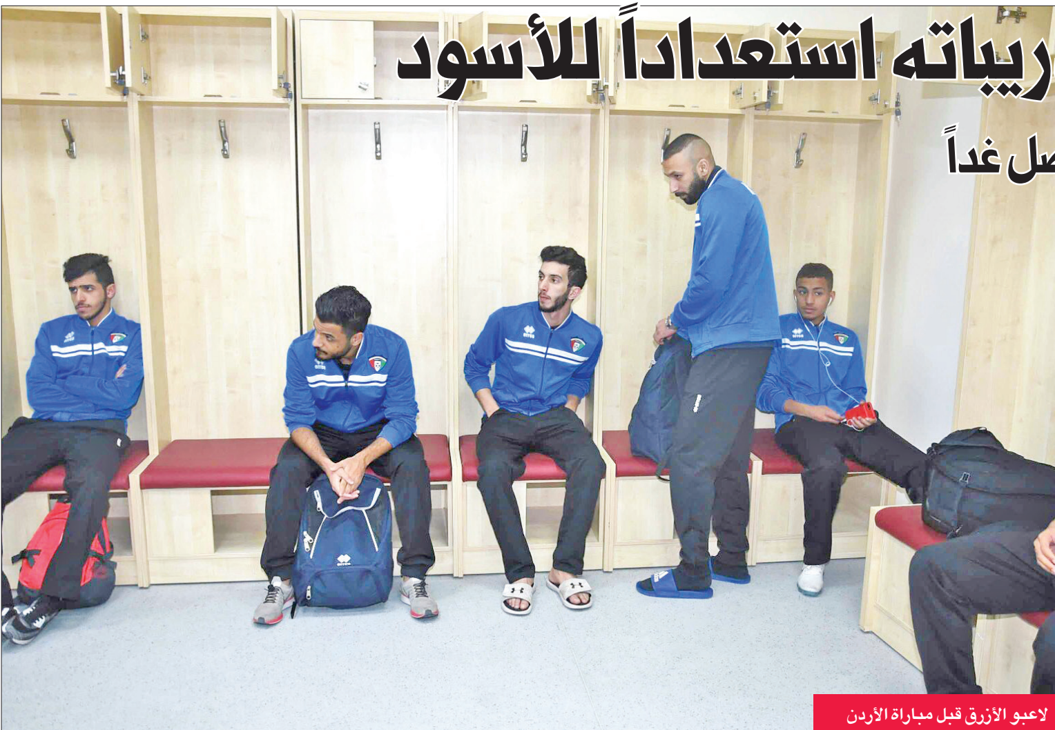
لاعبو الأزرق قبل مباراة الأردن