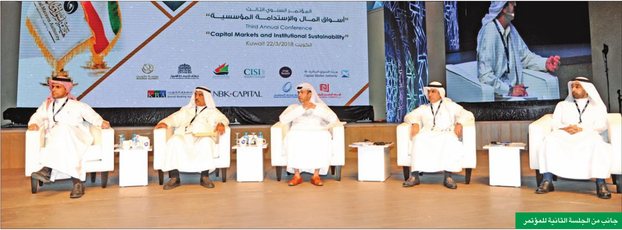
جانب من الجلسة الثانية للمؤتمر

متوسط عدد المصوتين في الجمعيات العمومية السعودية ارتفع 211% فهد بن محمد