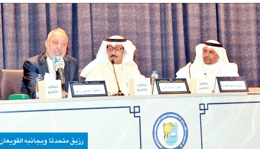
رزيق متحدثا وجانبه القويان

يعود على المقاول بالشكوى أو الضمان، إذ أنه لم يملك البيت، وعليه أقامت «السكنية» نفسها طرفا في القضية فهي من تملك الضمان العشري على البيت.