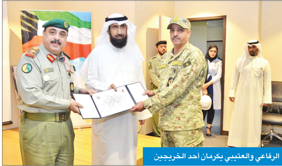
الرفاعي والعتيبي يكرمان أحد الخريجين

شهد تخريج دورة للمهندسين والفنيين في الكهرباء و«تشغيل مطاحن الدقيق»