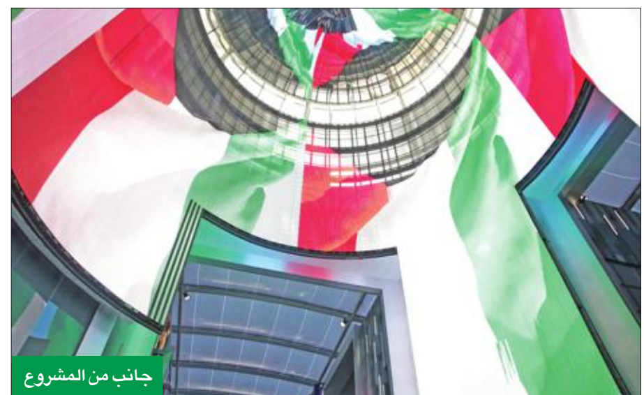
جانب من المشروع

وفيما يتعلق بالفنادق فإن أعمال البناء لا تزال مستمرة في فندق والدورف استوريا من فئة الخمس نجوم، والذي سيشتم 200 غرفة، وفندق هيلتون غاردن إن من فئة الأربع نجوم الذي سيشتم 400 غرفة.