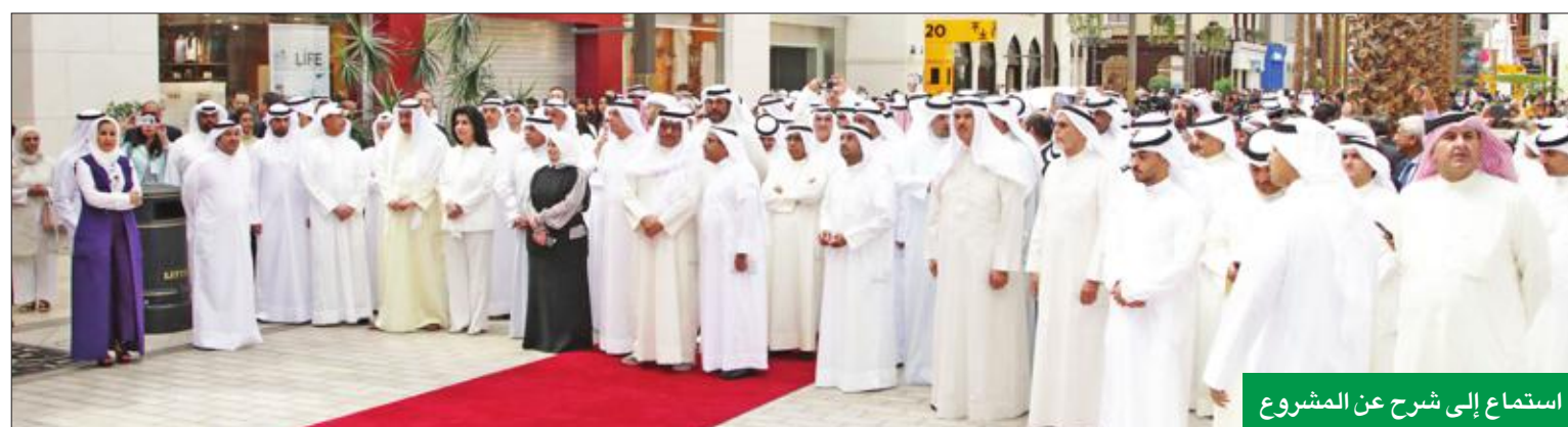
استمع إلى شرح عن المشروع

أعرب الشايح عن شكره وامتنانه لافتتاح سموه المرحلة الرابعة من «الأقنيوز».