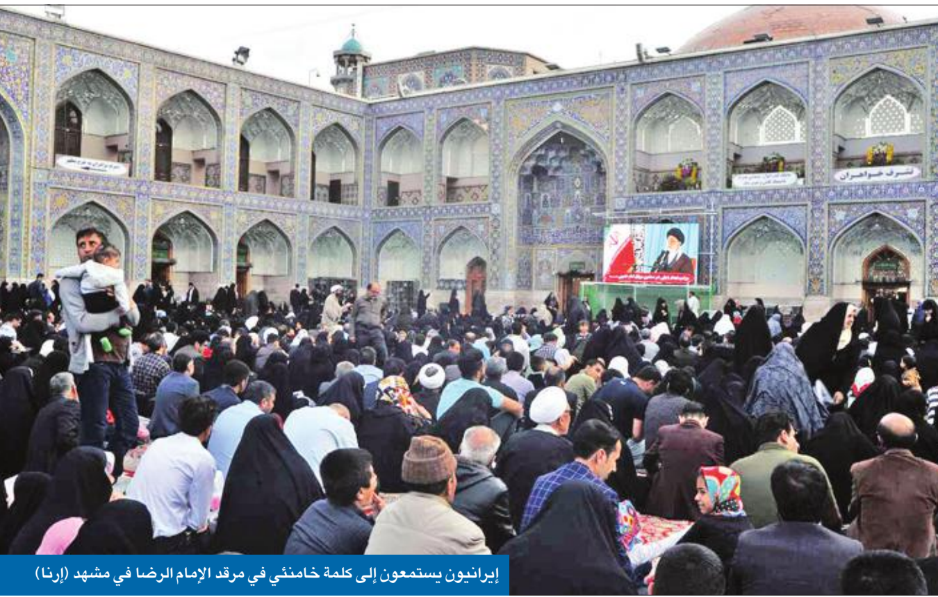
إيرانيون يستمعون إلى كلمة خامنئي في مرقد الإمام الرضا في مشهد

اعتبرها منافذ للأعداء وأمهل الحكومة 3 أشهر لإنشاء بدائل ولوح بقطع الإنترنت • مئات آلاف الإيرانيين مهددون في تجارتهم وروحاني توقع خسارة 200 ألف شاب وظائفهم