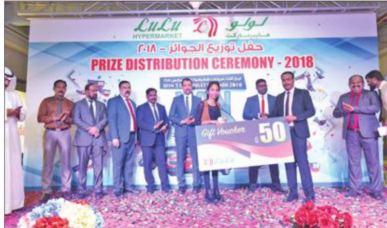
فائزة في السحب تتسلم قسيمة شراء