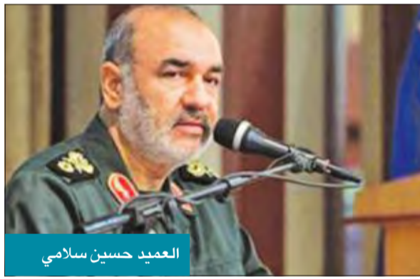
العميد حسين سلامي

المقابلات؛ أن المقاومة التي خاضها السنة ضد الجيش الأميركي بعد عام 2003، لم تكن إلا خطوطاً أمامية للحرس الثوري الإيراني ضد مشروع الولايات المتحدة في العراق. وقد أكدت تطورات الواقع العراقي صدق تلك الادعاءات يوماً بعد يوم، لاسيما في الشهر الماضي، والذي أدلى فيه نائب قائد الحرس الثوري في إيران العميد حسين سلامي، بتصريحات أكد فيها أن الجيشين العراقي والسوري يشكّلان عمقا استراتيجيا للجبهة الإسلامية الإيرانية، وأن إيران ترى في الخيار العسكري حقيقة قائمة، سواء أعلن العدو ذلك، أم أضرعه. كما أكد سلامي أن إيران طورت دقة صواريخها الباليستية؛ لاستهداف حاملات الطائرات الأميركية في أي مواجهة محتملة، وأما التقارب التركي الإيراني، ومدى تأثيره على النفوذ الأميركي في المنطقة، فقد تجسد التقارب هذا على مرحلتين؛ الأولى في ظل رفع الضغوط والعقوبات الأوروبية والأميركية على