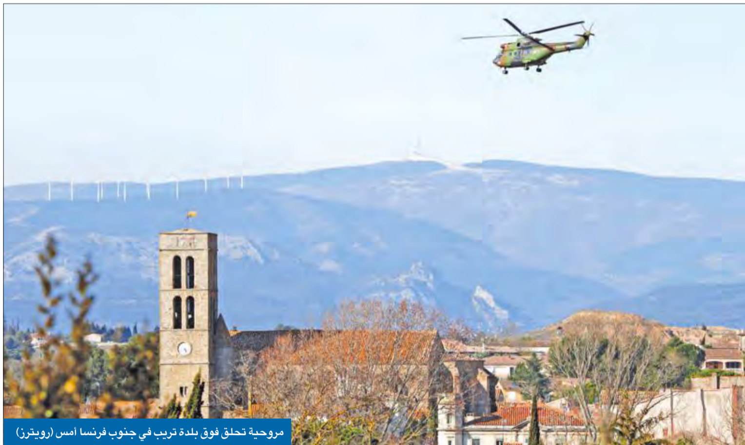
مروحية تحلق فوق بلدة تريب في جنوب فرنسا أمس