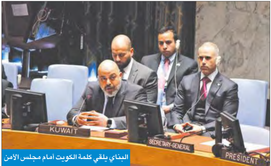
البنائي يلقي كلمة الكويت أمام مجلس الأمن

البنائي أشاد بدور القوات المتعددة الجنسيات في مواجهة الجماعات المتطرفة