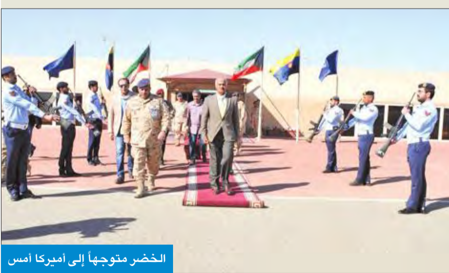
الخضر متوجهاً إلى أميركا أمس

غادر البلاد، صباح أمس، رئيس الأركان العامة للجيش الفريق الركن محمد الخضر، برفاقه وقد عسكري رفيع المستوى، متوجهاً إلى الولايات المتحدة الأميركية في زيارة رسمية. وكان في وداع الخضر، بقاعدة عبدالله المبارك الجوية، أمر القوة الجوية، وعدد من كبار ضباط الجيش.