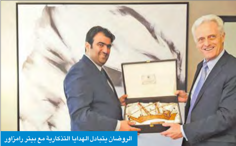
الروضان يتبادل الهدايا التذكارية مع بيتر رامزاور

استثمراتها في ألمانيا 30 مليار دولار. استقطاب الاستثمارات والقى الوزير الروضان كلمة في مؤتمر نظمه اتحاد الشرق الأوسط والأدنى «نوموف» في برلين، أمس، إذ أكد ضرورة تعزيز العلاقات الاقتصادية والاستثمارية بين الكويت وألمانيا. ولفت إلى أهمية هذا المؤتمر نظراً إلى المشاركة الواسعة للشركات الألمانية وللفرص التي يقدمها على صعيد استقطاب الاستثمارات إلى السوق الكويتي. وأشاد بالبيئة الاستثمارية في الكويت، قائلاً إن الكويت تتوفر فيها ميزات تنافسية كبيرة على صعيد الاستثمار، أهمها الموقع الجغرافي والبيئة القانونية المناسبة وأسعار الطاقة والمياه الرخيصة ورأس المال البشري الإبداعي إضافة إلى وجود خطة تنمية طموحة. وأكد الوزير الروضان أنه تم لقاء مسؤولي بعض الجامعات الألمانية وذلك في إطار التعاون مع الصندوق الوطني لدعم المشاريع الصغيرة، كذلك لتأسيس شركات مع هذه الجامعات التي لها دور كبير في تنمية اقتصاد ألمانيا.