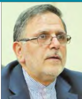
ولي الله سيف

الإيرانية تم استيراد بضائع بما يعادل 47.6 مليار دولار خلال أول أحد عشر شهراً من السنة الإيرانية الحالية، وكانت الصين ودولة الإمارات العربية المتحدة وكوريا الجنوبية وتركيا والهند بين أكبر الشركاء التجاريين، فيما شكلت البضائع المستوردة بصورة مباشرة من الولايات المتحدة أقل من 1 في المئة. وعلى أي حال، وحتى مع عدم وجود إحصاءات رسمية حول