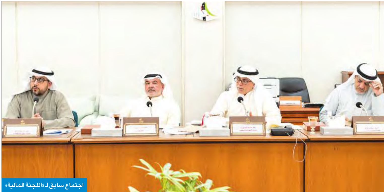
اجتماع سابق لـ «اللجنة المالية»