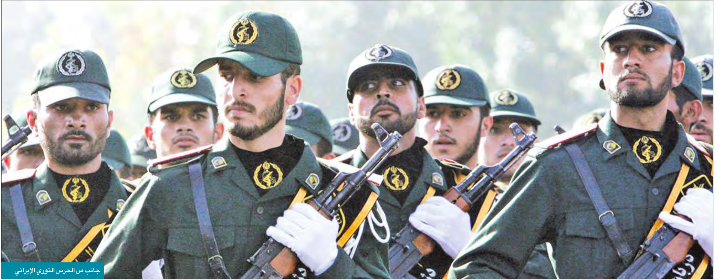
جانب من الحرس الثوري الإيراني

والمجموعات الشيعية الراضية للنفوذ الإيراني، والعمل على بناء تحالف واحد صديق للولايات المتحدة، مدعوم بقوة مالية وسياسية، وتأسيس علاقة جديدة استراتيجيّة. وأخيراً للمكمن من مراقبة السلوك الإيراني، على الولايات المتحدة الاهتمام بوضوح بالمصلحة الوطنية العراقية عبر تقديم ضمانات قوية لنجاح تقاسم عادل للسلطة في العراق، ولتحقيق استقلال محلي أكبر، وإنشاء قوات شبه عسكرية تكون بقيادة الحرس الوطني، مع اعتماد سياسة العفو بشكل محدود وضمن إعادة الاندماج السلمي للأفراد في النسيج الوطني.