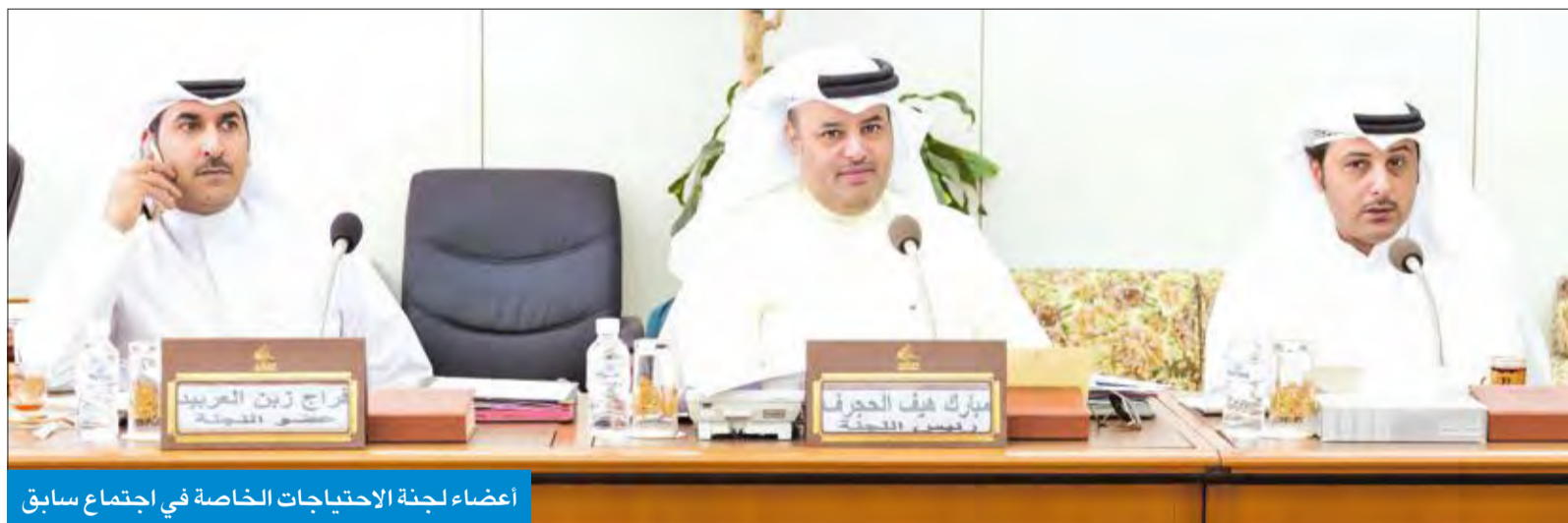
أعضاء لجنة الاحتياجات الخاصة في اجتماع سابق

● الهيئة ترفض التعديل: يحول دون اكتشاف حالات الشفاء أو تغيير درجة الإعاقة ● «التأمينات» تعترض على تخفيض سن التقاعد إلى 10 سنوات