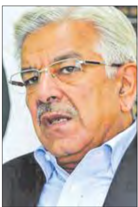
وزير خارجية باكستان