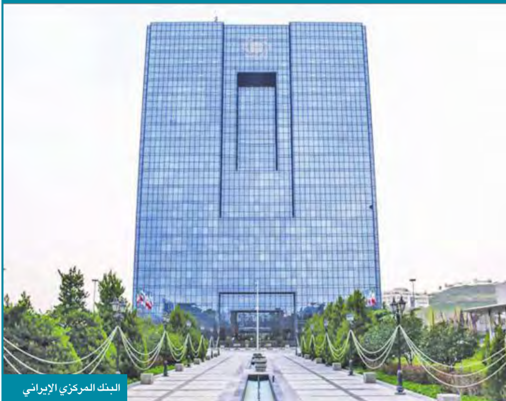
البنك المركزي الإيراني

المهيرة تشكل حصة تزيد على 50 في المئة من المستوردات وتضع المزيد من القيود على نقاط الدخول الرسمية التي يمكن أن تفضي إلى زيادة عمليات التهريب.