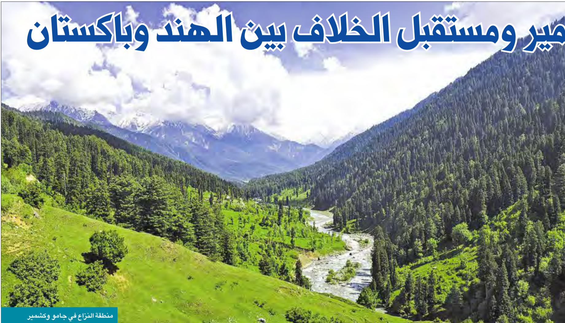
منطقة النزاع في جامو وكشمير