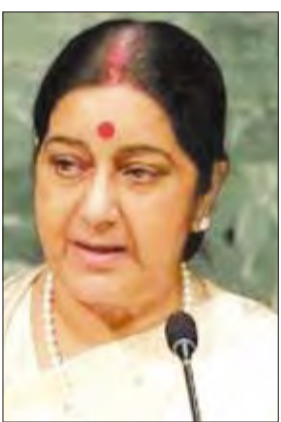
وزيرة خارجية الهند

انخرط الجانبان في محادثات خلال هذه الفترة وهبط معدل انتهاكات وقف النار بصورة كبيرة، وقد أبلغت الهند عن 70 انتهاكاً في سنة 2010 و62 انتهاكاً في 2011 و114 انتهاكاً في 2012، وفي عام 2010 التقى وزيراً خارجية البلدين في نيودلهي وأعقب ذلك اجتماعهما في إسلام آباد، وفي 2011 اجتمع وزيراً خارجية في نيوفو وفي 2012 اصدر وزيراً خارجية الهند وباكستان بياناً مشتركاً في إسلام آباد. وفيما استمرت المحادثات لم يتوقف إطلاق النار بصورة، كما استمرت المحادثات وإطلاق