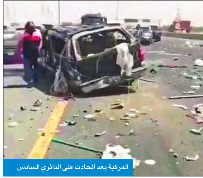
المركبة بعد الحادث على الدائري السادس

لقي وافد مصري مصرعه، صباح أمس، من جراء حادث مروع وقع على طريق الدائري السادس باتجاه مدينة سعد العبدالله، كما أسفر عن إصابة 4 وافدين بجرخ خطيرة، نقلوا على إثرها إلى المستشفى لتلقي العلاج.