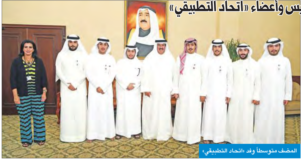
المضف متوسطاً وفد «اتحاد التطبيقي»

خلال استقبال رئيس وأعضاء «اتحاد التطبيقي»