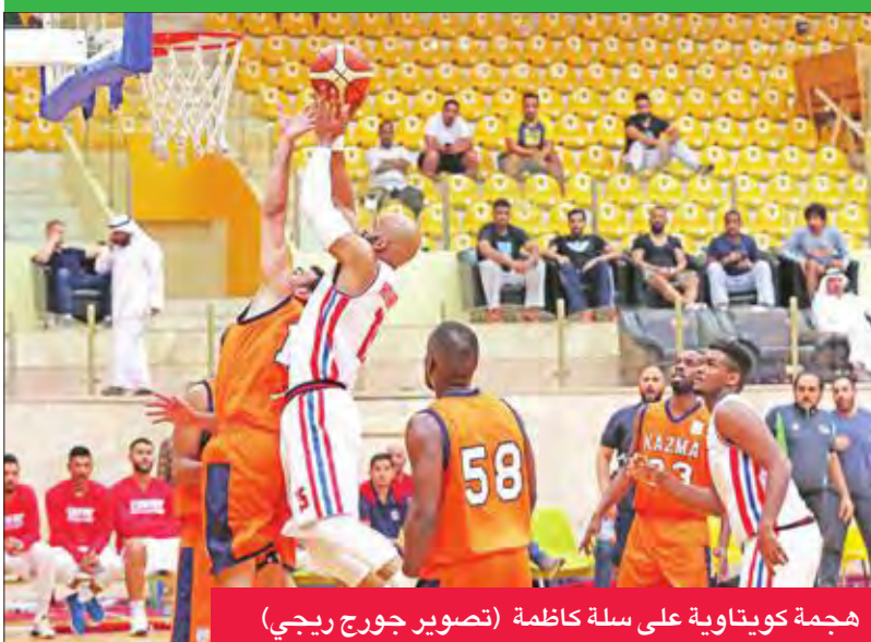
هجمة كويتاوية على سلة كاظمة