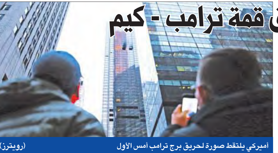
أميركي يلتقط صورة لحريق برج ترامب أمس الأول

صوت، أمس، الناخبون المجريون في انتخابات تشريعية يبدو رئيس الوزراء السادي فكتور أوربان الأوفر حظاً للفوز فيها لولاية ثالثة على رأس الحكومة. ودعي نحو 7.9 ملايين ناخب إلى التصويت في الاقتراع، الذي بدأ عند الساعة السادسة (04:00 غ)، واستمر حتى الساعة 19:00 (17:00 غ). ويرى المحللون أن الحزب القومي المحافظ «الائتلاف المدني المجري» (فيديس) يبدو متأكد من الفوز في الاقتراع. تشير استطلاعات الرأي إلى تقدم «فيديس» بفارق عشرين إلى ثلاثين نقطة، وهو يستفيد من طريقة التصويت في دورة واحدة تجمع بين الدوائر والنسبية.