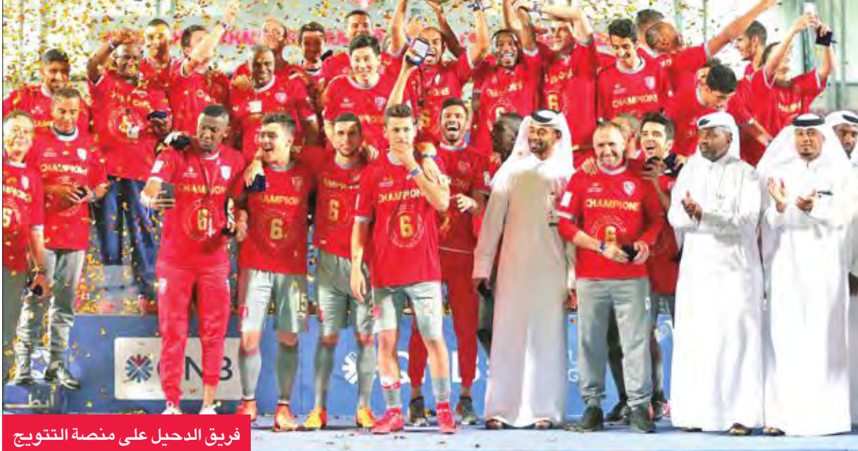
فريق الدحيل على منصة التتويج

بالاحتفاظ بلقب الدوري للموسم الثاني على التوالي، وبحقيق هذه الأرقام القياسية، متمنياً الفوز بكأس قطر وكأس الأمير.