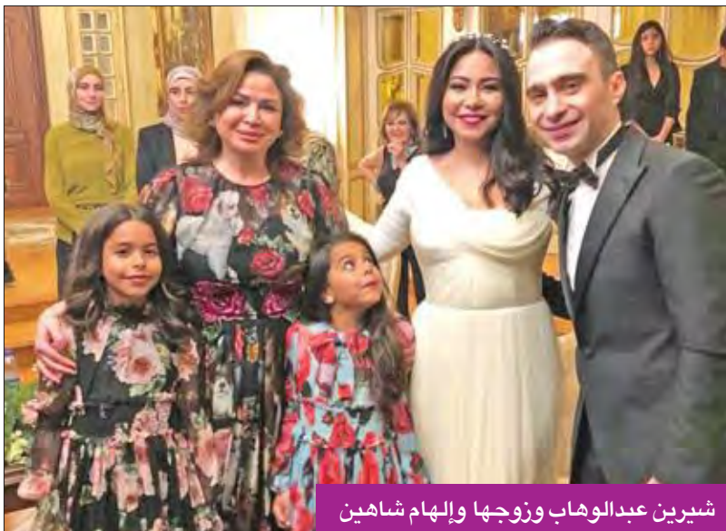
شيرين عبدالوهاب وزوجها وإلهام شاهين

وفرضت شيرين حالة من السرية والتأمين على الحفل، من خلال وجود عدد من رجال الأمن خارج الفيلا، وقاموا بمنع أي أحد من الدخول دون أن يحمل دعوات الحضور، ولم توجه شيرين دعوات لكل أصدقائها في المجال الفني، كما لم تدع فريق عملها الدائم معها في الحفلات، ومنعت وسائل الإعلام والمصورين من الدخول. وأشدلت اللقطات الخارجة من الحفل ووصلت الرقص والغناء من الطرفين على أنغام «العاب بلا»، واستمر الحفل على مدار ساعات، كما قامت شيرين بالرقص مع طفلتها أكثر من مرة.