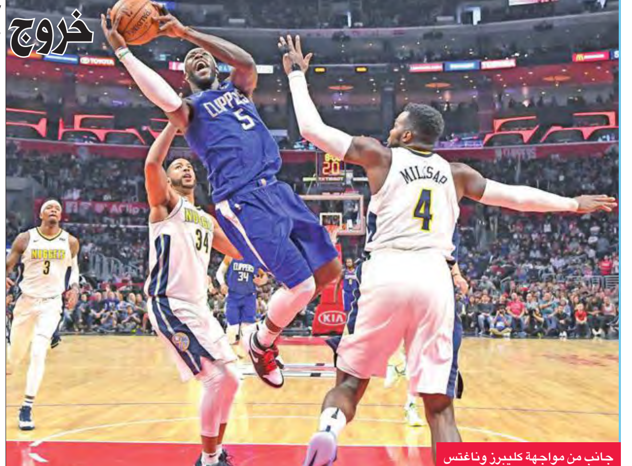
جانب من مواجهة كليبرز وناغتش

خرج لوس أنجلوس كليبرز من دائرة المنافسة على إحدى بطاقات «البلاي أوف» للمنطقة الغربية، بعد خسارته أمام دنفر ناغتش، أمس الأول، في الدوري الأميركي لكرة السلة.