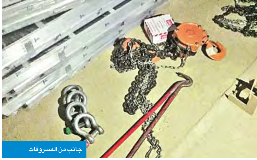
جانبا من المسروقات

في عملية مشتركة لمباحث وأمن المحافظة والمتهم اعترف بـ 10 سرقات سابقة