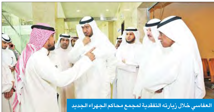
العفاسي خلال زيارته التقديرية لمجمع محاكم الجهراء الجديد

العفاسي: نقل نيابة المخدرات وإدارة الخبراء إلى «محاكم الجهراء» قريباً