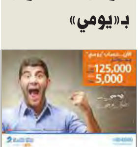
أعلن بنك برقان أسماء الفائزين في السحوبات اليومية.