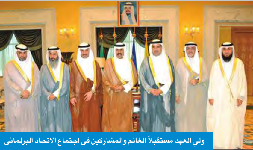
ولي العهد مستقبلاً الغانم والمشاركين في اجتماع الاتحاد البرلماني

استقبل سمو ولي العهد الشيخ نواف الأحمد، بقصر السيف، صباح أمس، رئيس مجلس الإمة مرزوق الغانم، وأعضاء الشعبين البرلمانيين المشاركين في الاجتماع الـ 138 للاتحاد البرلماني الدولي الذي عقد بمدينة جنيف، واجتماع المؤتمر الـ 27 للاتحاد البرلماني العربي الذي عقد بمدينة القاهرة. واستقبل سموه رئيس مجلس الوزراء بالإناحة وزير الدفاع الشيخ ناصر صباح الأحمد، ونائب رئيس مجلس الوزراء وزير الخارجية الشيخ صباح الخالد. كما استقبل سموه نائب رئيس مجلس الوزراء وزير الداخلية الشيخ خالد الجراح، ونائب رئيس مجلس الوزراء وزير الدولة لشؤون مجلس الوزراء أشس الصالح.