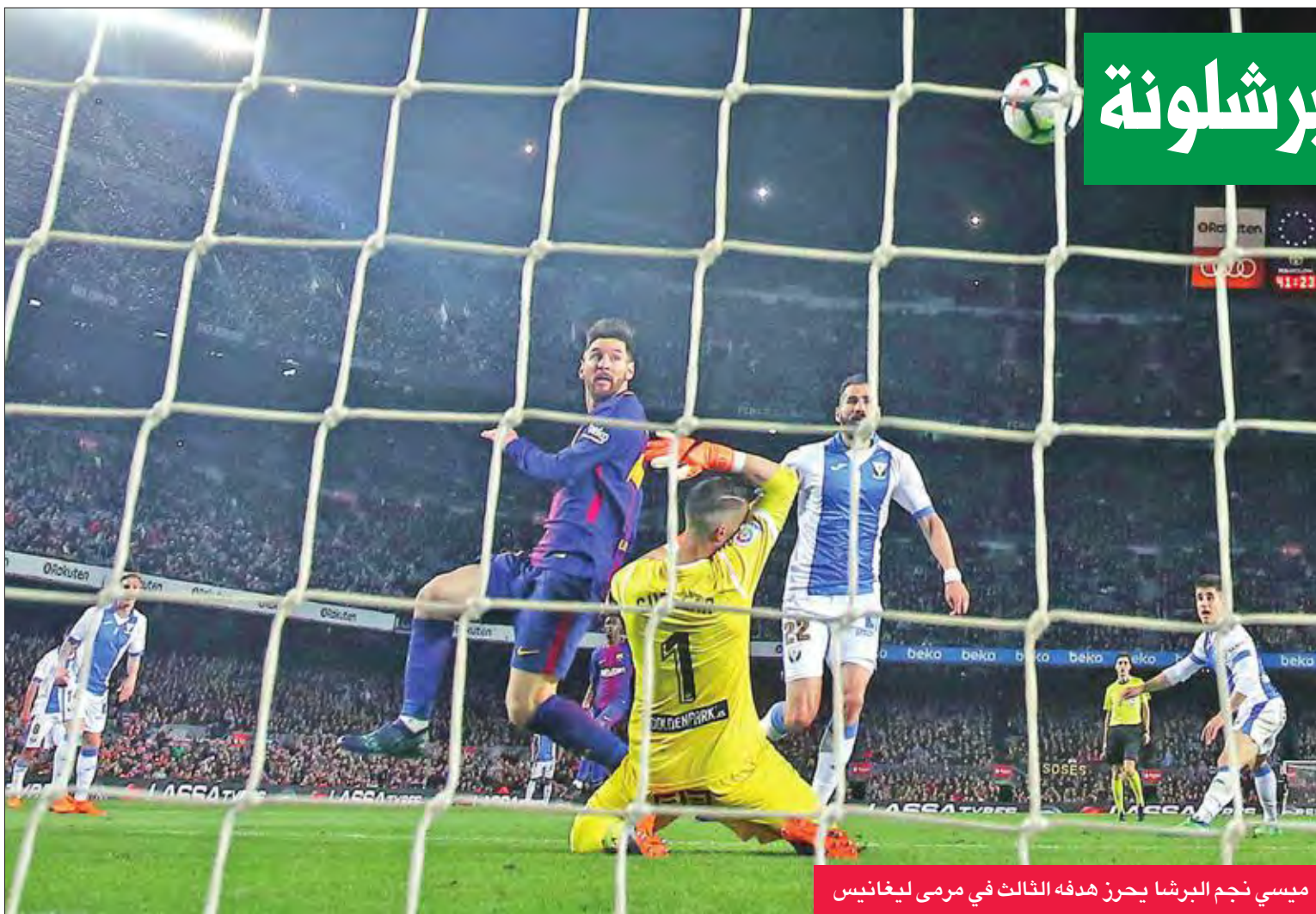
ميسي نجم البرشا يحرز هدفه الثالث في مرمى ليغانيس

من الناحية اليمنى وهيماها ميسي إلى سواريز المنفرد تماما بالحرار ولكن تشديد سواريز ارتدت من جسد الحارس. وسدد ميسي ضربة حرة من أمام قوس منطقة الجزاء في الدقيقة 22 ولكن الكرة ارتدت من الحائط البشري الدفاعي. وجد ميسي دفعة معنوية في الدقيقة 27 وسدد ضربة حرة من مسافة 26 مترا ليضع الكرة بسراها داخل المرمى على يسار الحارس محرزاً هدف التقدم لبرشلونة.