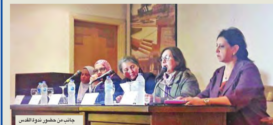
جانب من حضور ندوة القدس