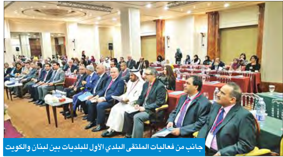
جانب من فعاليات الملتقى البلدي الأول للبلديات بين لبنان والكويت

أوصى الملتقى البلدي الأول للبلديات بين لبنان والكويت، أمس، بدعم إطلاق مركز دعم القرار البلدي، بالتعاون مع المعهد العربي للتخطيط، وبالشراكة مع بلديتي بيروت والكويت، لتعزيز العمل البلدي وتبادل الخبرات بين البلديات. ودعا المشاركون بالملتقى في توصياتهم الختامية إلى توحيد وتعميم أساليب تقييم مخاطر سلامة الغذاء في البلديات، وتبني مبادرة تقييم موحدة لقرارات أنظمة الرقابة على الأغذية. وشددوا على «ضرورة تبني الحلول الذكية في مجال سلامة الأغذية والتغذية، لمواجهة تحديات سلامة الأغذية، وخاصة في المنطقة العربية، وضرورة دعم وتطوير التشريعات المتعلقة بصحة وسلامة المستهلك».