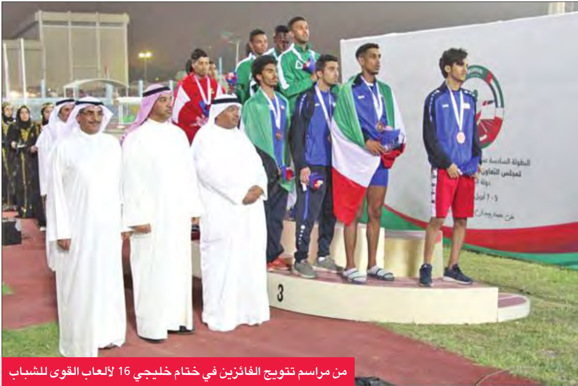
من مراسم تتويج الفائزين في ختام خليجي 16 لألعاب القوى للشباب