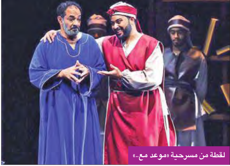
لقطة من مسرحية «موعد مع...»

المشاركات الخارجية ومدى أهميتها؟ وهل جرى تقييم هذه المشاركات؟ وما المطلوب من هذه الاستحقاقات أم أن الأمور تسير على البركة، وبلا تخطيط سابق؟ وربما السؤال الأهم، ما دور الأمين العام المساعد لقطاع الفنون بالمجلس الوطني للثقافة والفنون والآداب د. بدر الدويش بهذه الأمور؟ فهو يعي جيدا أن المشاركات الخارجية مهمة جدا للتواصل مع الحراك المسرحي العربي والعالمي، لاسيما أن الدويش على قمة قطاع الفنون في