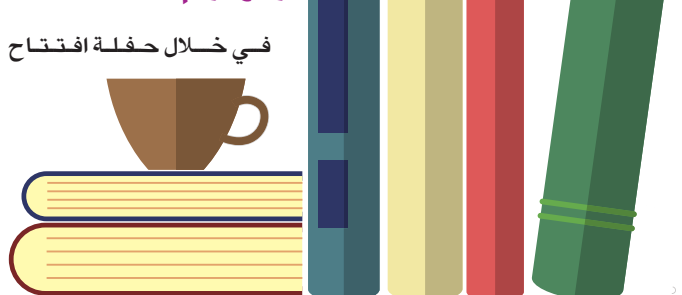
في خلال حفلة افتتاح