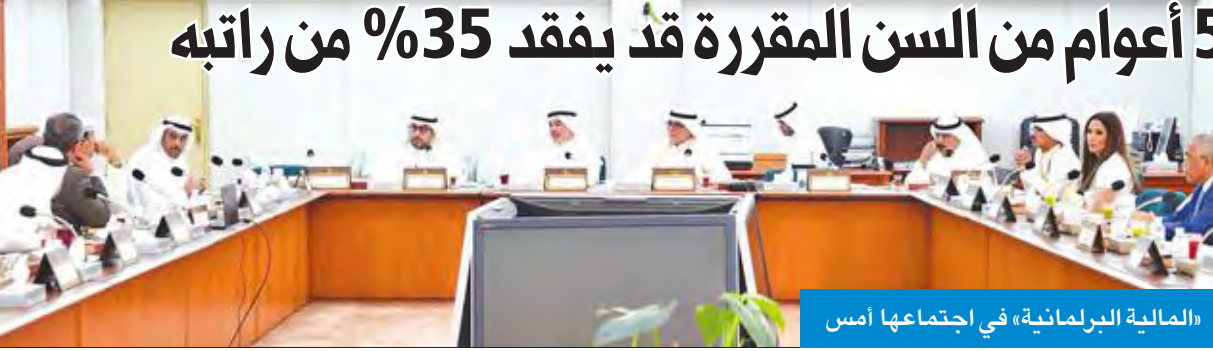
«المالية» البرلمانية، في اجتماعها أمس

30 عاماً للرجل و25 للمرأة ومن يتقاعد قبل 5 أعوام من السن المقررة قد يفقد 35% من راتبه