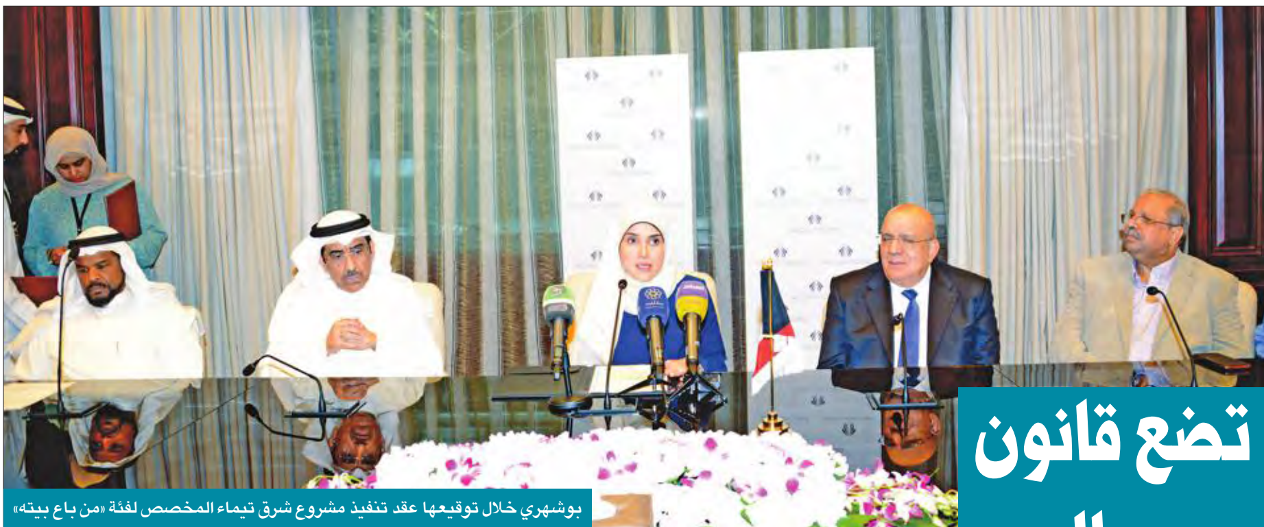
بوشهري خلال توقيعها عقد تنفيذ مشروع شرق تيماء المخصص لفئة «من باع بيته»