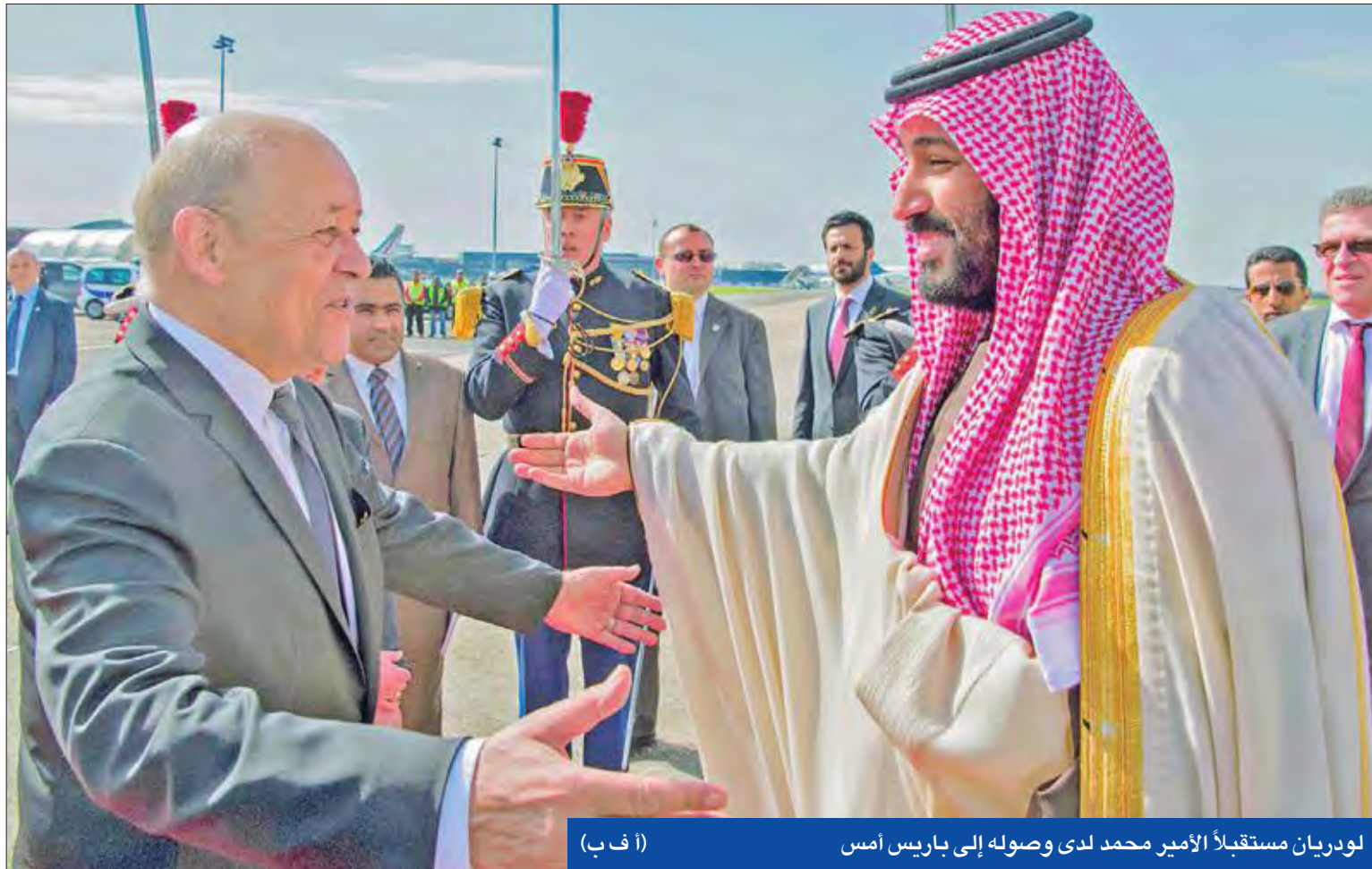
لودريان مستقبلاً الأمير محمد لدى وصوله إلى باريس أمس

• ولي العهد يبحث مع ماكرون وضع المنطقة • إحباط مخطط إرهابي بالعوامية واعتراض صاروخ استهدف نجران