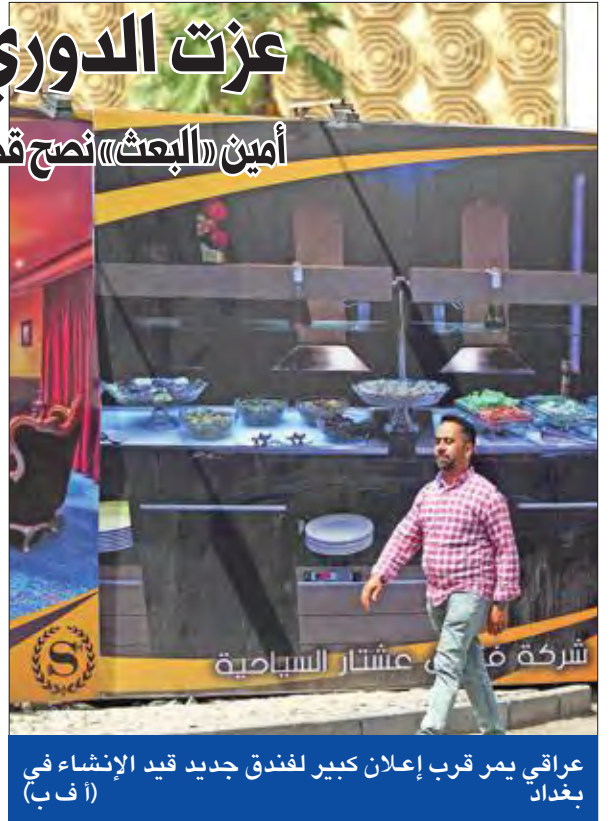
عراقي يمر قرب إعلان كبير لفندق جديد قيد الإنشاء في بغداد

وأشار إلى أن «ترامب لن يضرب إيران حتى يوم القيامة»، داعياً الجماهير العربية إلى أن تنتفض من المحيط إلى الخليج نصرمة لفلسطين في مواجهة