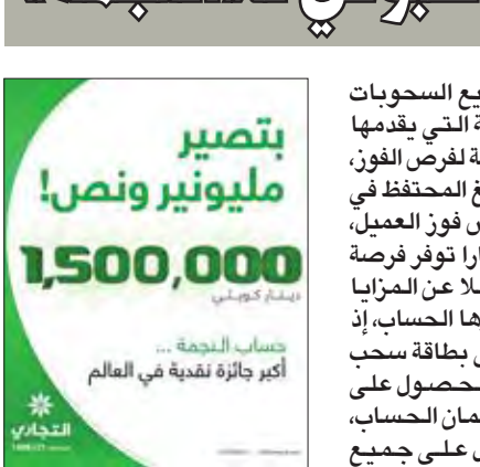
أكثر جائزة نقدية في العالم

فإنهم يستطيعون تقديم طلب فتح حساب من خلال موقع البنك الرسمي، وسيتبع الاتصال بهم عن طريق دائرة المبيعات، وترتيب موعد لزيارة العميل لاستكمال إجراءات فتح الحساب.