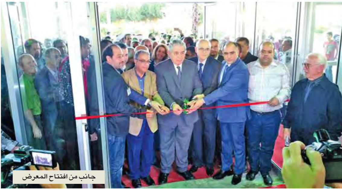
جانب من افتتاح المعرض

توقفت كثيراً أمام هذا القول، لأنه جاء عكس كتابة إحسان عبدالقدوس، المتمثلة برواياته العاطفية، التي أشعلت وأوقدت مشاعر أجيال من قرائه من المحيط إلى الخليج، كاتب العواطف لا يؤمن بالعواطف، امر بمنتهى التناقض، وربما يكون تركيبة العبقرية وسر النجاح أن تكتب عن العاطفة وأنت لا تؤمن بها، والعقل يحكمك، ويحكم صيرورة ودقة العمل، حتى يتمكن الكاتب من ضبطه، بعيداً عن اندلاق وانسكاب عواطفه مع مضمون كتابته.