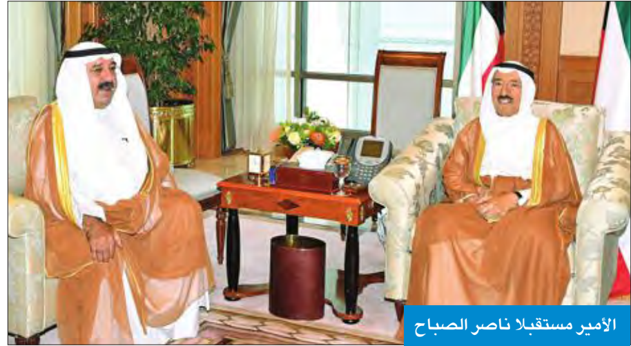
الأمير مستقبلاً ناصر الصباح

استقبل سمو أمير البلاد الشيخ صباح الأحمد، بقصر السيف صباح أمس، سمو ولي العهد الشيخ نواف الأحمد. كما استقبل سموه، رئيس مجلس الأمة مرزوق الغانم، وأعضاء الشعبين البرلمانيين المشاركين في اجتماع المؤتمر الـ 138 للاتحاد البرلماني الدولي الذي عقد بمدينة جنيف واجتماع المؤتمر الـ 27 للاتحاد البرلماني العربي الذي عقد بالقاهرة. كما استقبل سموه رئيس مجلس الوزراء بالإناحة وزير الدفاع الشيخ ناصر صباح الأحمد.