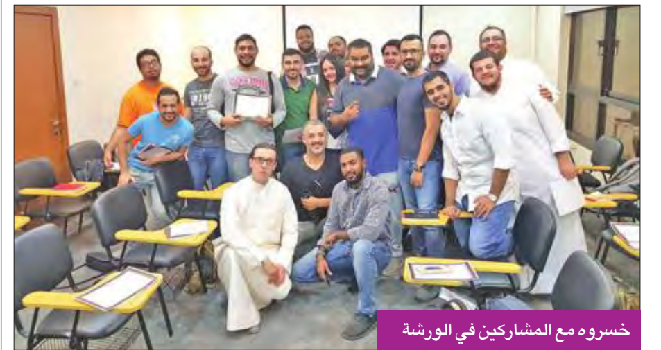
خسروه مع المشاركين في الورشة

كرم المخرج رمضان خسروه المنتسبين لورشة الإنتاج السينمائي، التي أقيمت خلال الفترة الماضية، وحاضر هو فيها.