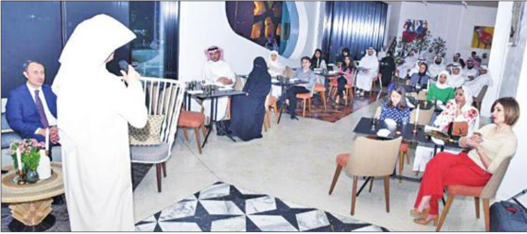
الجيماز متحدثاً إلى الحضور عن إنجازات الشركة