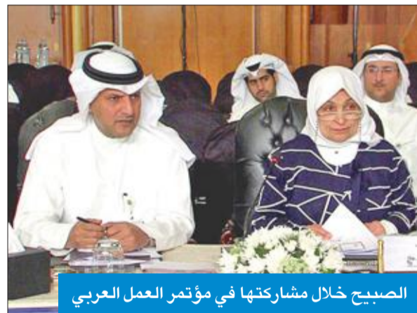
الصبيح خلال مشاركتها في مؤتمر العمل العربي

أعلنت وزيرة الشؤون الاجتماعية والعمل وزيرة الدولة للشؤون الاقتصادية هند الصبيح، أمس، انتخاب الكويت عضواً في مجلس إدارة منظمة العمل العربية من 2018 إلى 2020. جاء ذلك في تصريح أدلت به وزيرة الصبيح لـ «كونا»، على هامش مشاركتها في أعمال اليوم الثالث لمؤتمر العمل العربي في دورته 45، الذي يقود تحت رعاية الرئيس المصري عبدالفتاح السيسي، من 8 إلى 15 الجاري.