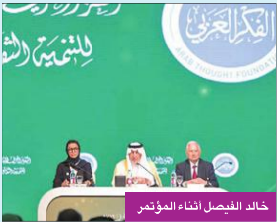
خالد الفيصل أثناء المؤتمر

«الفكر العربي» تطلق تقريرها العاشر للتنمية الثقافية من دبي