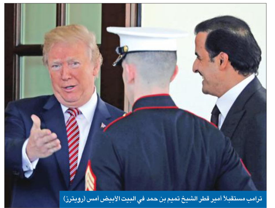
ترامب مستقبلاً أمير قطر الشيخ تميم بن حمد في البيت الأبيض أمس

أكدت مصادر مطلعة في واشنطن، أمس، أن الرئيس الأميركي دونالد ترامب حسم أمره، وأقر توجيه ضربة كبيرة لنظام الرئيس بشار الأسد، قد يكون لها تداعيات كبيرة على العملية السياسية في سورية، وعلى الأوضاع الإقليمية. وبينما تطرق المراقبون إلى سيناريوهات عسكرية عدة، بينها تدمير القوة الجوية للقوات الحكومية الموالية للأسد، أو استهداف واسع لكل المواقع الإيرانية في سورية، شهد مجلس الأمن مواجهة أميركية-روسية، قال مراقبون إن المفاوضات بين البلدين حول مرحلة «ما بعد الضربة» قد تجاوزتها، بعد أن خفضت موسكو حدة تصريحاتها بشأن «التزاماتها» بالدفاع عن الأسد.