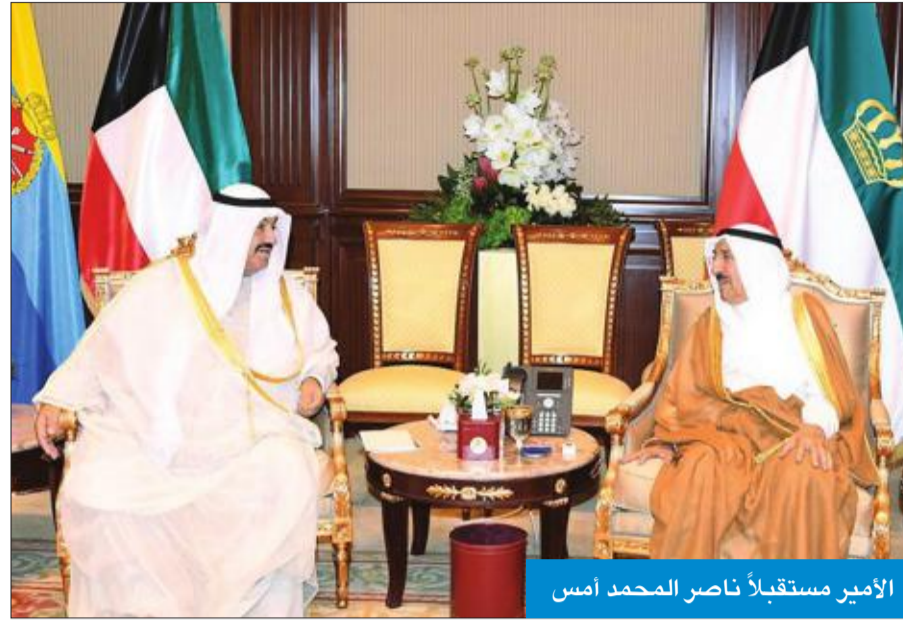
الأمير مستقبلاً ناصر المحمد أمس

استقبل صاحب السمو أمير البلاد الشيخ صباح الأحمد، بقصر بيان، أمس، سمو الشيخ ناصر المحمد. من جهة أخرى، بعث سموه ببرقية تهنئة إلى رئيس جمهورية أرمينيا آرمنين ساركسيان، عبر فيها سموه عن خالص تهنأته بمناسبة أداءه اليمين الدستورية رئيساً لأرمينيا، متمنياً سموه له كل التوفيق والسداد وموفق في الصحة والعافية، وللعلاقات الطيبة بين البلدين المزيد من التطور والنماء. وبعث سمو ولي العهد الشيخ نواف الأحمد، ورئيس مجلس الوزراء سمو الشيخ جابر المبارك ببرقيته تهنئة مماثلتين.