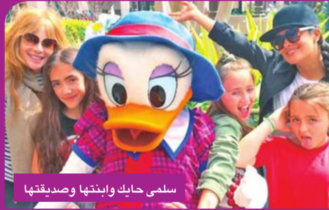
سلمى حايك وابنتها وصديقتها

رفضت الفنانة بثينة الرئيسي 9 أعمال للتفرغ لتصوير مسلسل «محطة انتظار» الذي يشهد وقوفها أمام الفنان محمد المنصور والفنانة أحلام محمد.