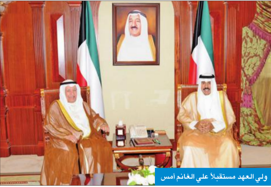
ولي العهد مستقبلاً علي الغانم أمس

استقبل سمو ولي العهد الشيخ نواف الأحمد، بقصر بيان، صباح أمس، سمو الشيخ ناصر المحمد، والشيخ د. إبراهيم الدعيج، واستقبل سموه رئيس مجلس إدارة غرفة تجارة وصناعة الكويت علي ثنيان الغانم.