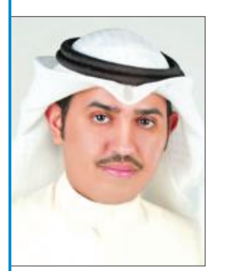
ناصر الدوسري (وكيل وزارة مساعد) إذا كان الجواب بنعم يرجى تزويدي بصورة ضوئية من كل متقدم وسيرته الذاتية وتدرجه الوظيفي حسب ديوان الخدمة المدنية، ويرجى تزويدي بصورة ضوئية عن كتاب ترشيح المتقدمين لمجلس الوزراء

وجه النائب ناصر الدوسري سؤالاً إلى وزير الصحة د. باسل الصباح جاء فيه: «صدرتم قراراً وزارياً يقضي بتشكيل فريق عمل لمراجعة وتحديث الهيكل التنظيمي لوزارة الصحة بالتنسيق مع ديوان الخدمة المدنية وفقاً لقرار 666 لسنة 2001». وأضاف: كما أصدر قراراً وزارياً بتسمية وكلاء مساعدين بالصحّة مخالفاً بذلك القوانين واللوائح الوزارية ومخالفاً مخالفة صارخة لمرسوم رقم 111 لسنة 2015، فهل تم تشكيل لجنة لاختيار المناصب الأشرافية والقيادية؟ إذا كان الجواب بنعم يرجى تزويدي بنسخة من القرار ومحاضر اجتماعاتها وعدد أعضائها ومكافئاتها المالية، وتزويدي بالسيرة الذاتية لأعضاء اللجنة كل على حدة، وهل تم الإعلان عن شغل المناصب القيادية