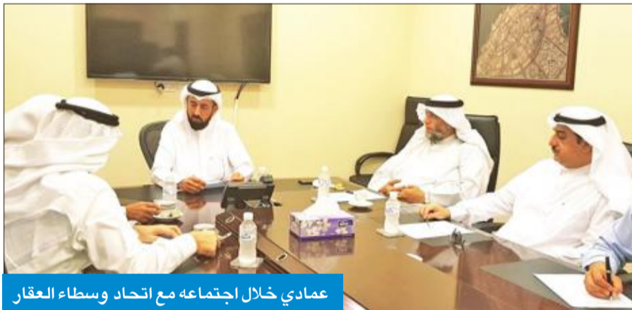
عمادي خلال اجتماعه مع اتحاد وسطاء العقار

المشاركة في تقديم وإنشاء معاملات شهادات الأوصاف إلكترونياً، حيث يتم ترشيح عدة أشخاص من الاتحاد لمتمتعهم الصلاحية لاستخراج هذه المستندات وكنتي التحديد، إيماناً منها بتيسير إنجاز المعاملات للقطاع الخاص، عبر نظام الربط الآلي بين البلدية والجهات المعنية.