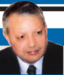
صالح القلب كاتب وسياسي اردني