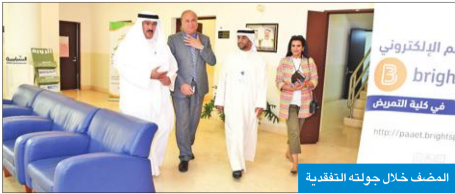
المضف خلال جولته التفقدية

خلال جولاته الميدانية لتفقد كلياتها ومواقعها