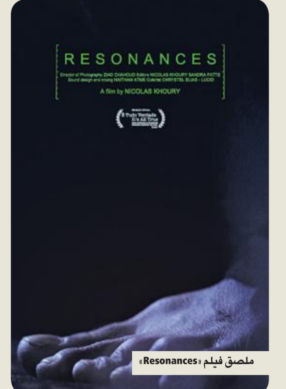
ملصق فيلم «Resonances»