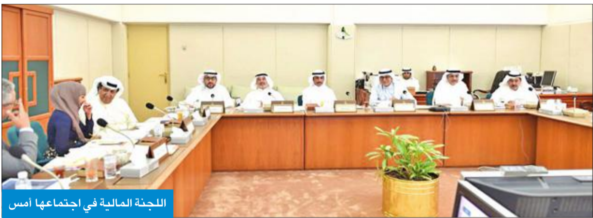
اللجنة المالية في اجتماعها أمس

وأوضح أن الاقتراحات الثلاثة كانت في حالة تطبيق القانون في أن من يخدم 30 سنة يستحق معاشاً تقاعدياً دون أي تخفيض مالي عليه، ومن يخدم 25 سنة