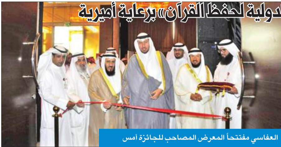
العفاسي مفتتحاً المعرض المصاحب للجائزة أمس

أكد وزير العدل وزير الأوقاف والشؤون الإسلامية، المستشار د. فهد العفاسي، أن «هم ما تفخر به الكويت أن قبض الله لها حكاما أهله وإكرام حفظته، لأنهم في الحقيقة يحتفون بكتاب شكّل وعى أمتنا العربية والإسلامية، وجعلها خير أمة أخرجت للناس».