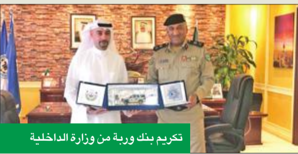
تكريم بنك وربة من وزارة الداخلية

تلقى بنك وربة تكريماً من وكيل وزارة الداخلية المساعد لشؤون المرور بالإدارة اللواء فهد الشويح، لمشراكته ورعايته في أسبوع المرور الخليجي الموحد 2018، الذي أقيم تحت شعار «حياتك آمنة»، بهدف التوعية المرورية لسلامة مستخدمي الطرق وأهمية التقيد بالأنظمة المرورية، حفاظاً على سلامتهم، وللمحد من الحوادث المهلكة لأرواح. أقيمت فعاليات أسبوع المرور الخليجي الموحد من 11 حتى 15 مارس الماضي، وتضمن العديد من الأفكار المتنوعة لتوعية المرورية لسلامة مستخدمي الطرق، وليس التركيز على تحرير المخالفات. كما وسعت الحملة نشاطها، لتشمل جميع وسائل الإعلام المقروءة والمسموعة ومواقع التواصل الاجتماعي، إضافة إلى مطبوعات باللغتين العربية والإنكليزية والنفوذ الإعلامية الأخرى لتوصيل الرسالة التوعوية. من جانبه، عبّر المدير التنفيذي للاتصال المؤسسي لمجموعة بهذا التكريم من وزارة الداخلية، مشيراً إلى أن «وربة» لن يتوان عن المساهمة في الفعاليات التي تصب في مصلحة المواطن بالدرجة الأولى، وتحافظ على سلامتهم، لا سيما في ظل تزايد أعداد الحوادث المرورية في الكويت والوفيات والإصابات والخسائر الناجمة عنها.