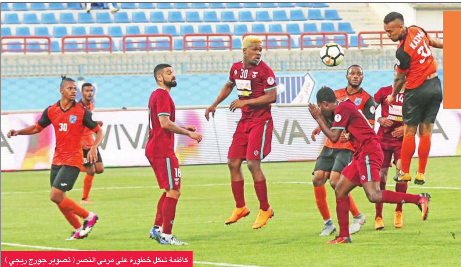
كاظمة شكل خطورة على مرمى النصر

وبعد تقدم النصر، تسلّم كاظمة الأفضلية، بفضل تحركات الحبيتر، وناصر فرج، وفاندري، وتمكن الأخير من ترجمة كرة عرضية لعمر الحبيتر في شبكات الحارس محمد هادي، واستمرت