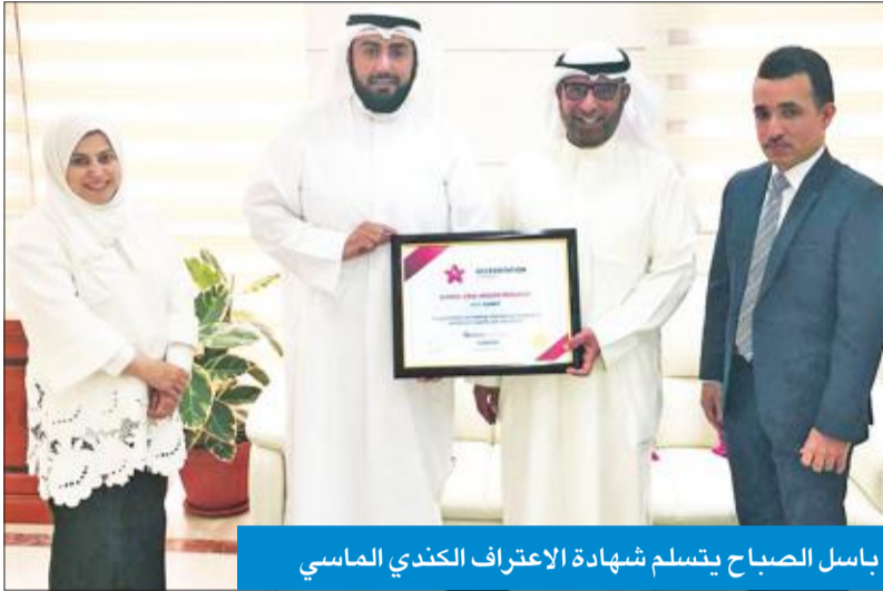
باسل الصباح يتسلم شهادة الاعتراف الكندي الماسي

اعلن وزير الصحة الشيخ الدكتور باسل الصباح حصول ستة مراكز مدرسية كويتية لصحة الفم والأسنان على أعلى درجات الاعتراف الكندي الماسي لجودة الخدمات الصحية من هيئة الاعتماد الكندي الدولي المعنية بتحسين جودة الخدمات الصحية والاجتماعية.