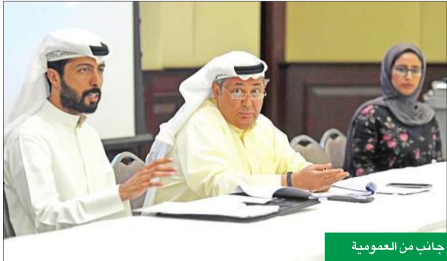
جانب من العمومية

وأفاد بأن مجلس الإدارة يبذل حالياً جهوداً استثنائية لتحقيق أفضل إيرادات في الأعوام المقبلة، مما يعكس إيجاباً على زيادة ربحية