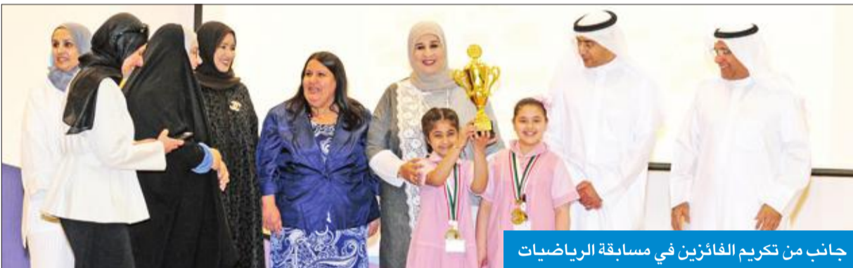
جانب من تكريم الفائزين في مسابقة الرياضيات