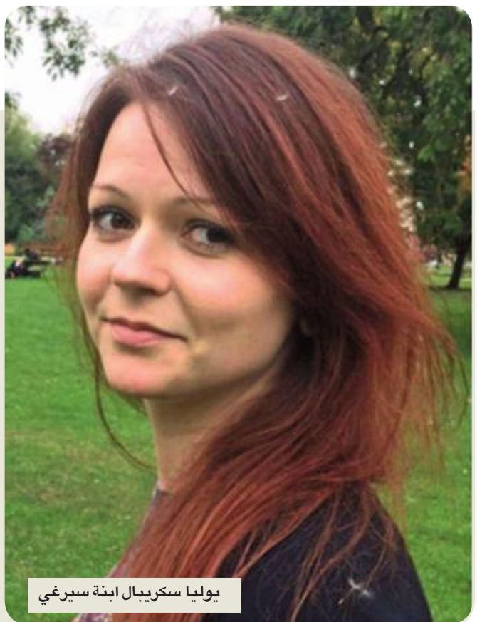
يوليا سكريبال ابنة سيرغي

اليوم، يجازف التخطّط البريطاني بنسف التضامن الذي كان سائداً على الجبهة الأوروبية الموحدة بنسبة معينة. وجدت لندن أصلاً صعوبة في إقناع بلدان مثل إيطاليا واليونان بدعم الاتهامات الموجهة ضد موسكو في التصريحات التي أصدرتها بشأن الاعتداء، ولم تؤيد البلدان الأوروبية طرد الدبلوماسيين الروس. كذلك، بدأ السياسيون المشككون في ألمانيا يرفعون أصواتهم الآن. مثلاً، غرّد حاكم ولاية شمال الراين وستفاليا، إرمين لاشيت، عضو «الحزب الديمقراطي المسيحي» الذي تقوده أنجيلا ميركل واحد المقربين من المستشارية الألمانية: «إذا أردتم إجبار معظم الدول الأعضاء في حلف الأطلسي على التضامن معكم، ألا فُتْرَض أن تقدموا لها دليلاً واضحاً؟».