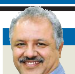
أ. د. غانم النجار

بين حين وآخر، يهددنا مسؤول أو آخر بفرض ضريبة أو ضرائب... ولم يشرح لنا أحد كمواطنين عاديين لماذا؟ أو أين ستذهب هذه الضريبة؟ لذلك لا بد من استعراض الجانب التاريخي للضرية، فأول ضرية في التاريخ كانت على يد الفراعنة في مصر، وبدأت بزيت الطبخ لندرتها، ثم تطور الأمر أيام الإمبراطورية الإغريقية، إذ فرضت الضرائب لتمويل الحرب، وهم أول من أعادوا دفع الضرية لمن دفعها في حالة الاستيلاء على ثروات الدول الأخرى وتوزيعها. ثم أتت الإمبراطورية الرومانية، وبدأت بضرية الواردات والمصادرات، وبعد ذلك توسعت الضرائب، وأصبحت كما هي الحال في حاضرنا، لتكون الحكومة قادرة على الصرف