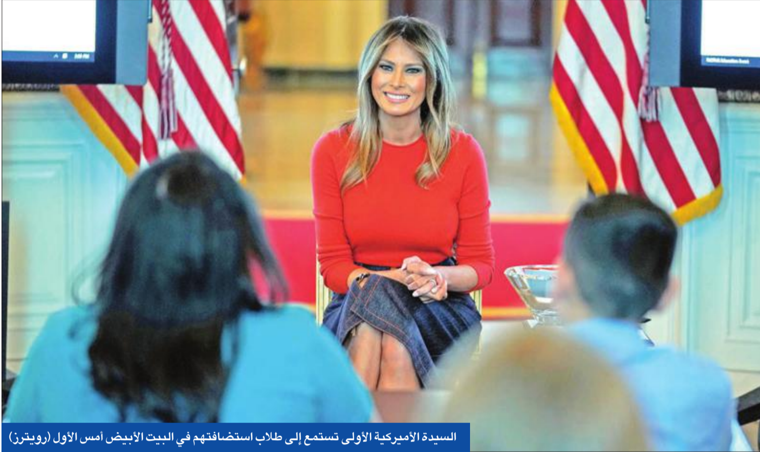
السيدة الأميركية الأولى تستمع إلى طلاب استضافتهم في البيت الأبيض أمس الأول

الرئيس الأميركي: أتعرض لاضطهاد وما جرى هجوم على بلدنا... وتحقيق مولر عار