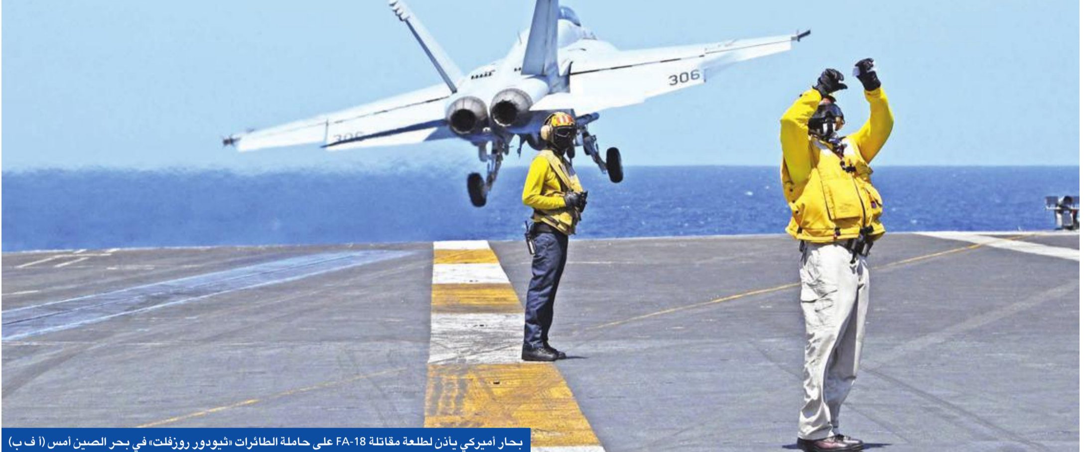
بحار أميركي ياذن لطلعة مقاتلة FA-18 على حاملة الطائرات «ثيودور روزفلت» في بحر الصين أمس

وتوعد الرئيس التركي رجب طيب أردوغان أمس المسؤولين عن هجوم دوما بأنهم سيدفعون ثمنًا باهظًا، مشيراً إلى أنه بعد أن أعرى ليوثين عن قلقه من استهداف المدنيين بالكيماوي سيكمل مبادراته في إجراء مكالمات مشابهة مع قادة العالم.