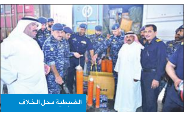
الضبطية محل الخلاف

على محظورات أيضاً، منها حاويات خمور سيتم إخطار النيابة العامة بها، تمهيداً لاتخاذ ما يلزم من إجراءات لإتلافها، في حصر الممنوعات. ولفت إلى أن أعمال اللجنة حظيت بمقابلة من قبل المدير العام للجمارك ونائبه لشؤون المنافذ من بداية عملها حتى انتهائها، ومن المتوقع أن تنهي مهام عملها بشكل كامل خلال الأسابيع القليلة المقبلة.