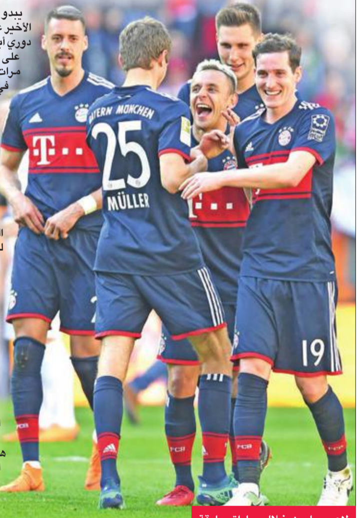
لاعبو بايرن خلال مباراة سابقة

ويتعين على المدرب الإيطالي فينتشنزو مونتيليا تسجيل هدفين على الأقل في معقل بايرن، للإبقاء على آمال التأهل. لكن إشبيلية، المتوج بلقب الدوري الأوروبي (يوروبا ليغ) خمس مرات، سقط سقوطا كبيرا أمام سلتا فيغو صفر-4 في نهاية الأسبوع، ما دفع مونتيليا إلى القول: «نحن غاضبون، نحن بحاجة إلى حلول».