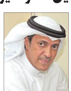
خالد العتيبي دراسة الجدوى ومرحلة التصميم حتى الانتهاء من المشروع وفق الجدول الزمني، قائلًا: على الوزارة أن تراقب أهمية المشروع وتباعد عن البيروقراطية وتختصر المدة الزمنية لكافة

اعتبر النائب خالد العتيبي توجه وزارة الأشغال العامة إلى تطوير طريق الفحيحيل ليكون طريقاً سريعاً مرتفعاً بطول 38 كيلومتراً خطوة تأخرت كثيراً. وأكد العتيبي في تصريح صحافي أمس أنه كان يتعين على الوزارة أن تتعاطى وتتجاوب مع المقترحات والنيابية والمطالب الشعبية التي استهدفت هذا الطريق الحيوي بشكل أسرع من ذلك بكثير ومنذ سنوات مضت بعد أن ضرب الشلل المروري طريق الفحيحيل على مدار اليوم بسبب عدم قدرته على استيعاب الكثافة المرورية الحالية. وزاد العتيبي: تقدمت باسئلة نيابية استفسرت فيها عن مواعيد الإعلان عن المشروع بمراحله المختلفة بداية من