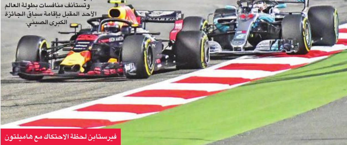
فيرستابن لحظة الاحتكاك مع هاميلتون

تعامل الهولندي ماكس فيرستابن، سائق فريق ريد بول، بهدوء إزاء الانتقادات الحادة التي وجهها له بطل العالم البريطاني لويس هاميلتون، سائق مرسيدس، بشأن اصطدامهما خلال سباق الجائزة الكبرى البحري الذي أقيم الأحد على ضفاف صخبر، ضمن منافسات بطولة العالم لسباقات سيارات فورمولا 1، حيث قال إن هاميلتون تصرف تحت تأثير العصبية الحظية. وكان فيرستابن حاول تجاوز هاميلتون خلال اللفة الثانية بمناورة انسمت بمجازفة كبيرة، لكنه تسبب في ثقب بإطار في