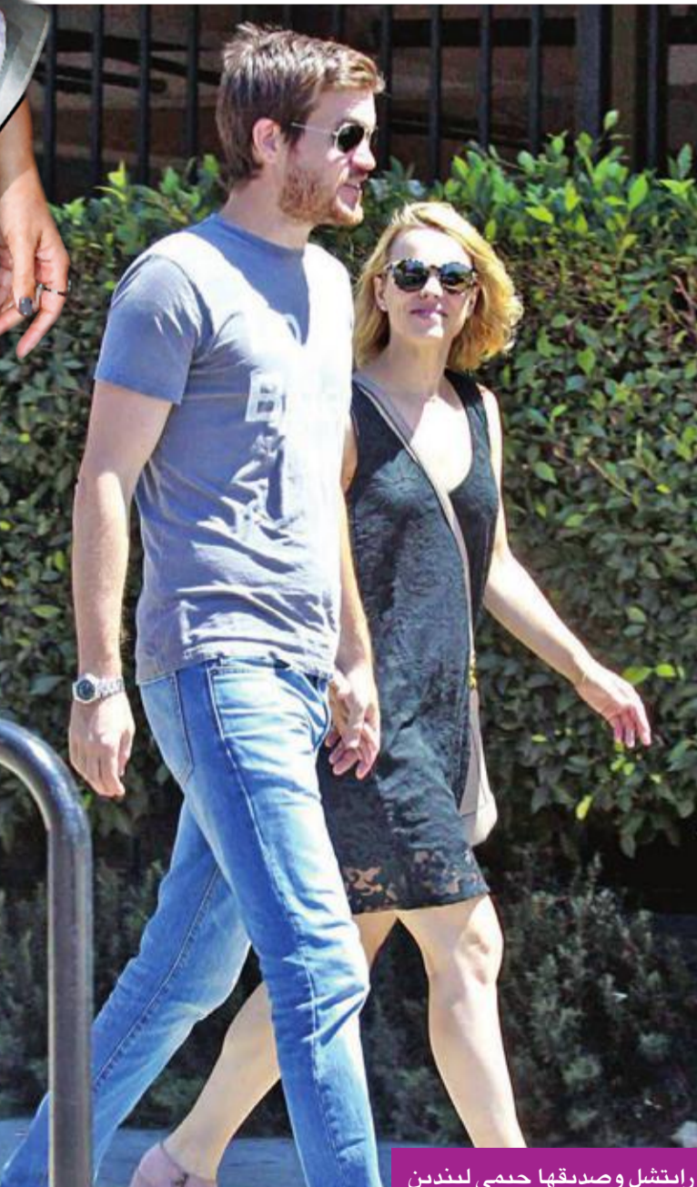
رايتشل وصديقتها جيمي ليندين

«Disobedience» في 28 الجاري، وهو من إخراج سيباستيان ليليو، ويشارك في بطولته، إلى جانب رايتشل مكادامز ورايتشل وايز، كل من اليساندرو نيفولا وأنتون ليسير ونيكولاس ووديسون وكارا هورجان وغيرهم من النجوم.