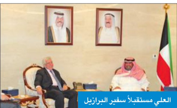
العلي مستقبلاً سفير البرازيل

بحث رئيس جهاز الأمن الوطني الشيخ ناصر العلي، أمس، مع سفير البرازيل لدى الكويت نورثون رابستا التعاون المشترك. وقالت إدارة العلاقات العامة بجهاز الأمن الوطني، في بيان صحفي، إنه تم خلال اللقاء