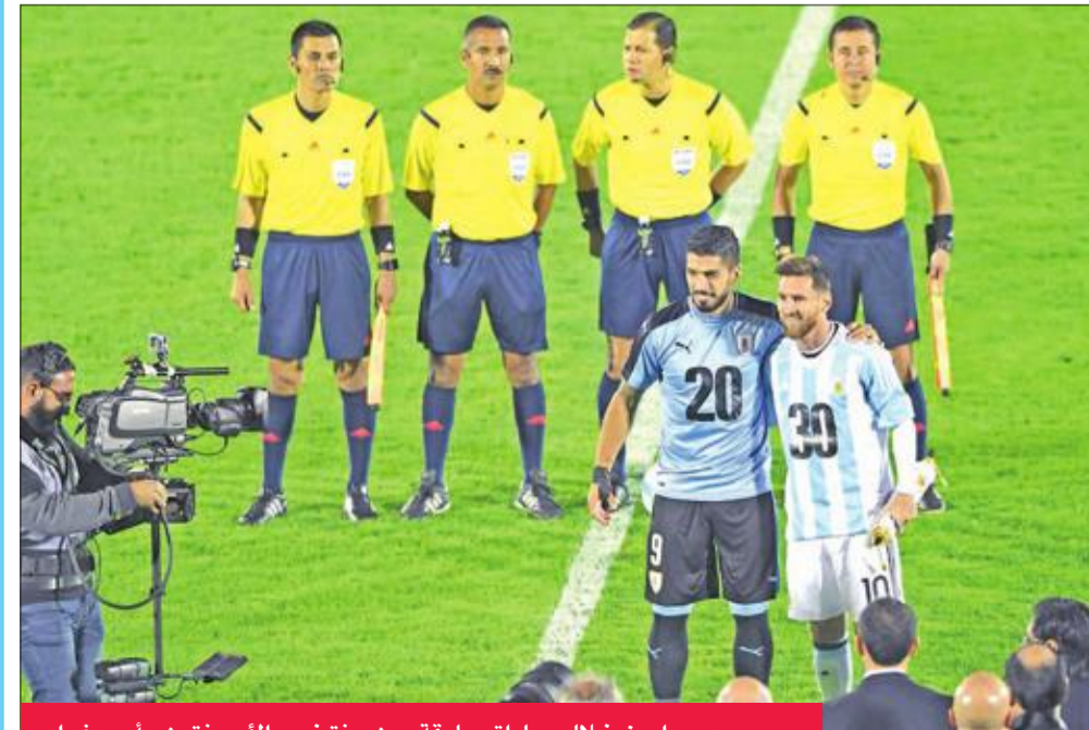
ميسي وسواريز خلال مباراة سابقة بين منتخبي الأرجنتين وأوروغواي

كما كشف مسؤول رفيع المستوى في الأرجنتين أن بناء الاستادات التي تستضيف فعاليات البطولة سيعتمد بشكل كبير على استثمارات خاصة. وجرى إعلان هذا الاتفاق في مقر الحكومة الأرجنتينية.