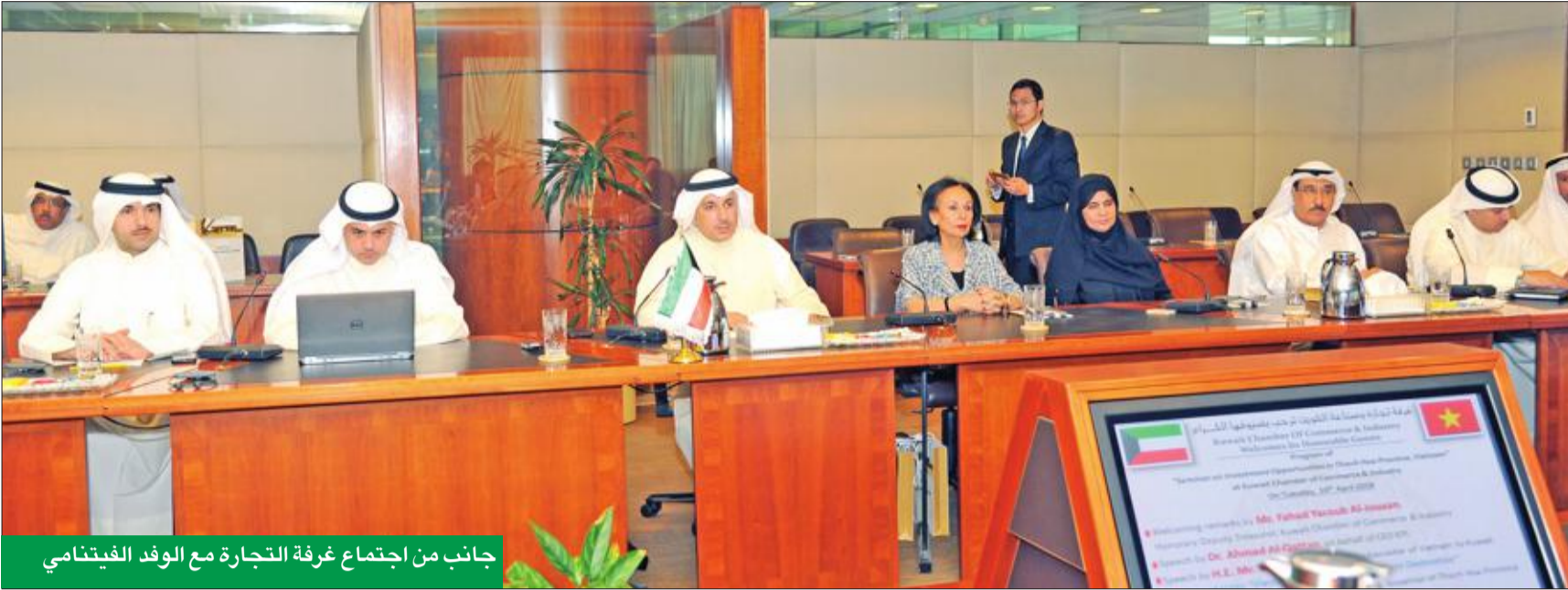
جانب من اجتماع غرفة التجارة مع الوفد الفيتنامي