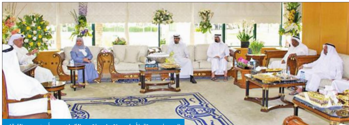
اليوسف مستقبلاً رئيس اتحاد منتجي الألبان وعداداً من مربي الأبقار

مربي الأبقار، وتعود بالنفع على المرين وتسهم في زيادة معدلات الإنتاج. وشدد على تقديم كل التسهيلات لتقليل الهدر من خلال التحصين الدوري وتوفير اللقاحات اللازمة لمنع انتشار الأمراض الداخلية، مشيراً إلى جهود الهيئة من خلال توفير الفنين والأطباء وتوفير التحصين الدوري للأبقار، إضافة إلى الفحص الدقيق للسماد لتفادي مشكلة تلوث الأسمدة. ووعد بتقديم الدعم المطبق للمرين بهدف زيادة الثروة الحيوانية وصولاً للاكتفاء الذاتي والأمن الغذائي، مبيناً أن الهيئة سوف تتولى توفير الظروف المناسبة للمرين وتشجيعهم لضمان الحصول على أفضل إنتاج وتخفيف العبء المادي وتوفير المواد الغذائية للحيوانات حتى يتم سد رفق لوقى الثريوي لدى الأجيال الجديدة، لحماية الكويت نتيجة للزيادة المطردة في عدد السكان.