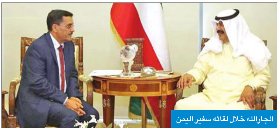
الجارالله خلال لقائه سفير اليمن

التقى نائب وزير الخارجية خالد الجارالله، أمس، سفير الجمهورية اليمنية لدى الكويت د. علي سفاع. وتضمن اللقاء بحث عدد من أوجه العلاقات الثنائية بين البلدين، إضافة إلى تطورات الأوضاع على الساحتين الإقليمية والدولية.