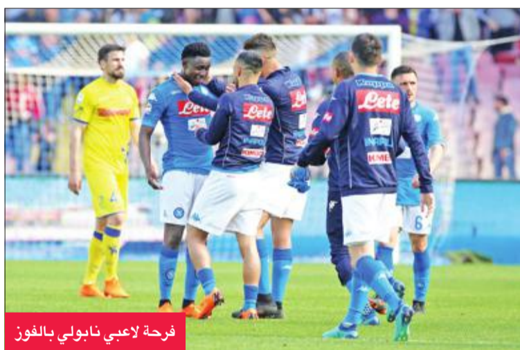
فرحة لاعبي نابولي بالفوز

لها مهاجمه البلجيكي دريس ميرتنز عندما كانت النتيجة 1-صفر للضيوف. وفي المباراة الثانية، جاءت الأهداف الثلاثة في الشوط الأول، فتقدم أودينيزي بواسطة كيفن لاسانيا (13)، ورد لاتسيو بهدفين عبر تشيرو إيموبيلي (26)، والإسباني لويس البرتو (37). وعزز إيموبيلي صدارته ترتيب الهدافين برصيد 27 هدفاً بفارق 3 أهداف عن مهاجم إنتر ميلان الأرجنتيني ماورو إيكاردي. وكان لاتسيو حقق نتيجة جيدة الخميس بفوزه على ضيفه سالزبورغ النمساوي 2-4 في ذهاب ربع نهائي الدوري الأوروبي «يوروبا ليغ». وانقذ الكرواتي نيكولا كالينيتش ميلان من الخسارة على أرضه أمام ساسوولو بإدراكه التعادل قبل أربع دقائق من النهاية. تقدم ساسوولو عبر ماتيو بوليتانو في الدقيقة 75، وعاد كالينيتش في الدقيقة 86 ورفع ميلان السادس رصيده إلى 52 نقطة. وفاز كرونوني على بولونيا بهدف للنيجيري سيمون نوانكو (25)، وفيرونا على كالباري بهدف لرومولو سوزا (36).