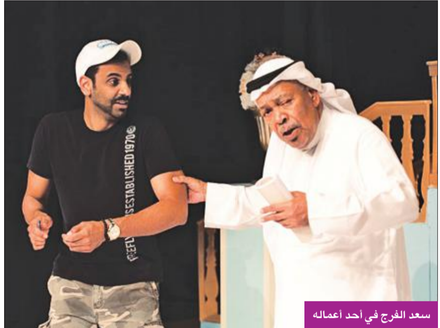
سعد الفرج في أحد أعماله