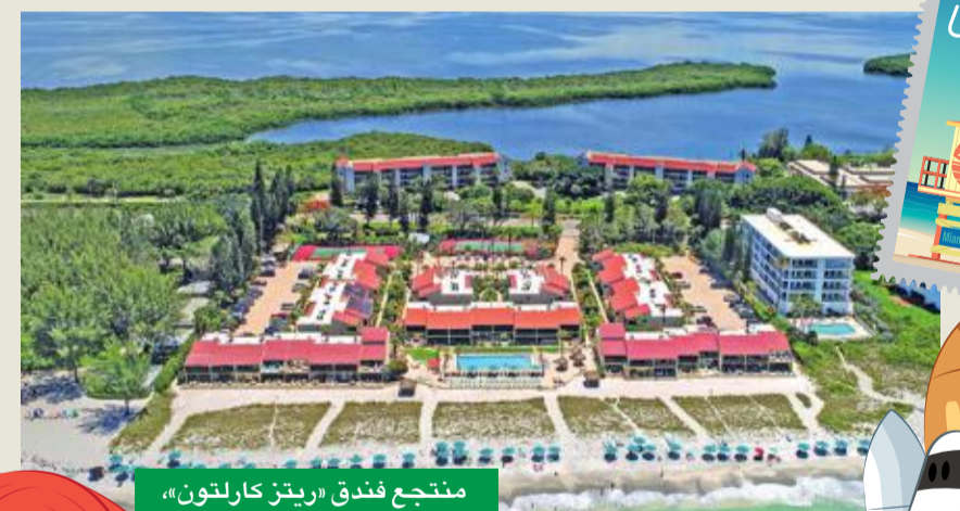
منتج فندق «ريتز كارلتون»

يجب أن تختار جلسة التدليك المعروفة في «ريتز كارلتون» كونها تلبّي حاجات كل عميل فردية.