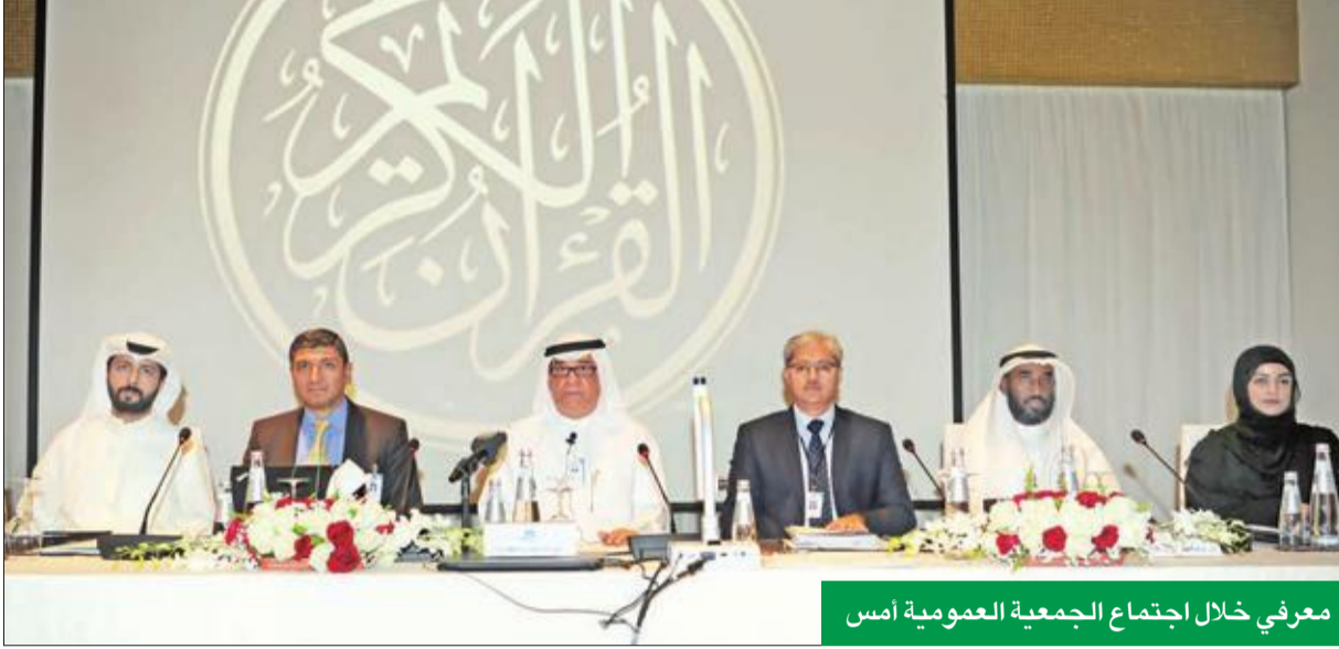
معرفي خلال اجتماع الجمعية العمومية أمس

حافل بالمزيد من الإنجازات والحلول المبتكرة، ووافقت الجمعية على كل البنود الواردة في جدول الأعمال وأبرزها المصادقة على تقرير مجلس الإدارة ومراقبي الحسابات، واعتماد البيانات المالية والحسابات الختامية للشركة، عن السنة المالية المنتهية في 31 ديسمبر 2017، كما وافقت على توصية مجلس الإدارة بتوزيع أرباح نقدية بواقع 5 في المئة.