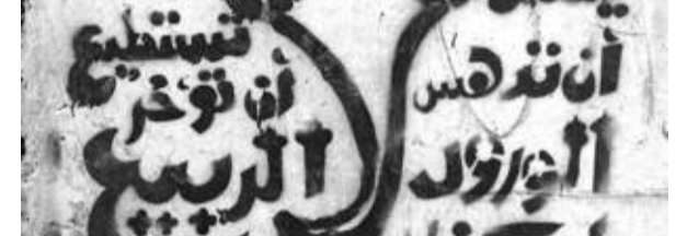
عبارات على الجدران ضمن مشروع الألف لا

بالابتكار والجمالية، ما دفعني إلى إطلاق مشروع «الألف لا»، الذي أكتب فيه حرف لا بالف طريقة تلخص التاريخ البصري لتخطيط الكلمة.