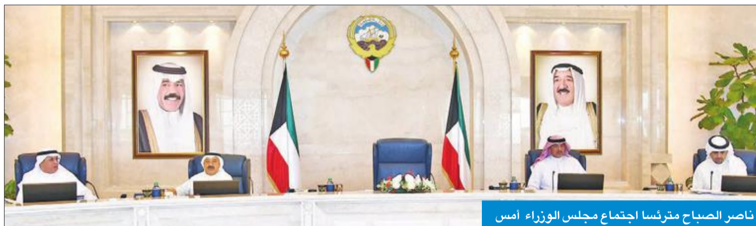
ناصر الصباح مترئسا اجتماع مجلس الوزراء أمس

اعتمد مرسوم العفو وتخفيض مدة العقوبة المقيدة للحرية المحكوم بها على بعض الأشخاص