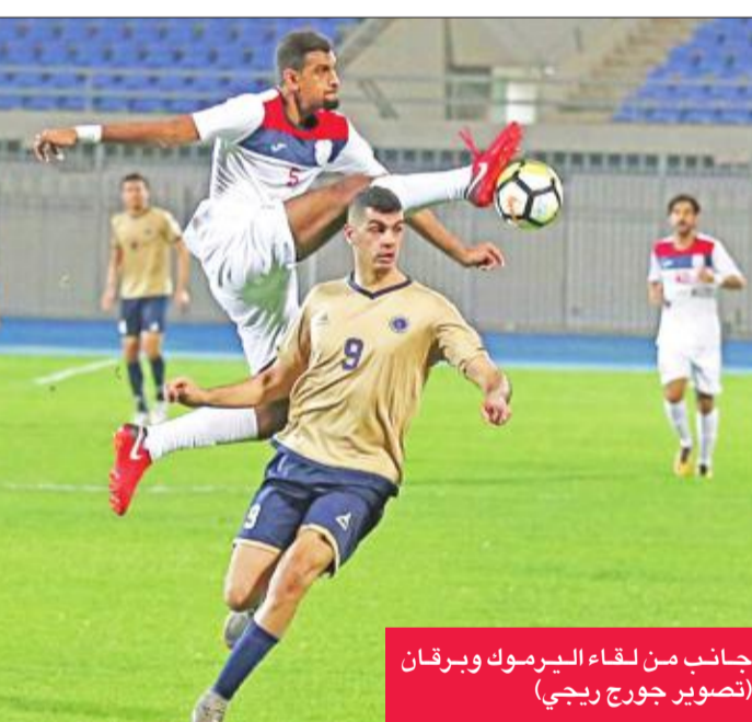
جانب من لقاء اليرموك وبرقان

وفي آخر المباريات تغلب الساحل على الصليبيخات بهدف نظيف سجله مدافع الأخير مبارك فهد بالخطأ في مرماه.