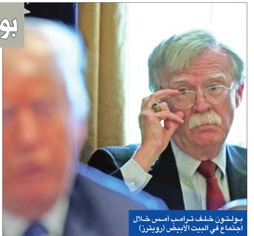
بولتون خلف ترامب أمس خلال اجتماع في البيت الأبيض (رويترز)

تسلم جون بولتون، أمس، مهامه الجديدة، مستشاراً للأمن القومي الأميركي، بعد أن عينه الرئيس دونالد ترامب في 22 مارس الماضي في هذا المنصب، خلفاً للجنرال أنتش. آر. ماکماستر. وكتب بولتون الذي يوصف بأنه من صقور المحافظين المؤيدين للتدخل الأميركي العسكري في الخارج على حسابه في «تويتر» أنه «مستعد للعمل مع الرئيس ترامب وفريقه للمحافظة على أمن وسلامة أميركا في هذه الأوقات الصعبة». وعشية تسلمه المنصب، أعلنت الناطقة باسم البيت الأبيض، سارة ساندروز، أن الناطق باسم