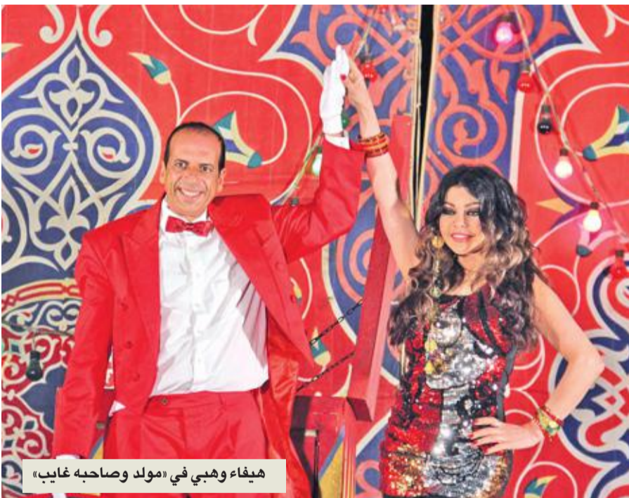
هيفاء وهبي في «مولد وصاحبه غايب»

إخلاق منتج العمل بالشروط المتفق عليها. السرداد لم يكف بالمسار القضائي، بل لجأ أيضاً إلى نقابة الممثلين وطالبها بصنورة وقف طلعت عن العمل أو التعاقد مع أي فنانين جدد خلال الفترة المقبلة، مؤكداً أنه تعرض لعملية نصب مكتملة الأركان من المنتج وشركته التي كان يامل بأن تقدم عمله الدرامي بشكل جيد.