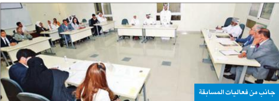
جانب من فعاليات المسابقة

وثيقة لمسابقة المحكمة الصورية العربية الخامسة حول القضية الافتراضية والمذكرة الخطية التي أعدتها الفرق المشاركة والمرافعات الشفهية خلال أيام المسابقة.