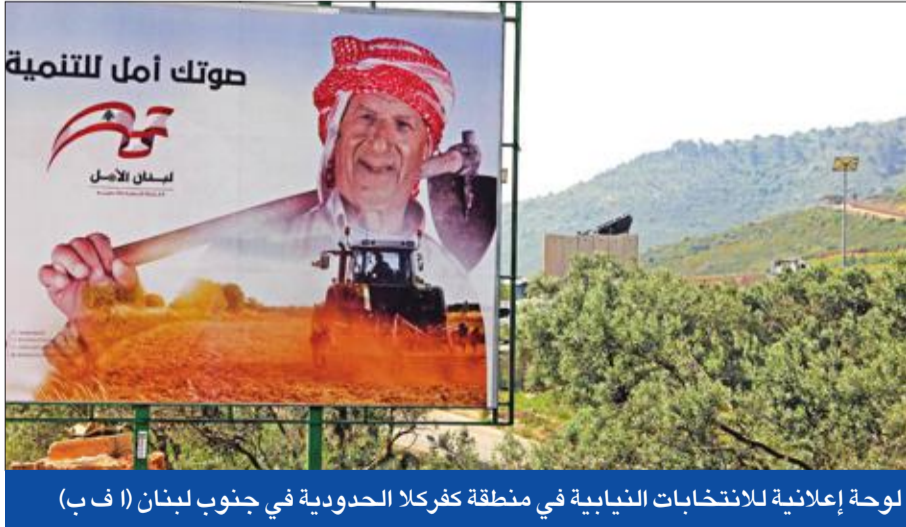
لوحة إعلانية للانتخابات النيابية في منطقة كفرلا الحدودية في جنوب لبنان

وأكدت مصادر سياسية متابعه لـ«الجريدة»، أمس، أن «اللقاء هو استكمال للقاء الحريري