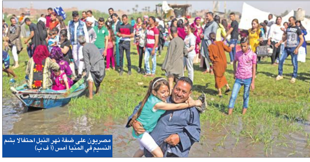
مصريون على ضفة نهر النيل احتفالاً بشم النسيم في المنيا أمس (أ ف ب)

● عد عكسي لعودة الروس ● انتخابات «عمالية» الشهر المقبل ● انتهاء «أعمال ماسبيرو» في أسبوعين