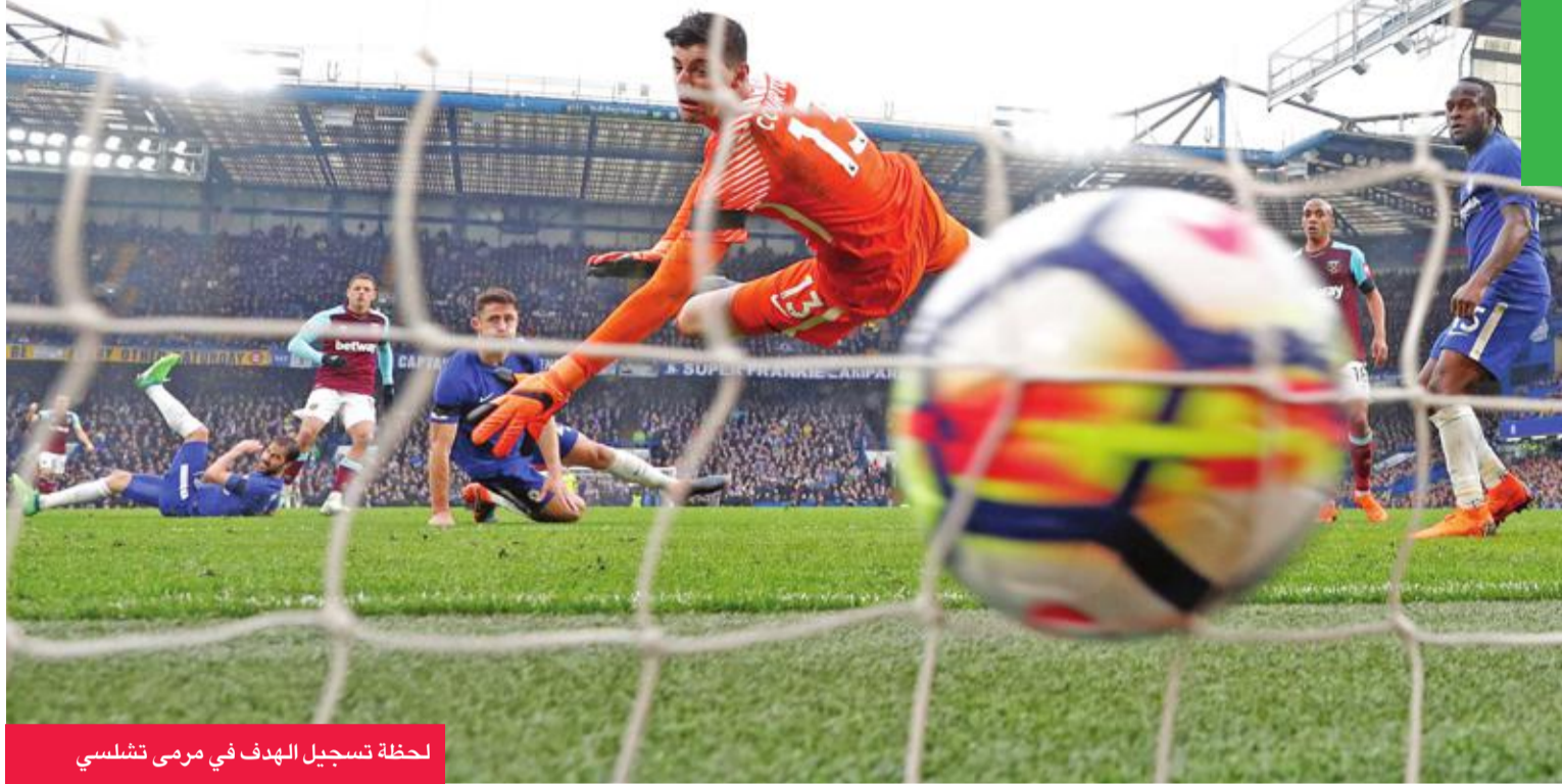
لحظة تسجيل الهدف في مرمرى تشلسي

وامه (78)، نجح في منح هدف الفوز لأرسنال، عندما تطاول لكرة عرضية من بين مدافعين واودعها برأسه داخل الشباك (81). وشهدت الدقائق الأخيرة طرد لاعبين هما جاك ستيفنس من ساوثمبتون قبل أن يلحق به المصري محمد النني من أرسنال بعدها مباشرة.