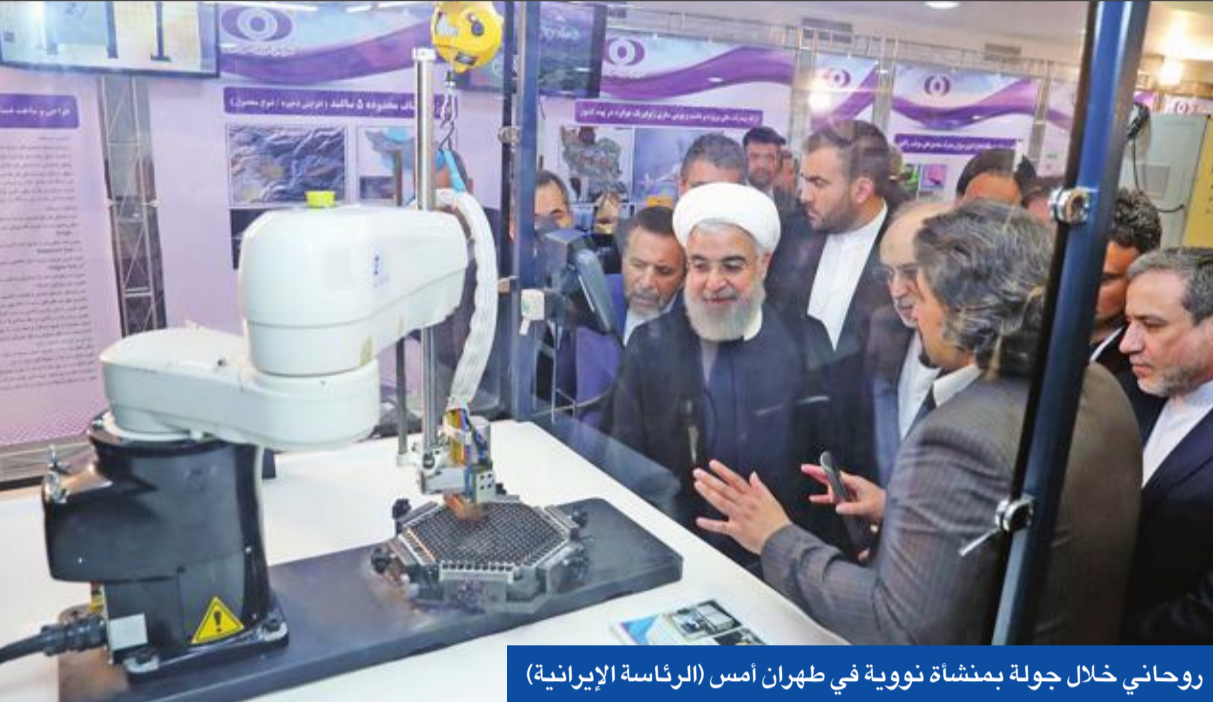
روحاني خلال جولة بمنشأة نووية في طهران أمس

وكانت مصادر في وزارة الدفاع الروسية نفت أن تكون الطائرات الإسرائيلية تمكنت من تجاوز الدفاع الجوي الروسي المنصوب في سورية، وحاولت تحوير تقرير «الجريدة» لإظهار عدم صحتة.