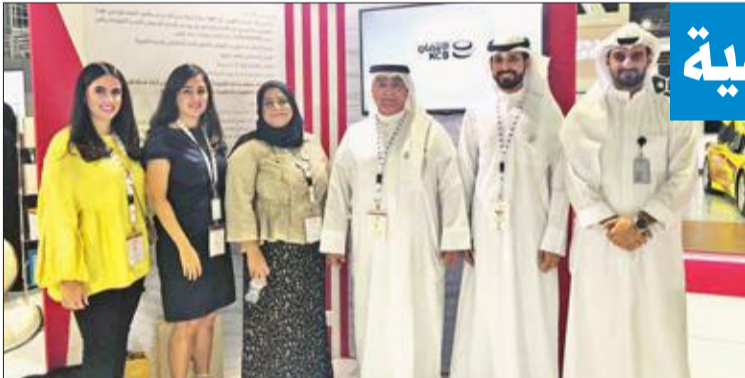
المضف متوسطاً كواثر البنك خلال مشاركتهم في معرض دبي الدولي

للتدريب والتطوير الإداري بمجمع الحمراء، الذي يعد أحد أهم المشاريع في مجال التنمية البشرية التي تضمنتها استراتيجية البنك وخطة الخمسية، ويقوم بدور مركزي في الارتقاء بقدرات العاملين وصقل مهاراتهم.