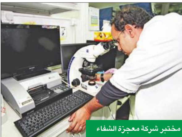
مختبر شركة معجزة الشفاء