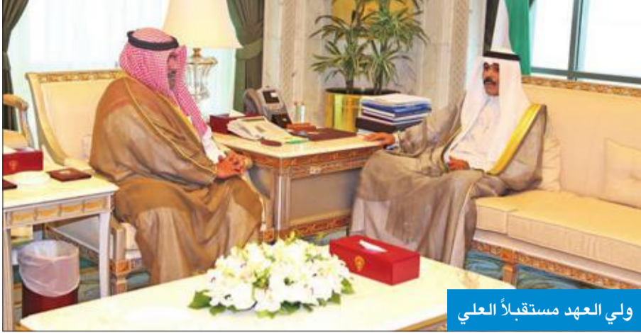
ولي العهد مستقبلاً العلي

استقبل سمو ولي العهد الشيخ نواف الأحمد، أمس، بقصر السيف، صباح أمس، رئيس جهاز الأمن الوطني الشيخ ثامر العلي، كما استقبل سموه يعقوب الصانع.