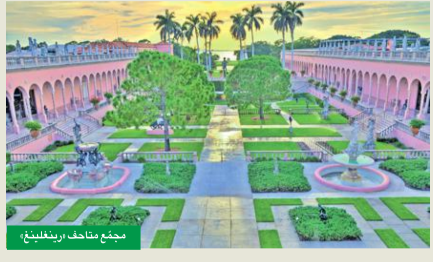
مجمع متاحف «رينغليغ»

يشكل متلاحق إلى ساراسوتا حيث أعيد ابتكاره بمظاهره المدهشة كافة.