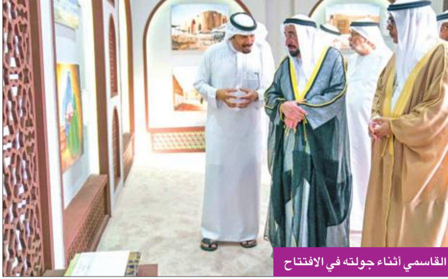
القاسمي أثناء جولته في الافتتاح

المسلم: تظاهرة ثقافية مهمة ومميزة زاخرة بالأنشطة والبرامج