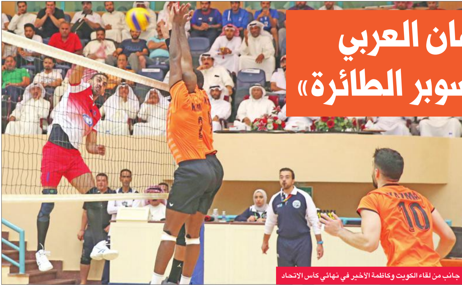
جانب من لقاء الكويت وكازمة الأخير في نهائي كأس الاتحاد