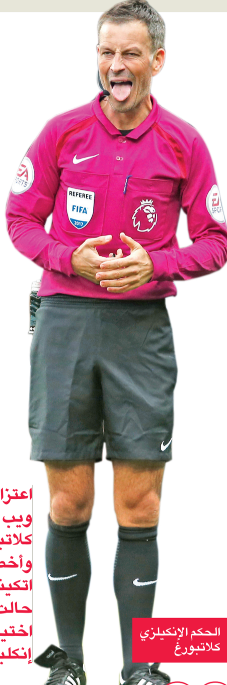
الحكم الإنكليزي كلاتبورغ

لم يحظ أي حكم إنكليزي بثقة الاتحاد الدولي لكرة القدم من أجل إدارة مباريات مونديال روسيا، الذي ينطلق يونيو المقبل، وأثار هذا الأمر حفيظة الإنكليز، الذين سعوا إلى اختيار ممثل لهم في القائمة دون جدوى.