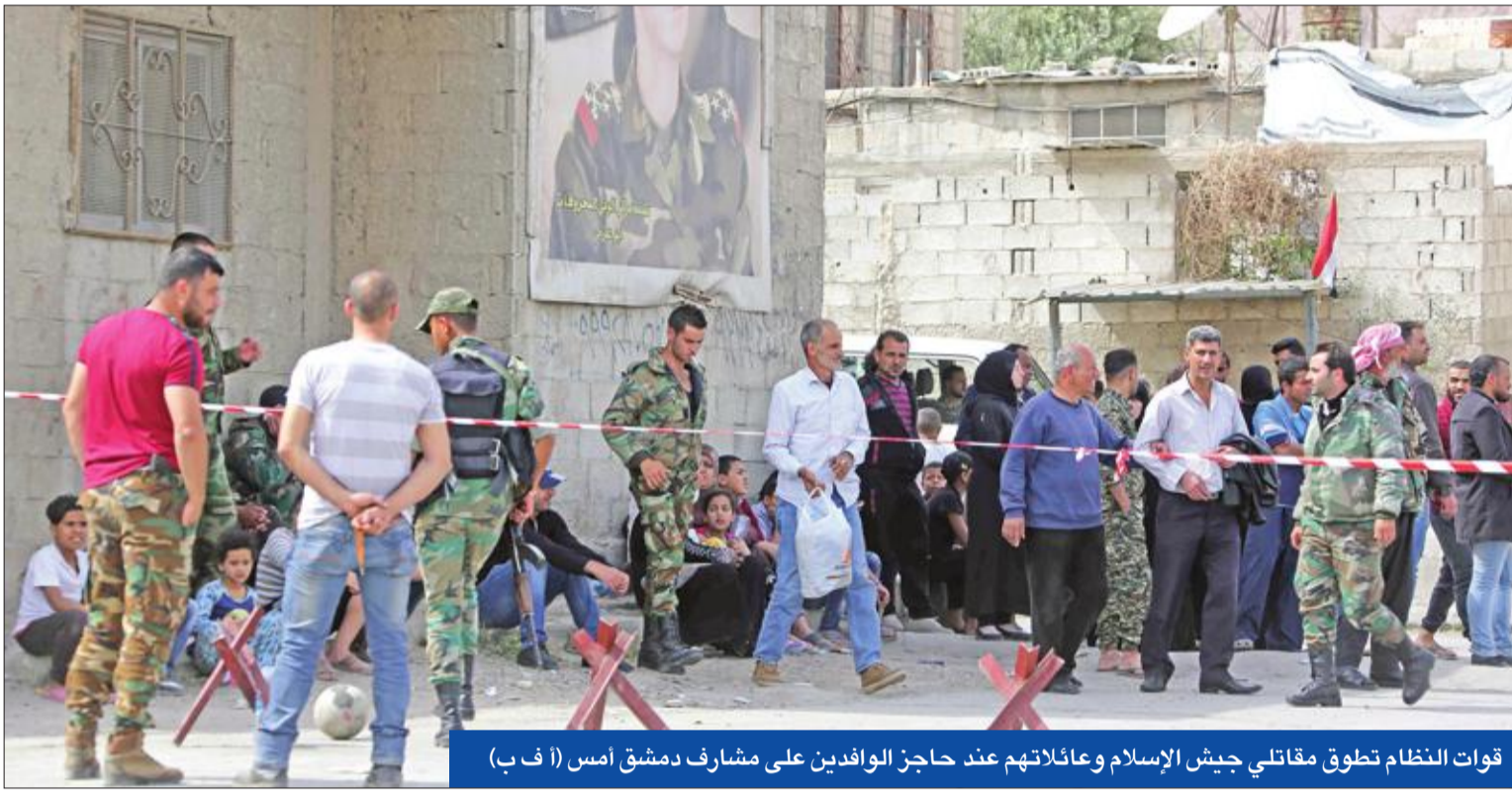
قوات النظام تطوق مقاتلي جيش الإسلام وعائلاتهم عند حاجز الوافدين على مشارف دمشق أمس (أ ف ب)

أعلنت رئيسة الوزراء البريطانية تيريزا ماي أنها تناقش مع الحلفاء التحرك اللازم بعد هجوم دوما، مؤكدة أنه يجب محاسبة داعمي حكومة الأسد. وقبل جلسة طارئة لمجلس الأمن، اتفق وزير الخارجية البريطاني بوريس جونسون، خلال مكالمة هاتفية مع نظيره الفرنسي جان إيف لوريان، على طرح خيارات كثيرة على الطاولة، داعياً إلى «رد دولي قوي وشديد على الهجوم المفترض».