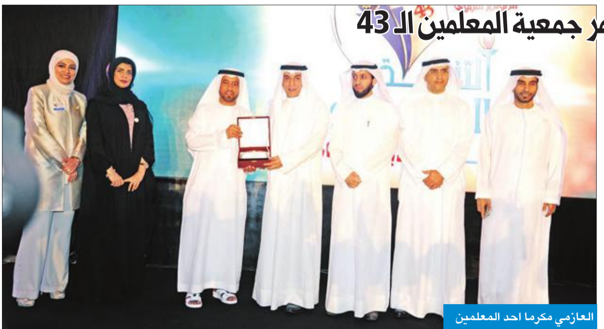
العازمي مكرماً أحد المعلمين

انطلق صباح أمس المؤتمر التربوي الـ 43 لجمعية المعلمين، تحت رعاية سمو ولي العهد وبحضور وزير التربية د. حامد العازمي.