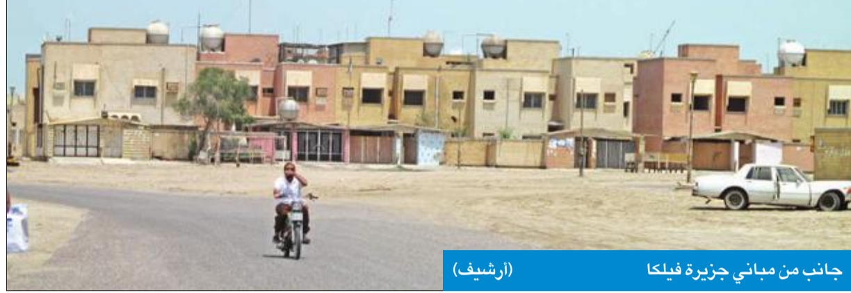
جانب من مباني جزيرة فيلكا