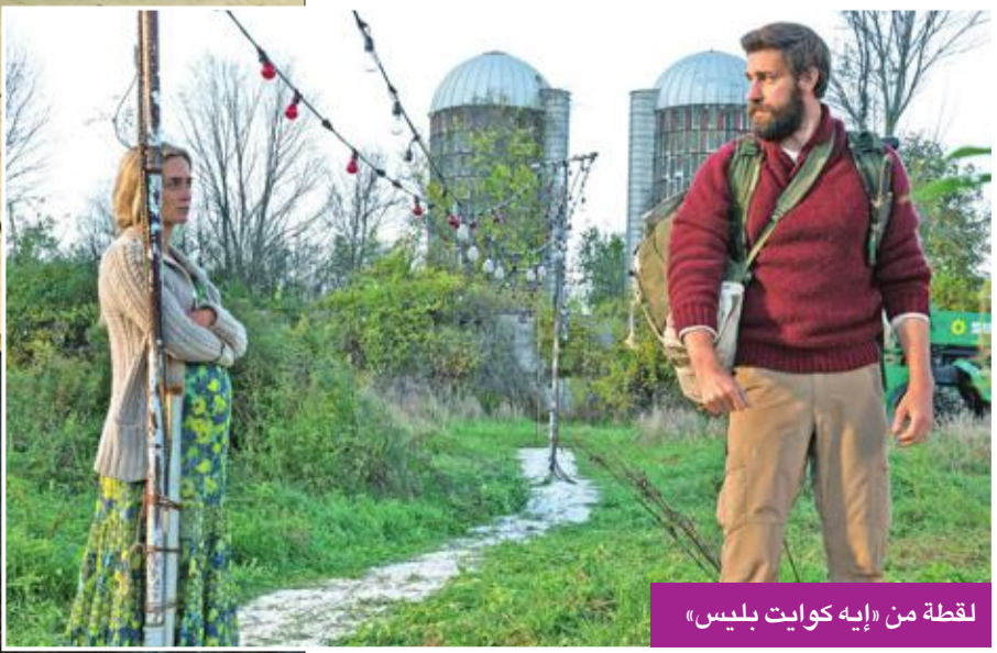
لقطة من «إيه كوايت بليس»

العلمي، وهو من إنتاج «وارنر براديرز»، قصة مراهق يجد نفسه داخل عالم افتراضي يزخر بالمغامرات والخطر سنة 2045. وحل في المرتبة الثالثة فيلم جديد آخر من إنتاج «يونيفرسال»، هو «بلوكرز»، محققاً 21.4 مليون دولار. وهو فيلم كوميدى من بطولة جون سينا وليسلي مان. وبعد عرضه ثمانية أسابيع على بدء عرضه استمر «بلاك بانثر» في تحقيق نتائج جيدة، مسجلاً 8.4 ملايين دولار في المركز الرابع، وبلغ مجموع إيراداته في الولايات المتحدة وكندا 665 مليون دولار، وهو فيلم الأبطال الخارقين الذي حقق أفضل العائدات حتى الآن في تاريخ الولايات المتحدة. وفي المركز الخامس، حلّ فيلم «أي كان أونلي إيمان» الذي يروي مغامرات فرقة روك مسيحية، محققاً 8.4 ملايين دولار. وبلغت إيرادات الفيلم حتى الآن في أمريكا الشمالية 69 مليون دولار، في حين كلف سبعة ملايين فقط. وتراجع «تايلر بيريز إكريموني» من المركز الثاني الأسبوع الماضي إلى المركز السادس هذا الأسبوع، محققاً 8.1 ملايين دولار، وهو يتمحور حول