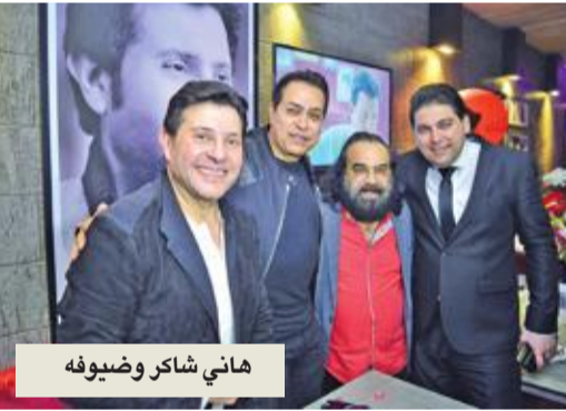
هاني شاكر وضيوفه

حرص نجوم الفن على مشاركة هاني شاكر فرحته بافتتاح مشروعه الجديد «كافيه علي الضحكاية» بمنطقة المهندسين بوسط القاهرة، والذي يدخل به إلى عالم بيزنس النجوم، وكان من بين الفنانين في الاحتفال كل من المطرب الشعبي حكيم، وأبو الليف، وعدد من الأصدقاء، وأعضاء نقابة الموسيقيين، وشخصيات عامة منهم المستشار مرتضى منصور، رئيس نادي الزمالك.