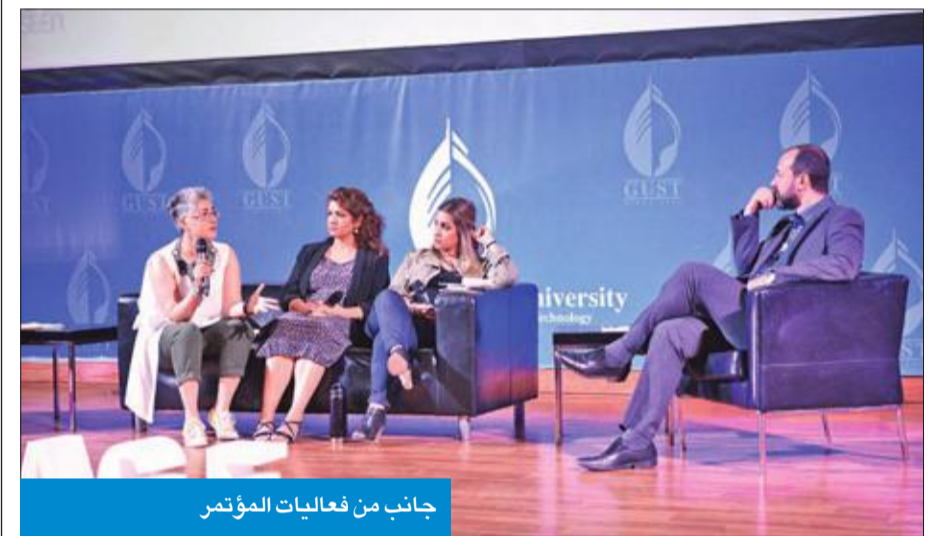
جانب من فعاليات المؤتمر

والأنشطة وورش العمل لرواد كويتيين وعرب في هذه الصناعة على مدار أيامه».