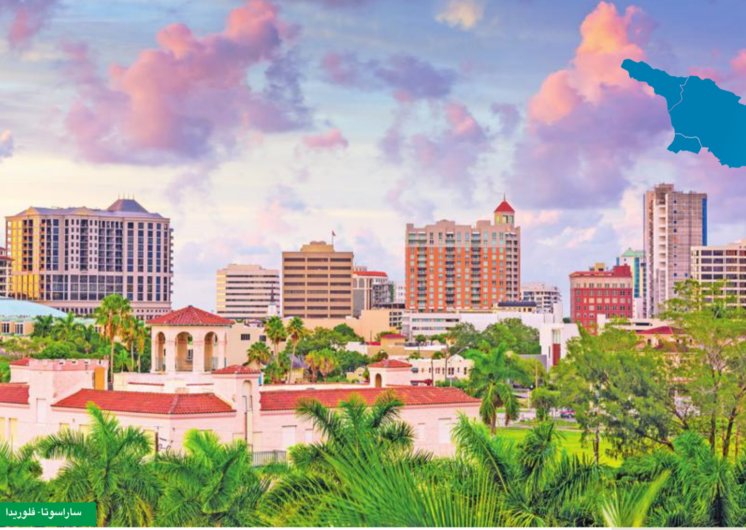
ساراسوتا - فلوريدا