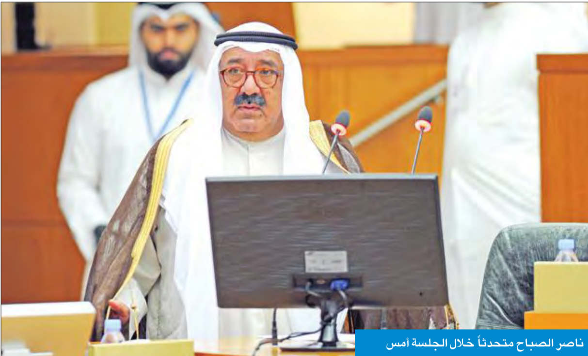
ناصر الصباح متحدثاً خلال الجلسة أمس

تطوير الجزر ينوع القاعدة الاقتصادية ويخلق 200 ألف فرصة عمل وعوائد استثمارية مختلفة