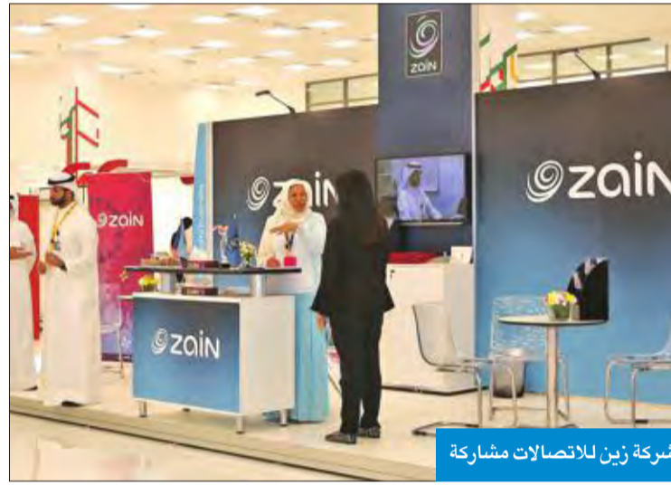
شركة زين للاتصالات مشاركة