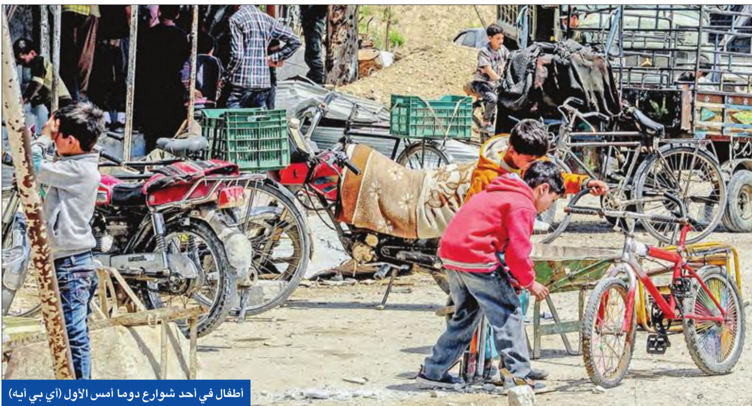
اطفال في أحد شوارع دوما أمس الأول (أي بي آيه)

اعتبرت بخينة شعبان المستشارة الإعلامية للرئيس السوري بشار الأسد أن دعوة الرئيس الأمريكي دونالد ترامب لاستبدال قواته في سورية ليحل محلها تحالف عربي «سابقة في العلاقات الدولية». وقالت شعبان لموقع «روسيا اليوم»، «سيكون أمراً غريباً جداً أن تقوم دولة احتلال غير شرعية بتوجيه دعوات لأطراف أخرى كي تأتي وتحتل البلد أيضاً». بأني هذا بعدما أفادت صحيفة «وول ستريت» بأن الولايات المتحدة تطلب دعماً عسكرياً من دول عربية لإحلال الاستقرار في سورية، وأن من المفترض أن ترسل السعودية وقطر والإمارات ومصر قوات إلى شمال شرقي سورية لتحل محل القوات الأميركية عقب تحقيق انتصار على تنظيم «داعش». وقال وزير الخارجية السعودي عادل الجبير أمس الأول: «لقد عرضنا إرسال قوات من التحالف الإسلامي ضد الإرهاب إلى سورية»، وكشف: «هناك نقاشات مع الولايات المتحدة منذ بداية هذه السنة، وفيما يتعلق بإرسال القوات لسورية قديماً مقترحاً، أنه إذا كانت الولايات المتحدة ستُرسل قوات فإن المملكة ستفكر كذلك مع بعض الدول الأخرى في إرسال قوات كجزء من هذا التحالف والفكرة ليست فكرة جديدة لدينا، كذلك لدينا مقترحات لأعضاء من دول التحالف الإسلامي لمكافحة الإرهاب».