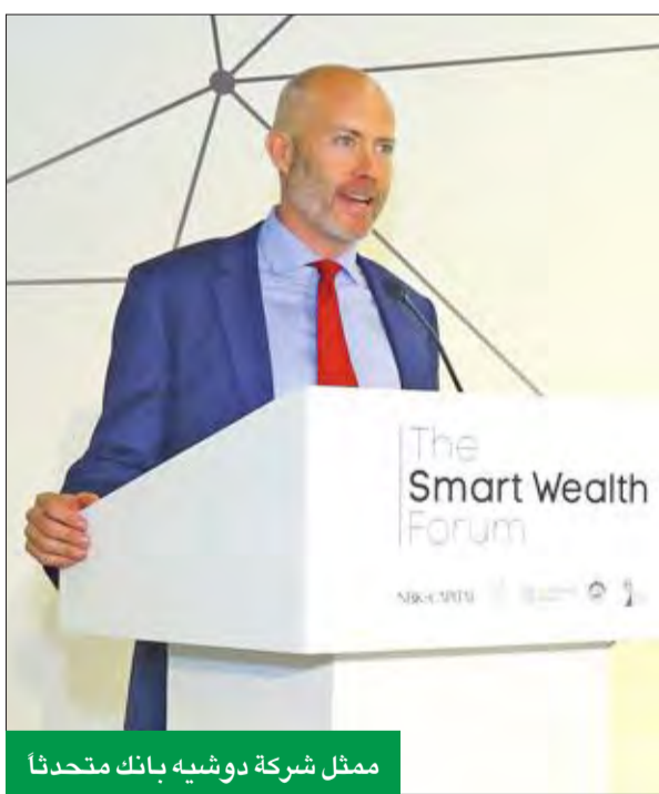
ممثل شركة دوشيه بانك متحدثاً

من جانب آخر، قال الصانع إن التحديات التي يواجهها الاقتصاد الكويتي حالياً تتطلب من أصحاب الدخل المتوسط مراجعة أساليب استثماراتهم وطرق ادخارهم للأموال، وذلك من خلال عدة أمور منها التعرف على احتياجاتهم الرئيسية في الحياة والتثقيف