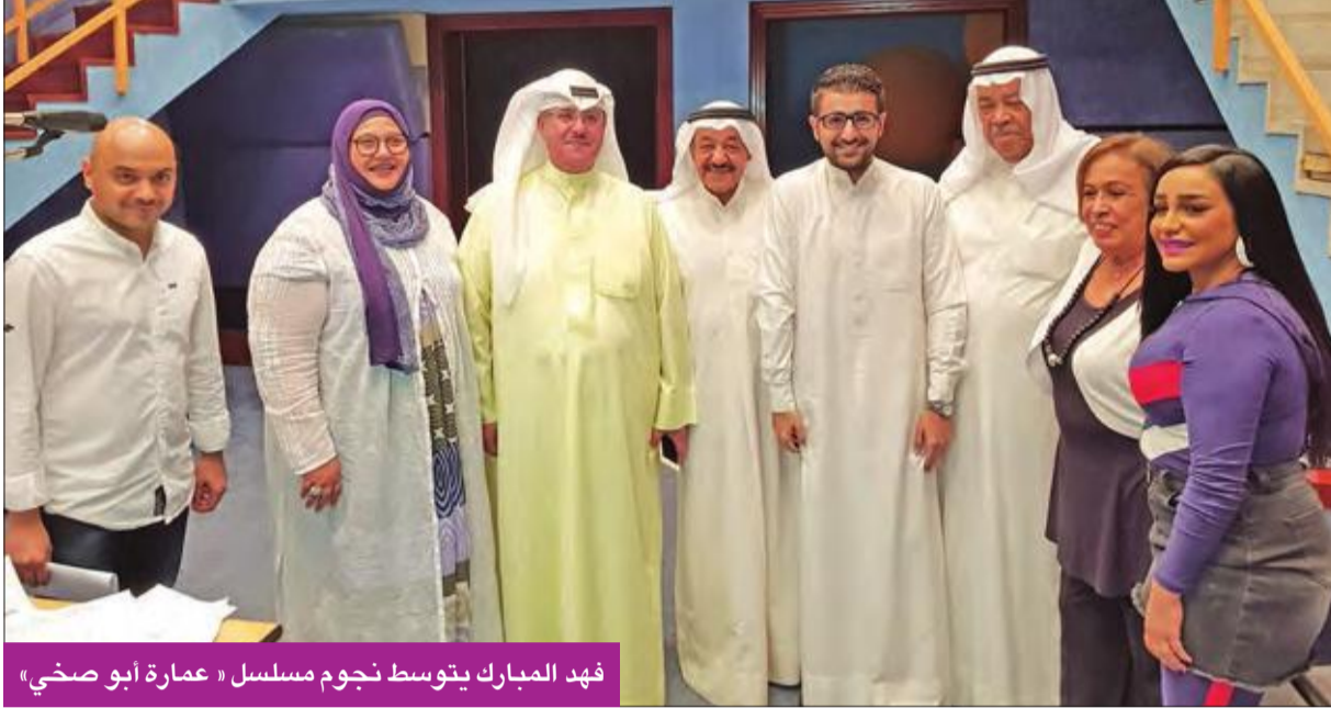
فهد المبارك يتوسط نجوم مسلسل «عمارة أبو صخي»

يلتقي الفنان سعد الفرج والفنانة حياة الفهد في الدراما الإذاعية «عمارة أبوصخي»، التي ستبث عبر الأثير خلال شهر رمضان المقبل.