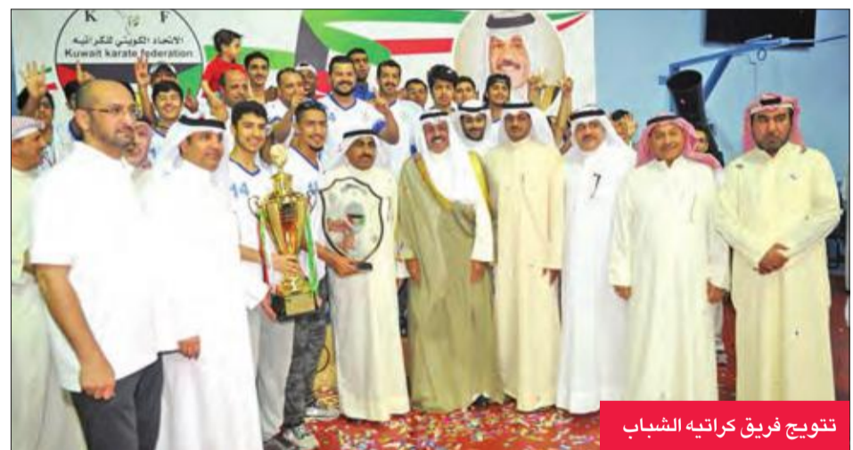
نتيجة فريق كراتيه الشباب

توج فريق كراتيه بنادي الشباب بلقب بطولة سمو ولي العهد الشيخ نواف الأحمد الـ 25 الشاملة للكراتيه، والتي أقيمت أمس الأول على صالة اتحاد الكراتيه، وحل في المركز الثاني نادي البرموك، وجاء السالمية ثالثاً.