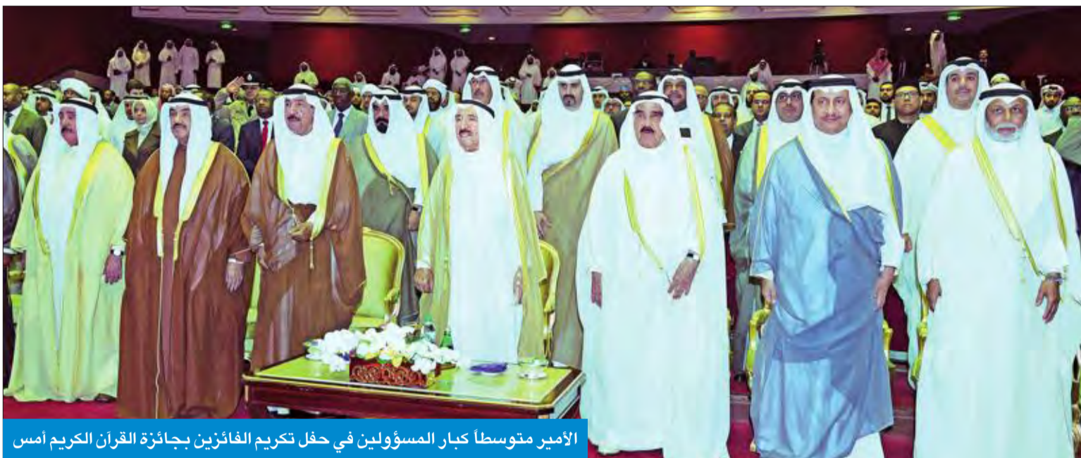
الأمير منوسطا كبار المسؤولين في حفل تكريم الفائزين بجائزة القرآن الكريم أمس

شنت أقطار العالم الإسلامي، كما تم وضع منهج للتحكيم يتميز بالدقة والعدالة والموضوعية حتى تخرج هذه الجائزة بالصورة اللائقة بالقرآن العظيم. ثم تم عرض فيلم بعنوان "الدورة التاسعة"، بعدئذ تفضل صاحب السمو بتكريم لجان التحكيم وتقديم الجوائز للفائزين والجهات الفائزة بمسابقة الكويت الدولية لحفظ القرآن الكريم وقراءته وتجويد بالقرآن العظيم.