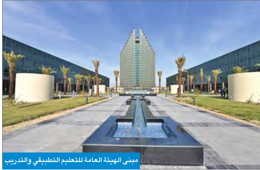
مبنى الهيئة العامة للتعليم التطبيقي والتدريب

أعداداً كبيرة ستقدم للهيئة لتضمن مقاعد، ولا ترغب في الالتحاق حالياً بالخدمة الوطنية العسكرية (التجنيد). وبيّنت أن أزمة القبول التي مرت بها «التطبيقي» في الأعوام