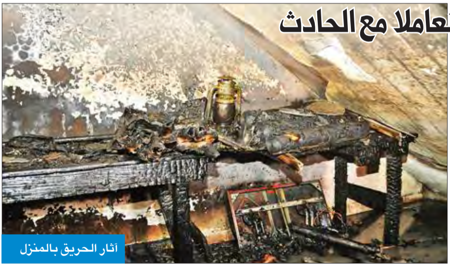
آثار الحريق بالمنزل

واستهل الحفل بتلاوة عطرة من آيات الذكر الحكيم، بعدها ألقى أمير قاعدة أحمد الجابر الجوية، العميد الركن طيار سيف الحسيني، كلمة رحب فيها براعي الحفل والحضور، وبين من خلاله المراحل التدريبية التي مر من خلالها الخريجون، ليتأهلوا بعدها للعمل في وحداتهم بالقوة الجوية، حيث شملت تلك المراحل دروساً عسكرية نظرية وعملية أساسية. وبعد ذلك بدأت مراسم