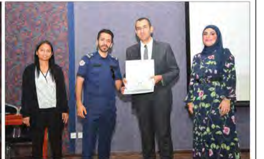
توزيع الشهادات للمشاركين

السوق تبلغ نحو 1.2 مليار دولار، تتعاون «جنرال موتورز» على الدوام مع السلطات المختصة في منطقة الشرق الأوسط لمحاربة إنتاج وبيع القطع غير الأصلية. وفي عام 2017، تم اكتشاف نحو 158,400 قطعة آيه سي دكو مقلدة في الإمارات، عبر عملية مشتركة جمعت دائرة التنمية الاقتصادية في عجمان وشركة عجمان.