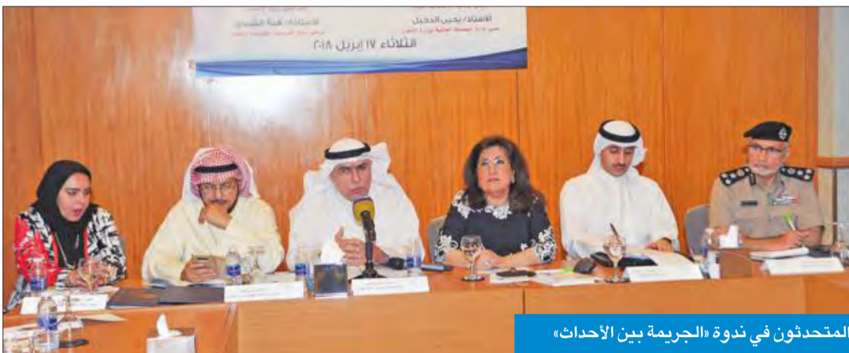
المتمحدثون في ندوة «الجريمة بين الأحداث»

الكندري: جرائم القتل تنفسي بين الفقراء و«المخدرات» بين أبناء الأغنياء