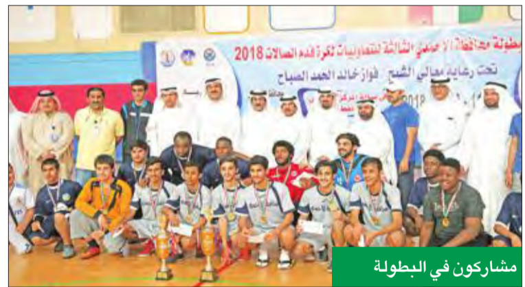
مشاركون في البطولة

رعى البنك التجاري الكويتي بطولة محافظة الأحمدي الثالثة للتعاونيات لكرة قدم الصالات، والتي استمرت منافساتها على مدى ثلاثة أيام، في المركز الرياضي التابع لشركة نفط الكويت. وجاءت رعاية البنك لهذه البطولة في إطار الجهود المتواصلة في خدمة المجتمع، والمشاركة في كل الفعاليات والششاطات الاجتماعية المختلفة، التي تقوم بتنظيمها محافظات الكويت ومؤسسات المجتمع المدني، في إطار جهود لترسيخ مفهوم المسؤولية الاجتماعية الشاملة.