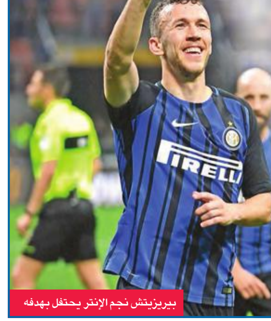
بيرزينيتش نجم إنتر يحتفل بهدفه

صب إنتر ميلان جام غضبه على ضيفه كالياري، عندما أكرم وفادته برعاية نظيفة الثلاثاء في ميلانو، في افتتاح المرحلة الثالثة والثلاثين من الدوري الإيطالي لكرة القدم. وهو الفوز السابع عشر لإنتر ميلان هذا الموسم والأول في مبارياته الأربع الأخيرة، بعد تعادلين وخسارة واحدة، فرغ رصيده إلى 63 نقطة. أما كالياري فمني بخسارته التاسعة عشرة هذا الموسم، وتجمد رصيده عند 32 نقطة في المركز الرابع عشر. وكبر إنتر ميلان بالتسجيل عبر المدافع البرتغالي جواو كانسيلو وتحديدًا في الدقيقة الثالثة، وفرض سيطرته على مجريات المباراة وسنحت لمهاجميه العديد من الفرص للتعزير دون جدوى. وانتظر إنتر ميلان حتى الشوط الثاني لترجمة أفضليته، فأضاف قائده الدولي الأرجنتيني ماورو إيكاردي الثالث في الدقيقة 49، رافعا رصيده إلى 25 هدفاً في المركز الثاني على لائحة الهادفين بفارق هدفين عن مهاجم لاتسيو تشيرو ايموبيلي المتصدر.