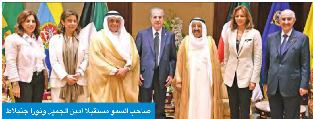
صاحب السمو مستقبلا أمين جميل ونورا جنبلاط

تعاذيه وصادق مواساته له ولأسرته الكريمة بوفاة حرمه باربارا بوش. وأشاد سموه بما تمتعت به من محبة وتقدير على لدى أبناء الشعب الأمريكي، راجيا سموه لها الرحمة، وله وأسرته الكريمة وللشعب الأمريكي الصديق جميل الصبر وحسن العزاء. كما بعث سموه ببرقية تعزية الرئيس رئيس الولايات المتحدة الأميركية الأسبق جورج دبليو بوش الابن، أعرب فيها سموه عن خالص تعازيه وصادق مواساته بوفاة والدته باربارا بوش، راجيا سموه لها الرحمة وله وأسرته الكريمة جميل الصبر وحسن العزاء. وبعث سمو ولي العهد الشيخ نواف الأحمد، ورئيس مجلس الوزراء سمو الشيخ جابر المبارك ببرقيتي تعزية مماثلتين.