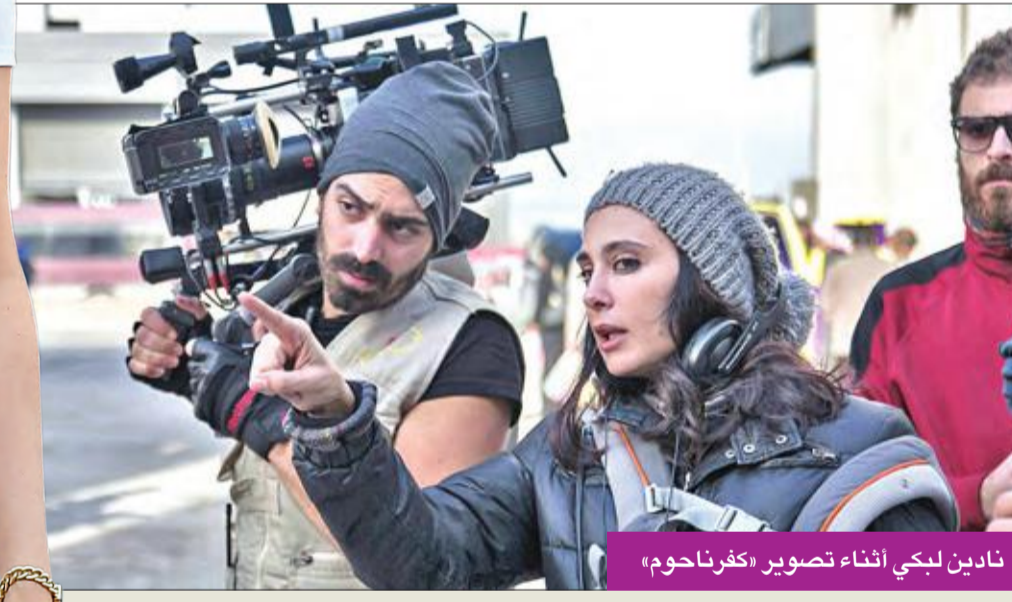
نادين لبكي أثناء تصوير «كفرناحوم»

يشارك فيلمان عربيان ضمن المسابقة الرسمية لمهرجان كان السينمائي الدولي في دورته الـ 71، للمنافسة على جائزة السعفة الذهبية التي تمنحها لجنة التحكيم لأفضل فيلم روائي طويل. الأول للمخرجة اللبنانية نادين لبكي، بعنوان «كفرناحوم». ويحكى قصة طفل صغير يعيش في بيئة فقيرة، ويقرر التمرد على واقعه عبر رفع دعوى ضد والديه اللذين أنجبا إلى هذا العالم، والثاني «يوم الدين» للمخرج المصري أبو بكر شوقي، قصة رجل قطبي من جامعي القمامة، نشأ داخل مستعمرة للمصابين بالجذام، إلا أنه يعادها، محاولاً الوصول إلى عائلته.