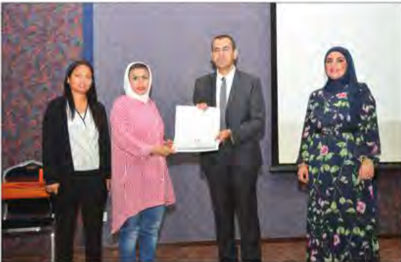
جزء من توزيع الشهادات للمشاركين