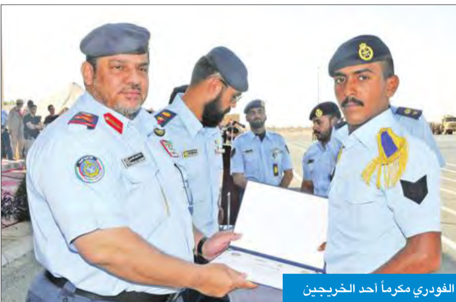
الفودري مكرماً أحد الخريجين

بعدها أدى الخريجون القسم القانوني. وفي الختام، وزع راعي