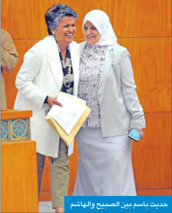
حديث باسم بين الصباح والهاشم

دعوات إلى إعادة النظر في طريقة اختيار القياديين بعيداً عن المحاصصة والترصيات