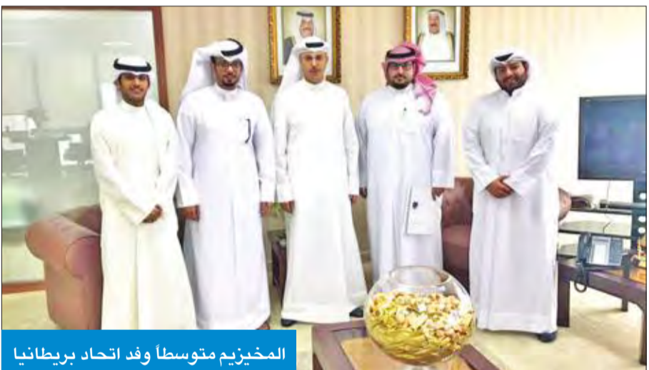
المخيزيم متوسطاً وفد اتحاد بريطانيا

أهمها مشكلة قائمة الجامعة، مؤكداً أن مشكلة تغير القائمة خلال الفترة الماضية باتت تؤرق الكثير من الطلبة، وتجعلهم مشتتين بين اعتماد بعض الجامعات ورفضها.