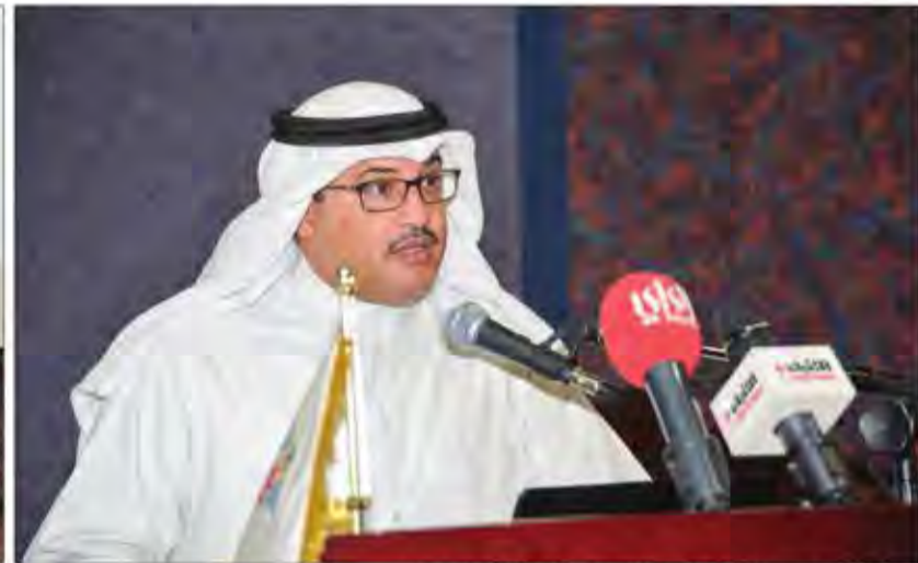
جمال الجلاوي مدير إدارة العامة للجمارك يلقي الكلمة الختامية