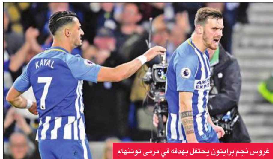
غروس نجم برايتون يحتفل بهدفه في مرمرى توتنهام

إلا أن فريق المدرب الأرجنتيني ماوريتسيو بوكيتينو فشل في تحطيم