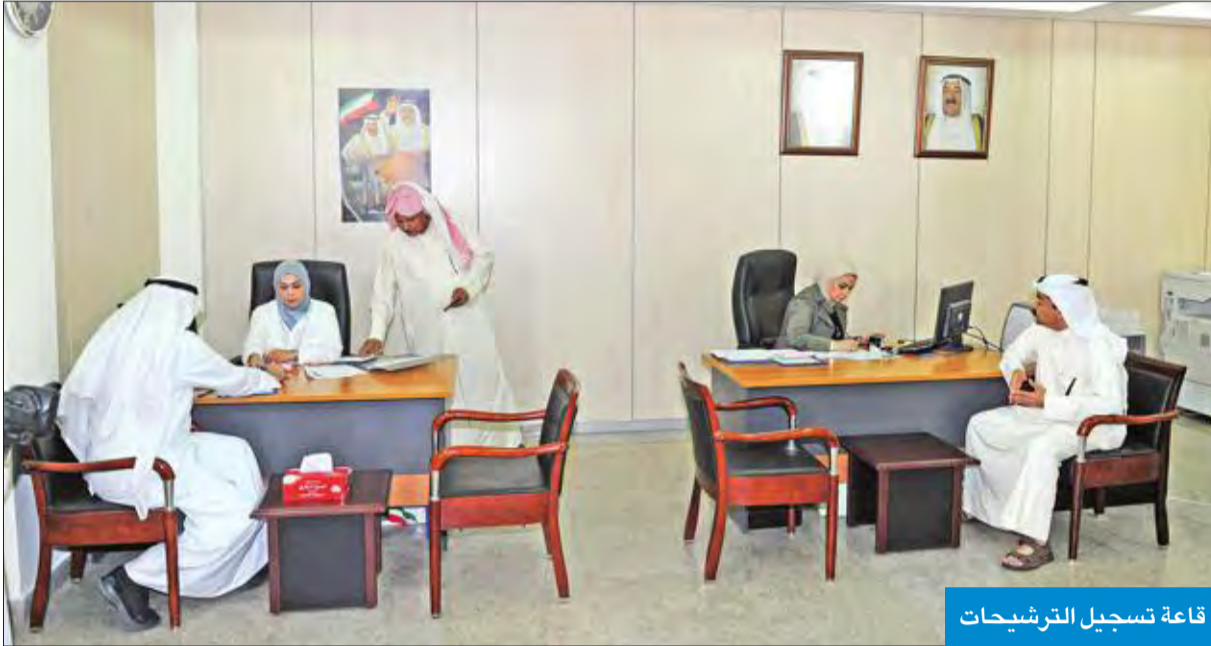
قاعة تسجيل الترشيحات

ودعا البلوشي المجلس القادم إلى تشكيل لجنة من الفنيين من أعضائه لحصر ودراسة كل المشروعات الكبرى المقدمة للبلدية للفصل بها واتخاذ القرارات المناسبة بشأنها، على أن تتضمن تلك المشاريع في حال إقرارها جهازاً متخصصاً في البلدية لمتابعة تنفيذها، وأن