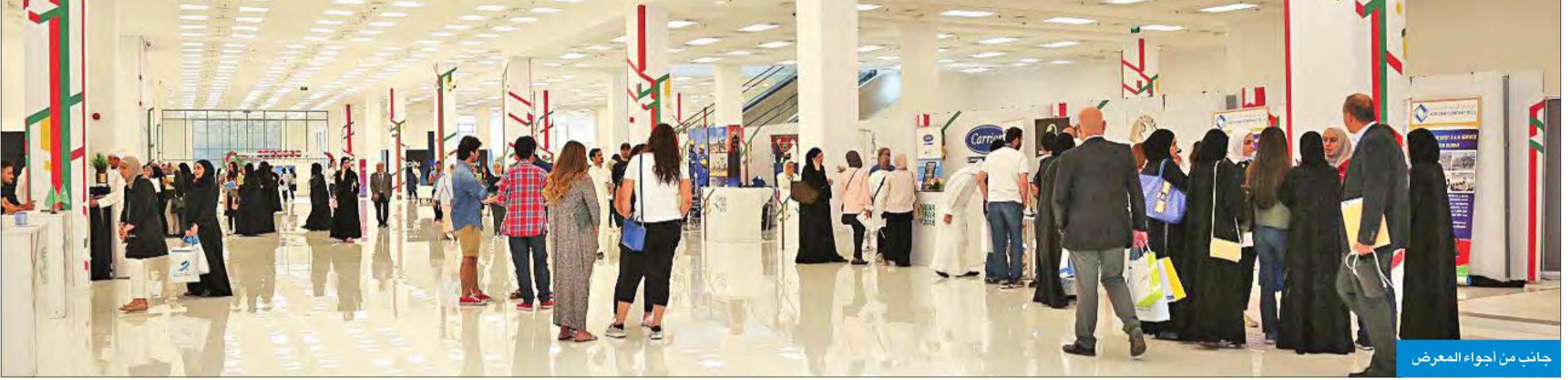
جانب من أجواء المعرض

ممثلو الشركات أجمعوا على تميز خريجي الجامعة خلال فترة تدريبهم