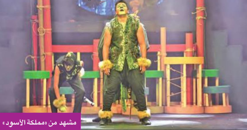
مشهد من «مملكة الأسود»

عرضت ضمن مسابقة المهرجان العربي لمسرح الطفل