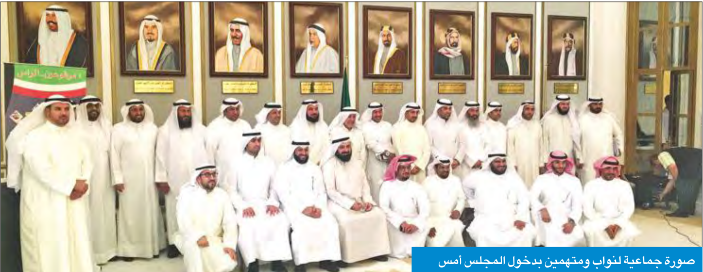
صورة جماعية لنواب ومتهيمين بدخول المجلس أمس

الشاهين: الجميع شهد بنظافة أيدي المتهمين • الحجرف: القضية سياسية بالدرجة الأولى