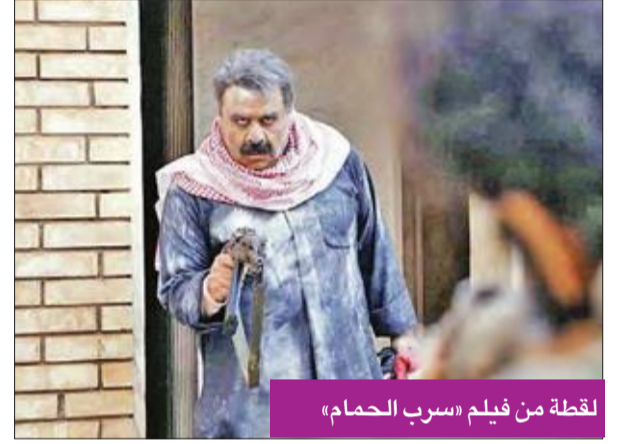
لقطة من فيلم «سرب الحمام»