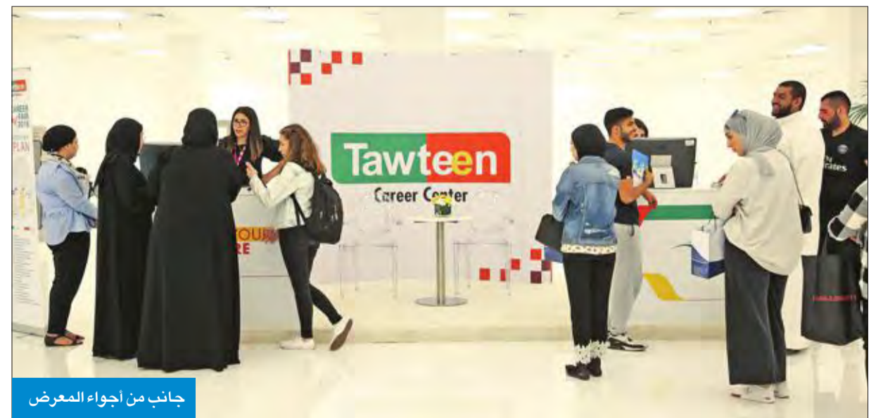
جانب من أجواء المعرض