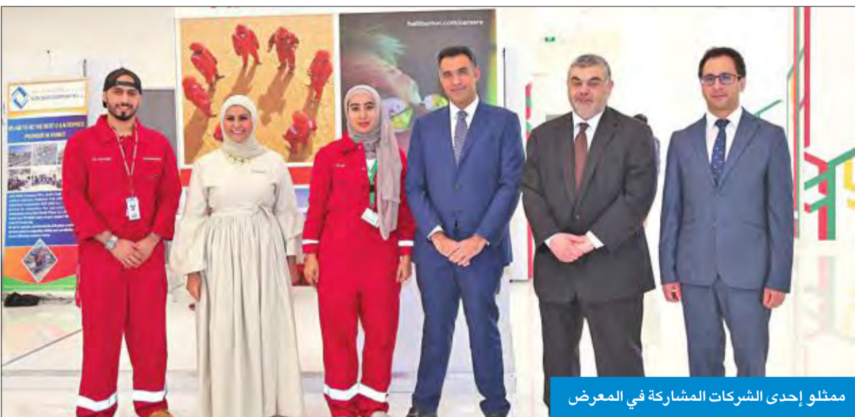
ممثلو إحدى الشركات المشاركة في المعرض

جهود واضحة من الجامعة لبناء علاقات مستدامة في سوق العمل