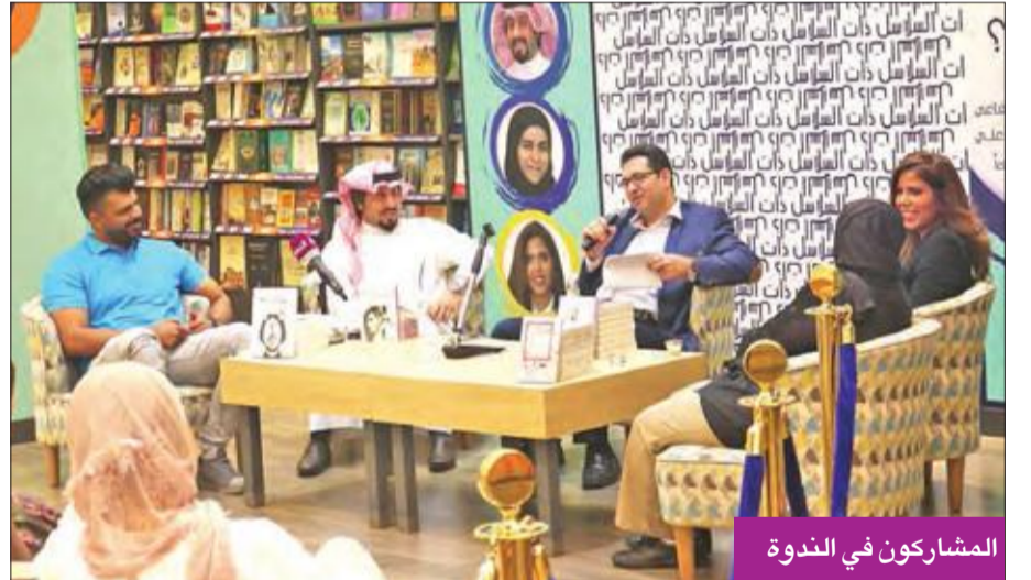
المشاركون في الندوة

وماركيز الذي يجمع علب البلاستيك ليستطيع العيش والكتابة. وأكد أن "الكتابة فعل وشغف، والقراءة أمر رباتي، والكلمة أمانة"، وحكى رحلته من نظم الشعر ونفسه المسكونة بالكلمات والشاعر صالح الغازي. المساحة، ليناقش ما يدور في المجتمع والواقع، فالواقع أفضل حين نقرأ الرواية. وعن أحدث أعماله، ذكر أن هناك مسلسلا إذاعيا يعرض في رمضان المقبل.