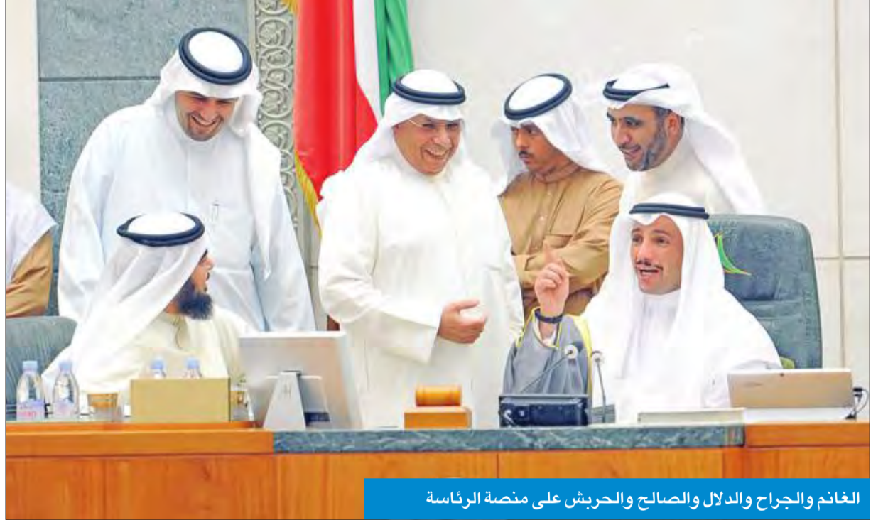
الغانم والجراح والدلال والصالح والحريش على منصة الرئاسة

بسبب العراقيل الكبيرة، فكيف نناقش ببرنامج الحكومة؟ وانتقد الفصالة قانون التخصص، مشيراً إلى أن الصراعات على هذه اللقمة هي التي تحرك هذا القانون، لافتاً إلى تطوير المطار الكويت، وهذه القضية كبرى، ولعل أكبر مشكلة أن المسؤولين لا يعاونون نظراً لأنهم يسافرون من قاعة التشريعات، مطالباً ناصر الصباح بإغلاق هذه القاعة ليشعر المسؤولون بمعاناة المواطنين.