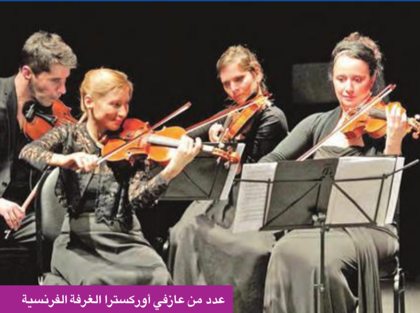
عدد من عازفي أوركسترا الغرفة الفرنسية

وحدائقها وتاريخها في سماء الموسيقى الراحلة. ويتناغم تام بين عازفي الأوركسترا عرفت الاتهام أجمل مقطوعات كبار الموسيقيين، فكانت البداية مع مقطوعة للموسيقار النمساوي موزارت، تلتها مقطوعة خاصة بعنوان «الشعبان الراقص»، ومقطوعة للموسيقار البلجيكي غليوم لوكه، وخاتما بمقطوعة للروسي تشايكوفسكي.