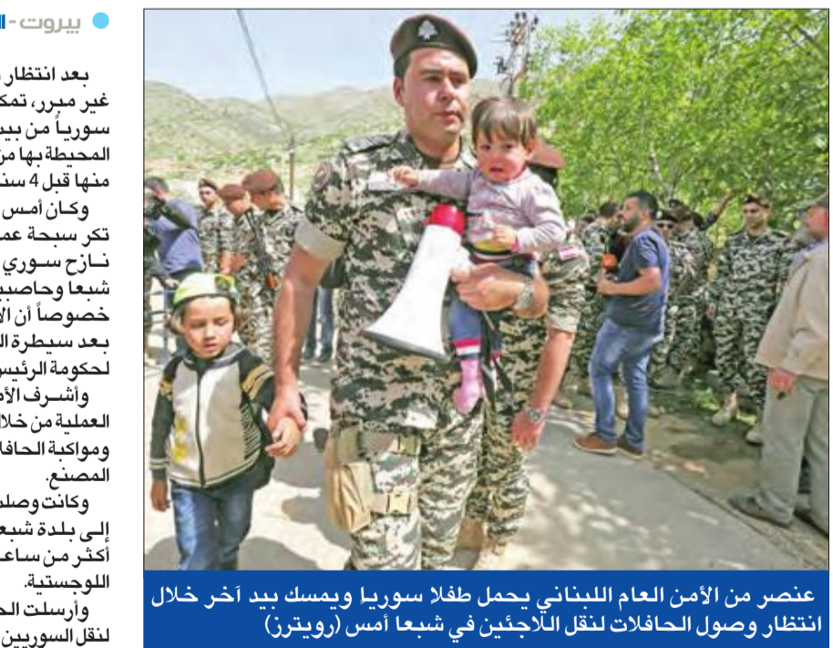
عنصر من الأمن العام اللبناني يحمل طفلاً سوريا ويسكب بخر خلال انتظار وصول الحافلات لنقل اللاجئين في شبعاء أمس

وأرسلت الحكومة السورية الحافلات لنقل السوريين الراغبين بالعودة الطوعية