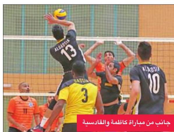
جانب من مباراة كاظمة والقادسية

وطبقاً لنظام البطولة يتأهل الفريقان الفائزان بمجموع مباراتين من أصل ثلاث مباريات مباشرة للمباراة النهائية المقرر أن تقام الثلاثاء المقبل الموافق 24 الجاري بدلاً من 1