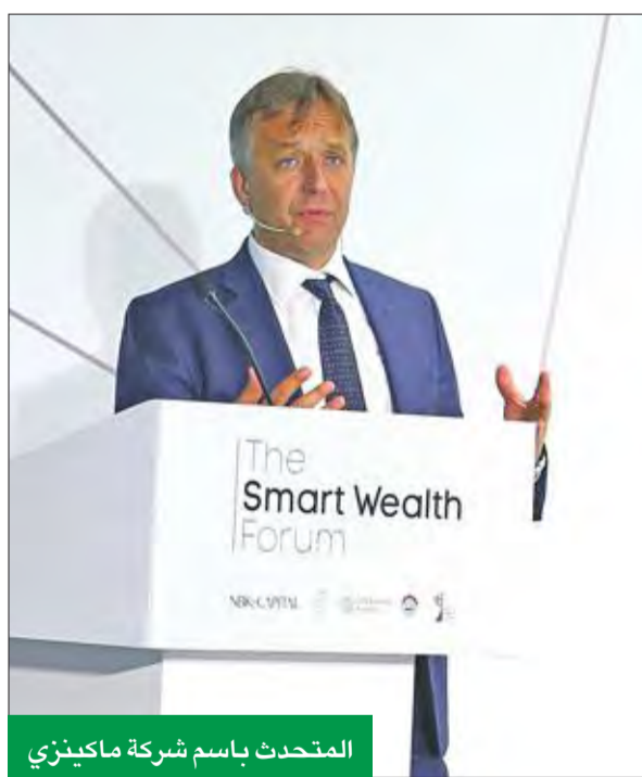
المحدث باسم شركة ماكيني

من جانبه، أكد القطان ضرورة تطوير الأدوات