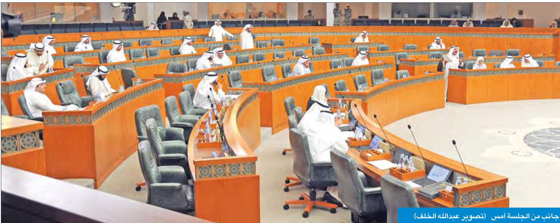
جانب من الجلسة أمس

تأكيدات على مد يد التعاون للنائب الأول لتنفيذ رؤية الكويت 2035 وطي صفحة الماضي