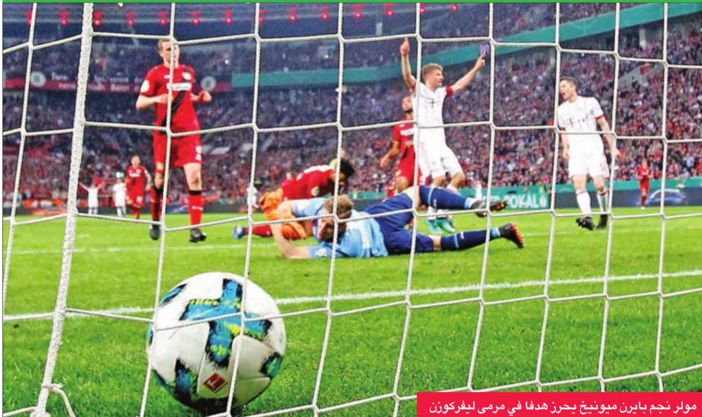
مولر نجم بايرن ميونخ يحرز هدفا في مرمرى ليفركوزن

بات بايرن ميونخ على بعد مباراة من الفائزة الـ 12 في تاريخه، وذلك بلوغه نهائي كأس ألمانيا لكرة القدم بعد فوزه الكبير على مضيفه باير ليفركوزن 6-2، أمس الأول، على ملعب "باي أرينا". ويسعى بايرن إلى تكرار سيناريو عام 2013، حين أحرز ثلاثة الدوري والكأس المحليين ودوري أبطال أوروبا بقيادة مربيه الحالي يوب هاينكس، الذي قلب وضع الفريق رأسا على عقب، منذ أن تسلم الإشراف عليه في أكتوبر 2017 خلفا للإيطالي كارلو أنشيلوتي. وضمن بايرن إحرازه لقب الدوري للموسم السادس على التوالي، وبلغ أيضا نصف نهائي دوري الأبطال، حيث يتواجه مع ريال مدريد الإسباني حامل اللقب، الذي يحل الأربعاء المقبل ضيفا على النادي البافاري في الذهاب.