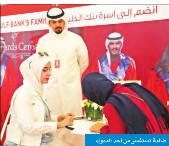
طالبة تستفسر من أحد البثوك