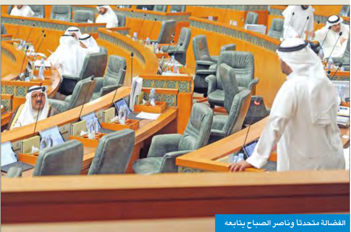
الفضالة متحدثاً وناصر الصباح يتابعه

وعقب نائب رئيس مجلس الوزراء وزير الداخلية الشيخ خالد الجراح قائلاً إن الفضالة ذكر ان رئيس الوزراء الحقيقي هو ناصر الصباح، وهذا غير صحيح، بل هو جابر المبارك، وهذه ارادة سمو الامير، وناصر الصباح هو النائب الأول لرئيس الوزراء. ثم تحدث نائب رئيس مجلس الوزراء وزير الدولة لشؤون مجلس الوزراء انس الصالح قائلاً: «ورد في