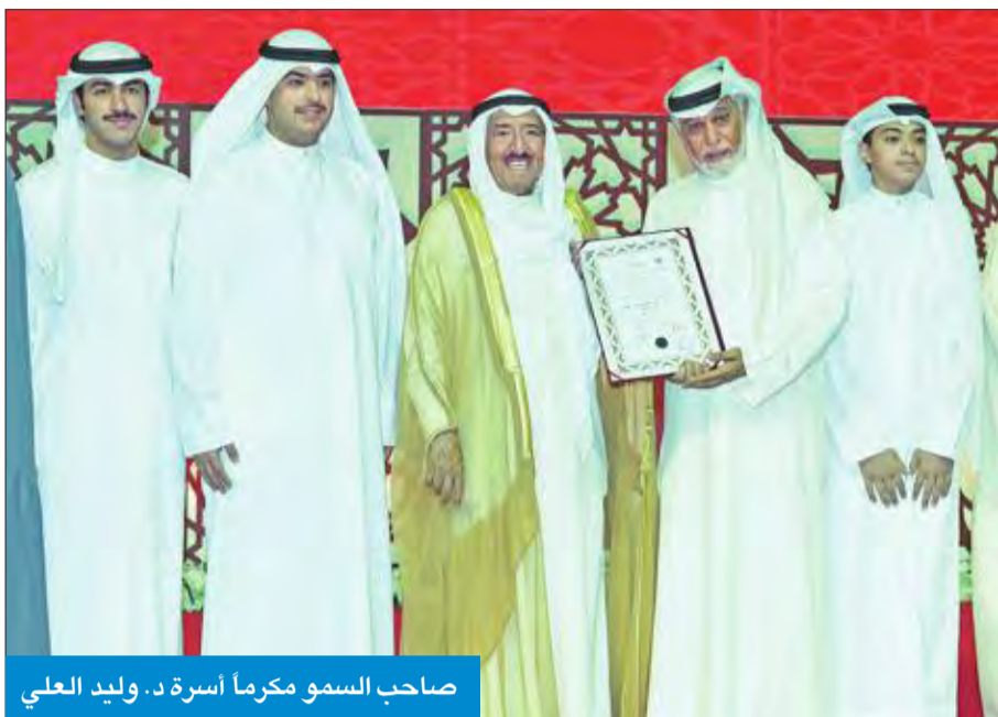
صاحب السمو مكرم أسرة د. وليد العلي

العفاسي: زيادة المشاركين بالمسابقة دليل اهتمام الدولة برعاية كتاب الله والاعتناء بأهله