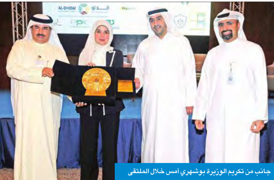
جانب من تكريم وزيرة بوشهري أمس خلال الملتقى

الأحمد: «البيئة» تسعى لإنتاج ما لا يقل عن 15% من الطاقة المتجددة النوري: «الكهرباء» رصدت خطة حتى 2023 وتكاليفها تصل إلى نصف مليار دينار