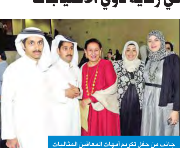
جانب من حفل تكريم أمهات المعاقين المتأليات

توفير الدعم لمختلف الأنشطة المجتمعية، لاسيما تلك المرتبطة بفعلة ذوي الاحتياجات الخاصة وأسره.