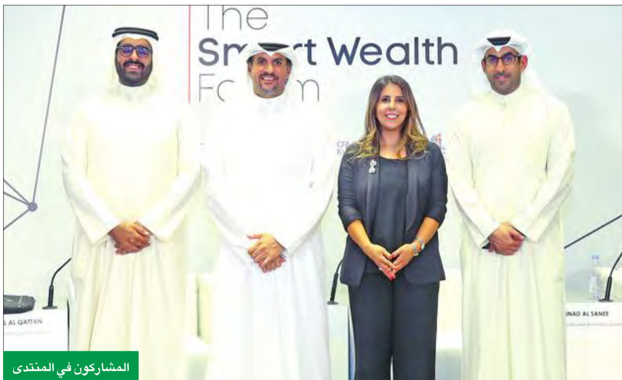
المشاركين في المنتدى

وذكر أنه بإمكان المستثمرين إدارة استثماراتهم ومراقبتها من خلال البوابة الإلكترونية لخدمة سماتر وبلت المقدمة من شركة الوطني للاستثمار، أو عن طريق تطبيق الهاتف النقال، مبيّناً أنه يمكن للمستثمرين تسجيل الدخول بسهولة إلى حسابهم وإدارته في أي وقت ومن أي مكان. وشهد ختام المنتدى تفاعلاً من الحضور، من خلال توجيه الاستفسارات حول آليات الاستثمار الآمن إلى المشاركين الرئيسيين والمتخصصين في شركة الوطني للاستثمار.