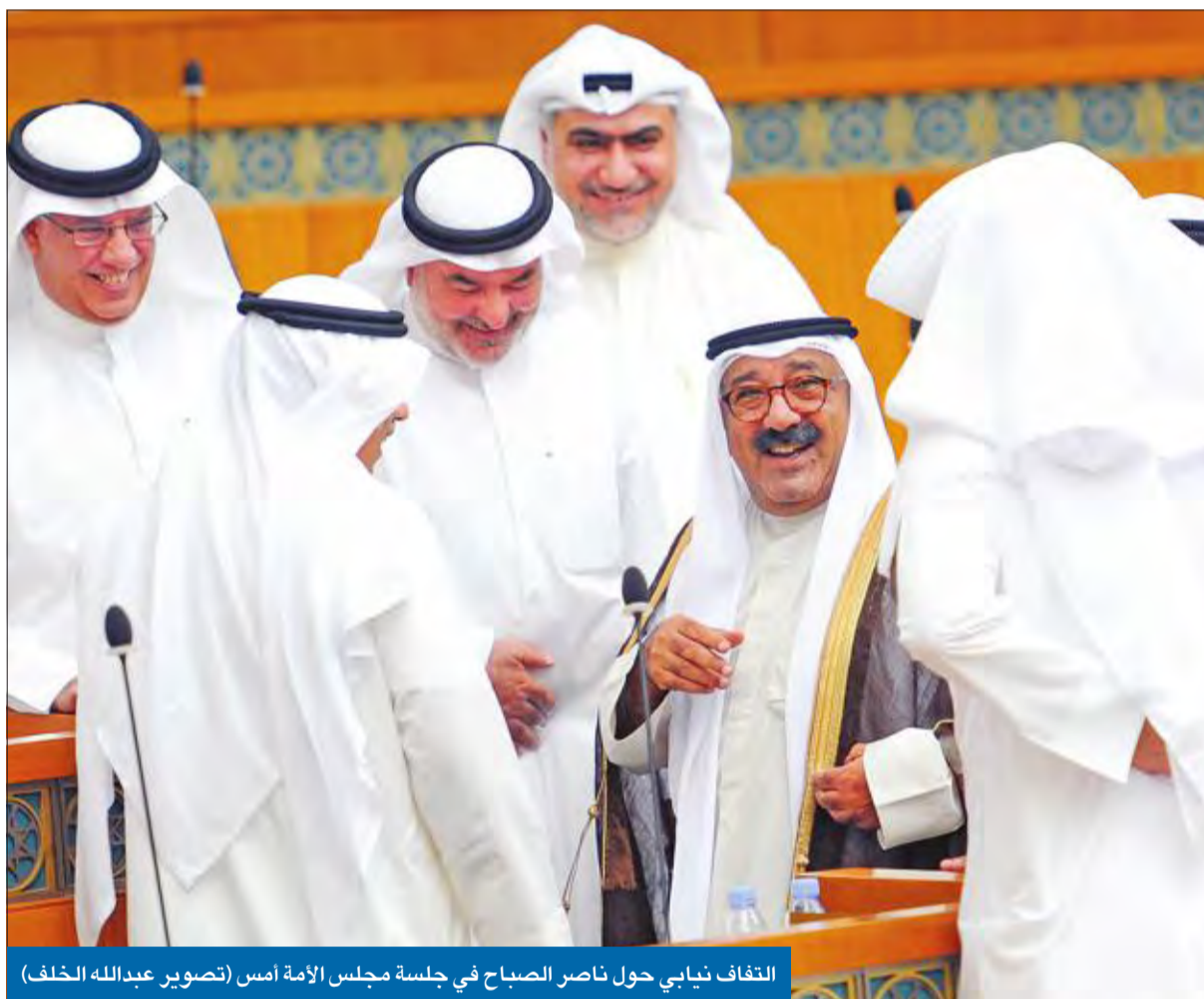
التفاف نيابي حول ناصر الصباح في جلسة مجلس الأمة أمس

«أولوياتنا إصلاح وحوكمة الإدارات والتصدي للفساد ورفع كفاءة الأداء المؤسسي والبشري» • «نسعى لمجتمع متطور منتج ذي تنمية حقيقية تجعل البلاد في مصاف الدول المتقدمة» • «الرؤية تحتاج إلى استثمار كبير لترى النور في ظل بنية تشريعية صلبة دون المساس بالعدالة»