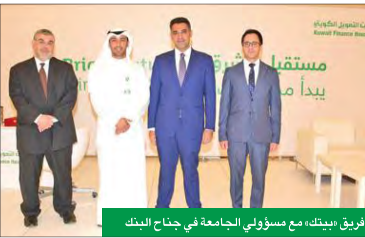
فريق «بيتك» مع مسؤولي الجامعة في جناح البنك

شارك بيت التمويل الكويتي (بيتك) في معرض الفرص الوظيفية الذي تقيمه جامعة الشرق الأوسط الأميركية، تحت شعار «مستقبل مشرق يبدأ من بيتك»، وذلك استمراراً لجهود البنك في استقطاب الكفاءات الوطنية، وفي إطار تأكيد الأولوية التي يضعها لتعزيز دوره الفاعل في خدمة جهود تطوير الكفاءات، وصقل الخبرات الشبابية وفق المعايير والمقاييس العالمية. وتأتي مشاركة «بيتك» ضمن إطار الاهتمام المتواصل بالعملية التعليمية ودعم القدرات الوطنية وتشجيع الشباب على الالتحاق بالعمل في القطاع الخاص، إذ حقق «بيتك» زيادة في استقطاب وتطوير الكفاءات الوطنية، ونجح في استراتيجيته تنمية الموارد البشرية وتكريس الموارد لتزويد