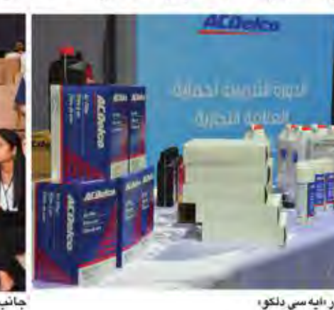
قطع غيار آيه سي دكو

وعادة ما يتم عرض قطع الغيار المقلدة كبديل اقتصادي للقطع الأصلية، لكنها ترتبط كثيراً بمزيد من التكاليف، ليس فقط من الناحية المادية، فالقطع غير الأصلية يمكن أن تؤدي إلى العديد من المشاكل الميكانيكية والحوادث، وحتى الإصابات الشخصية، إضافة إلى تعطل المركبات.