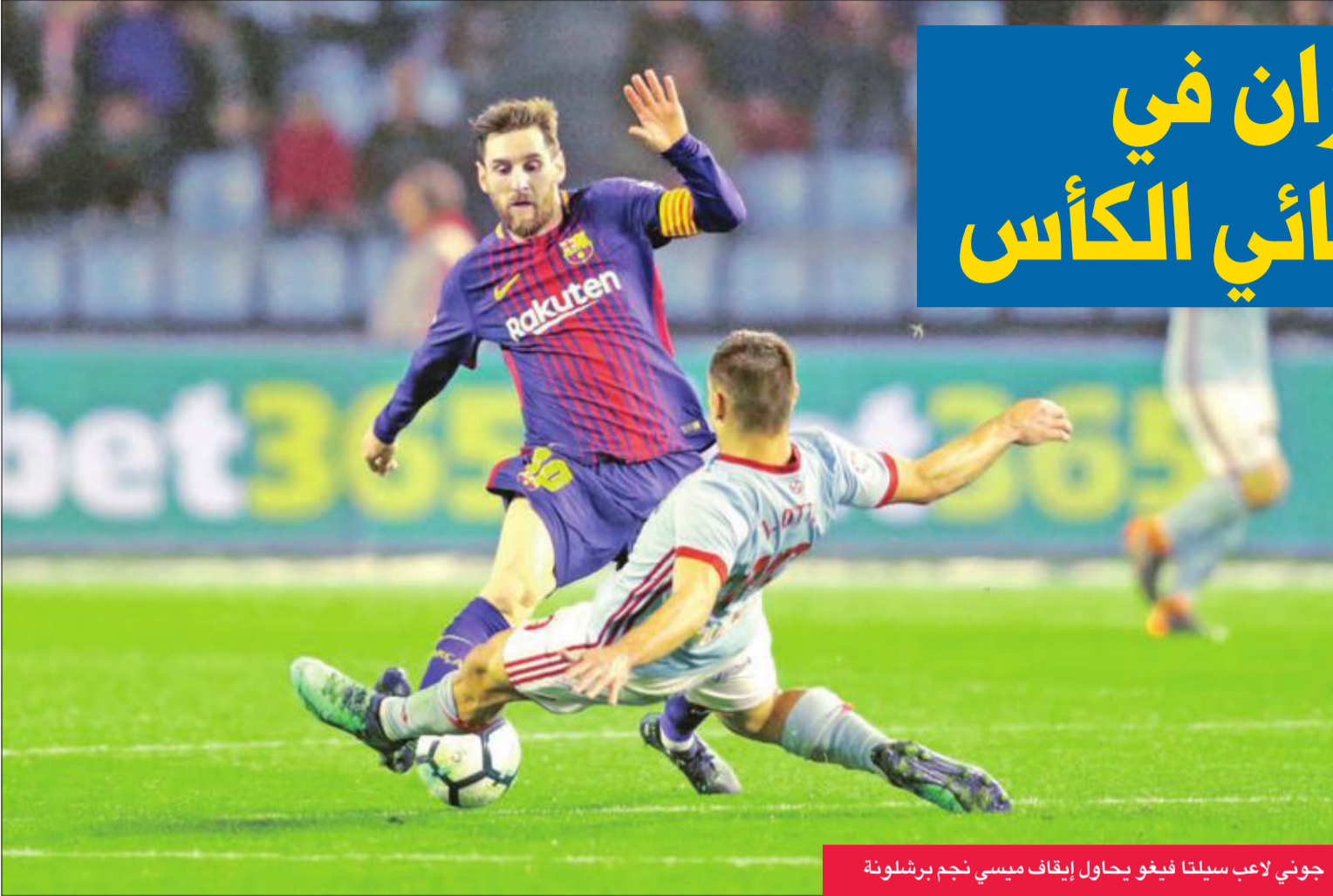
جوني لاعب سيلتا فيغو يحاول إيقاع ميسي نجم برشلونة

تعتبر برشلونة المتصدر وإشبيلية خارج قواعدهما، في البروفة الأخيرة قبل المباراة النهائية لمسابقة كأس إسبانيا لكرة القدم، المقررة بعد غد، فتنعادل الأول مع مضيفه سلتا فيغو 2-2، والثاني مع ضيفه ديبورتيفو لا كورونيا سلتا، أمس الأول، في افتتاح المرحلة الثالثة والثلاثين من الدوري.