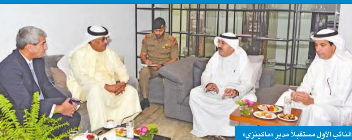
النائب الأول مستقبلاً مدير «ماكينزي»

كما استقبل النائب الأول سفير الولايات المتحدة الأمريكية لدى البلاد لورنس سيلفرمان، ورئيس شركة بوينغ مارك إن، بمناسبة زيارته للبلاد.