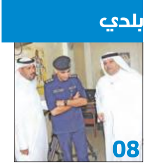
بلدي 08 61 اجمالي المرشحين حتى نهاية اليوم الثامن وإغلاق الباب غداً

العازمي قدمه في محاور الفساد والعهد وتأخر تنفيذ القوانين والجناسي والبدون والرياضة ● الغانم: أبلغت سموه... وأدرج في جلسة أول مايو مع استجواب الرشيد ● حمدان: أرفض السرية... وصعود المنصة مكسب للرئيس بعد 7 حكومات متتالية