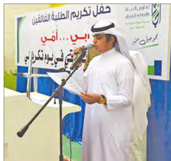
كلمة الحفل يلقيها أحد الفائزين