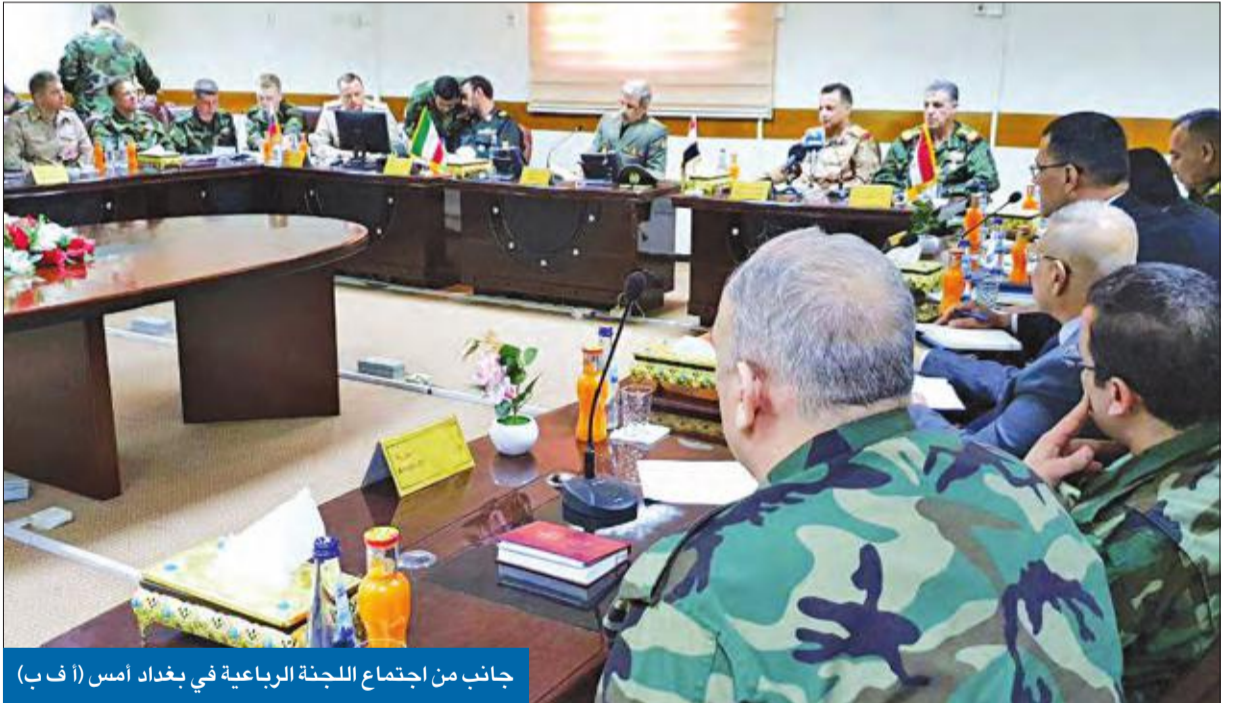
جانب من اجتماع اللجنة الرباعية في بغداد أمس

● غارة عراقية داخل سورية بموافقة الأسد وواشنطن ● موسكو وطهران تفعّلان «غرفة بغداد» الرباعية