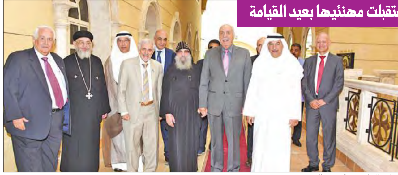
الساير والسنعوسي والحمد يهنئون