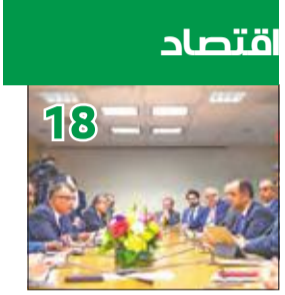
اقتصاد 18 الحجرف يناقش تعزيز التعاون المشترك مع البنك الدولي