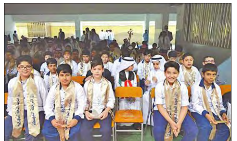
طلاب «النجا» النموذجية