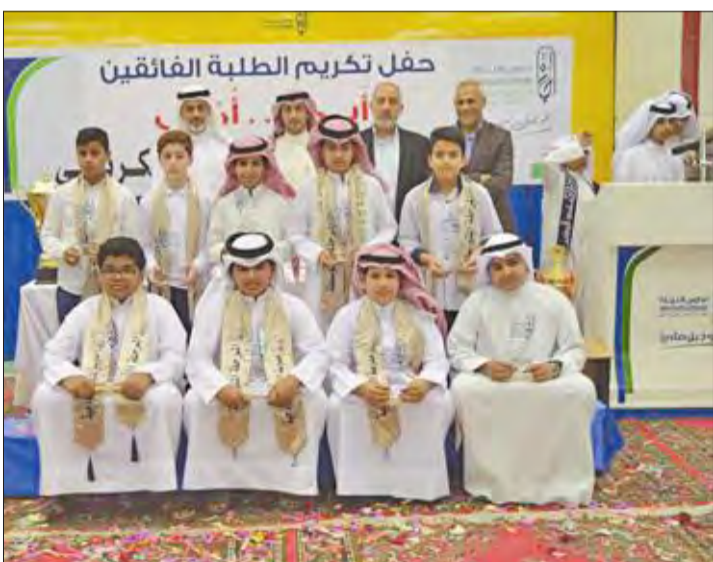
الطلاب الفائزون مع معلمهم