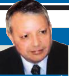
صالح القلب كاتب وسياسي أردني