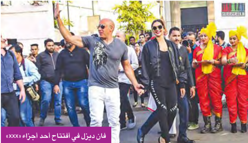
فان ديزل في افتتاح أحد أجزاء «XXX»

بعد نجاح الجزء الثالث من سلسلة «The Return of Xander Cage»