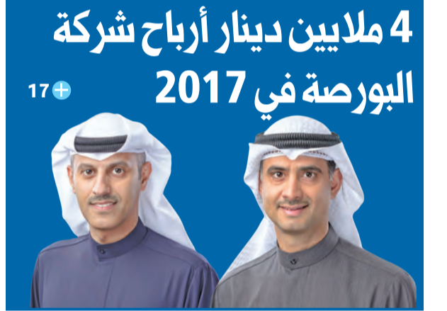
4 ملايين دينار أرباح شركة البورصة في 2017

واصلت أسعار النفط ارتفاعها، أمس، مسجلة أعلى مستوياتها منذ أواخر 2014، في وقت انخفضت مخزونات الخام الأميركية، لتحرك مقترية من متوسط خمس سنوات. يأتي ذلك في أعقاب نقل «رويترز» عن مصادر، أن السعودية، أكبر مصدر للنفط في العالم، تسعى إلى دفع أسعار الخام للارتفاع. وزادت العقود الآجلة لخام القياس العالمي برنت إلى 74.73 دولاراً للبرميل، لتسجل أعلى مستوى منذ 27 نوفمبر 2014، في حين صعدت عقود خام غرب تكساس الوسيط الأميركي 98 سنتاً إلى 69.45 دولاراً، كما بلغ الخام