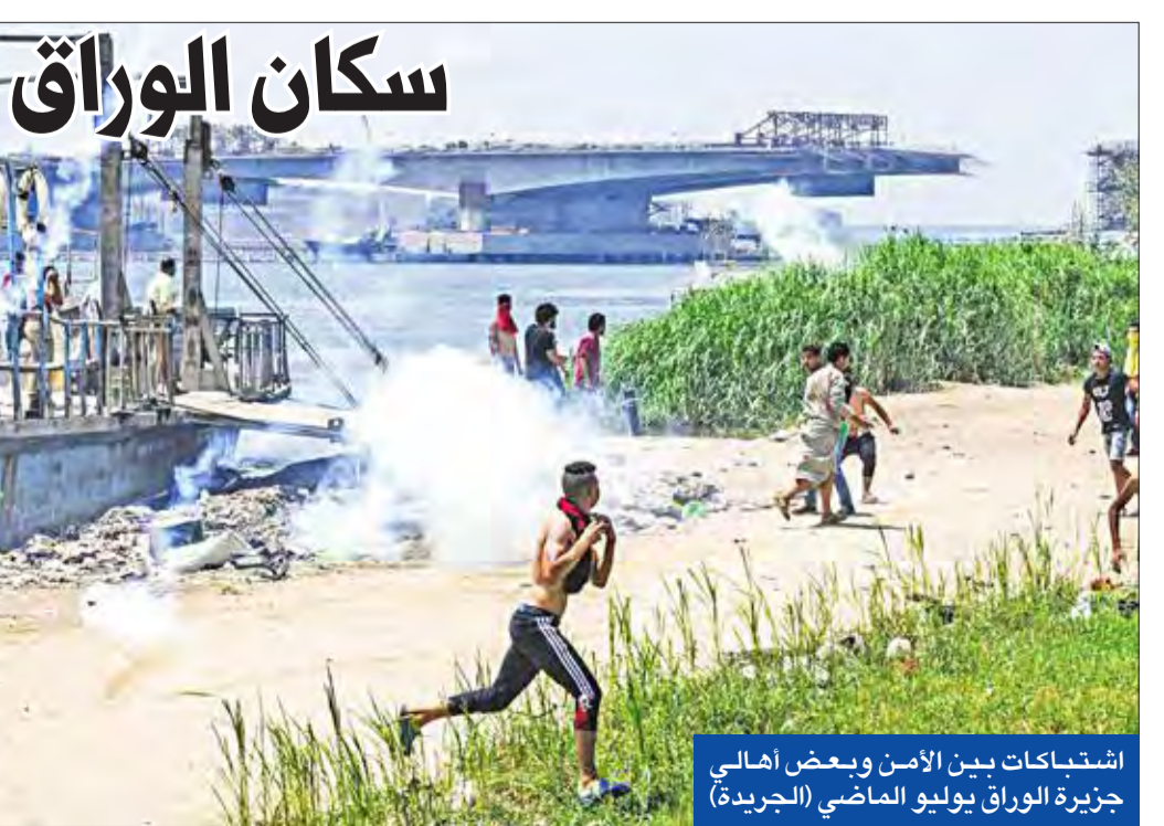
اشتباكات بين الأمن وبعض أهالي جزيرة الوراق يوليو الماضي (الجريدة)

أيدت محكمة النقض المصرية، أمس، إدراج 46 متهمًا في قضية اغتيال النائب العام المصري السابق المستشار هشام بركات في «قوائم الإرهابيين». ورفضت محكمة النقض برئاسة نائب رئيس المحكمة، المستشار عبدالرحمن هيكل، طعونًا من المتهمين المدرجة أسماؤهم على القوائم بموجب حكم أدنى درجة من محكمة جنائيات القاهرة. وأشارت تحقيقات إلى محاولة هؤلاء اغتيال وزير الدفاع الفريق أول صدقي صبحي بذات الطريقة التي نفذت بها عملية اغتيال النائب العام الراحل «باستخدام سيارات مفخخة» بعد رصد وطعن المتهمون على الأحكام