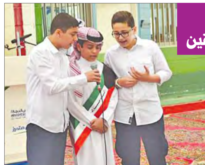
تلوة آيات من الذكر الحكيم