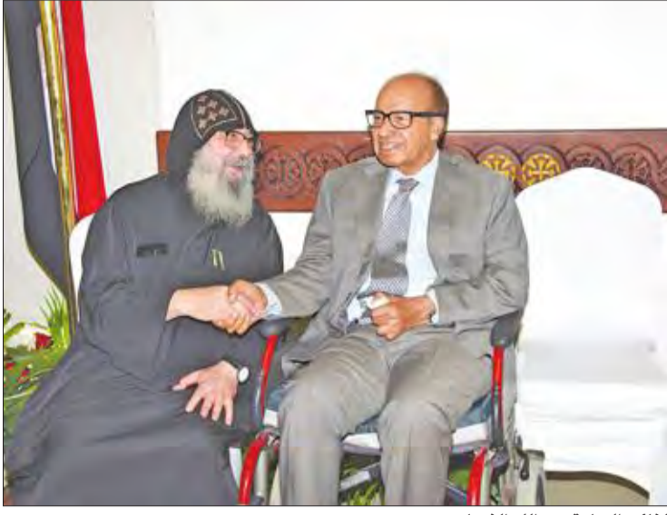
النائب السابق عبدالله النجباري