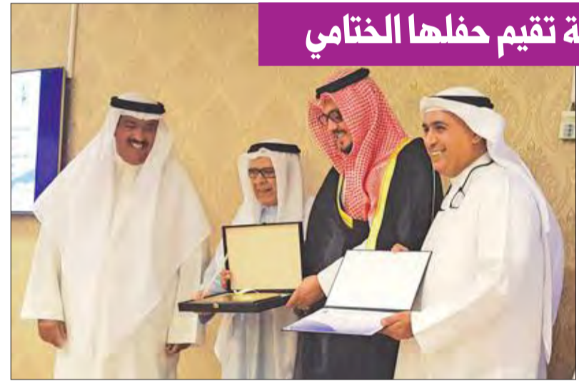
تكريم الشيخ حمد الخالد