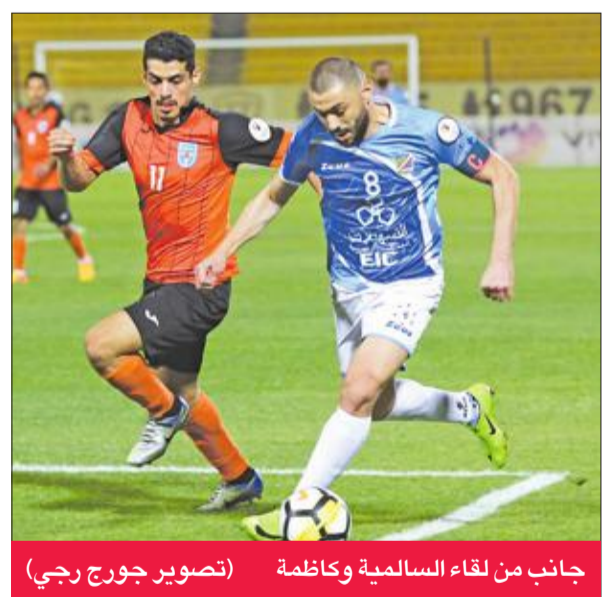
جانب من لقاء السالمية وكاظمة