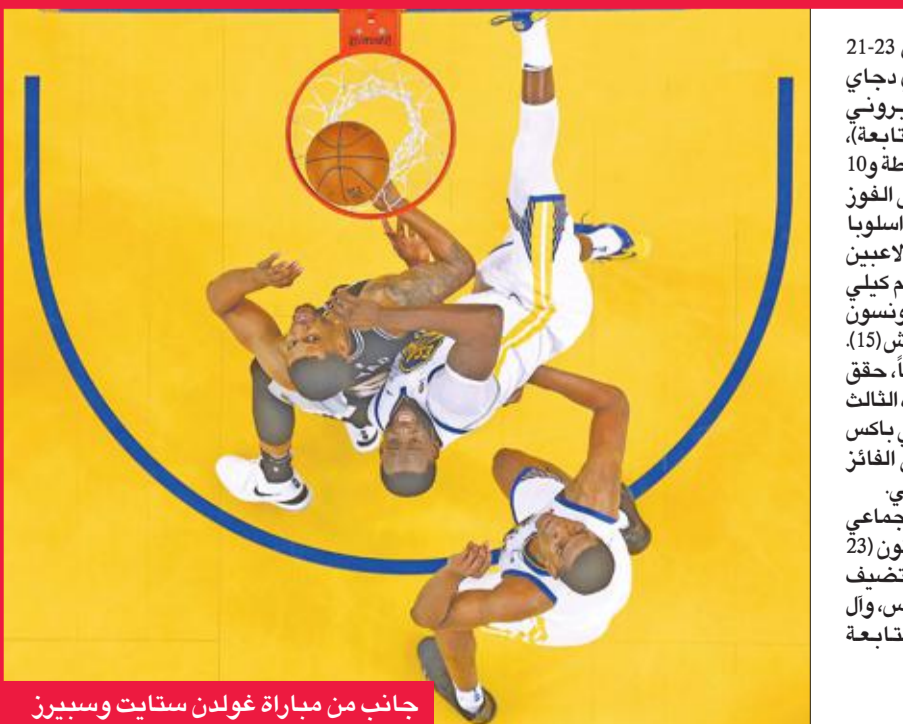
جانب من مباراة غولدن ستايت وسبيرز

وتميز موسم 2017-2018 بحصيلة سلبية بالنسبة إلى سان أنتونيو تضمنت 47 فوزاً (14 فقط خارج أرضه) و35 هزيمة (27 خارج قواعده)، وهي من أسوأ النقاط الإحصائية في عهد بوبوفيتش. ولأول مرة منذ 1997، كان سان أنتونيو المعروف بثبات واستقرار مستواه، مهدداً بعد التاهل للنادول النهائية، وقد تأثر مستواه بمجرد غياب نجم واحد عن صفوفه بسبب الإصابة هو كاهي ليونارد (26 عاماً) صاحب 25.5 كمدل وسطي في المباراة الواحدة في موسم 2016-2017.