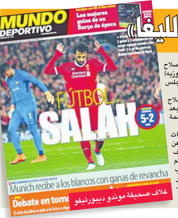
غلاف صحيفة مونديو ديبورتيفو

فرق العاصمة الإسبانية، غاريث بيل وكريم بنزيمة، وكتب أحد المعلقين: "تعاقدوا مع هذا الفتى، وليس مع نيمار فهذا أفضل"، في حين قال آخر: "الآن صلاح فعل ما يصنعه ميسي، وبات ينقصه تقديم نفس الأداء لعدة أعوام ليصبح واحدا من أفضل اللاعبين في التاريخ". ونشرت الصحيفة استطلاعا للرأي حول مدى إمكانية فوز صلاح بجائزة الكرة الذهبية لأفضل لاعبي العالم على حساب النجمين الكبيرين ليونيل ميسي وكريستيانو رونالدو، المستحوذين عليها طوال السنوات العشر الماضية، شارك فيه أكثر من خمسة آلاف شخص، أبدى 64 في المئة تأييده لإمكانية فوزه بالجائزة، مقابل استبعاد 36 في المئة منهم لذلك. أما صحيفة "أس" الرياضية، فنشرت أن "صلاح أصبح أحد النجوم الكبار في عالم كرة القدم، ويبدو