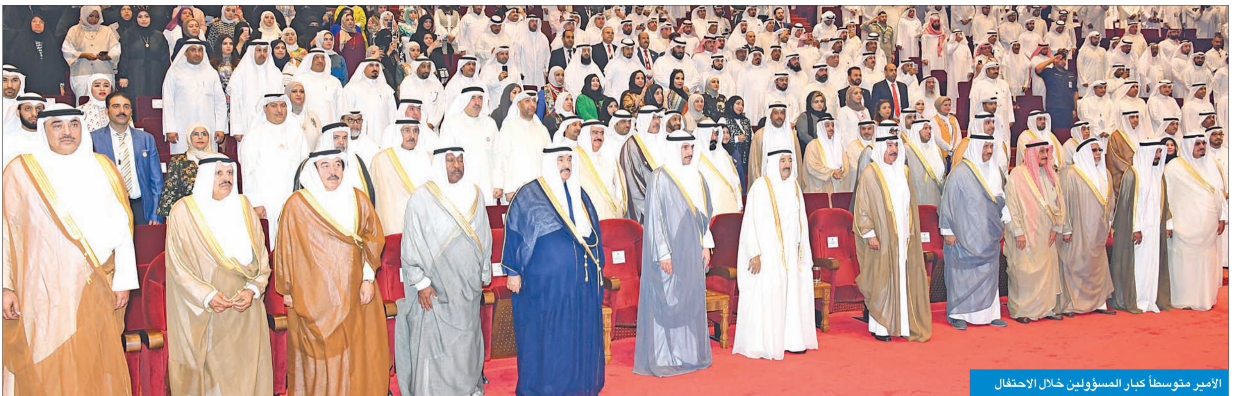
الأمير متوسطاً كبار المسؤولين خلال الاحتفال