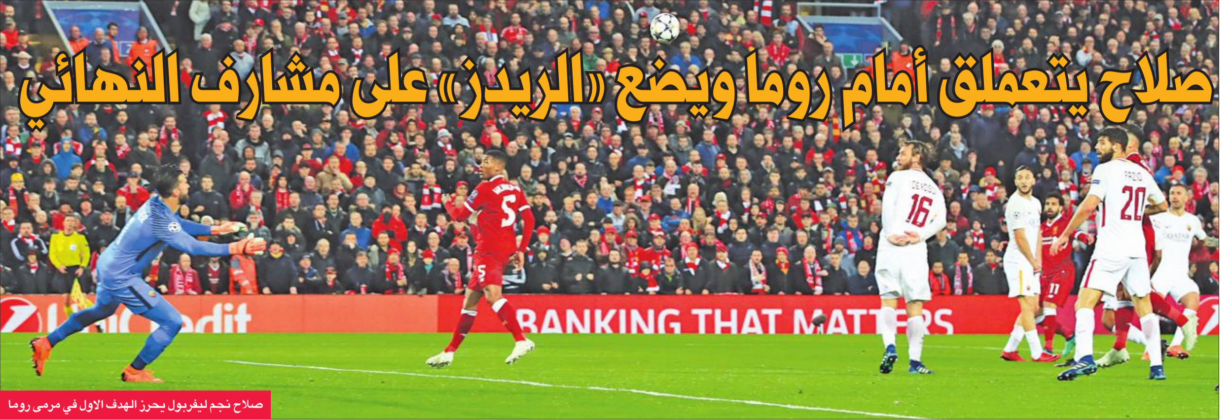
صلاح نجم ليفربول يحرز الهدف الأول في مرمى روما

فتابعها في المرمى هدفًا رابعًا (61). وفي أول هدف لم يحمل توقيع أو لمسة صلاح، حقق القناص فرمينيو الثنائية بكرة رأسية بكرة ركنية لجيمس ميلنر عمقت جراح روما بهدف خامس (69). وبعدما أخرج كلوب صلاح في الدقيقة 74 وسط هازيغ صاخبة بكرة مرتدة لعبها إلى المصري فخرج البسون لملاقاته، بدأ أن لاعب المقاولون العرب السابق لعبها ساقطة من فوفه تدرجرت نحو الشباك الخالية، هدفًا ثانيًا (45). ومطلع الشوط الثاني، عرّف صلاح مجدداً انما هذه المرة من موقع المرمى، فانطلق على حافة التسلسل ولعب عرضية متقنة إلى ماثيه، تابعها الأخير من داخل المنطقة بعيدة في الزاوية اليسرى للبسون (56). استمر العرّف ومن الجهة اليمنى أيضاً، وتلاعب صلاح بالمدافع البرازيلي جوان جيزوس، واهدى بيميناه كرة حاسمة جديدة لكن هذه المرة إلى فرمينيو على القائم البعيد،