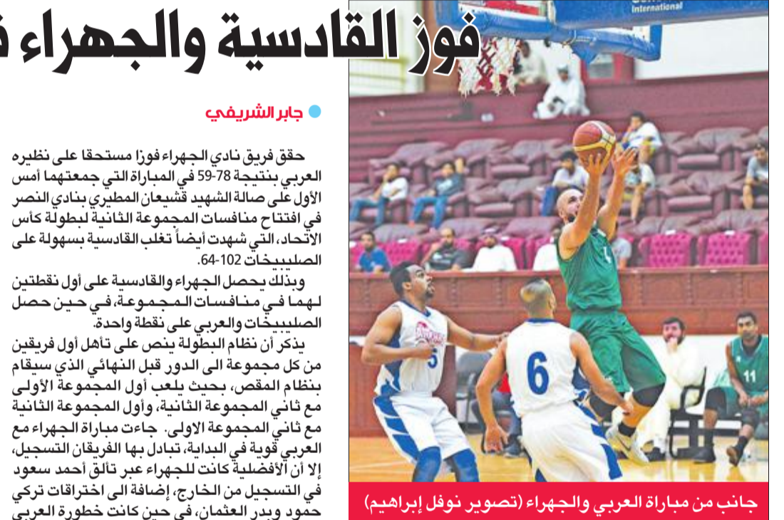
جانب من مباراة العربي والجهراء

وتقام اليوم الجولة الثانية من منافسات المجموعة الثانية، حيث يلقي الشباب مع الجهراء في الساعة السادسة مساءً على صالة نادي الكويت، كما يلعب أيضا العربي مع الصليبيخات في الثامنة على نفس الصالة.