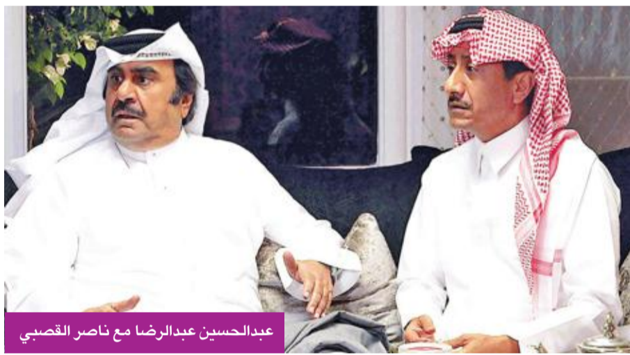
عبدالحسين عبدالرضا مع ناصر القصبي