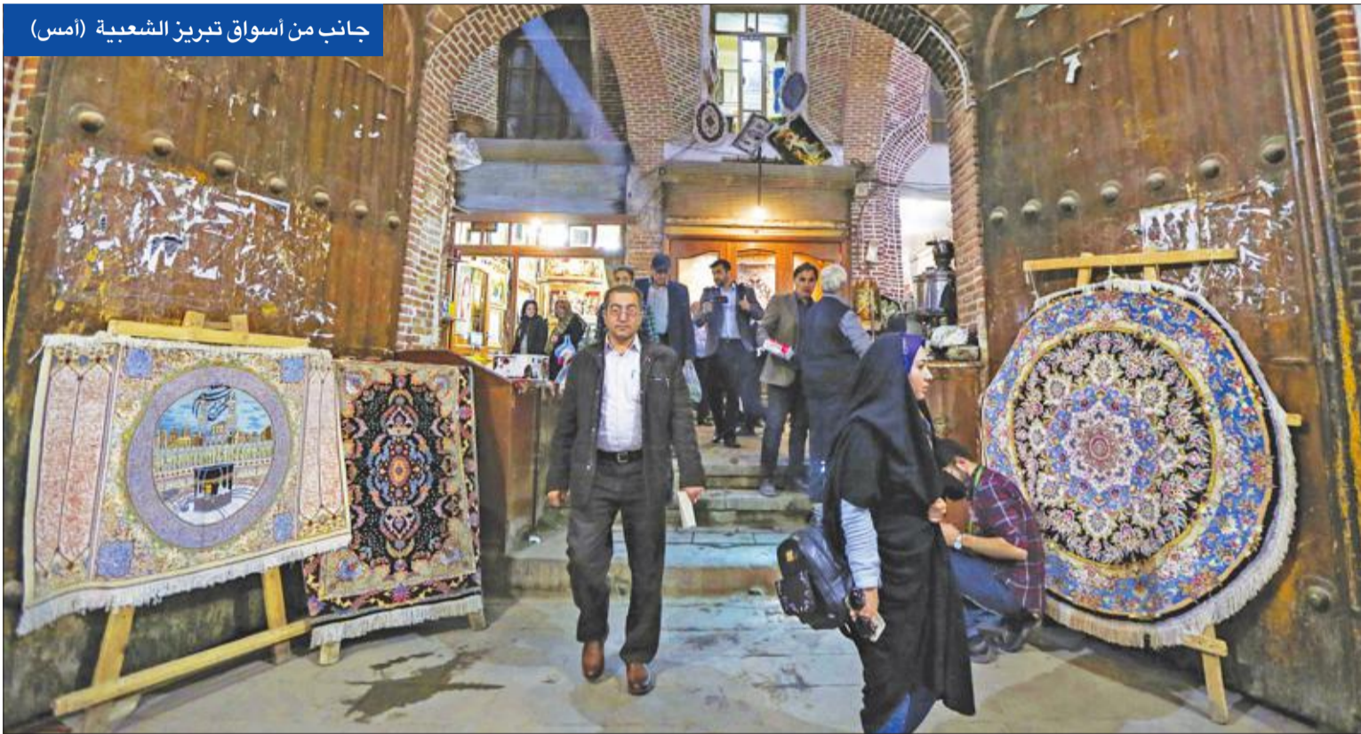
جانب من أسواق تبريز الشعبية (أمس)

تثبيت الرئيس الإيراني حسن روحاني أمس برفض بحث أي تعديل أو استبدال الاتفاق المبرم بين القوى الكبرى وبلادها بشأن برنامجها النووي، ردّاً على دعوة الرئيسين الأميركي دونالد ترامب، والفرنسي إيمانويل ماكرون إلى العمل على اتفاق جديد حول الملف النووي الإيراني. ورد روحاني أمس في خطاب القاه في تبريز على تصريحات الرئيسين، مشككاً في شرعية مساعي التوصل إلى اتفاق جديد. وفي إشارة ضمنية إلى خطاب ترامب ماكرون، مساء أمس الأول، قال روحاني: يقولون لي جانب رئيس دولة أوروبية، تريد أن تقرر حول اتفاق تتوصل إليه الأطراف السبعة، للقيام بماذا؟ وبأي حق؟ وأضاف مستنكراً ومتهماً الغربيين بعد الوفاء بتعهداتهم بشأن المعاهدة المبرمة في 2015 بين طهران ومجموعة "P5+1"، عليكم أن توضحوا كيف سيسير الاتفاق في السنوات المقبلة. قولوا لنا من فضلكم أولاً ماذا فعلتم في السنتين الماضيتين؟ وأشار روحاني إلى أن الوكالة الدولية للطاقة الذرية تؤكد بانتظام أن إيران تفي بتعهداتها التي قطعتها في حينها حول برنامجها النووي، بهدف تقديم ضمانات بأنها لا تسعى إلى امتلاك السلاح الذري. واعتبر الرئيس المعتدل أن الاتفاق أسقط اتهامات الولايات المتحدة وإسرائيل لبلادها بالسعي لامتلاك قنبلة نووية.