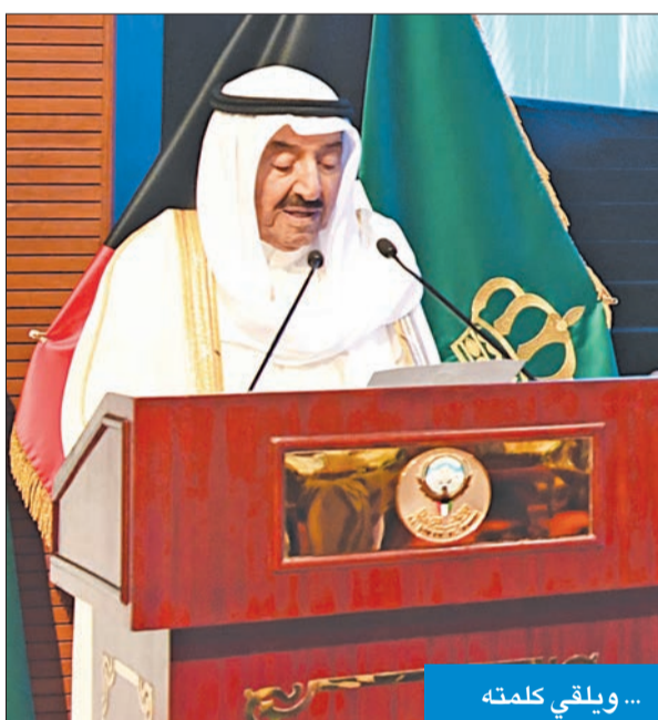
... ويلقي كلمته