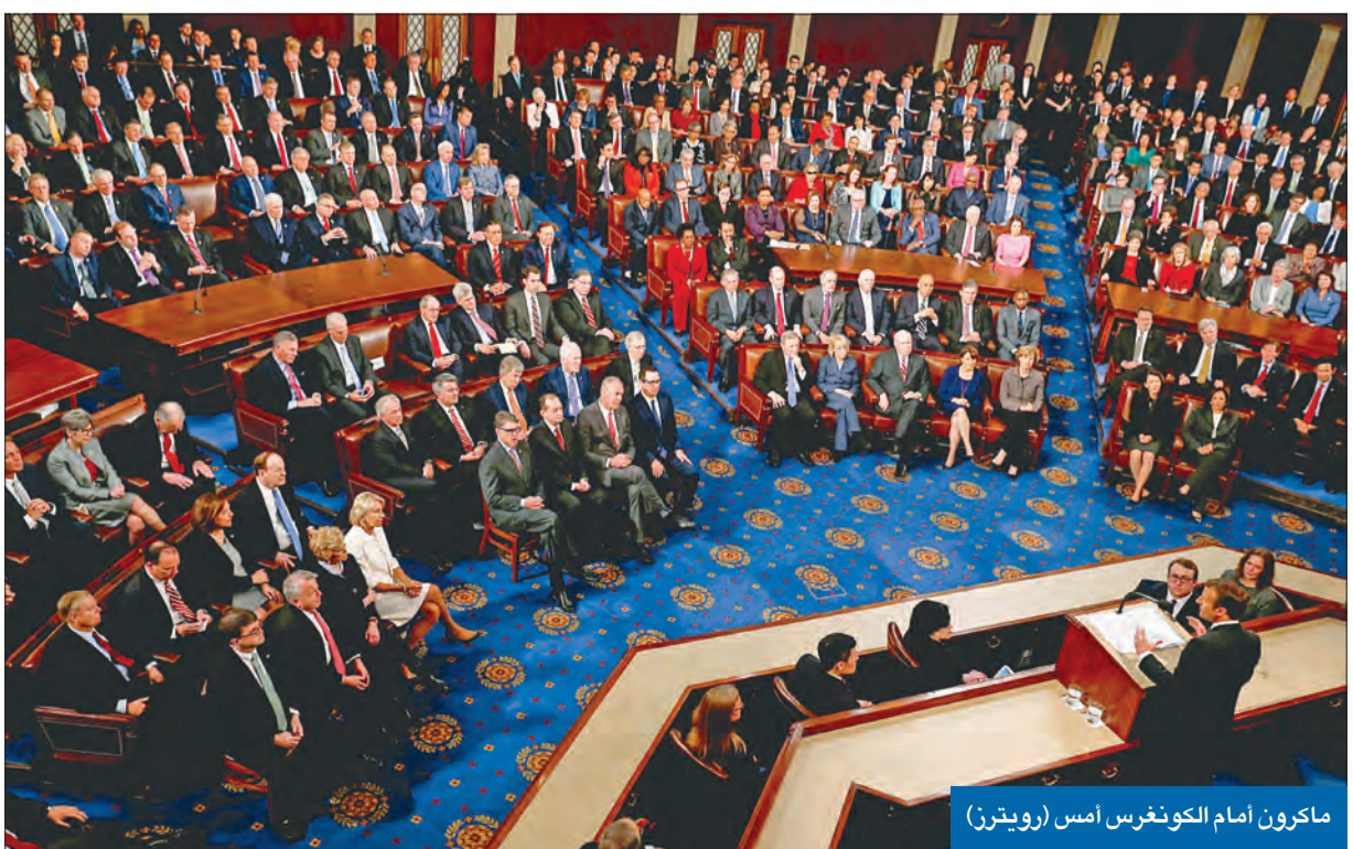
ماكرون أمام الكونغرس أمس

يمكن اعتبار زيارة الرئيس الفرنسي إيمانويل ماكرون للعاصمة الأميركية واشنطن واحدة من أنجح الزيارات لرئيس دولة أجنبية، إذ استطاع خلالها تحقيق مقاربات ناجحة مع دونالد ترامب، أحد أصعب الرؤساء الأميركيين، وأكثرهم إثارة للجدل في تاريخ أميركا الحديث.