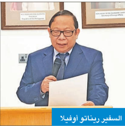
السفير ريناتو أوفيلبا

أكد سفير الفلبين ريناتو أوفيلبا، في تصريح مقتضب لـ «الجريدة»، احترامه لدولة الكويت حكومة وشعباً، معرباً عن اعتزازه وفضه بالفقرة التي قضاه ممثل بلاده فيها. وقال: «كان شرف كبير لي العمل في دولة الكويت»، مؤكداً أن بلاده لن تتخذ أي إجراءات إزاء التطورات الأخيرة بين البلدين.