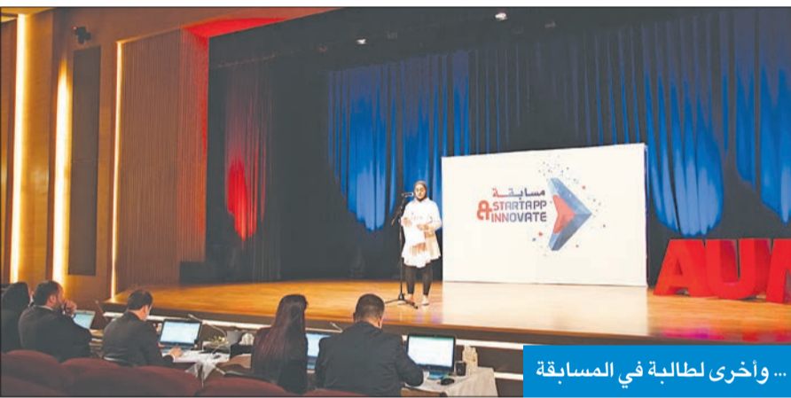
... وأخرى لطلبة في المسابقة

الديبسي: الفعالية استثمار للطاقت الإبداعية الكويتية