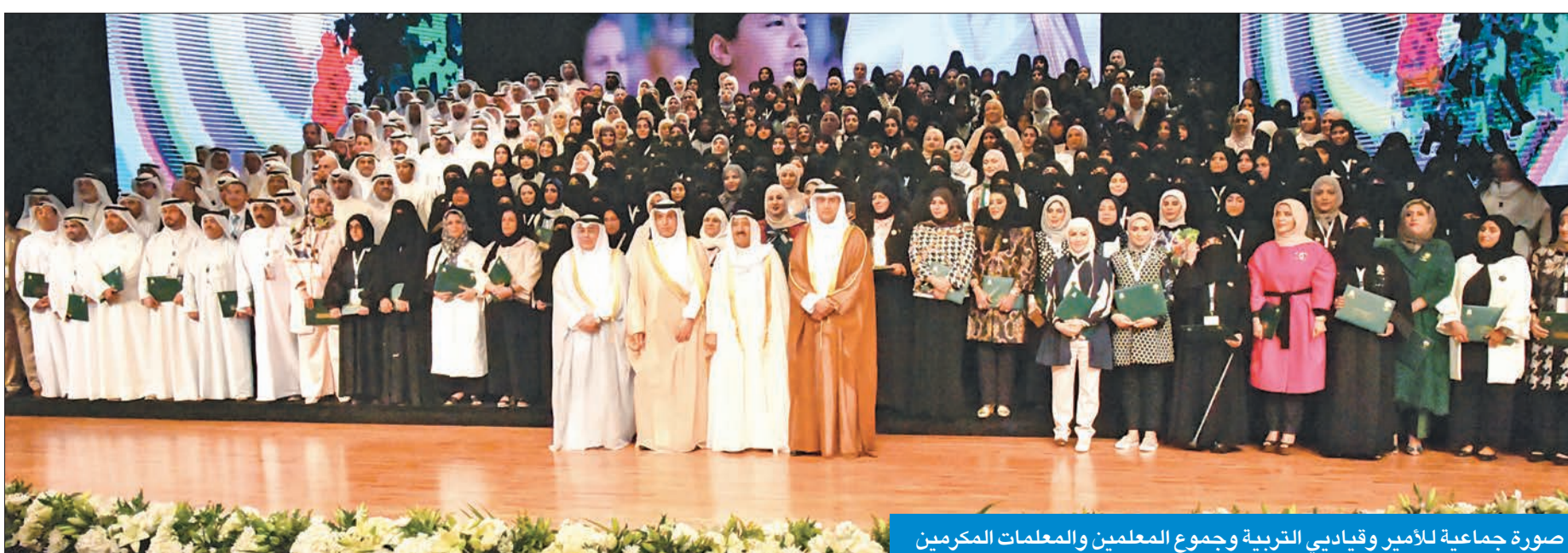
صورة جماعية للأمير وقيادتي التربية وجموع المعلمين والمعلمات المكرمين

بعث صاحب السمو أمير البلاد الشيخ صباح الأحمد، ببرقية تهنئة إلى رئيس جمهورية بنغلادش محمد عبد الحميد، عبر فيها سموه عن خالص تهنئه بمناسبة أداءه اليمين الدستورية رئيساً لجمهورية بنغلادش الصديقة، متمنياً لسموه له كل التوفيق والسداد، وموفور الصحة والعافية، وللعلاقات الطيبة بين البلدين الصديقين المزيد من التطور والنماء. كما بعث سموه، ببرقية تهنئة إلى الرئيس المنتخب لجمهورية الباراغواي ماريو ايدو بينيتيز، عبر فيها سموه عن خالص تهنئه بمناسبة فوزه في الانتخابات الرئاسية لجمهورية الباراغواي، متمنياً لسموه له موفور الصحة والعافية، وكل التوفيق والسداد، وللعلاقات الطيبة بين الكويت وجمهورية الباراغواي الصديقة المزيد من التطور والنماء. وبعث سمو ولي العهد الشيخ نواف الأحمد، ورئيس مجلس الوزراء سمو الشيخ جابر المبارك ببرقيات تهنئة مماثلة.