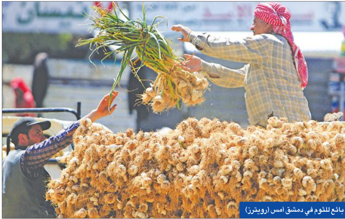
بائع للخبز في دمشق أمس

مع تأكيد روسيا أنها لم تقرر بعد إرسال منظومات دفاع جوي جديدة إلى سورية في القريب العاجل، انشغلت الاستخبارات الأميركية والإسرائيلية في مراقبة "شحنات جوية مريية" بين طهران ودمشق يشتهيه في أنها قد تحتوي على أسلحة أو معدات عسكرية.