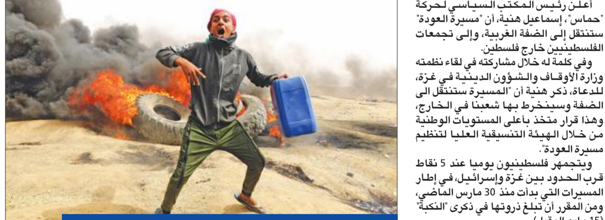
فلسطيني خلال المواجهات مع الإسرائيليين على حدود غزة