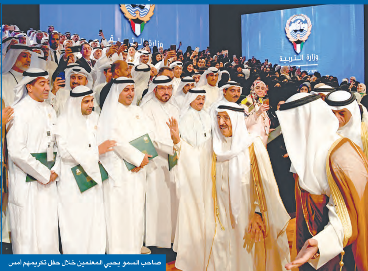
صاحب السمو يحيي المعلمين خلال حفل تكريمهم أمس