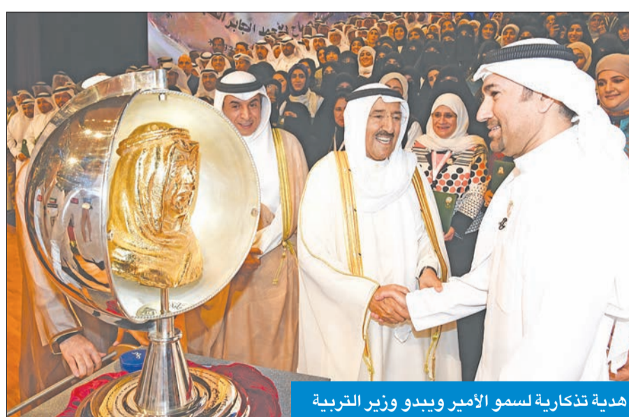
هدية تذكارية لسمو الأمير وبيد وزير التربية

عبر الحضور، لاسيما الصحافيين، عن شكرهم للمراقبة شديدة الكوج التي كان لها دور كبير في تذليل الصعاب، وتسهيل مهام العاملين للخروج بهذا الحفل في أبهى صورة».