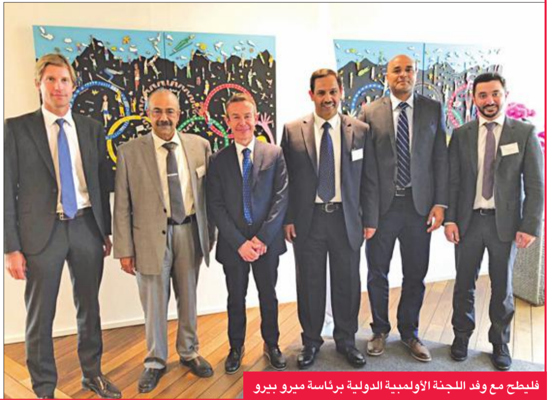
فليطح مع وفد اللجنة الأولمبية الدولية برئاسة بيرو ميرو