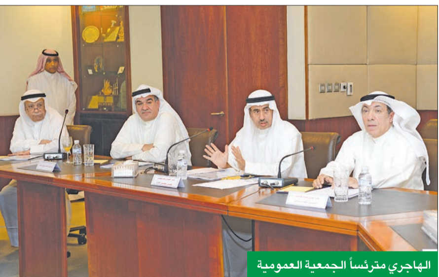
الهاجري مترئساً للجمعية العمومية

عمومية الشركة وافقت على توزيع 10% أرباحاً نقدية