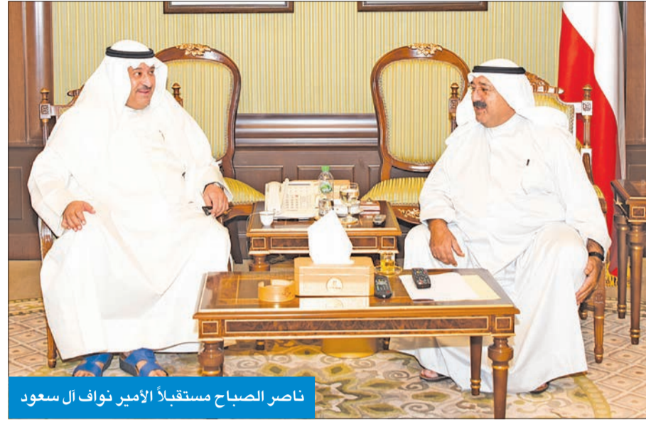
ناصر الصباح مستقبلاً الأمير نواف آل سعود

أقام مأدبة غداء على شرف سفير المملكة المتحدة