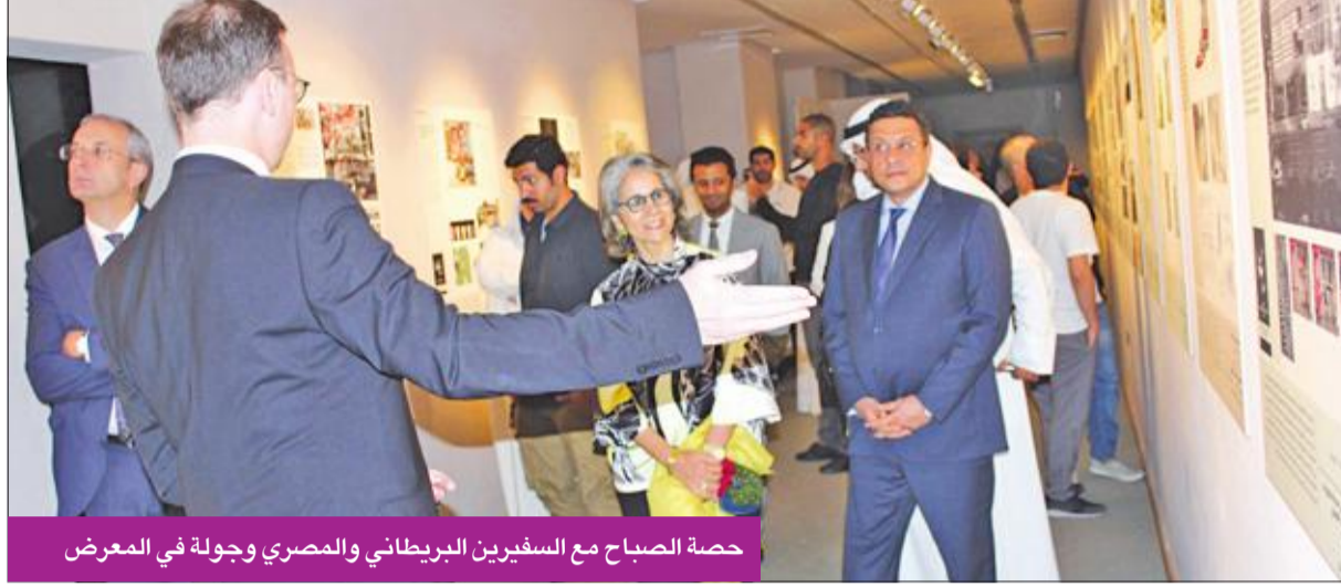
حصة الصباح مع السفيرين البريطاني والمصري وجولة في المعرض

معرض أوسمة رئيس المعهد الملكي يستمر حتى 15 يونيو المقبل بمركز الأمريكي الثقافي