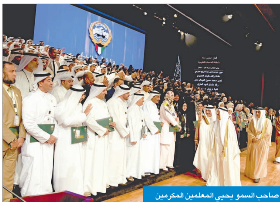
صاحب السمو يحيي المعلمين المكرمين

أكد سمو أمير البلاد الشيخ صباح الأحمد ثقتة بأهل الميدان التربوي، وتحملهم المسؤولية الكبيرة الملقاة على عاتقهم، وبذلهم قصارى جهدهم للمضي قدماً في مسيرة التعليم والنهوض بها، ومتابعة كل جديد في ميادين التطور العلمي، «لا سيما ونحن في عصر التكنولوجيا والعولمة». وعبر سموه، في كلمته خلال حفل تكريم المعلمين المتميزين العاملين في وزارة التربية، على مسرح الهيئة العامة للتعليم التطبيقي والتدريب، أمس، عن سعاده بمشاركة المحترفي بهم في اليوم العالمي للمعلم، وكونه بين أبنائه وبناته في هذا اليوم الذي يعتبر يوم المعلم الكويتي، الذي نكن له كل احترام وتقدير وإجلال، فهو المعلم الذي علم أبنائي وأحفادي وبناءنا وبناتنا، وأفضاله علينا عظيمة لا تنسى، وستظل معنا مستمرة وتلازمنا طوال حياتنا».