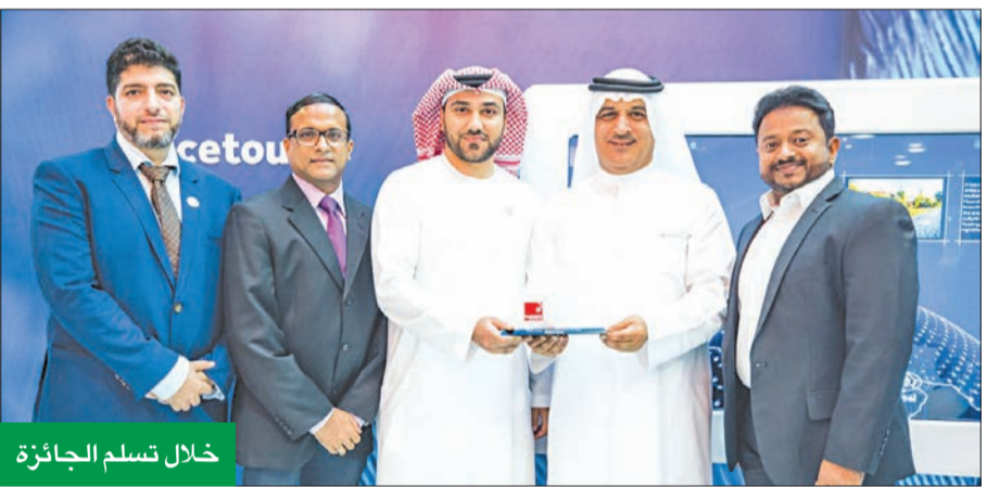
خلال تسلم الجائزة

كرم رئيس مؤسسة مطارات دبي الشيخ أحمد بن سعيد شركة فلاي دبي، تقديراً لجهودها ودعمها لتطوير وتنمية دبي كمركز عالمي للطيران، وتسلم الرئيس التنفيذي للعمليات في «فلاي دبي» حمد عبدالله الجائزة نيابة عن الشركة.