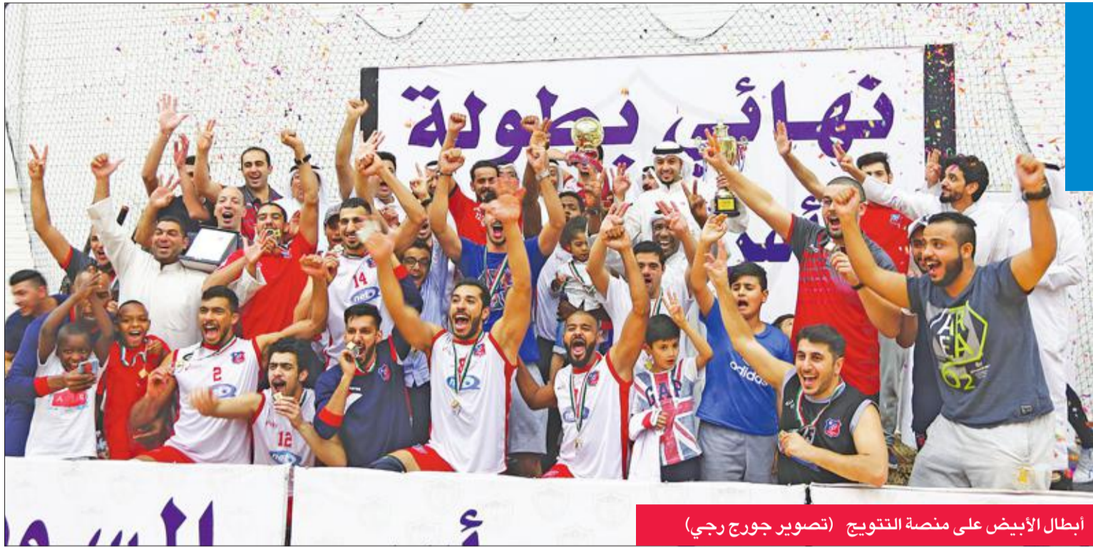
ابطال الأبيض على منصة التتويج