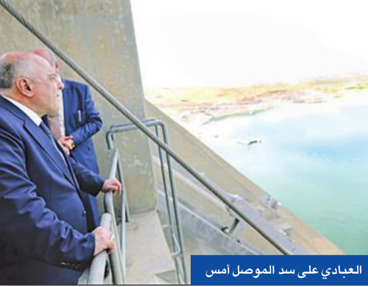
العبادي على سد الموصل أمس

تشجيع البطش في كوالالمبور وقاتلاه لايزالان في ماليزيا