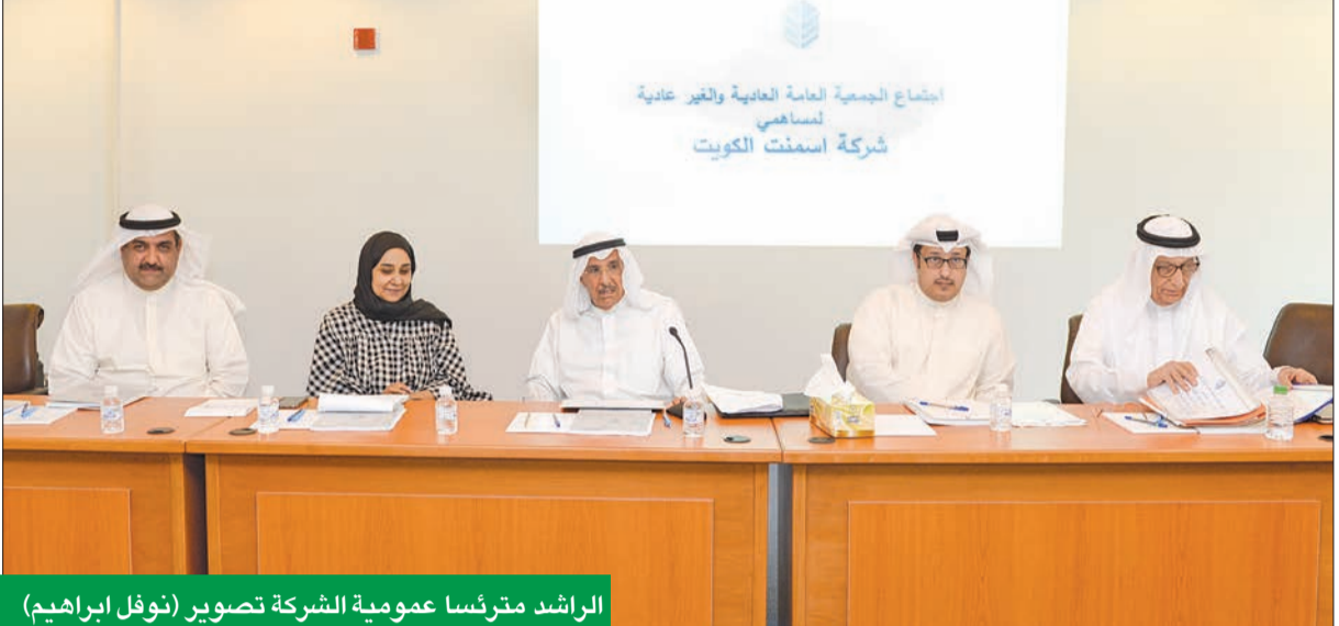
الراشد مترنسا عمومية الشركة

الصناعة الداعم الرئيسي للدولة والمجتمع ويجب تشجيع منتجاتنا الوطنية