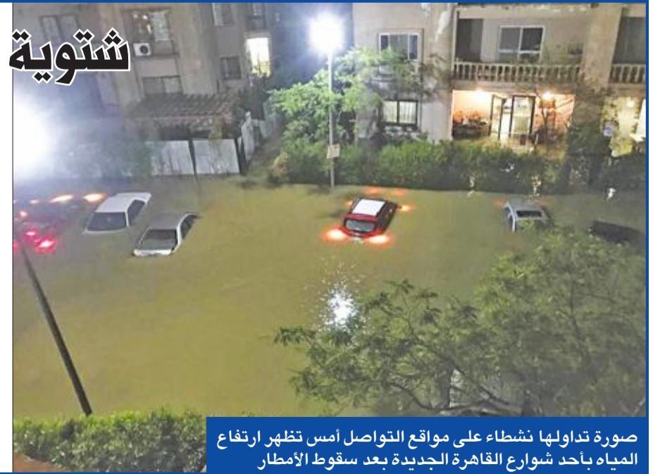
صورة تداولها نشطاء على مواقع التواصل أمس تظهر ارتفاع المياه بأحد شوارع القاهرة الجديدة بعد سقوط الأمطار

ولم تتحرك الجهات المسؤولة في العاصمة إلا صباح أمس بالدفع بسيارات شفط المياه لإزالة تراكمات الأمطار، ورغم أن معظم شوارع القاهرة والحيزة عانت بسبب الأمطار، في ظل غياب منظومة تصريف المياه، وعدم وجود خطة طوارئ، فإن الوضع كان كارثياً في مدينة القاهرة الجديدة، شمالي شرق العاصمة، إذ تجمعت مياه الأمطار في التجمع الخامس، ووصلت إلى ارتفاع نصف متر، في ظل غياب كامل للمسؤولين، فتوالى الاستغاثنات من الأهالي.