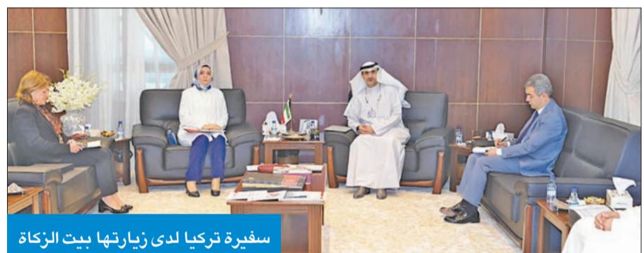
سفيرة تركيا لدى زيارتها بيت الزكاة

التعرف على خدمات «البيت» ومشاريعه المختلفة، وإمكانية الاستفادة من تجربة «الزكاة»، وتدعيم أواصر التعاون المشتركة في مجال العمل الخيري، كما تهدف الزيارة إلى بحث إمكانية تنفيذ مشاريع خيرية للبيت في الجمهورية التركية. وفي ختام الزيارة، أمنت سفيرة تركيا على مسؤولي بيت الزكاة وحفاوة استقبالهم وحسن ضيافتهم، كما أعربت عن عميق شكرها وتقديرها لجميع موظفي «البيت» لقاء الجهود الكبيرة التي بذلوها في سبيل الارتقاء بالعمل الخيري.