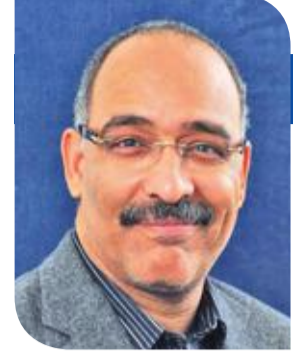
كوارث عربية (2): انتهاك الخصوصية