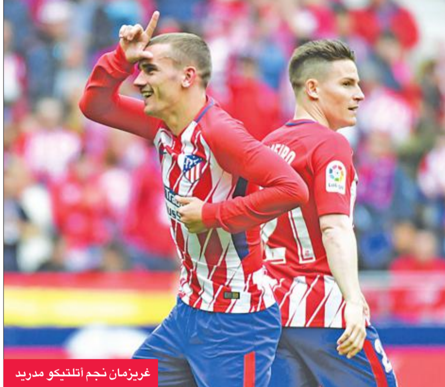
غريزمان نجم أتلتيكو مدريد

مرسيليا، الفريق الفرنسي الوحيد الذي توج بدوري أبطال أوروبا (1993)، عن بلوغ النهائي لخوضه في فرنسا على ملعب ليون في 16 مايو، ويتعين عليه تخطي ريد بول سالزبورغ وصيف بطل 1994. وفي ظل وجود أرسنال وأتلتيكو مدريد في نصف النهائي، لا يعد مرسيليا مرشحا للقب، بيد أن فوزه الكبير على لايبزيغ الألماني 2-5 في أياب ربع النهائي رفع هبة فريق المدرب رودى غارسيا. وأعاد غارسيا، مدرب ليل وروما الإيطالي سابقا، إحياء الفريق المتوسطي بعد استحواذه من الأميركي فرانك ماكورت. وأطلق ماكورت مشروع