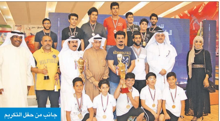
جانب من حفل التكريم

مشيراً إلى المخرجات المتميزة من خلال هذه الأنشطة الهادفة على مستوى المناطق التعليمية. وأعرب عن سعادته بحضور هذا الحفل، نيابة عن وكالة أولياء الأمور والموجهين والمعلمين، التي أسهمت في إنجاح هذه الاحتفالية، مقدماً التهنية للطلبة الفائزين في البطولة، داعياً إياهم إلى أن يباضعوا من جهودهم لخدمة بلدكم محلياً ودولياً.