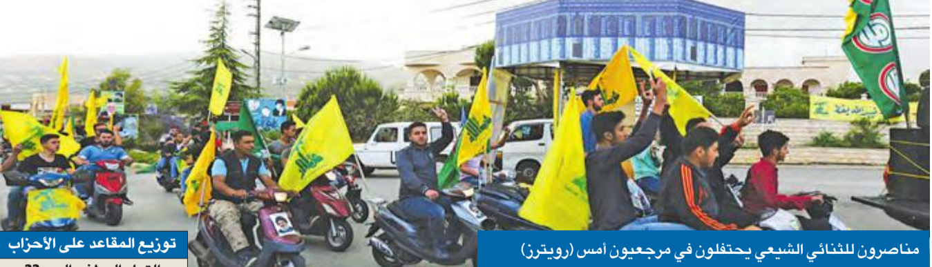
مناصرون للثنائي الشيعي يحتفلون في مرجعيون أمس

نصر الله دعا بعد الانتخابات للبقاء في «ربط النزاع» لحماية الحزب من المقبل