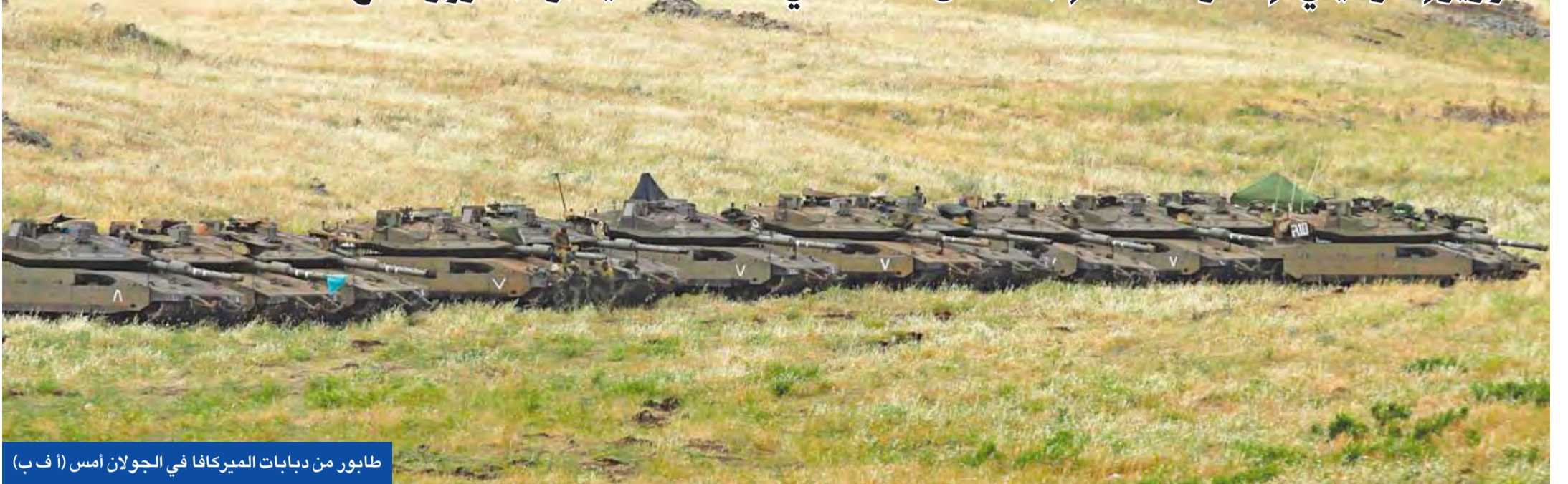
طابور من دبابات الميركا في الجولان أمس

● برلين وباريس تتمسكان بمعاهدة 2015 وجونسون يدعو واشنطن إلى عدم «تحطيم قيود طهران» ● وزير إسرائيلي: إذا أراد أحد الإبقاء على الأسد في السلطة فليخبره بضرورة منع مهاجرتنا