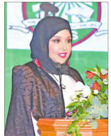
الحشاش تلقي كلمتها