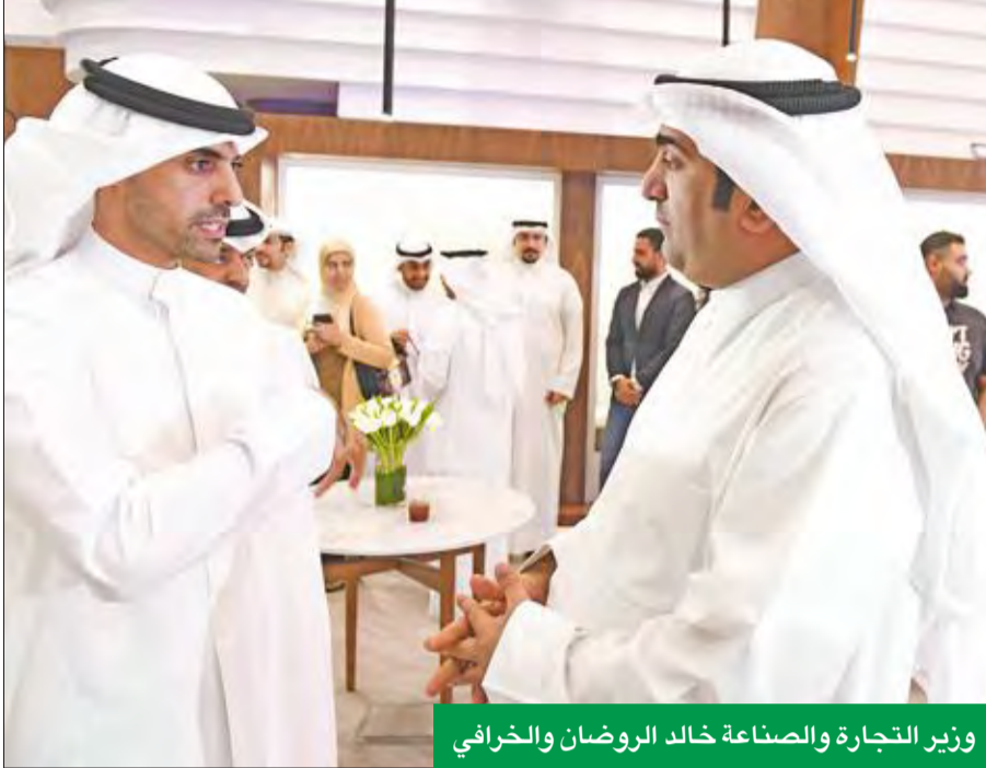
وزير التجارة والصناعة خالد الروضان والخرافي

الخرافي: نعمل على تنمية المجتمع المعلوماتي وتمكين المواطن الرقمي