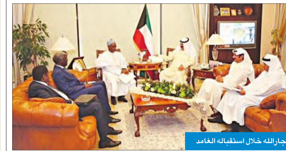
الجارالله خلال استقباله الغامد

التقى نائب وزير الخارجية خالد الجارالله، أمس، رئيس وزراء النيجر السابق د. حامد الغامد، الأمين العام السابق لمنظمة التعاون الإسلامي، سفير النوايا الحسنة للرئيس، الذي يقوم بزيارة للبلاد والوفد المرافق له. وسلم الضيف خلال اللقاء رسالة خطية موجهة إلى سمو أمير البلاد الشيخ صباح الأحمد من