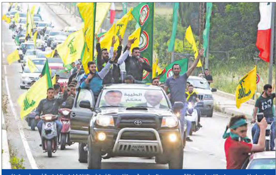
موكب لمناصري «حزب الله» في منطقة مرجعيون الجنوبية يحتفلون بالفوز في الانتخابات النيابية أمس

سلة أخبار نصب لافتات لموقع السفارة الأميركية في القدس نصب عمال، أمس، في القدس أولى الإشارات التي تدل على اتجاه السفارة الأميركية التي ستفتتح أبوابها في 14 من مايو، بعد قرار الرئيس الأميركي دونالد ترامب نقلها إلى القدس والذي رحبت به إسرائيل ودانته المجتمع الدولي. وشوهد عدد من العمال يرتدون ملابس برتقالية اللون وهم ينصبون الإشارات في الشوارع المؤدية إلى مقر السفارة الجديد، التي تقول سفارة الولايات المتحدة باللغات العبرية، والعربية، والإنكليزية. وسيتم تدشين السفارة الأميركية في احتفال الأسبوع المقبل، يتزامن مع الذكرى السبعين لقيام دولة إسرائيل، في التقويم الغريغوري وفي البداية، ستكون السفارة في مبنى الفصيلة الأميركية بالقدس، إلى حين تخطيط وبناء موقع دائم للسفارة، حسب وزارة الخارجية الأميركية.