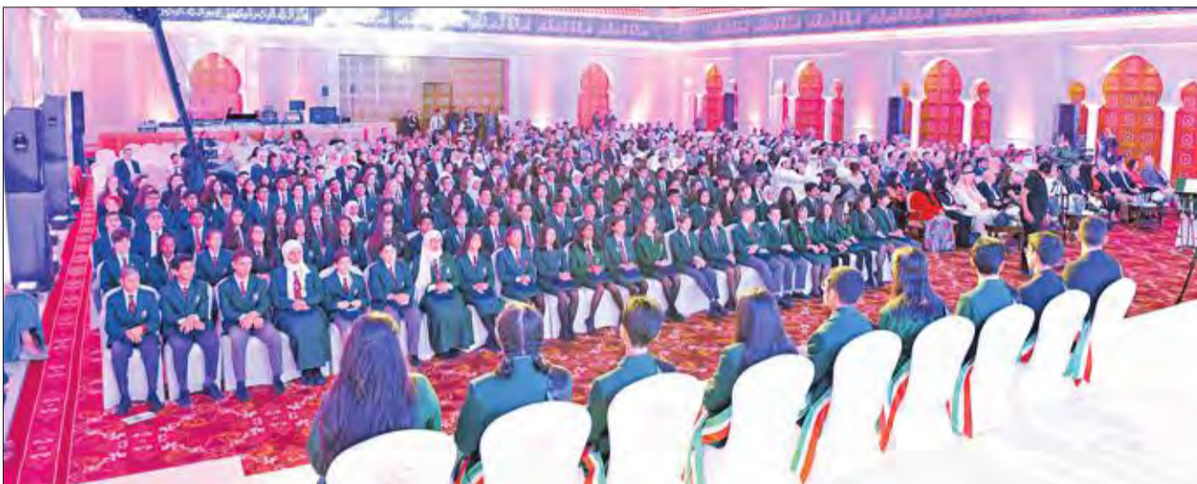
جانب من الطلبة المكرمين