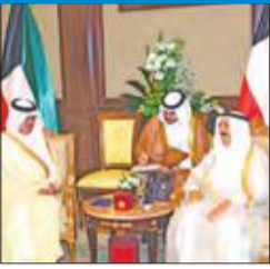
الأمير تسلم أوراق اعتماد سفراء وهنا بوتين ولبنان