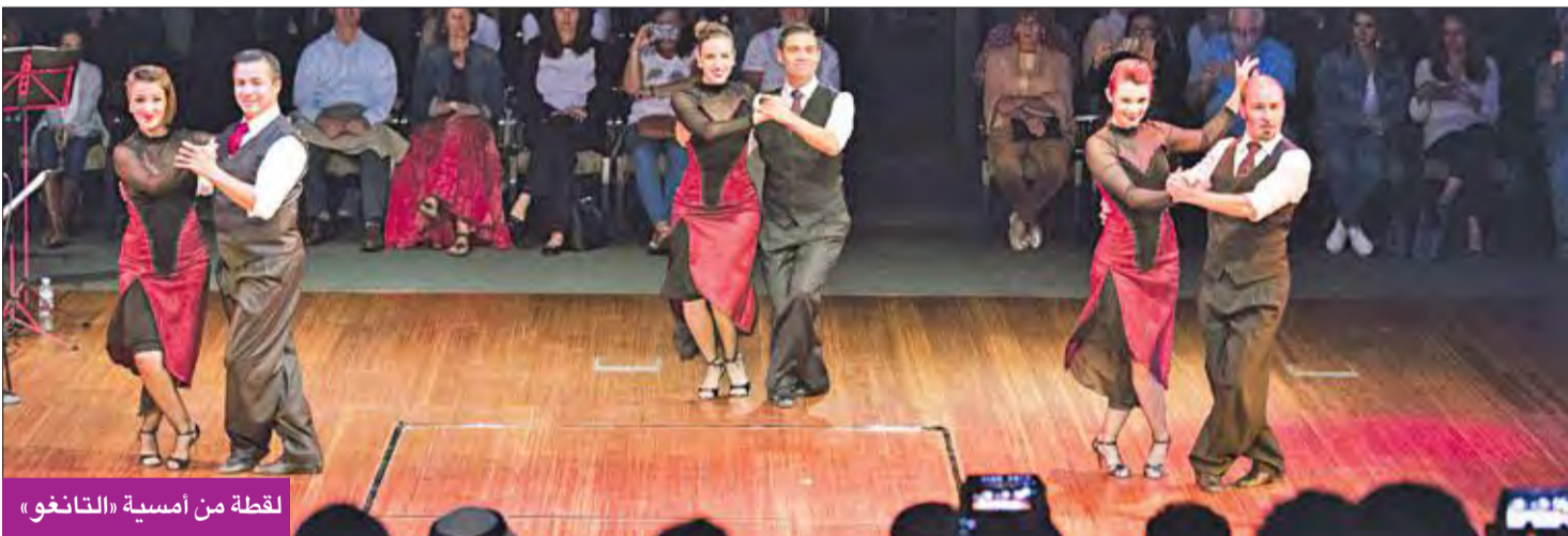
لقطة من أمسية «التانغو»

الفرقتان أحيتا الحفل قبل الأخير لموسم دار الآثار الإسلامية