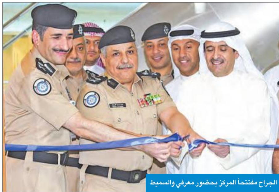
الجراح مفتتحاً المركز بحضور معرفي والسميحي

منذ تطبيق قانون الخدمة الوطنية العسكرية بوزارة الدفاع اللواء الركن محمد الخضّر، أمس، أن الخدمة الوطنية العسكرية ولاء وانتماء وواجب وطني يتطلب التحلي بروح التعاون والتضحية لخدمة هذا الوطن المعطاء.