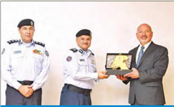
البلديص مكرماً أحد المشاركين بحضور العقيد الأمير