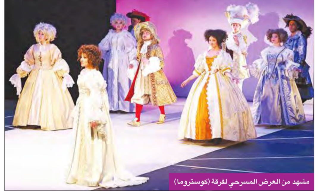
مشهد من العرض المسرحي لفرقة (كوستروما)

من المدن الروسية بكناسها القديمة وبمتحف الفن المعماري الخشبي في الهواء الطلق. وتستقبل الكنيسة الزوار ليصل بهم طريق مرصوف إلى قرية تُذكر بالحياة الروسية القديمة. وصار هذا المكان محلاً للنزهة يقصده كبار والصغار، كما تقام فيه حفلات وفعاليات الأعراس.