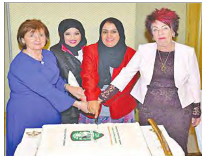
قطع كعكة الاحتفال