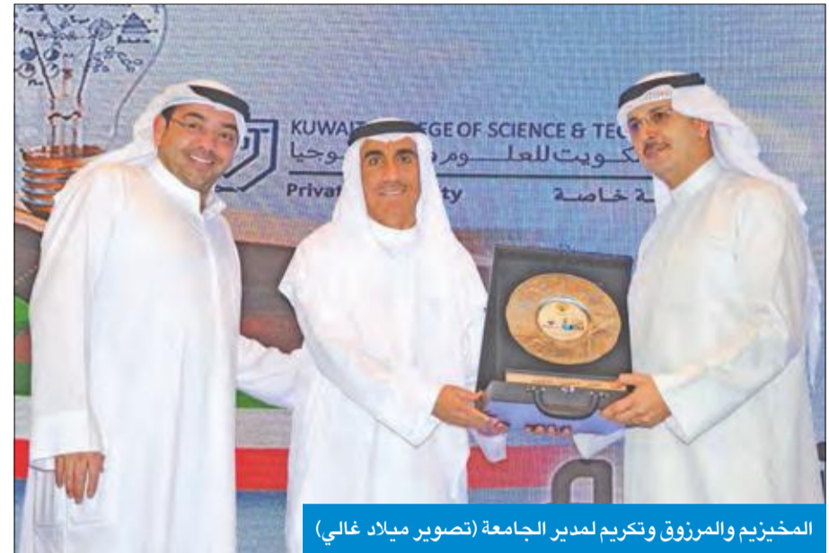
المخيزيم والمرزوق وتكريم لمدير الجامعة

لحصر جديد تتكامل فيه مراحل التربية والتعليم.