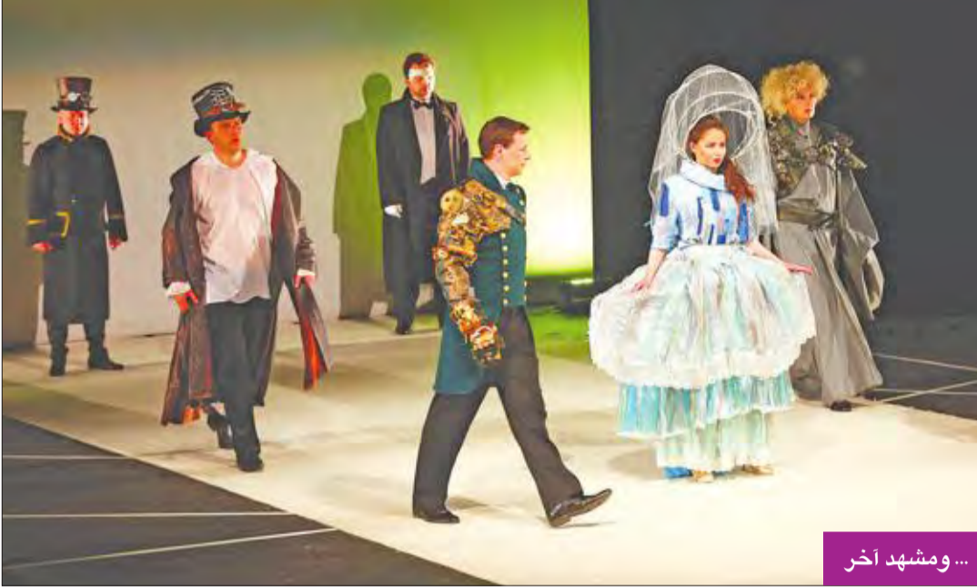
... ومشهد آخر

جيرنا ودوفنسكي أديا مقاطع من أوبرا «الناي السحري»