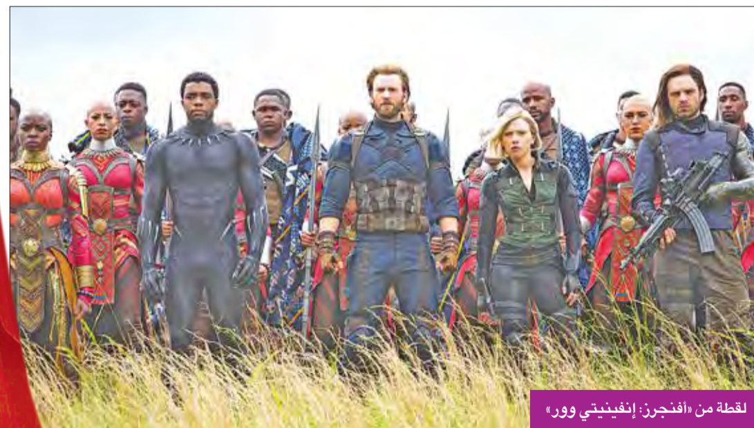
لقطة من «أفنجرز: إنفينيتي وور»

وكانت المرتبة العاشرة من نصيب «باد سامارين» الذي جنى في الأسبوع الأول من عرضه في 1.7 مليون دولار. (أ ب)