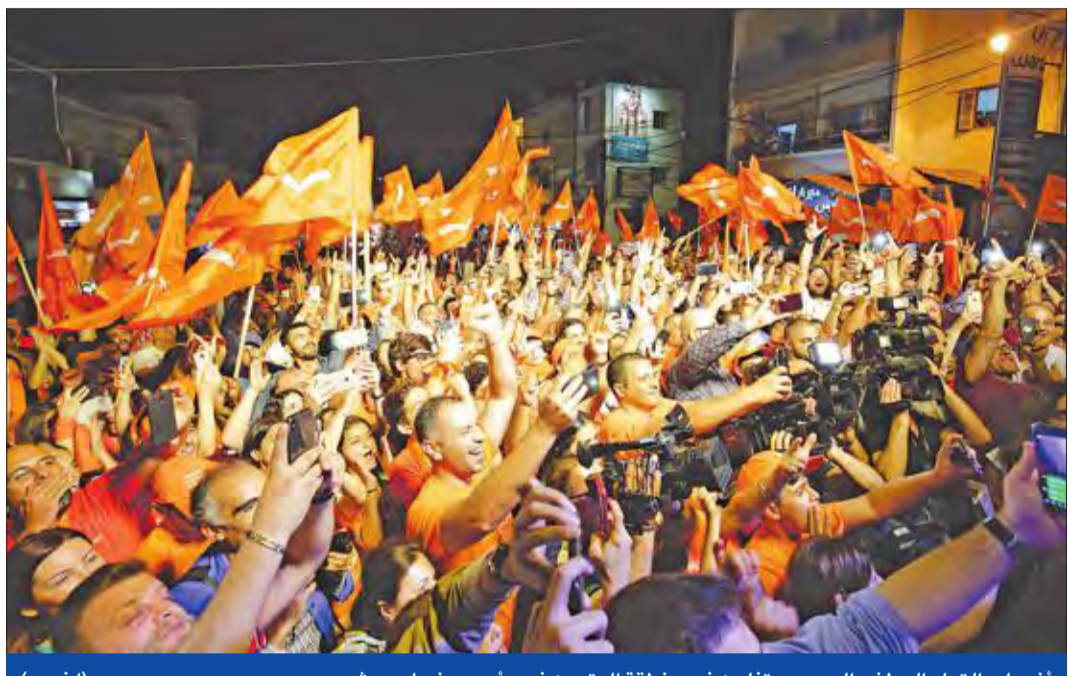
انصار «التيار الوطني الحر» يحتفلون في منطقة البترون فجر أمس بنجاح مرشحهم