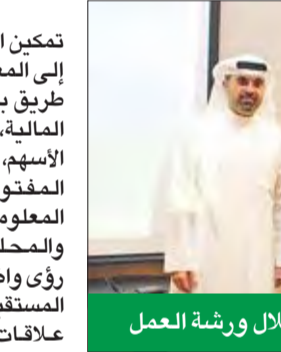
لقطة خلال ورشة العمل