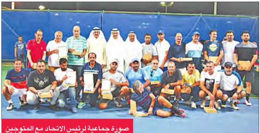
صورة جماعية لرئيس الاتحاد مع المتوجين

وفي الترتيب النهائي للأندية المشاركة في البطولة، جاء في المركز الأول خيطان برصيد 306 نقاط، وفي المركز الثاني اليرموك برصيد 217 نقطة، وحل الكويت ثالثاً برصيد 125 نقطة، وفي المركز الرابع كاظمة برصيد 81 نقطة، وفي المركز الخامس نادي السلمية برصيد 57 نقطة، وفي المركز السادس نادي القادسية برصيد 40 نقطة، وفي المركز السابع نادي الساحل برصيد 20 نقطة، وفي المركز الثامن نادي الشباب برصيد 14 نقطة، وفي المركز التاسع نادي التضامن برصيد 10 نقاط، وفي المركز العاشر نادي الصليبيخات برصيد 9 نقاط. وفي الترتيب النهائي لكأس التفوق العام ونقاطه احتفظ اليرموك بالمركز الأول برصيد 40 نقطة، كما احتفظ خيطان بالمركز الثاني برصيد 26 نقطة، بينما جاء في المركز الثالث نادي السلمية برصيد 17 نقطة، وجاء في المركز الرابع نادي الكويت برصيد 11 نقطة، وفي المركز الخامس نادي كاظمة برصيد نقطتين.