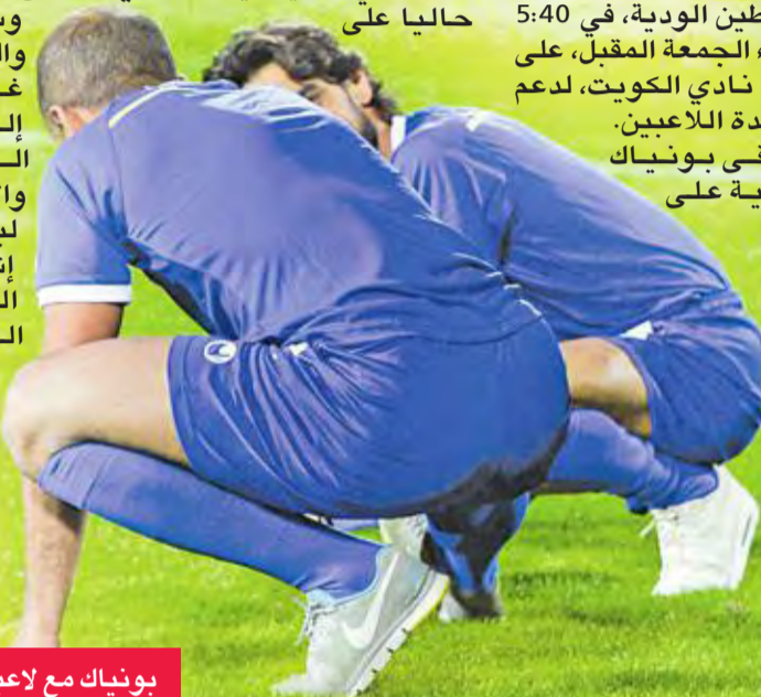
بونياك مع لاعبي الأزرق في «خليجي 23»

تواجد مدرب الجهاز السابق الصربي بوريك بونياك في تدريب المنتخب الوطني الأول لكرة القدم مساء الأربعاء، في 5:40 مساءً الجمعة المقبل، على استاد نادي الكويت، لدعم ومساندة اللاعبين، والتقى بونياك التحية على