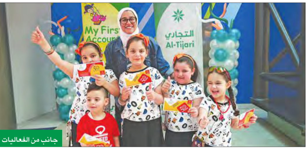
جانب من الفعاليات

للعلاء الصغار، ما ساهم في جعل اليوم المفتوح حدثاً لا ينسى بالنسبة لعملاء حسابي الأول. وبعتر البنك التجاري الكويتي إذ يشكر عملاءه الصغار وأسره على تلبية الدعوة وحضور فعاليات اليوم الترفيهي المفتوح، ويعددهم بالعمل على تنظيم العديد من الفعاليات الأخرى لتوطيد التواصل بينه وبين عملاءه الصغار وأصحاب حسابي الأول الذي يعد حساب توفير مصمماً خصيصاً للأطفال حتى 14 سنة، ويعتبر الطريقة المثلى لأبناء والأمهات الذين يرغبون في تأمين مستقبل أفضل لأبنائهم وتوفير الأموال لهم في مراحلهم العمرية المبكرة.