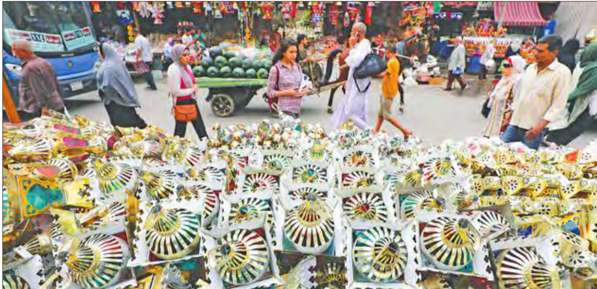
مصريون يمشون أمام بائع فوانيس رمضان في القاهرة

تعديل قانوني يفتح الطريق لـ «حزب الأغلبية»... والبرلمان يسمح لـ «أوبر وكريم» بالعمل نهائياً