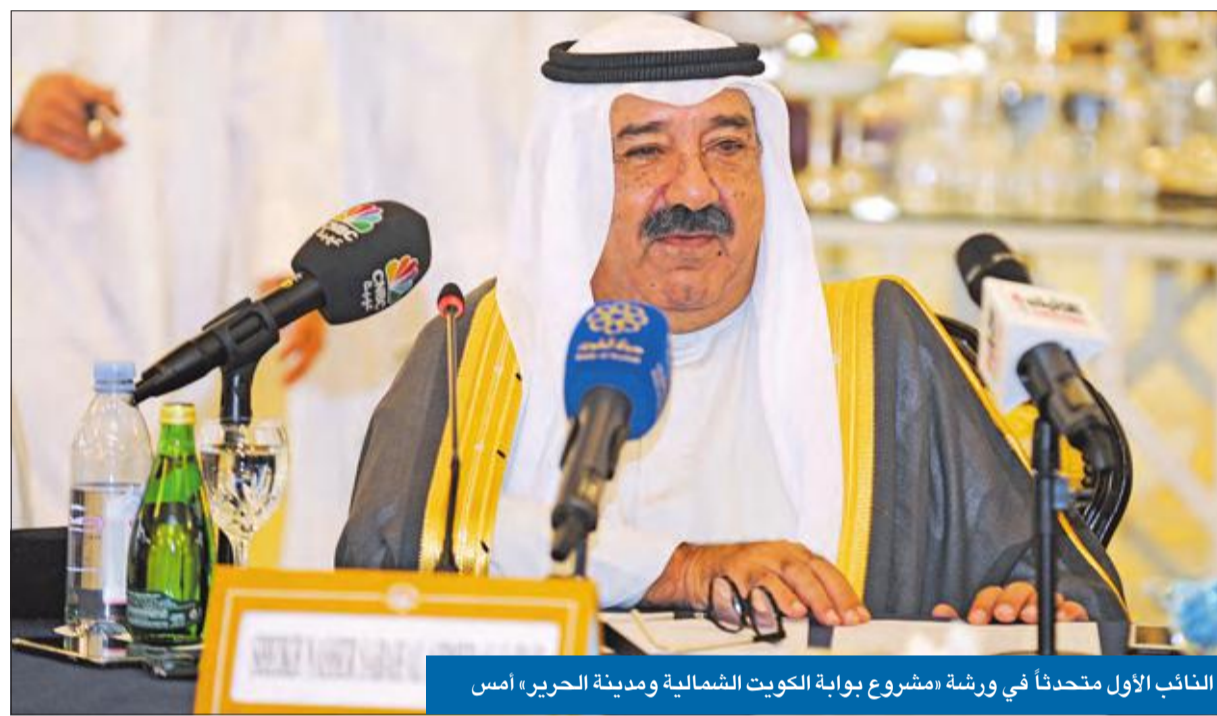
النائب الأول متحدثاً في ورشة «مشروع بوابة الكويت الشمالية ومدينة الحرير» أمس

أكد النائب الأول لرئيس مجلس الوزراء وزير الدفاع الشيخ ناصر الصباح، أن تحدياً كبيراً يواجه الكويت في تنفيذ مشروع تطوير شمال البلاد ومدينة الحرير الكن إرادتنا أكبر من ذلك بكثير». وقال الصباح، في كلمة خلال افتتاح ورشة عمل نظمها مكتب البنك الدولي، أمس، إن «دول آسيا الوسطى تحتاج إلى مساعدات للوصول إلى باقي أجزاء العالم، ونحن نود أن نوفر لها مخرجاً يساعدها على التواصل والوصول إلى العالم، مؤكداً «أننا قادرون بهذا المركز الإنساني العالمي على خدمة أمم كثيرة مثل جنوب روسيا ومنغوليا وإيران». ورأى أن مشروع الحرير «ليس مجرد رؤية، بل هو واقع الكويت منذ ما قبل اكتشاف النفط، معقياً: «ورغم أنه مازال في بدايته، لكن الكثير من الحماس يغمرنا للتفاعل الاجتماعي والسياسي معه»، إذ من شأنه أن «يجعل الكويت مرفأً يصل منطقة آسيا الوسطى وجنوب روسيا ومنغوليا ببقية دول العالم»، لاسيما أن تلك المنطقة تحتوي على عناصر شتى تؤهلها لتكون مثل هونغ كونغ أو سنغافورة. وأضاف: «نطمح إلى استغلال جبال البحر الأحمر السعودية والعقبة الأردنية، إذ تتضمن هاتان المنطقتان معادن عديدة يمكن استخراجها والعمل عليها». بدوره، أعرب مدير مكتب البنك الدولي في الكويت والشرق الأوسط وشمال إفريقيا فراس رعد عن فخر البنك بالشراكة مع الكويت، مؤكداً أن هذه الورشة تركز على التجارب العالمية في آسيا، وبالتحديد في سنغافورة وهونغ كونغ وجبل علي والعقبة وجنوب أميركا، للاستفادة منها في الكويت.