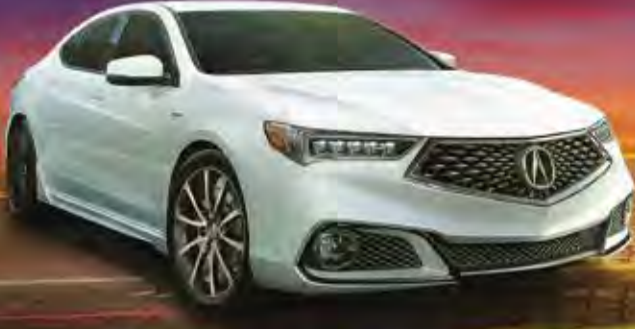
TLX 2018 القسط شهري 199 دك