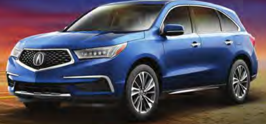
MDX 2018 القسط شهري 233 دك