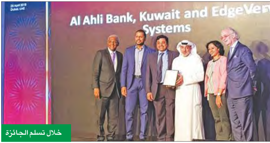
خلال تسلم الجائزة

تأتي جائزة التميز لتؤكد النهج الإيجابي الذي يتبعه البنك الأهلي الكويتي تجاه الابتكار في مجال الخدمات المصرفية المبتكرة. وتحت مظلة «إنفوسيس فيناكل» التابعة لشركة «إنفوسيس»، جائزة مرموقة عن فئة «أفضل مبادرة لا ابتكار تطبيق أو برنامج مصرفي أساسي لبنك ناشئ في الشرق الأوسط لعام 2018»، خلال حفل توزيع جوائز «ذا آسيان بانكر» للابتكار في مجال التكنولوجيا المالية. وتم تقديم الجائزة ضمن حفل خاص أقيم بديهي في 25 أبريل، أثناء انعقاد مؤتمر مستقبل القطاع المالي في الشرق الأوسط وإفريقيا 2018، ويقام الحفل السنوي لتكريم أفضل المنتجات والخدمات المصرفية المتميزة في المنطقة، وتحظى بتقدير واسع النطاق في الصناعة المصرفية.