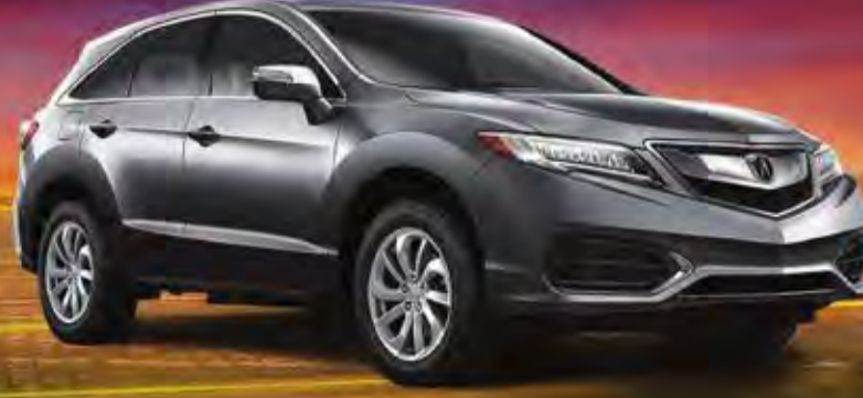
RDX 2018 القسط شهري 199 دك