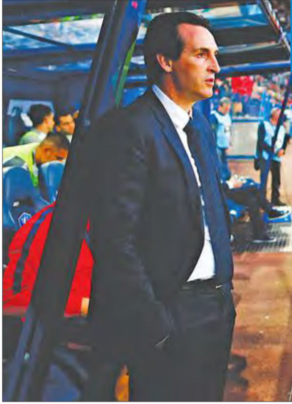
إيمري مدرب باريس سان جرمان

سيكون باريس سان جرمان أمام فرصة توديع مدربه الإسباني أوناي إيمري بأفضل طريقة من خلال منحه الثلاثية المحلية، بفوزه الثلاثاء بلقب كأس فرنسا لكرة القدم على حساب المتواضع ليزيربييه، الذي أصبح أول فريق من الدرجة الثالثة يخوض النهائي منذ 2012. وبعد أن توج بلقب كأس الرابطة للموسم الخامس تواليا بفوزه على موناكو 3-صفر في المباراة النهائية، استعاد سان جرمان لقب الدوري من نادي الإمارة بالذات، ويبدو مرشحا فوق العادة لإكمال الثلاثة والفوز بالكأس للمرة الرابعة تواليا وال11 في تاريخه. وتوج سان جرمان بلقبه الأولين لهذا الموسم دون نجمه الجديد البرازيلي نيمار، الذي غاب عن الملاعب منذ مطلع مارس بعد خضوعه لعملية جراحية من معالجة كسر في مشط القدم اليمنى، وسيخوض نهائي الثلاثاء من دونه أيضا، لكنه