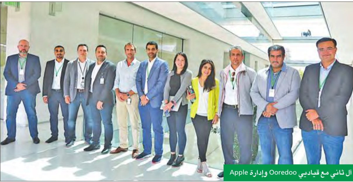
أل ثاني مع قياديي Ooredoo وإدارة Apple

إطار استراتيجية Ooredoo نحو عصر الرقمنة واستخدام التكنولوجيا الرقمية كعامل أساسي لإثراء تجربة العميل وتطوير نطاق الخدمات المقدمة.