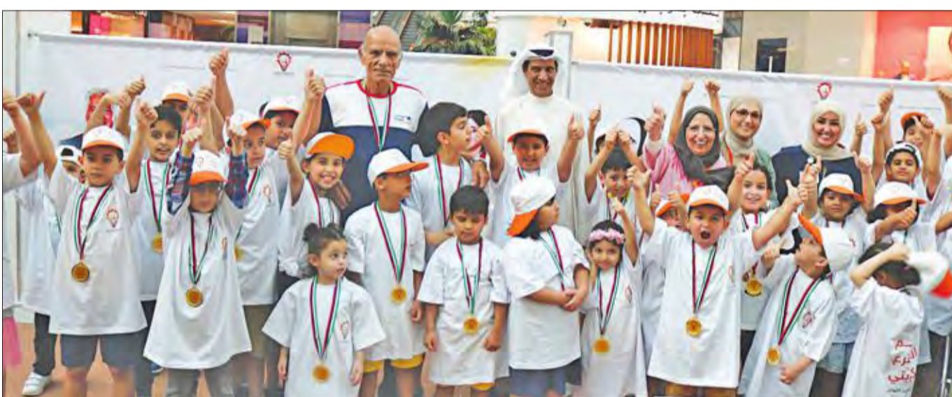
عدد من الأطفال المشاركين في الماراثون