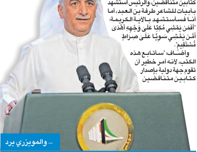
... والموزيرى يرد

الغانم بالمرکز الإعلامي بمجلس الأمة ضمن ردوداً تفصيلية على تصريحات الموزيرى