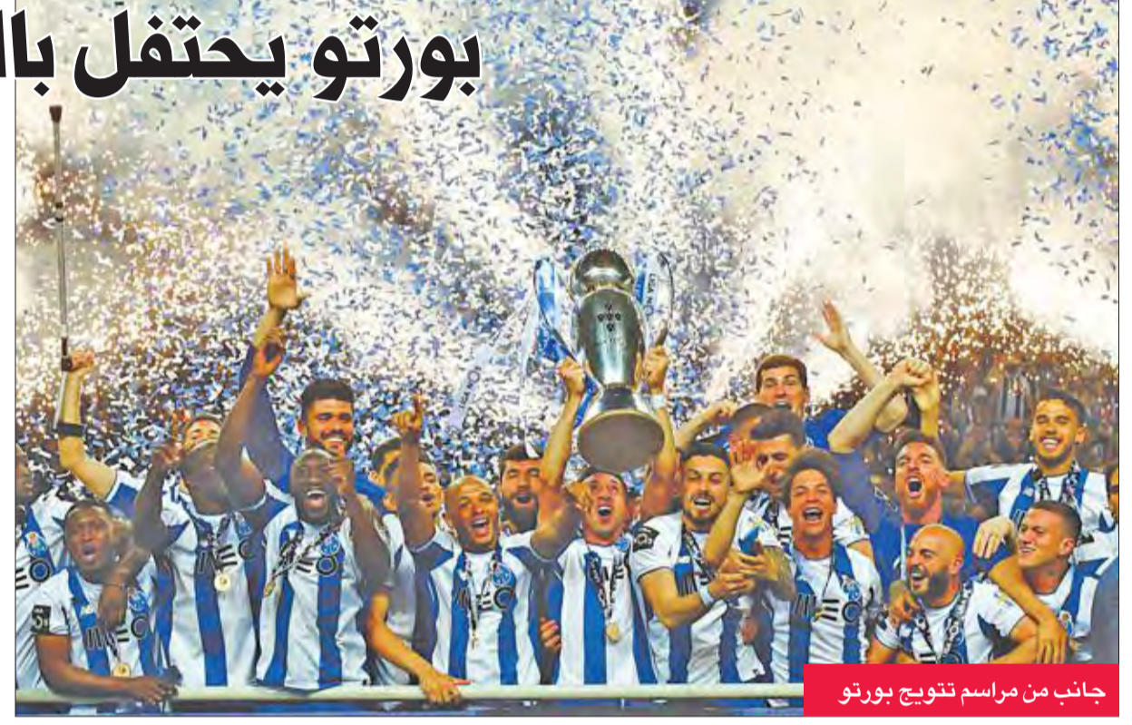
جانب من مراسم تتويج بورتو

وعزز بورتو مركزه كثاني أكثر الأندية البرتغالية القابا بعد بنفيكا (36 لقباً) الذي احرز البطولة المحلية منذ عام 2014 قبل أن ينتزعها منه بورتو.