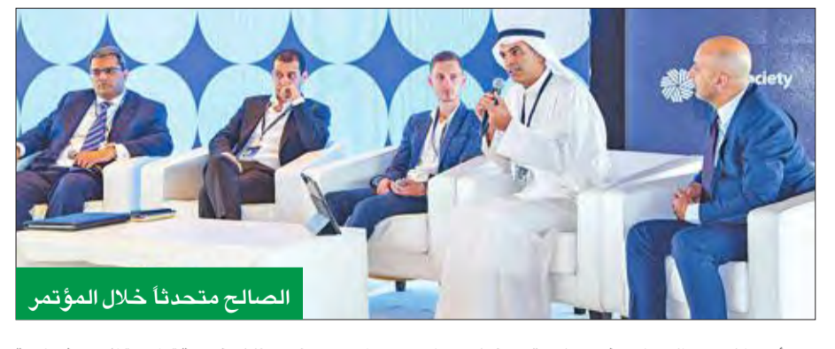
الصالح متحدثاً خلال المؤتمر

استعرض ذلك خدمة «وايز» الاستثمارية الإلكترونية الأولى من نوعها في الكويت، والتي تم إطلاقها في سبتمبر 2017، وهي خدمة إدارة المحافظ الاستثمارية للعملاء الأثرياء، والتي تساهم على تنويع استثماراتهم والاستثمار في الأسواق الدولية بطريقة سهلة وشفافة وفعالة من حيث التكلفة. واستطرد: «توفر خدمة وايز محافظ استثمارية متنوعة وفقاً للأهداف الاستثمارية الخاصة بكل عميل، وفترة الاستثمار، إلى جانب القدرة والاستعداد لتحمل المخاطر، كما تمنح خدمة وايز العملاء إمكانية الاطلاع على المحفظة الاستثمارية في أي وقت وفي أي مكان، من خلال الخدمات المصرفية الإلكترونية، أو تطبيق الهاتف الذكي، بشكل يتسم بالسهولة والأمان، وبدون تكلفة، أما بالنسبة لرسوم إدارة المحفظة فهي تدفع سنوياً». وجمع مؤتمر إيكو شخصيات من جميع أنحاء العالم لمناقشة الفرص والإمكانات الحديثة التي تقدمها التكنولوجيا، كما وفر للمشاركين فيه فرصة لمناقشة تقنيات البلوك تشين مع المعنيين بها حول العالم، وشكل المؤتمر كذلك منصة تعليمية تهدف إلى رفع الوعي بأحدث التطورات والتحديات الخاصة بالقطاع وبهذه التكنولوجيا تحديداً.