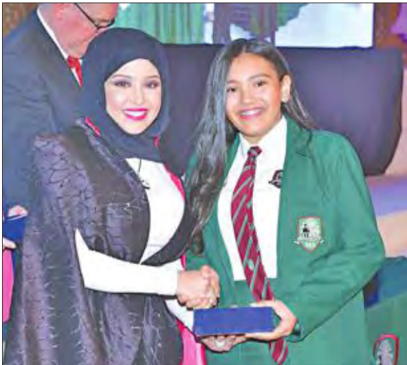
تكريم طالبة متفوقة