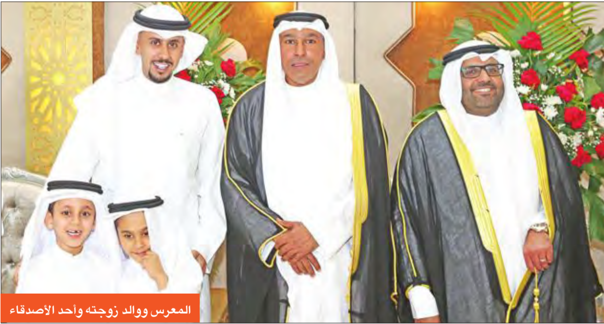
المعرس ووالد زوجته وأحد الأصدقاء