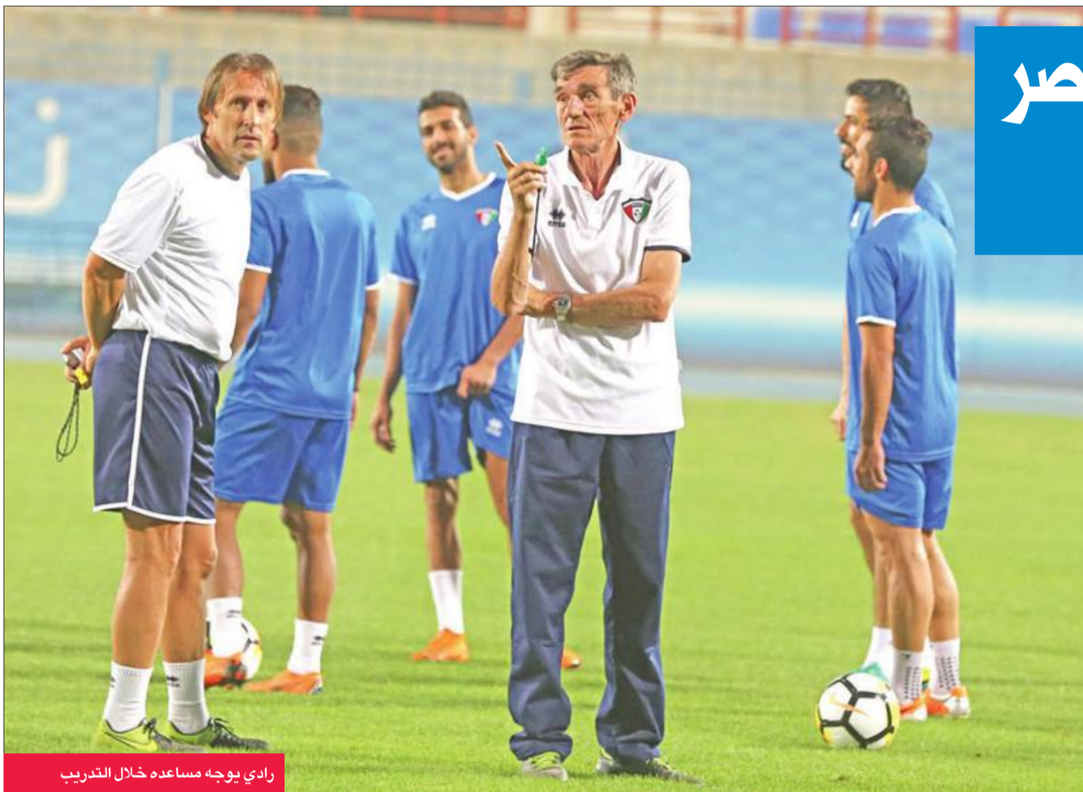
رادي يوجه مساعده خلال التدريب