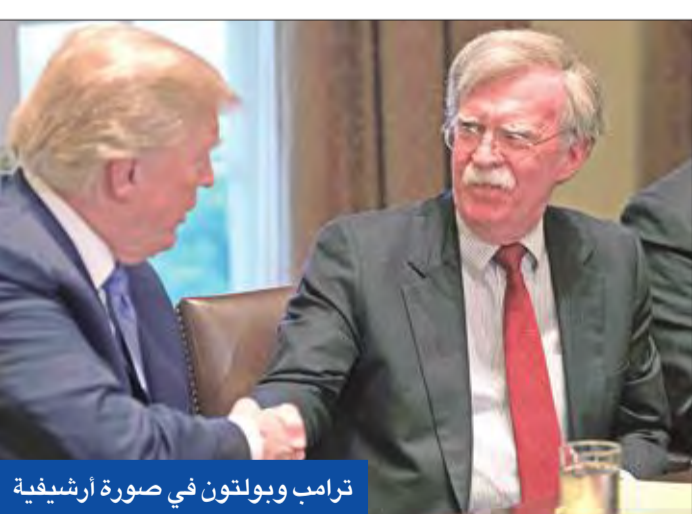
ترامب وبيولتون في صورة أرشيفية