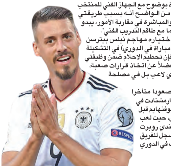
فاغنر يعتزل دولياً بعد استبعاده عن تشكيلة ألمانيا

أعلن المهاجم الألماني ساندر فagner اعتزاله اللاعب دولياً بعد استبعاده عن التشكيلة الأولى لمنتخب بلاده التي ستشارك في مونديال روسيا 2018 في كرة القدم. وقال فagner (30 عاماً) أمس الأول لصحيفة "بيلد" المحلية: "انسحب فوراً من المنتخب الوطني، أكون كاذباً إذا قلت إنني لست محبطاً، كأس العالم كانت ستشكل أمراً رائعاً". ولم يستدع المدرب يواكيم لوف هذا المهاجم الذي سجل 5 أهداف في 8 مباريات دولية إلى التشكيلة الأولى لمنتخب المانشافت بطل العالم 2014. وكان فagner، الذي حمل اللوان هوفنهايم حتى يناير الماضي، يامل الحصول على فرصة المشاركة في المونديال، خصوصاً بعد انتقاله الشتاء الماضي إلى صفوف بايرن ميونخ بطل الدوري. لكن بحسب التشكيلة التي أعلنها لوف، يبدو أن تيمو فرنر سيكون أساسياً، والمخضرم ماريو غوميز خياراً ثانياً في مركز رأس الحربة.