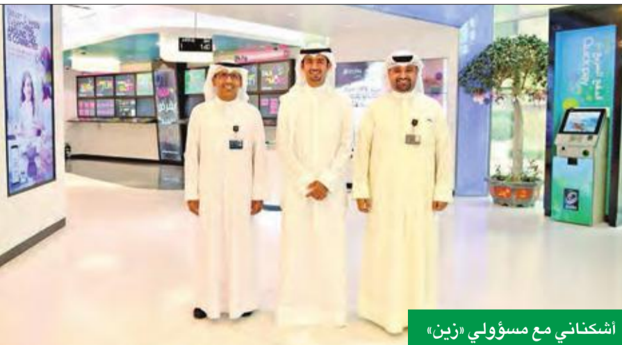
أشكناي مع مسؤولي «زين»

Cup العالمية من أبرز بطولات سباقات السيارات حول العالم وأكثرها تحدياً، ويقود جميع المشاركين في البطولة الطراز الأخير من سيارة بورشه 911 «جي تي 3 كاب»، وهي مزودة بمحرك سعة 4 ليترات بولت قوة 357 كيلوواط (485 حصاناً)، ما يجعل هذه السيارة الأقوى في تاريخ سلسلة السباقات أحادية الصنع الأخرى في العالم، ويستخدم جميع السائقين إطارات واحدة والوقود نفسه لضمان حصول كل منهم على فرص متساوية في التسابق.