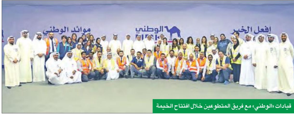
قيادات «الوطني» مع فريق المتطوعين خلال افتتاح الخيمة

التقت الإدارة التنفيذية فريق المتطوعين من موظفي بنك الكويت الوطني، واطلعت منهم على ما تم إنجازه من أعمال، وأشادت بجهودهم الجليلة التي يبذلونها خلال الشهر الفضيل.