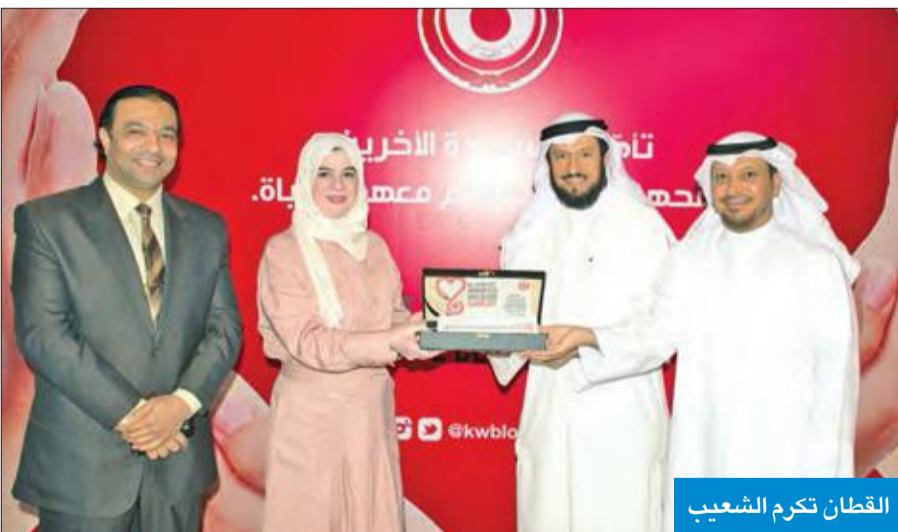
القطن تكريم الشعب