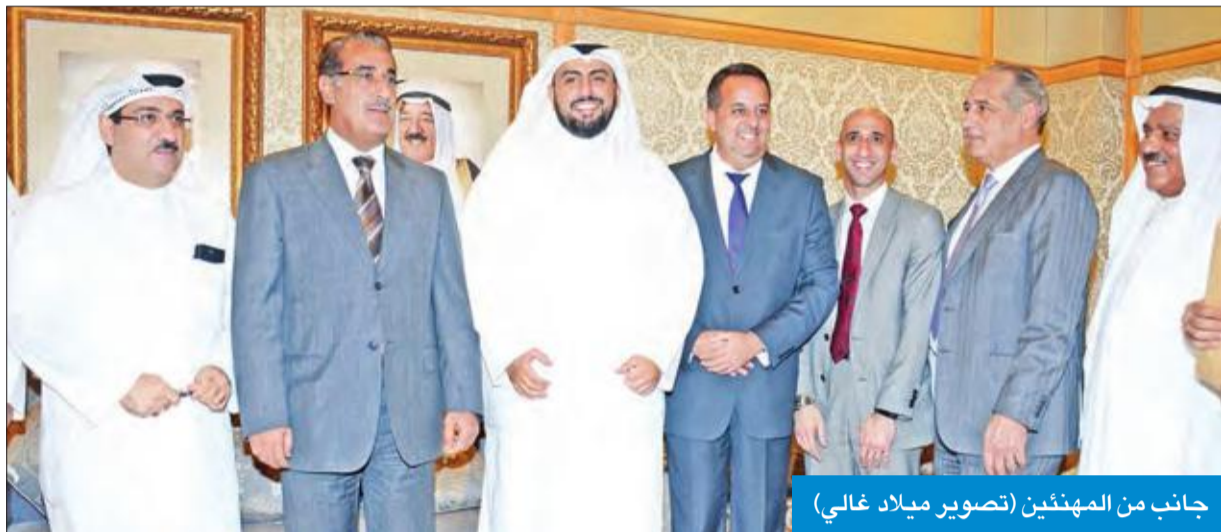
جانب من المهنيين

العازمي: خفض معدلات إرسال المرضى للعلاج بالخارج وآلية جديدة وفق المعتمديات المالية