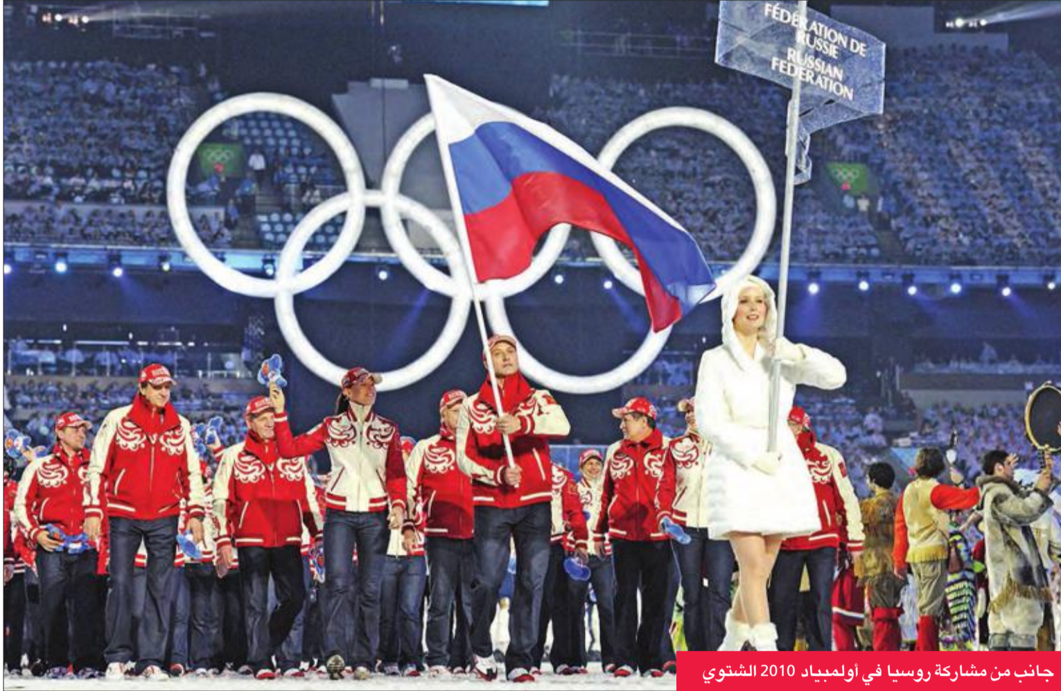
جانب من مشاركة روسيا في اولمبياد 2018 الشتوي

بمكافحة المنشطات، لاسيما من قبل مكالارين، ما عرض الرياضة الروسية لعقوبات شتى. وأكد الرئيس الروسي فلاديمير بوتين في مارس الماضي انه سيواصل الدفاع عن شرف الرياضة الروسية، علما بأنه سبق له ان وعد بإصلاح نظام مكافحة المنشطات في بلاده.