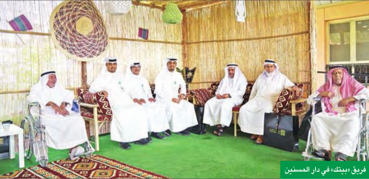
فريق «بيتك» في دار المسنين

الالتزام برسالته الاجتماعية والإنسانية، بما يرسخ مفهوم المسؤولية الاجتماعية، ويهدف إلى دعم مبادرات العمل التطوعي والإنساني، انسجاماً مع القيم الاجتماعية وتعزيزاً لأهداف التنمية المستدامة.