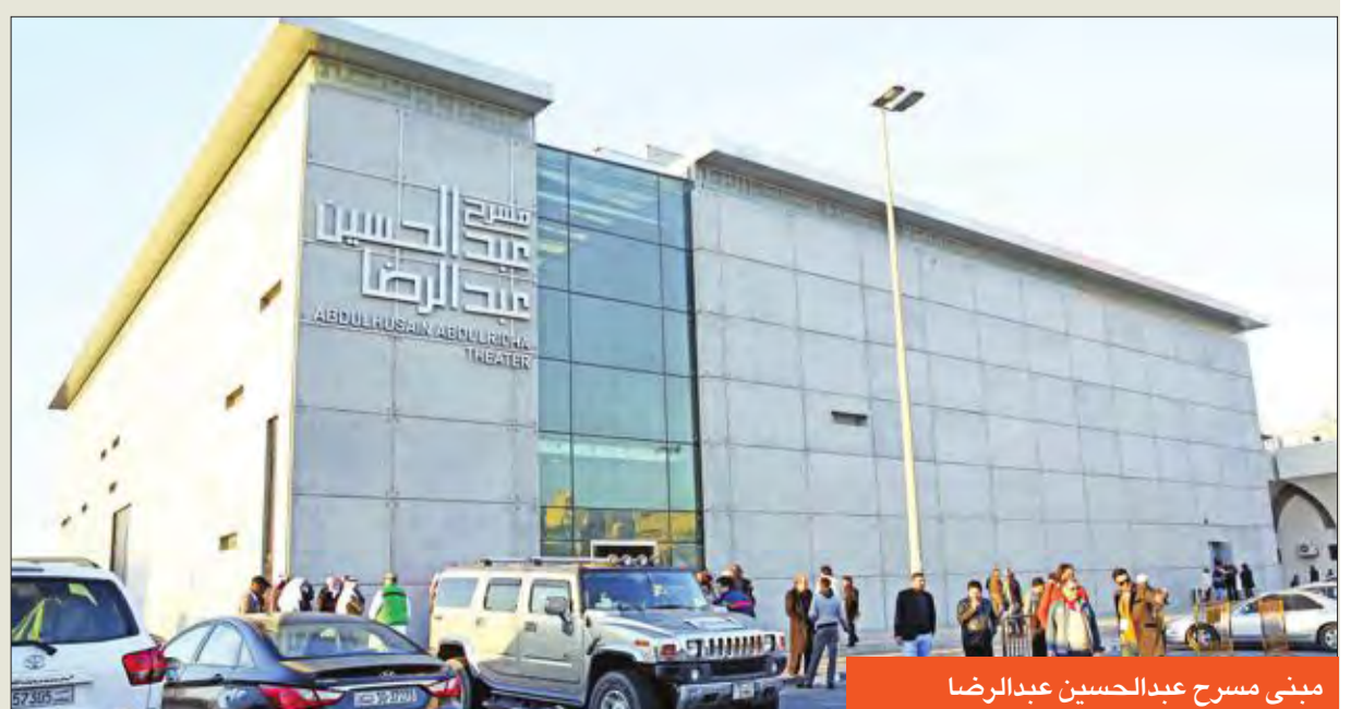
مبنى مسرح عبدالحسين عبدالرضا

وقال الجويعة، إن الفنان عبدالحسين عبدالرضا قامه فنية عالية، وله دور كبير في مسيرة المسرح، وجسد شخصيات فنية بارزة أسعدت الملايين من عشاق الفن، سواء على خشبة المسرح أو في الشاشة الصغيرة. وأشار إلى أن موافقة رئيس مجلس الوزراء سمو الشيخ جابر المبارك، ودعم وزير الإعلام رئيس المجلس الوطني للثقافة والفنون والآداب الشيخ سلمان الحمد (في ذلك الوقت) كان لهما الأثر الكبير في اعتماد مبادرة المسارح الأهلية بإطلاق اسم الفنان الكبير على أحدث مسارح الدولة وهو مسرح السالمية.