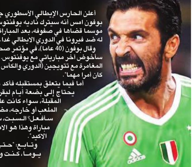
بوفون يعلن رحيله عن يوفنتوس

أعلن الحارس الإيطالي الأسطوري جانلويجي بوفون أمس أنه سيتترك نادي يوفنتوس بعد 17 موسماً قضاها في صفوفه، بعد المباراة الختامية له ضد فيرونا في الدوري الإيطالي غداً. وقال بوفون (40 عاماً)، في مؤتمر صحفي: "غداً، سأخوض آخر مبارياتي مع يوفنتوس. إنهاء هذه المغامرة مع توتو جين (بوفون والكاس والمطبخ) كان أمراً مهماً". أما فيما يتعلق بمستقبله، فأكد بوفون أنه يخطط للبقاء في صفوفه، سواء كانت على أرضية الملعب أو خارجه، مضيفاً: "ماذا سأفعل؟ السبت، سأخوض مباراة وهذا هو الأمر الوحيد الأصيل". وتابع: "حتى قبل 15 يوماً، كنت واثقاً من