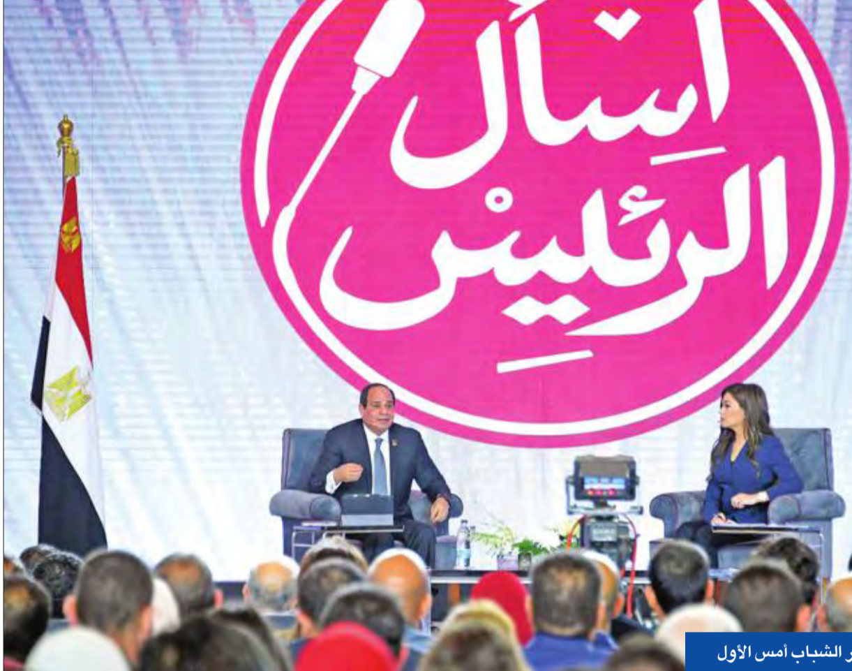
السياسي خلال مؤتمر الشباب أمس الأول

وأنه من المهم فتح كثير من الأسواق للتصدير وخفض الاستيراد لمعالجة عجز الموازنة، داعياً العاملين في الاقتصاد غير الرسمي للدخول في منظومة الاقتصاد الرسمي، مقابل إعفائهم من الضرائب لمدة 5 سنوات. وتطرق السيسي إلى المنظومة الجديدة للتعليم التي أقرت أخيراً، قائلاً إن الدولة حريصة على توفير تعليم جيد، منتقداً تصدي بعض الأهالي لتطبيق الاستراتيجية الجديدة، ووافياً إلى أنها خضعت لمعايير صارمة ودراسات مستفيضة، وأشار إلى أن هناك مئات الآلاف الذين يتخرجون من الجامعات في وقت لا يحتاج سوق العمل إلى مؤهلهم، والنتيجة الخريجين من الجامعات المصرية، متوعداً بمحاسبة بعض وسائل الإعلام التي تسعى إلى تاجيح الفتن وترديد معلومات مغلوطة.