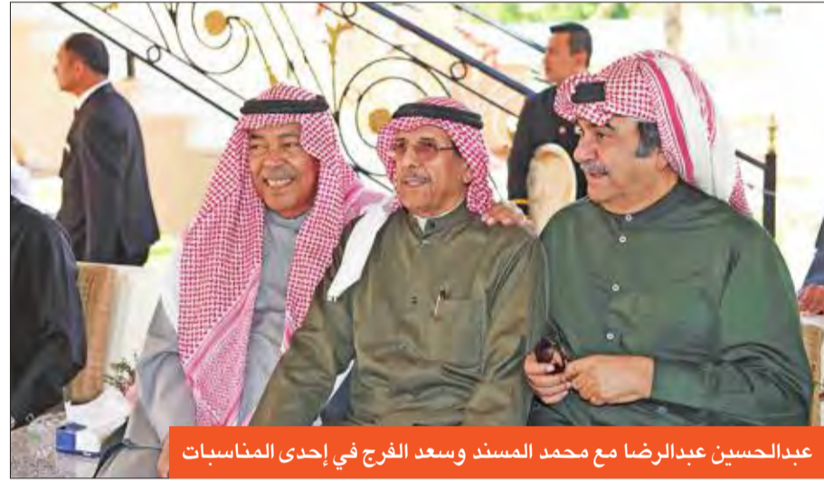
عبدالحسين عبدالرضا مع محمد المسند وسعد الفرج في إحدى المناسبات

لم يعد المشاهد أو المستمع في دولة الكويت أو الخليج غياب الفنان عبدالحسين عبدالرضا خلال الدورة الرمضانية، لأن الراحل كان شديد الحرص على الإطلالة الرمضانية، سواء تلفزيونياً أو إذاعياً. نظراً لارتباط أعماله بهذا الشهر الكريم منذ عقود. وإن كان شهد غيابه في فترات سابقة فلاسباب صحية أو عدم توافر عمل جيد يطل من خلاله على مريديه. ومع حلول شهر رمضان تقرب من الذكرى الأولى لرحيل النجم الكبير بوعدنان، الذي فقدته محبوه في شهر أغسطس من العام الماضي، و«الجريدة» تستذكر علق الكوميديا الخليجية عبر