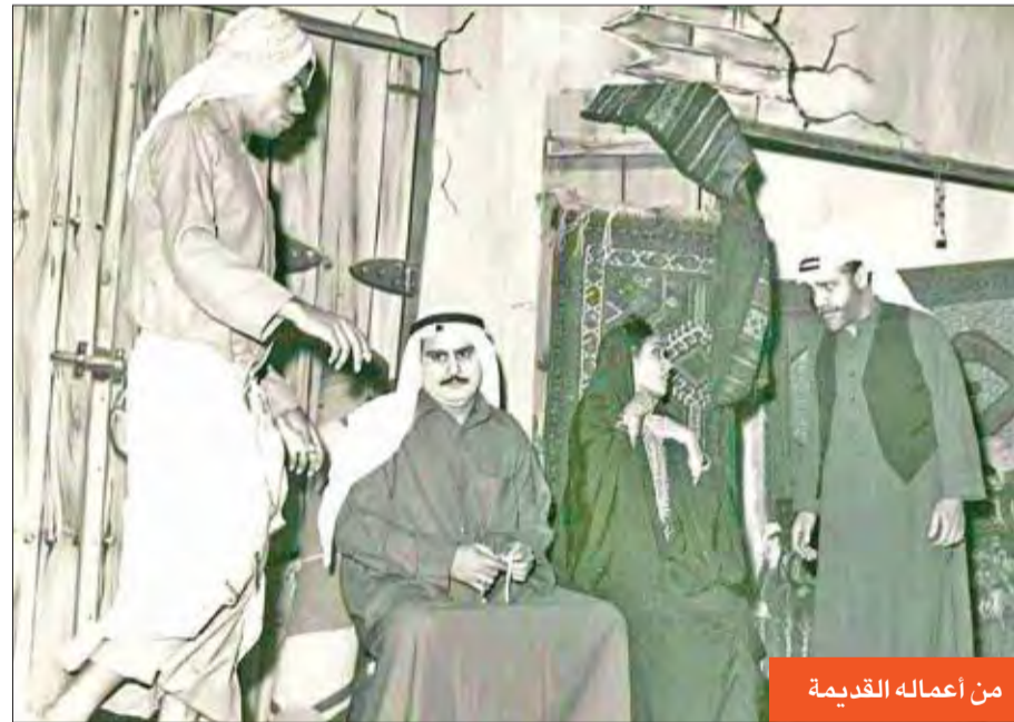
من أعماله القديمة

حسين يتعرض إلى أزمة نفسية عقب زواج والدته من بوصالغ