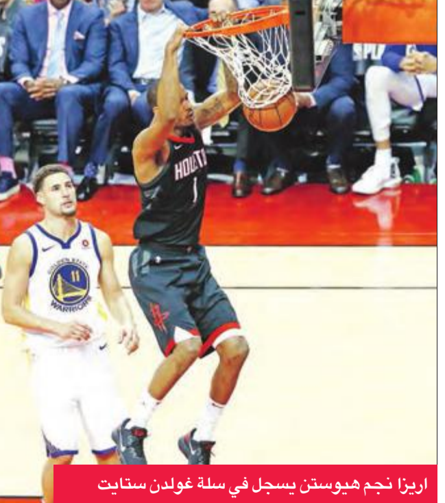
أريزا نجم هيوستن يسجل في سلة غولدن ستايت

ثار هيوستن روكس لخسارته امام منافسه غولدن ستايت ووريز بطل الموسم الماضي والحق به خسارة قاسية 105-127 في المباراة الثانية من نهائي البالي أوف في المنطقة الغربية للدوري الأميركي للمحترفين في كرة السلة ليدرك التعادل 1-1. وكان هيوستن سقط على أرضه في المباراة الأولى 106-119 الانثين.