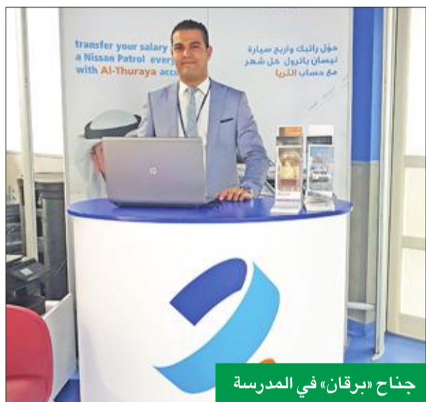
جاثرا «برقان»، في المدرسة

الحديثة والتقنيات المستخدمة، لتحفيز ملكة الإبداع عند المعلمين، بحضور نحو 100 معلم من مختلف مدارس الكويت. ونظراً لنجاح ورشة العمل استضاف البنك د. ريتشارد كاش ليقدم ورشة عمل خاصة لموظفي «برقان» تحت عنوان «الإبداع في مكان العمل». وحضر البنك خلال فترة الورشة في مدرسة دسمان، لعرض مختلف منتجاتها وخدماتها المصرفية المتكاملة للمعلمين.