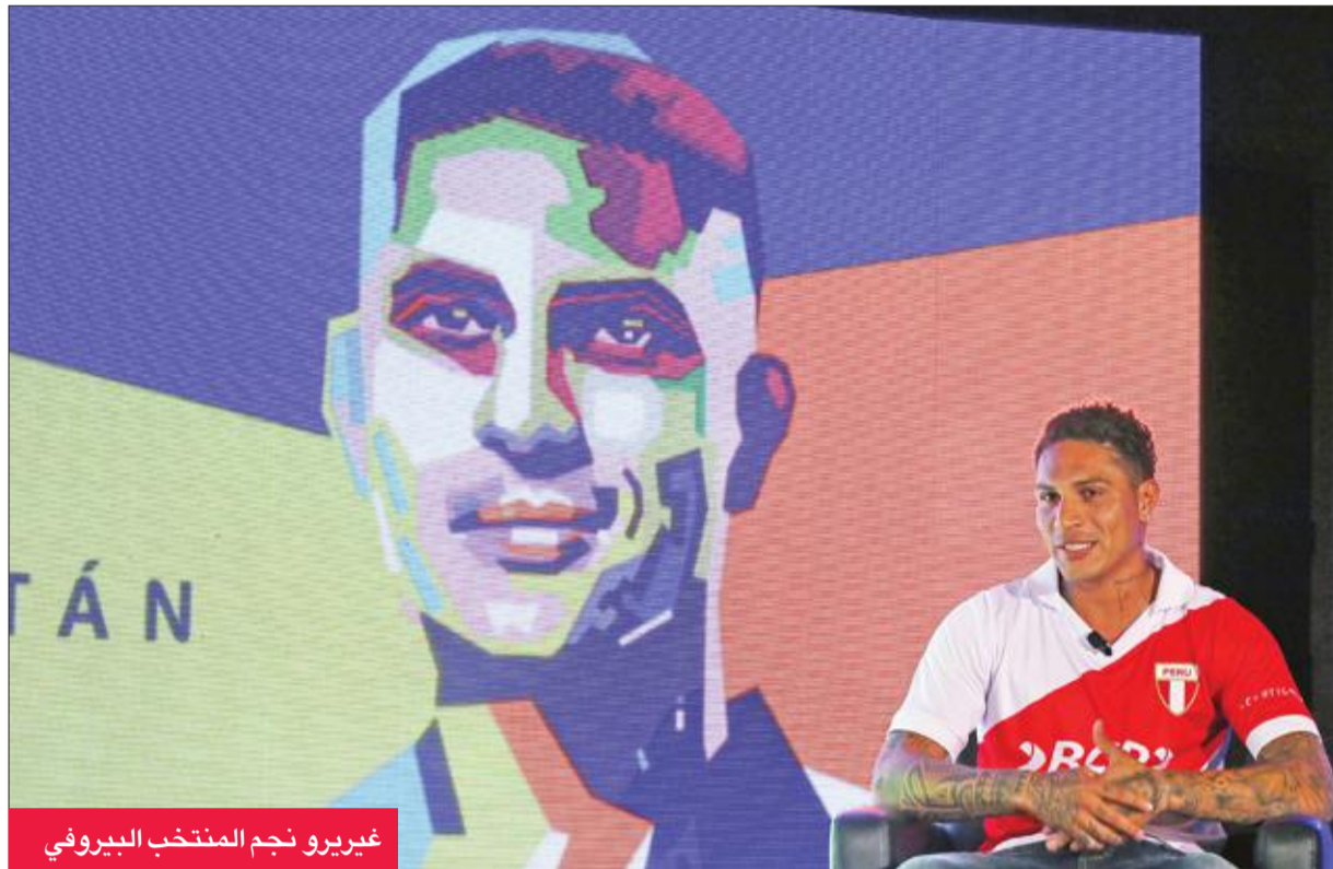
غيريرو نجم المنتخب البرازيلي

أقدم قائد منتخب البيرو لكرة القدم باولو غيريرو على محاولة أخيرة للمشاركة مع منتخب بلاده في نهائيات كأس العالم 2018، بتقدمه بطلب استئناف أمام محكمة سويسرية لإلغاء عقوبة الإيقاف المفروضة بحق، حسبما أفاد الاتحاد المحلي للعبة. وكانت محكمة التحكيم الرياضي "كاس" قررت في 14 مايو رفع عقوبة الإيقاف التي فرضت بحق غيريرو لتبويت وجود مادة كوكايين في فحص منشطات خضع له، من ستة أشهر إلى 14 شهرا، مما سيؤدي إلى حرمانه من خوض مونديال روسيا بين 14 يونيو و15 يوليو. وتقدم المهاجم غيريرو المدعوم في مساعاه من سلطات بلاده، بطلب الاستئناف إلى المحكمة الفدرالية السويسرية، وهي الوحدة المخولة بنقض قرارات "كاس" التي تتخذ من مدينة لوزان السويسرية مقرا لها. وقال رئيس الاتحاد البيروفي إدوين أوفيدو، في بيان أصدره ليل الجمعة: "تمنا بذلك على أمل أن نرى باولو في كأس العالم، هذا يعكس شعور الاتحاد البيروفي لكرة القدم وكل البلد". ونأتي الخطوة بعد أيام من زيارة أوفيدو وغيريرو لرئيس الاتحاد الدولي (فيفا) جاني إنفانتينو الذي أبدى تفهمه لـ "خيبة أمل" اللاعب، لكنه شدد على أن "العقوبة فرضتها محكمة التحكيم الرياضي بعد استئناف مقدم ضد قرار من هيئة قضائية مستقلة في الفيفا". وذلك بحسب الاتحاد الدولي. وكان الفيفا قرر في ديسمبر الماضي تقليص عقوبة