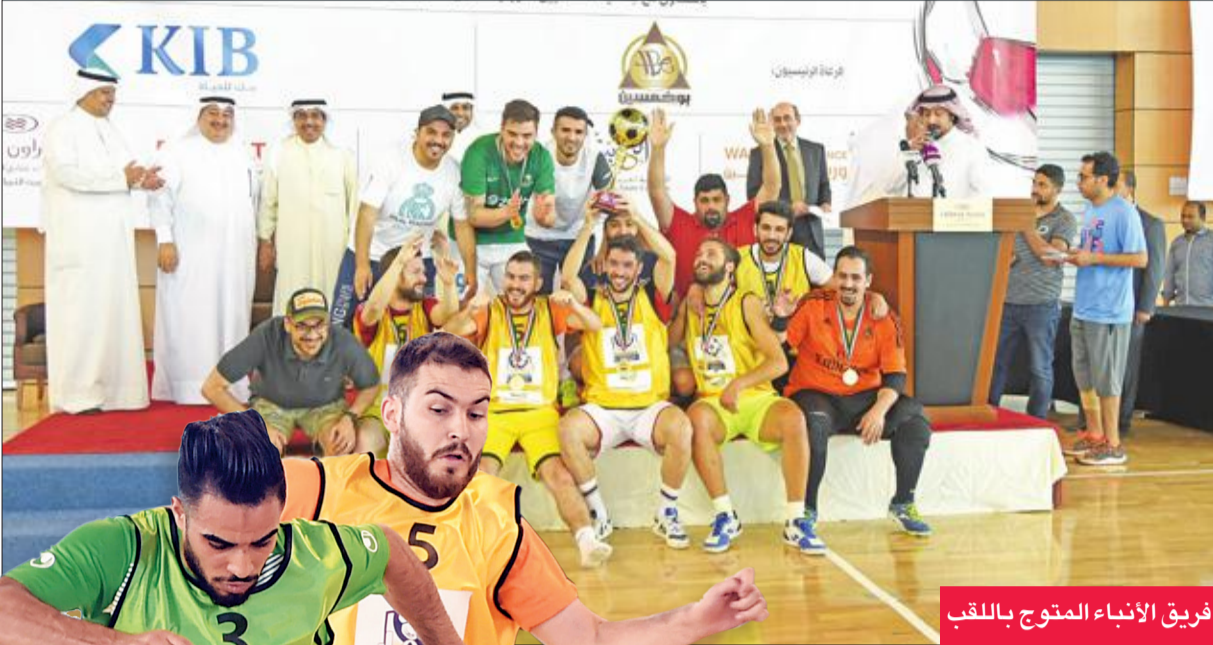
فريق الأبناء المتوج باللقب