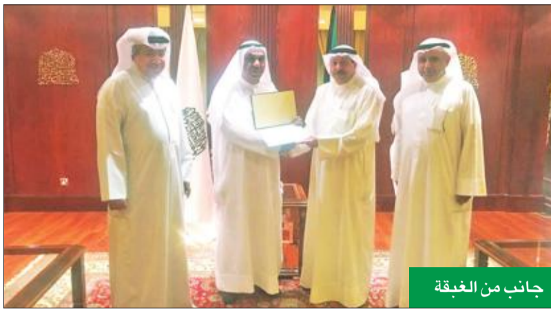
جانب من الغبقة

أقام غبقة الرضائية السادسة وكرّم رئيسه السابق