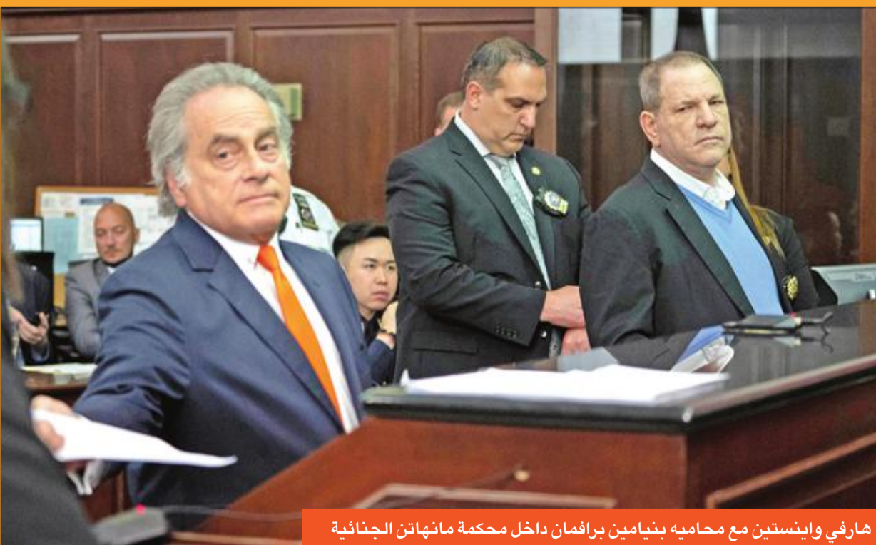
هارفي واينستين مع محاميه بنيامين برافمان داخل محكمة ماتهاتن الجنائية

النفوذ في عالم الأعمال والحكومة وصناعة الترفيه بسوء السلوك الجنسي.