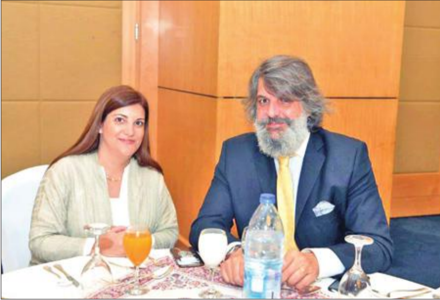
من ضيوف الغبقة