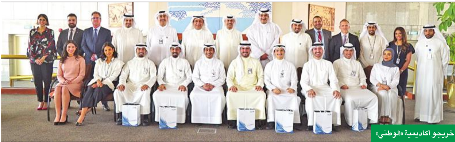
خريجو أكاديمية «الوطني»

العلباني: البرنامج نجح في إثراء البنك بأجيال متعاقبة من الكوادر الوطنية المؤهلة