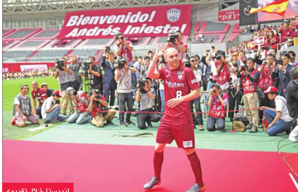
إنيسستا خلال تقديمه

قدم نادي فيسل كوبي الياباني لاعبه الجديد أندريس إنيسستا بإقامة احتفال في ملعبه، ظهر فيه اللاعب وهو يعد الجمهور بتحقيق الإنجازات المحلية، وكذلك الآسيوية.