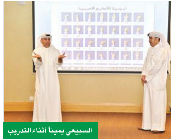
السيبي يمتدأ أثناء التدريب

المستويات العالمية، ويحرص على أن تكون الخدمة مناسبة لكل شريحة من شرائح العملاء، ومنهم ذوو الاحتياجات الخاصة الذين يحتاجون إلى رعاية خاصة من موظفي الفرع بمجرد دخولهم إليه، ويجب أن يحظوا بالاهتمام المطلق طوال بقائهم في الفرع وعند تلقيهم الخدمة.