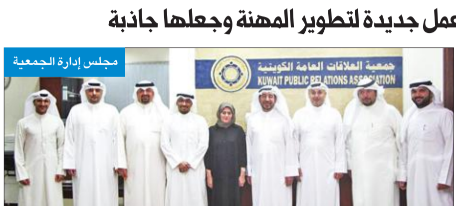
مجلس إدارة الجمعية

جديدة للارتقاء بمهنة العلاقات العامة، وجعلها مهنة جاذبة للعمالة الوطنية من خلال تحقيق العديد من المطالب أهمها التصديف الوظيفي السليم لهذه المهنة، وتعديل السلم الوظيفي لها، وإقرار مزايأ مالية، ووضع أليات مناسبة لتطوير بيئة العمل، ما يساهم في تحقيق العدالة الوظيفية المنشودة. وأضاف أن تحقيق طموحات العاملين في هذا المجال