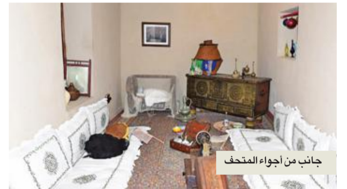
جانب من أجواء المتحف

تعتبر جزيرة فيلكا من المناطق التي تزخر بهذا النوع الذي عناه قانون الآثار، فقد شيدت قرية الزور القديمة في نهاية القرن التاسع عشر ومطلع القرن العشرين، ولا تزال شاخصة للعيان، ويمكن للمتحول فيها أن يشاهد كيف استخدم الأهالي الصخور البحرية والطوب، وسقوا منازلهم بخشب المانجروف، المعروف محلياً باسم الجندل، وشيدت في ستينيات القرن الماضي مبانٍ تراثية في الجزيرة أندثر