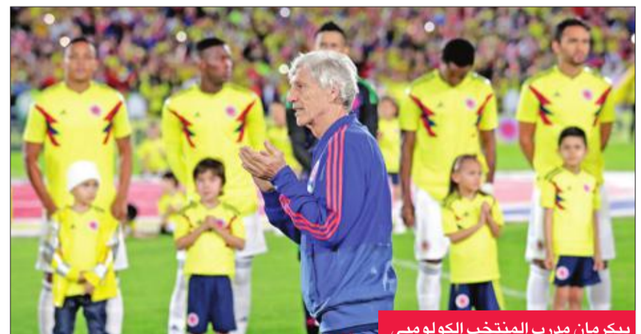
بيكرمان مدرب المنتخب الكولومبي

الذي ارتدى قميص المنتخب، ووقف إلى جانب اللاعبين لغناء النشيد الوطني. وخاض اللاعبون مباراة استعراضية انقسم فيها المنتخب لفريقي وانتهت بالتعادل 1-1. وفي نهاية اللقاء، سلمت لاعبة القوى كاترين إيبارجين، الحاصلة على الميدالية الذهبية الذهبية في ريو 2016، العلم الكولومبي إلى قائد المنتخب فالكاو جاريسا الذي قام بتحية الحضور، وقال: «نحمل في قلوبنا 50 مليون كولومبي، وسندافع عن هذا العلم بكل قوة».