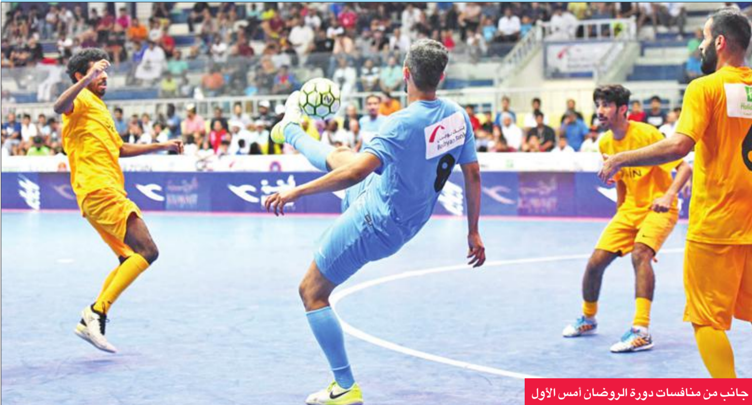
جانب من منافسات دورة الروضان أمس الأول