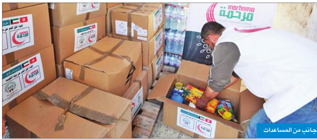
جانب من المساعدات

استجواب النائب حمدان العازمي لرئيس مجلس الوزراء سمو الشيخ جابر المبارك مطلع الشهر الجاري، أوضحت للنواب الخطوات المتخذة في هذا الملف، واستعرضت معهم قرارات عودة الجناسي إلى بعض الحالات والية عمل اللجنة، متوقفاً حسم الكثير من حالات المسحوبة جناسيهم بعد نهاية دور الانعقاد الحالي. في السياق، وعبر حسابه على تويتر، بشر النائب د. نايف المراديس بقرب عودة الجناسي المسحوبة، مبيناً أنه «بالتواصل مع الرئيس المبارك، ونائب رئيس الوزراء وزير الداخلية الشيخ خالد الجراح، نقول إن هناك تباشير بعودتها قريباً». ولفت المراديس إلى ضرورة عدم تمكين من يحاول عرقلة أي عودة مستحقة لجنسية أي شخص، داعياً أن يعم الفرح البلاد، وأن يطوى هذا الملف، لاسيما في هذه الأيام المباركة.