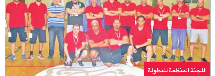
اللجنة المنظمة للبطولة

ووعد الهزيم بأن تعمل اللجنة المنظمة في البطولة بكل قوتها من أجل إرضاء جماهير اللجنة. وقال د. ناثل الهزيم، إن دورة الهزيم أفرزت عدداً من اللاعبين الجيدين للأندية، مشيراً إلى أن هناك مبادرة لذوي الاحتياجات الخاصة ستقام على هامش المنافسات.