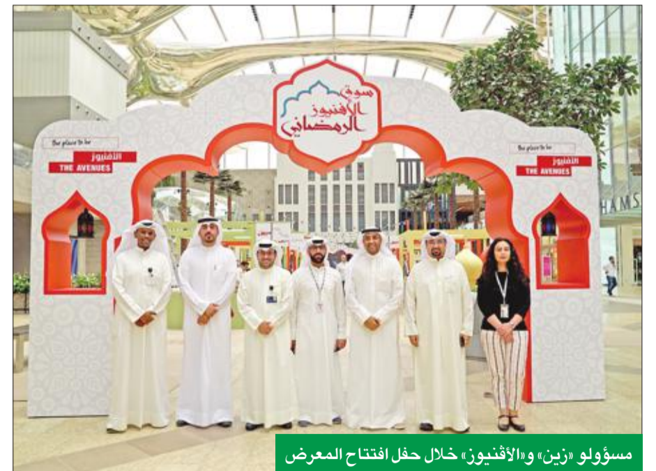
مسؤولو «زين» و«الأفيوز»، خلال حفل افتتاح المعرض

الشركة حريصة على دعم وتمكين الشباب من رواد الأعمال