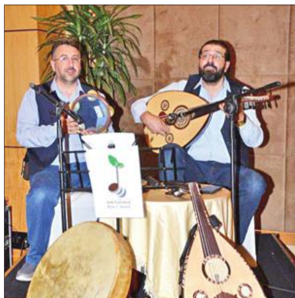
أحان شرقية قدمت للحضور