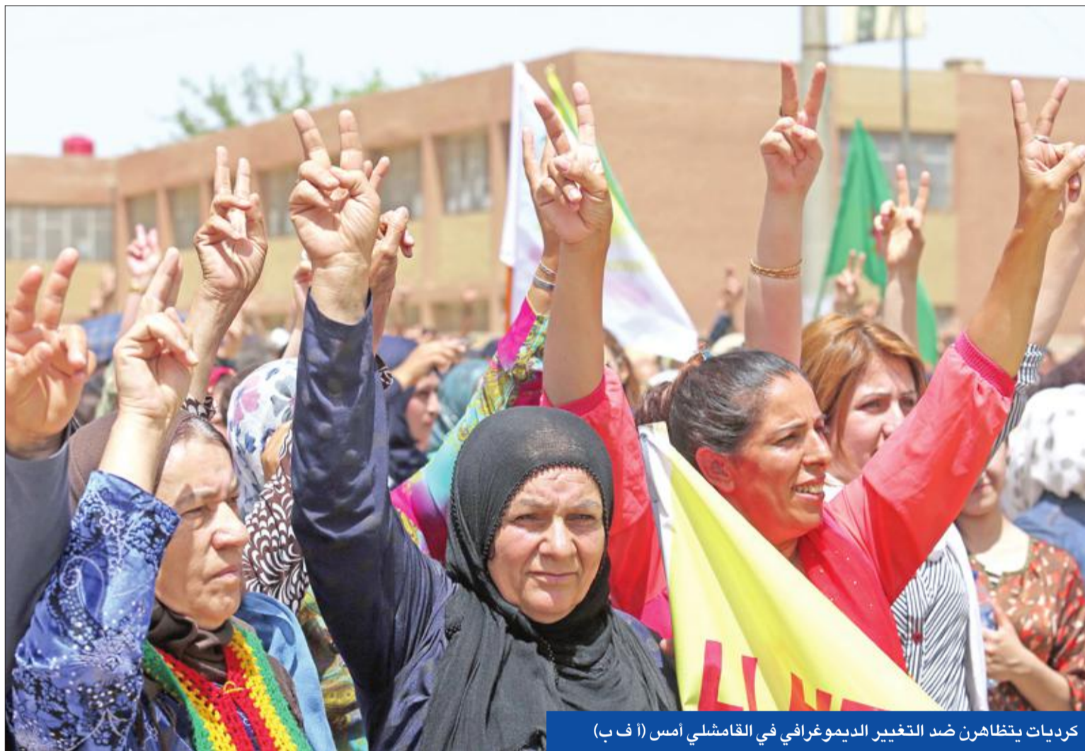
كرديات يتظاهرن ضد التغيير الديموغرافي في القامشلي أمس (أ ب)

«خريطة منبج» أمام مومبيو • دمشق تسرح أول دفعة مجندين منذ 8 سنوات