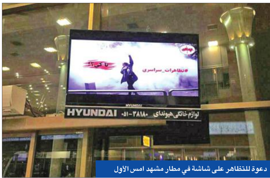
دعوة للتظاهر على شاشة في مطار مشهد أمس الأول

بنوا عبارات تنتقد سلوك «الحرس الثوري» في سورية ولبنان وغزة