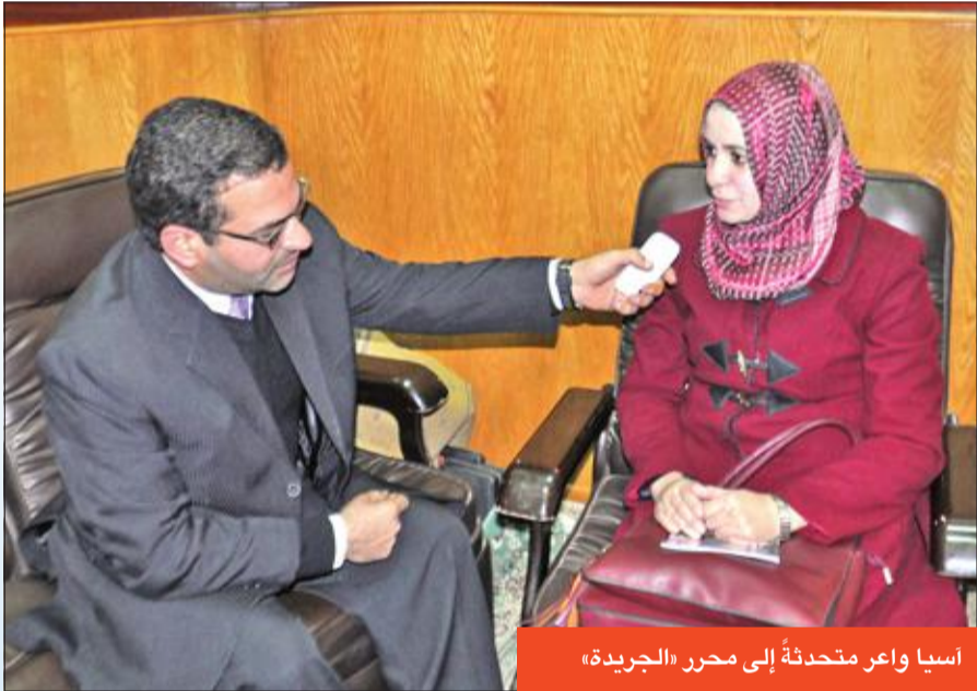
آسيا واعر متحدة إلى محرر «الجريدة»

«إذا لم نتصد لمظاهر العولمة فسيضمحل الدين»