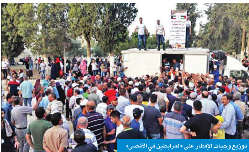
توزيع وجبات الإفطار على «المرابطين في الأقصى»