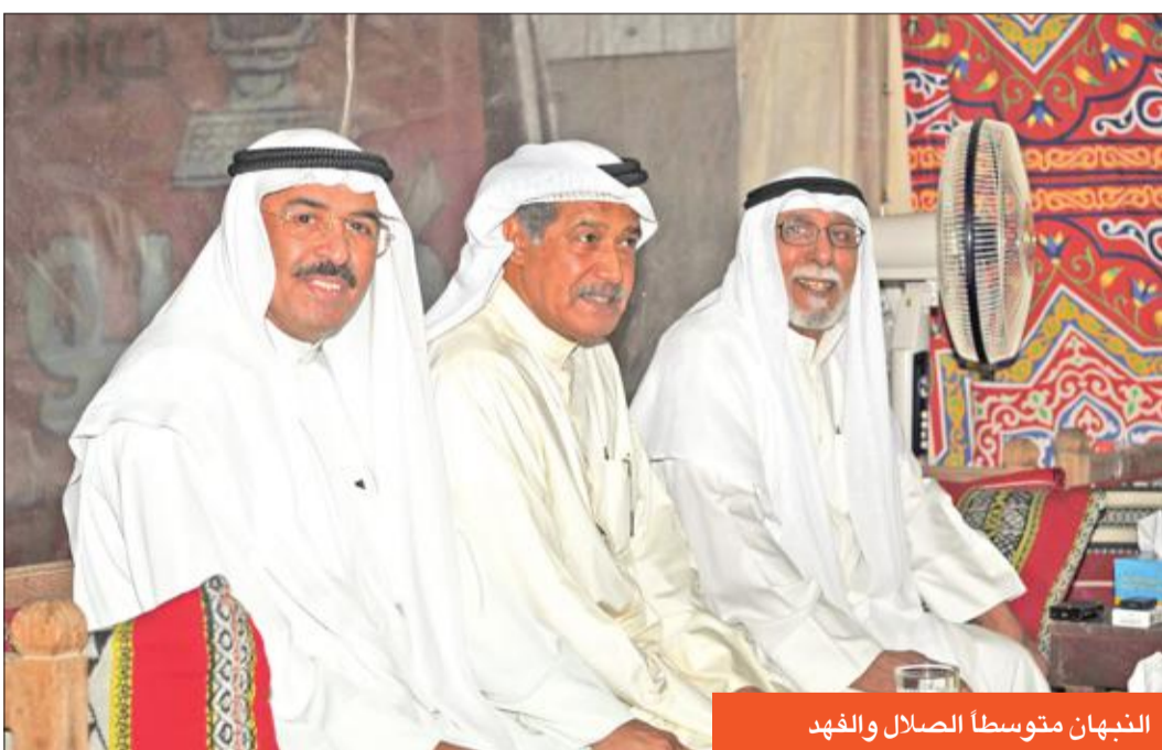
النبهان متوسط الصلال والفهد

بعد انتسابي للمسرح الشعبي صرت التقى الفنانة