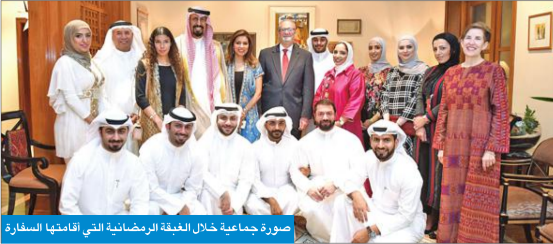
صورة جماعية خلال الغيبة الرمضانية التي أقامتها السفارة

اعتبر رسالة الأطفال الكويتيين لبوش الأب رمزاً للصداقة الثابتة بين البلدين