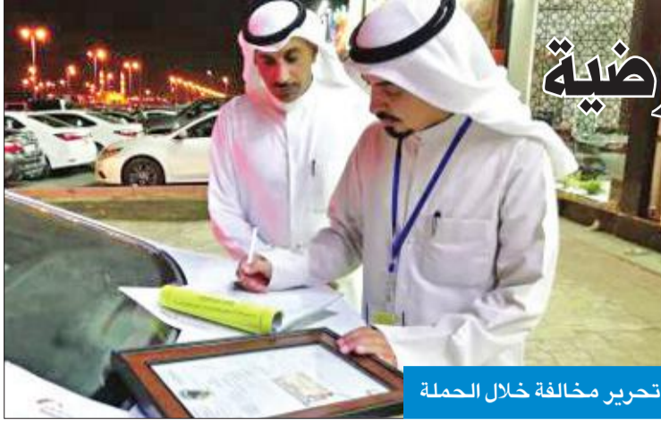
تحرير مخالفة خلال الحملة

معروضة للبيع، تمهيداً لرفعها بمجرد انتهاء المدة القانونية. وقال الخرينج إنه تم الكشف على 16 محلاً أثناء الحملة، وناشد أصحاب المحلات بالالتزام بالمساحات المرخصة لهم وعدم استغلال أي مساحة، دون ترخيص، تجنباً للمسائلة القانونية. ودعت إدارة العلاقات العامة أصحاب المحلات ومكاتب بيع وتاجير السيارات بالالتزام بالمساحات المرخصة لهم من البلدية، تجنباً للمخالفة والغرامة.