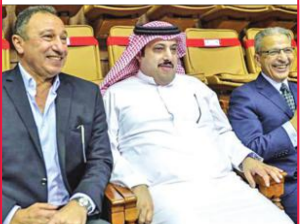
الخطيب وآل الشيخ في مناسبة سابقة

إلى ذلك، نفى مجلس إدارة الأهلي إصدار بيان رسمي للتعليق على اتهامات آل الشيخ، مؤكداً أن البيان الذي يتم تداوله على مواقع التواصل الاجتماعي غير صحيح بالمره، وليس له علاقة بالنادي ومسؤوليه.