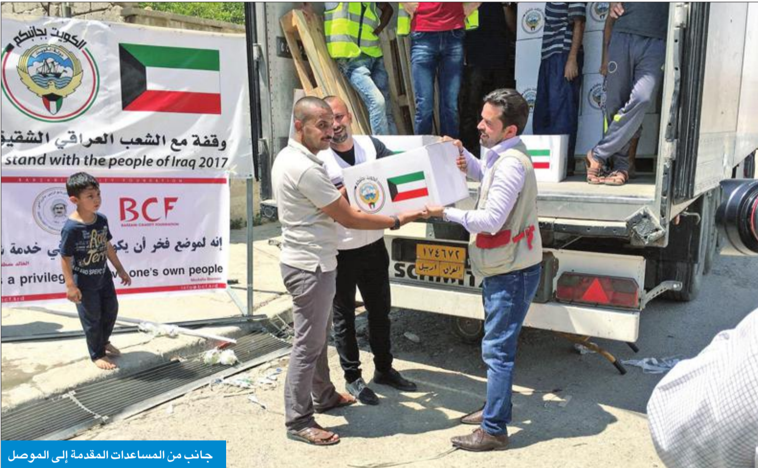
جانب من المساعدات المقدمة إلى الموصل

قدمت مساعدات إنسانية للاجئين والفقراء لتخفيف الأعباء التي يتحملونها