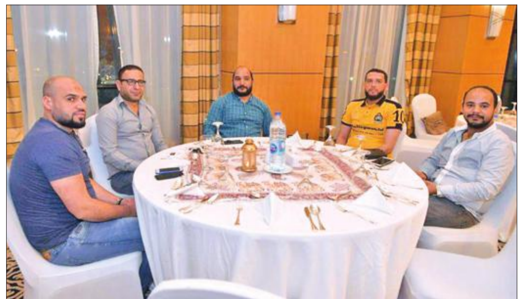
عدد من الحضور