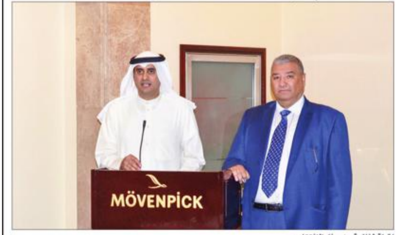
لقطة ثانية من حفل الافتتاح

افتتح فندق وريزدنس موفنبيك برج هاجر مكة البهو الخاص به بعد توسعته والتي بدأت في 26 سبتمبر 2017، وبلغت مساحته 2200م2، وأقام الفندق حفلاً كبيراً في 29 شعبان لاستقبال زوار بيت الله الحرام خلال الشهر الفضيل وهو في ثوبه الجديد.