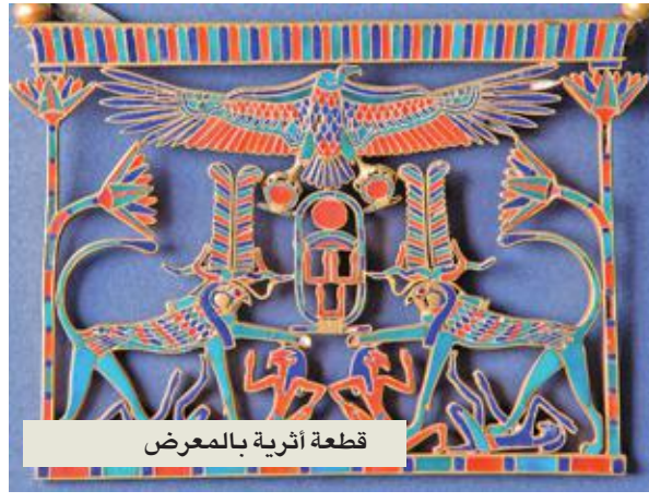
قطعة أثرية بالمعرض