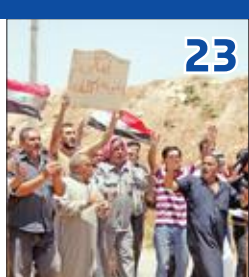
ليبرمان لا يستبعد إقامة علاقات بين تل أبيب ودمشق