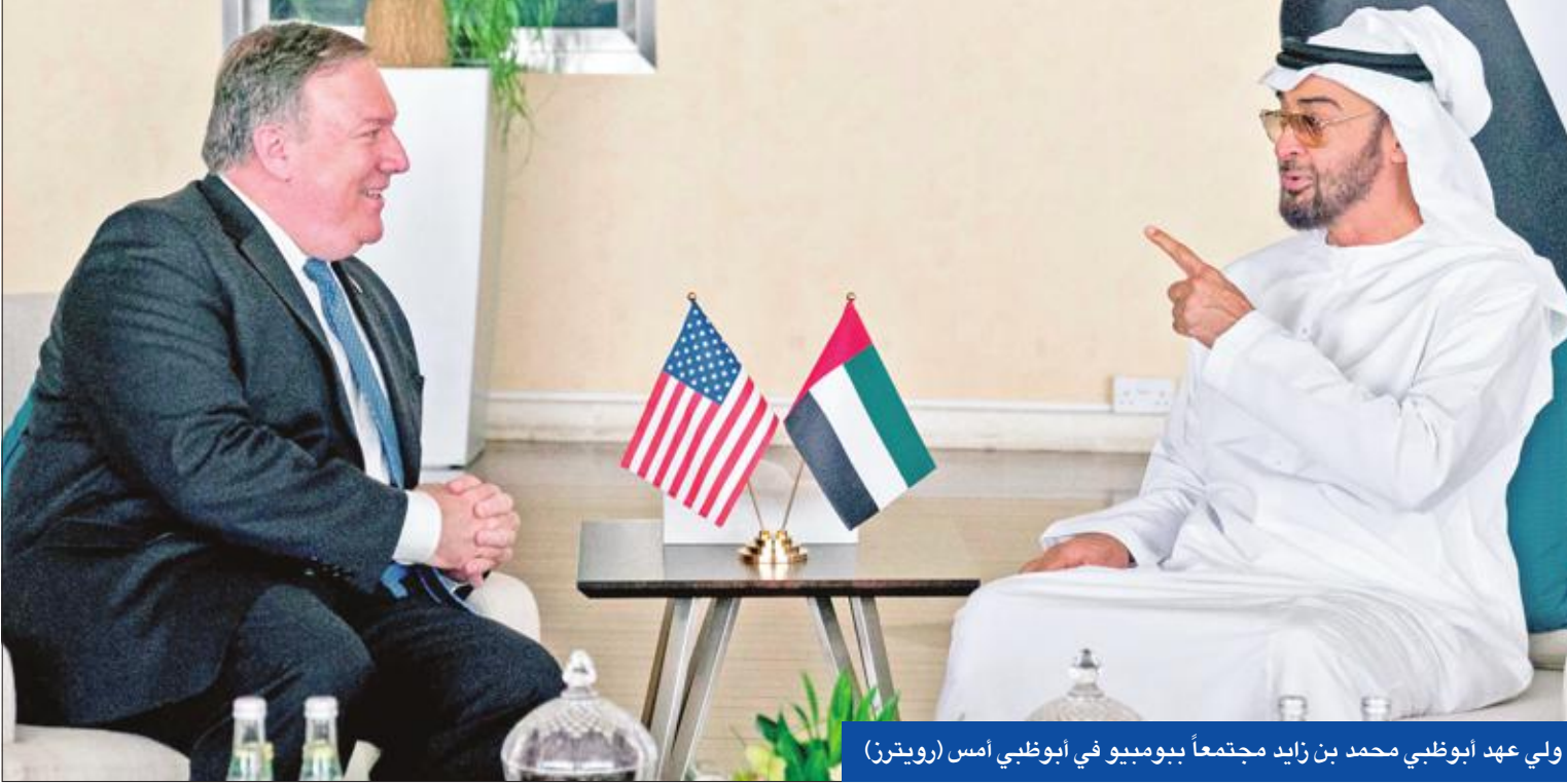
ولي عهد أبوظبي محمد بن زايد مجتمعاً ببومبيو في أبوظبي أمس

تعهد وزير الخارجية الأميركي مايك بومبيو بالتصدي لسلوك إيران «الشريـر»، وتحجيم ميليشياتها بالمنطقة، في وقت هاجم حلف شمال الأطلسي (ناتو) برنامج تسليحها الصاروخي، وكرز رئيس «الشورى» الإيراني تهديد بلاده بإغلاق مضيق هرمز إذا فرضت واشنطن حظراً شاملاً على تصدير بلاده للنفط.