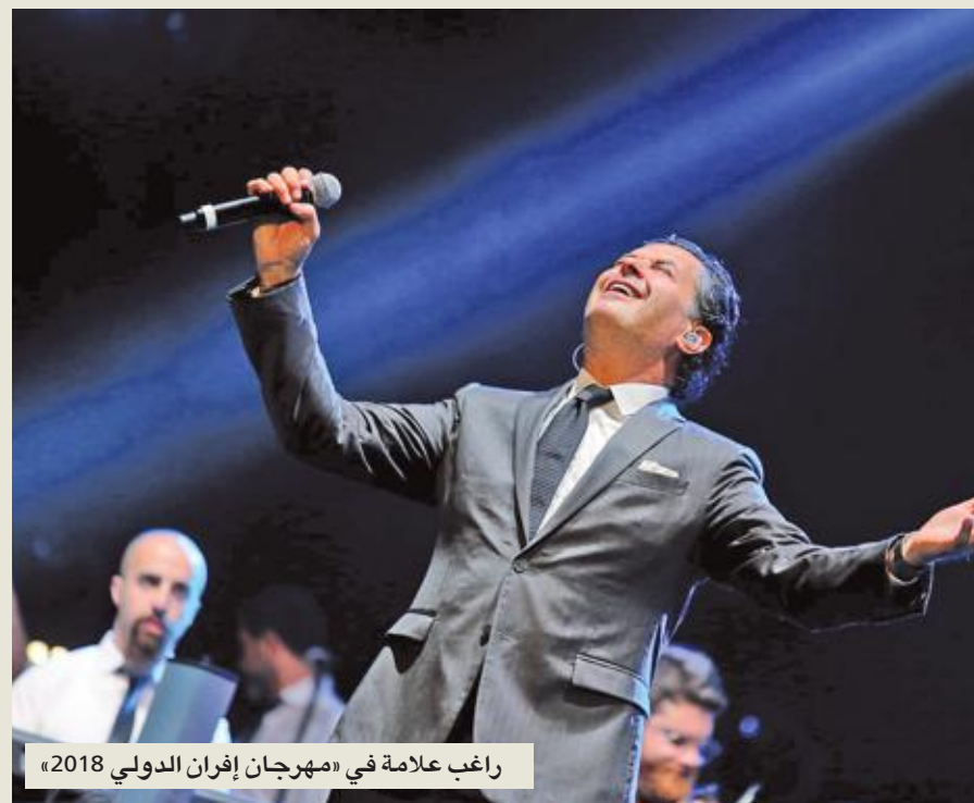
راغب علامة في «مهرجان إفران الدولي 2018»

بعد غياب سنوات عن المغرب عاد الفنان راغب علامة إلى هذا البلد من بوابة «مهرجان إفران الدولي 2018»، الذي افتتح دورته الثالثة بحفلة غنائية ضخمة حضرها حشد من أهل السياسة والإعلام وجمهور كبير، جذّ خلاها «السوبر ستار» محبته للشعب المغربي مؤكداً أن الإشاعات المفرضة نتج بعض الوقت في تشويه سمعة الفنان لكنها لا تثبت أن تزول وتبدو الحقيقة واضحة كالشمس... وهذا بالتحديد ما حصل معه.