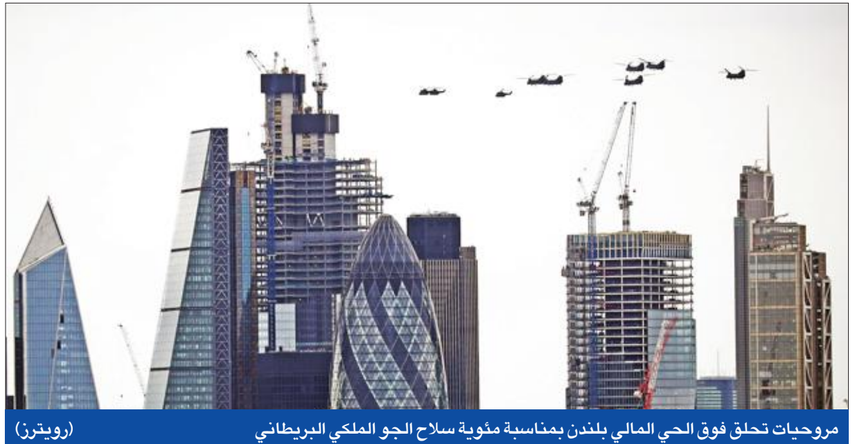
مروحيات تحلق فوق الحي المالي بلندن بمناسبة مئوية سلاح الجو الملكي البريطاني