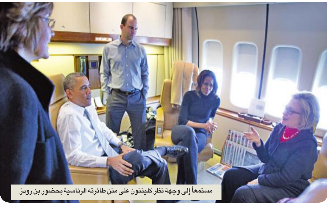
استمعا إلى وجهة نظر كلينتون على متن طائرته الرئاسية بحضور بن رودز

في كتابه THE WORLD AS IT IS (العالم كما هو) يروي لنا رودز قصصاً مشوقة دارت في أروقة الرئاسة الأمريكية ومكاتب إدارتها. وحكايات مثيرة للاهتمام لم تتسرب إلى العلن، كذلك يتطرق إلى العلاقة التي ربطته برئيس برهن أنه من القامات التاريخية للولايات المتحدة. يكشف رودز في هذه الحلقة كيف أصبح الرئيس الليبي المخلوع معمر القذافي محور الأحداث التي طبعت عهد باراك أوباما الرئاسي.