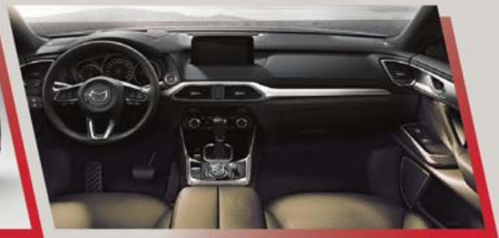
مقصورة رحبة غاية في الفخامة