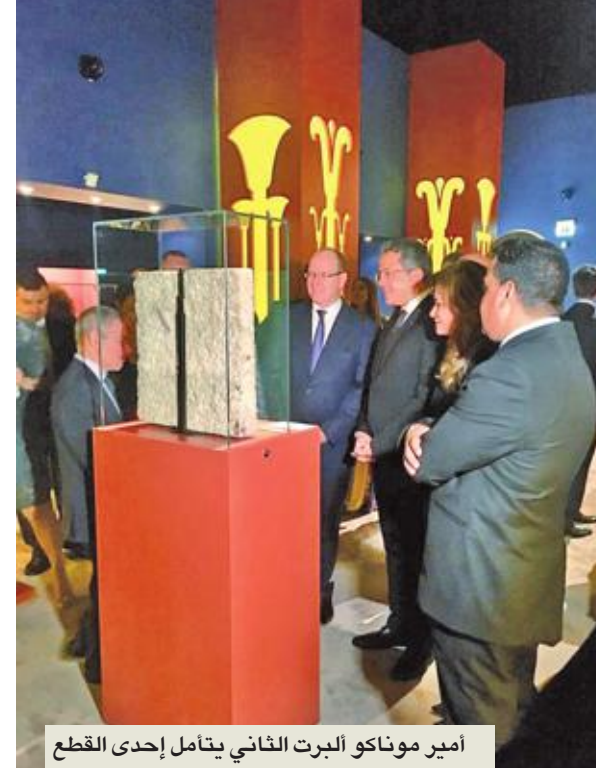
أمير موناكو البرت الثاني يتأمل إحدى القطع

يعاني قطاع السياحة في مصر تراجعاً شديداً منذ حادث سقوط الطائرة الروسية السياحية، في 31 أكتوبر 2015، وما ترتب عليه من إعلان مجموعة من الدول تجميد رحلات الطيران إلى القاهرة، في وقت تكابد أجهزة الدولة المعنية منذ ذلك التاريخ لإعادة الروح إلى السياحة المصرية، عبر تنظيم فعاليات مختلفة للتعريف بمنجزات الحضارة المصرية وآثارها الخالدة، التي تلمع في المعارض الخارجية. في هذا الإطار، عقد وزير الآثار في مصر، خالد العناني، والوفد المرافق له، مؤتمراً صحافياً عالمياً أثيراً في قاعة «غريمالدي فوروم» في إمارة موناكو (إمارة ذات سيادة على شاطئ البحر المتوسط في منطقة الريفيرا الفرنسية) حضره عدد كبير من الإعلاميين الفرنسيين والإيطاليين، بمناسبة افتتاح «معرض الكنوز المصرية الذهبية» الذي