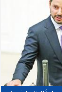
صهر الرئيس التركي يؤدي اليمين أمس وزيراً للمالية (ا ف ب)

من أن يشدد أردوغان قبضته على السياسة النقدية. وكان أردوغان أعلن مساء أمس الأول تشكيلة حكومته الجديدة، بعد انتقال البلاد إلى النظام الرئاسي، واختار فؤاد أوقطاي نائباً للرئيس، واحتفظ وزير الخارجية مولود جاووش أوغلو بمنصبه، كما عين الجنرال خلوصي أكار وزيراً للدفاع، وقائد القوات البرية الجنرال يسار غول رئيساً جديداً لأركان الجيش، بدلا من أكار. وتم تعيين نائب رئيس الأركان الجنرال أوميد دوندار قائداً جديداً للقوات البرية، والجنرال متين غوراك نائباً جديداً لرئيس الأركان. وسيعين أردوغان مديراً للبنك المركزي ونوابه وأعضاء لجنة السياسة النقدية لفترة مدتها 4 أعوام.