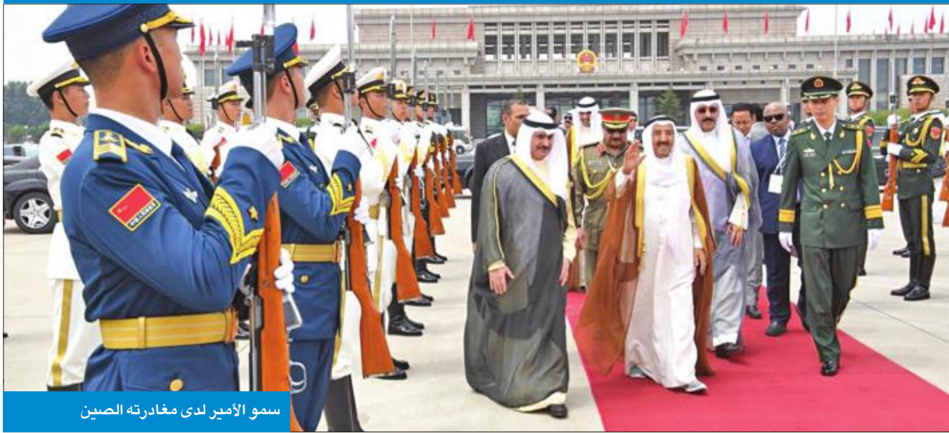
سمو الأمير لدى مغادرته الصين

الكويتي للمنتمة الاقتصادية العربية عبد الوهاب البدر، ورئيس الشؤون الإعلامية والثقافية بالديوان الأميري يوسف الرومي، ورئيس الشؤون السياسية والاقتصادية بالديوان الأميري الشيخ فواز السعد، والمدير العام لهيئة تشجيع الاستثمار المباشر الشيخ د. مشعل الجابر، ورئيس جهاز تطوير مدينة الحرير (الصبية) وجزيرة بوبيان فيصل المدالج، وكبار المسؤولين بالديوان الأميري ووزارتي الخارجية والنفط.