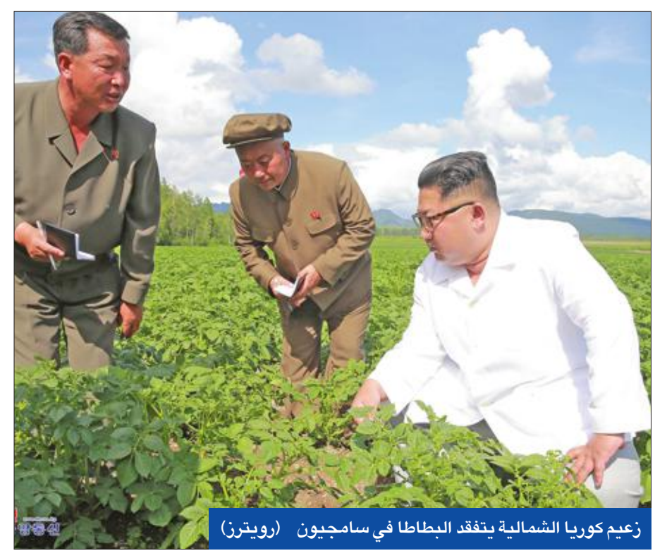
زعيم كوريا الشمالية يتفقد البطاطا في سامجيون

المحت وسائل الاعلام الحكومية في بيونغ يانغ، أمس، إلى أن الزعيم كيم جونج أون ربما كان مشغولاً جداً بتفقد حقول البطاطا في مقاطعة سامجيون الثانية الشاسعة على الحدود الصينية، وذلك حال دون لقائه وزير الخارجية الأمريكي مايك بومبيو الذي زار بيونغ يانغ يومين الأسبوع الماضي. وعادة ما تبدأ وسائل الاعلام الرسمية في كوريا الشمالية نشراتها التلفزيونية وصفحاتها الأولى بأخبار كيم، لكن غياب سبعة أيام عن الأخبار خلال زيارة بومبيو، أثار التكهنات لدى المرابرين حول مكان وجوده. وحل اللغز أمس عندما بثت وكالة الأنباء الكورية الشمالية الرسمية ما لا يقل عن أربعة تقارير بشأن زيارته لسامجيون، الثانية الشاسعة على الحدود الصينية، أورد معظمها تفاصيل أكثر من المعتاد حول زيارته الميدانية التوجيهية. وقالت الوكالة إنه في حقل زراعة البطاطا