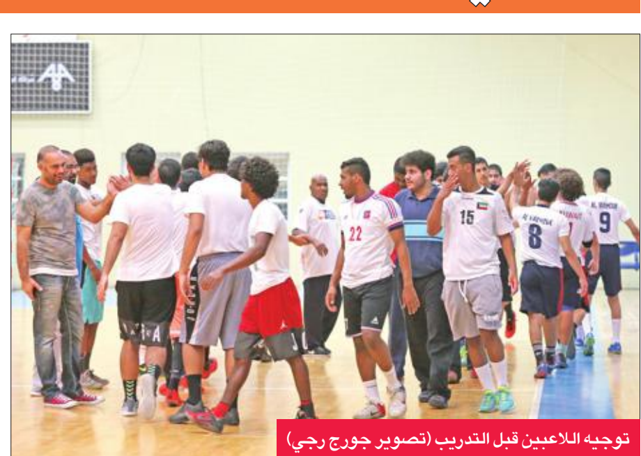
توجيه اللاعبين قبل التدريب

بدأت أمس الأول فترة التدريب المحلية لمنتخب الناشئين تحت 17 سنة لكرة اليد على صالة مركز الشهيد فهد الأحمد بالديعة تحت قيادة الجهاز الفني الوطني مساعد ونايف الرندي استعداداً لحوض المعسكر التدريبي الصيفي في هنغاريا أواخر الشهر الجاري. وحضر الحصة التدريبية الأولى 26 لاعباً اشتملت على ترميمات بدنية لتهيئة اللاعبين بعد توقفهم منذ نهاية منافسات الموسم المنقضي إضافة إلى بعض التدريبات باستخدام الكرة.