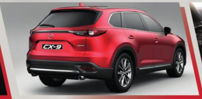
تصميم فريد بخطوط عصرية