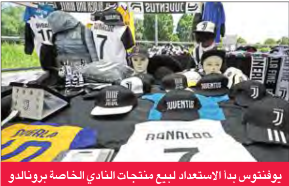
يوفنتوس بدأ الاستعداد لبيع منتجات النادي الخاصة برونالدو

الواحد 0.9 يورو، وهو السعر الأعلى منذ عام. وكان رونالدو انضم إلى ريال مدريد قادماً من مانشستر يونايتد في 2009، وفاز بلقب الدوري الإسباني ولقب دوري أبطال أوروبا أربع مرات مع النادي، بالإضافة إلى العديد من الألقاب الفردية، ولكنه المرح إلى أن يقاه مع ريال مدريد يمكن أن ينتهي فوراً عقب التوقيع بلقب دوري أبطال أوروبا الأخير، واستطاع يوفنتوس أن يحصل على توقيع.