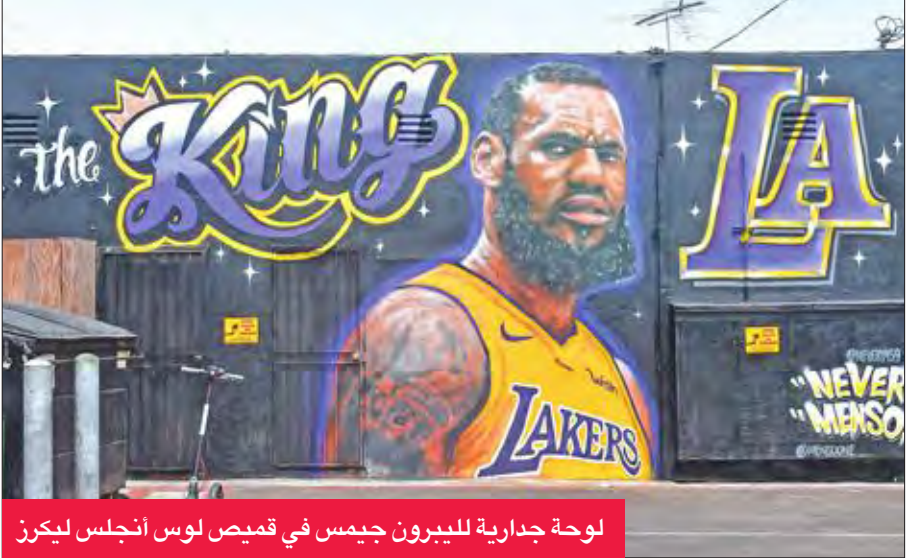
لوحة جدارية لليبرون جيمس في قميص لوس أنجلوس ليكرز

وخاص جيمس الدور النهائي في المواسم الثمانية الماضية، فقاد ميامي هيت الذي انتقل إلى صفوفه من كليفلاند عام 2010 إلى اللقب مرتين في 4 نهائيات، ثم كليفلاند إلى اللقب في 2016 على حساب غولدن ستايت ووريترز بعد مباراة سابعة فاصلة، علماً أن كليفلاند تخلف 1-3 أمام منافسه، لكنه خسر امامه في النهائيات الثلاثة الأخيرة.