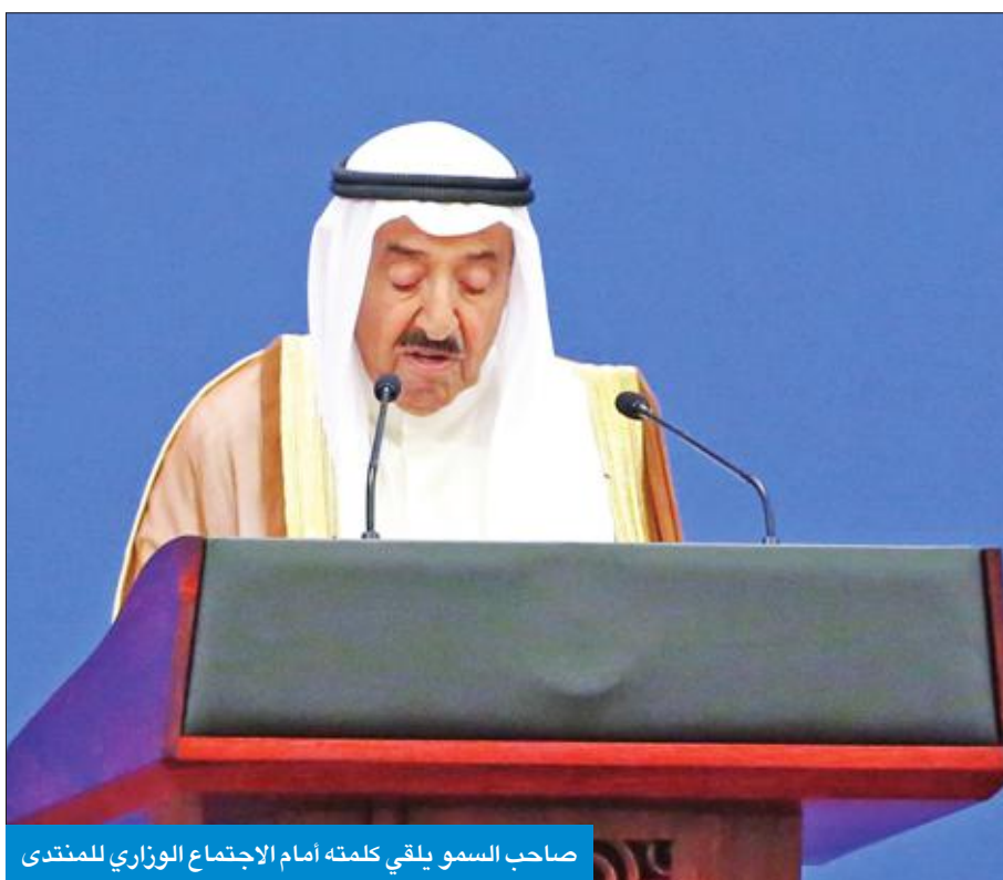
صاحب السمو يلقي كلمته أمام الاجتماع الوزاري للمنتدى

● سموه أكد أمام المنتدى العربي - الصيني وجوب دفع آليات التعاون لتحقيق المصالح العليا للجانبين