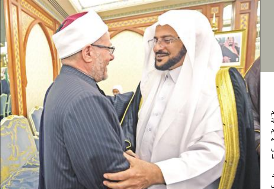
مفتي الديار المصرية شوقي علام مصافحاً وزير الشؤون الإسلامية السعودي عبدالمطيف ال الشيخ خلال حضور مؤتمر عن السلام والأمن في أفغانستان أمس (ا ف ب)

من جهته، قال غريفيث: «سنعمل على التفاوض مع مختلف الأطراف لبلورة الرؤى والأفكار الممكنة المتسقة مع مرجعيات السلام والتأكيد على الجوانب الإنسانية في هذه المرحلة». (الرياض، صنعاء - ب. أ، رويترز)