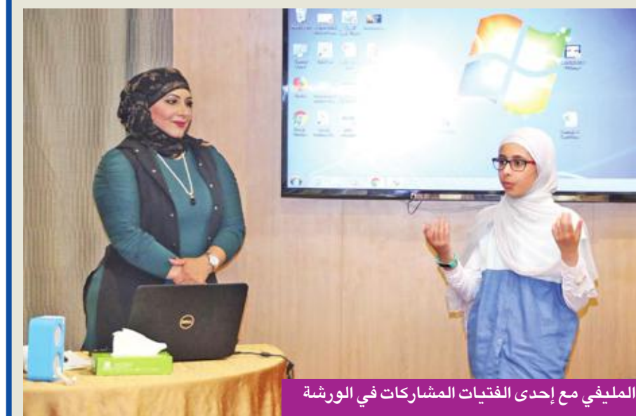
المليثي مع إحدى الفتيات المشاركات في الورشة

وقد غناها عدد من الفنانين، وأكدت أن الدفاع عن الوطن يكون بشئتي الصور وكل في مجاله وسعاد الصباح مجالها الإبداع الشعري، والكلمة الحرة الشريفة، فكتبت عدداً من القصائد الوطنية التي دانت من خلالها الغزو العراقي الغاشم على بلدها الكويت.