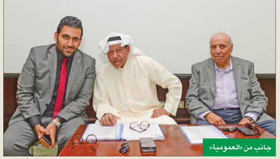
جانب من «العمومية»

الرئيسية المنتشرة في العديد من البلدان في الشرق الأوسط وشمال إفريقيا لتسهيل مشاركتها في تلك الأسواق لتحقيق الأهداف الاستراتيجية لمجلس الإدارة والعمل على تنويع المخطاط وتحويل النمو المرجو مستقبلاً. وعن البيانات المالية للشركة للسنة المنتهية في 31 ديسمبر 2017، كشف عن تأثير الشركة بشكل كبير بالمتغيرات الاقتصادية التي عصفت بقطاع النفط، لكن إدارة الشركة سعت خلال هذه الفترة إلى إعادة توجيه بوصلتها واستهداف تقديم خدمات متعلقة بقطاع النفط وتأهيل شركاتها في الكويت ودول مجلس التعاون الخليجي لدى شركات النفط الرئيسية بهدف تقليل المخاطر وفتح أسواق جديدة لخدماتها في تلك الدول مستقبلاً. وبين الهزاع أن الشركة الخليجية للاستثمار البترولي شهدت انخفاضاً في حجم