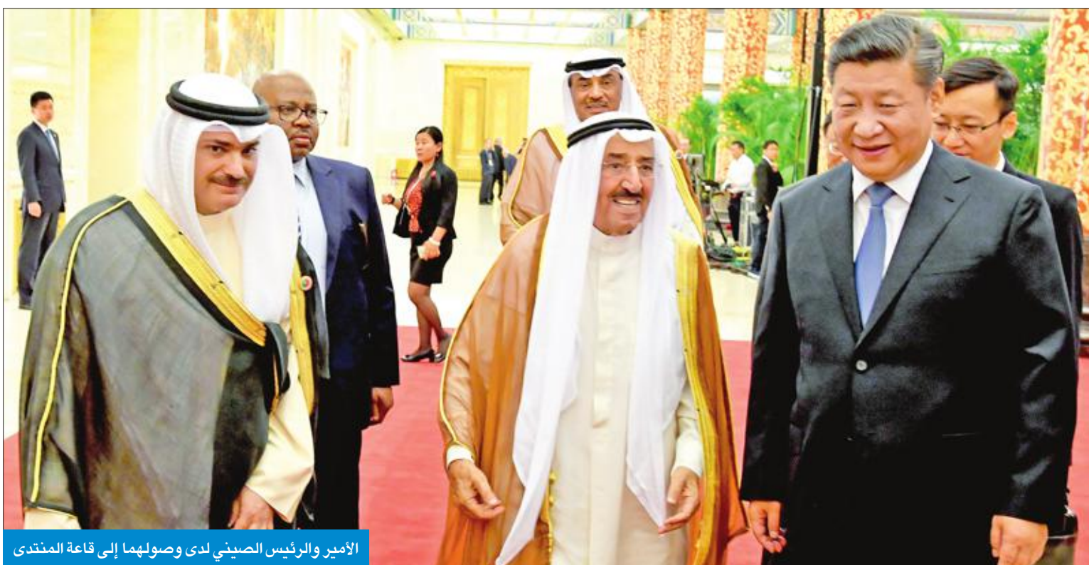
الأمير والرئيس الصيني لدى وصولهما إلى قاعة المنتدى

كما ندعم مساعي الصين لإيجاد حل سلمي للنزاعات على الأراضي والمياه الإقليمية عبر المشاورات والمفاوضات الودية وفق الاتفاقيات الثنائية وعلى أساس اتفاقية الأمم المتحدة لقانون البحار كما أننا ننظر بارتياح لما تحقق من إنجازات لأصدقائنا على صعيد تعاملهم مع ما يمس أمنهم واستقرارهم.