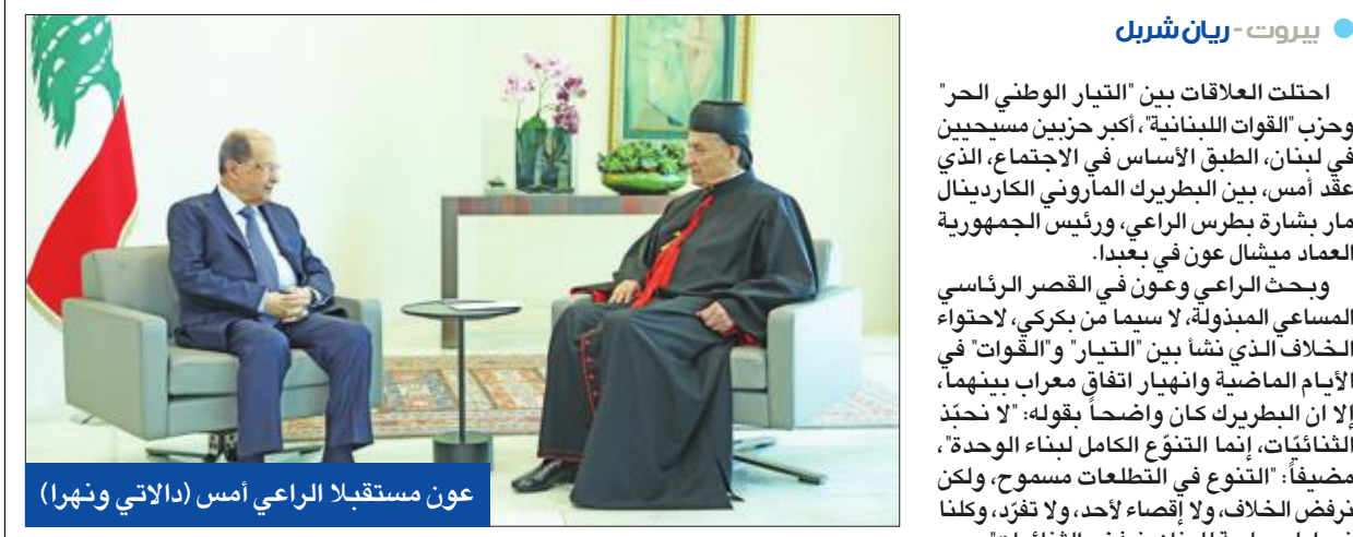
عون مستقبلاً الراعي أمس (اللايتي ونهرا)