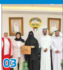
«التربية»: استثناء «الخبرة» للمعلمين ببعض التخصصات