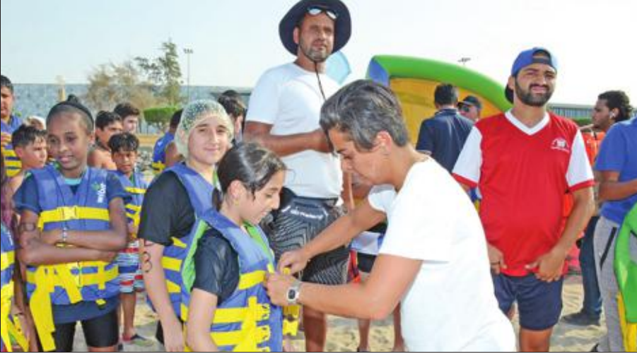
عدد من الأطفال يستمتعون بالنشاطات البحرية