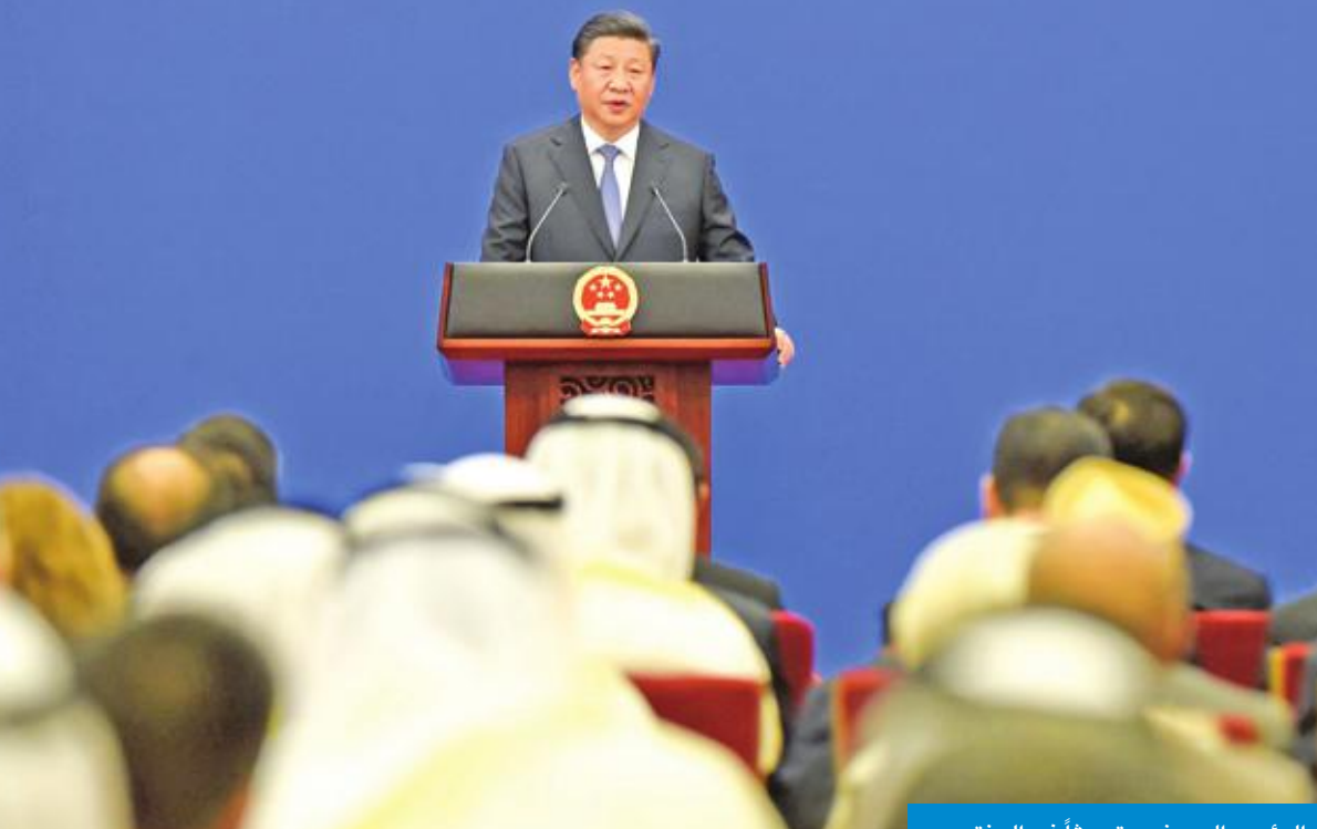
الرئيس الصيني يتحدث في المنتدى

دعا الرئيس الصيني شي جين بينغ إلى إقامة علاقات شراكة استراتيجية بين الصين والدول العربية قائماً على التعاون الشامل والتنمية المشتركة. وقال الرئيس بينغ في كلمة له خلال الجلسة الافتتاحية للدورة الثامنة للاجتماع الوزاري لمنتدى التعاون العربي - الصيني أن الدول العربية شريك أساسي في مبادرة (الحزام والطريق)، مشدداً على أن تلك المبادرة حققت نتائج مثمرة وساهمت في تطوير العلاقات الصينية - العربية. وأضاف أن بلاده تحرص على القيام بدور أكبر إزاء منطقة الشرق الأوسط لتحقيق الأمن والاستقرار فيها فضلاً عن تنمية دولها ونهضة شعوبها،