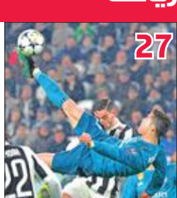
«صاروخ ماديرا» يحط في أرض «السيدة العجوز»