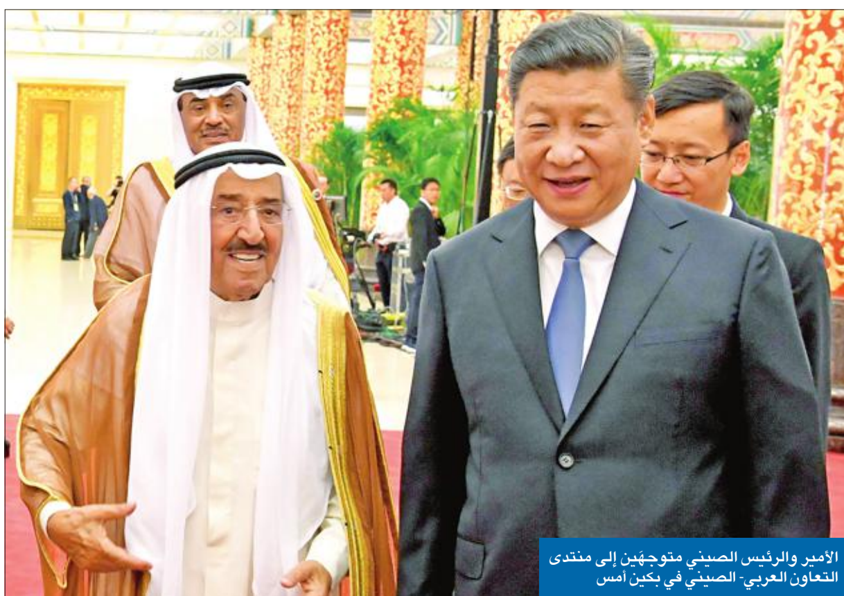
الأمير والرئيس الصيني متوجهين إلى منتدى التعاون العربي- الصيني في بكين أمس

دعا نائب رئيس مجلس الوزراء وزير الخارجية الشيخ صباح الخالد، إلى ضرورة التخفيف من حدة البعد الجغرافي بين الدول العربية والصين، عبر تواصل التشاور والحوار، وإقامة المشاريع المشتركة سواء الاقتصادية أو التجارية أو الثقافية «التي تربط بين دولنا وشعوبها، والصين وشعبها الصديق».