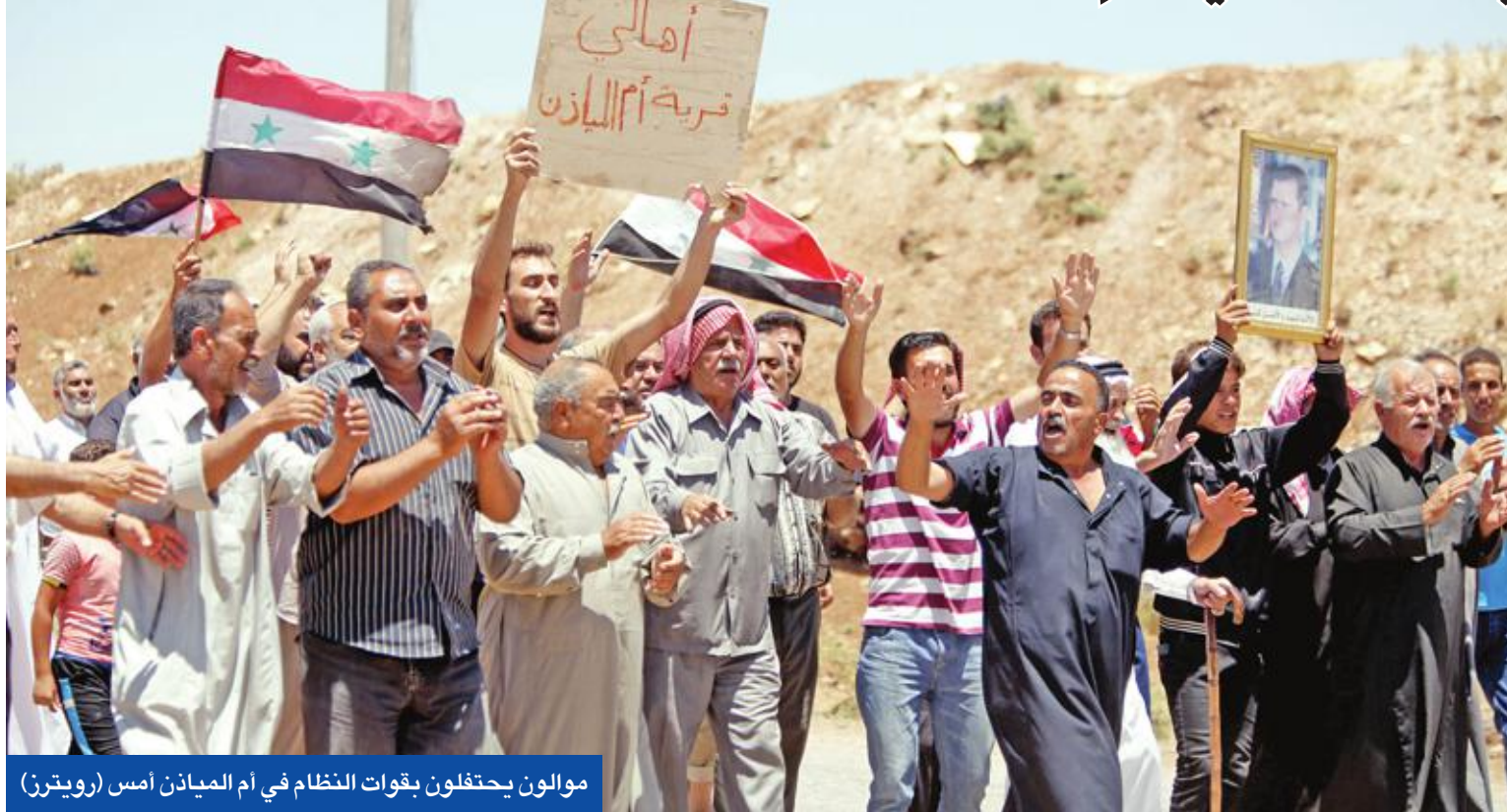
مولون يحتفلون بقوات النظام في أم الميادين أمس

● نتياهو ومستشار خامنئي بموسكو في يوم واحد ● بومبيو: مصير الأسد بيد السوريين