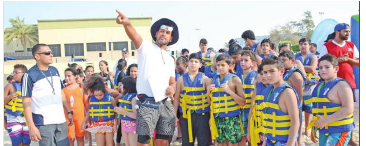
المدرّب يوجه المشاركين