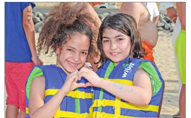
مشاركتان في الفعالية

وأعلنت المدرسة، في تصريح صحفي، أن اختبار الطالبين جاء بترشيح من لجنة المناظرات للمدارس الأجنبية في الكويت، لافتة إلى أن المناظرة تُعقد سنوياً في إحدى الدول، حيث عُقدت الدورات السابقة في عدة بلدان عربية وعالمية، بينها: بيرو، وقطر، وأثينا، وسيول، وكيب تاون، وبانكوك، وشوتغارت، وسنغافورة، وأشارت «الإنكليزية» إلى أن تلك المناظرات ستقام بين طلاب ينتمون إلى 60 جنسية، للتباحث والمناقشة في حلول المشاكل، واستعراض الآراء، مؤكدة أنها ستشتمل جميع تكاليف السفر الخاصة بطلابها، والتي تتضمن تذاكر السفر والإقامة والتنقل والمصاريف الأخرى.