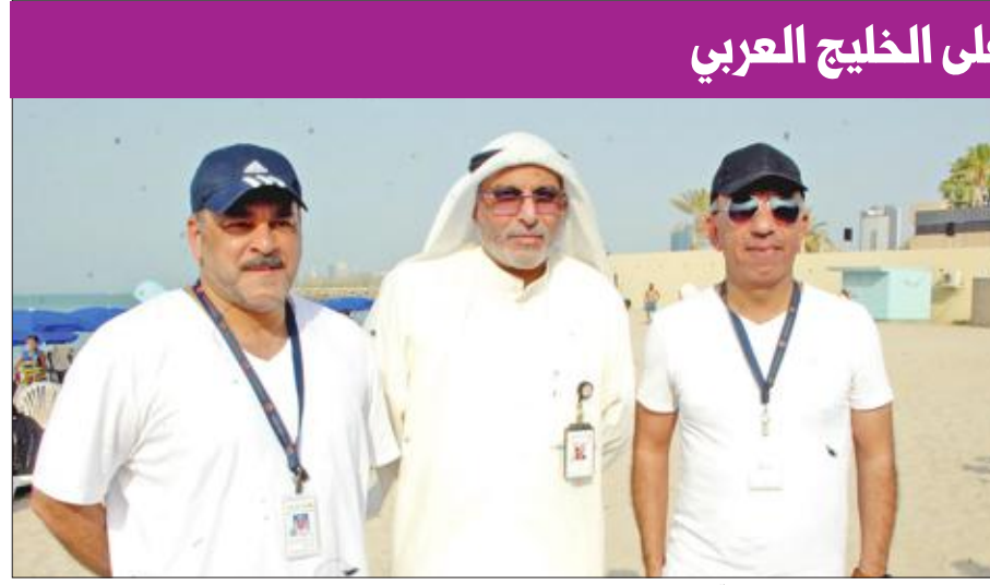
فريق عمل «المشروعات السياحية»