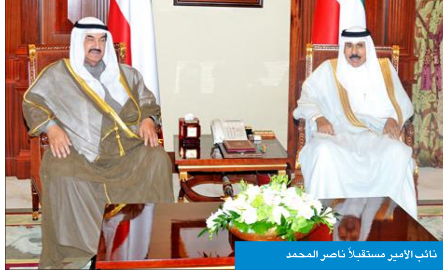
نائب الأمير مستقبلاً ناصر المحمد

استقبل سمو ولي العهد الشيخ نواف الأحمد بقصر بيان، صباح أمس، سمو الشيخ ناصر المحمد.