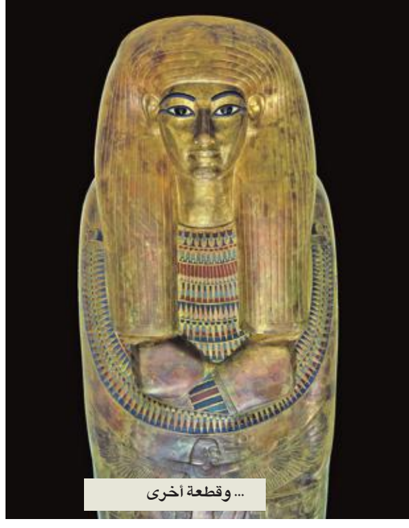
... و قطعة أخرى

عبد الفتاح السيسي مبادرته أثناء حديثه إزاء مجلس النواب بأن المرحلة المقبلة هي مرحلة بناء الإنسان المصري، مضافة: «من هذا المنطلق، يجب تسليط الضوء على أهمية دور الثقافة، خصوصاً في بناء الإنسان المصري، عن طريق تعريفه بتاريخ أثاره التي تجوب العالم؛ لتشهد الإنسانية عراقية هذه الحضارة».