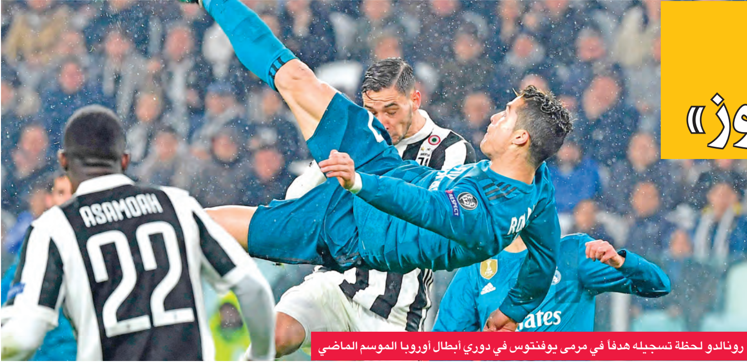
رونالدو لحظة تسجيله هدفاً في مرمى يوفنتوس في دوري أبطال أوروبا الموسم الماضي