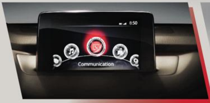
شاشة عرض معلومات تعمل باللمس