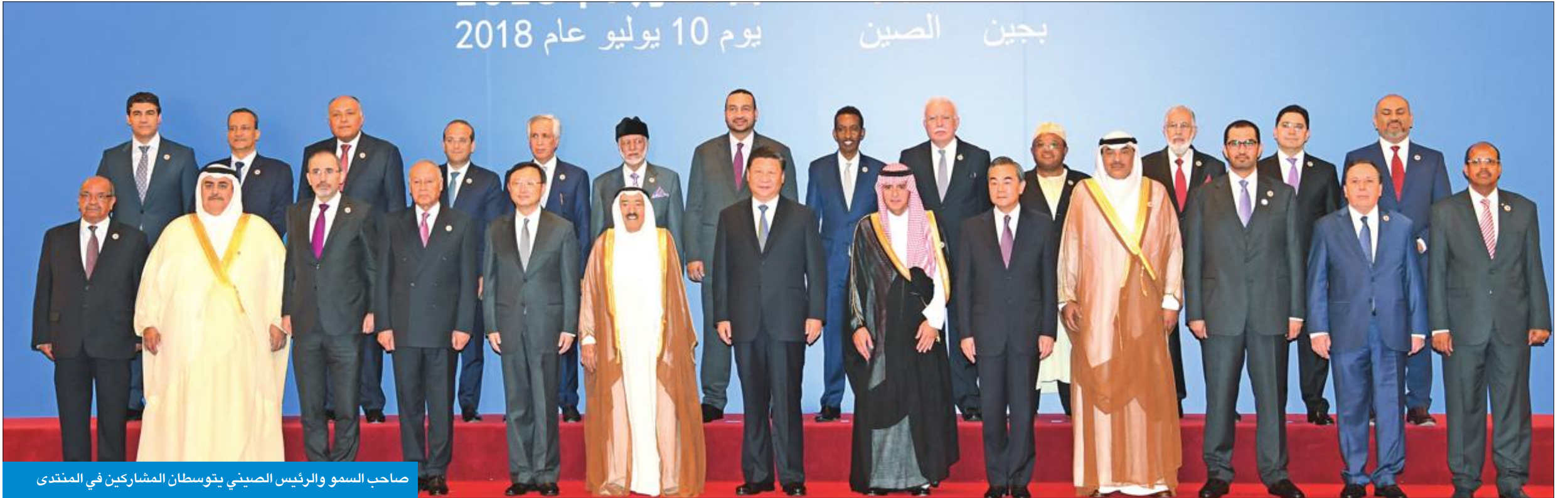
صاحب السمو والرئيس الصيني يتوسطن المشاركين في المنتدى

● «العمل مع الصين لتجاوز الأزمات التي تعيشها بعض الدول العربية»