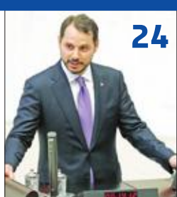
إربوغان يعين صهره وزيراً للمالية والليرة تخسر