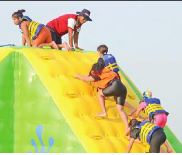
مسابقات ترفيهية للأطفال