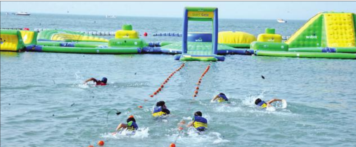
الأطفال أثناء مشاركتهم في الألعاب