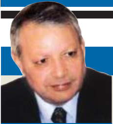
صالح القلب كاتب وسياسي اردني