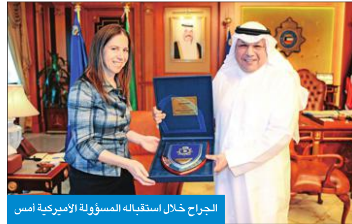
الجراح خلال استقباله المسؤولة الأميركية أمس