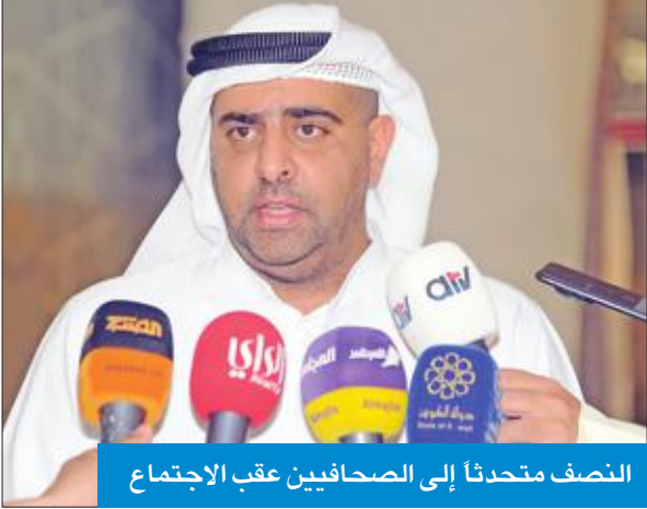
النصف متحدتاً إلى الصحافيين عقب الاجتماع

النصف: الوزيرة أكدت الالتزام بتوزيع 12 ألف وحدة سكنية سنوياً