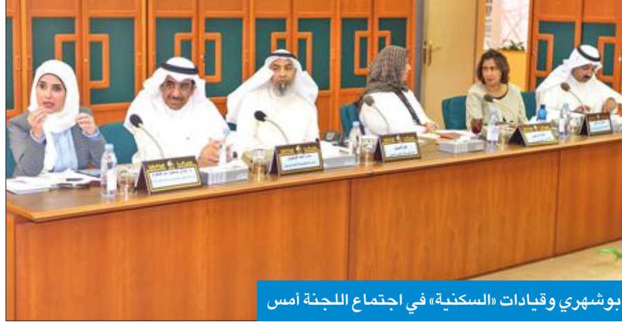
بوشهري وقيادات «السكنية» في اجتماع اللجنة أمس

لجنوب مدينة صباح الأحمد لـ 12 ألف وحدة سكنية، علماً بأن الجزء الجنوبي من المدينة يتسع 25 ألف وحدة سكنية. وسابع، فيما يتعلق بخدمات مدينة صباح الأحمد، ابلغنا الوزيرة بوشهري طرح مجموعة مشاريع تتمثل في الشراكة بين القطاعين العام والخاص وتغطية القطاعات الخدمية للمدينة. ولفت النصف إلى أن اجتماع السكنية تطرق إلى نسبة أنجاز عقود مدينة المطلاع والتي كانت نسبة مرضية للجنة بحسب أرقام الإسكان، ويتخذ إلى الآن العمل مرض من قبل المؤسسة العامة للرعاية السكنية.