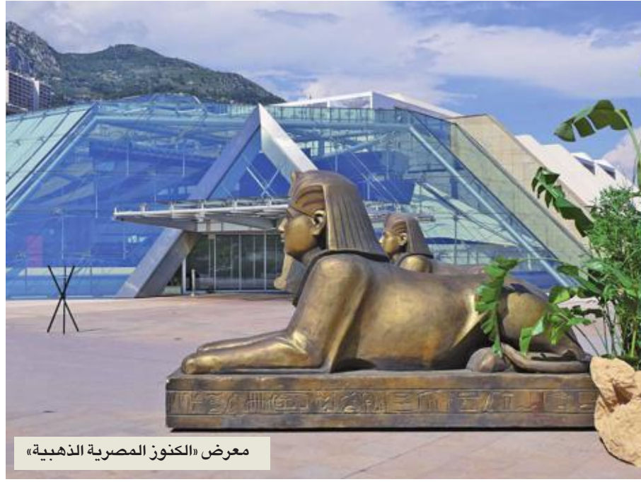
معرض «الكنوز المصرية الذهبية»

بعيدا عن الأسباب وراء عشق البشر لكرة القدم، ما يهم هو أن هناك أمراً قادراً على جر الناس، ومن مختلف شرائح البشر وفي كل زاوية من زوايا الأرض، إلى متعة رياضة بعيداً عن همومهم، وبعيدا عن منغصات حياتهم، وبعيدا عن الوحش الذي بات يسكن ويطل من خلف نظرات مجاميع كبيرة من البشر. يكفي لعبة كرة القدم فخراً أنها تقدم متعة رياضية للبشر في زمن الأسلحة الفتاكة، وفي زمن الاقتتال المجاني.