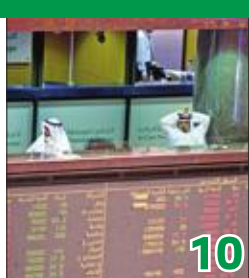
7309 حسابات تداول جديدة في البورصة منذ بداية العام... بنمو 1.9%