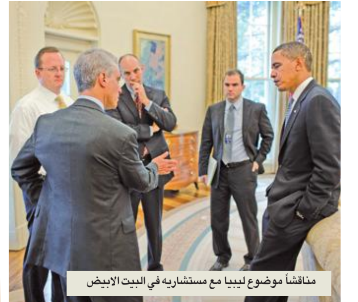
مناقشة موضوع ليبيا مع مستشاريه في البيت الأبيض