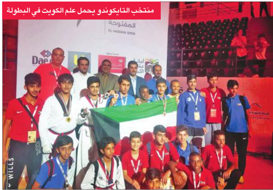
منتخب التايكوندو يحمل علم الكويت في البطولة

حقق منتخب الكويت للتايكوندو 10 ميداليات في بطولة «الحسن الدولية المفتوحة للتايكوندو - جسي ون» التي استضافها الأردن، بمشاركة أكثر من 1400 لاعب ولاعبة من 31 دولة، من بينها 16 دولة عربية. واستطاع لاعبو المنتخب تحقيق ميدالية ذهبية واحدة وميداليتين فضيتين وسبع ميداليات برونزية لفئات الناشئين والشباب والرجال بمختلف الأوزان ضمن منافسات البطولة على مدى يومين متتاليين.