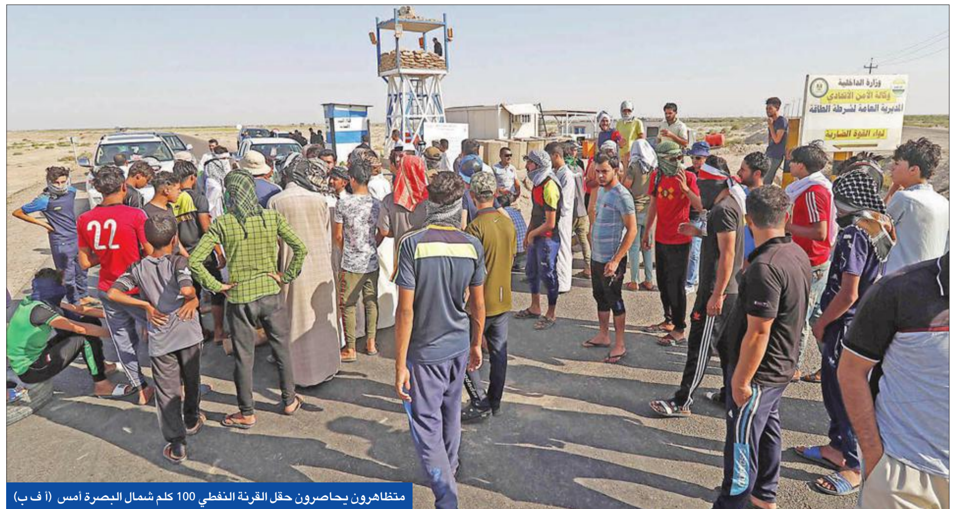
متظاهرون يحاصرون حقل القرنة النفطي 100 كلم شمال البصرة أمس

شهدت خدمة الإنترنت في معظم مناطق العراق تردياً وضعفاً واضحاً أعاناه مستخدمو الشبكة العنكبوتية. وحسب تقارير محلية، فقد شهدت خدمة الإنترنت انقطاعاً تاماً منتصف ليل الجمعة السبت. ورغم عودة الخدمة أمس لكنها تشهد ضعفاً شديداً.