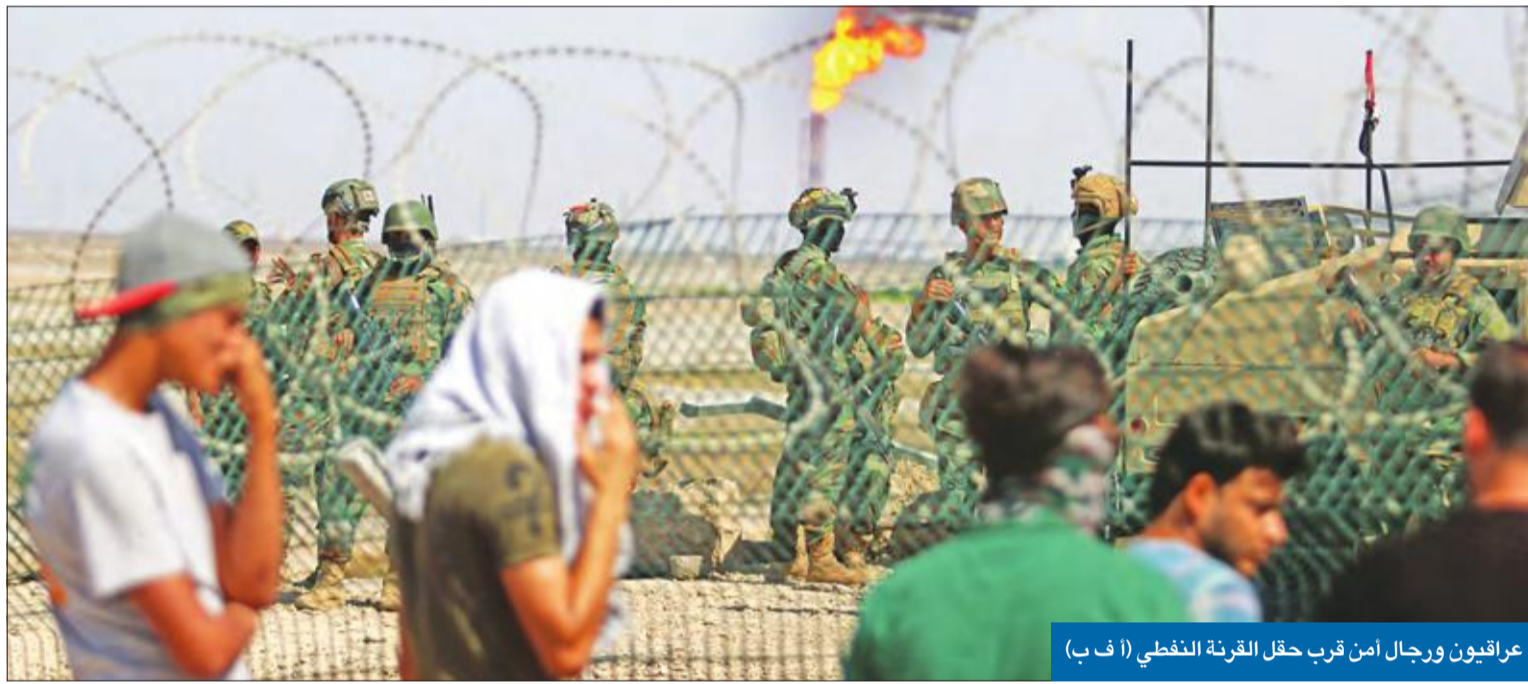
عراقيون ورجال أمن قرب حقل القرنة النفطي

● «الخارجية»: نتابع التطورات ولا داعي للقلق ● الخضر تفقد جاهزية القوات ● «الداخلية» تعلن الاستنفار... وتحريك قوة «واجب مبارك» والمغاوير والزوارق ● العراقيون يغلقون «سفوان» ساعات... وحلفاء طهران أكبر المتضررين من الاحتجاجات