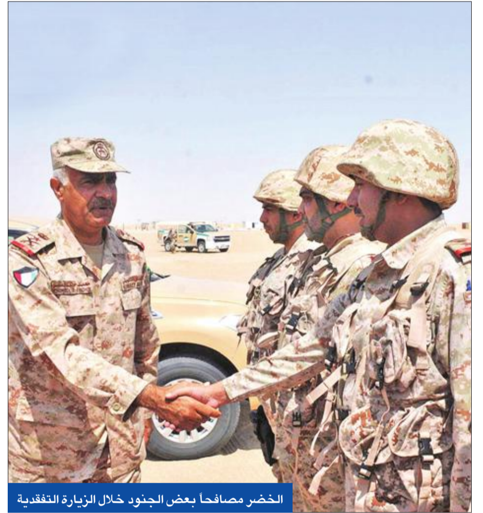
الخضر مصافحاً بعض الجنود خلال الزيارة التفقدية

اقفال المطار، وقال رب الأسرة لـ «الجريدة» إنه غادر إلى العراق على متن الخطوط الجوية الكويتية بغرض زيارة العتبات المقدسة بمدينة النجف، وكان من المفترض أن يعود على متن الكويتية أيضاً، إلا أن الأحداث في مدينة النجف حالت دون ذلك وكان الوضع صعباً جداً، مما دفعه وأفراد أسرته للعودة إلى الكويت برا ومنها إلى السعودية، وأشار إلى أنه أثناء عودته برا لم يشاهد أي مظاهر لتجمعات أو مظاهرات، وأن السيارة التي اقتنهم واصلتهم للمنفذ الكويتي بسلام ولم يتعرضوا لأي مكروه.