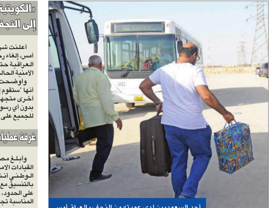
أحد السعوديين لدى عودته من النجف بالعراق أمس

وأبلغ مصدر أمني مطلع «الجريدة» بأن القيادة الأمنية والعسكرية وقيادات الحرس الوطني أنشأت غرفة عمليات مشتركة، بالتنسيق مع وزارة الخارجية لمتابعة الأوضاع على الحدود، على مدار الساعة، واتخاذ القرارات المناسبة تجاه أي موقف.