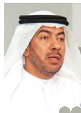
وجود المتظاهرين بالقرب من حدودنا يدعو للقلق علي الدقباسي