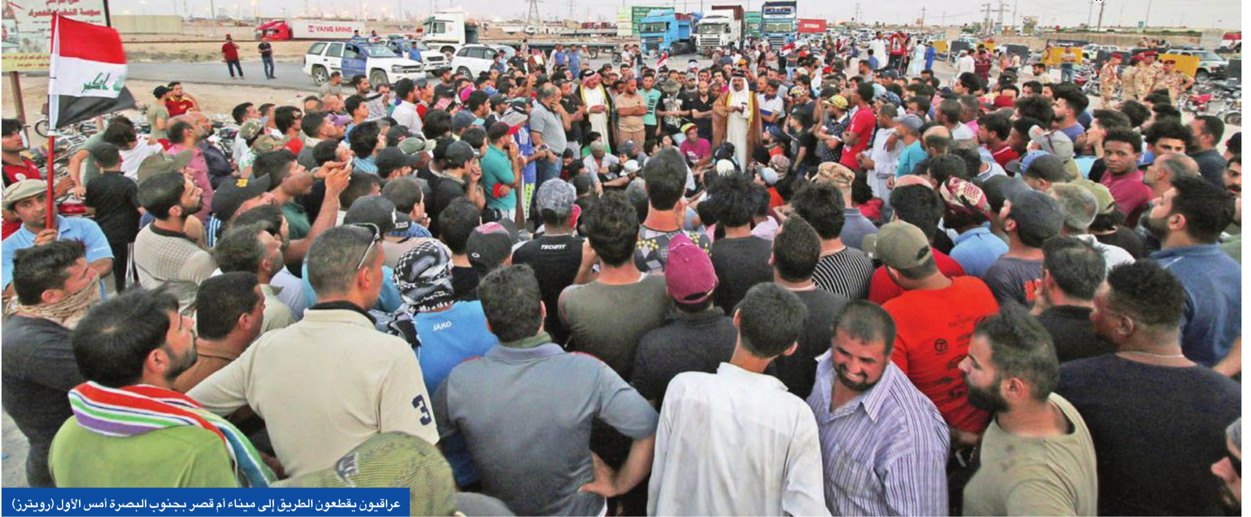
عراقيون يقطعون الطريق إلى ميناء أم قصر جنوبي البصرة أمس الأول (رويتزن)

تتمنى من المتظاهرين الحفاظ على الممتلكات العامة فهي ملك للشعب وليست للفاستين، وأصفاً وكانت المرجعية الدينية العليا بزعامة السيد علي السيستاني أعلنت، أمس الأول، تضامنها مع الاحتجاجات التي تشهدها محافظة البصرة، مشيرة إلى أن المحافظة هي الأولى برفد البلد بالموارد المالية والشهداء والجرحى، مشددة على أنه من غير الإنصاف أو المقبول أن تكون أكثر مناطق العراق "بؤساً وحرماناً".