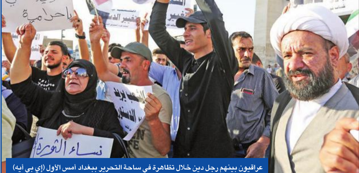
عراقيون بينهم رجل دين خلال تظاهرة في ساحة التحرير ببغداد أمس الأول

وأعلنت المرجعية الدينية العليا ظهيرة الجمعة تأييدها لمطالب المحتجين، واستخدمت عبارات قاسية في نقد السلطات وشككت الفساد المعرقة للتنمية، ما أدى إلى خروج الآلاف في النجف للتضامن مع مطالب البصرة، لكن احتجاجات النجف ذهبت إلى ابعد مما حصل جنوب البلاد، فاقتمحت المطار الدولي بسهولة ودونما مقاومة، ووقفت حركة المسافرين في واحد من انشط المطارات العراقية.