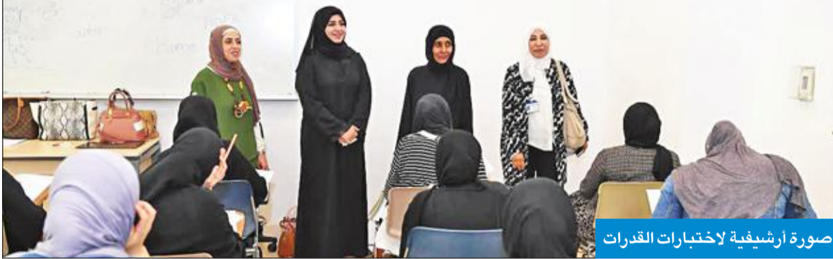
صورة أرشفية لاختبارات القدرات