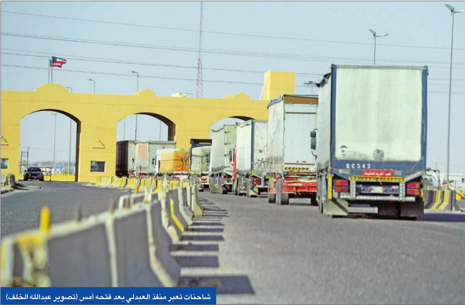
شاحنات تعبر منفذ العبدي بعد فتحه أمس