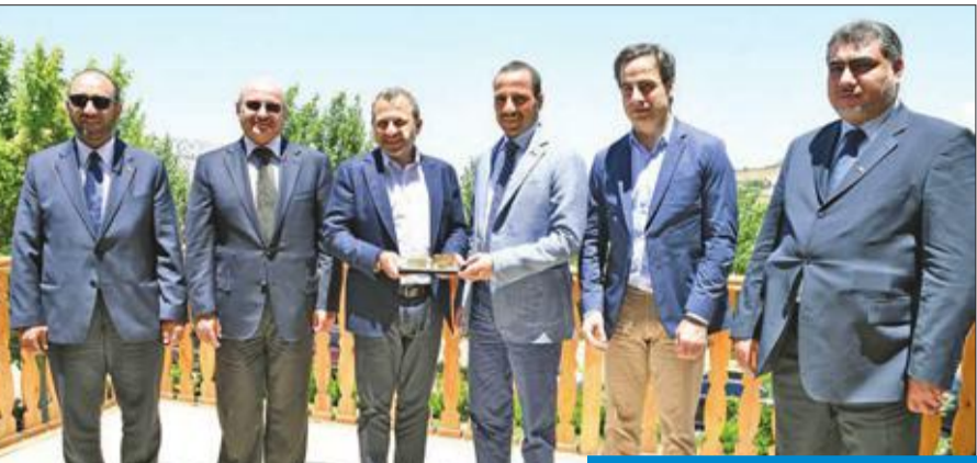
الغانم ووزير الخارجية اللبناني

وزير الخارجية اللبناني يقيم مأدبة إفطار على شرفه