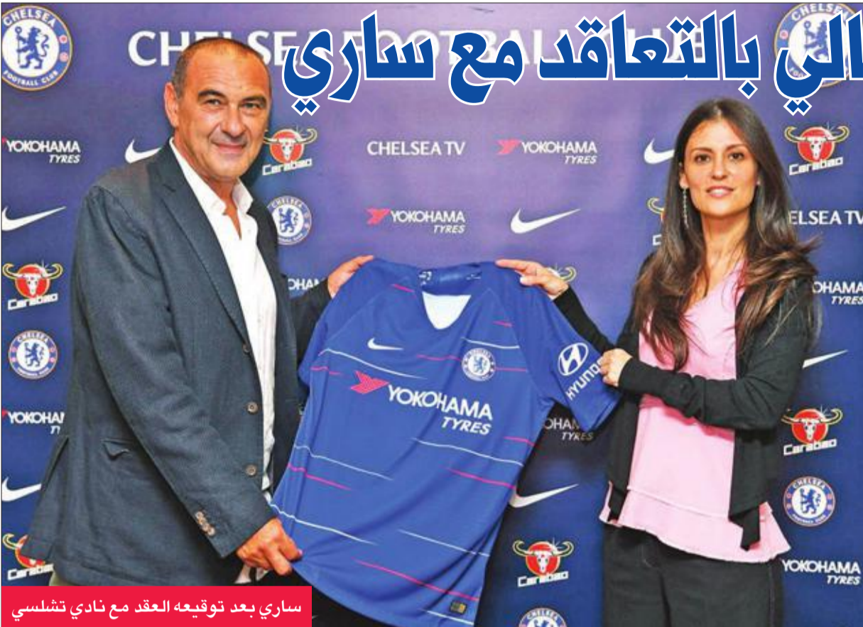
ساري بعد توقيع العقد مع نادي تشلسي