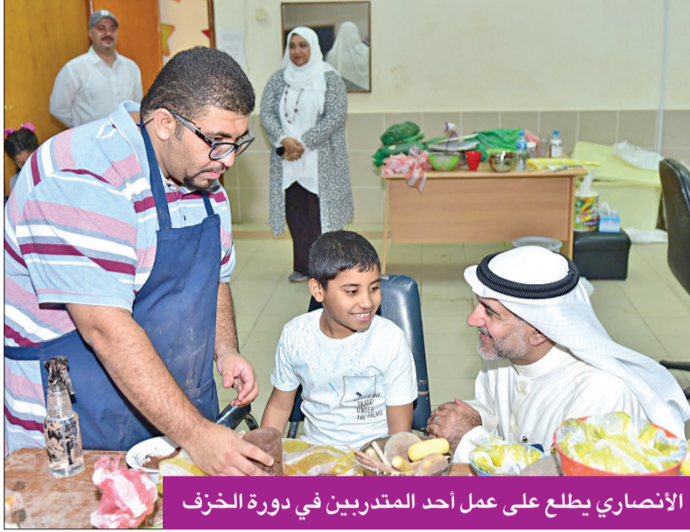
الأنصاري يطلع على عمل أحد المتدربين في دورة الخزف