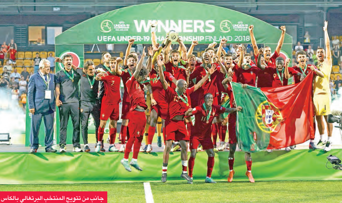
جانب من تتويج المنتخب البرتغالي بالكأس

توج المنتخب البرتغالي لكرة القدم أمس بلقب بطولة الأمم الأوروبية للشباب دون 19 عاما، إثر فوزه المثير على إيطاليا بنتيجة 4-3، في المباراة النهائية الماراثونية التي شهدها ملعب أوما إس بي بمدينة سينايوكي الفنلندية.