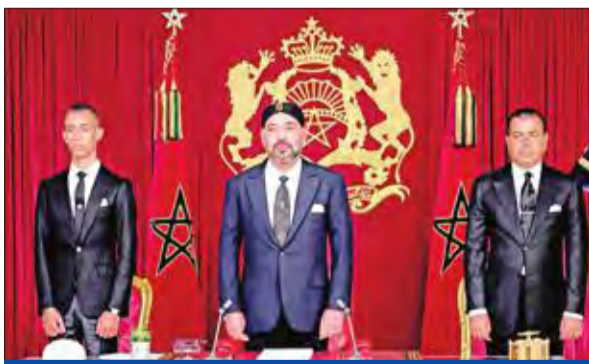
العاهل المغربي قبيل الخطاب الملكي أمس الأول

لقى خطاب العرش من الحسينة مهد «حراك الريف»