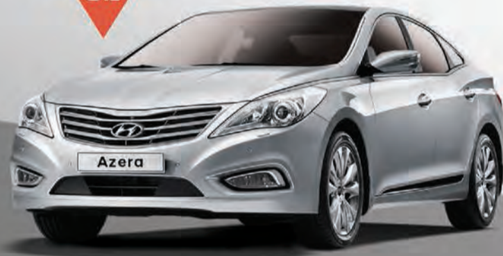
أزيرا 2016 | V6 3.0