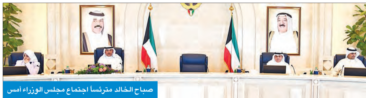
صباح الخالد متروناً اجتماع مجلس الوزراء أمس

دعا إلى استلهام الدروس والعبر من الغزو العراقي للمحافظة على أمن البلاد وتعزيز الوحدة الوطنية