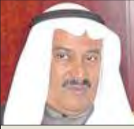
السفير يوسف عبدالله الصيذي

بما أننا نعيش الآن في خضم "جمرة القيظ" فمن السهل علينا أن ندرك أحد أسباب هذا الإزم من التواصل الاجتماعي والرسائل النصية و"تويتز" وصولاً إلى المقالات الصحافية والزوايا والمشاركة في التحليلات، سواء كانت سلبية أو إيجابية.