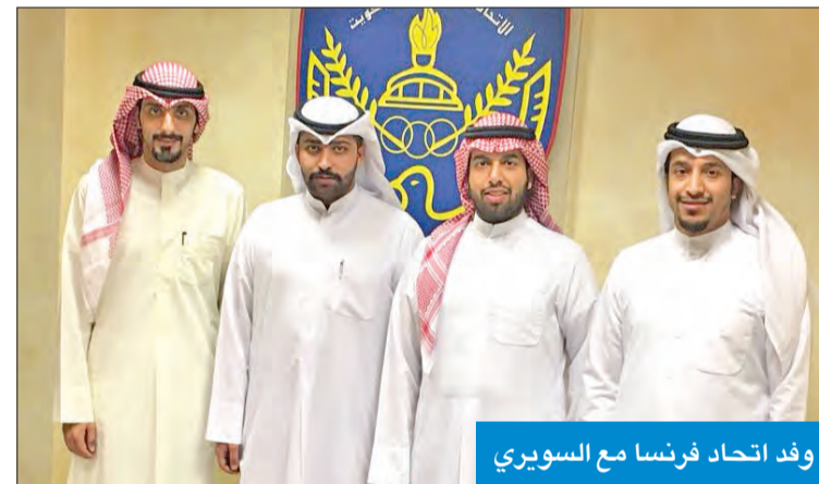
وفد اتحاد فرنسا مع السوري