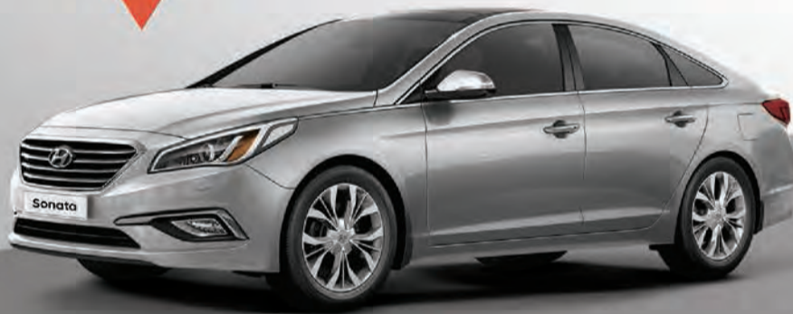
سوناتا 2016 | V4 2.0