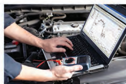
فحص 14 نقطة