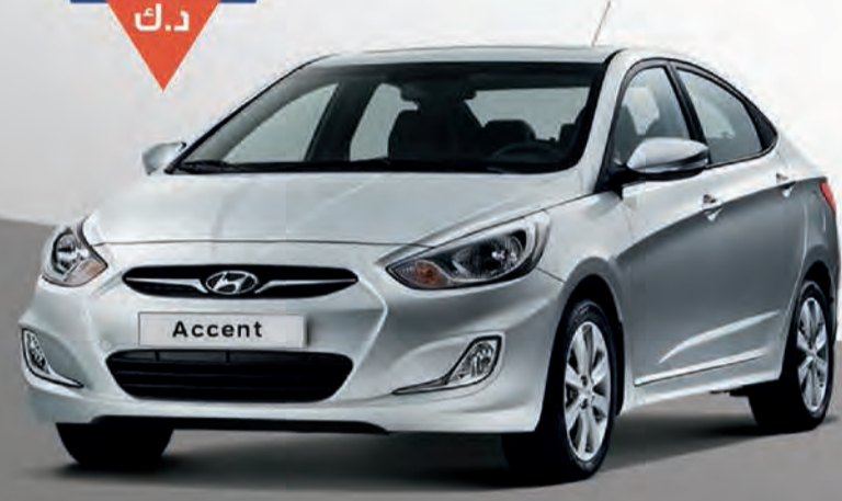
أكسنت 2016 | V4 1.4