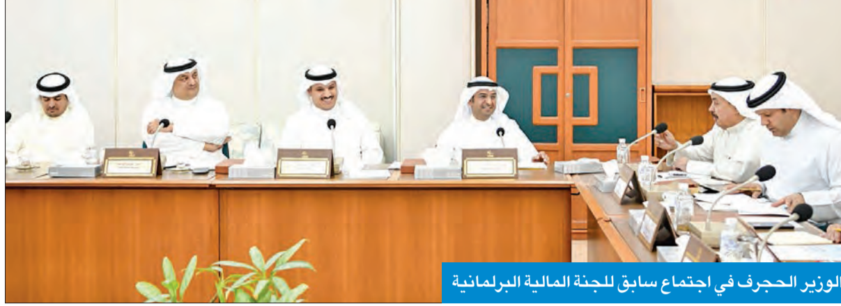
الوزير الحزفي في اجتماع سابق للجنة المالية البرلمانية

يترتب عليه تبعات سلبية تتمثل في إمكانية إلغاء القرار إذا طرح الأمر على القضاء، وفي حال ثبوت صدوره من غير المختص يستحق الشخص المضروب التعويض المناسب الذي تقرره المحكمة، حيث إنه من أهم أركان القرارات الإدارية ركن الاختصاص». وأردف: «في ضوء ما تقدم فإن جميع بنود السؤال المعروض لا تندرج ضمن الاختصاص الرقابي للبنك الاجتماعية والعمل».