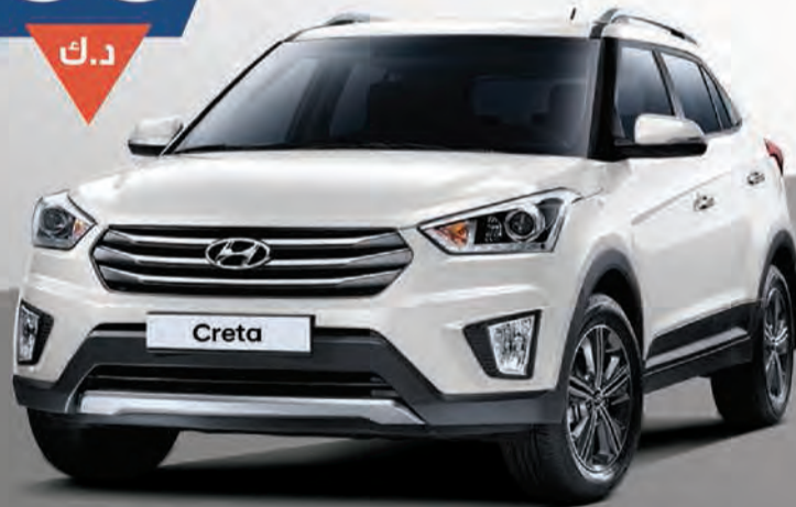
كريتا 2017 | V4 1.6