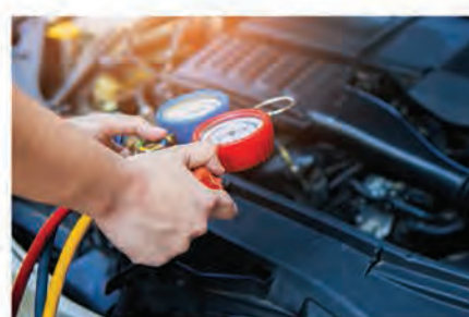
فحص نظام التبريد