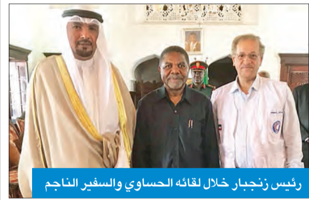
رئيس زنجبار خلال لقائه الحساوي والسفير الناجم

التقى وفد «الهلال الأحمر» عقب افتتاح بنك الدم ببلادها