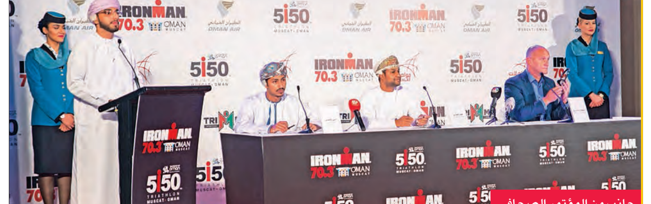
جانب من المؤتمر الصحافي