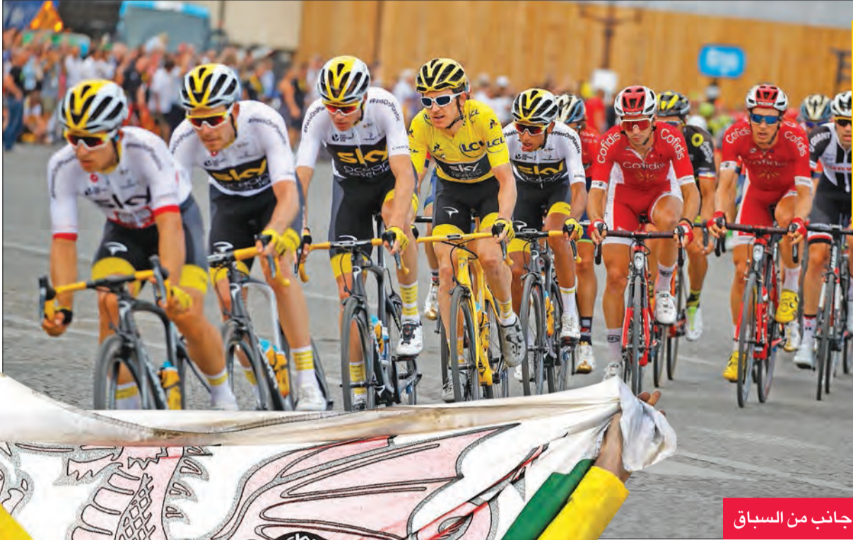
جانب من السباق

وحل غيرانت توماس في المركز 67 في مرحلة اليوم بالتوقيت ذاته ليجعلها، فيما جاء فروم في المركز 69 ودومولان في المركز 36. ونال الفرنسي جوليان الإفيليب جائزة أفضل دراج في الجبال، والسلوفاكي بيتر ساغان ترتيب النقاط، والفرنسي بيار لاتور جائزة الدراجين الشباب، والإيرلندي دان مارتن جائزة القتالية، في حين ذهب لقب الفرق إلى فريق موفستار. (أ ف ب)