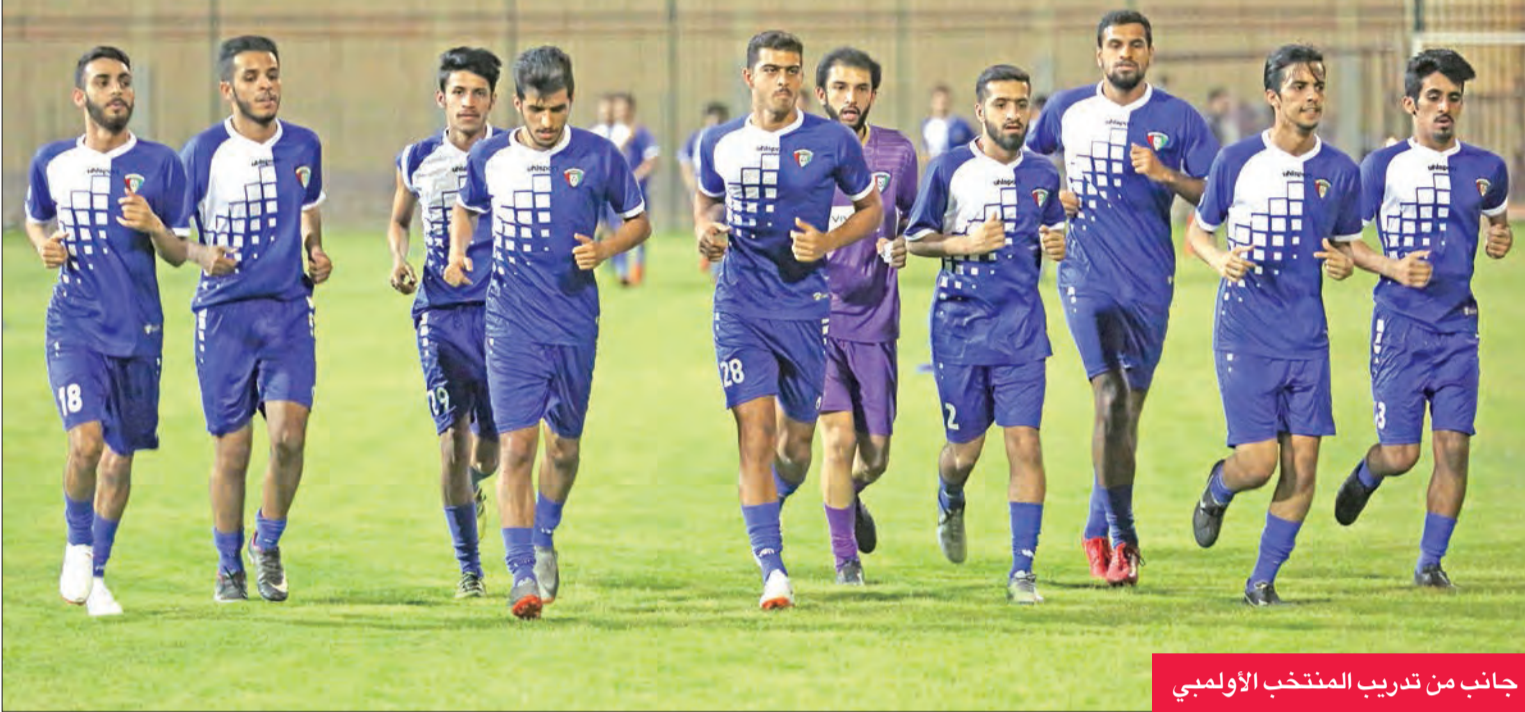
جانب من تدريب المنتخب الأولمبي