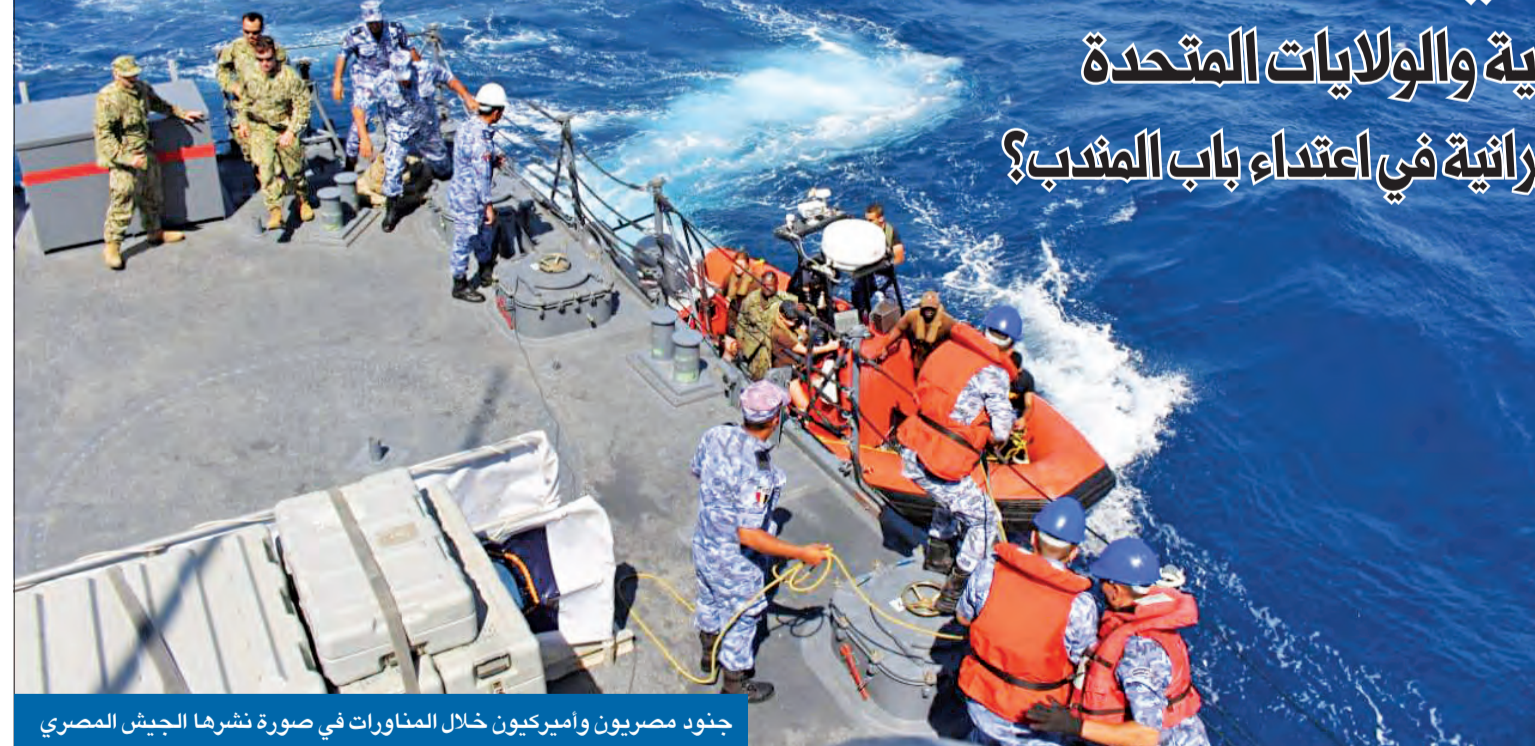
جنود مصريون وأميريكيون خلال المناورات في صورة نشرها الجيش المصري

تضم مصر والإمارات والسعودية والولايات المتحدة • هل شاركت «السفينة الأم» الإيرانية في اعتداء باب المندب؟