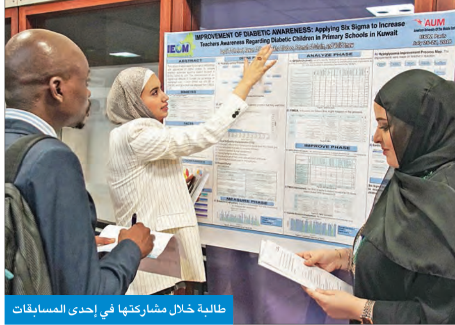
طالبة خلال مشاركتها في إحدى المسابقات

فازت طالبات الهندسة الصناعية في جامعة الشرق الأوسط الأميركية (AUM) بأربع مسابقات خلال مشاركتهم في المؤتمر الأوروبي الثاني للهندسة الصناعية وإدارة العمليات، الذي أقيم في كلية ايزيغ لإدارة (IESEG) في باريس يومي 26 و 27 الجاري. وتضمن المؤتمر جمعية الهندسة الصناعية وإدارة العمليات العالمية بالتعاون مع المنظمة الإفريقية للهندسة (AEES)، والاتحاد الدولي لجمعيات التعليم الهندسي (IFES)، وجمعية المهندسين للتكلفة والجودة (SCQE).