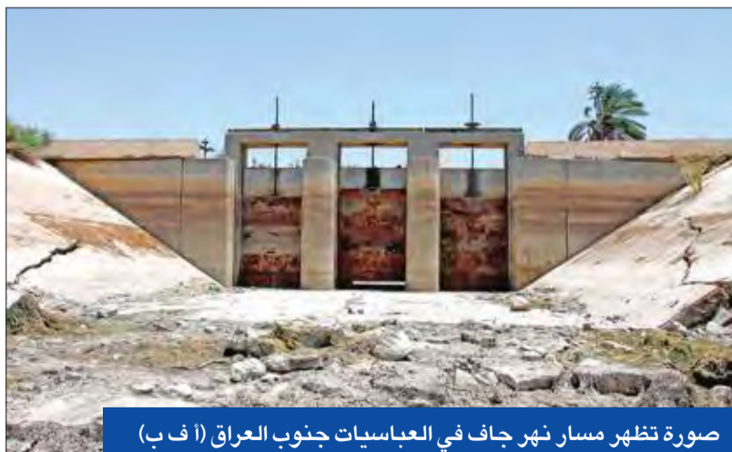
صورة تظهر مسار نهر جاف في العباسيات جنوب العراق (أ ف ب)

قال المتحدث باسم رئيس الحكومة العراقية سعد الحديثي أمس، إن طلب إنشاء إقليم البصرة لم يصل حتى الآن إلى مجلس الوزراء. وأكد الحديثي أنه 'إذا ما وصل الطلب فإن مجلس الوزراء سيقدمه بشكل طبيعي وسيخضع للتصويت'. مشيراً إلى أن 'الحكومة لا تعترض على أي طلب أو مشروع لا يخالف الدستور، ويأتي بسياسات قانونية، وما يخص إقليم البصرة لم يصل إليها الطلب من الحكومة المحلية هناك، أو من إقليمها قانونياً'.