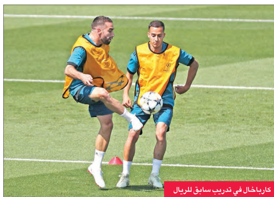
كارباخال في تدريب سابق للريال

وبحسب الصحيفة البريطانية، فإن عرض ريال مدريد سيُدرس بعناية من قبل مسؤولي ستامفورد بريدج، خصوصا أنهم أبدوا استعدادهم لاستقبال عروض لشراء الجناح البرازيلي، عندما أعرب برشلونة عن رغبته في ضمه، قبل أن يقرر النادي الكتالوني لاحقا التعاقد مع البرازيلي الآخر ماكغوك.