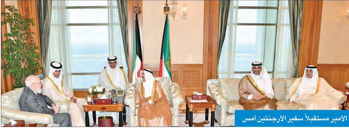
الأمير مستقبلاً سفير الأرجنتين أمس

يتمكن المسؤولون في البلد الصديق من تجاوز آثار هذه الكارثة الطبيعية. كما بعث سموه ببرقية تعزية إلى رئيس جمهورية الهند رام نات كوفيند، عبر فيها سموه عن خالص تعازيه وصادق مواساته بضحايا الأمطار الغزيرة التي هطلت على ولاية (أوتار براديش) في شمالي الهند وأسفرت عن سقوط عدد من الضحايا والمصابين، راجيا سموه للضحايا الرحمة وللصابين سرعة الشفاء، أملا أن يتمكن المسؤولون في البلد الصديق من تجاوز آثار هذه الكارثة الطبيعية.