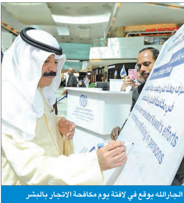
الجارالله يوقع في لافتة يوم مكافحة الاتجار بالبشر

أكد أن الكويت تسعى إلى احتواء تلك الظاهرة من خلال توفير الحياة الكريمة والحرية لجميع العاملين والموجودين على أراضيها، إذ تحتضن نحو 3 ملايين