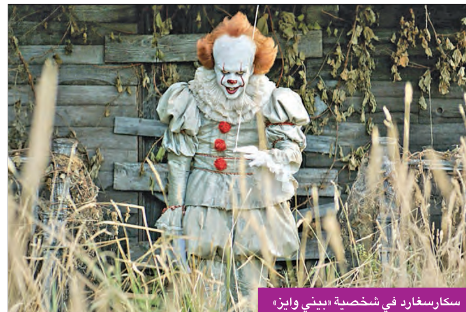
سكارسغارد في شخصية «بيني وايز»

هو أجسهم لإحافتهم، فتظهر سلسلة لاختفاء الأطفال من دون أي دليل على المهرج بيني وايز، ويظهر المهرج في القرية الملعونة كل 27 سنة، ليقوم بأفعاله الشريرة، ويستغل خوف الأطفال، ثم يعاود الاختفاء، ليظهر مجدداً بعد مرور 27 عاماً أخرى. ويعد فيلم «IT» إعادة صياغة لفيلم تم إنتاجه في الثمانينيات بنفس الاسم، لكن المخرج موشيني أظهر الأحداث بشكل مختلف وجديد، وأضاف لشخصية وايز أبعاداً أخرى أكثر رعباً. تركز فكرة الفيلم على ضرورة التغلب على مخاوفه وأجاس النفس ومواجهتها، ويحتوي الجزء الأول على مشاهد عنيفة، مع تصنيف المشاهدة للكبار فقط. وأعلنت شركة الإنتاج وارنر بروس أن موعد صدور الجزء الثاني من فيلم الرعب المرتقب في صالات السينما حول العالم سيكون في السادس من سبتمبر عام 2019.