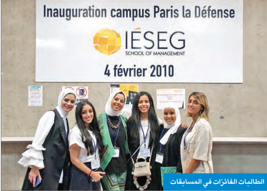
الطالبات الفائزات في المسابقات

المؤتمر شمل مشاركة جامعات مختلفة من 60 دولة قدمت 400 ورقة بحثية