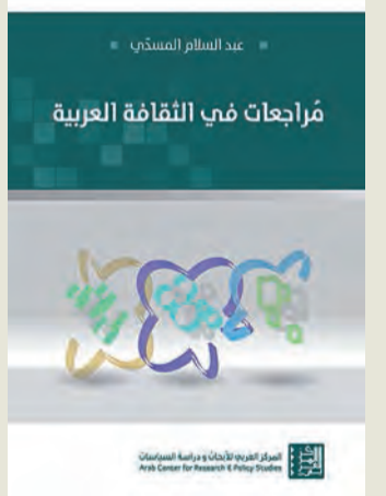
بيروت - الجريدة

يقول الباحث إن «مقدمة» ابن خلدون جسمت فعلاً المنظومة الإبيستمية في تاريخ الحضارة العربية. ويتابع في الفصل التاسع والأخير بعنوان «ابن خلدون وقوانين التاريخ»: «إذ كانت جامعة لثبات الرؤى الفرعية، ومستوية لقفولات الفكر النقدي مع غزارة تاليفية هي وليدة القدرة على التجريد والطاقة على الاستقطاب المعرفي الشامل».