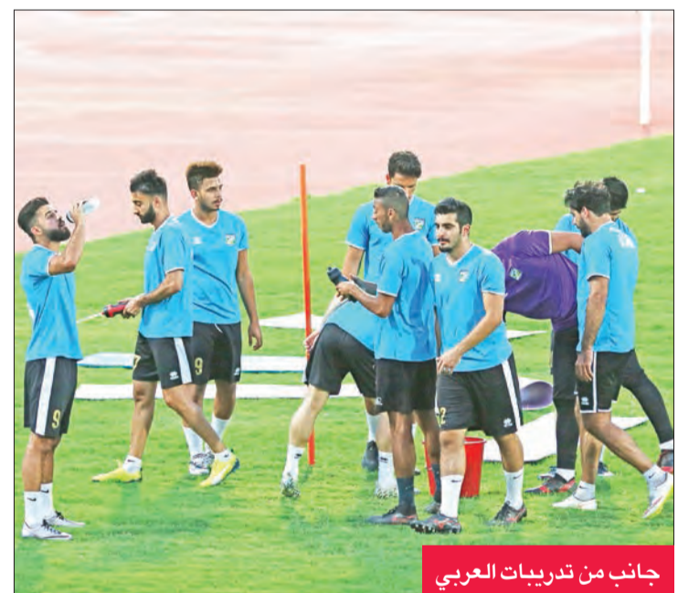
جانب من تدريبات العربي