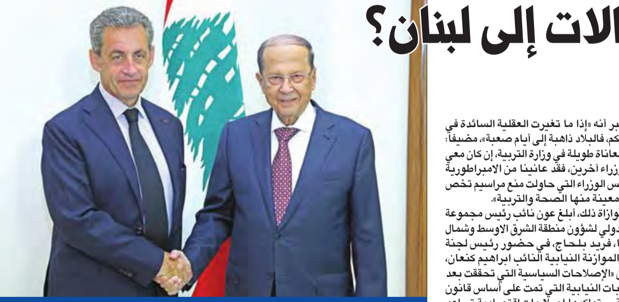
عون مستقبلاً الرئيس الفرنسي السابق نيكولا ساركوزي في قصر بعبدا أمس (اللاتي ونهرا)

لا انفراجة في مسار التآليف... والحريزي يرفض حكومة أكثرية