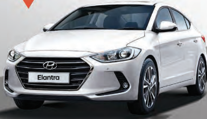
إلنٲرا 2017 | V4 1.6