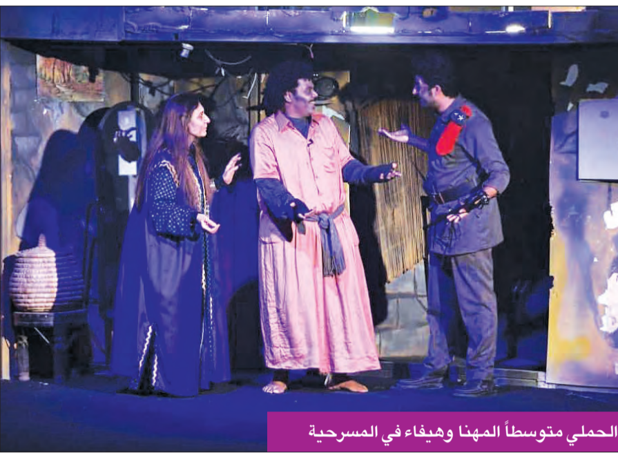
الحملتي متوسطاً المهنا وهيفاء في المسرحية

كما أجاد الحملي في تقديم سينوغرافيا وخدم مسرحية محكمة الصنع، باهرة وإتقان، مع مرونة الخشبة، في