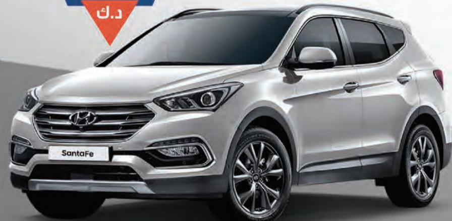
سانتافي 2016 | V4 2.4 | 4x4

تسجيل مرور مجانيه ✓ كفالة من المصنع ✓ نتعامل مع كل المؤسسات المالية