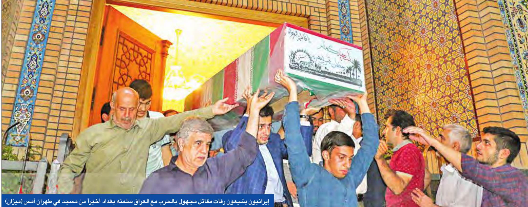
إيرانيون يشيعون وفات مقاتل مجهول بالحرب مع العراق سلمته بغداد أخيراً من مسجد في طهران أمس (ميران)

«الحرس الثوري» والأصوليون يخشون أن يمهد إطلاق كروبي وموسوي لانقلاب