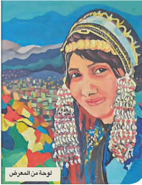
لوحة من المعرض

تستضيف أكاديمية الفنون في القاهرة معرض الفنان التشكيلي اليمني محمد سبأ بعنوان «مقتطفات يمنية»، ويضم أكثر من 30 لوحة تعكس البيئة والتراث الحضاري في اليمن، ومستلهمه من طبيعة القرى اليمنية والمدن الجبلية والزراعية، والتنوع الثقافي في هذه البيئة.