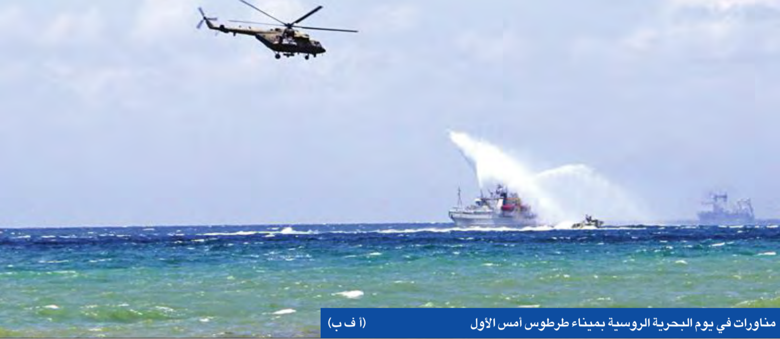
مناورات في يوم البحرية الروسية بميناء طرطوس امس الأول

● الأكراد قد يتعاونون مع الأسد ضد إردوغان ● اللاجئون والمعتقلون على طاولة «أستانة 10»