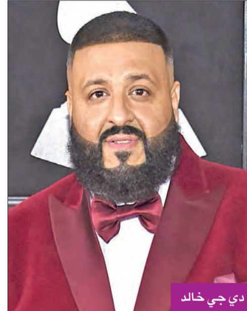
دي جي خالد