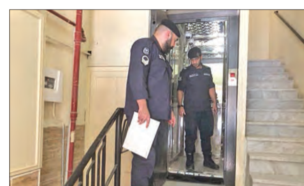
جانب من إجراءات معاينة أحد المصاعد خلال الحملة

وتناشد العمجي أصحاب المنشآت بأنواعها ضرورة عمل الصيانة الدورية الدائمة للمصاعد، من خلال جهات مرخصة ومعتمدة من قبل «الإطفاء»، وطالبهم بعدم