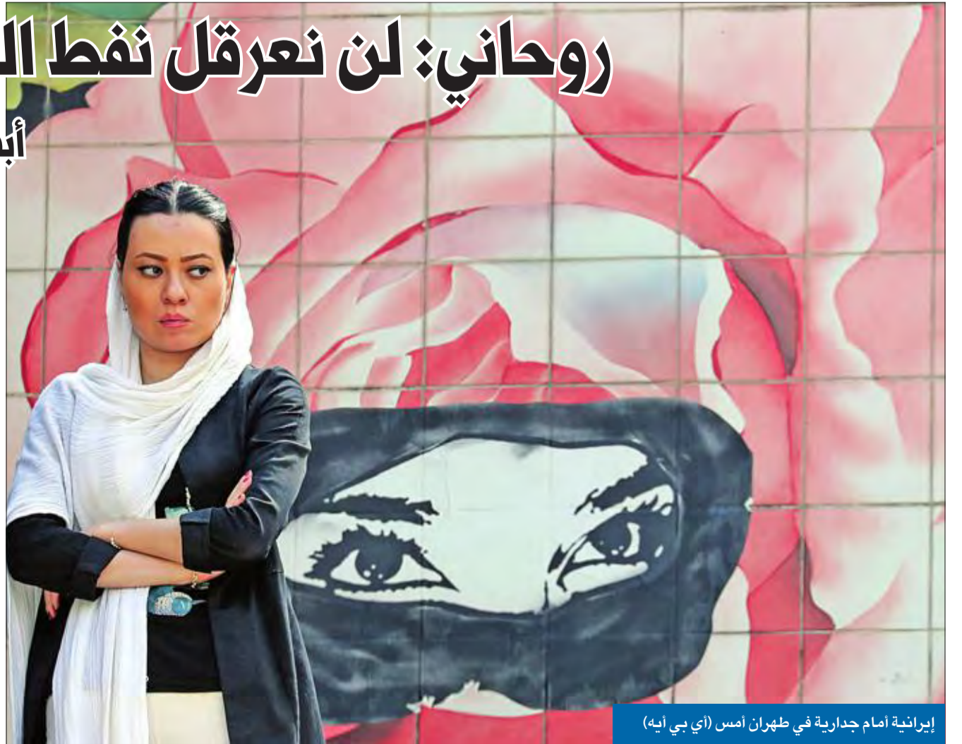
إيرانية أمام جدارية في طهران أمس