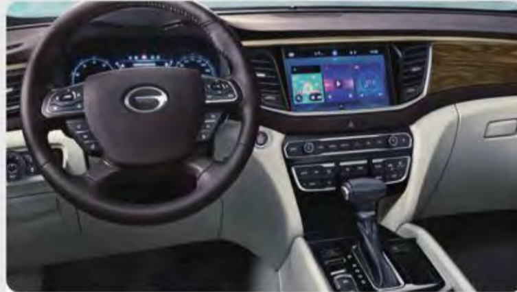
مقصورة قيادة مجهزة بأحدث التكنولوجيا