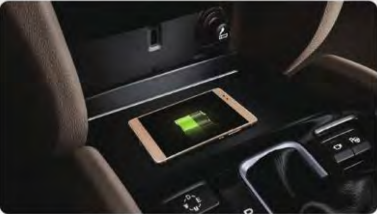
شاحن هاتف لاسلكي