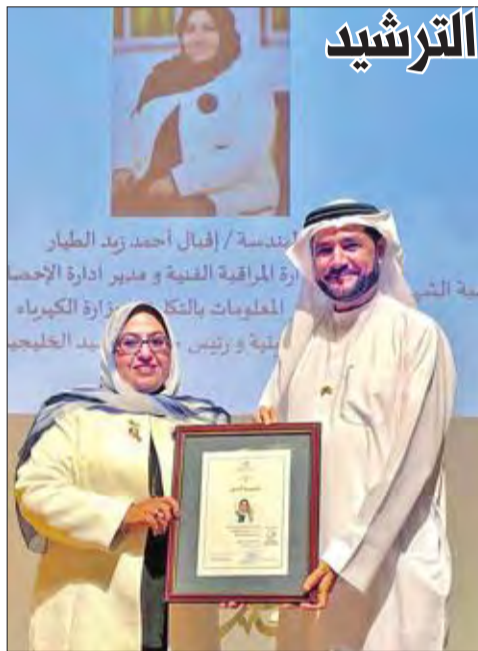
رئيس هيئة كهرباء الشارقة مكرم الطيار

الخليجية للترشيد إقبال الطيار، الشخصية الاعتبارية لشهر الترشيد، الذي ترعاه إمارة الشارقة، جاء ذلك خلال حفل أقامته الهيئة، بمناسبة «شهر الترشيد»، الذي تنظمه سنوياً لتشجيع الجهود الحكومية الرامية إلى تقليل استهلاك الطاقة واستعمالها بالشكل الأفضل. وقام رئيس هيئة كهرباء ومياه الشارقة، د. راشد النجم، بتكريم الطيار، باعتبارها من صناعات القرار الذين لهم بصمة واضحة في ترويج وتشجيع جمهور المتعاملين في مجال ترشيد استهلاك الطاقة على مستوى دول الخليج العربي.