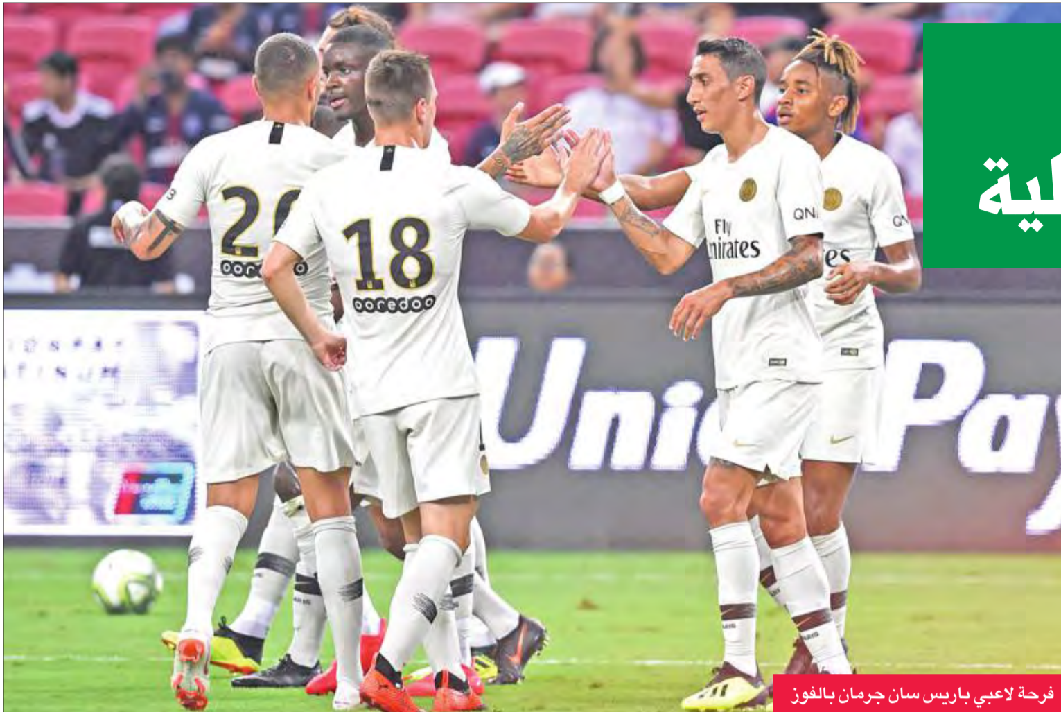
فرحة لاعبي باريس سان جرمان بالفوز