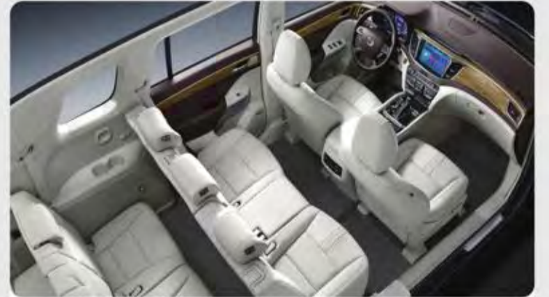
مقصورة قيادة فخمة لسبعة ركاب