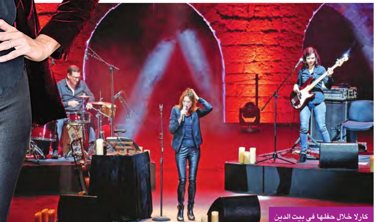
كارلا خلال حفلها في بيت الدين

وصفت النجمة كارلا بروني، جمهور حفلها في مهرجانات بيت الدين بأنه «وَدّي ومستمتع جيد». واعتلت بروني المسرح في مواجهة 1800 شخص، لتقدم مجموعة مميزة من أغنياتها.