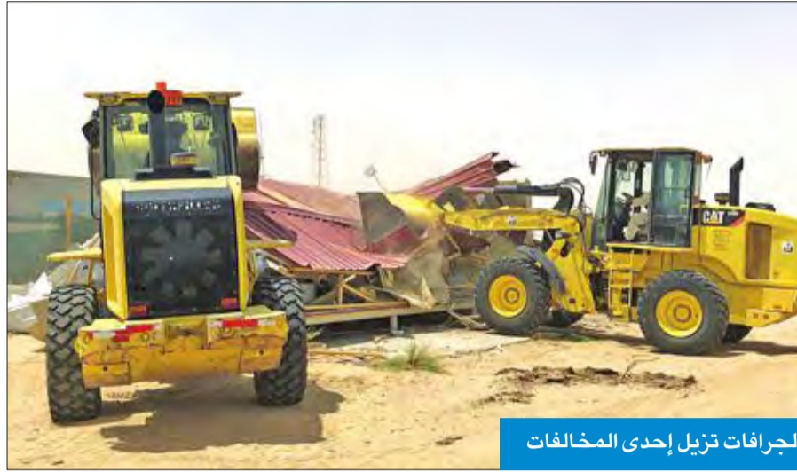
الجرافات تزيل إحدى المخالفات