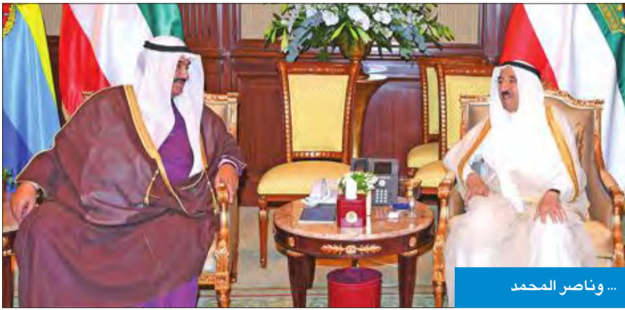
... وناصر المحمد

● الأمير استقبل نائب الرئيس العراقي ● المالكي: نقدر دور الأشقاء في دعم شعبنا