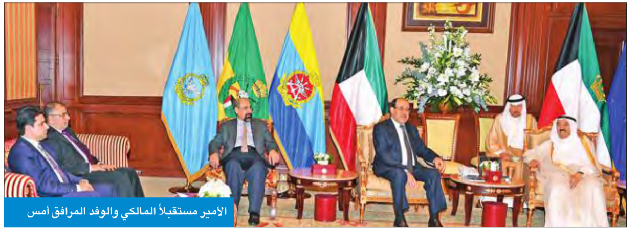
الأمير مستقبلاً المالكي والوفد المرافق أمس

استقبل صاحب السمو أمير البلاد الشيخ صباح الأحمد، بقصر بيان صباح أمس، سمو الشيخ ناصر المحمد واستقبل سموه ذلك رئيس مجلس الوزراء بالإنابة وزير الخارجية الشيخ صباح الخالد ونائب الرئيس العراقي نوري المالكي والوفد المرافق، بمناسبة زيارته الرسمية للبلاد. حضر المقابلة نائب وزير شؤون الديوان الأميري الشيخ محمد العبدالله. وقام المالكي ظهر أمس، بزيارة إلى مركز عبدالله السالم الثقافي، واطلع