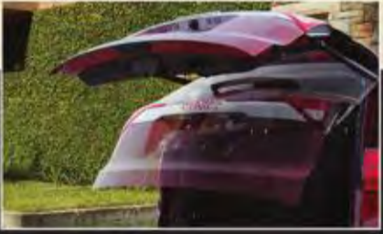
باب الصندوق يعمل كهربائياً