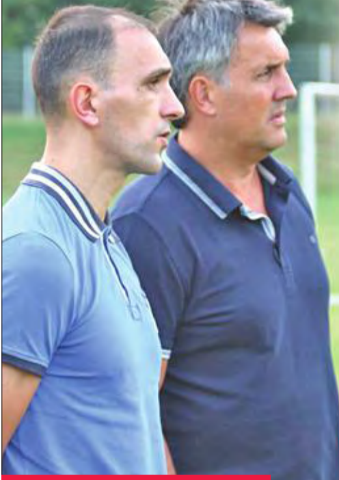
جوزاك يتابع تدريبات المنتخب الأولمبي

وتحدث مع الجهازين الإداري والفني بشأن آخر التطورات والتحديات في المعسكر عقب وصوله، للوقوف على المستوى الفني والبدني لكل اللاعبين.