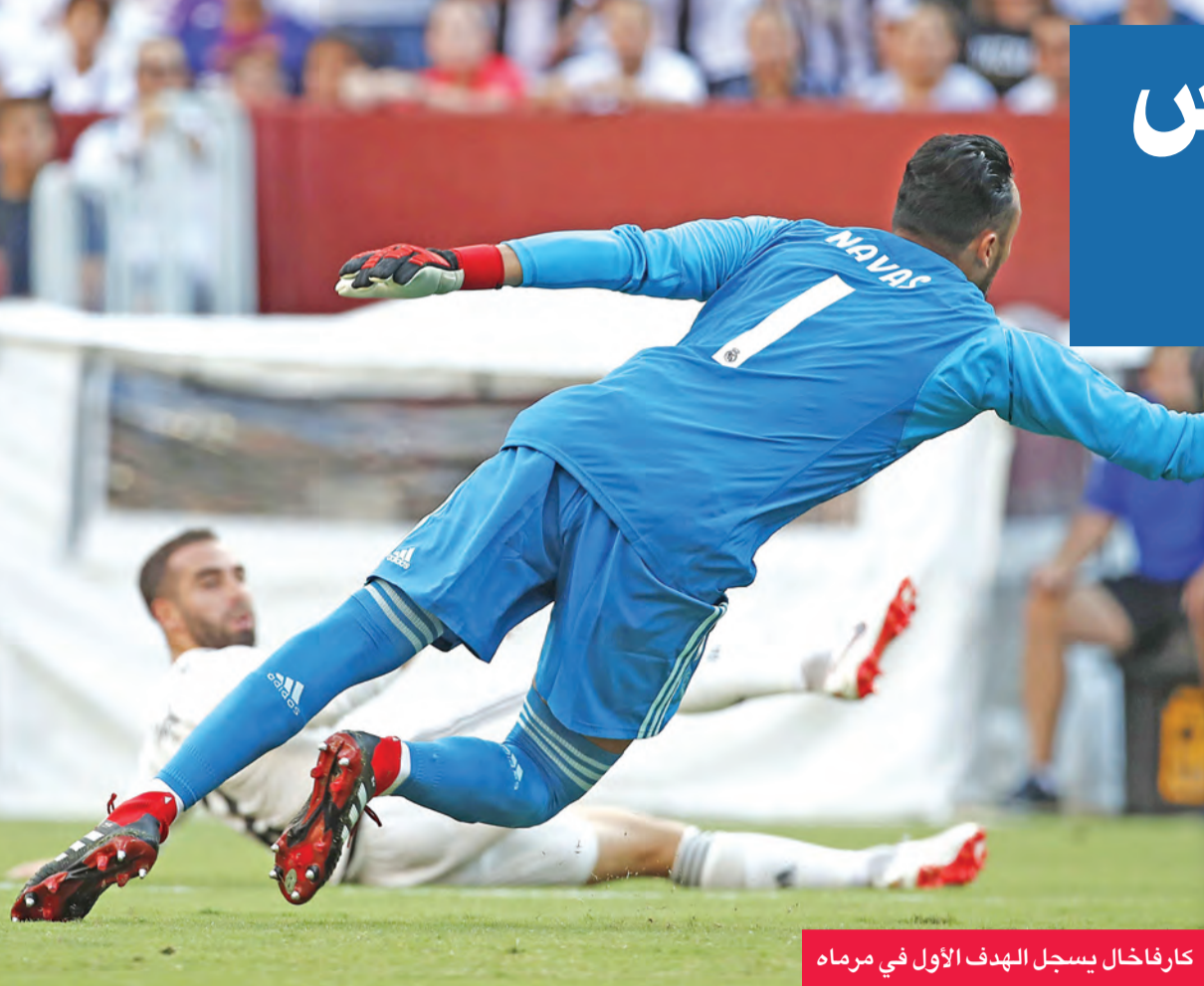
كارفاخال يسجل الهدف الأول في مرماه

أنهى يوفنتوس الإيطالي جولته الإعدادية الأميركية بالخسارة أمام ريال مدريد بنتيجة 3-1 ضمن الكأس الدولية للأبطال في كرة القدم، بعدما كان حقق ثلاثة انتصارات أمام ميونخ وبنفكا ونجوم الدوري الأميركي.