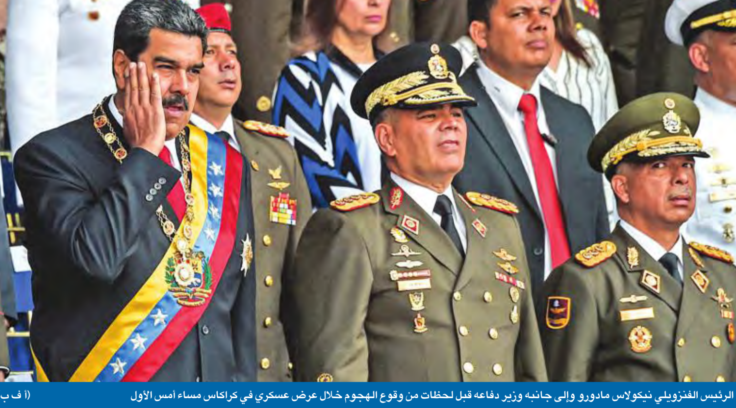
الرئيس الفنزويلي نيكولاس مادورو وولي جانبه وزير دفاعه قبل لحظات من وقوع الهجوم خلال عرض عسكري في كراكاس مساء أمس الأول