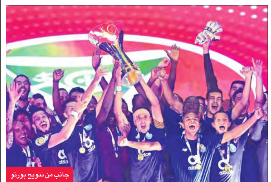
جانب من تتويج بورتو