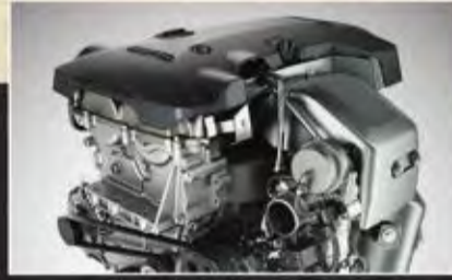
مُحرك قوي مزوّد بتيربو مزدوج