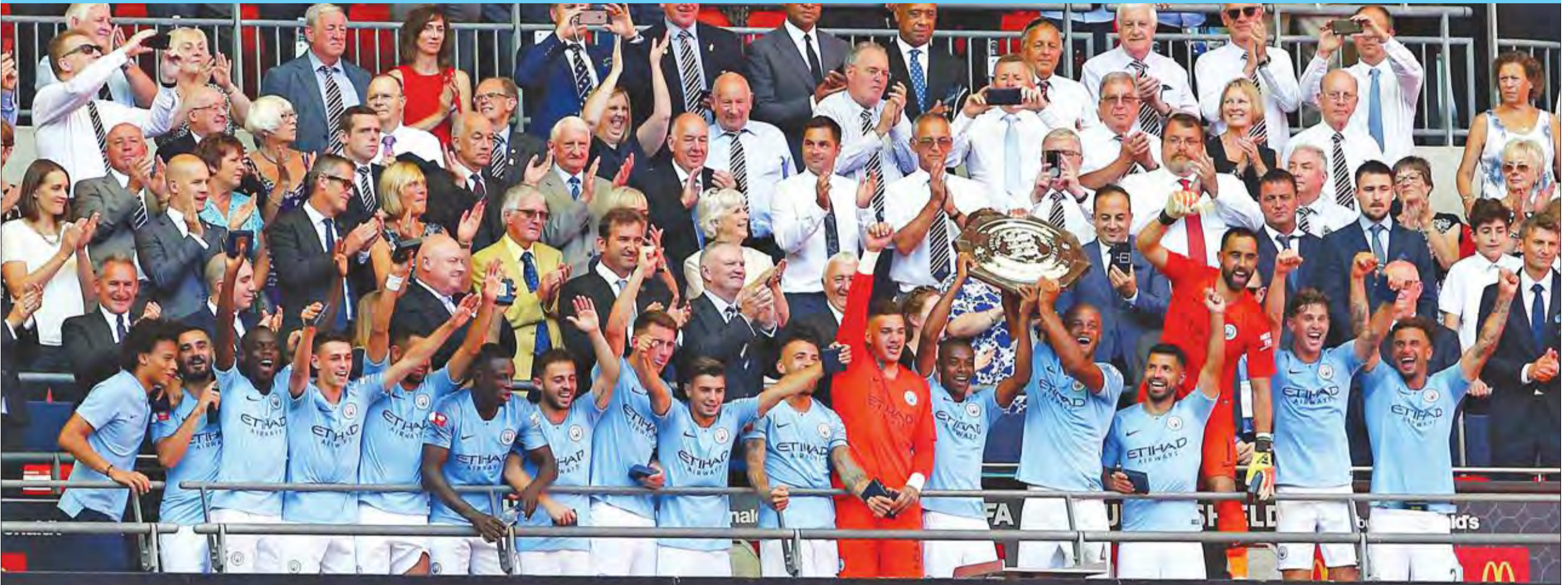
لاعبو مانشستر سيتي خلال التتويج

وأيضاً فشل الإيطالي ماوريسيو ساري في افتتاح باكورة بطولاته مع تشلسي في أول مباراة رسمية له مع الفريق اللندني، منذ قدومه لتولي مسؤولية الأمور الفنية من نابولي الإيطالي.