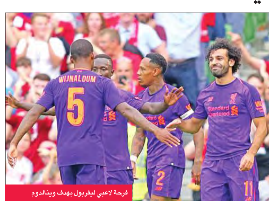
فرحة لاعبي ليفربول بهدف وينالدوم

أسدل أرسنال الإنكليزي الستار على استعداداته لإطلاق الموسم الجديد 2018-2019 بالفوز ودياً على نظيره لاتسيو الإيطالي بنتائية تغلّبه أمس الأول، على ملعب فريندرز أرينا بالعاصمة السويدية ستوكهولم. سجل "الغانز" هدفاً في كل شوط، حيث افتتح له المهاجم الشاب ريس نيلسون (18 عاماً) باب التسجيل في الدقيقة 18. وأضاف الدولي الجابوني بيير-إيميريك أوبامانغ الهدف الثاني في الدقيقة 64 من عمر اللقاء.