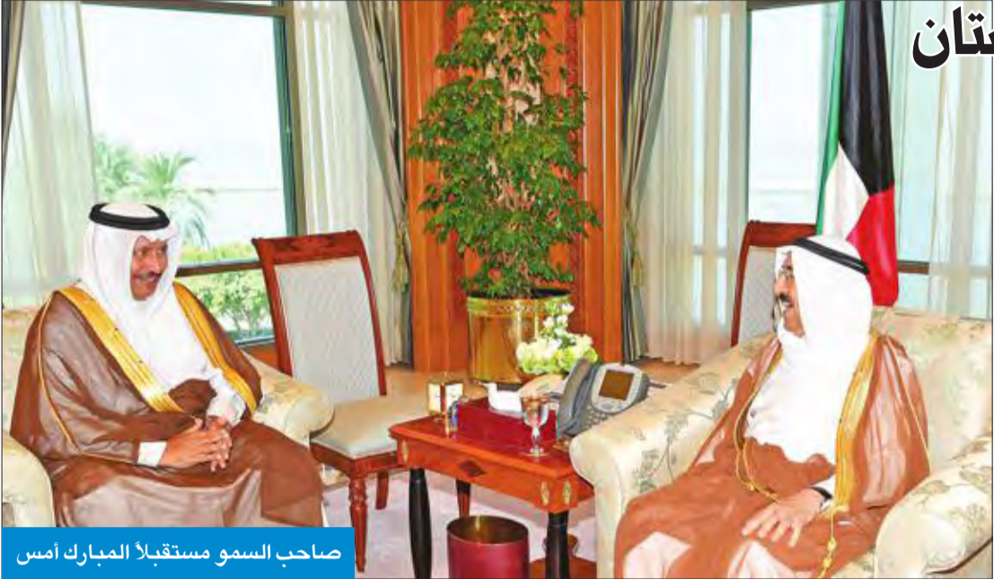
صاحب السمو مستقبلاً المبارك أمس

الرهابي بواسع رحمته ومغفرته، ويلهم ذويهم جميل الصبر وحسن العزاء، وأن يمن على المصابين بسرعة الشفاء والعافية. كما بعث صاحب السمو ببرقية تعزية إلى رئيس الاتحاد السويدي الإن بيرسيه، عبر فيها سموه عن خالص تعازيه وصادق مواساته بضحايا حادثي تحطم طائرتين سياحيين في منطقتي نيفالدين وجريوندين بسويسرا، والذين أوديا بحياة ركابيهما، راجيا سموه للضحايا الرحمة ولذويهم جميل الصبر وحسن العزاء. وبعث سمو ولي العهد الشيخ نواف الأحمد، ورئيس مجلس الوزراء سمو الشيخ جابر المبارك ببرقيات تعزية مماثلة.