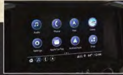
شاشة كبيرة 8 إنش مع كاميرا خلفية و Navigation ونظام ترفيه (Android Auto و Apple Carplay)