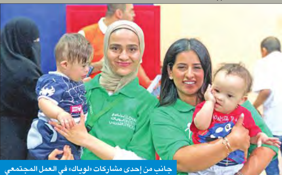
جانبا من إحدى مشاركات «لويك» في العمل المجتمعي

كما يتم تدريب الشباب على كيفية تشغيل الأجهزة في قاعات الألعاب والترفيه الضخم، وكيفية التعامل معها، في سبيل تقديم أفضل الخدمات للزبائن، ومساعدة الأطفال، وتأمين سبل الراحة لهم. ويجري التنسيق لإقامة تلك الدورات مرتين في العام، بواقع 6 ساعات عمل يومياً، موزعة وفق ما تقتضيه الحاجة وضرورة العمل.