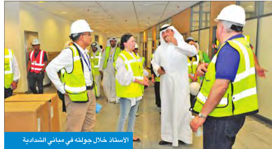
الأستاذ خلال جولته في مباني الشداية

وموظفي الخدمات العامة والعلاقات العامة والإعلام.