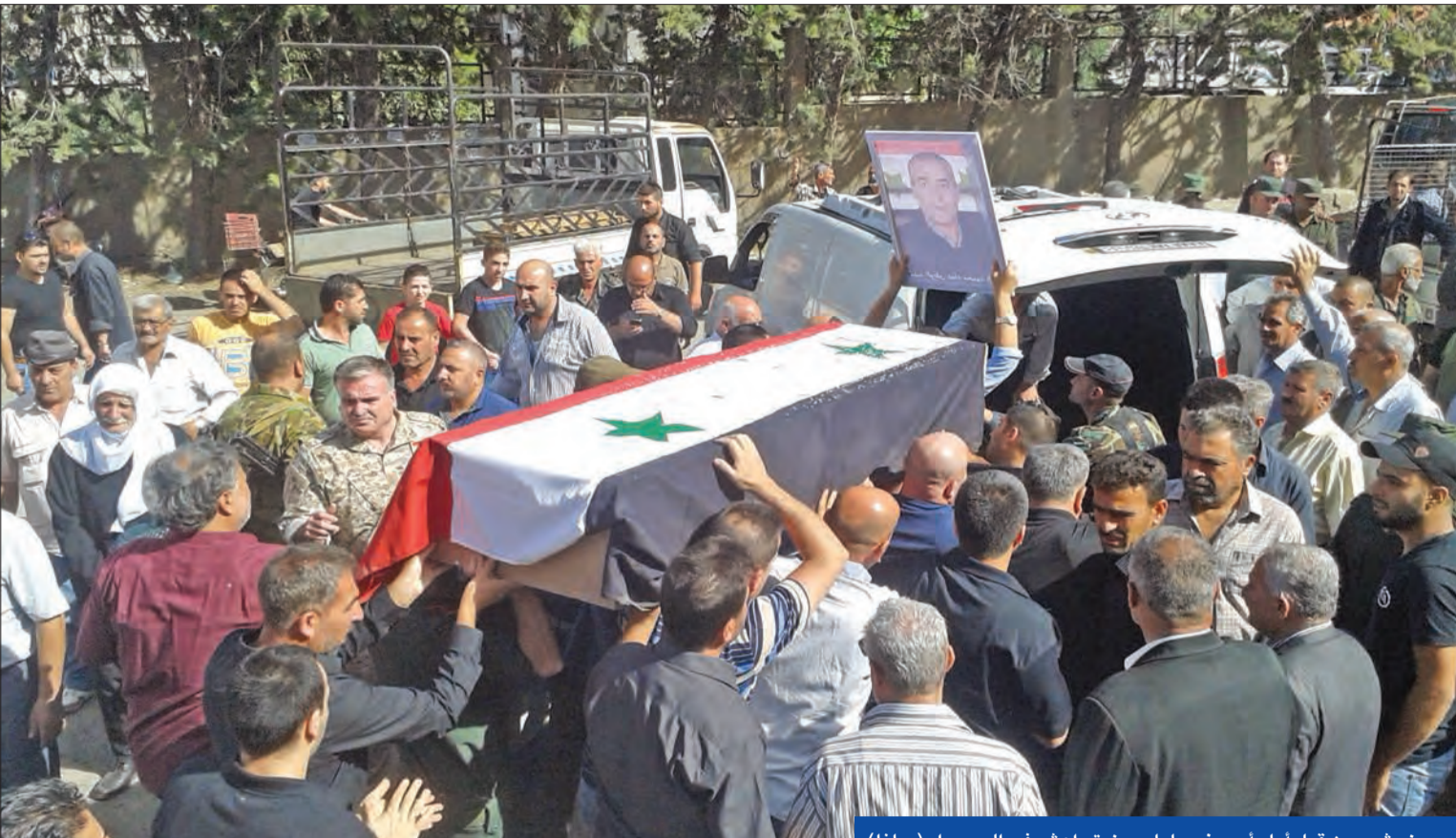
دروز يشيعون قبل أيام أحد ضحايا مجزرة داعش في السويداء

مع رفض شيوخ طائفة الموحيدين الدروز للتدخل لإجلاء عناصرها من حوض اليرموك، قمع تنظيم «داعش» رأس واحد من أصل 30 مديناً اختطفهم خلال هجوم مروع شنه في 25 يوليو على محافظة السويداء، التي نأت بنفسها عن الانخراط في النزاع المستمر منذ عام 2011 وبقيت على الحياد.