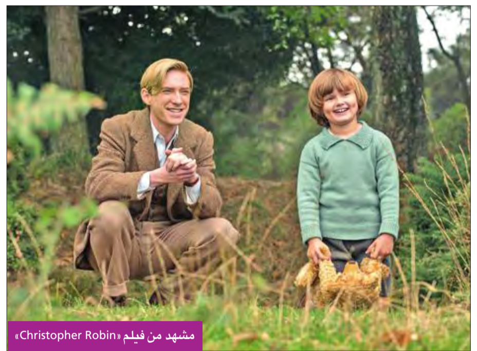
مشهد من فيلم «Christopher Robin»

أعلنت الجهات الرقابية في الصين منع طرح أحدث إنتاجات شركة «ديزني»، فيلم المغامرات «Christopher Robin» بدور العرض الصيني، إذ تواصل بكين منع أي صور خاصة بشخصية «Winnie the Pooh» الكارتونية، وإلى الآن لم تصدر «ديزني» بياناً تعلن فيه موقفها من قرار المنع الصيني. الفيلم نسخة واقعية للشخصيات الكارتونية الشهيرة، ويؤدي بطولته النجم العالمي إيوان ماكريجور، الذي يجسد دور رجل أعمال متوسط العمر يمر بمشكلة ما ليفاجئ بعودة هذه الشخصيات الكارتونية إلى الحياة في محاولة منهم لإجباره على استخدام مخيلته مرة أخرى. وقررت السلطات الصينية منع شخصيات «Winnie the Pooh» بسبب وجه الشبه بينها وبين رئيس جمهورية الصين الشعبية «شي جين بينغ». وعلى الرغم من أن الفيلم لا يحمل أي إساءة وتم تقويمه لكل أفراد العائلة، لكن الصين قررت منع الفيلم بعدما عرضها الإعلامي جون أوليفر في إحدى حلقات برنامجه «Last Week Tonight» على قناة «HBO». أكد مصدر مطلع بالسينما الصينية أن الموضوع ربما ليس له علاقة بالسياسة، في حين لم تعلن الصين السبب الأساسي وراء رفضها الفيلم. وربما جاء الرضا بسبب طرح عدد ضخم من الأعمال السينمائية طوال العام، التي تصل لـ 34 فيلماً في العام، إلى جانب وجود عدد من أفلام هوليوود التي تتنافس سابقاً على شبكات النذائر الصيني. ومن المقرر أن يتم عرض فيلم الأبطال الخارقين «Ant-Man and the Wasp» بدور العرض الصيني يوم 24 أغسطس الجاري، على أن تعرض النسخة السادسة من سلسلة «Mission Impossible» يوم 31 الجاري.