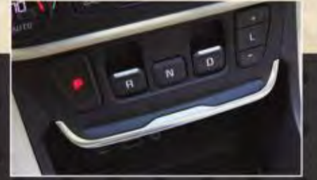
ناقل حركة إلكتروني متطور عالي الدقة بـ 9 سرعات