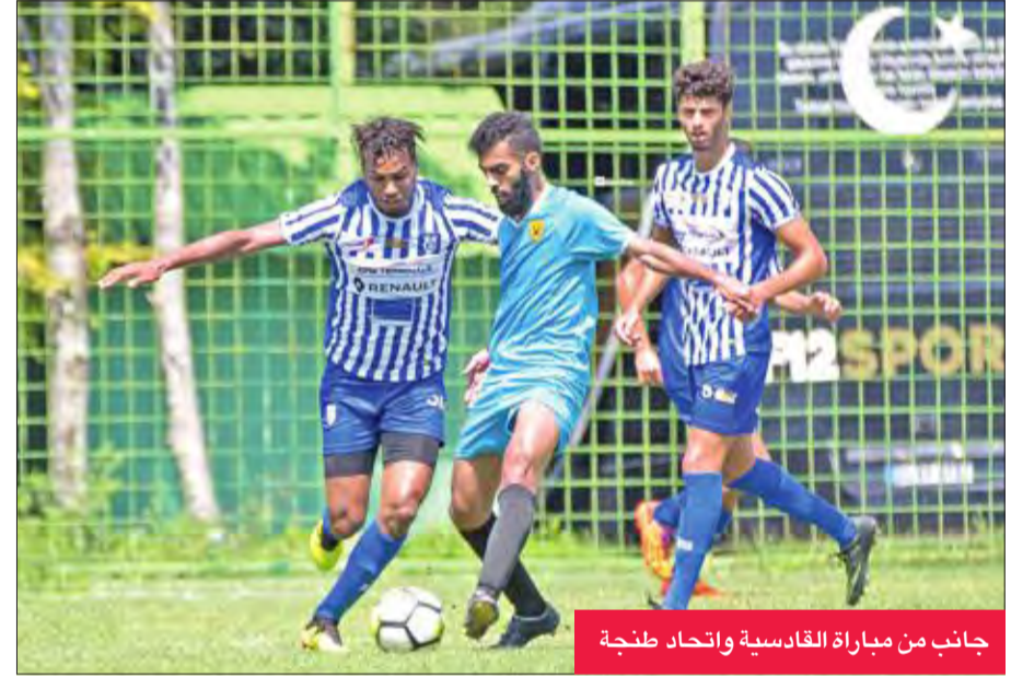
جانب من مباراة القادسية واتحاد طنجة

يختم الفريق الأول لكرة القدم بنادي القادسية تدريباته في معسكره التدريبي بمدينة أزميت التركية عصر اليوم، وذلك في صالة الحديد بمقر إقامة الوفد، بناء على رؤية الجهاز الفني للأصفر بقيادة المدرب الروماني مارين.