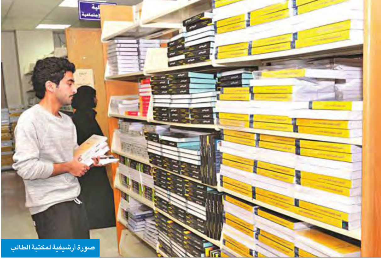
صورة أرشيفية لمكتبة الطالب

أكدوا لـ «الجريدة». ضرورة تأمينها للمستجدين نظراً لتأخر تسلمهم مكافأتهم الاجتماعية عن بداية الدراسة