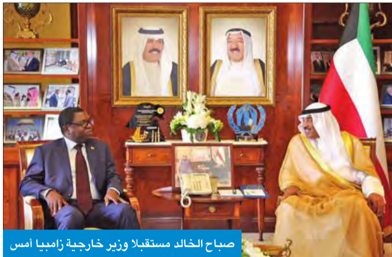
صباح خالد مستقبلاً وزير خارجية زامبيا أمس

بحث نائب رئيس مجلس الوزراء وزير الداخلية الشيخ خالد الجراح مع سفير الولايات المتحدة الأمريكية لدى الكويت لورانس سيلفرمان أمس، عدداً من الموضوعات والقضايا ذات الاهتمام المشترك وسبل تعزيز علاقات التعاون والتنسيق الأمني بين الجانبين. وقالت الإدارة العامة للعلاقات والإعلام الأمني في «الداخلية»، إن الجراح أكد خلال اللقاء، الذي عقد في مبنى الوزارة بمنطقة صباحن عمق العلاقات بين البلدين الصديقين. من جانبه، أشاد السفير سيلفرمان بدور الكويت في