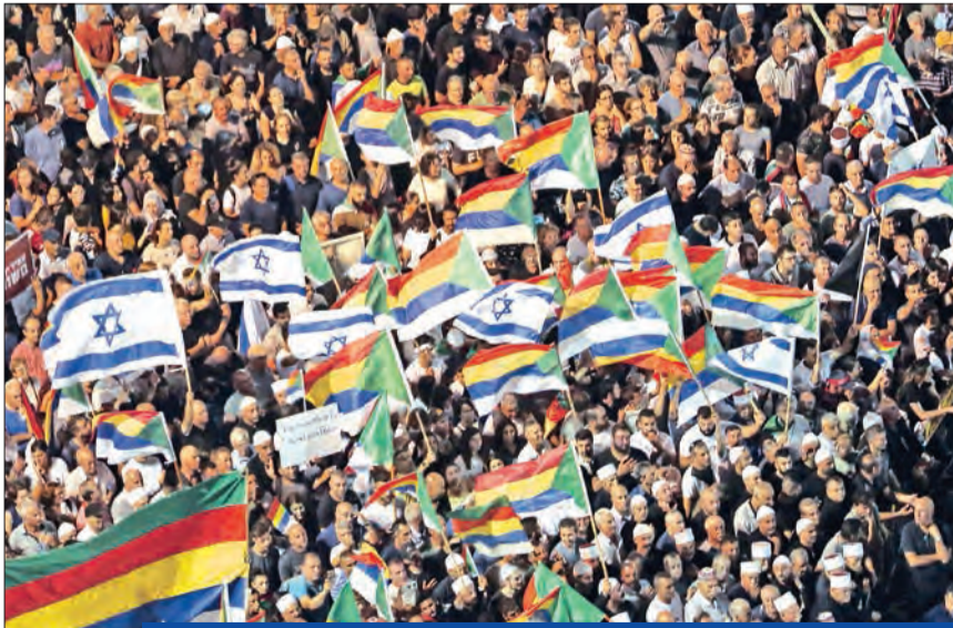
إسرائيليون يبنهم دروز خلال تظاهرة أمس الأول وسط تل أبيب

● «الكابنيت» يبحث «تسوية غزة» ● «فتح»: «حماس» تطبق «صفقة القرن»