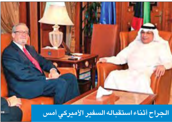
الجراح أثناء استقباله السفير الأمريكي أمس

بحث نائب رئيس مجلس الوزراء وزير الداخلية الشيخ خالد الجراح مع سفير الولايات المتحدة الأمريكية لدى الكويت لورانس سيلفرمان أمس، عدداً من الموضوعات والقضايا ذات الاهتمام المشترك وسبل تعزيز علاقات التعاون والتنسيق الأمني بين الجانبين. وقالت الإدارة العامة للعلاقات والإعلام الأمني في «الداخلية»، إن الجراح أكد خلال اللقاء، الذي عقد في مبنى الوزارة بمنطقة صباحن عمق العلاقات بين البلدين الصديقين. من جانبه، أشاد السفير سيلفرمان بدور الكويت في