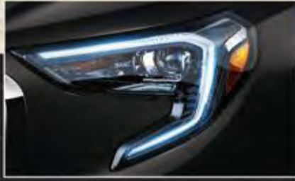
إضاءة نهائية LED مميزة