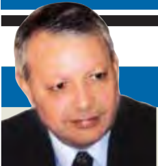
صالح القلب كاتب وسياسي أردني