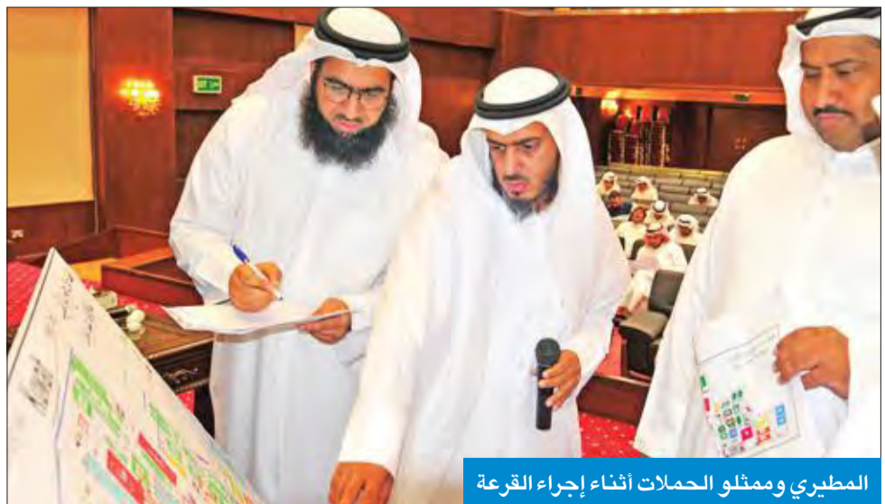
المطيري وممثلو الحملات أثناء إجراء القرعة

أصحاب الحملات قبل الوصول إلى الأراضي المقدسة بوقت كاف لإسيماً أن عدد الحجاج الكويتيين هذا الموسم يبلغ 9 آلاف حاج موزعين على 49 حملة كويتية وهو يفوق العدد الذي كان عليه في السنوات الأخيرة. وأشار إلى أن بعثة الحج الكويتية تواصل الجهود من أجل الانتهاء من تجهيز وترتيب مخيمات مشعر منى على أن يتم توزيع مقراتها فور وصول جميع الحملات إلى الأراضي المقدسة، مؤكداً أنه تم التعاقد مع المؤسسة الأهلية لمطوى حجج الدول العربية لتطوير مخيم منى الذي سيشهد نقلة نوعية هذا الموسم وسيكون مختلفاً عن المواسم الماضية. وأشاد بالجهود الكبيرة التي تبذلها الجهات المسؤولة في السعودية لتوفير الراحة لجميع ضيوف الرحمن، فضلاً عن تذييلها جميع الصعوبات التي واجهت بعثة الحج الكويتية، إضافة إلى الخدمات المميزة التي تقدمها المملكة في مشعر عرفات للحجاج من جميع دول العالم.