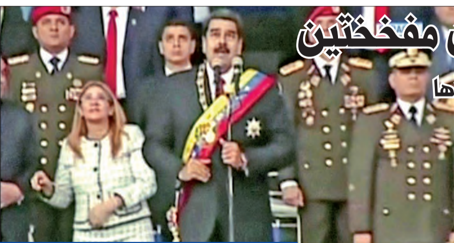
مادورو وزوجته في لقطة تلفزيونية لحظة وقوع الانفجارات خلال لحظات من العرض العسكري في كاراكاس أمس الأول

يمكن أن يكون ذريعة دبرها نظام الرئيس مادورو نفسه أو شيئا آخر». وقال إنه «إذا كانت لدى فنزويلا معلومات ملموسة عن الصحافة المعارضة بشدة الأميركي، فسندرس الأمر بجدية». وفي بوغوتا، نفت الحكومة الكولومبية نفيا قاطعا اتهام مادورو، معتبرة أن «لا أساس له» ووصفته بأنه «عبثي».