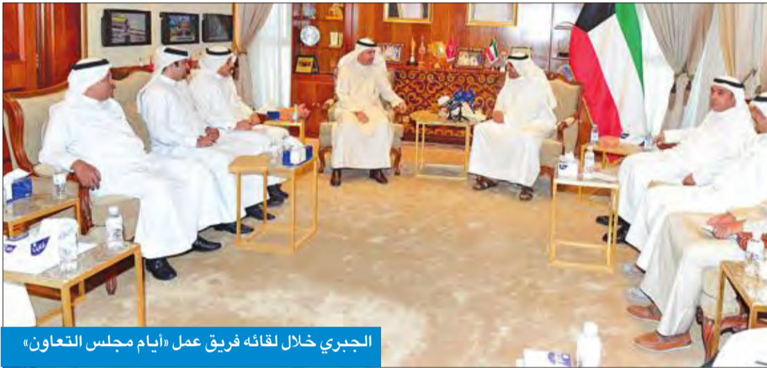
الجبري خلال لقائه فريق عمل «أيام مجلس التعاون»

أشاد وزير الإعلام وزير الدولة لشؤون الشباب محمد الجبري بالجهود التي يبذلها فريق العمل المنظم لفعاليات «أيام مجلس التعاون الخليجي»، التي تستهدف عكس اللحمة الخليجية ووحدة العصر المشترك. جاء ذلك في بيان صادر عن «الإعلام» عقب لقاء الجبري فريق «أيام مجلس التعاون» برئاسة الأمين العام المساعد للشؤون التشريعية والقانونية بالأمانة العامة لدول مجلس التعاون، السفير حمد المري، والمقرر أن تستضيفها الكويت. وأكد الجبري وفقاً للبيان ضرورة ترجمة الأهداف المرجوة من هذه الفعاليات في تطوير العلاقات الاقتصادية والتجارية وتعزيز العلاقات الثقافية وتشجيع السياحة البيئية ودعم الشراكة القائمة بين دول مجلس التعاون على كافة المستويات الرسمية والشعبية. وأوضح أن هذه الفعاليات تأتي ترجمة لتوجهات قادة دول المجلس، تأكيداً على اللحمة الخليجية ووحدة الصف والصير المشترك.