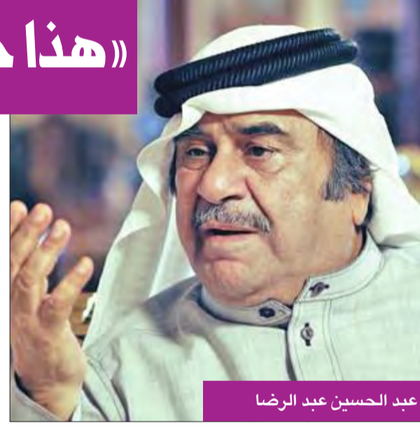
عبد الحسين عبد الرضا