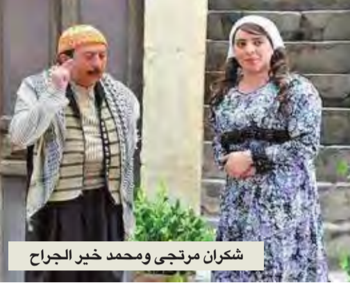
شكران مرتجي ومحمد خير الجراح

يستعد النجمان السوريان محمد خير الجراح وشكران مرتجي لإطلاق دويتو غنائي يجمعهما، مستوحى من طبيعة شخصيتيهما «أبو بدر» و«فوزية»، في مسلسل «باب الحارة». تحمل الأغنية عنوان «ما يسترجي»، وهي من كلمات صفوح شغالة والحنان الموسيقار نوبلي فاضل الجزائري، وتوزيع المايسترو هاني طيفور. و«غرافيك ومونتاج عبيدة كوراني». الكاتب صفوح شغالة أعلن أنّ الجمهور سيستمع إلى الأغنية في وقت قريب. وكان الفنانان حققا نجاحاً لافتاً من خلال شخصيتيهما في المسلسل.